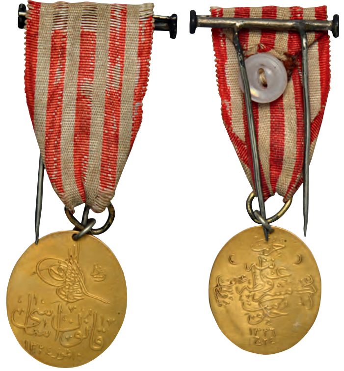
4- Kanun-i Esasi madalyasının ön ve arka yüzü (İstanbul Arkeoloji Müzesi)

İstanbul'da Rum kiliseleri çanlarını sürekli olarak çalmışlar, Rumlar bu çan sesleri üzerine dükkânlarını kapatmışlardı. Sokaklar, öfkeli Rum göstericilerle dolmuştu. Rumların gösterileri özellikle Beyoğlu semtinde etkili olmuş burada şiddet hareketleri görülmüştü. Bunun üzerine Zabtiye Nezareti gerekli tedbirleri almak zorunda kalmıştı. Ancak alınan tedbirlerin yetersizliği Rumların bir gün sonra yaptıkları protesto gösterileri ile ortaya çıkmıştı. Rumlar 23 Kasım'da bir gün öncekine oranla daha geniş çaplı gösteriler yapmışlar, taşkınlıklarını artırmışlardı. Rumların gösterilerindeki amaçları Beyoğlu seçimlerinin iptali ve seçimlerin 8 gün sonraya