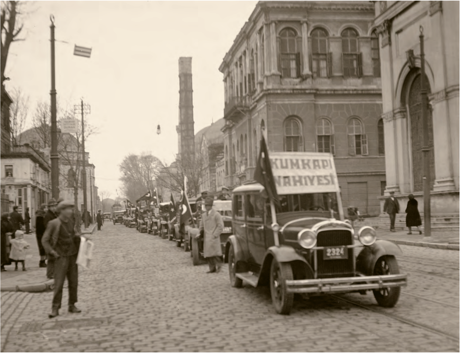
12- Kumkapı nahiyesi seçim sandığı, açılmak üzere Eminönü Kaymakamlığına nakledilirken (13 Nisan 1931)

yanı sıra ustabaşı yardımcısı, tesviyeci, ayakkabıcı mesleğinden adayların yer aldığı liste, 1931 kongresinde parti tüzüğünde yer alan halkçılık ilkesinin de izlerini taşımaktadır.