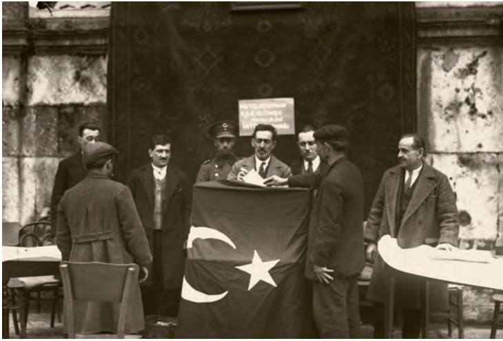
15- Pürtelaş Hasan ve Kılıç Ali Mahalleleri intihabat seçim sandığı