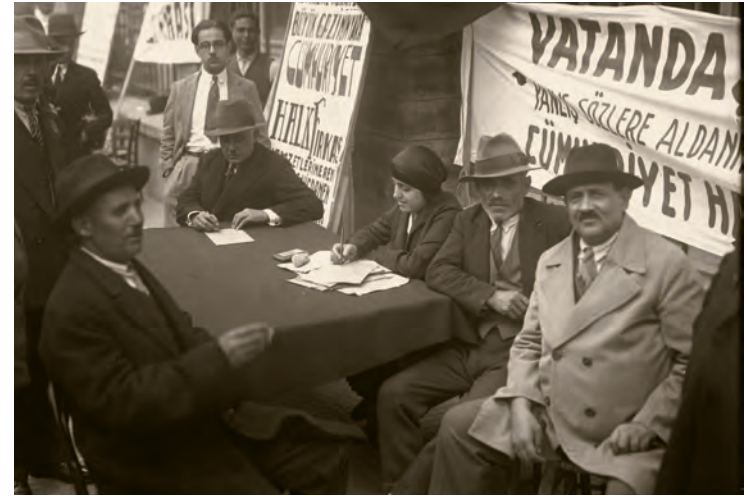
16- İstanbul'da bir seçim kampanyası

Kanunu gelişmiştir. Bu kanun ile 20 belediye dairesine ayrılan İstanbul Şehremaneti'nin organları arasında Şehremini, Şehremaneti Meclisi ve Cemiyet-i Umumiye-i Belediye yer almıştır.