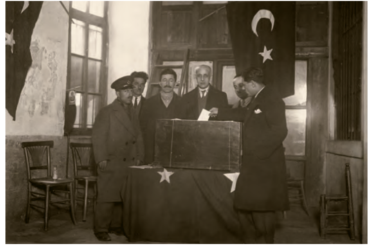
14- Oy kullanma işlemi