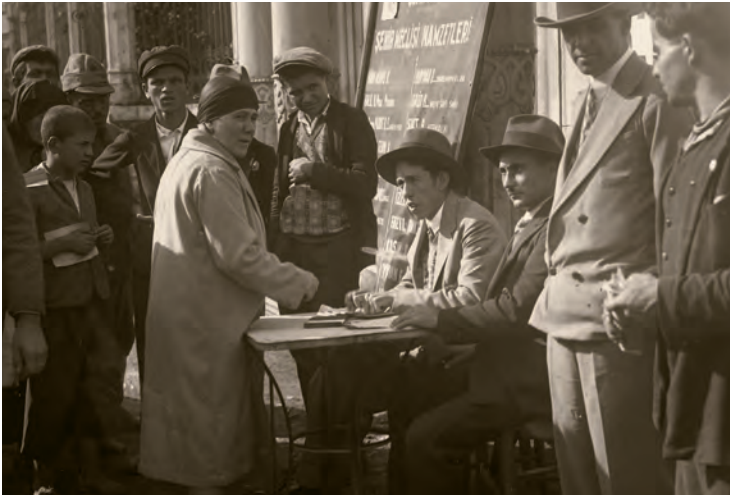
13- İstanbul'da bir seçim kampanyası