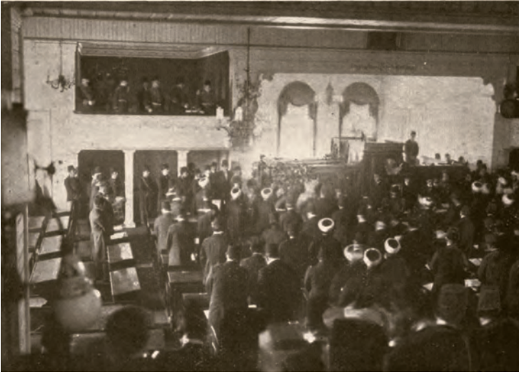
3- Meclis-i Mebusan'ın II. Meşrutiyet dönemi açılışında Sadrazam Said Paşa tarafından nutk-ı hümayunun (padişahın konuşmasının) okunması

Yunanistan ile Fener Rum Patrikhanesi desteklemiştir. Rumların seçim hileleri meydana çıkınca, bunu gizlemek için, bir taraftan Patrik kanalıyla Bâbiâli'ye şikâyetlerde bulunmuşlar diğer taraftan da 20.000 kadar Rum, 22 Kasım 1908'de Beyoğlu ve Bâbiâli'de gösteri yapma yoluna gitmişlerdir. Rumların temel isteği, İstanbul'daki seçimlerde nüfus tezkeresi aranmamasıdır. Çünkü nüfus tezkeresi arandığında Osmanlı vatandaşı olmayan dindaşlarına oy kullanıramayacaklarını bilmektedirler. Yunan basını da Türkiye'de 6.500.000 Rum ahali bulunduğu söz ederek, mebus ve ayan sayısının buna göre belirlenmesini istemiştir. Hâlbuki Osmanlı Devleti'nde Rumların nüfusu hiçbir zaman 6.500.000 olmamıştı. 1907 yılında nüfus oranları şöyleydi: Müslüman 15.508.753, Rum 2.852.812, Ermeni 1.120.748, Yahudi 253.435, Bulgar 761.530, ecnebi 197.760, diğer 189.592, toplam 20.884.630'dur. Rum Patriği Yuvakim Efendi, hükûmetten dine ve eğitime dair eski imtiyazların korunmasını istemiş, İttihat ve Terakki yönetimi de bu imtiyazlara dokunmak niyetinde olmadıklarını bildirmişti.