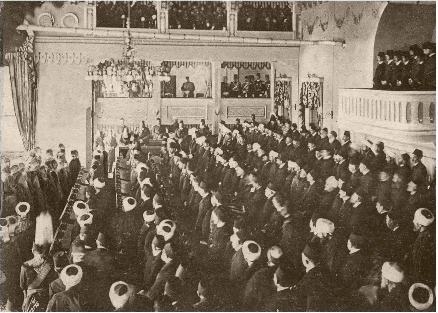
2- Meclis-i Mebusan'ın II. Meşrutiyet döneminde açılışı (17 Aralık 1908). Sultan II. Abdülhamid orta locada ayakta durmaktadır

Diğer usuller sancaklar için uygulananlar ile aynı olacaktır.