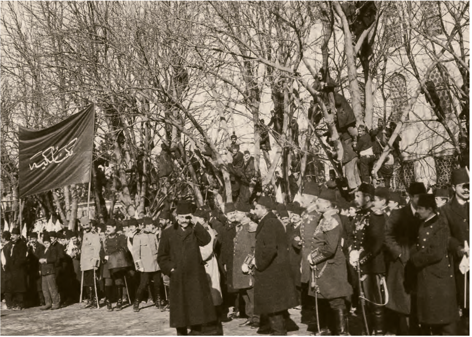
5- Meclis-i Mebusan'ın açılışını izlemeye gelen Mülkiye Mektebi talebeleri ve mezunları

Fırkası adayları ve bağımsızlardan seçilebilen olmamıştır. Sadrazam Kâmil Paşa ve Dâhiliye Nazırı Hüseyin Hilmi Paşa gibi tecrübeli isimler seçilememiştir