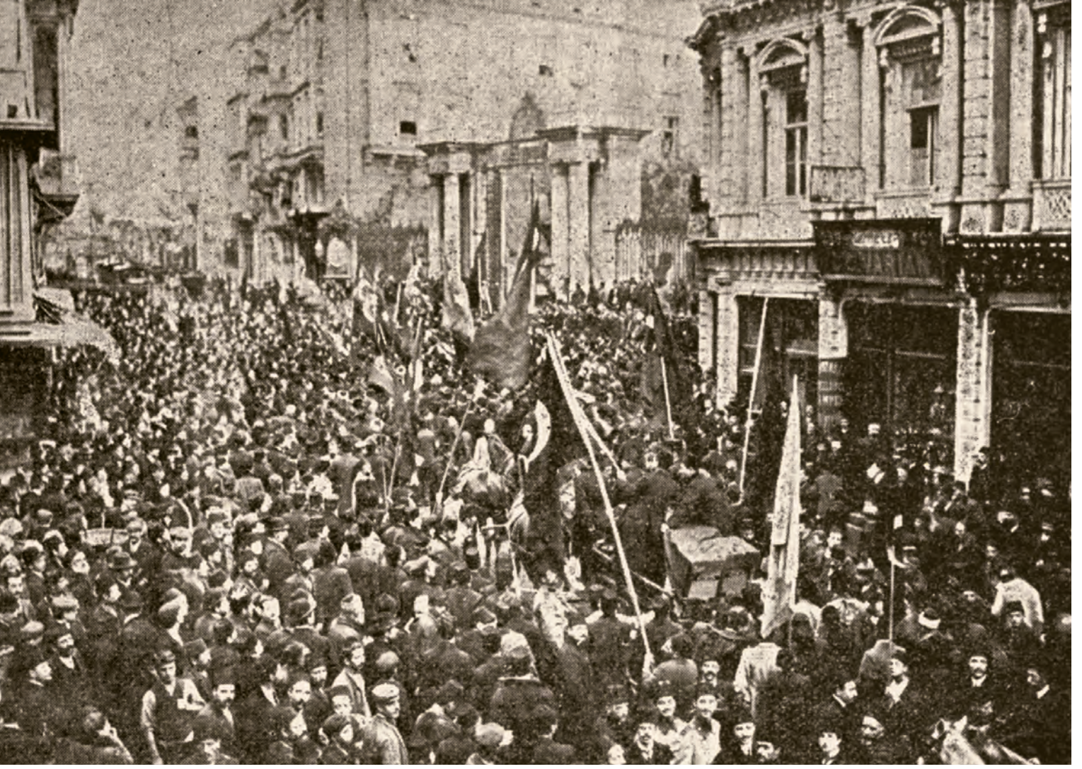
7- Beyoğlu seçim sandıklarının Cadde-i Kebir'den geçirilmesi (Resimli Kitap)