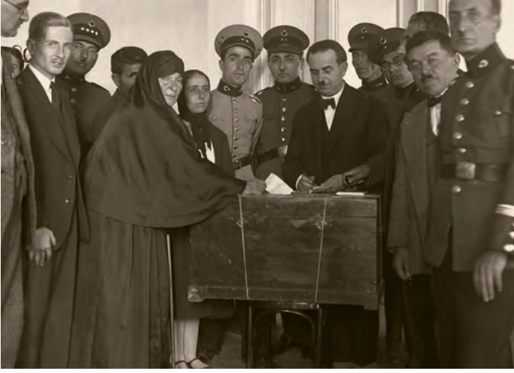
11- İstanbul'da seçim sandıkları ve oy kullanma işlemi (13 Ekim 1930) (İBB, Kültür A.Ş.)