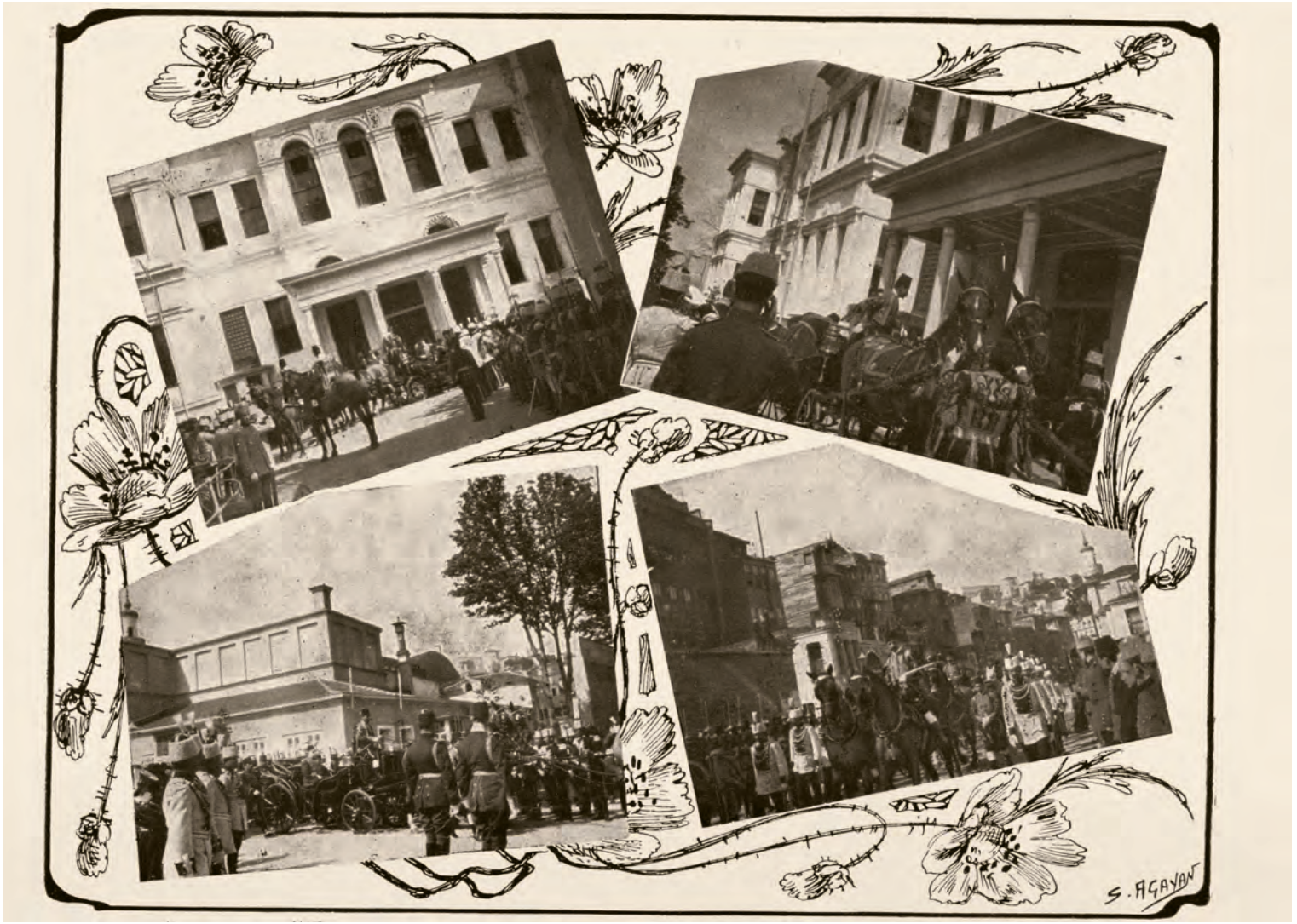
8- Sultan V. Mehmed Reşad'ın Meclis-i Mebusan'ı açmak üzere parlamentoya gelişi (Resimli Kitap)