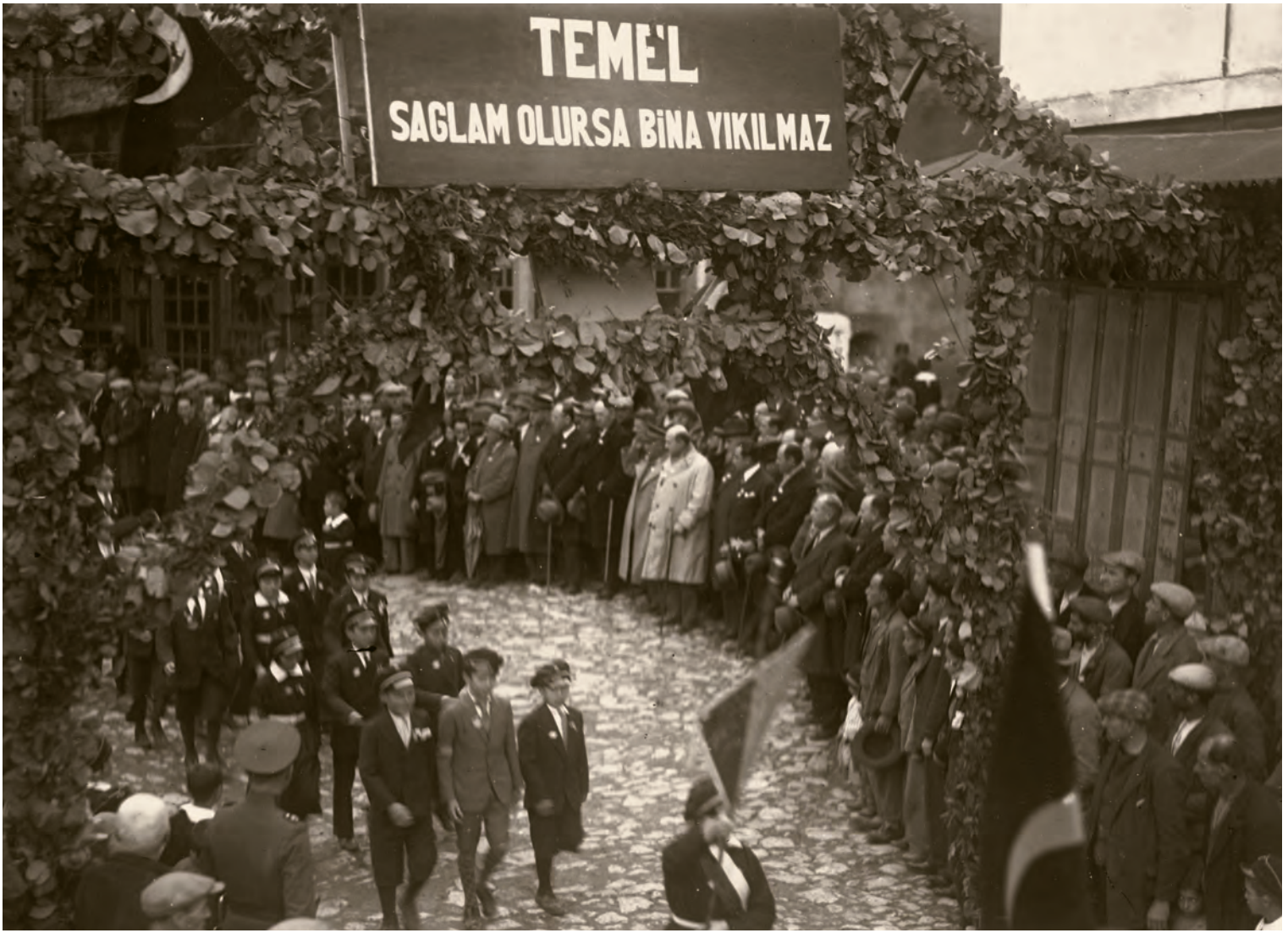
19- 29 Ekim Cumhuriyet Bayramı merasiminde İstanbul Valisi ve Belediye Başkanı Muhittin Üstündağ (beyaz paltolu, elinde bastonu var)

müşahedeye tabi tutmuştur.” DP merkezine gelen raporlar sonucunda seçimlerde “birçok tesir, müdahale ve yolsuzluklar” tespit edilmiştir. Seçimlerden sonra bu raporların bir kısmını “26 Mayıs Seçimleri” isimli bir broşür ile yayınlamıştır.