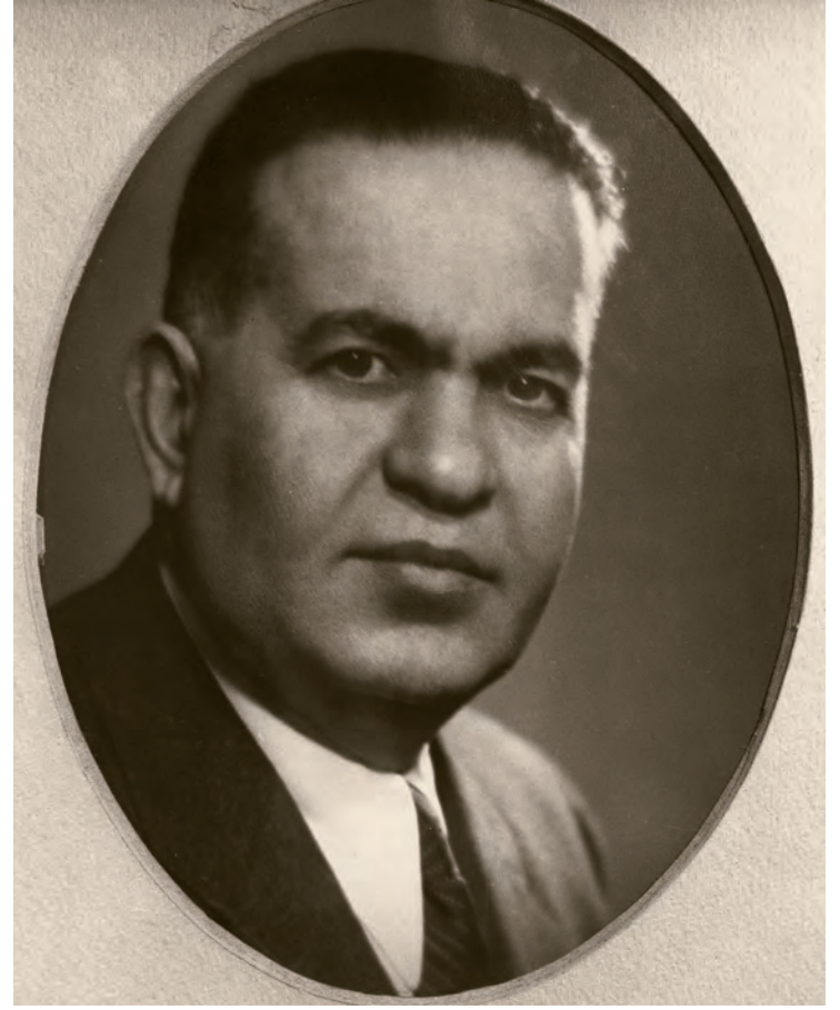
18- 08.12.1938-16.10.1949 tarihleri arasında İstanbul Belediye reisi olan Lütfi Kırdar