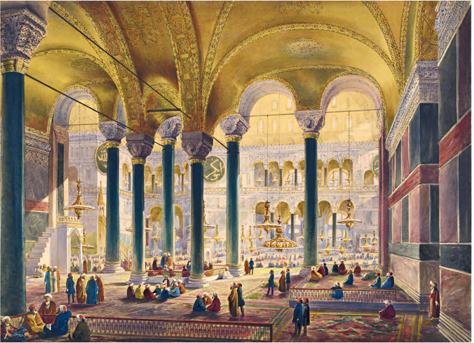
6- Ayasofya (Fossati)

kullanılmaktaydılar. Yapıldığı tarihte duvarları mermer levhalarla kaplı olan rampaların özellikle kuzeydoğuda olanı içinde bir de mezar vardır.