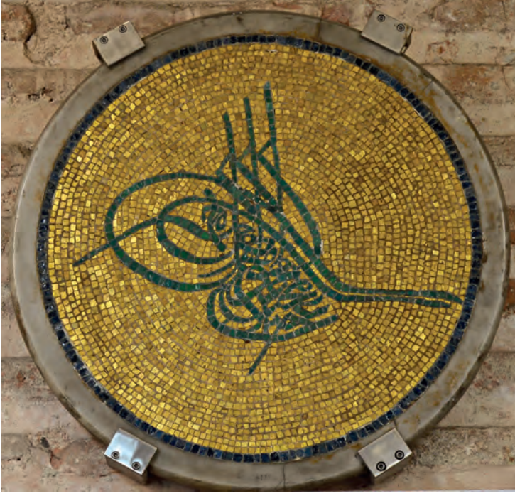
9- Dış narteks ana giriş kapısının sağındaki duvarda sergilenen Sultan Abdülmecid'in tuğrası. Tuğra Fossati kardeşlerin Ayasofya onarımı sırasında duvarlardan dökülen orjinal altın yaldızlı mozaik parçalarından İtalyan usta N. Lanzoni tarafından yapılmıştır

katı hâlâ büro, üst katı ise müdür lojmanıdır. Sıbyan mektebinin karşısında ise camideki ibadet zamanlarını belirlemekte kullanılan saatlerin muhafaza edildiği muvakkithane binası vardır. Bu bina Ayasofya'da yaptıkları büyük onarımın ardından İsviçreli Fossati Kardeşler tarafından 1853'te inşa edilmiştir. Ayasofya'nın müzeye çevrilmesinin ardından bu yapı büro olarak kullanılmaya başlanmıştır.