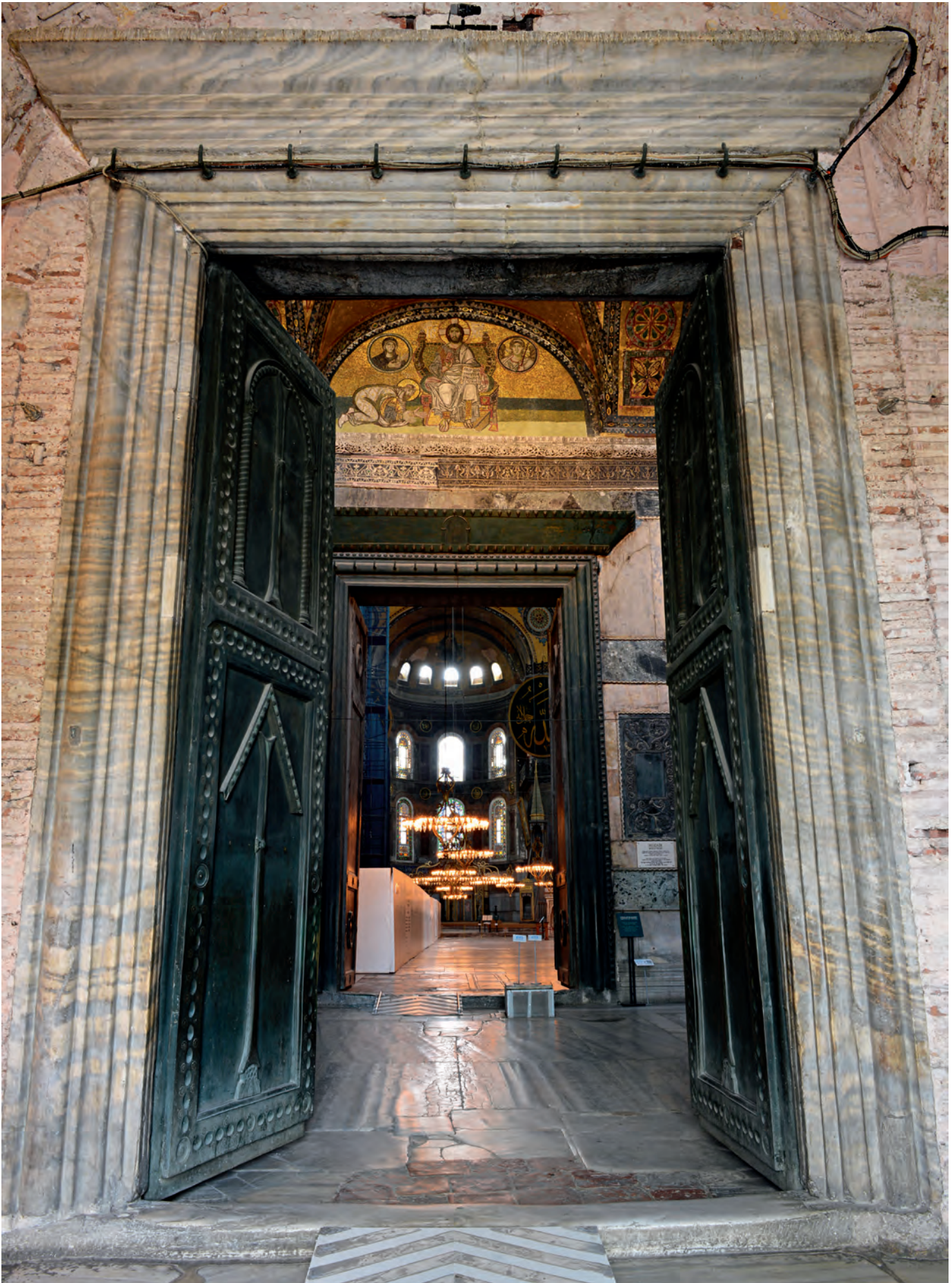
1- Ayasofya'ya giriş