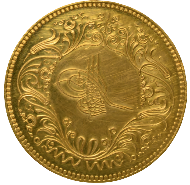
8- Sultan Abdülmecid tarafından tamir edilen Ayasofya'nın hatıra madalyasının ön ve arka yüzü (İstanbul Arkeoloji Müzesi Sikkeler Bölümü)

hatırlatılmaktaydı. Din adamlarının kutsallığı sebebiyle halk arasında çok özel algılanan bu mekâna bu sebeple halk arasında cennet kapısı denmekteydi. Patrikhaneden bugün geriye sadece güneybatı tarafındaki sekreterlik odası kalmıştır. Bu bölümün, kapı girişi üstünde ve tavanında bulunan mozaikler sebebiyle, imparator ve patriğin görüşmeleri sırasında kullandıkları mekân olduğu düşünülmektedir. Bugün itibarıyla içinde bölge kentlerinden gelen ikonalar depolanmaktadır.