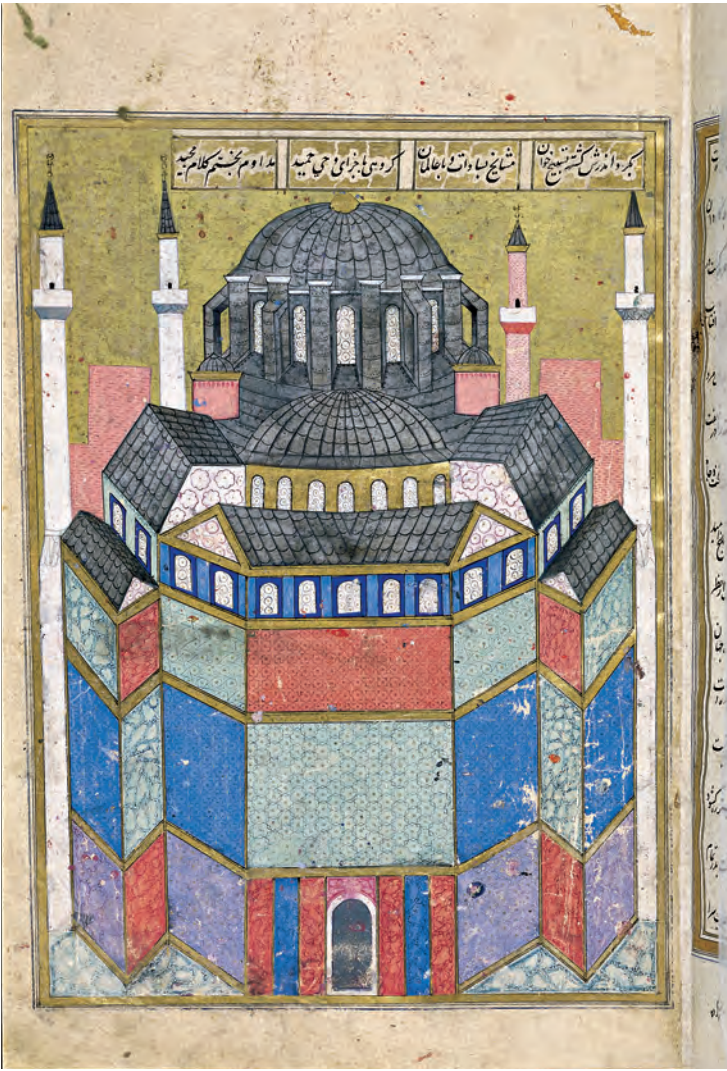
5- Ayasofya (Hünernâme)

içinde Kur'andan Nur suresi bulunmaktadır. Kubbenin altında dört köşede bulunan ve mahşer gününde İsa Peygamberin oturacağı tahtı taşıyacağına inanılan altı kanatlı Serafim meleklerinden kuzeydoğuda olanının yüzü 2009 tamiratları sırasında ortaya çıkarılmıştır. Aslında dördünün de mozaikten yapılmış olmalarına karşın, daha Bizans döneminde batı yönündeki melekler mozaikle tamir edilememiş ve freskoyla melekler yapılmıştır. XIX. yüzyıl ortasında yapılan tamiratlar sırasında doğu yönündeki mozaikten yapılmış meleklerin suratları üzerine levhalar konulmuştur. Diğer meleklerin yüzlerini örten yıldızların altında yüzleri mevcuttur. Binanın bitiminde içinde bugün de bir kısmı görülebilen mozaik bezemeler bulunduğu bilinmekle beraber, dönem kaynakları herhangi bir insan ya da melek tasvirinden bahsetmemektedir. İnsan ve melek tasvirli olanların sonraki yüzyıllarda 843 yılında sona eren "ikona kırıcılık" hareketinin ardından yapıldığı bilinmektedir. Bina içinde bulunan mozaiklerde sadece suratlar kapatılmıştır.