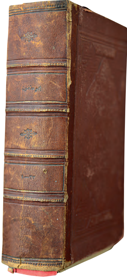
1a- Cemiyet-i İlmiye-i Osmaniye'nin çıkardığı Mecmûa-i Fünûn

resmî dili Türkçeye dönmüştür. Saltanatın kaldırılmasının ardından adı “Şark Tıp Cemiyeti” olarak değiştirilmiş ve cemiyet 1923’te “Türk Tıp Cemiyeti” adını almıştır. 1973’te adı “Türk Tıp Derneği” olarak değişen bu kuruluş günümüzde de varlığını sürdürmektedir. 8