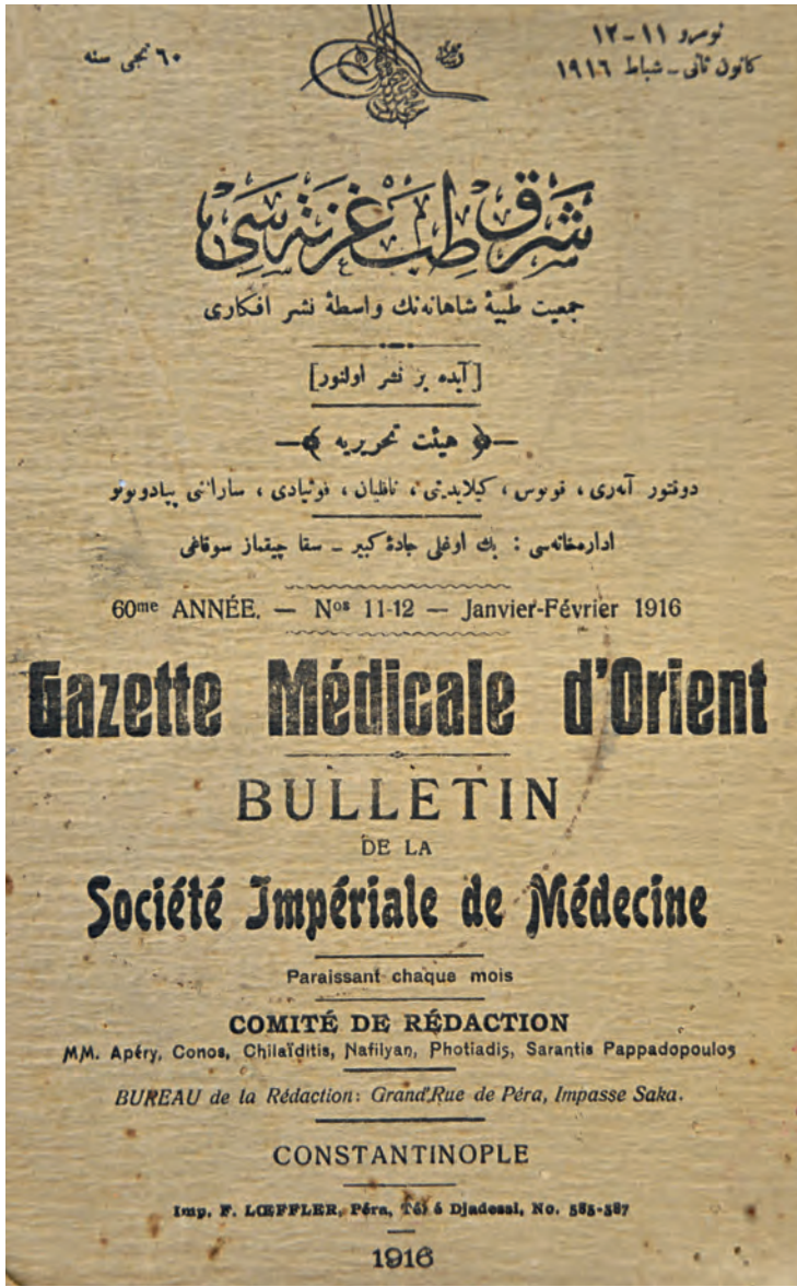
4- Cemiyet-i Tıbbiye-i Şâhâne'nin çıkardığı Gazete Médicale d'Orient (Doğu Tıp Gazetesi)