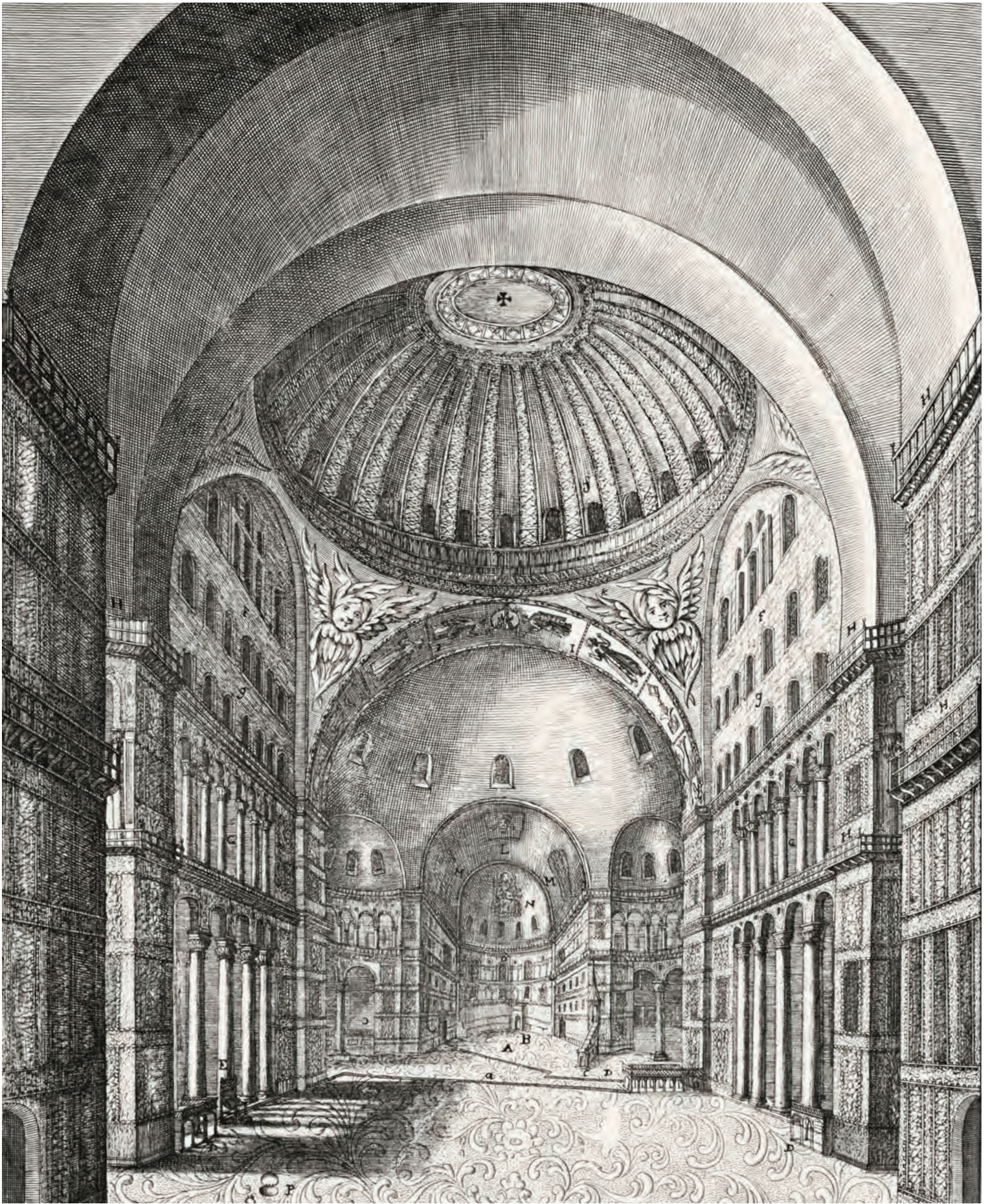
2- Konstantinopolis'in simge mabedi Ayasofya (Bunduri)