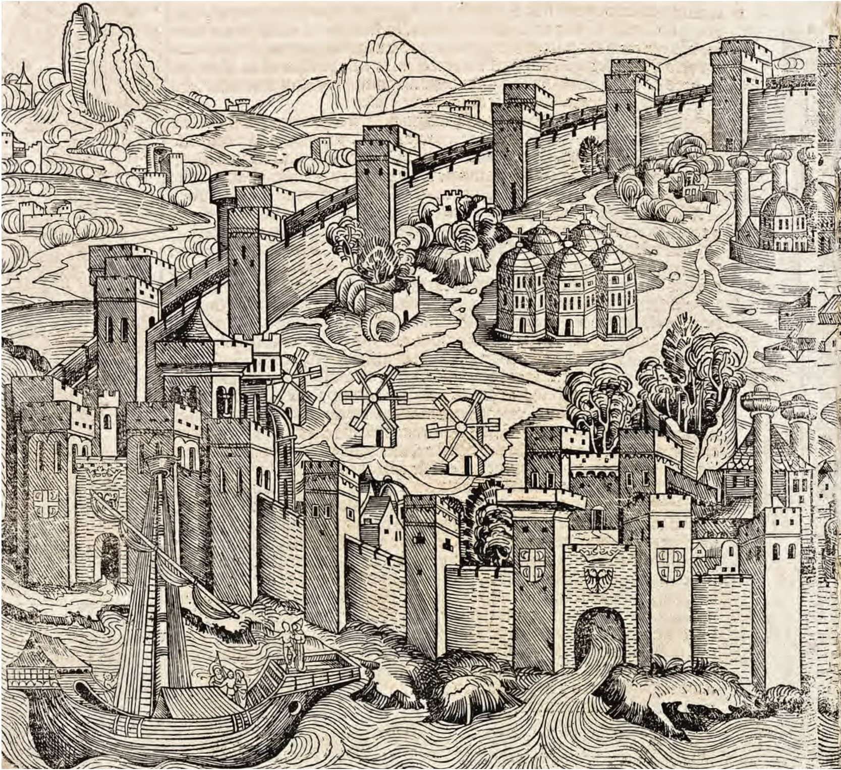
1- Konstantinopolis (1493) (Schedel)

geldi ve ana küresel şehirden miras aldığı kültürel kimliği öne çıkarmaya başladı.