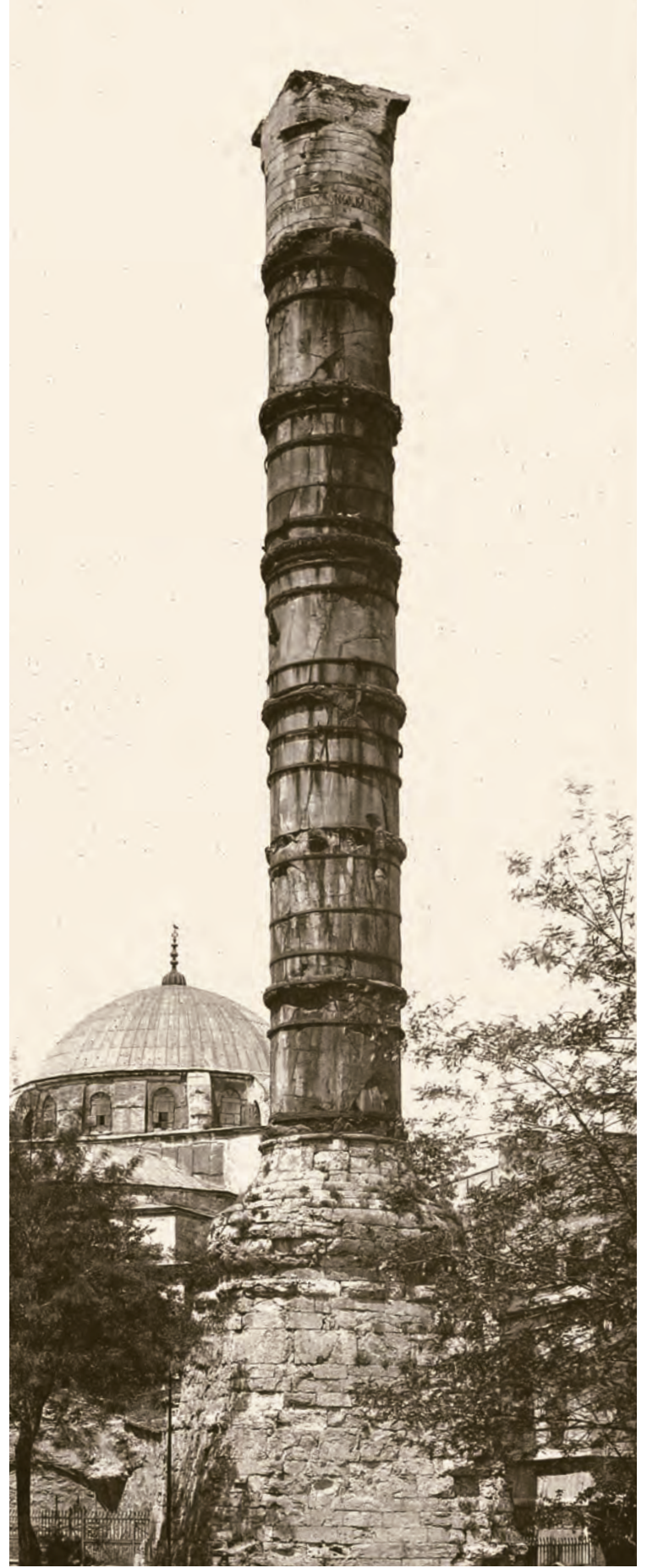
4- Konstantinopolis'in simgelerinden Kıztaşı ve Çemberlitaş (Sağda) (Gurlitt)