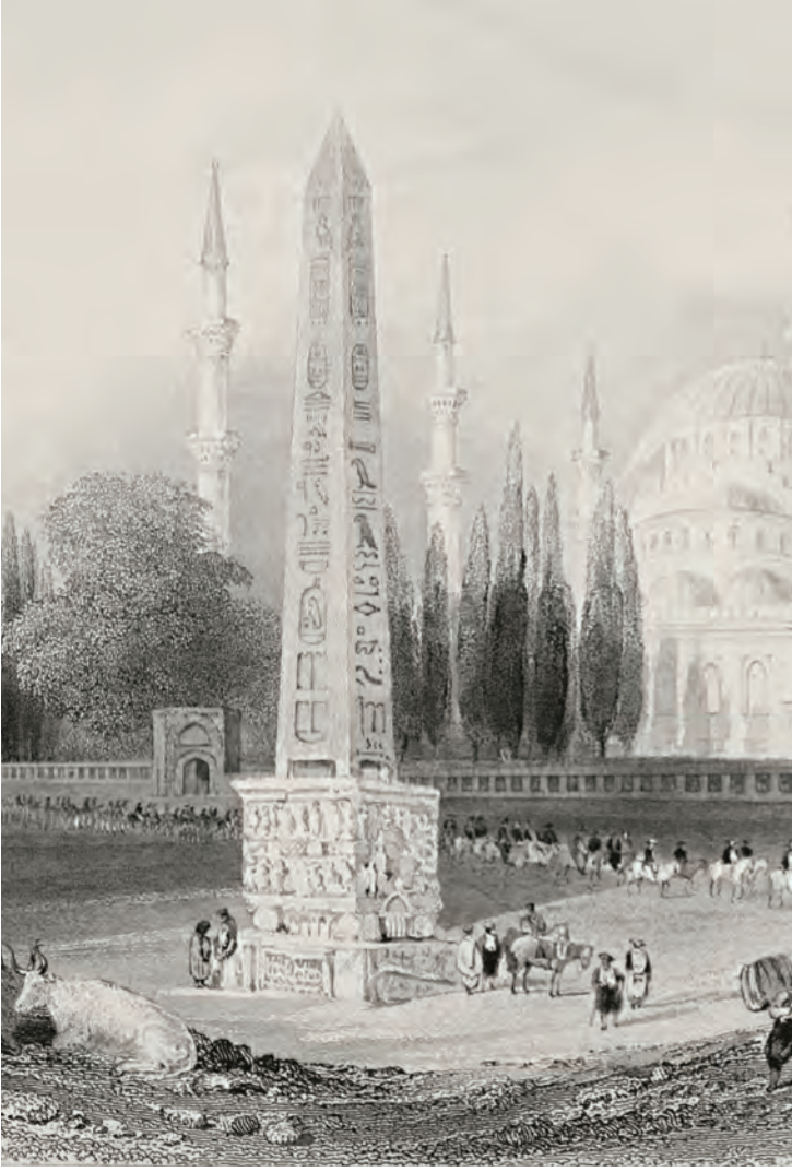
5- Konstantinopolis'te imparatorluk törenlerinin mekânı Hipodrom ve Dikilitaş (Allom)

Abbasîler yeni kurdukları başkent Bağdat'ta gerçekten küresel öneme sahip bir şehir inşa ettiler.