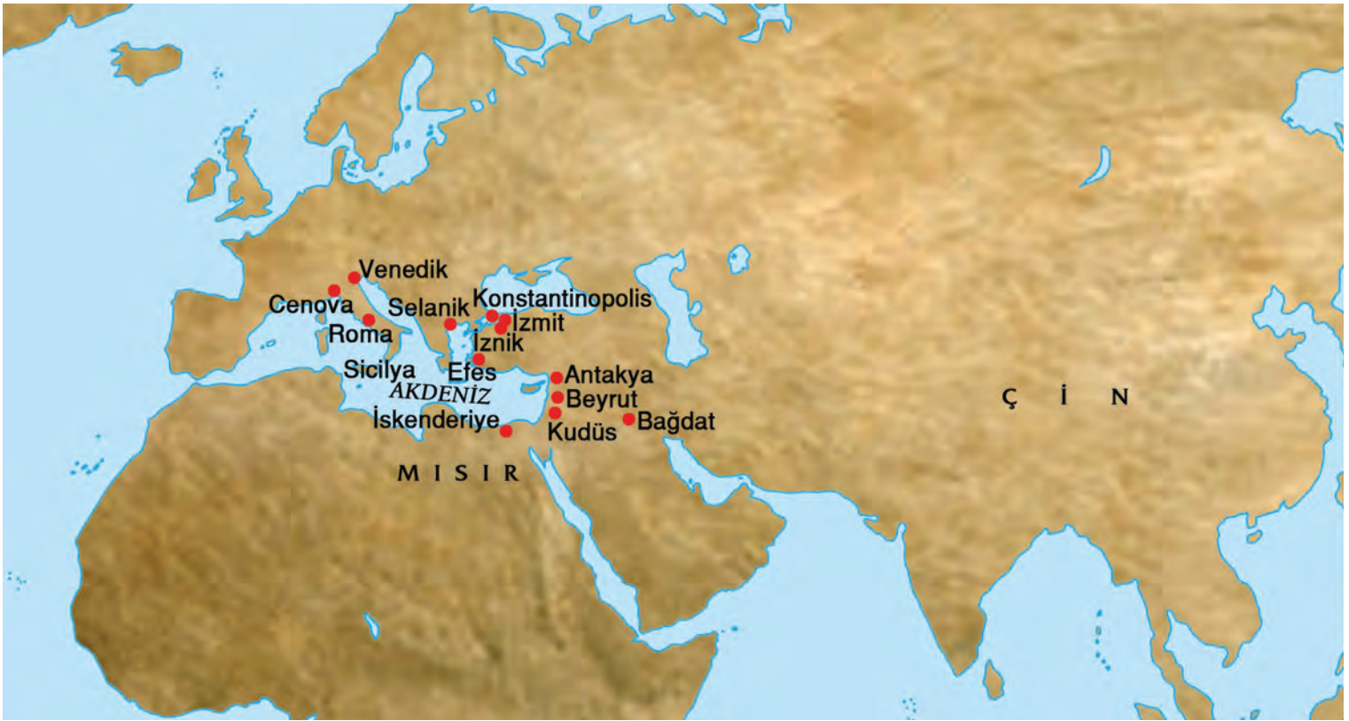
3- Konstantinopolis ve dünya şehirleri (Harita: Oğuz Kallek)

ve kültürel ağının etkilerini Kuzey sınırının çok daha ilerisine taşımış olduğundan, Batı taraflarını kendisinden çok farklı olmayan yapılara bırakmış oldu. Bu topraklarda kurulan krallıklar Roma âdetlerine veya Roma âdetleri sandıkları şeylere sahiptiler ve Konstantinopolis'in imparatorluğun başkenti olmasına da bir itirazları yoktu. O zamanın kaynaklarından Romalıların bu durumu basitçe “yeni bir idare” deyip geçmediklerini biliyoruz ve fakat bu, öyle böyle sadece siyasi bir anlam ifade ediyordu. Yeni durumda, niteliksel olarak yani iktisadi, kültürel ve dinî açıdan değişiklik yok mesabesindeydi niceliksel olarak ise hatırı sayılır bir küçülme oldu. Batı, imparatorluğun zengin bir parçası değildi; az da olsa şehirlerinde olan zenginlik ise, imparatorluğun sağladığı büyük ağın parçası olmasından ve büyük şehirleri besleyen mal ve personeli dolaşıma sokmasından kaynaklanıyordu. Şimdi geniş imparatorluk ağının yerini daha küçük olan krallıkların ağı aldı, kilisenin kurduğu ağ varlığını devam ettiriyordu ama şehir hayatı küçüldü ve taşradaki hayat da eskisine oranla çok daha fakirleşti. Hele Vandalların Kuzey Afrika'ya yerleşmesiyle eski başkent, tahıl ambarını da kaybetmiş oldu. Bu durumda, başkentte büyük nüfus barındırmanın imkânı yavaş yavaş ortadan kalktı.