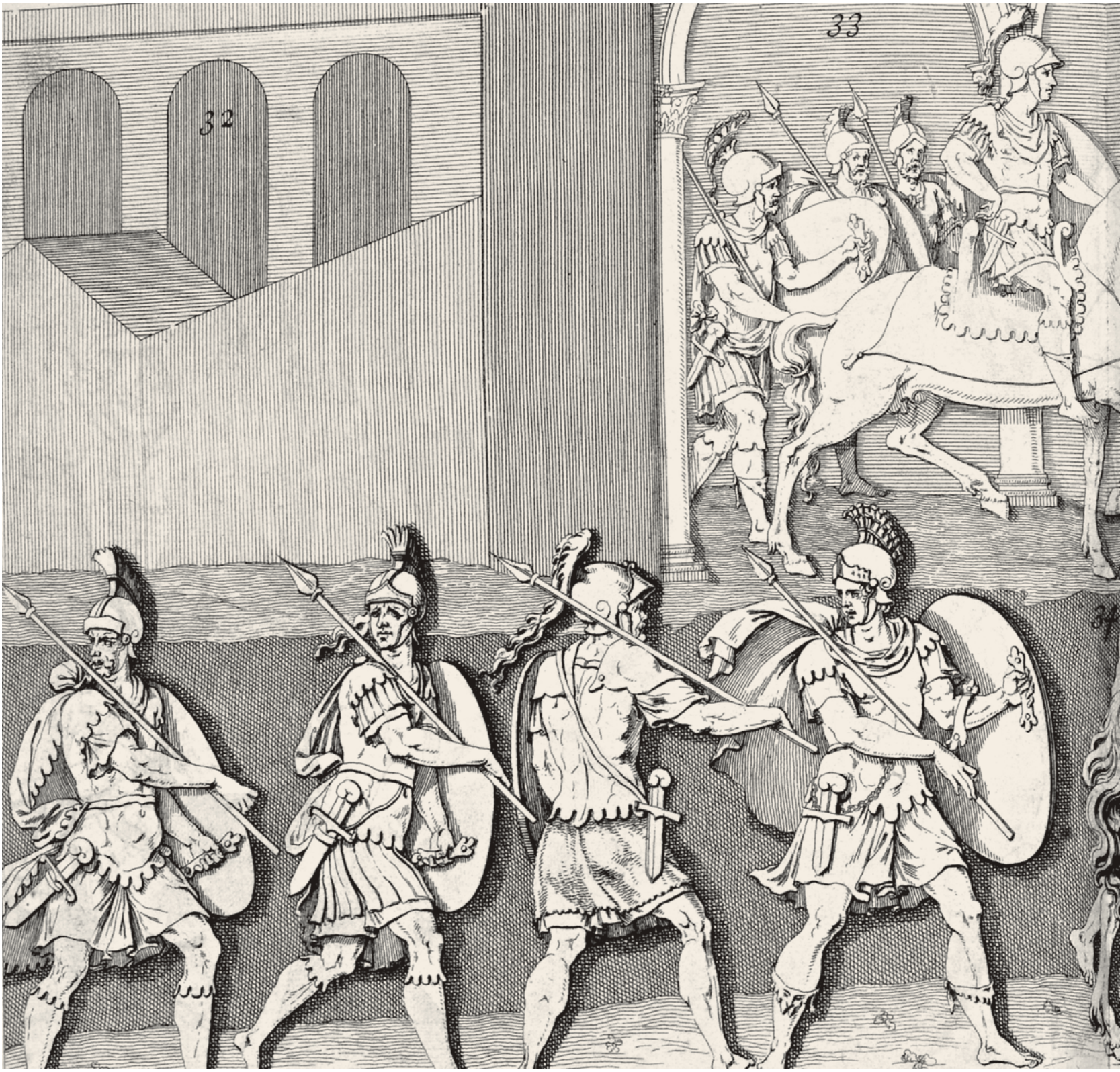
6- Arkadios Sütunu'nda resmedilen Bizans askerleri (Coignard)

bakımlarını yapan ayrıca özel şahıslarca yasal olmayan yoldan su çekenleri tespit eden aquarii adında teknik görevli vardı. Bu görevliler tanınmaları için ellerinin üzerinden işaretlenmişlerdi ve militia adı verilen askerî görevli statüsündeydiler. Bazı kemerler kamu binalarına tahsis edilmişti. Konstantinopolis'teki Aqua Hadriana