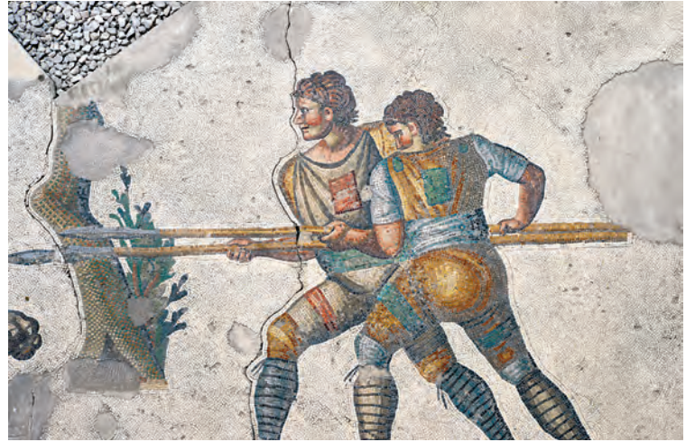
5- Şehir idaresinde en önemli merkez olan Büyük Saray'ın mozaikleri (İstanbul Mozaik Müzesi)

Bir başka kemer I. Theodosios tarafından, şehrin yüksek yöneticileri tarafından düzenlenen oyunlara ara verilmek ve bunun yerine su kemerini finanse etmek üzere sabit miktarlı fon oluşturmak suretiyle inşa edilmişti. Arkadios zamanında bazı yüksek yöneticiler, oyunların yeniden düzenlenmesi için emir almışlardı, fakat öyle görünüyor ki diğerleri su kemeri fonuna yaptıkları ödemelere devam ettiler. Sonuçta bu ödeme kalıcı hâle