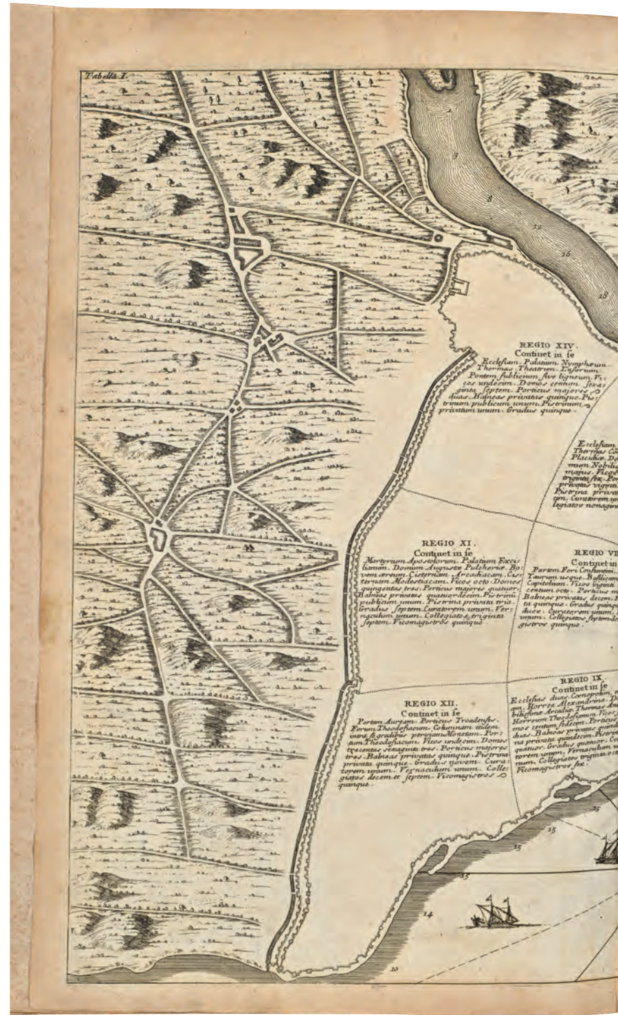
9- Bizans döneminde 14 bölgeye ayrılan İstanbul'un yönetim haritası (Coignard)

Başkent'in hazinesine Sakelle veya Sakellion, bu işi yürüten kişiye de sakellarios adı verilmektedir. Sakellariosun en önemli görevi; saray halkının finansmanından sorumlu müfettişlikti. Sakellarios, imparator ve saray halkıyla yakın ilişki içerisinde olması Bizans'ın mali olarak gittikçe merkezî bir yapı hâline geldiğini göstermektedir. VII. yüzyıldan itibaren kendisini belirgin şekilde hissettiren bu merkezîleşme ile beraber imparatorun idari anlamda daha baskın bir rol üstlendiği görülmektedir. İmparatorluğun 640'lı yıllardan itibaren içine düştüğü iktisadi ve siyasi bunalım, bu sürecin oluşmasını sağlamıştır. Bununla bağlantılı olarak bu dönemden itibaren Bizans hâkimiyetindeki birçok kentte olduğu gibi başkent'in de küçüldüğü görülmektedir. Bu küçülmenin çok çeşitli sebepleri olmakla birlikte başkent'in zenginlerinin VI. yüzyılın ikinci yarısından itibaren servetlerini dinî yapılara ya da dinî objelere ayırma eğilimi içerisinde girmeleri en temel sebep olarak