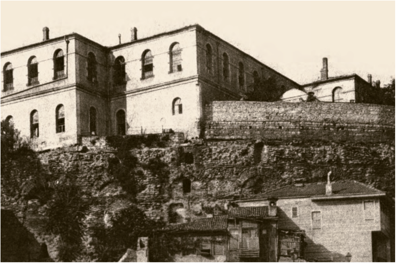
4- Bizans Büyük Saray kalıntıları (Mamboury-Wiegand)

konutlara sahip olabiliyordu”. Aristokratlar mekânsal olarak imparatorun sarayına yakın olmak istiyorlardı. Noterliklerin mekânsal olarak kiliselerle olan bağlantıları VI. yüzyıla kadar gitmektedir. Eparkhosun Kitabı ’nın ilk bölümü; hukuk mesleğinin kent içindeki örgütlenmesini anlatmaktadır. Noterlik büroları içinde veya onlara ek olarak hukuk üstatlarının ( nomikoi ) yardımcılarıyla birlikte nerelerde ders verdiklerini tarif etmektedir. Her üstat, geleneksel mekânların ( nome ) başına geçmeden önce meslektaşlarınca seçilir ve vali ( eparkhos ) tarafından cemiyetinin başı olarak atanırdı. İviron’un Amelleri adlı eser, başkentte beş hukuk bürosunun varlığından bahsetmektedir: