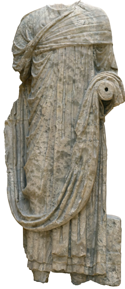
3- Laleli kazılarında bulunan V. yüzyıla ait üst düzey memur heykeli (İstanbul Arkeoloji Müzesi)

Yüzyıllar boyunca imparatorluğun yönetim kademesinde etkin bir rol oynayarak varlığını sürdüren senato, toplumsal saygınlığa sahip çok zengin bir kurum