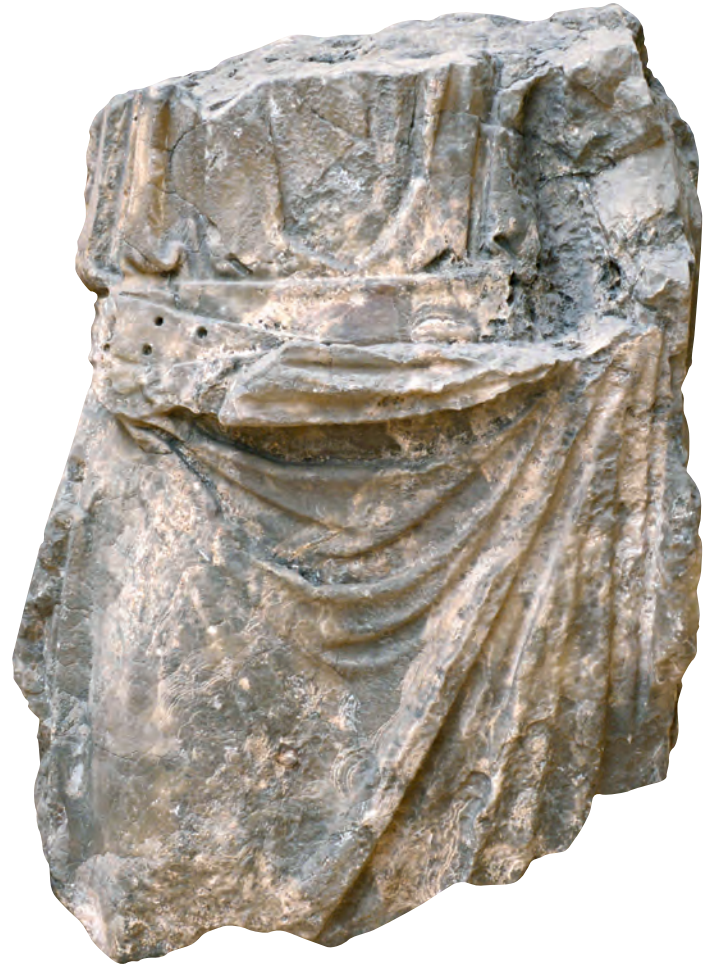
1- İmparatora veya bir memura ait olduğu tahmin edilen IV. yüzyıla tarihlenmiş heykel parçası (İstanbul Arkeoloji Müzesi)

İdari yapıdan bahsetmeden önce, çoğunluğu tahmini rakamlara dayanan kentin nüfusunun tarihî süreçteki dalgalanmalarını hatırlatmakta fayda vardır. 330 yılında imparator tarafından resmî bir törenle açıldıktan sonra kentin nüfusunun 200.000 kişi olduğu, V. yüzyılda 300.000'i aşkın kişiyi barındırdığı, daha sonra Iustinianos döneminde (527-565) 500.000 kişiye ulaştığı, VIII. yüzyılın ortasında veba salgını ve çeşitli sebeplerden 30.000-40.000 kişiye kadar düştüğü