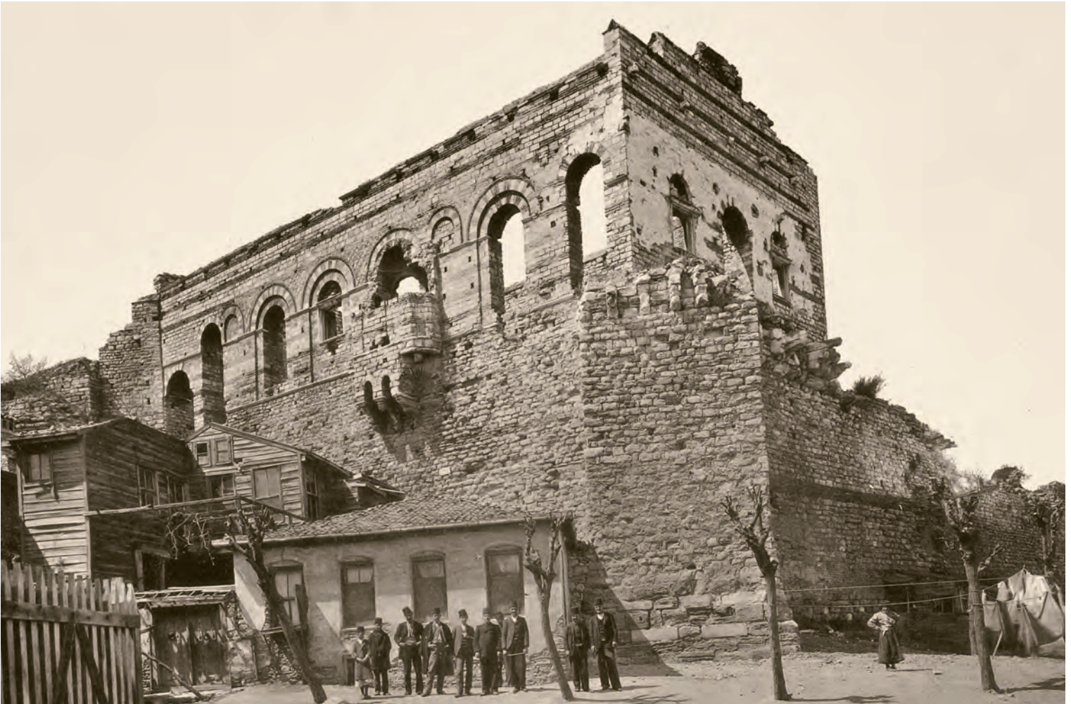
8- Tekfur Sarayı (Gurlitt)

metalar, dönemin ticaret pazarları olan kapanlara getirilerek, onun gözetiminde vergi ve alım-satım fiyatı belirlendikten sonra piyasaya sürülebilirdi. Eparkhos, gerekirse ürünlerin fiyatını sabitleyebilirdi. Bizans İmparatorluğu'nun iktisadi hayatı, kendi kendine yetebilme politikasına dayandığı için imparatorluk tebaası, imparatorluk nüfusuna yetecek kadar üretim gerçekleştirebilirdi. Yönetim tarafından ihracat ciddi anlamda sınırlandırılır; ithalat ise yönetimin kararıyla sistematik bir şekilde teşvik edilirdi. Osmanlı İmparatorluğu'nda olduğu gibi Bizans İmparatorluğu'nda da stratejik meta olarak değerlendirilen bazı metaların satışı (tuz, silah, ergüvani ipek, Grek ateşi yapımında kullanılan ham maddeler gibi) yasaklanmıştır. Özellikle ipek ticaretinin ciddi anlamda denetlenmesi gerekmekteydi. Bunu, imparatorluk adına denetleyecek olan yine eparkhostur. Ayrıca ürünlerin satışında en önemli unsur olan ölçüm ve tartı birimlerinin belirlenmesi yine onun kontrolü altındadır. Hükûmetin, dolayısıyla eparkhosun ölçüm ve alım-satım kararlarına aykırı davranışlar, loncadan çıkarılmak, falaka ve