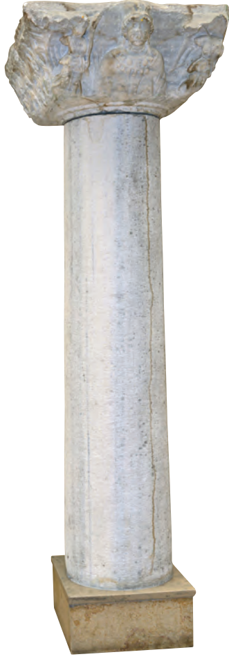
2- Haznedar-Bakırköy kazılarında çıkarılan V-VI. yüzyıllara ait imparator ve imparatoriçe betimli başlık (İstanbul Arkeoloji Müzesi)

olarak taahhüt altına girmesi, imparatorun talep ettiği yerel gelirlerin vergi matrahının belirlenmesi, toplanması ve merkezî bütçeye iletilmesi bu meclisin görevleri arasında sayılabilir. Halkın ve ordunun yaptığı seçimi yasallaştırmak için tahta çıkan her imparatoru senatonun onaylaması zorunluydu. İmparator seçiminde önemli rol oynayan senato, sık sık darbe yaparak ya da güç kullanarak iktidarı ele geçiren imparator adaylarının tahta çıkışını onaylamak zorunda kalmıştır. Bu yetkileri sebebiyle meclis üyeleri zaman içinde siyasi meselelerde de söz sahibi olan soylu bir sınıf oluşturdu. Fakat meclis üyelerinin özellikle mali sorumluluklarından kurtulmak için zaman zaman çeşitli yollara başvurdukları görülmektedir. Konstantinopolis'teki senatonun, tıpkı Roma senatosuna benzeyen ayrıcalıkları, tahsisatları, parasal avantajları vardı. Senato, eparkhosun başkanlığında Augusteion Forumu'nun yanındaki bir sarayda toplanırdı.