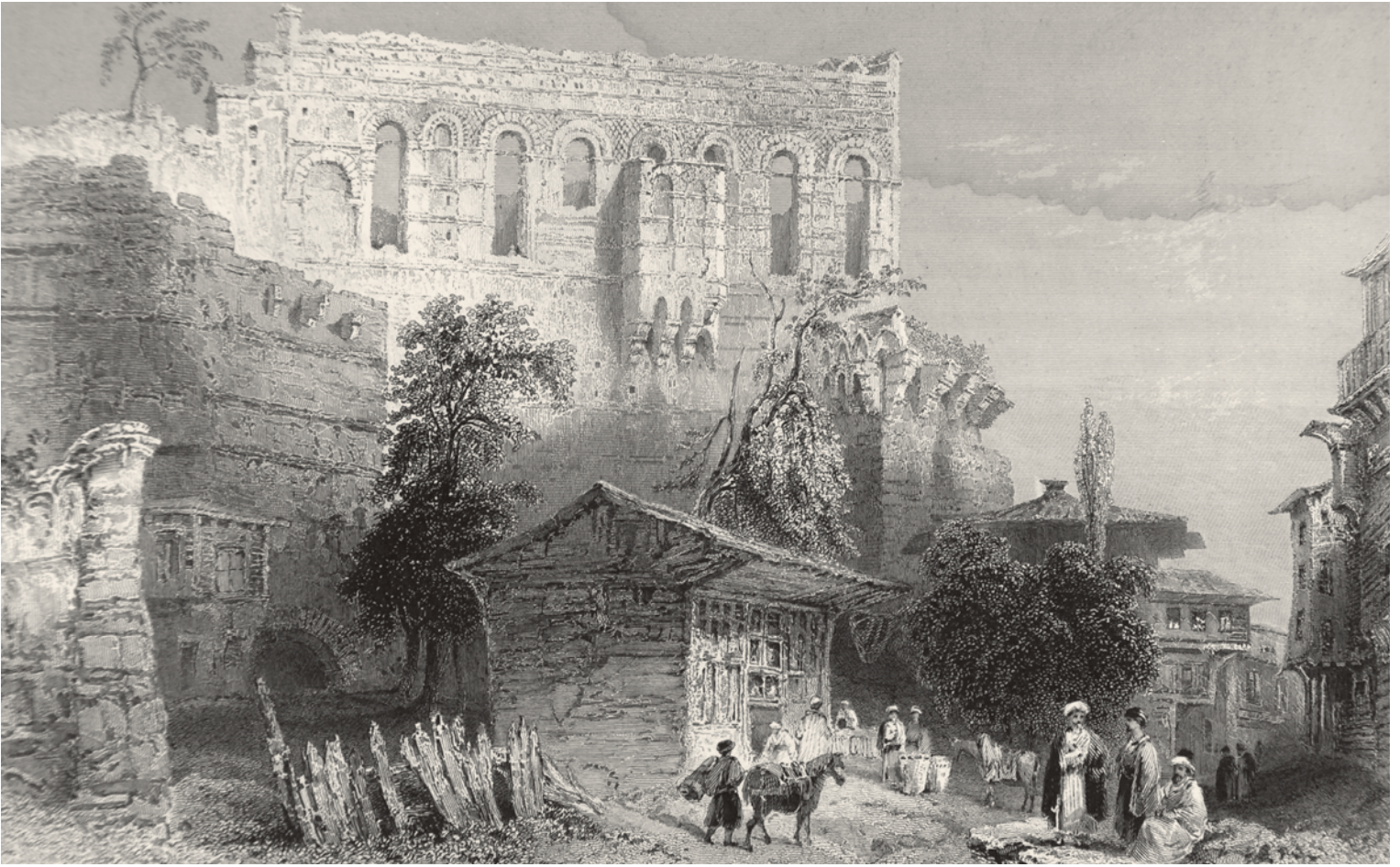
2- Elçilerin ağırlandığı Tektur/Blakhernai Sarayı (Pardoe)

engel olur.” cümlelerini kullandı ve kahkaha attıktan sonra “Onların oburluğu iş yapmalarına manidir...” sözlerini sarf etti. Benim cevap vermeme müsaade bile etmeden aşağılayıcı bir tarzda “Sizler Romalı olamazsınız, Lombardsınızdır...” dedi. 11