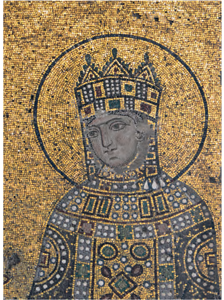
11- İmparatoriçe Zoe (Ayasofya)

İstanbul aristokrasisi sahip oldukları makamlara göre sivil ve asker olmak üzere iki grupta mütalaa ediliyordu. Sivil aristokratların birçoğu İstanbul'da ikamet edip çeşitli unvanlarla devlet makamlarını ellerinde tutarlarken onların zenginlik kaynakları olan toprakları Anadolu ya da Balkanlar'daydı. Bunlar iktidarla ilişkilerinde sürekli kendi çıkarları lehine imtiyazlar elde etmeye uğraşıyorlar ve vergi muafiyetleri talep ediyorlardı. Ordu ve donanmada komutanlıkları ellerinde bulunduran askerî aristokratlar ise askerî sınıf lehine düzenlemeler istiyorlardı. İmparator II. Basileios her iki aristokrat zümre arasında ustaca bir denge sağlarken, özellikle sivil aristokrasinin mali ayrıcalık taleplerini kabul etmedi ve vergi yükünün askerî aristokrasi üzerine yıkılmasına engel oldu. Diğer taraftan ülke genelinde devlete asker sağlayan küçük arazi sahibi köylüyü, koruyucu tedbirler aldı. Büyük arazi sahibi aristokratların ve kilisenin küçük arazisiz olan köylülerin topraklarını yutmalarına izin vermedi. Bizans vergi sisteminde eskiden beri uygulanmakta olan sisteme göre köylülerden biri vergisini ödeyemezse komşuları bu vergiyi ödemekle yükümlü tutuluyorlardı. Bu usulde değişiklik yapan II. Basileios, küçük toprak sahibi köylünün ödeyemediği vergiyi büyük arazi sahibi olan aristokratların ödemesini emretti. Bu durumu İstanbul aristokrasisi Patrik Sergios'un da katılımıyla protesto etse de imparator aldığı