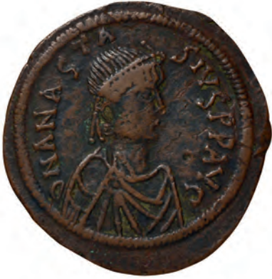
8- Anastasios adına kesilen sikkeler (İstanbul Arkeoloji Müzesi, Sikkeler Bölümü)

Bu arada 599'da Avarlar tarafından esir alınan 10.000 Bizanslının katledilmesi imparatorluk yönetimine olan tepkileri daha da arttırdı. İstanbul'da imparatora karşı halk partileri ateşli gösteriler yaptılar. Diğer taraftan imparator ordunun kışlık üslerine dönmesine de izin vermedi. Böylece aileleriyle görüşme imkânı da kalmayan askerler için yaşam daha da zorlaştı. Bu durumda da isyan eden askerler kendilerine Fokas'ı lider seçerek ayaklandılar ve İstanbul üzerine yürüdüler.