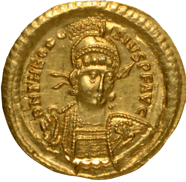
2- I. Theodosios adına basılan altın sikke (İstanbul Arkeoloji Müzesi, Sikkeler Bölümü)