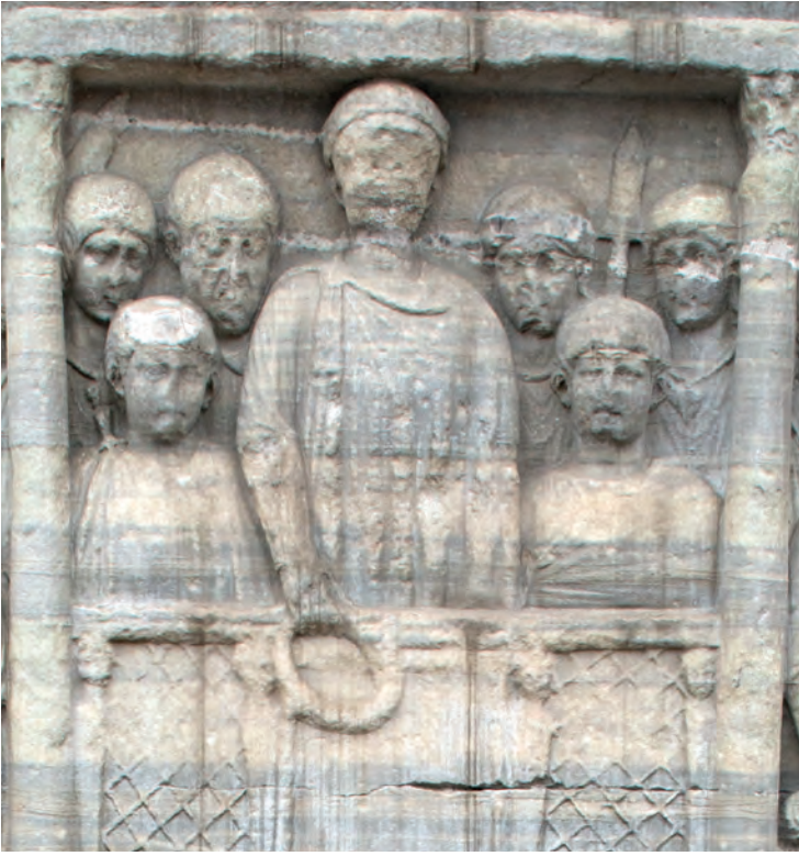
7- İmparator Theodosios (Dikilitaş)

oğlu bir isyan bahanesiyle ortadan kaldırıldı. İstanbul'da Aspar'a bağlı Germenler de bu sırada tasfiye edildiler. Başkentten sonra Balkanlar'da bulunan Germen Ostrogotların da batıya yöneltilmesiyle İmparatorluğun doğu kanadı Germen tehlikesini tamamen atlattı. İstanbul'da imparatorluk yönetimi Germen baskısından kurtulmuştu ama şimdi de Isaurialıların nüfuzu altına girmişti. İmparator I. Leon 473'te öldüğünde torunu Leon'dan (Ariadne ve Zenon'un oğlu) başka tahta çıkacak kimse yoktu. Çocuk imparatorun babası ve vasisi olarak Zenon bütün yetkileri kullanmaya başladı. Dokuz ay sonra çocuk imparator ölünce Zenon, Bizans tacının rakipsiz sahibi oldu. İstanbul aristokrasisi, halk ve kilise, Isaurialı birinin tahtta bulunmasından hiç memnun olmamışlardı. Isaurialılar, Germenler gibi yabancı değillerdi, imparatorluğun egemenliğindeki halklardan biriydiler. Fakat onların kaba saba tavırları ve Roma-Grek asıllı olmayışları İstanbul halkının onlara yabancı, "barbar" olarak bakması için yeterli gerekçeydi. İmparator Zenon (474-491) İstanbul halkının ve Bizans kamuoyunun kendilerini dışlayıcı tavırlarını hiç umursamadan Isaurialı kabile şeflerini İstanbul'da imparatorluk yönetiminin önemli mevkilerine getirdi. Saray muhafızlarını Isaurialılardan seçti. Zenon'un en büyük güvencesi Bizans başkentinde en etkili silahlı kuvvet olan Isaurialı askerî birliklerdi. Bununla birlikte Zenon, müteveffa kayınpederi