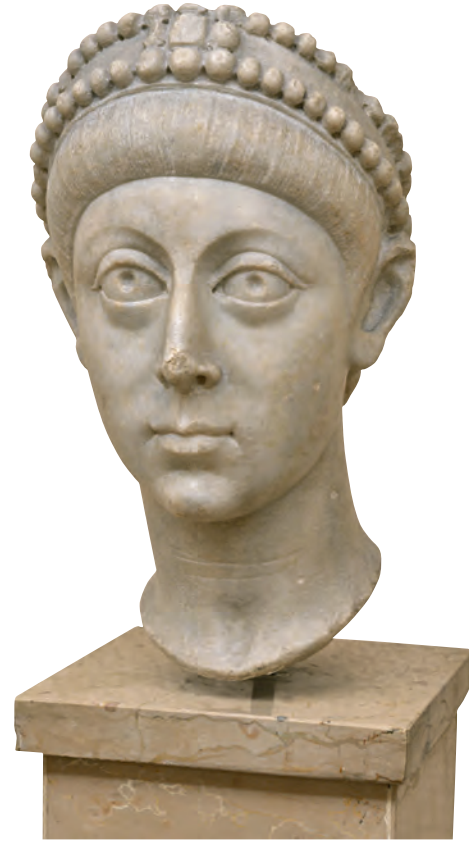
4- İmparator Arkadios (İstanbul Arkeoloji Müzesi)

İmparatorluğun doğu tarafını yöneten İmparator Arkadios 397 yılında boş bulunan İstanbul patriklik makamına Aziz Ioannes Hrisostomos'u atadı. Sadeliği seven, gösteriş ve israftan uzak duran, açık fikirli, etkili bir hatip ve karizmatik bir özelliğe sahip olan Hrisostomos, kısa sürede İstanbul halkının hayranlığını kazanıp kitleleri harekete geçirebilen bir lider oldu. Patrik Hrisostomos, siyasi iktidar karşısında dik durması ve hatta gerek gördüğünde imparator ve imparatoriçenin tavırlarına açıkça cephe almasıyla tanındı. 399 yılında Ostrogotlarla birleşen ordu komutanı Gainas isyan edip imparatorun sadık adamlarından Eutropios'un kendisine teslimini istedi. Başmabeyinci Eutropios'un tahakkümünden bıkmış olan İmparatoriçe Eudoksia'nın teşvikiyle İmparator Arkadios onu asilere teslim etmeye karar verince, Eutropios, Ayasofya'ya sığındı ve Ioannes Hrisostomos'tan kendisini kurtarmasını istedi. Askerler Ayasofya'yı kuşatıp Eutropios'u teslim almak isteyince patrik buna şiddetle karşı çıkarak reddetti. Bir süre sonra Patrik Hrisostomos, imparator ve imparatoriçeye karşı tavrını sertleştirdi. Patrik, özellikle İmparatoriçe Eudoksia'nın gösteriş merakını, aşırıya kaçan tavırlarını ve savurganlığını eleştirmekte ve halkın nazarında imparatorluk ailesinin itibarını sarsmaktaydı. Bu duruma daha fazla tahammül göstermeyen İmparator Arkadios,