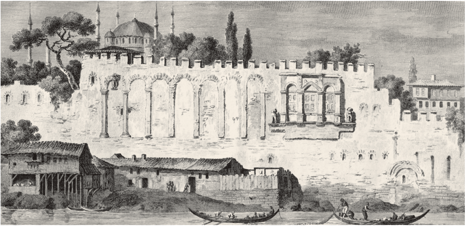
10- İmparator Marcellus Leo anıtı (Gouffier)

servetler dolayısıyla İstanbul kamuoyunda büyük memnuniyetsizlik de oluştu. İmparator II. Basileios bu fırsatı kaçırmadı, Basileios Lakapenos'un sarayı bir sabah imparatorluk kuvvetlerince sarıldı ve yaşlı mabeyinciye kimse sahip çıkmadı. Tutuklanan Lakapenos, İstanbul'a bir daha geri gelmemek üzere sürgüne gönderildi. 27