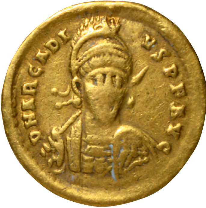
3- Arkadios adına kesilen sikke (İstanbul Arkeoloji Müzesi, Sikkeler Bölümü)

hepsi “augustus” (imparator) olarak ilan edildi. Üç kardeş siyasi rakipleri olarak, ölen imparatorun üvey kardeşleri Iulius Konstantios ve Dalmatios’un kendilerine tehdit oluşturacaklarını düşünüyorlardı. Onları bertaraf etmek için öncelikle İstanbul halkını kazanmaya yönelik çabalar gösterdiler. Halk arasında bir söylenti özenle yayıldı. Güya Büyük Konstantinos öldüğünde avucunda bir kâğıt bulunmuştu ve kâğıtta