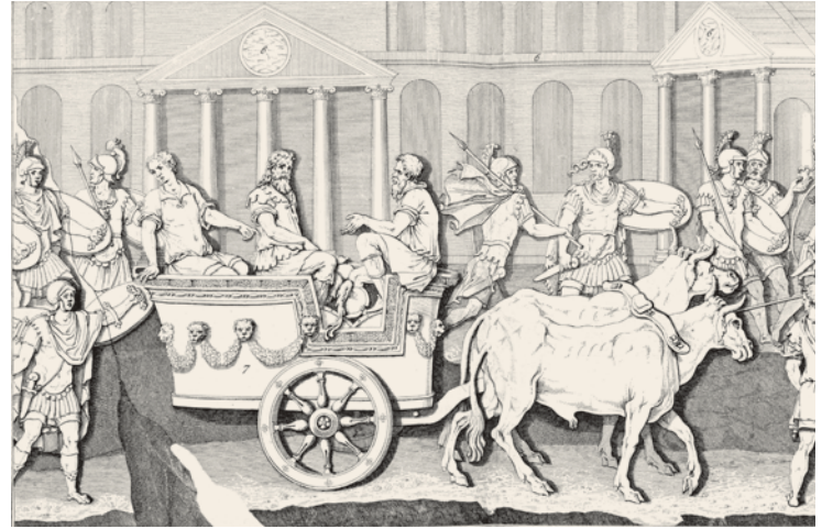
6- Avrat Pazarı'ndaki Arkadios Sütunu üzerindeki temsili çizimler (Gurlitt)

Bizans İmparatorluğu V. yüzyılın ilk yarısında Hun ilerleyişinin hedefi oldu. Bu dönemde İstanbul nüfusu hızlı bir artış göstermiş ve kent artık Konstantinos döneminde inşa edilen surların dışına taşmıştı. Halkı ve şehri korumak için yeni bir sur inşası önemli bir ihtiyaç olarak görülünce İmparator II. Theodosios (408-450) harekete geçti ve günümüzdeki kara surlarını inşa ettirdi. Onun bu güvenlik politikası halk nazarında tam ittifakla desteklendi. 450 yılında Theodosios'un ölümü üzerine İstanbul'da iktidar değişimi meşruiyet dâhilinde gerçekleşti. Daha önceleri imparatora vasalılık yapan ve iktidarda ağırlığı olan ablası Pulkheria, ordu komutanlarından Markianos'la evlenerek onun Bizans tahtına oturmasını sağladı.