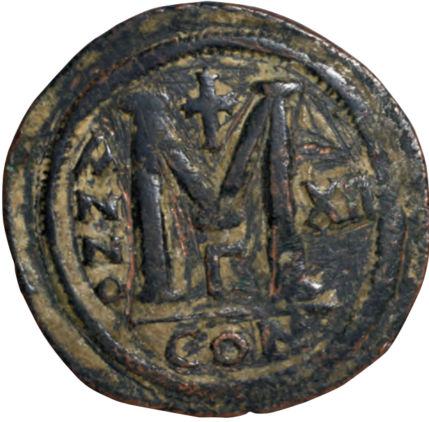
9- İmparator İustinianos adına basılan para (İstanbul Arkeoloji Müzesi, Sikkeler Bölümü)

İmparator Herakleios (610-641) döneminde İstanbul'da siyasi aktörlerin nispeten imparatorluk yönetimi etrafında birleştikleri istikrarlı bir yönetim yaşandı. İran'la yürütülen savaşlar, 626'da Avarların İstanbul kuşatması, Müslümanların fetihlere başlamaları gibi gelişmeler Bizans siyasetinde ön plana çıktı. Avarların İranlılarla ittifak hâlinde İstanbul'u kuşatmaları sırasında, başkentte halk partileri, ruhbanlar, aristokrasi ve askerî güçler birlikte savunma yaptılar. İmparatorluk yönetiminin gerçekleştirdiği askerî ve idari reformlar halk tarafından memnuniyetle karşılandı. Bununla birlikte İmparator Herakleios'un özel hayatı özellikle ruhban sınıfı ve halk arasında eleştirilere uğradı ve öfkeyle karşılandı. İmparator, ilk eşi Eudokia ölünce yeğeni Martina ile evlendi. Geleneklere, sivil ve kilise kanunlarına aykırı olan bu evlilik gayriahlaki olduğundan halkın da tepkisiyle karşılandı. Bu tepkileri umursamayan ve özellikle 641'de imparatorun ölümünden sonraki siyasi gelişmelerde rol oynayan İmparatoriçe Martina, İstanbul'un Bizans tarihinde en çok nefret edilen kişilerinden biri oldu.