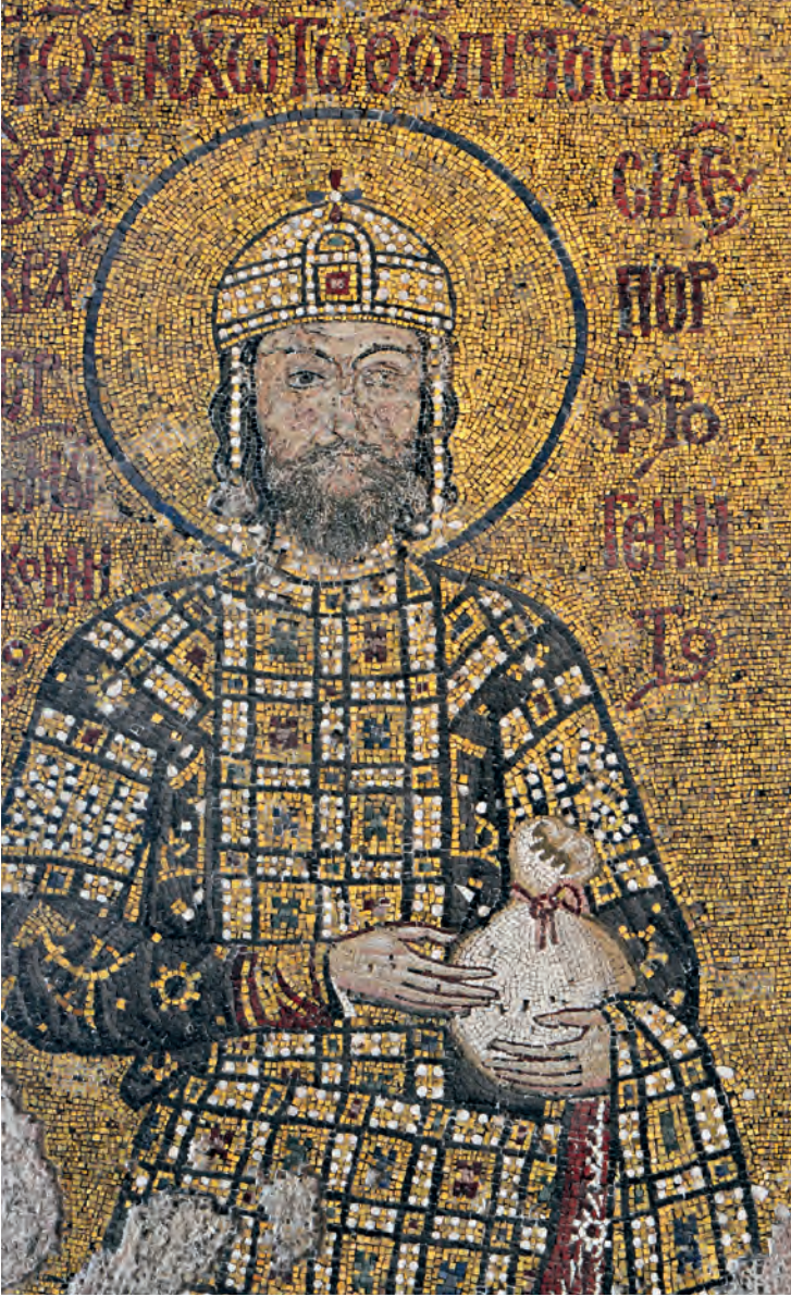
16- Ioannes Komnenos (Ayasofya)

Latin tehdidinden korumak. Maddi ve manevi tüm imkânlar buna harcandı. Fakat Papalık liderliğindeki güçlü Latin tehdidi ciddiyetini hissettirince Mikhael Palaiologos yönetiminde Bizans, Batılılarla kiliseleri birleştirmeyi ve papalığın manevi üstünlüğünü tanımayı müzakereye açtılar. Katolik inancı kabul etmek ve Papa'ya bağlanmak fikri ise Bizans ahalisini dehşete düşürüyordu. İmparatorun bu müzakereleri başlatması bile Latin korkusunun iliklere kadar işlediği ve Ortodoks inancın kalbi sayılan İstanbul'da büyük endişe ve tepkiye neden oluyordu. 1274'te İmparator VIII. Mikhael çaresizlikten unionu kabul edip Katolik olarak vaftiz olunca Bizans ülkesinin genelinde olduğu gibi İstanbul halkı da bunu büyük bir infialle karşıladı. Kendi Ortodoksluğuna sıkıca