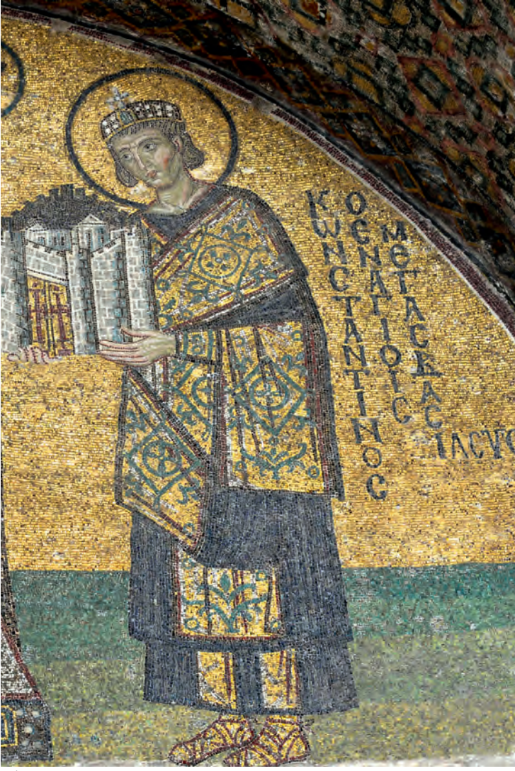
1- İmparator Konstantinos (Ayasofya)

Bizans İstanbul’unda siyasetin gündemi birkaç önemli ana konu etrafında belirleniyordu. Bunlardan biri din olmuştur. Hristiyan inancına ilişkin tartışmalar, alınan kararlar ve bu kararların uygulanmasında başta İstanbul halkı olmak üzere Bizans’ın bütün kurum ve kuruluşları son derece hassastı. Hristiyanlığın serbest bırakılması ve imparatorluğun Hristiyanlaşmasında belirleyici olan I. Konstantinos zamanında ünlü din âlimi Eusebios, Bizans iktidarının başında bulunan imparatorun konumunu şöyle ifade ediyordu: “İmparator bir çoban ve bir baba olarak insanlığı yönettiği kadar, yeryüzünde çobanlık yaptığı toplumun karşısında Tanrı’nın biricik temsilcisidir. Bu hâliyle imparator, Tanrı’nın öteki dünyada oynadığı role bu dünyada sahiptir.” 3 Tanrı’nın tek temsilcisi olan imparator kiliseyi vesayeti altında bulundurmaktadır. Siyasetin bir diğer önemli aktörü olan kilisenin başı patriği, imparator atamaktadır. İmparator