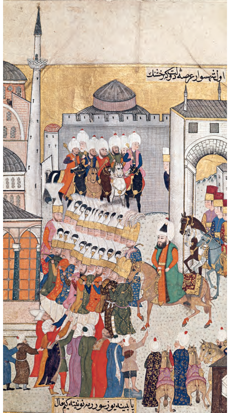
1- III. Murad, Topkapı Sarayı'ndan Ayasofya Camii'ne Cuma namazına giderken (Nâdirî Divânî)

XVIII. yüzyıl sonlarından itibaren bu camilerin dışında Karaköy'den başlayarak sahil boyunca başta Tophane, Kılıç Ali Paşa, Nusretiye, Fındıklı Molla Çelebi, Dolmabahçe, Beşiktaş Sinan Paşa, Ortaköy Mecidiye,