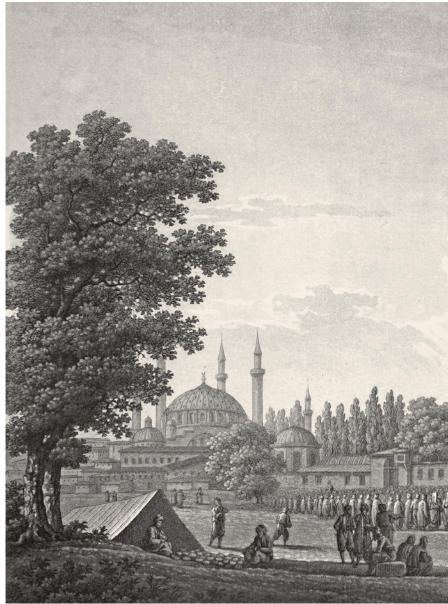
3- III. Selim’in Sultanahmet Camii’nden dönüşü (Pertusier)

XVII. yüzyıl müelliflerinden Koçi Bey’in Sultan İbrahim’e sunduğu risalesinde bu konuda açık ifadeler yer almaktadır. Burada halkın verdiği arzuhâllerin toplanması için kapıcılar kethüdasına padişahın emir vermesi, saraya döndükten sonra bunları birer birer okuması, sonra veziriazama yollayarak ona hitaben arzuhâl sunanları