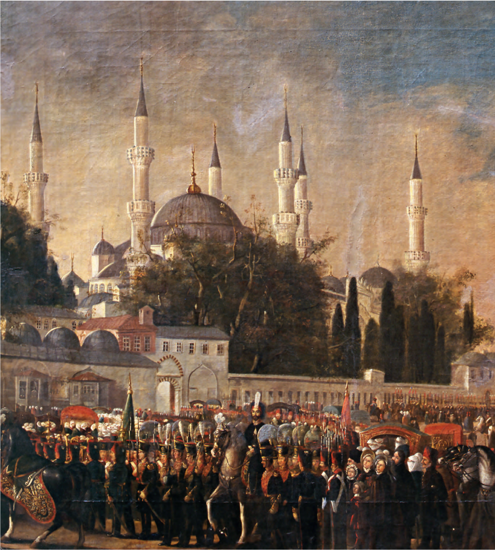
4- Sultan Abdülmecid'in Sultanahmet'teki selâmlık alayı (1840) (Speranza Fecir, İRSM, nr. 57)