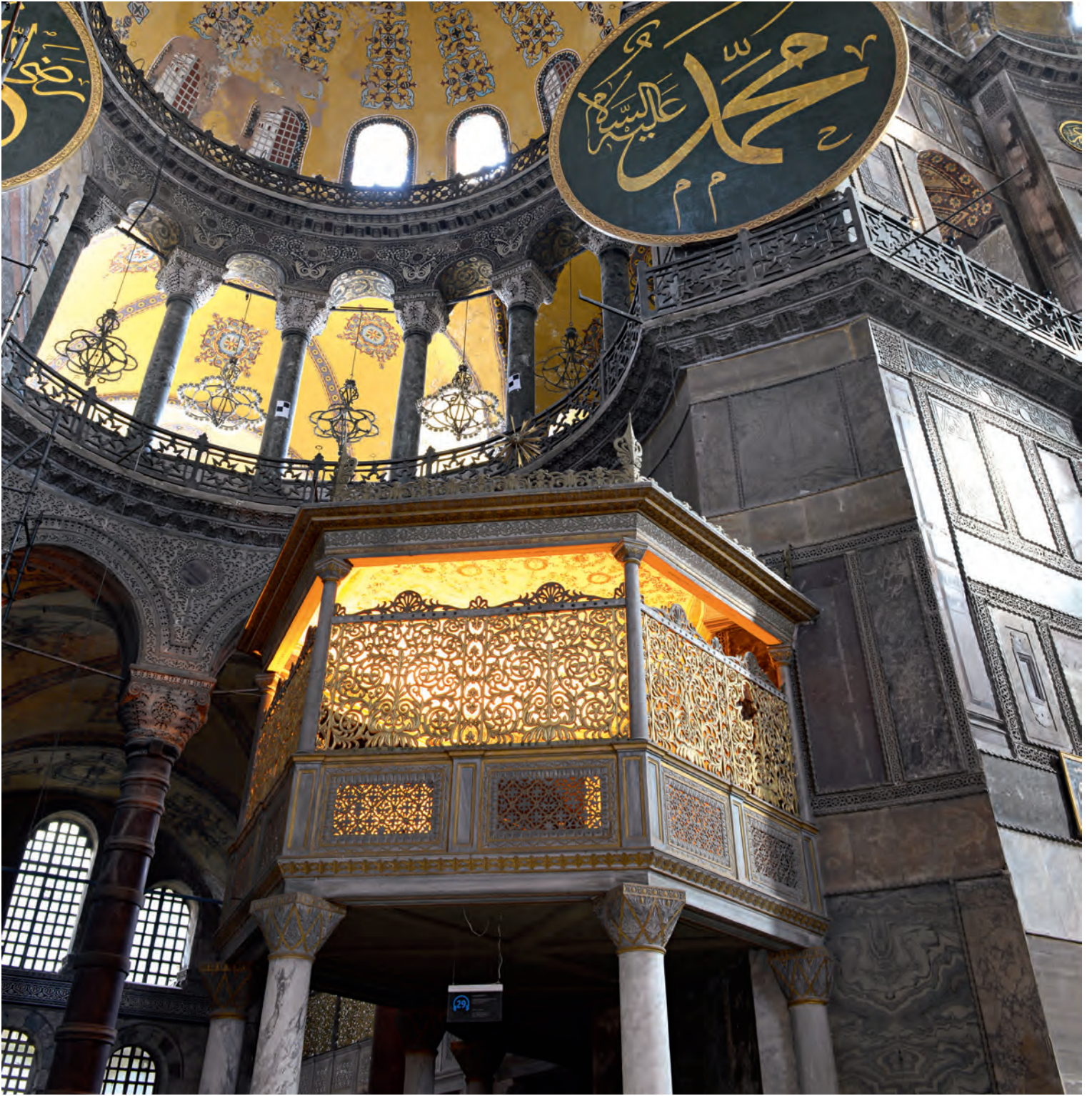
2- Osmanlı sultanlarının Ayasofya Camii'nde namazlarını kıldıkları hünkâr mahfili

Padişahların cuma günü saraydan çıkıp tekrar saraya dönünceye kadar gerek yol boyunca gerekse uğradıkları yerlerde oldukça ilgi çekici merasimler ve hadiseler cereyan ederdi. Teşrifat mecmualarında bu merasimler ayrıntılı olarak kaydedilirken Osmanlı kroniklerinde de meydana gelen olaylar hakkında bilgi verilmektedir.