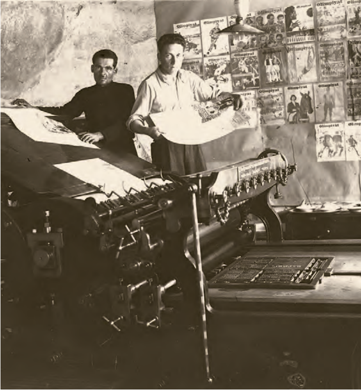
3- Gazete ve dergi baskısı