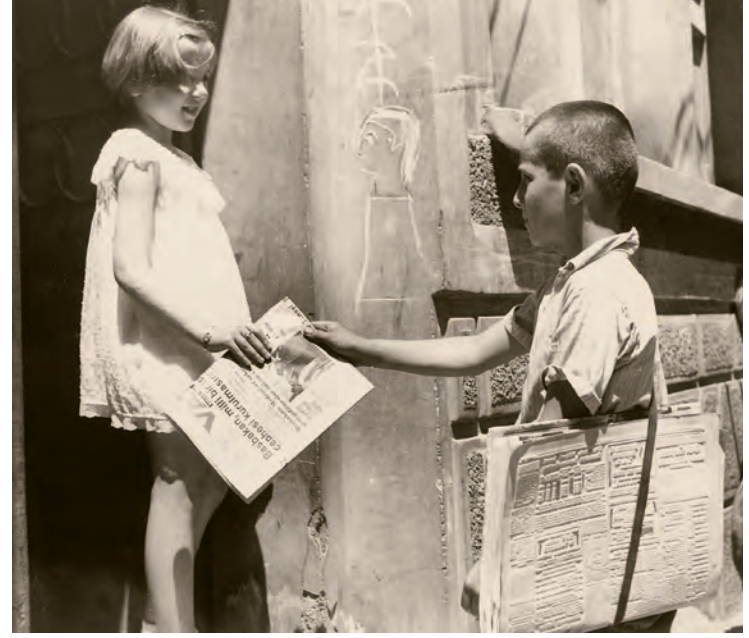
2- Gazete dağıtıcısı ve evin gazetesini teslim alan çocuk

1930 yılında Büyük İktisadi Buhran'ın etkileri Türkiye'de de görülmeye başlayınca Mustafa Kemal yeni bir denemeye girmeye karar verdi ve yakın arkadaşı Fethi Okyar'a Serbest Cumhuriyet Fırkası'nı kurdurdu. Bu olay İstanbul basınında bir çalkalanmaya neden oldu. Aynı yıl dört tecrübeli gazeteci; Zekeriya Sertel, Selim Ragıp Emeç, Ekrem Uşaklıgil ve Halil Lütfi Dördüncü Son Posta gazetesini çıkardılar. Son Posta hemen Serbest Fırka'nın yanında yer aldı ama tenkitleri temkinliydi. Asıl büyük muhalefet ise deneyimli gazetecilerden Arif