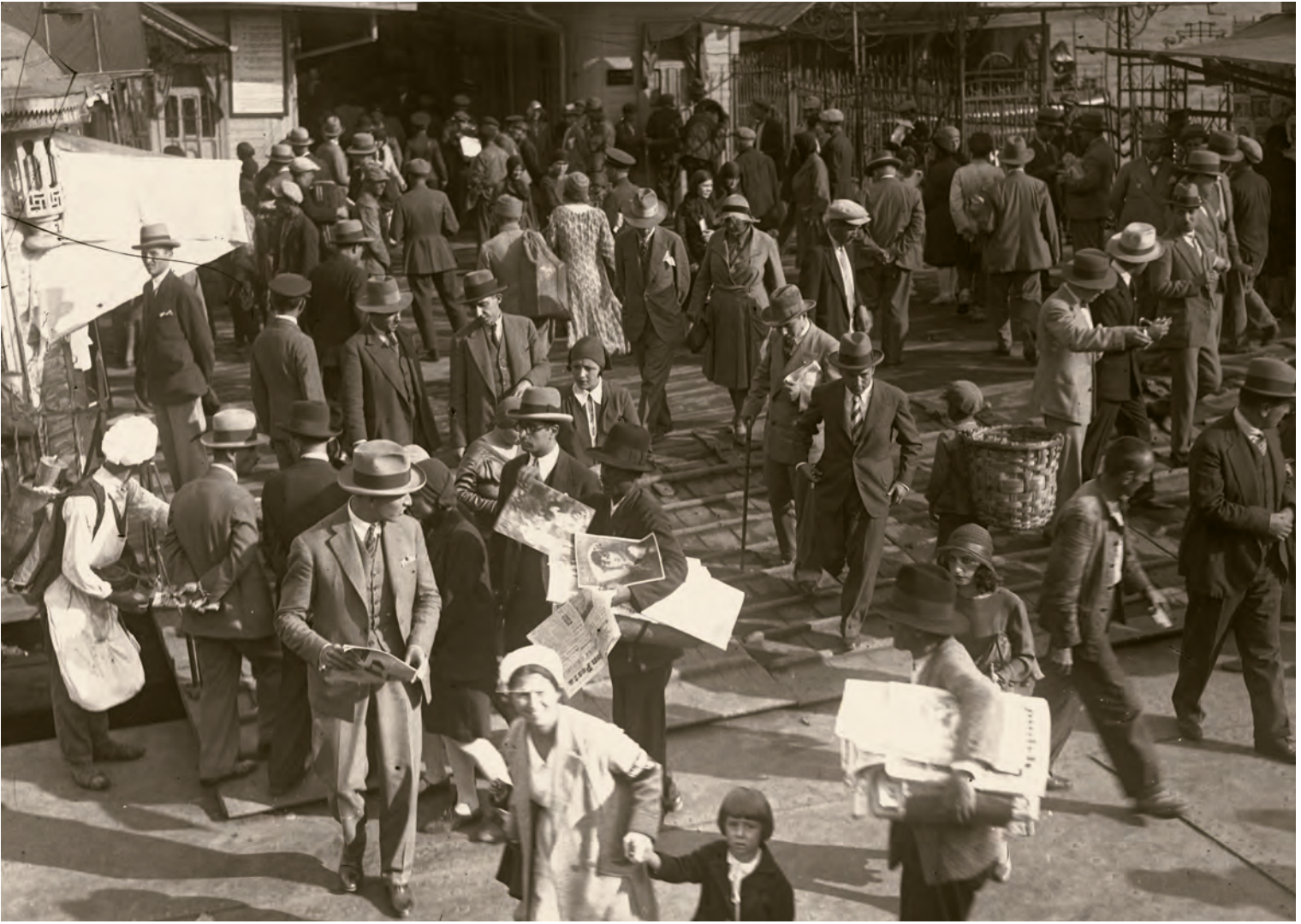
4- Seyyar gazete satıcısı ve gazete alan İstanbullular

Nedim Tör, Fikret Adil, Ömer Sami Çoşar, Abdülhak Şinasi Hisar ve hatta Falih Rıfkı Atay'ı kadrosuna alan gazete, daha sonraki dönemlerin usta gazetecileri olacak Bedii Faik, Tarık Buğra ve İlhan Selçuk'un ilk kez çalıştıkları yayın olacaktı. Gazetenin sahibi Habip Edip Törehan başmakale yazmayı kendi üstlenmişti. Bu biraz aristokrat görünümlü girişim daha sonraları pek başarılı olamayacak ve çok sık el değiştiren bir gazeteye dönüşecekti.