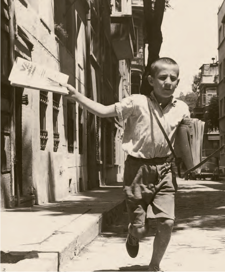
1- Cumhuriyet döneminde İstanbul sokaklarında gazete satan bir çocuk (İBB, Kültür A.Ş.)

düşmesiydi. Mesela tirajı 11.500 olan Cumhuriyet ancak 5.700 satabiliyordu. Milliyet 10.000 tirajdan 5.250 satışı, Vakit 7.000 tirajdan 2.700 satışı, Son Saat 6.000 tirajdan 1.500'e, Akşam 4.000 tirajdan 1.300 satışı düştü. En acıklısı ise Ahmed Cevdet Bey'in 1894'ten beri -otuz dört yıldır- yayınlanan gazetesi İkdam 'ın başına geldi; 8.000 tirajdan 3.100 satışı düşünce 1928'in Aralık ayında sahibi satmaya karar verdi ve bir süre gazetede çalışmış olan Ali Naci Karacan İkdam 'ı aldı ama gazete bir yıl sonra kapandı. Karacan, 1939 yılında İkdam 'ı yeniden yayınlamak ama gene başarılı olamayacaktır.