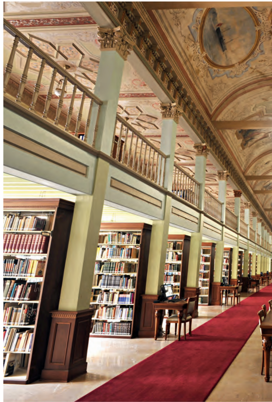
5 IRCICA Kütüphanesi

kitaba ve 9.000 cilt dergiye sahiptir. Koleksiyonuna http://www.nit-istanbul.org/nitlibrarytr.htm adresinden ulaşılmaktadır.