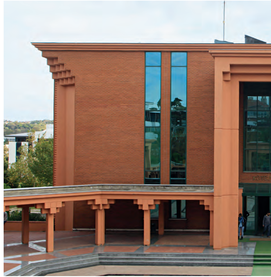
6 İSAM Kütüphanesi

30) Köprülü Kütüphanesi : Yukarıda değinildiği üzere ünlü Köprülü ailesi tarafından 1661'de kurulan kütüphane, Arapça-Farsça ve Türkçe yazma eserlerden