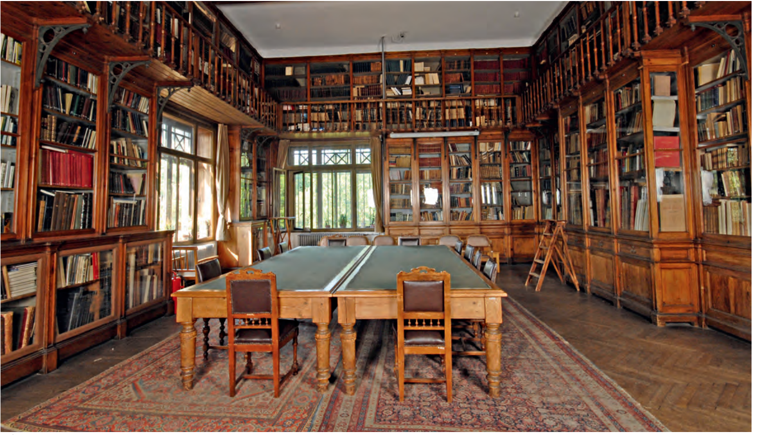
8 İstanbul Arkeoloji Müzesi Kütüphanesi

odaklı bir kütüphane ile arşiv malzemesini bir araya getiren SALT Araştırma, mekânsal düzenleme ve adıyla kütüphane kavramının dönüşümüne örnek teşkil etmektedir.