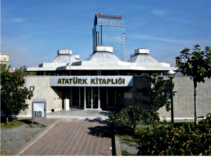
2 İBB Atatürk Kitaplığı

sanat kurumları ile ilçe belediyelerinin açtığı kültür merkezlerinde kütüphane kurulması dikkat çeken bir husustur. 10 Ayrıca, İstanbul'da üniversite sayısının artışıyla beraber, üniversite kütüphanelerinin sayısındaki artışı da belirtmek gerekir. 11