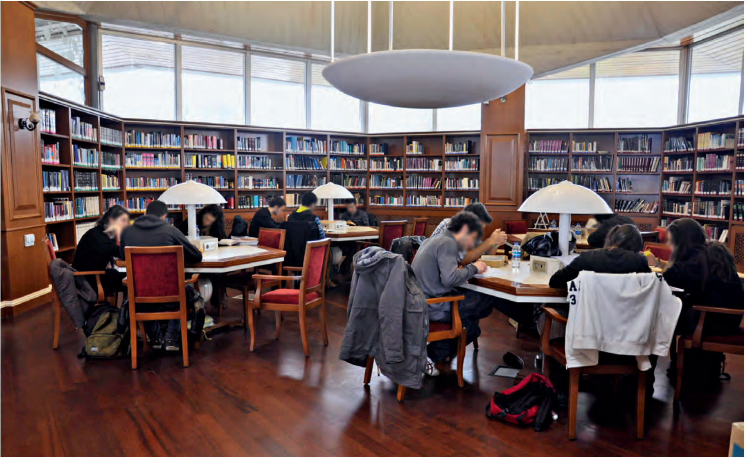
3 İBB Atatürk Kitaplığı

web sayfasında istenilen bilgiye ulaşmak kolay olduğu için kütüphanenin adı, kuruluş yılı, bulunduğu yer, koleksiyonundaki temel konular ile web sayfasının adresinin verilmesinin yeterli olacağı düşünülmüştür.