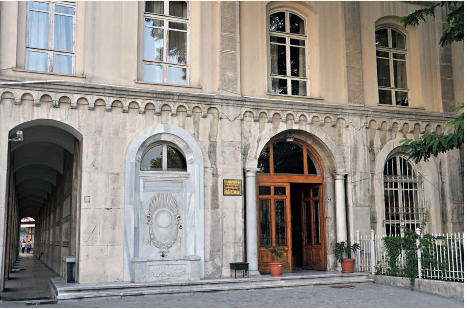
4 Beyazıt Devlet Kütüphanesi

150 VHS, 100 DVD'ye http://www.borusansanat.com/_MuzikKutuphanesi/Kutuphane_Tanitim.aspx adresinden ulaşılmaktadır.