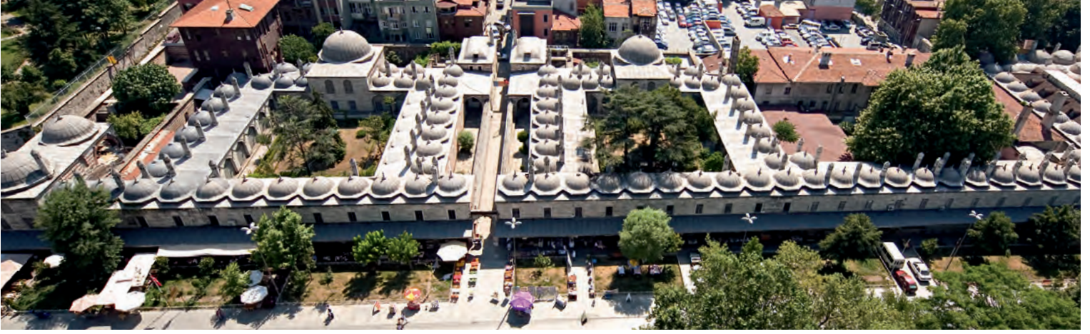
1 Süleymaniye Kütüphanesi