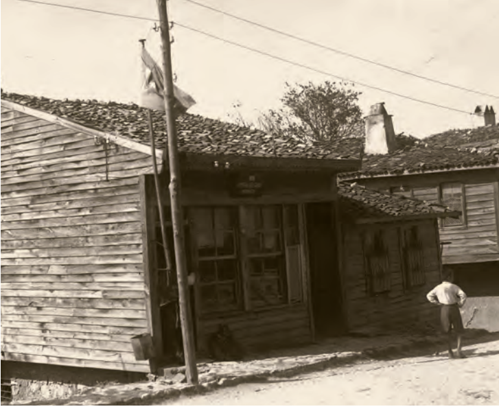
5- Cumhuriyet döneminde İstanbul'da mahalli bir posta ve telgraf merkezi

Bey, bunu, savaştan dolayı makine, levazım ve tel bulmakta yaşanan güçlüklerle bağlamaktaydı. O dönemde İstanbul'un 15 bölgesinde bulunan santrallerden saatte en fazla 2.750 görüşme yapılabilmekteydi. Savaş, telefona olan ihtiyacı daha da artırdığı için bütün alet, edevat, para ve personel eksliğine rağmen abone sayısı 5.000'i geçti. Ancak, Dersaadet Telefon Şirketi bu abonelere kaliteli hizmet verememekte ve gün geçtikçe daha büyük aksaklıklar yaşanmaktaydı. Birkaç yıl öncesine kadar Avrupa'daki benzerlerini aratmayacak derecede düzgün işleyen telefon sisteminden şikâyetler giderek arttı. 19