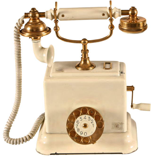
4- Telefon (İstanbul PTT Müzesi)

genelinde 37.705 faks aboneliği vardı. Ancak 1997 yılından sonra Türkiye genelinde faks aboneliği oranları düşmeye başladı. İstanbul'da ise Türkiye rakamlarının tersine az da olsa bir artışın olduğu gözlenmektedir.