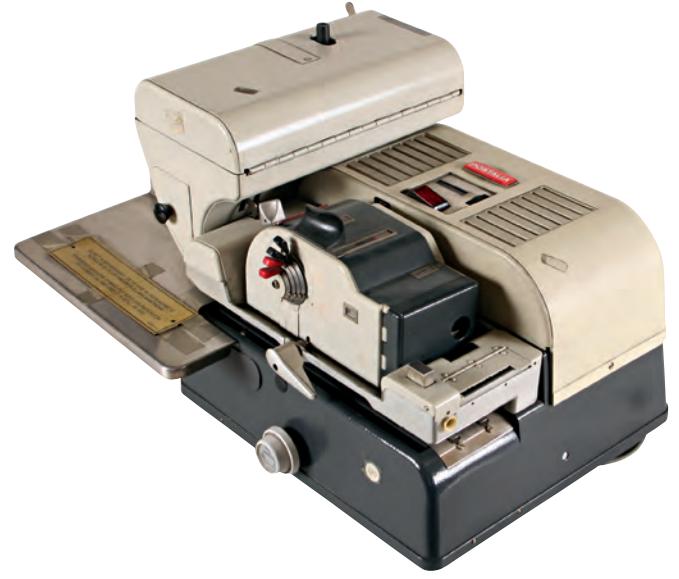
2- PTT'de 1952'de kullanılmaya başlanan ücret alma makinası (İstanbul PTT Müzesi)

Merkezi arkasındaki binaya taşındı. Türkiye'nin yurt dışıyla doğrudan posta alıp veren üç merkezinden biri olan İstanbul Paket Postanesi, bütün Türkiye'den İstanbul teslimli ve İstanbul merkezinden taşra varışlı dâhilî koli trafiğinin uğrak yeridir. Türkiye çapında koli trafiğinin üçte biri burada işlem görmektedir. 15 1980'de Türkiye'ye gelen kolilerin %22,3'ü İstanbul'a geldiği için özel nakliye ve kargo şirketlerinin en yoğun çalıştıkları il de doğal olarak İstanbul'du. 2001 yılı itibariyle İstanbul Ticaret Odası'na kayıtlı kargo ve nakliye işi yapan şirketlerin sayısı 3.719'dur.