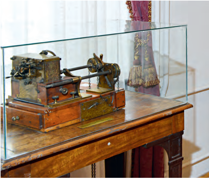
3- Telgraf makinaları (İstanbul PTT Müzesi)

milletlerarası telgraf çekilebilmekteydi. 17 Telgraf 1980'lerin sonuna kadar en hızlı yazılı haberleşme aracı olmayı sürdürdü.