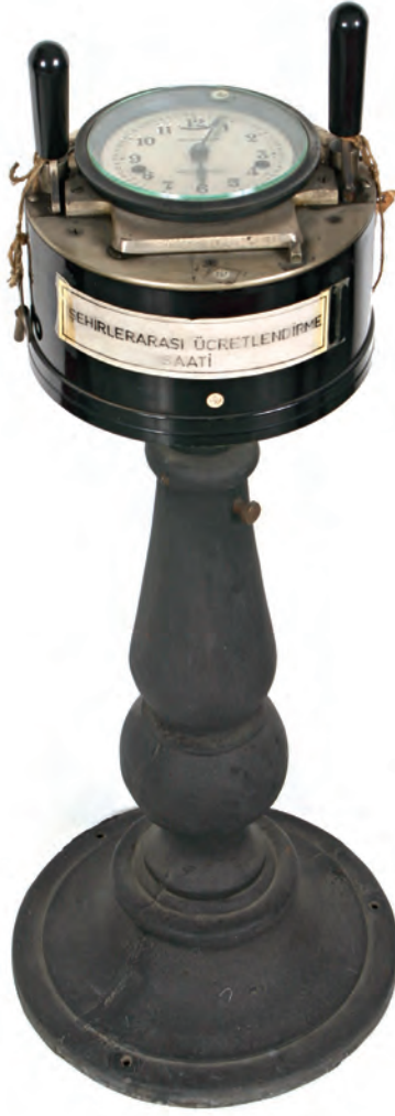
10- Şehirlerarası telefon görüşmelerini ücretlendirme saati (İstanbul PTT Müzesi)

Başmüdürlüğü'nün 7.055 personeli vardı; şehir içi kablolu şebeke kapasitesi 631.179 ve otomatik telefon santral kapasitesi de 388.000 idi. Ücretli telefon abone sayısı 335.840 ve ücretsiz abone sayısı ise 1.498 olup 575.949 kişi telefon almak için sırada beklemekteydi. İstanbul'un değişik yerlerinde de 2.187 genel telefon vardı. 25