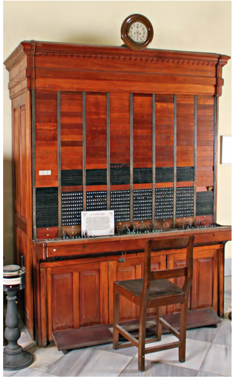
9- İstanbul PTT'sinde kullanılan telefon santrali (İstanbul PTT Müzesi)

sistem eklendi. 1948'den itibaren Tahtakale santralinin kapasitesinin 10.000, Beyoğlu'nunkinin 7.600 ve Kadıköy'ünün de 2.400 hatta çıkarılması için LMT Firması'yla anlaşarak sipariş verildi. 1948'de Ericson Şirketi'nin İstanbul santraline 13.500 hat ilave etmesi öngörüldü; ancak sadece Kadıköy'e 3.000 hatlık eklemeye yapılabildi. Bunun üzerine Kadıköy'de bulunan 2.400 hatlık santralin 1.200 hatlık kısmı Erenköy'e; daha sonra Erenköy'de 7B Rotary santralinin kurulması üzerine de 1.200 hatlık santral bu sefer Beyoğlu'na nakledildi. Ericson'un Kadıköy'e kurduğu 3.000 hat 1952'de Anadolu'ya sevk edildi ve Kadıköy'e ise 7B Rotary sisteminde toplam 37.500 hat eklendi. 1954-1959 arasında ise, Fatih'e 5.000, Bakırköy'e 1.600, Yeşilköy'e 1.300, Şişli'ye 6.800, Tahtakale'ye 4.000, Beyoğlu'na 5.000, Kadıköy'e 6.000, Büyükdada'ya 100, Heybeliada ve