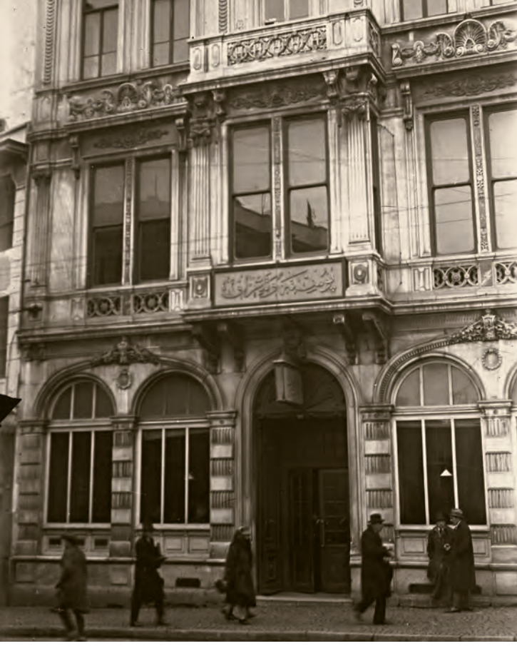
1- İstanbul'da Cumhuriyet'in ilk dönemlerinde bir Posta ve Telgraf binası

şube toplam sayısı 356'ya ve dağıtıcı sayısı da 1.100 kişiye ulaştı. İstanbul, PTT hizmetlerindeki öncelikli yerini her zaman korudu. Nitekim Acele Posta Servisi (APS), telefon, teleks, faks gibi yeni sistemler öncelikle İstanbul'da hizmete girmiştir. 13