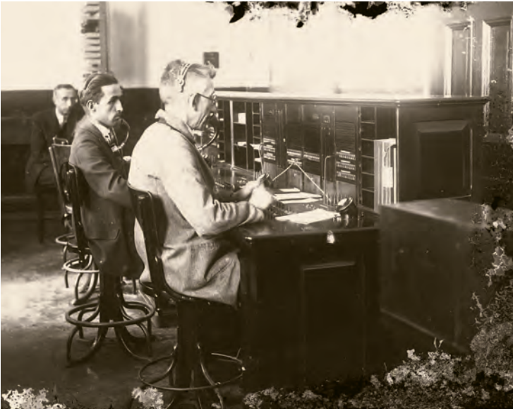
7- Telefon santralinde görüşmeler için bağlantı kuran görevliler (İBB, Kültür A.Ş.)