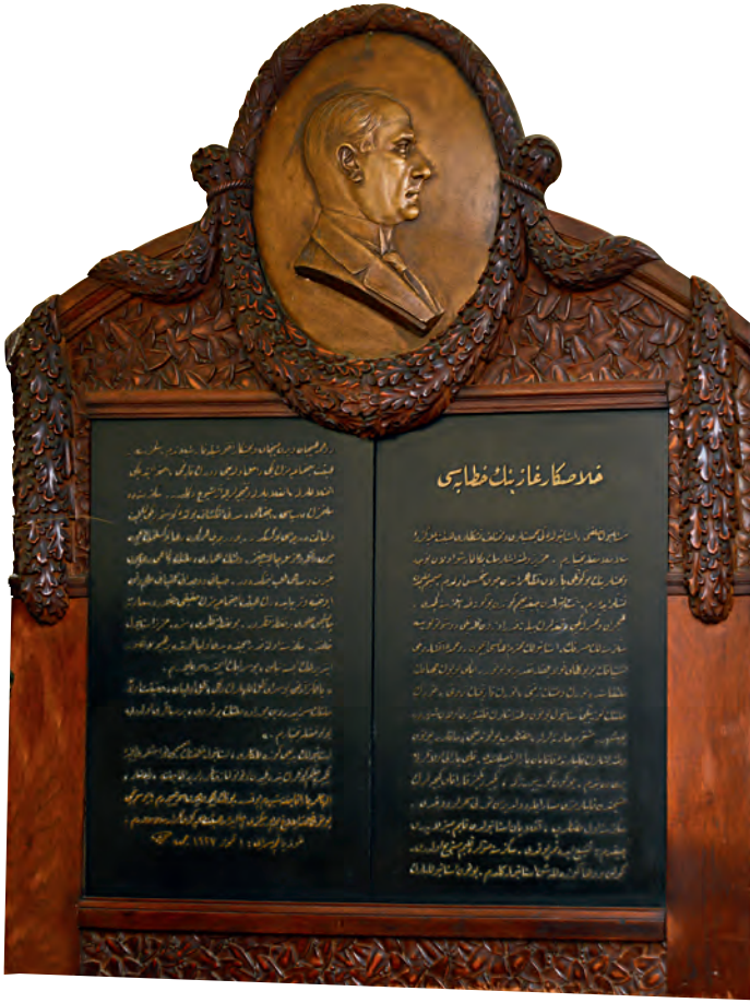
7- Atatürk'ün İstanbul'a ilk gelişindeki konuşması

Kumandanlığı, Hükûmet Konağı ve Belediye'yi ziyaret ettikten sonra Şehitlik, Bakırköy ve Baruthane'ye de uğradı. 38 Bir gün sonra yine resmî temaslarına devam eden Gazi, Cumhuriyet Halk Fırkası İstanbul merkezine ve Tayyare Cemiyeti şubesine gitti. 39 Yoğun mesaisinden fırsat bulduğunda 11 Temmuz'da akşam saatlerinde Ankara motoruyla bir deniz gezisi yaparak Kalamış'a kadar giderek, bir süre sonra saraya geldi. 14 Temmuz'da yine gün boyu çalışma odasında bulunan Gazi, akşam saatlerinde Ankara motoruyla Büyükkada'ya giderek yat kulübünü ziyaret etti ve bir süre halkın arasında vakit geçirdikten sonra aynı motorla geri döndü. İlerleyen günlerde zaman zaman yine geceleri motorla boğaza çıkmış ve bazen Yeşilköy ve Florya sahillerine kadar, bazen de tam tersi istikametle Kavak'a kadar seyahat edilmiştir.