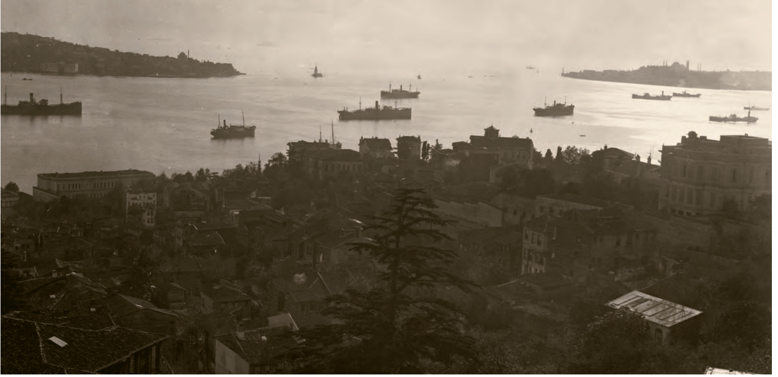
15- İstanbul Boğazi

Binası üzerinden bazı kişilerin kalabalığa ateş etmesi sonucu oluşan kargaşa kalabalığın Kazancı Yokuşu'na birikmesiyle çok sayıda vatandaş hayatını kaybetti. Ayrıca, yüzlerce vatandaş yaralandı. 3 Mayıs 1977 tarihli Milliyet gazetesine göre, ölü sayısı 36'ya çıkmıştı ve ölenlerden sadece 2 kişide kurşun izine rastlanmış, diğerleri ezilerek hayatını kaybetmişti. Olayı kimlerin düzenlediğine dair çeşitli tahmin ve yorumlar yapıldıysa da gerçek ortaya çıkarılmadı. 1 Mayıs katliamı, 12 Eylül 1980 İhtilali'ne giden süreçte siyasi terörün kazandığı ivmede zincirin ilk halkasıdır. 16 Mart 1978'de İstanbul Üniversitesi'nden çıkan öğrencilere yapılan bombalı saldırıda 5 kişi öldü, 5'i ağır 44 kişi yaralandı. Daha sonra yaralı öğrencilerden 2 kişinin daha hayatını kaybetmesiyle 16 Mart saldırısında hayatını kaybedenlerin sayısı 7 olmuştur.