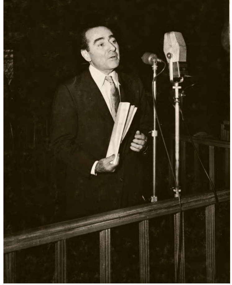
14- Başbakan Adnan Menderes ve arkadaşları Yassıada duruşmalarında savunmalarını yaparken

Kolları'nın faaliyetiyle 27 Nisan akşamından bir gün sonraki protesto için hazırlıklar yapılmaya başlanmıştı. Başbakan Adnan Menderes'in görüşlerine ehemmiyet verdiği, hükûmetin hukuk danışmanı da olan İstanbul Üniversitesi Anayasa Hukuku profesörü Ali Fuat Başgil'in anılarına göre, İstanbul Üniversitesi'ndeki olayların başlangıcı 28 Nisan 1960 tarihinde saat 10.00'da öğrencilerin hükûmeti protestolarıyla olmuştu. Hukuk Fakültesi önünde konuşma yapılmış, ders boykotu ve eylemler başlatılmıştı. Öğrencilerin nümayişlerine polis müdahalesinin yetersiz kalması üzerine, öğrencileri kontrol üzere büyük giriş kapısında bekleyen piyade birliği harekete geçmişti. Gelişmeleri endişe ve merak içinde üniversitedeki odasından izleyen Başgil, asker, subay ve öğrencilerin karşı karşıya geldiklerinde birbirlerine sarılmalarını görmüştür. Ali Fuat Başgil'e göre, bu durum önemli bir andı ve "hareketin orduya sirayet ettiği ve Menderes Hükûmeti'nin gittiğini" göstermekteydi. Ardından Rektör Prof. Dr. Sıddık Sami Onar'ın polis şefleriyle tartışması, yere düşmesi neticesinde gözlüğünün kırılması ve yaralanması olayların tırmanmasında etkili olmuştur. Bu sefer Beyazıt Meydanı'nda toplanan