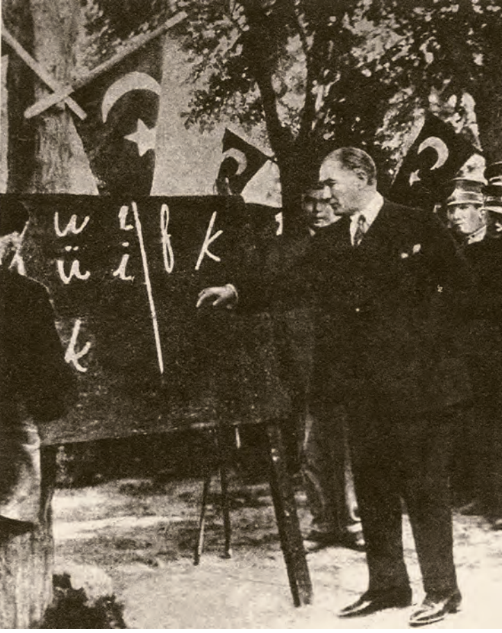
8- Atatürk'ün Gülhane Parkı'nda Harf İnkılabı'nı ilan etmesi ve ilk ders

tatbikini düşünmek” olarak ifade edildi. Dil Komisyonu çalışmalarına Haziran 1928’de başladı.