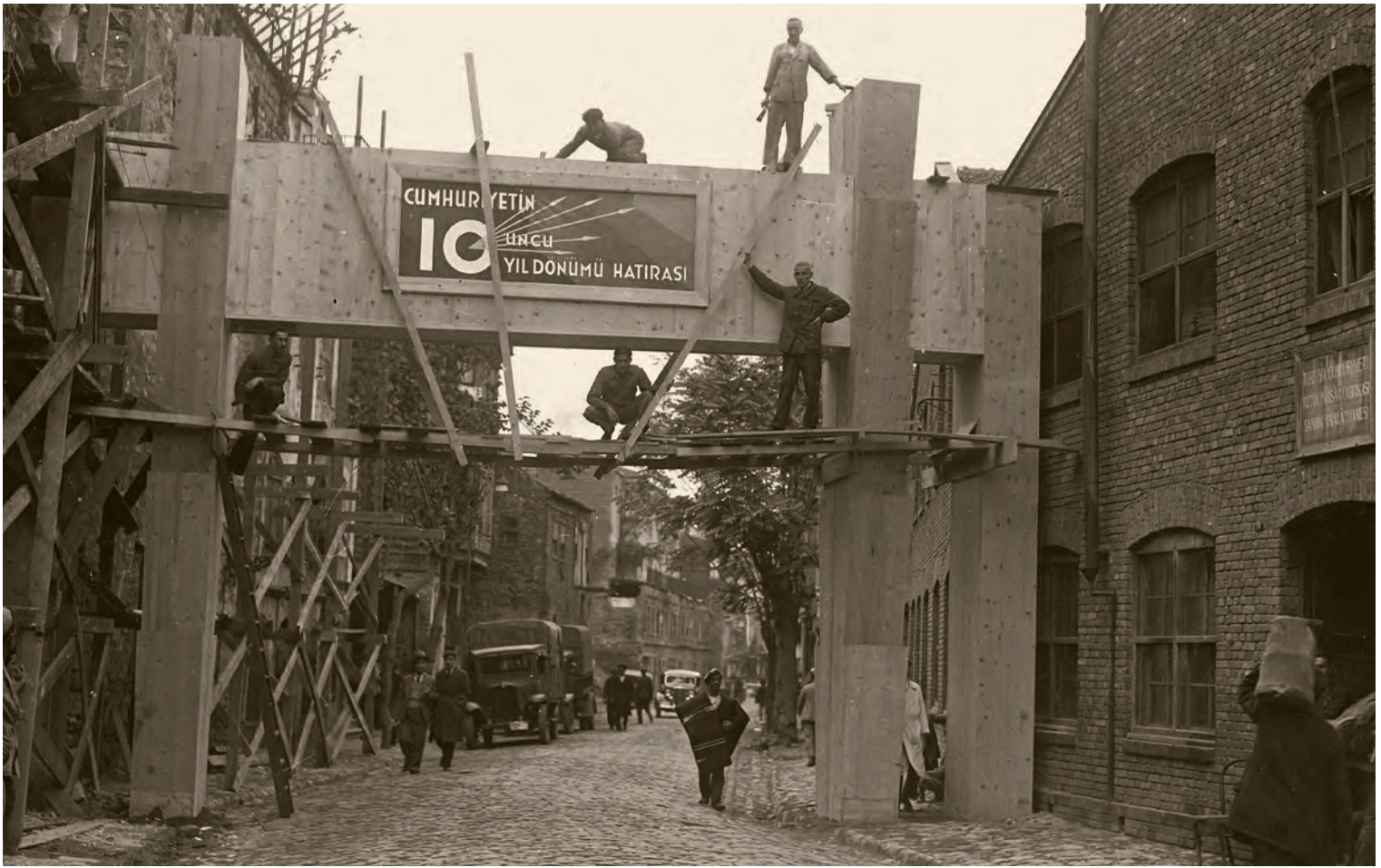
3- 1933'te İstanbul'da Cumhuriyet'in 10. yılı hazırlıkları

teslim edilecekti. Böylece, 2 Ekim 1923 Salı günü saat 10.00 itibarıyla yabancı işgalinde bulunan bir tek bina kalmamış olacaktı. 14