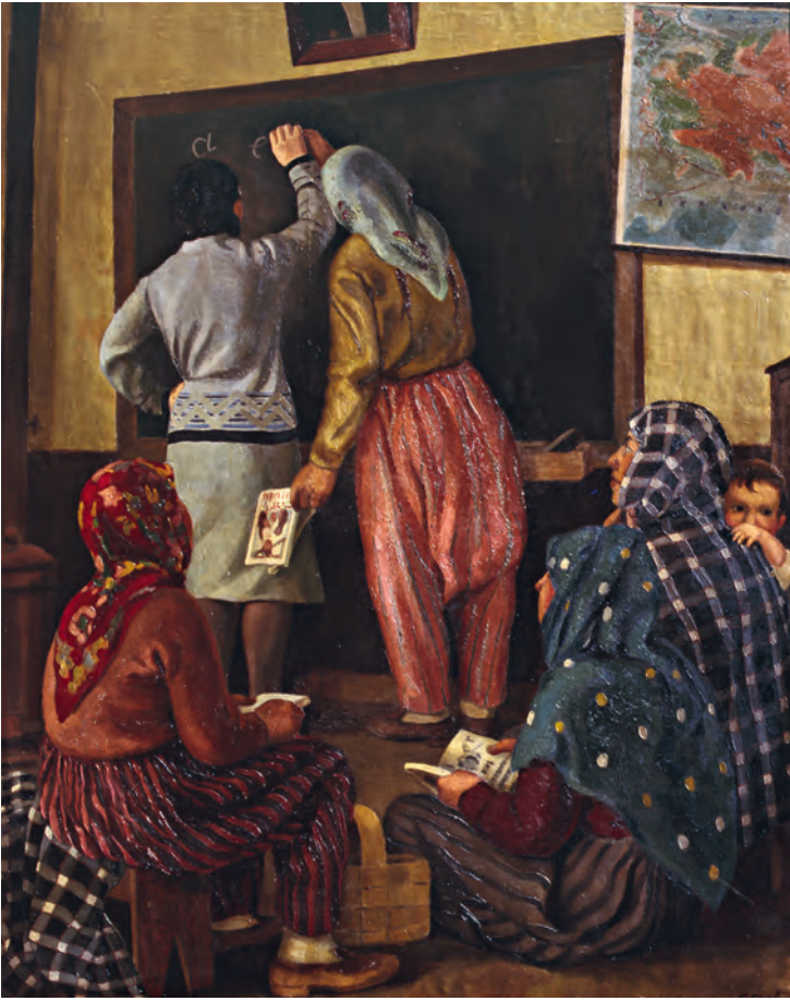
9- Latin alfabesini öğrenen kadınlar (İRHM)

80 kadar milletvekili, Dolmabahçe Sarayı'na gitmiş ve bir salonda kara tahta önünde yeni alfabe dersleri görmeye başlamışlardı. Bu durum, yabancı gazetelerde "Milletvekilleri Okula Gidiyor" şeklinde haber başlığı oldu. 25-29 Ağustos 1928 tarihleri arasında cereyan eden ve basında konferans olarak belirtilen bu toplantılar aslında bir çeşit kurultaydı. Bu kurultayın amacı, fiilen başlamış ama henüz yasalaşmamış bu inkılabın anlamını kavrayamamış olanların aydınlatılması, ikna edilmesi ve yeni yazının onaylatılmasıydı. Dolmabahçe Sarayı'ndaki kurultay için yabancı gazetelerin esprili haberleri bir bakıma gerçeği de yansıtmaktaydı. Çünkü milletvekilleri hakikaten okullu olmuşlardı. Dersler esnasında milletvekillere alfabe kitabından parçalar okutuldu, bazıları kara tahtaya çağrılarak yeni harflerle cümleler yazdırıldı. Bu dönemde Mustafa Kemal Paşa'nın her ortamda bir öğretmen gibi davranması, hem yeni yazı dersleri vermesi hem de bir nevi sınava tabi tutması ona basında Başöğretmen sıfatı verilmesine neden olmuştur. Yeni harflerin öğretilmesi için yurdun her tarafında kurslar ve yeni yazıyı geniş kitlelere yaymak için Millet Mektepleri açıldı. Gazi'nin Başöğretmenlik sıfatı resmî kayıtlarda da yer aldı. Nitekim, Millet Mektebi Teşkilatı'nın 4. maddesi şöyleydi: "Bu teşkilatın Reis-i