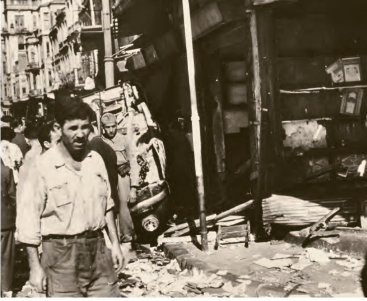
11- 6-7 Eylül 1955 olaylarında İstanbul'dan kareler