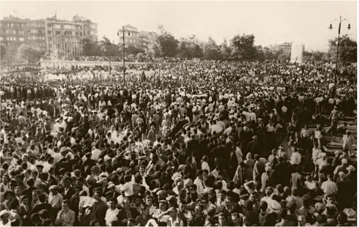
12- 27 Mayıs öncesi İstanbul'da bir nümayiş

aralarında Ermeni ve Yahudi vatandaşlara ait olanlar da bulunmaktaydı. 11 Eylül 1955'te cumhurbaşkanının himayesinde ve başbakanın fahri riyasetinde bir yardım komitesi kuruldu ve büyük bir yardım kampanyası başlatıldı. 4.433 vatandaş da toplam 69.578.744 lira zarar beyan ettiler. Yardım Komitesi, Kızılay ve 1956'da çıkartılan 6.684 sayılı kanun vasıtasıyla zararlar karşılanmaya çalışıldı.