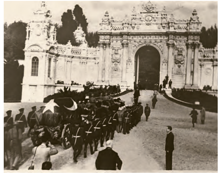
10- Atatürk'ün tabutu Dolmabahçe Sarayı Muayede Salonu'nda (üstte), Tabutun salondan ve Dolmabahçe Sarayı'ndan nakli (altta)

08.30'da cenazenin Dolmabahçe Sarayı'ndan alınması, cenaze korteji, güzergâh, Yavuz zırhlısına bindiriliş, İzmit'e varış, oradan trenle Ankara'ya hareket, karşılama, meclisten Etnografya Müzesi'ne doğru güzergâh ve kortej ayrıntılarıyla tespit edilmiş ve cenaze töreninin 21 Kasım 1938'de naaşın Etnografya Müzesi'ne nakliyle son bulması planlandı. Bayrakların 21 Kasım 1938 günü saat 24.00'e kadar yarıya indirilmiş olarak kalması kararlaştırılmıştı.