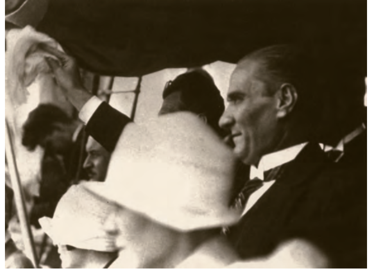
5- Mustafa Kemal Atatürk, İstanbul'a ilk gelişinde kendisini karşılayanları selamlarken

Mustafa Kemal Paşa'nın 30 Haziran 1927 Perşembe akşamı Ankara'dan ayrılması ve trenle İzmit'e hareket