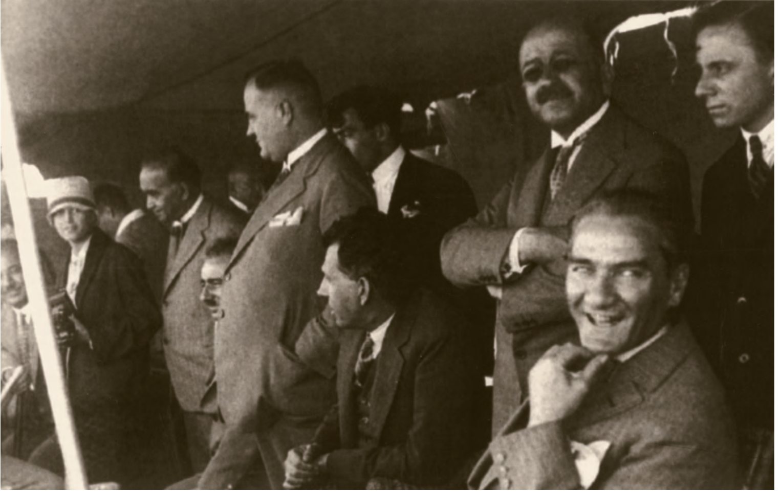
6- Mustafa Kemal Atatürk, İstanbul'a ilk ziyaretinde Söğütlü yatı ile gezintide