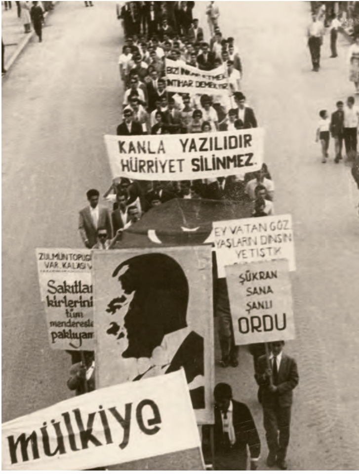
13- 27 Mayıs sonrası göstericilerden bir grup

yoluyla ticaret yapmaya başladı. Zaten 1954'ten beri düşük büyüme hızı, yüksek enflasyon süreci içine girilmişti. 1958'deki istikrar önlemleri ise aslında ekonomide alarm zillerinin çaldığı anlamına gelmekteydi.