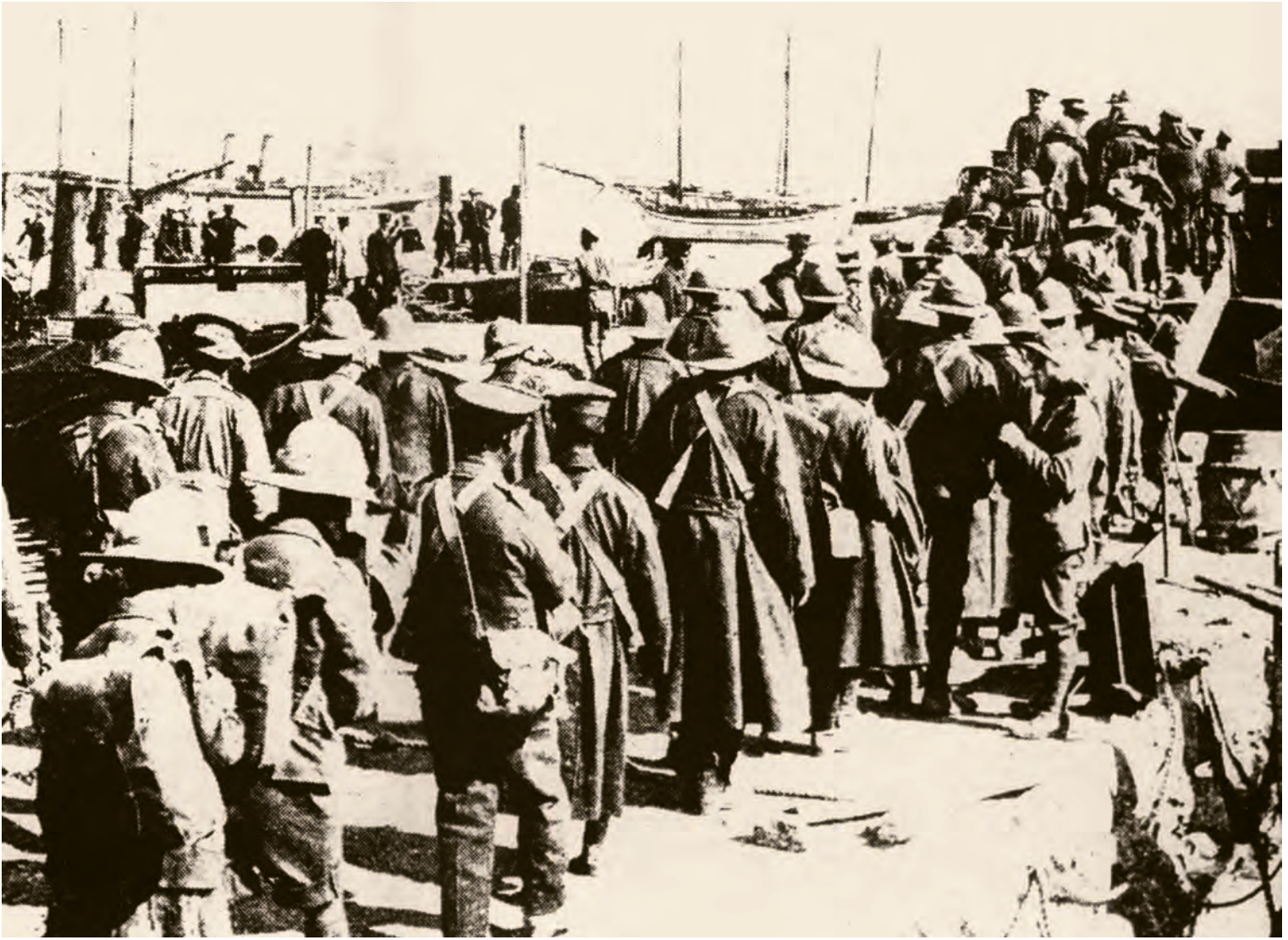
2- İstanbul işgal kuvvetleri