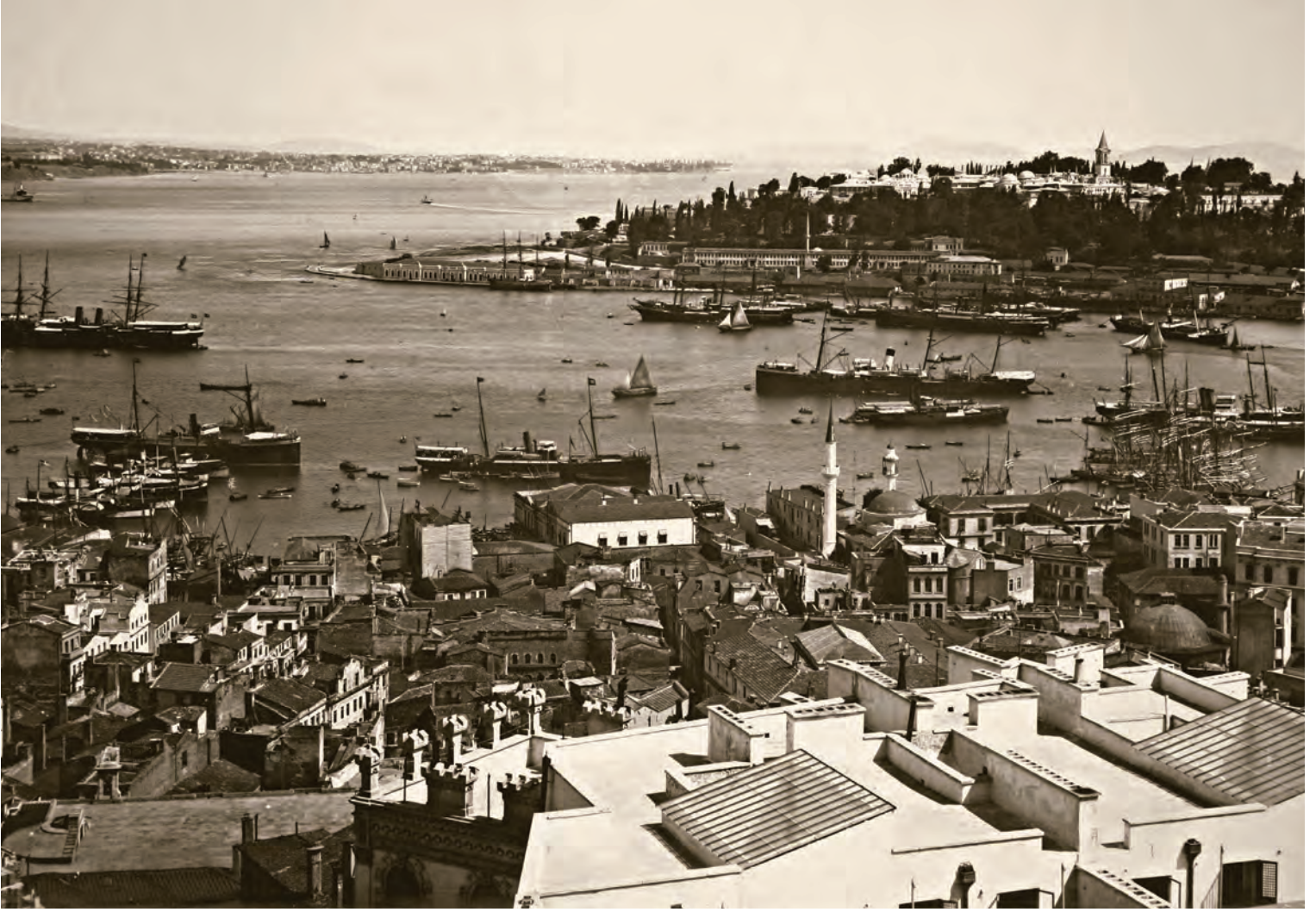
7- Galata'dan Sarayburnu ve Boğaz

yerleşim alanı itibarıyla çok daha mütevazıdırlar ve 100 hektarı pek de geçmeyen bir yerleşim alanına sahiptirler. 9