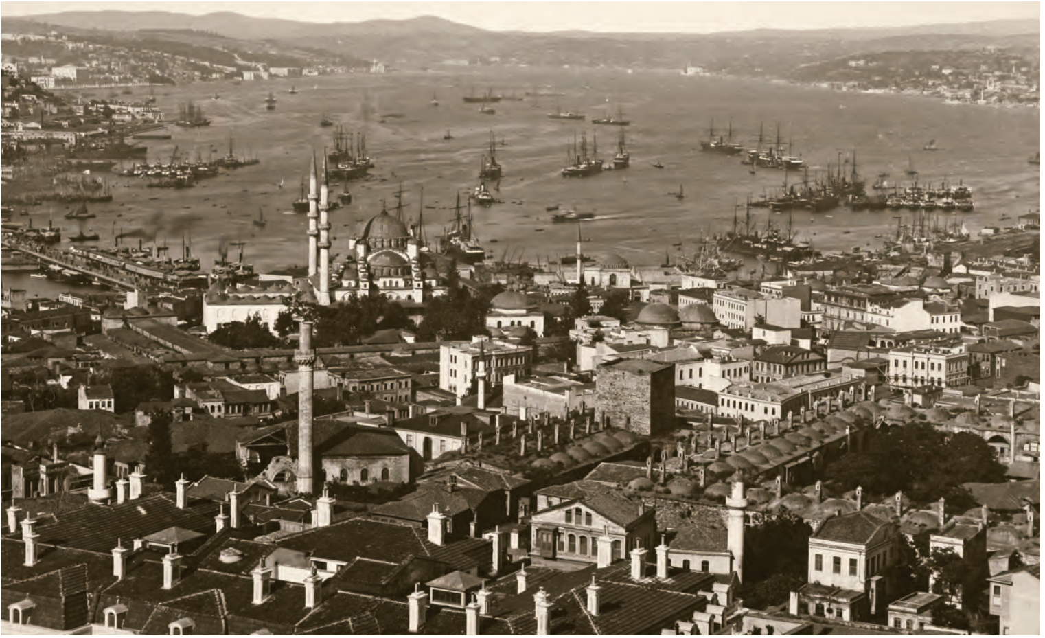
6- Yeni Cami çevresi ve Boğaz

XV. yüzyıllara kadar geri götürülebilirse de sonuçları ve şehirlere etkilerinin görülmesi açısından 1700'lü yıllar kritik eşik olarak ortaya çıkmaktadır.