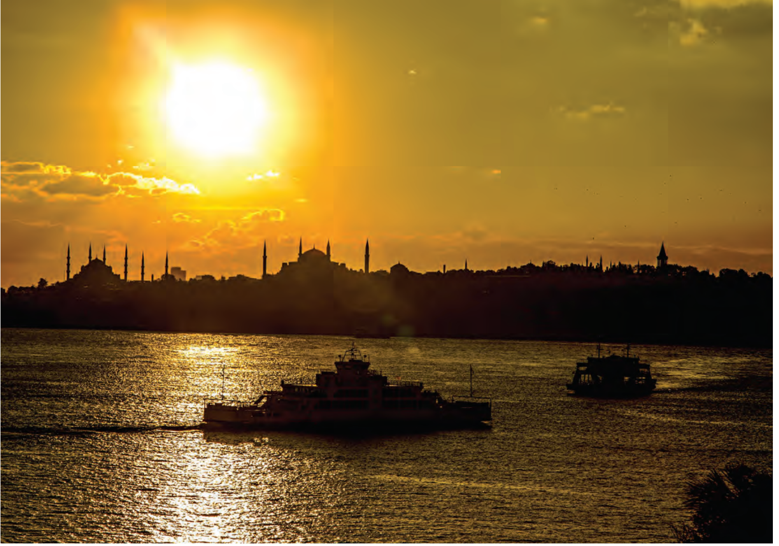
10- İstanbul: Sultanahmet Cami, Ayasofya Cami ve Topkapı Sarayı

avantajlarını ve kapasitesini ileriye taşıması için en önemli adımlardan biriydi. İstanbul zaten 1.000 yıldan fazla bir süre Bizans'ın payitahtlığını yapmıştı ve buna devam etmesi, şehrin potansiyellerinin açığa çıkması için çok önemli bir karardı. Böylece, diğer şehirlerle siyasi konumu çerçevesinde bir ağı şimdiden kurmuş olacaktı. Bunu besleyen ikinci önemli unsur, II. Mehmed ve II. Bayezid'in fetihlere devam etmeleri ve Akdeniz-Karadeniz havzalarının hâkimiyetini ve güvenliğini tamamen sağlamış olmalarıdır. Böylece İstanbul, diğer şehirler ile ticari-iktisadi bağlarını da kuracaktır. Osmanlıların fetihle birlikte hemen başlattığı şehri imar ve iskân faaliyetleri ise siyasi ve iktisadi ağları besleyerek şehre teveccühü artırmış, yani zihnî ve bedenî göç ağlarının da oluşmasını sağlamıştır. Bunlara ilaveten fetihle birlikte kazandığı dinî-kutsal algı ve sembolik değerle patriklik kadar ve ondan daha fazla hilafet merkezi olarak tüm dünyada itibar kazanması İstanbul'u diğer şehirlerden ayırmış ve birçok özelliği ile onu zamanının