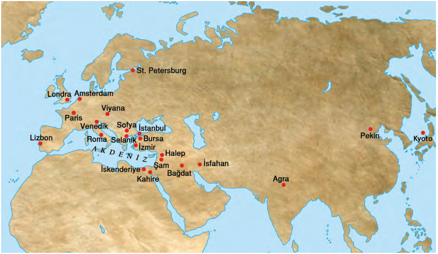
9- XVI-XVII. yüzyıl Osmanlı İstanbul'u ve dünya şehirleri (Harita: Oğuz Kallek)

bu şehirlerle kıyas edildiğinde benzer dönemlerde yani 1650'lerden 1850'lere kadar neredeyse stabil bir nüfus miktarına ya da nüfus büyüme hızına sahip oldu.