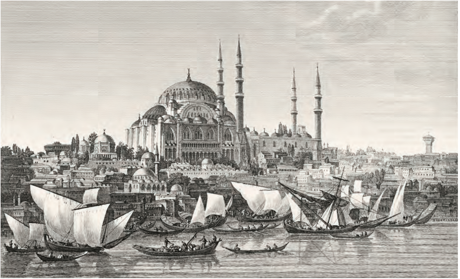
3- Süleymaniye Camii ve çevresi (Gouffier)

başkent olmuştur. Nitekim, XVI-XVII. yüzyıllarda dünyada Pax Ottomana'nın (Osmanlı Barışı) teşekkül etmesi böyle bir başkent ile mümkün hâle gelmiştir.