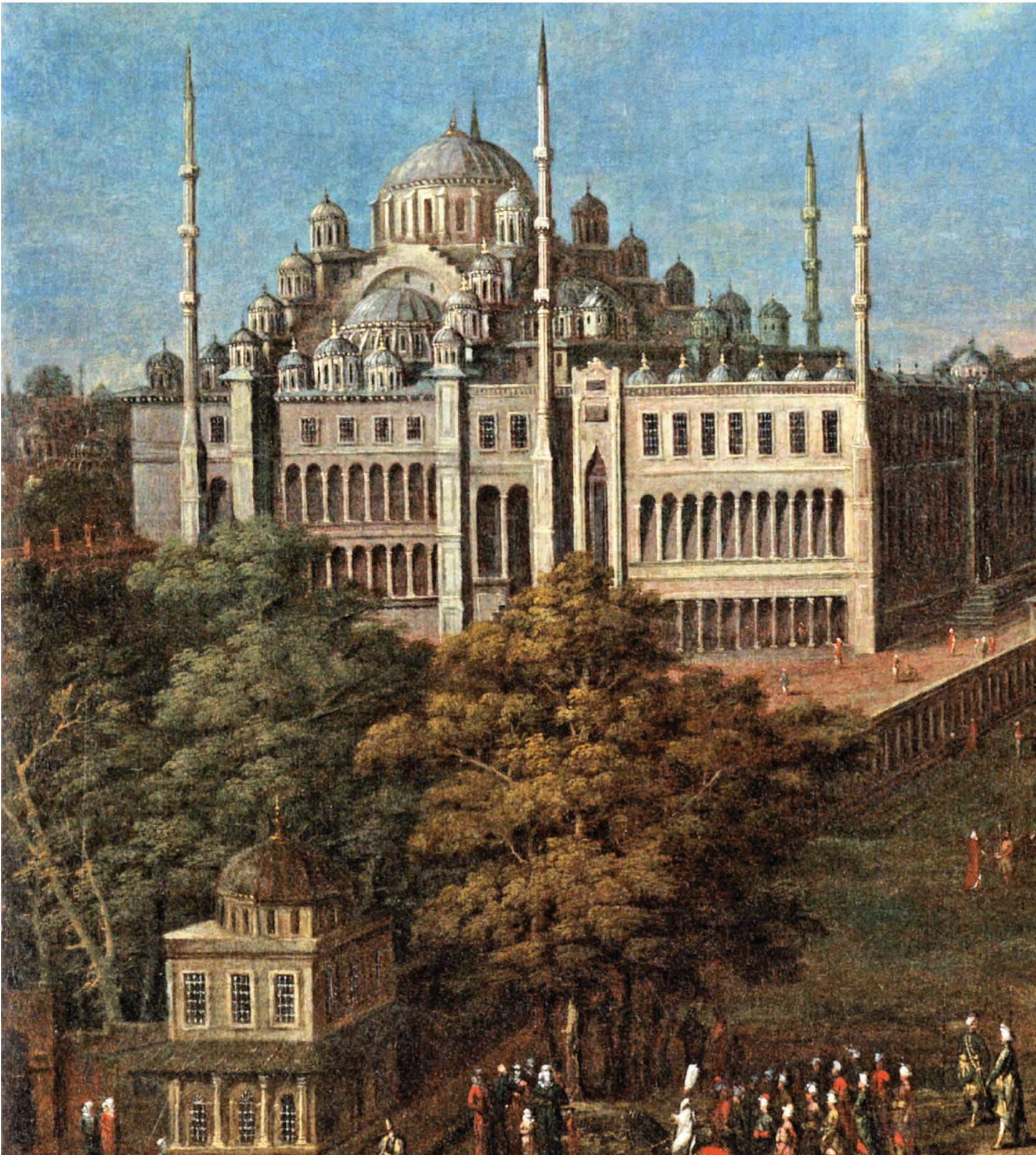
4- Sultanahmet Camii ve Meydanı (Amsterdam, Rijks Müzesi)