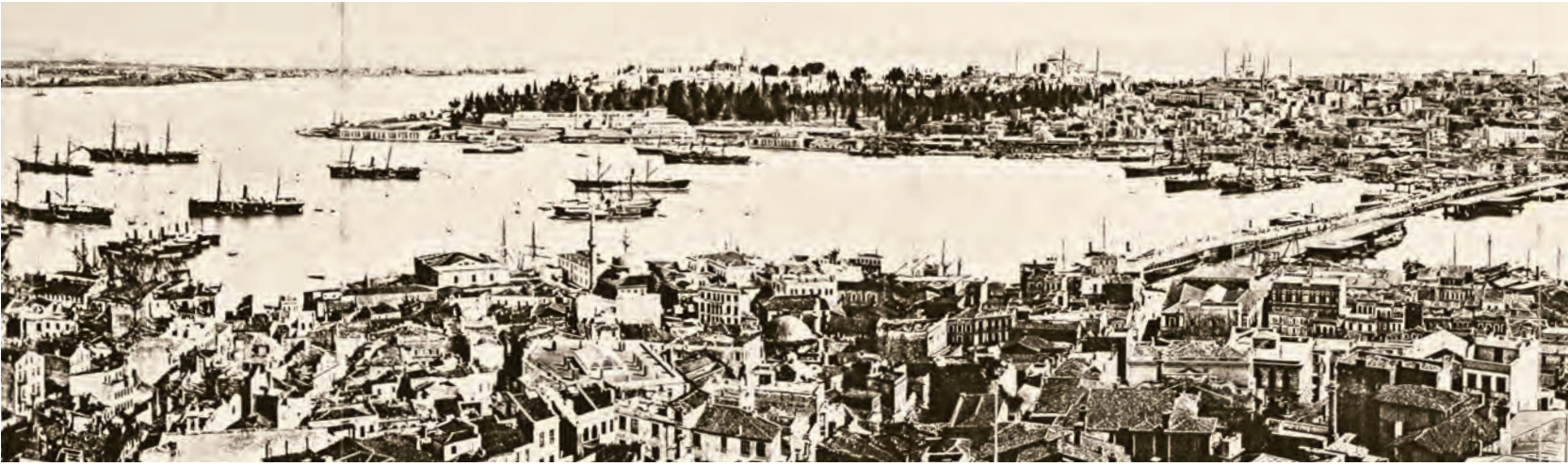
8- İstanbul panoraması: Üstte: Beyazıt'tan, eski İstanbul (Sultanahmet'ten Süleymaniye'ye), Haliç, Galata-Pera, Dolmabahçe, Üsküdar, Haydarpaşa ve Marmara Denizi

Venedik, 1600'lerde sahip olduğu 150.000 kadar nüfusu ile yine de bir ada şehir olarak tarih boyunca önemini hep muhafaza etmiştir. Jeostratejik olarak İstanbul'a çok benzeyen bu şehir, özellikle X-XV. asırlar arasında İstanbul ile ya ortak ya da rakip olarak başa baş gitmiş sonraki yüzyıllarda ise İstanbul'un birçok açıdan gerisinde kalmıştır. 1900 yılları başlarında 2.000.000'lük nüfusu ile Avrupa'nın Londra, Paris ve Berlin'den sonra en kalabalık şehri olan Viyana ise 1700'e kadar 50.000-100.000 ve 1800'e kadar da 250.000'i aşmayan nüfusu ile İstanbul'a göre oldukça küçük bir şehir olarak kalmıştır. Tuna Nehri üzerinden bulunan ve nehrin imkânlarından yararlanan, uzun bir tarihe ve kültürel öneme sahip şehir, 1800'lerde Avrupa'nın merkezi olabilmıştır.