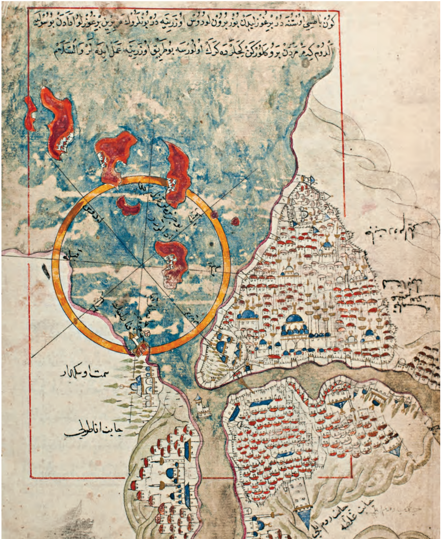
1- İstanbul (Piri Reis, Kitab-ı Bahriye)