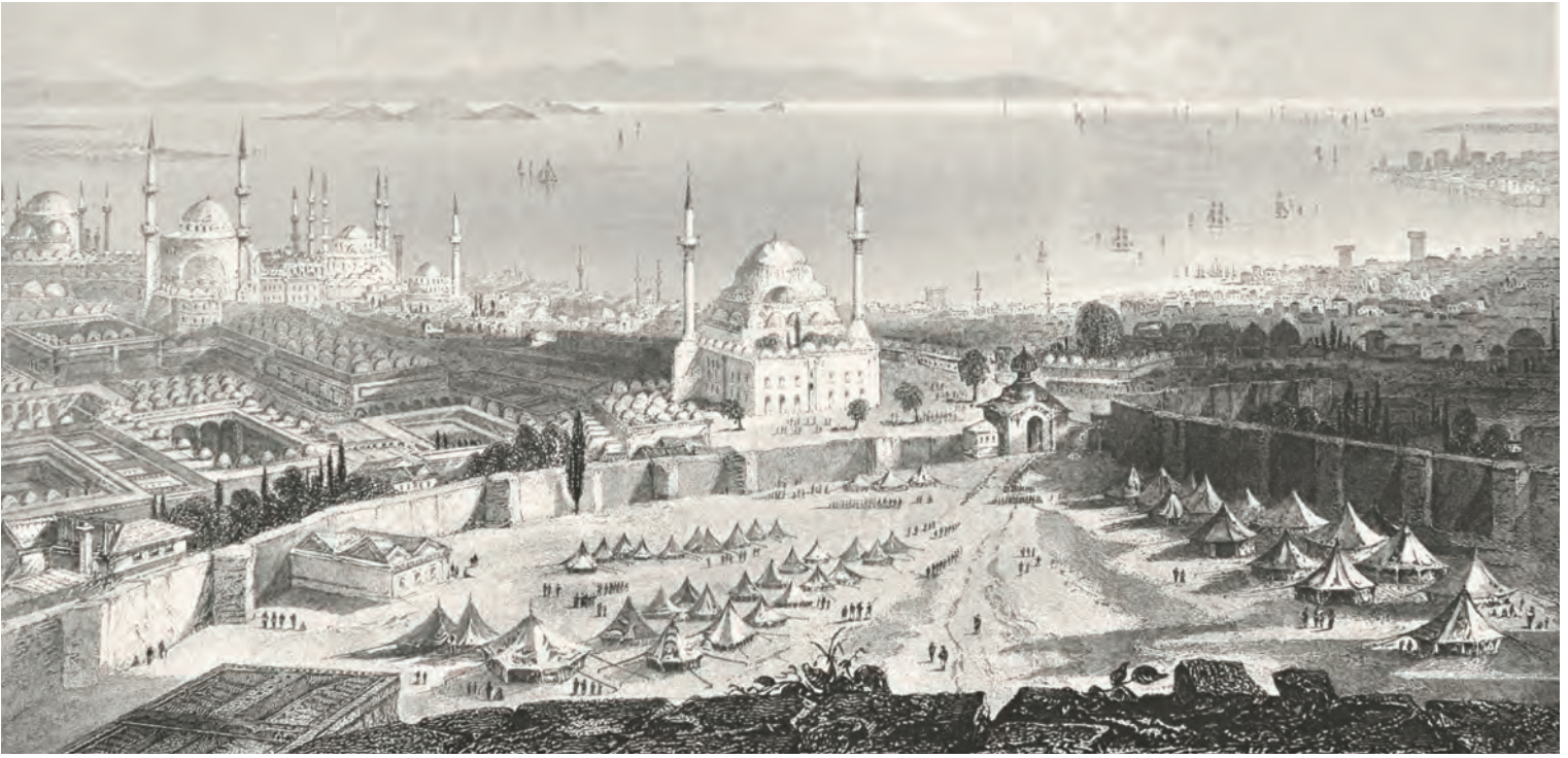
5- Beyazıt Yangın Kulesi'nden İstanbul ve Marmara (Pardeo)

ortaya konulmaya çalışıldı. Bu süreçler tespit edilirken kullanılan deliller daha çok imgesel ve tarihî kayıtlara dayandırıldı. Bir anlamda kendi iç-dış ilişkilerine bakarak şehre dünyada bir yer biçilmiş oldu. Şimdi detaylara inip bu tasavvuru biraz daha somutlaştırıp diğer şehirler çerçevesinde mukayeseli bir şekilde incelemek gerekmektedir. Mukayeseye konu olacak şehirleri belirlerken her iki dönemde İstanbul ile karşılaştırılması mümkün olan Osmanlı coğrafyasından ve diğer coğrafyalardan farklı şehirler seçildi. İnceleme ise karşılaştırılacak şehirler için ilk elden ulaşabilecek bilgiler hesap edilerek üç kriter üzerinden yapıldı. Birinci kriter şehrin topoğrafik ve yerleşim özellikleri yani coğrafi konumu, temel topoğrafik özellikleri ve iç yerleşim biçimidir. İkincisi şehirlerin demografik gelişimleri yani nüfus büyüklükleri, etnik ve dinî çeşitliliğidir ve son kriter ise şehirdeki mimari yatırımlar ve estetik değerleridir. Hemen ifade edilmelidir ki, burada verilen her türlü rakamsal bilgiler yani şehirlerin alan büyüklükleri, nüfus toplamları çeşitli kaynaklardan elde edilen tahminlerdir; kesin bilgiler değildir. Özellikle nüfus tahminleri, ilk el kaynaklardaki çok değişken bilgiler ya da ipuçları arasından en makul bir şekilde yapılmaya çalışılmıştır.