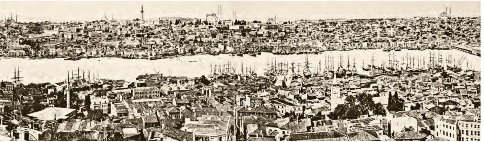
Alta: Galata'dan Haydarpaşa, Topkapı Sarayı, Ayasofya, Sultanahmet, Nuruosmaniye, Beyazıt Camii, Beyazıt Yangın Kulesi, Süleymaniye ve Fatih Camii'ne kadar Fatih semti (Diez-Glück)

Agra siyasi nüfus özelliklerini kaybederken İstanbul ise uzun başkentliğine devam edecektir. Delhi, Agra'nın ve Tahran, İsfahan'ın yerini XVIII-XIX. yüzyıllarda alarak İstanbul ile mukayese edilebilecek şehirler konumuna geçeceklerdir.