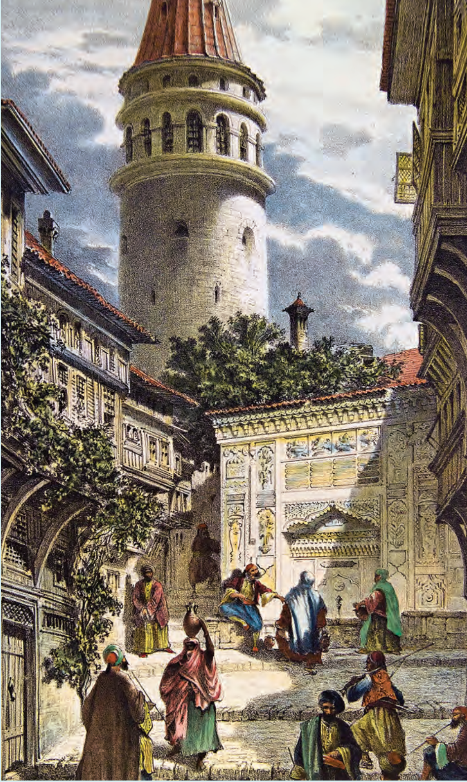
5- Galata Kulesi, çeşmesi ve sakinleri (Flandin)

soktular. 1855'te Perşembe Pazarı, Voyvoda Caddesi ve Karaköy başta olmak üzere Galata, Avrupa mallarının ve bankaların yer aldığı başlıca ticaret merkezi