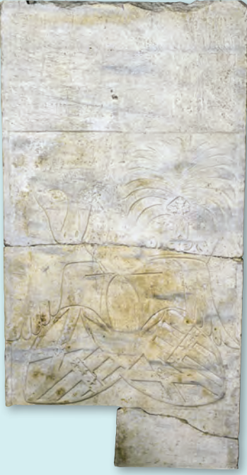
2- Galata'da bulunan iki İngilize ait 1391 tarihli mezartaşı (İstanbul Arkeoloji Müzesi)

almaktaydılar. 1455 nüfus sayımına göre Galata'da en kalabalık nüfusu Rumlar oluşturuyordu. Nüfusça ondan sonra Latinler (Cenevizli, Venedik ve Katalan) geliyordu; Ermeniler üçüncü, Yahudiler en son sıradaydı. Galata'da Türk nüfusunun yerleşmesi yarım yüzyıl almış; Türkler kentin تنها batı bölümünde yoğunlaşmıştır. İlk 5-10 yıl içinde yerleşenler arasında denizci azepler, kaptanlar, Galata Kulesi çevresinde, kulede görev yapan yeniçeriler yer almaktadır. Askerî sınıf dışında ilk yerleşen Türkler arasında Ankara'dan bir sof tüccarı, bir kürk tüccarı, bir hamamcı, bir demirci ve bir nakkaş bulunmaktadır. Galata hızla Türkleşmiştir. 1481 tarihli vakfiyede 13 İtalyan, 8 Rum ve 6 Ermeni mahallesine karşı Türklerin yerleştiği mahallelerin sayısı 20'yi bulmuştur. Kadı Muhyiddin'in yaptığı 1478 tarihli Galata nüfus sayım sonucu 592 Rum-Ortodoks, 535 Müslüman, 332 Latin