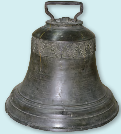
3- Galata Kulesi çanı (İstanbul Arkeoloji Müzesi)

(Efrenciyan yani Katolik Avrupalı nüfus) ve 62 Ermeni hanesi tespit edilmiştir. Böylece, daha 1478'de nüfusun %49'u Müslüman idi. Müslüman mahallelerinde Hristiyanların yerleşmesine izin verilmemişti; fakat pazar bölgesinde ve esnaf birliklerinde tüccar ve esnaf hangi dinden olursa olsun bir arada çalışırdı. Fetih'in en önemli sonuçlarından biri, Galata'nın İstanbul ile her bakımdan bütünleşmesidir. Galata, yalnız ticaret bakımından değil, yaşam tarzı bakımından da İstanbul'un Avrupa'ya açılan penceresi olmuştur. Fatih'in tarihçisi Tursun Bey (1490'a doğru) "Eğer İstanbul'dan Frengistan'a (yani Galata'ya) geçmek istersen kayığa bir akçe ödemen yeter" diyor. Osmanlı idaresinde 1453-1490 arasında rastlayan Galata-Ceneviz noter kayıtları, serbest yaşam ve ticaret bakımından eskiye göre bir değişiklik olmadığını ortaya koymaktadır. Osmanlı, Magnifica Comunit di Pera adını alan Ceneviz cemaatine, bir protegeros (kethüda) idaresinde kendi iç işlerini düzenleme hakkı tanınmıştı. 1540'larda eski San Michele Kilisesi yerinde Rüstem Paşa bir bedesten ve han yaptırarak tüccar ve değerli ithal malları için güvenceli bir ticaret merkezi yaratmış oldu. Galata aynı zamanda zeytinyağı ve şarap gibi Ege mallarının başlıca antreposuydu. Öbür yandan, XVI. yüzyılda Kasımpaşa semti imparatorluğun esas tersanesi ve donanma merkezi olunca, Galata denizcilerin ve denizcilik sanatlarının başlıca mekânı hâline geldi. XVII.