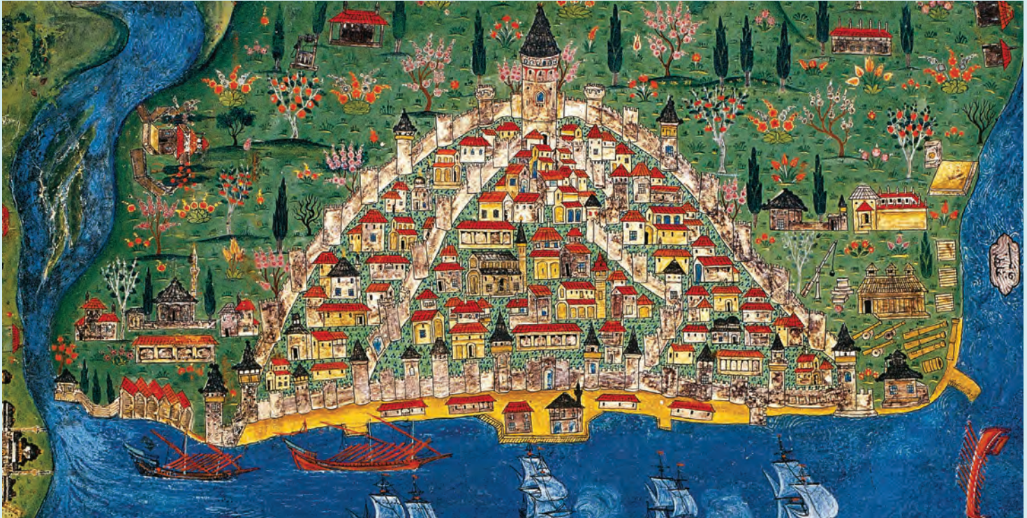
1- Galata (Matrakçı)

yeni mahalleler kuruldukça, bunları korumak için yeni surlar yapılmış, böylece iç surlarla Galata beş bölümlü bir kale hâlini almıştır. Sultan, Galata karasurlarının, güvenlik nedeniyle yer yer yıkılmasını emretmiş, ama kent, Ceneviz dönemindeki esas konumunu korumuştur. İlk Ceneviz çekirdek bölgesi (contrata), Azeapkayı ile Karaköy arasındaki bölüm, büyük kuleye doğru genişlemiş, Osmanlı döneminde Galata'nın en canlı ticaret bölgesi olarak kalmıştır. Cenevizlilerin Eski Lonca ve Yeni Lonca'sı, belli başlı Latin kiliseleri (San Michele, San Francesco, Santa Anna, Santa Maria, San Domenico, San Zani) bu bölgededir. Yahudiler kalenin doğusunda Karaköy ve Yüksekaldırım boyunca; Rumlar Büyük Kale (Galata Kulesi) ile ilk Ceneviz Kalesi arasında ve Karaköy'den Tophane'ye kadar kıyıda Haliç üstünde; Ermeniler ise onların arkasında yamaçta yer