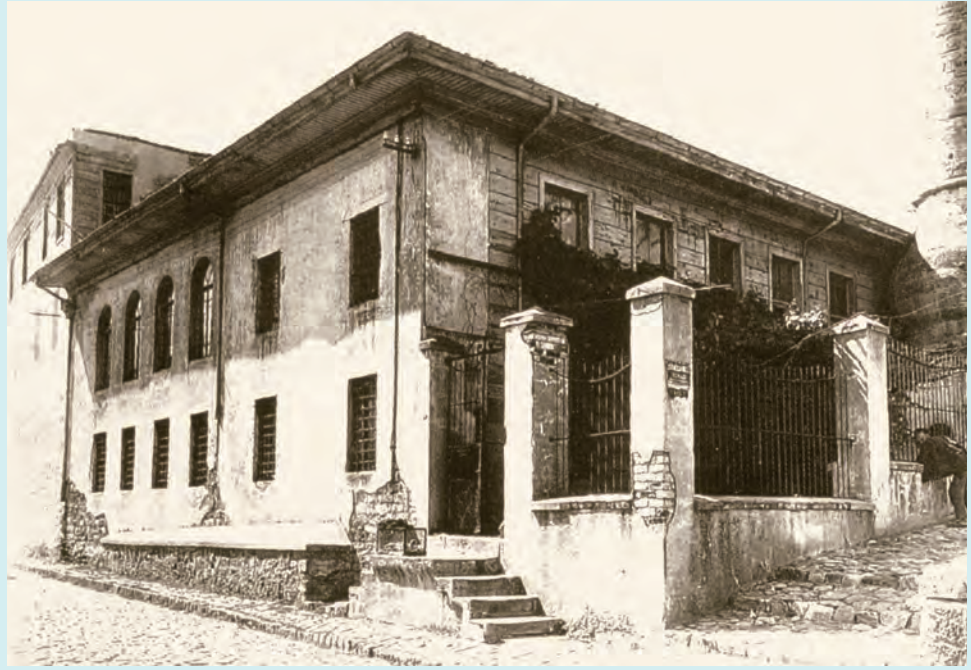
1- Gümüşhanevî Dergâhı

Bugün İstanbul Valiliği olarak hizmet veren Cağaloğlu'ndaki yapı, Osmanlı döneminde Sadaret/Bâbiâli, bugünkü anlamda "Başbakanlık" binası olarak kullanılmakta idi. Lale Devri'nin kudretli sadrazamı Nevşehirli Damad İbrahim Paşa, burayı faal olarak kullanmış, sonraki zamanlarda ise sadrazamların etkinlikleri oranında önemli bir idari merkez olmuş veya önemi zayıflamıştır. Hayır eserleri inşa edip bunları insanların faydasına vakfetme hususunda oldukça gayretli gördüğümüz İbrahim Paşa, kimi hayır eserlerini III. Ahmed'in kızı