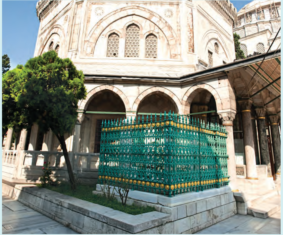
3- Ahmed Ziyâüddin Gümüşhanevî'nin Kanunî Sultan Süleyman'ın türbesinin bitişiğindeki kabri