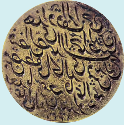
1- Ahmed Ziyâüddin Gümüşhanevî'nin kütüphanelerinin vakıf mührü (M. Esad Coşan Eğitim ve Araştırma Merkezi)

tehlil hatmi yapılır, gece namazları kılınır, böylelikle gece ihya edilirdi. Bayram namazlarından sonra topluca bayramlaşılır. Kurban Bayramı'nda kimi kurbanlar ve sair zamanlarda adak adayanlar bu adaklarını dergâhta keser, etler yemeklerde kullanılmak suretiyle gelenlere ikram edilirdi.