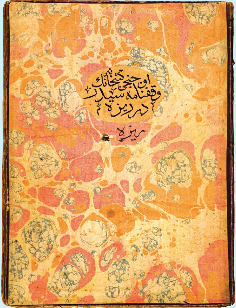
2- Ahmed Ziyâüddin Gümüşhanevî'nin kurduğu kütüphanelerden üçüncüsünün vakfiyesi (M. Esad Coşan Eğitim ve Araştırma Merkezi)

Gümüşhanevî Dergâhı'nın, Düyûn-ı Umûmiye idaresinin kurulduğu; iktisadi iflasını ilan ettiği bir dönemde, diğer pek çok alanda olduğu gibi bu yöndeki girişimciliği ile de toplum dinamiklerini harekete geçirmek suretiyle gerek kitleye, gerekse idarecilere yol ve yöntem gösterdiği gözlenmektedir.