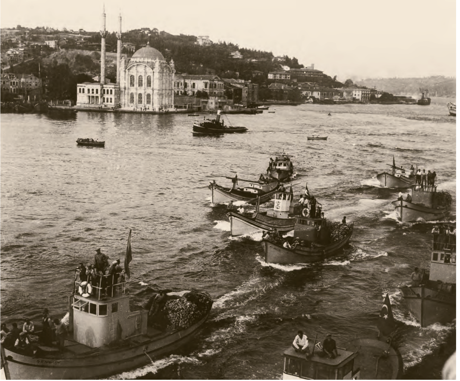
12- İstanbul balıkçıları Boğaz'a açılmışlar. Arka planda Mecidiye (Ortaköy) Camii