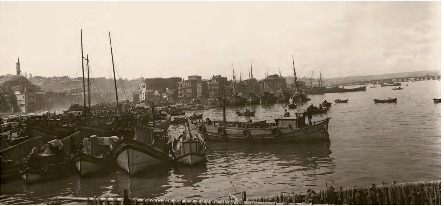
10- Eminönü-Unkapanı arasının eski görünüşü

dans müziğinden ve tangolardan çocukluğumuz boyunca hiç hoşlanmadık. Ben, ortaokul yıllarımda, çok sıkı bir Sadi Yaver Ataman korosu dinleyicisi oldum. Yani halk müziğini de, sevdiğim Türk müziğinin yanına ekledim. Çocukluktan beri elimizde radyo kullanma imkânı veya klasik Batı müziği plakları olsa, muhakkak ki ağabeyimiz gibi biz de klasik Batı müziğini çok sevecektik. Fakat yetişme çağlarımızda dinleyemediğimiz çok sesli müziği, otuz yaşa merdiven dayayınca sevmeye başladık.