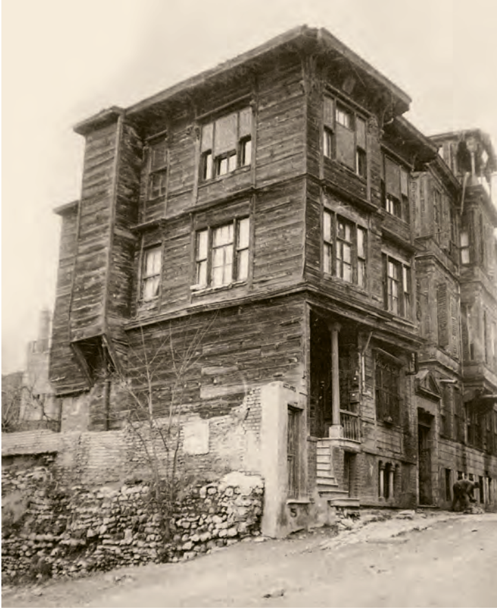
6- Eski bir İstanbul konağı... Kim bilir nasıl hayatların yaşandığı bu zarif konağın yerinde şimdi muhtemelen bir beton yığını vardır