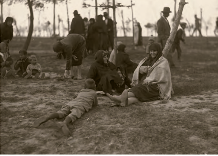
9- İstanbul halkı mesirede... Eski İstanbul halkının en büyük eğlencelerinden biri bugün olduğu gibi, dün de mesirelere gitmek, yiyip içip eğlenerek hoşça vakit geçirmektir