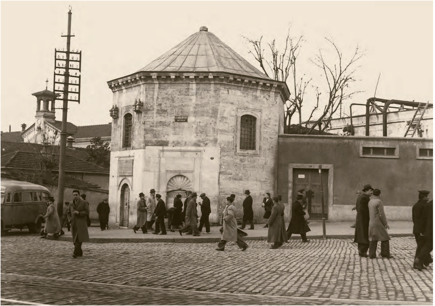
7- Taksim Meydanı'na adını veren, bir zamanlar Beyoğlu'na suyun taksim edildiği Maksem, bir I. Mahmud devri yapısı... Sağ tarafta görülen duvar günümüzde yok. Arkadaki su deposu ise Büyükşehir Belediyesi tarafından büyük bir sanat galerisine dönüştürüldü: Taksim Cumhuriyet Sanat Galerisi

Sonra tamamen kayboldular. Birader ve ben kirpi ile ilk defa 1944'te Kısıklı-Çamlıca'da karşılaştık. Sonra bir daha ne Feriköy ne Göztepe'de kirpi gördük. 2008 yılında İnönü Üniversitesi lojmanlarının arasındaki kırsal bölgede, akşam karanlığında koşuşturan on-on beş kirpi gördüm. Malatyalılar da kirpilerimizi küstürmemeliler.