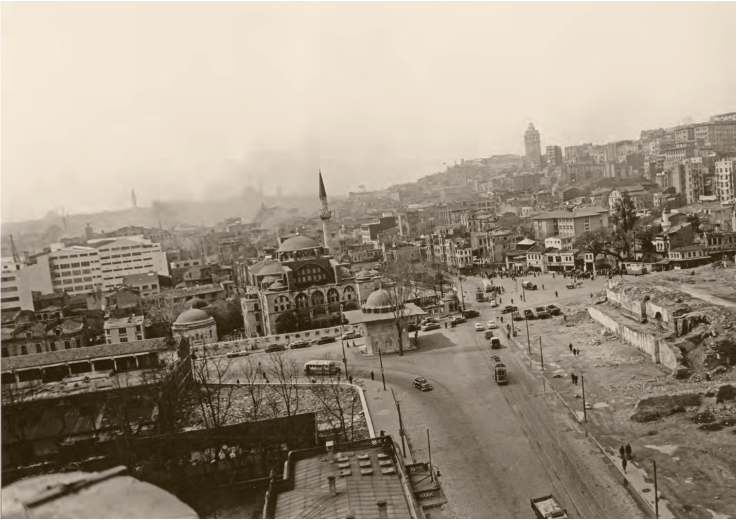
8- Tophane Meydanı... Sağ tarafta yıkımlar gerçekleştirilmiş. Önde Mimar Sinan'ın eseri Kılıç Ali Paşa Camii, arka planda Galata ve İstanbul'un belli belirsiz tarihî silüeti... Süleymaniye Camii, Beyazıt Yangın Kulesi, Beyazıt Camii...

eksik değildi. Bu maganda tipler, ne hikmetse Küçüksu'da ve Beykoz'da görülmezdi. Magandaların nadir de olsa can sıkıldığı yerler, Yenikapı, Samatya ve Florya civarıydı. Hemen hemen hanımların tümü aynı klasik piknik yiyeceklerini getirirlerdi.