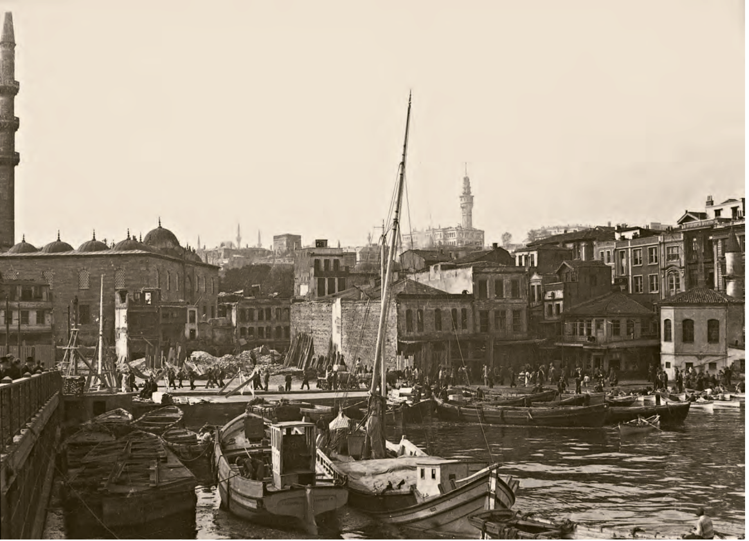
11- Eminönü Meydanı'nın açılıp genişletilmeden önceki görünüşü. Sağ tarafta eski İstanbul'un karakteristik köşelerinden biri olan ve 1950'lerde yıkılan Balık Pazarı görülüyor

taşımacılığının artması ile mi, başka sebeplerle mi, bilemiyorum, 1980'lerde önemini kaybetti. Ambarların ve hamalların çok işlevli olduğu yıllarda, bol miktarda at arabası da vardı. Haldun Taner'in hikâyeleri o yılları çok iyi anlatır. "Şişhane'ye Yağmur Yağlıyordu" hikâyesini okuyan bir gence derim ki "O hikâyede anlatılan İstanbul, tam anlamı ile 1950'li yılların İstanbul'udur. 1950'li yıllarda Refii Cevat Ulunay ve Refik Halid Karay, yaşıyorlardı. Bu dünyayı terk edişleri, 1960'lı yılların ikinci yarısındadır. Refii Cevat'tan İstanbul kabadayılarını, yazar-çizerlerini okurduk. Refik Halid ise Ulunay'ın anlattıklarına ek olarak, Beyoğlu'nun eğlence dünyasını da anlatırdı. Bu iki yazarımızın, Sermet Muhtar Alus'un, Haldun Taner'in hayatlarını ve anılarını okumadan, İstanbul'un ruhunu tam anlamıyla hissedemeyiz. Ayrıca Samiha Ayverdi, Münevver Ayaşlı gibi hanım yazarlar da İstanbul'un ruhunu anlamamızda bize rehberlik ederler.