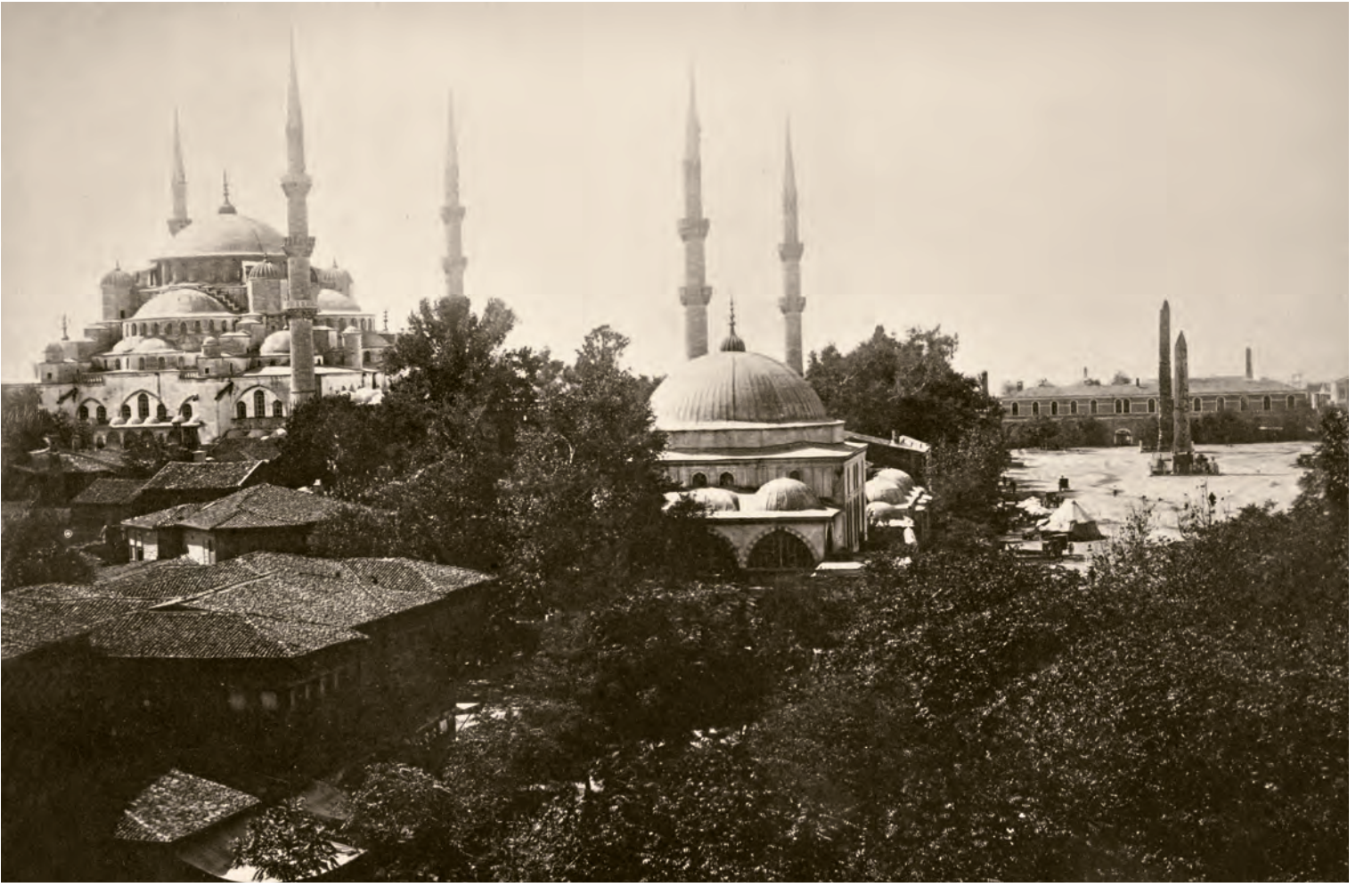
14- Sultanahmet

girer, birincisinde kafamızı dinleyerek dolaşır, ikincisinde ise تنها ve ışıklı mavi bir ortamda dua ederdik. 1953 veya 1954 yılında, ilk defa Arkeoloji Müzesi'ni ziyaret etmiş ve zamanın tarih kitaplarında fotoğrafları kötü bir şekilde basılmış heykellerin ve lahitlerin asıllarının ne kadar etkileyici olduğunu düşünmüştüm. Topkapı Sarayı'nda biraz daha fazla turist olurdu. Turistlere, ellili yılların ikinci yarısına kadar ya "seyyah" veya "ecnebi seyyah" denirdi. Topkapı Sarayı'na gelenler arasında Amerikalı, Japon gibi "ecnebler" pek görülmezdi. Avrupalı ziyaretçiler Fransız, İngiliz, Alman, doğulular ise, Suriyeli, Iraklı, Ürdünlü, İranlı turistler olurdu. Sayıları da bugünkü kadar fazla değildi. II. Mahmut Türbesi'nin ek binaları bir devlet dairesinin kullanımına verilmişti. Devlet dairesinin çalışanları da "Müdür Bey'in emri var." diyerek kimseyi içeri almazlardı.