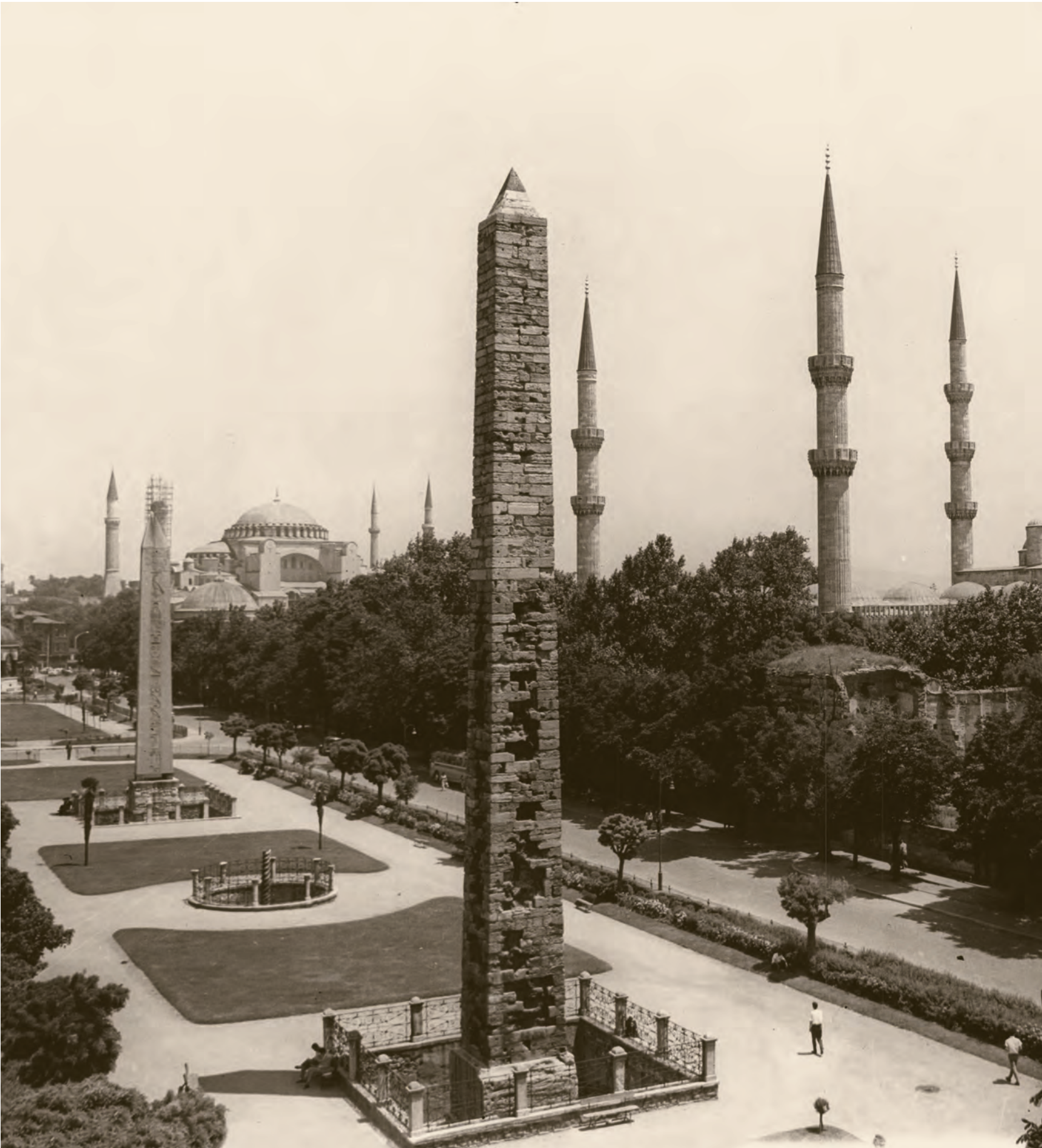
13- Cumhuriyet'in ilk yıllarında Sultanahmet Meydanı. Örne Sütun, Yılanlı Sütun ve Mısır Obeliski. Sağ tarafta Sultanahmet Camii, arka planda Ayasofya