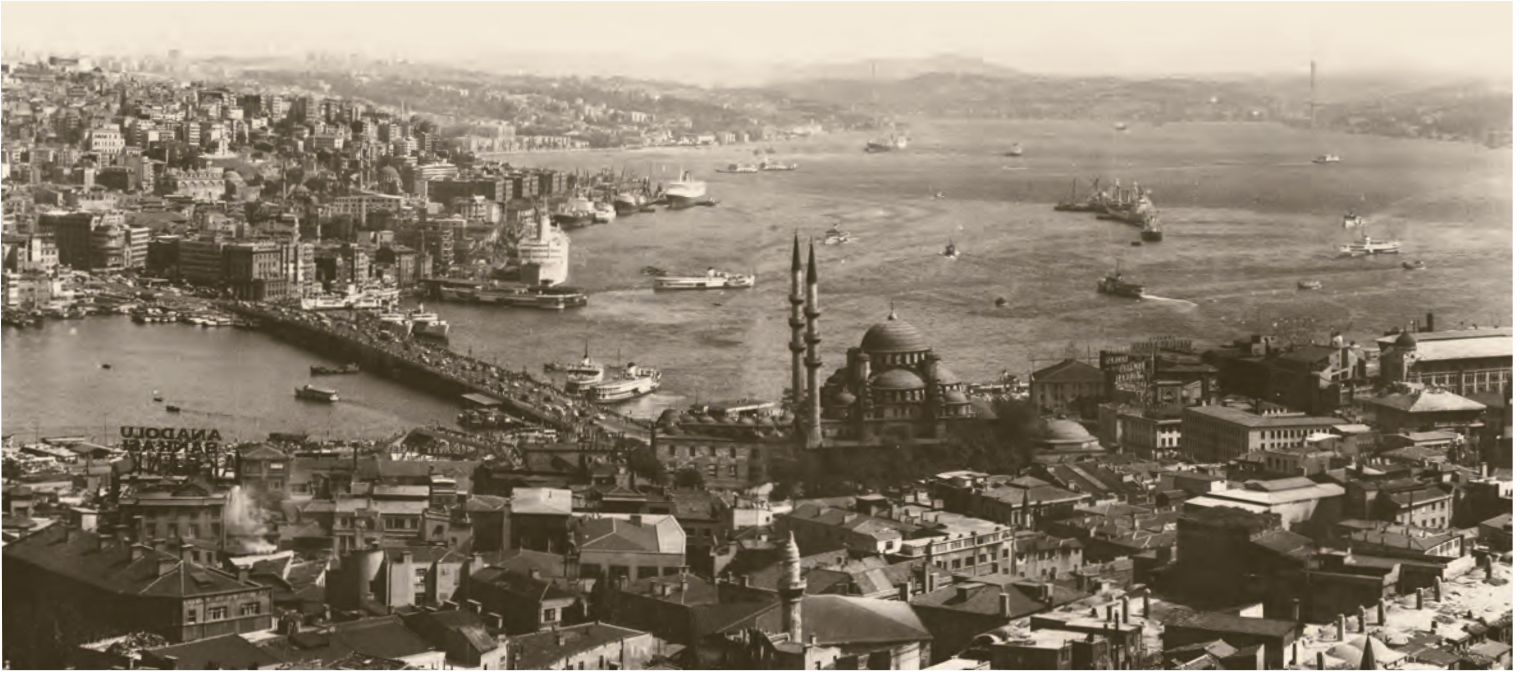
2- İstanbul'un Halic'i ve Boğaz'ı kucaklayan büyüleyici manzaralarından biri. Birinci köprü henüz yapılmış ve Boğaziçi sırtları henüz gökdelenler tarafından istila edilmemiş

çıkarılarak, dersaneleri otel odası gibi kullanma imkânı tanınırdı. Belki ordu için de böyle bir imkân vardı, ama bilmiyorum. Kısacası, 1960'lı yılların başına kadar, kamu olsun, özel sektör olsun, memurlar tatil yapar, fakat genellikle Bodrum'a Antalya'ya değil kendi ilçelerine giderlerdi. Esnaf ise, müşteri kaybetmek veya "Çalışmayı sevmiyor!" derler korkusuyla yalnız pazar günü tatiliyle yetinirdi. Kurtuluş Tramvay Caddesi'nde apartman sık görüldüğü hâlde, Feriköy Çobanoğlu Sokağı'nda evlerin hepsi iki katlıydı. Her iki katlı evin de sağ komşu, sol komşu ve bahçe komşusu olmak üzere ortak duvarlı üç komşusu olurdu. Erkek komşular "Akşam şerifler hayr olsun." ve "Sabah şerifler hayr olsun." diye selamlaşırlardı. Üçüncü komşu, Kuyulubağ Sokağı'nın bahçeleri ile Çobanoğlu Sokağı'nın bahçelerinin bahçe komşuluğu oluşturmasından doğuyordu.