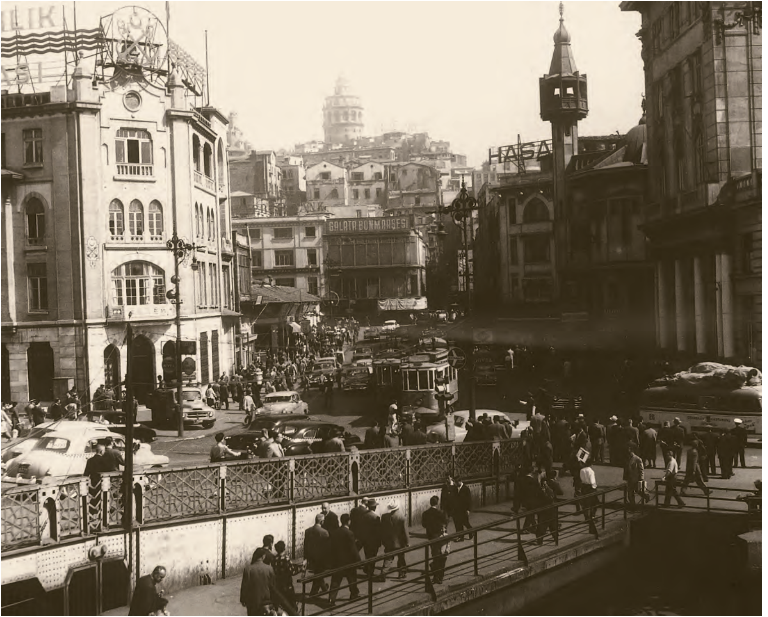
5- Galata Köprüsü ve Karaköy Meydanı... Karaköy Mescidi (Merzifonlu Kara Mustafa Paşa Camii) yerli yerinde durduğuna göre, fotoğraf 1958 yılından önce çekilmiş olmalı

Efendi -“efendi”liği medrese öğrenimi görmesindenmiş-. Dârüşşafaka kurucularındandı.