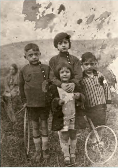
9- Tahta çemberli çocuklar (XX. yüzyılın başı)

Hacivat, trampet, davul, def, kamyon, kaynana zırlıtısı, beşik yapar ve satardık... Plastiğe teslim oluyordum yavaş yavaş. Rahmetli babam, teneke oyuncaklara isyan etmişti. Ama 16 yıl dayandı. Ben plastiğe daha çabuk teslim oldum. Hem baba mesleğimi sürdüremediğim hem de İstanbul'a