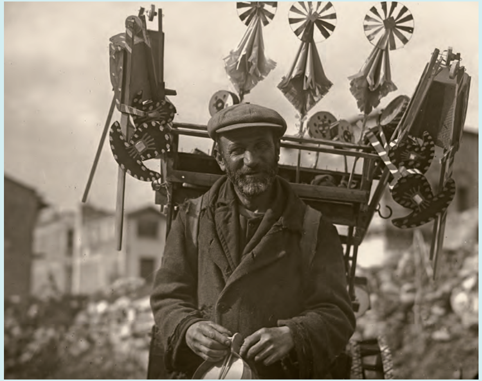
7 İstanbul'da bir oyuncak satıcısı

Çocuk, doğumundan yetişkinliğe nesnelere, seslere, hareketlere, büyüklerin dünyasına ait fakat kendi fiziksel özelliklerine uygun büyüklükte objelerle algılayıp kurgulayarak anlamaya, tanımaya