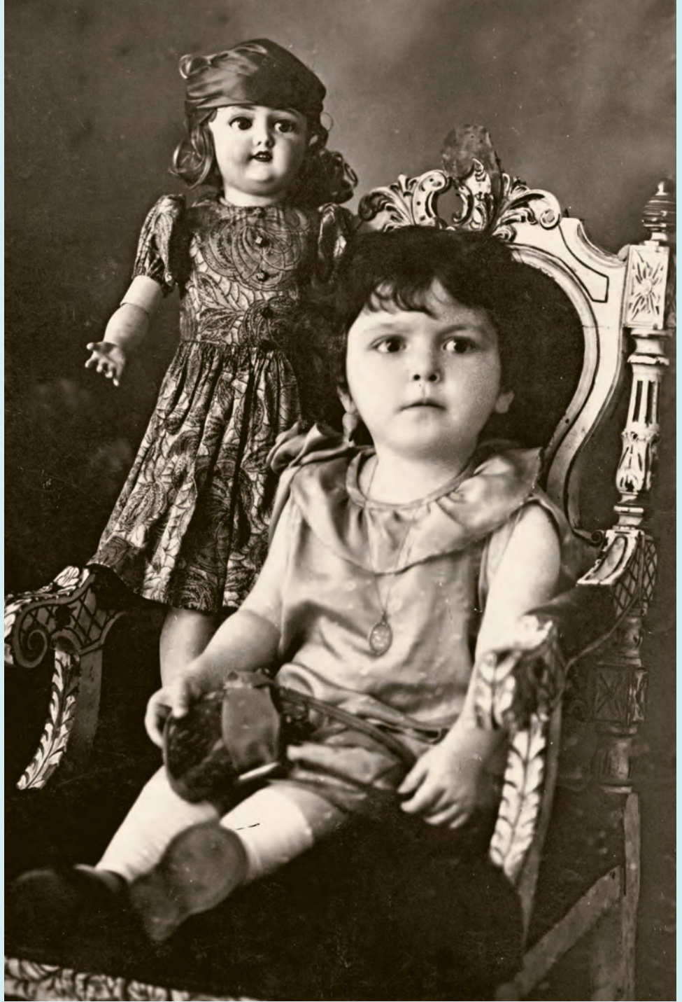
10- Taş bebekli çocuk fotoğrafı (XX. yüzyılın başları)

Hacivat, trampet, davul, def, kamyon, kaynana zırlıtısı, beşik yapar ve satardık... Plastiğe teslim oluyordum yavaş yavaş. Rahmetli babam, teneke oyuncaklara isyan etmişti. Ama 16 yıl dayandı. Ben plastiğe daha çabuk teslim oldum. Hem baba mesleğimi sürdüremediğim hem de İstanbul'a