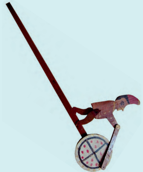
4- Eyüp imalatı cambaz (XX. yüzyıl başı, İBB Şehir Müzesi)