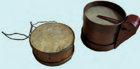
5- Eyüp imalatı davul ve trompet (XX. yüzyıl başı, İBB Şehir Müzesi)