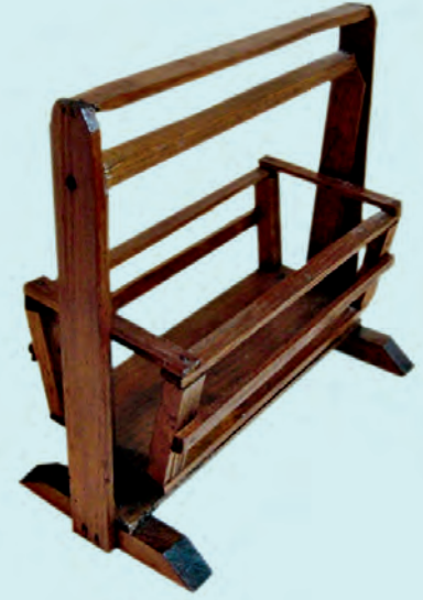
2- Eyüp imalatı salıncaklı beşik (XX. yüzyıl başı, İBB Şehir Müzesi)