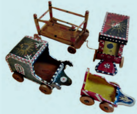
3- Eyüp imalatı arabalar (XX. yüzyıl başı, İBB Şehir Müzesi)