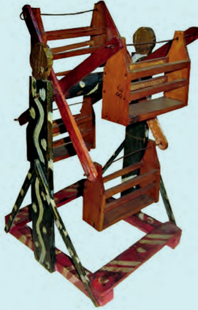
1- Eyüp imalatı dönme dolap (XX. yüzyıl başı, İBB Şehir Müzesi)

Efendi, oyuncakçı dükkânları açarak bu sanatın yayılmasına hizmet etmişlerdir. 1