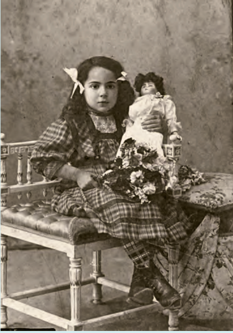
8- Oyuncak bebekli çocuk (XX. yüzyıl başı, F. Geleş Koleksiyonu)