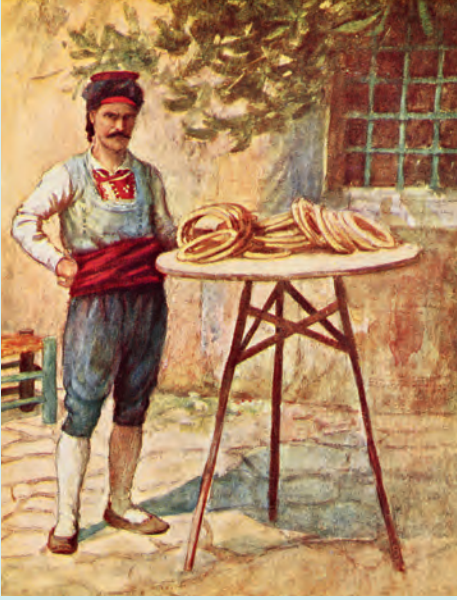
3- Simitçi (Millingen)

değirmenleri ise normal un çıkarmaktaydılar. Uncu değirmenleri has un imalinden sonra geriye kalan “kara simit” tabir olunan kepekli unu değirmenlerinde, pazarlarda, Unkaparı haricinde üç dört dükkânda devecilere, hayvanları için yem temini için köylerden gelen köylülere ve gemicilere satmaktaydılar. Kepekli unun fırıncılara satışı yasaktı.