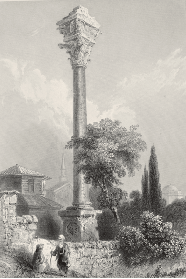
2- Kıztaşı (Bartlett)

Sevgilisinin ölümüne dayanamamış ona kavuşmuştu. Zamanla Leandros'un İstanbul Boğazı'nda kayb olduğu yerde bir kayalık oluştu. İşte Kız Kulesi, Leandros'la Hero'nun anısına burada inşa edildi. 3