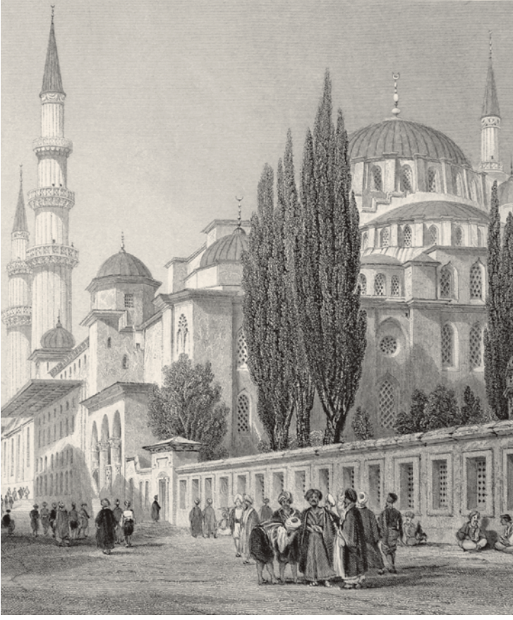
4- Süleymaniye Camii (Allom)

Evlialar Ansiklopedisi adlı eserde çeşitlemelerine diğer kaynaklarda rastlamadığımız İstanbul'un fethine dair şöyle bir efsane kaydedilmiştir: