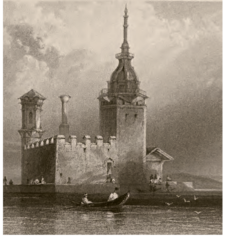
1- Kızkulesi (Pardoe)

Boğaz'ın öteki yakasında oturan Leandros adlı yakışıklı delikanlı da hayatında ilk kez bu bayrama katılmak üzere tapınağa geldi. Afrodit onun yakarışlarını duymuş olmalı ki karşısına güzeller güzeli Hero'yu çıkardı. İki genç birbirlerini görür görmez âşık olmuşlardı. Ama aralarında aşılması güç bir engel vardı. Bu engel İstanbul Boğazı'ydı... Leandros yaşadığı şehre dönmeden önce sevgilisine, aralarındaki denizin aşklarına engel olamayacağını söyledi. Eğer Hero, denizin durgun olduğu gecelerde kulede bir ışık yakarsa, Leandros yüzerek onun