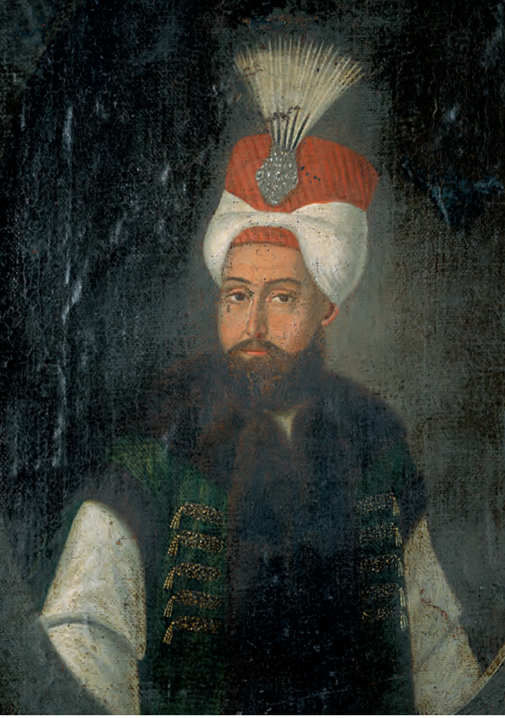
2- III. Selim (TSM, nr. 17-32)