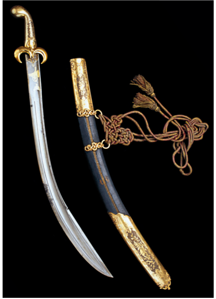
3- III. Selim'in kılıcı (TSM)

birisinin ayakta kalabilmesi bakımından en önemli mekanizmayı oluşturuyordu. Arşiv belgeleri yapılan teftişler neticesinde çok sayıda göçmenin çoğu zaman güvenilir bir kefil gösterememeleri sebebiyle şehirden sürüldüğünü göstermektedir. Genellikle yeniçerilik ve kahvehaneler gibi birçok unsuru birleştiren çok katmanlı ve oldukça değişken sosyal ağlara dâhil olabilenlerin ve keza hemşehri dayanışmaları içinde kendilerine yer bulabilenlerin şehirde barınak ve iş temin etme bakımından şansları çok daha yüksekti. Diğer bir söyleyişle, “[M]uvaffak olmuş bir göçmen kendisine kefil olunan bir göçmendi.” 9 Ne var ki tatbikatta idarecilerin kefaletle bel bağlamalarına rağmen III. Selim’in bu işe memur edilmiş ricalinin bildirdiğine göre durum vahimdi: “Ol makule serseriler hin-i tahrirde ekseri birer bahane ve kefil bularak kalıp, sonra küfelaya mesuliyet dahi terettüb etmemek cihetiyle, rast geldiğine kefalet etmek halka tabi’at olmuş olduğu ve gidenler dahi iznikmid ve sair