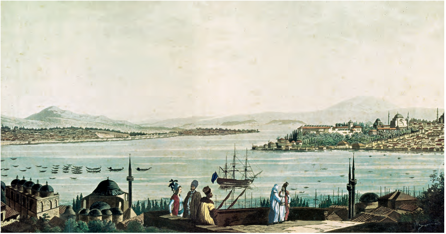
1- İstanbul (Clare Mayer, Londra 1794) (TSMK, nr. YB 3497)

gibi karışıklık çıkarması muhtemel muzır şahısların teşhis edilmesiydi. Bu gayeye ulaşmak için teftiş memurlarına öncelikle bu tür şüpheli kimselerin aralarına karışması muhtemel olan hamallar, bahçıvanlar, seyyar satıcılar, kayıkçılar ve Arnavut hamam tellakları gibi belli grupları ve yine bu kişilerin ekseriya dolandıkları veya saklandıkları bekâr odaları, camiler, medreseler, derviş kulübeleri ve aş evleri gibi yerleri hedef almaları tembihleniyordu. 7 Müfettişlerden katı kefalet koşullarını tatbik etmeleri isteniyordu. Ve şehirde yalnızca iş bulup güvenilir kefiller getirebilenlerin ikamet etmelerine izin verilmesi öngörülmüyordu. Bir başka deyişle, bu önlemlerin amacı şehirde kalanların bağlantılı oldukları bir grubun parçası olarak teşhis edilebilir olduklarından emin olmaktı. Kefalet uygulaması, idare açısından teşhis edilemeyen ( mechul ) kimseleri kanunen teşhis edilebilir ( ma'lum ) bir kategoriye dâhil olacak şekilde devletin görüş alanı içerisine alan bağ temin ediyordu; fakat aynı zamanda bu tür münasebetler tesis edemeyenleri dışlıyor ve marjinalleştiriyordu.