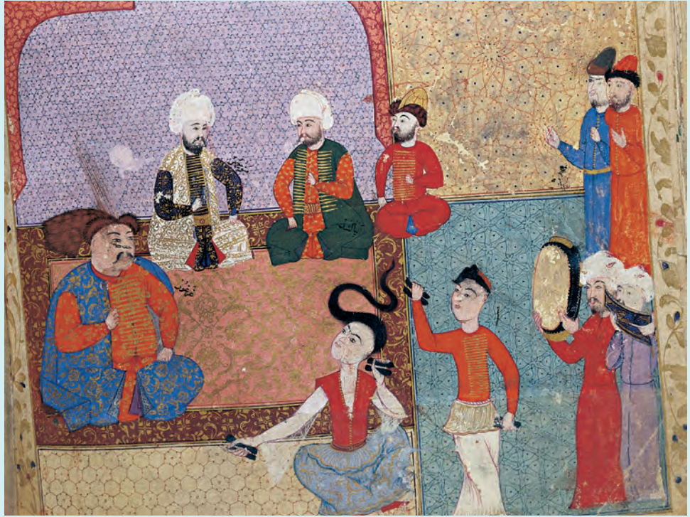
1- Sohbet meclisi (TSMK, nr. 1365)

az olan, ayrıca anlatıcısı/yazarı ve ilk anlatılma/yazılma tarihi bilinmeyen eserlerin istinsah edilmiş ilk örneği 1724'ten önceye aittir. Saraydan konaklara, kahvehanelere kadar çeşitli mekânlarda meddahların belli bir topluluğa sözlü olarak anlattıkları bu macera hikâyelerinin bir kısmı, yeniden kaleme alınarak XIX. yüzyılda basılmıştır. XX. asrın başlarında meddahlık sanatının canlılığını kaybetmesiyle birlikte hikâyelere gösterilen ilgi de kaybolmuştur.