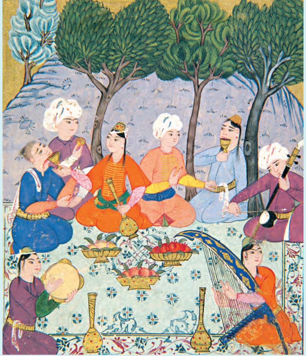
2- Kırdı sohbet (TSMK, nr. 373)

Hikâyelerde en fazla yer alan sohbet meclisleri konaklarda yapılan toplantılardır. Bunlar arasında ayrıntılı olarak yer alan Tıflî Efendi Hikâyesi ve onun varyantı olan Meşhur Tıflî Efendi ile Kanlı Bektaş’ın Hikâyesi başlıklı eserlerdeki helva sohbetidir. Tıflî, şöhreti İstanbul’u aşmış, geceleri şehrin seçkin sohbet meclislerine davet edilen, “kibar ve rical nazlısı” ünlü bir meddaktır. Kocamustafapaşa’daki konağında yaşayan ağa, çok zengin olmakla birlikte kibar adabını bilmeyen bir kişidir. Devlet adamlarının ve şehrin ileri gelenlerinin evlerinde tertiplenen tarzda bir helva sohbeti düzenlenmesini ister. Hikâyenin varyantında ise ev sahibi Şıkk-ı Sani Ahmed Bey’dir. Sohbet şu şekilde gerçekleşir: Her davete gitmeyen Tıflî, toplantıya katılmayı dostlarının hatırı için kabul eder. Misafirler, akşamüstü helvanın yapılacağı evde toplanmaya başlarlar. Karşılıklı hâl hatır sorulduktan sonra yemekler yenir, şerbetler içilir, kahveler ve duhanlar (tütün) ikram edilir. Yatsı namazından sonra tekrar kahveler, duhanlar tazelenir. Meclistekilerin keyfi yerine gelince sıra sanatkâra gelir. Herkes ona saygı göstermektedir. Meddah güzel bir lisanla kıssa, menkıbe anlatır, bazen havadis verir, bazen de daire ile besteler, şarkılar okur. Arada kahveler, şerbetler devrolur. Gece yarısına doğru ev sahibinin emriyle helva pişirilip misafirlere ikram edilir.