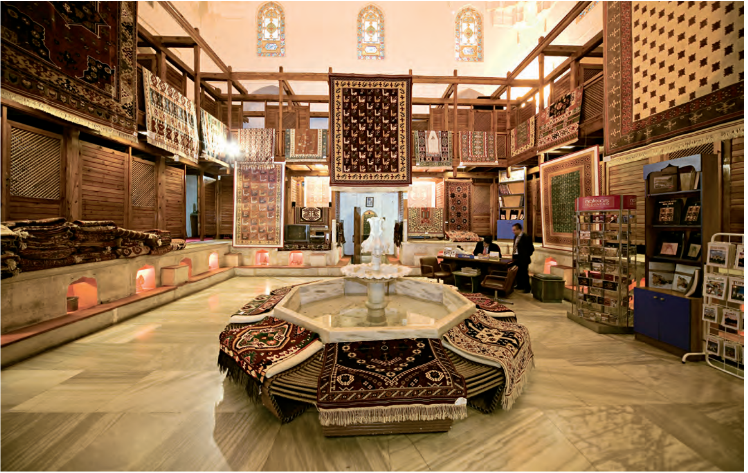
7- Halı Müzesi

Ayasofya I. Mahmut İmarethanesi'nin halı müzesine dönüştürülmesiyle yeniden hizmete girmiştir.