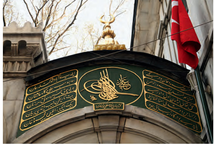
4- Galata Mevlevihanesi girişindeki II. Mahmud devrine ait kitabe

Dr. Fuat Sezgin'in kaleminden çıkan 5 ciltlik katalogunda yer almaktadır. 3