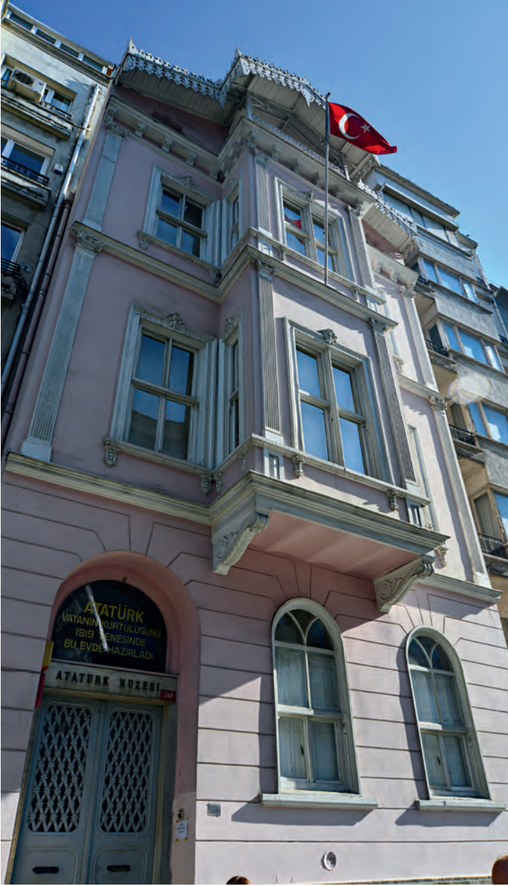
8- Atatürk Müzesi