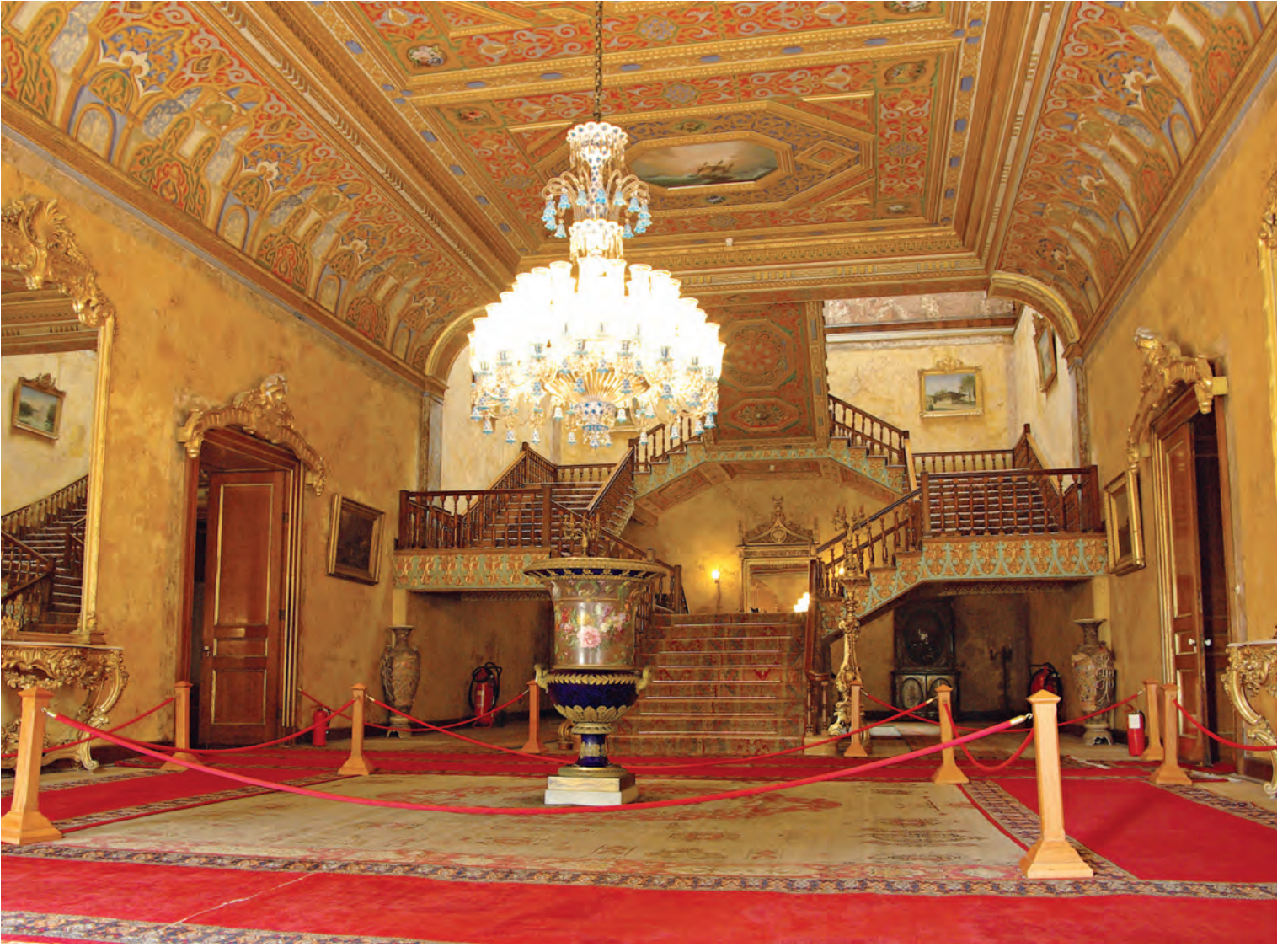
5- Beylerbeyi Sarayı

XVII-XIX. asırlara tarihlenen 22 top ve top gülleleri sergilenmektedir. Ayrıca Türklerin İstanbul'u kuşatması esnasında Haliç'i kapatan meşhur zincirin bir parçası da teşhir edilmektedir.