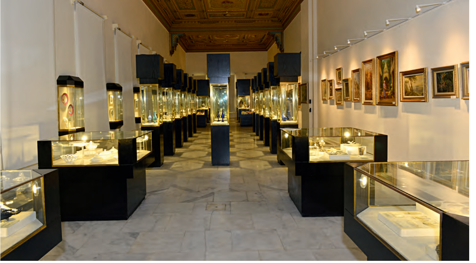
9- İstanbul Şehir Müzesi