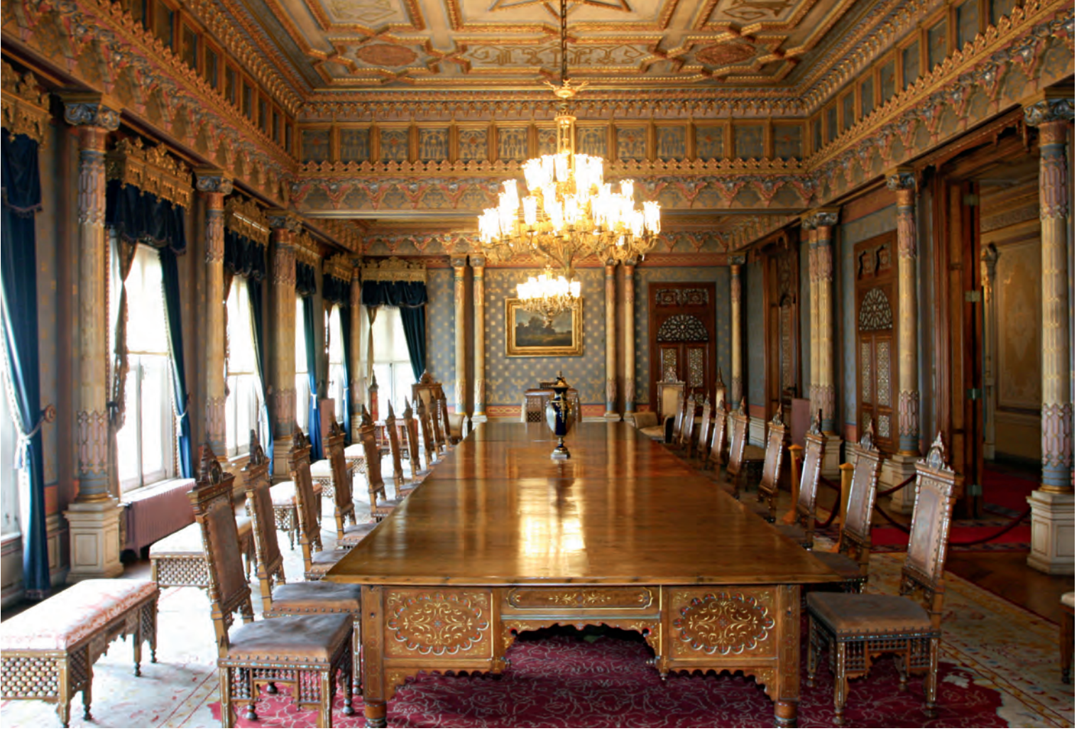
6- Şale Köşkü

kazanmıştır. TBMM Başkanlığı'na bağlı en eski yapı olma hususiyetini taşımakla beraber, geleneksel mimarisi ve dekorasyon özellikleriyle son derece ayrıcalıklı bir yeri vardır.