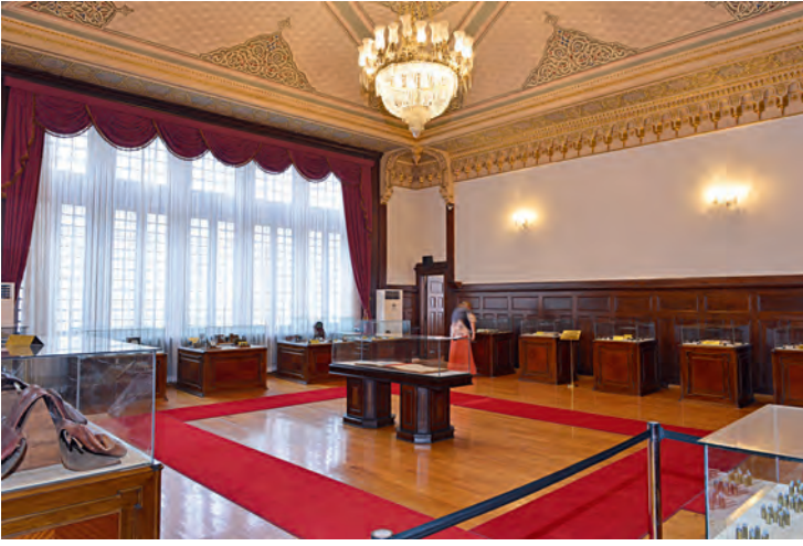
11- İstanbul PTT Müzesi

bilinen dünyasının kapılarını aralamaktadır. Müzede yer alan belge ve objeler, dönemin siyasi, ekonomik, toplumsal durumu, gündelik yaşamı ve kültürüyle ilgili ipuçları vermektedir. Kronolojik olduğu kadar tematik bir mantıkla da hazırlanan müze, yalnız banka hakkında değil, Osmanlı İmparatorluğu'nun Tanzimat'tan Cumhuriyet'e kadarki durumu hakkında da bilgiler içermektedir.