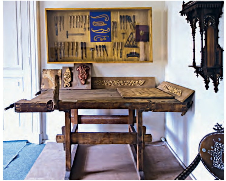
3- II. Abdülhamid'e Japon imparatorunun hediye ettiği marangoz takımı (Yıldız Sarayı Müzesi)