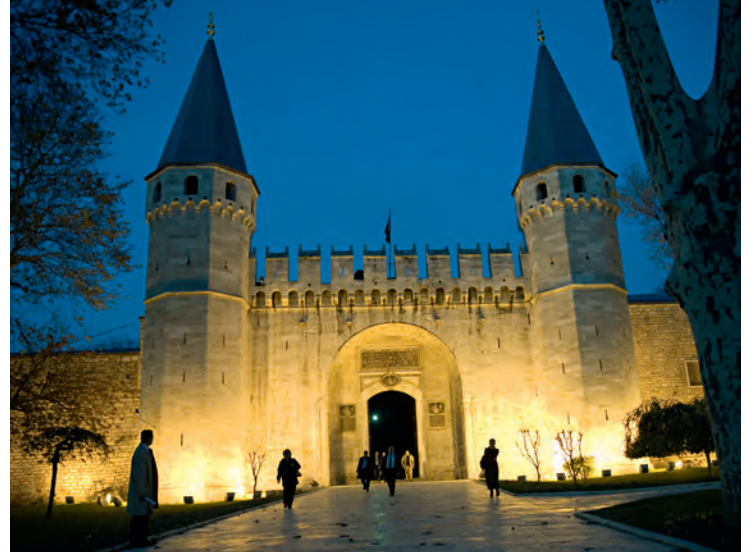
1- Topkapı Sarayı, Bâb-ı hümayun

Türkiye'de müzelerden sorumlu kurum, Kültür ve Turizm Bakanlığı'dır. Bu bakanlığın sahip olduğu birçok müze ile beraber diğer kamu kurum ve kuruluşlarına bağlı müzelerle gerçek ve tüzel kişiler ile vakıfların kendi hizmet konuları veya amaçları doğrultusunda açılan müzeler de bulunmaktadır. Bunların içerisinde Türkiye Büyük Millet Meclisi Başkanlığı ile Türk Silahlı Kuvvetleri'ne ait müzelerin haricindekiler, Kültür ve Turizm Bakanlığı'nın denetimindedir. Bakanlığın denetimi altında olan müzeler 2863 sayılı kanun ve buna bağlı çıkarılan Özel Müzeler ve Denetimleri Hakkında Yönetmelik hükümlerine tâbi olup "özel müze" statüsündedir. Bu yönetmeliğin hükümlerini yerine getirmeyen ve bakanlıkça denetlenmeyen ancak isimlerinde "müze" ibaresi olan müesseseler de vardır. Bu yazıda, Cumhuriyet dönemi İstanbul müzeleri sorumlu bakanlığın tasnifi doğrultusunda işlenecektir.