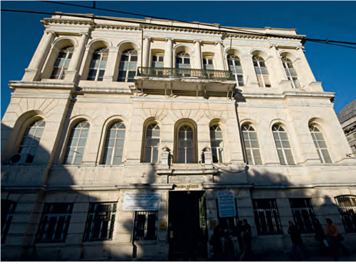
12- İstanbul Basın Müzesi

Müze ayrıca, Türkiye İş Bankası'na ait resim koleksiyonundan birkaç örneği kurgusu çerçevesinde sergilenmektedir. Kurum tarihi müzeciliği açısından başarılı bir örnek müzedir.