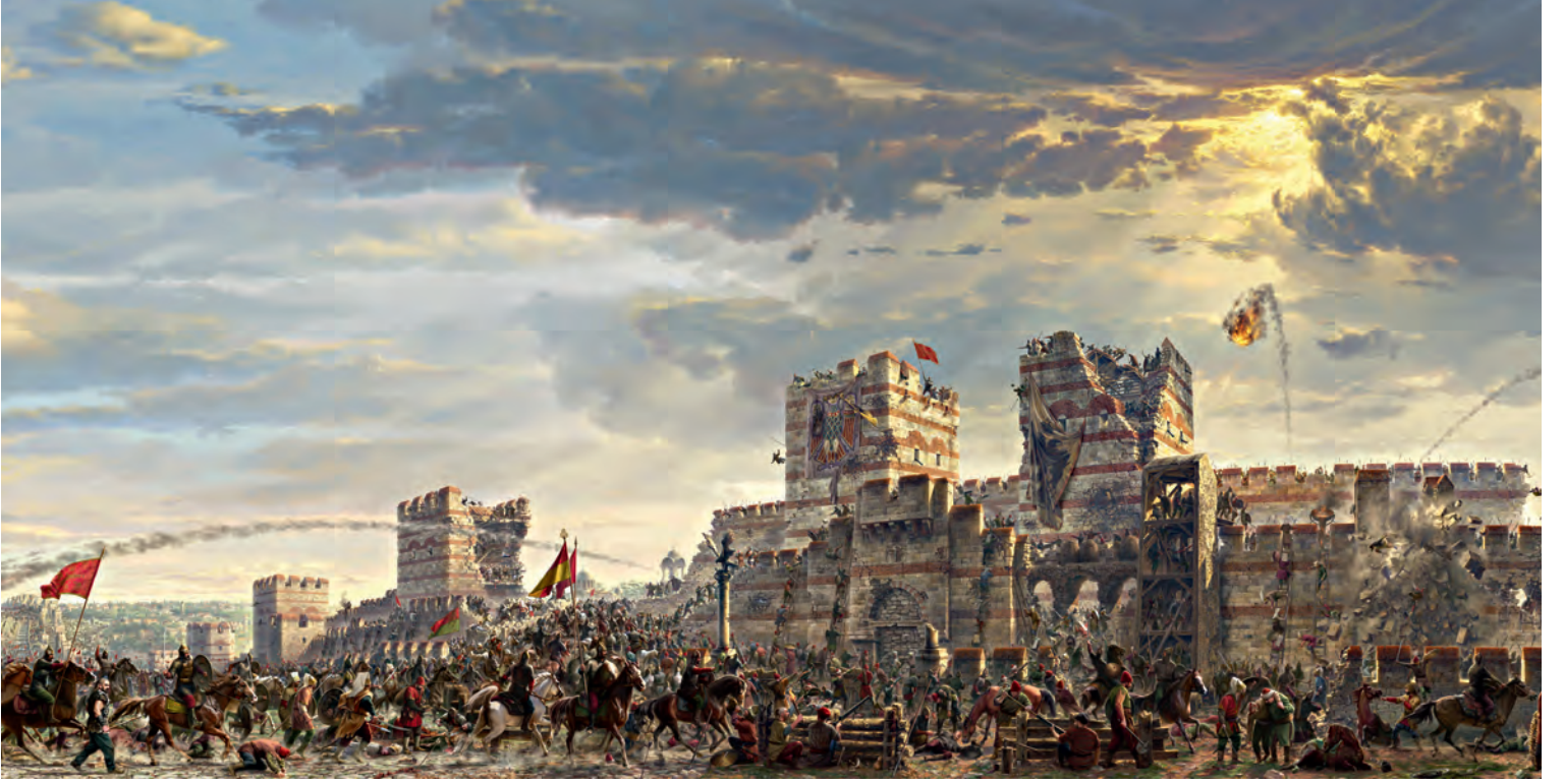
10- Panorama 1453 Tarih (Fetih) Müzesi'ndeki İstanbul'un Fethi Panoramasi'ndan kesit