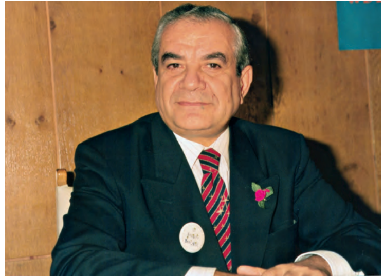
13- Nurettin Sözen (28.03.1989-27.03.1994)

27 Mart 1994'te yapılan yerel seçimlere gidilirken, özellikle 1989 seçimlerinden sonra siyasette ve seçim sisteminde önemli değişiklikler olmuştur. Özal'ın 1989'da cumhurbaşkanı olmasının ardından merkez sağda ANAP'ın oyları erimeye başlarken, DYP merkez sağda gittikçe güçlenmiştir. Ayrıca, solda yaşanan bölünmeler ve Kürt siyasetçilerin siyasal arenada çeşitli kısıtlamalara ve kapatmalara rağmen farklı parti isimleri etrafında boy göstermesi de önemlidir. Bu bağlamda seçimlere 13 farklı siyasi parti katılmıştır. İslamî siyasetin önemli aktörlerinden Refah Partisi'nin gittikçe önemli bir siyasal aktör olarak ortaya çıkması, yerel yönetimlerin kaderini dolayısıyla da İstanbul'un yeni belediye başkanının kim olacağını da belirleyecekti. Siyasal alanda güvenlikçi