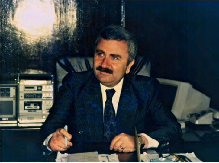
12- Bedrettin Dalan (26.03.1984-28.03.1989)