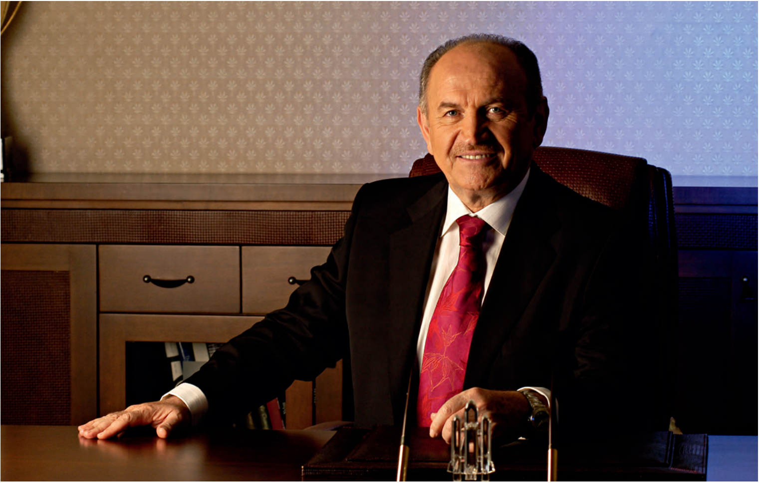
16- Kadir Topbaş (01.04.2004- ...)

Adalet ve Kalkınma Partisi (AK Parti), Türkiye’de ezici bir çoğunlukla seçimi kazanmıştır. Meclis’e giren ikinci parti de bir önceki seçimde barajın altında kalan CHP’dir. Recep Tayyip Erdoğan liderliğindeki AK Parti, bu seçimde %34’lük oy oranına ulaşırken, Deniz Baykal liderliğindeki CHP ise %19 oy almıştır. 2002 yılında İstanbul, üç seçim bölgesinden seçilecek olan 70 milletvekili ile Türkiye seçiminin kaderini belirleyecek en önemli seçim çevresiydi. 2002 seçimlerinde AK Parti İstanbul’da %37 oy oranı ile 43 milletvekili kazanırken, CHP ise %24’lük oy oranı ile 27 milletvekili kazanmıştır. İstanbul’da Genç Parti %8,22, DEHAP %5,51, MHP %5,4, ANAP %4,57, DYP ise %3,62 oy oranına ulaşmıştır. 2002 yılında AK Parti’nin seçim başarısının ardında muhakkak Erdoğan’ın İstanbul büyükşehir belediye başkanlığı döneminde üretmiş olduğu siyasal mirasın büyük bir payı vardı. Çünkü Erdoğan’ın siyasal söylemini üzerine oturttuğu pratikler, belediye başkanlığı döneminde gerçekleştirdiği projeler üzerinden kolaylıkla temellendirilebilmekteydi.