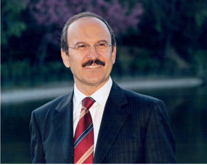
15- Ali Müfit Gürtuna (12.11.1998-01.04.2004)

hızlandırmıştır. Bu bağlamda RP'nin 1995 milletvekili seçimlerinde oy oranı Türkiye genelinde %21,38 iken, İstanbul'da %23,93'e yükselmiştir. İstanbul'da ANAP, 1995 genel seçimlerinde %21,98, DSP %18,33, DYP %15,39, CHP %11,64, MHP %3,70, HADEP ise %3,64 oy almıştır.