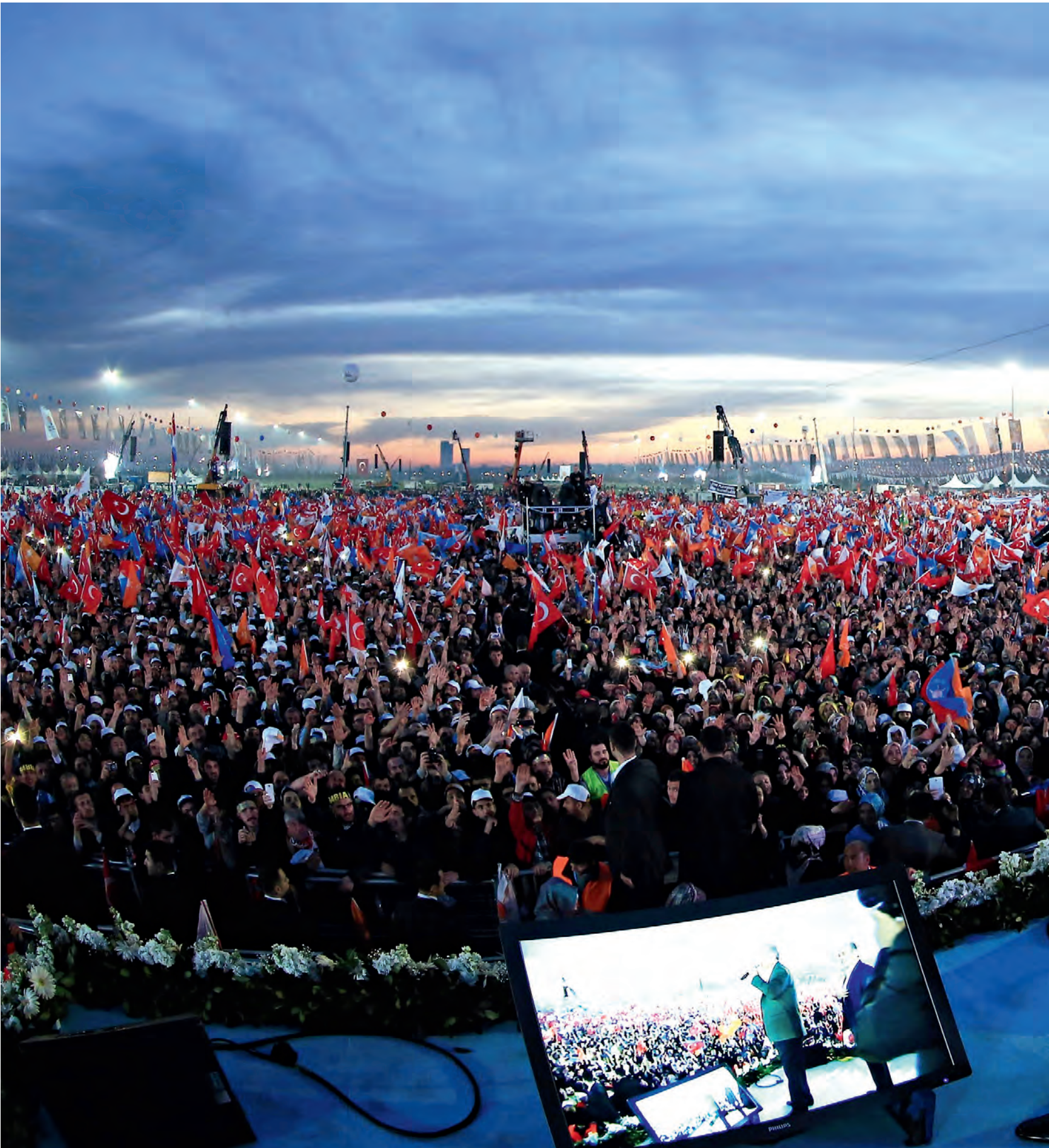
17- 27 Mart 2014 yerel seçimleri öncesinde, Ak Parti Genel Başkanı Recep Tayyip Erdoğan İstanbul Büyükşehir Belediye Başkan Adayı Kadir Topbaş ile İstanbul Yenikapı Meydanı'nda düzenlenen son seçim mitinginde