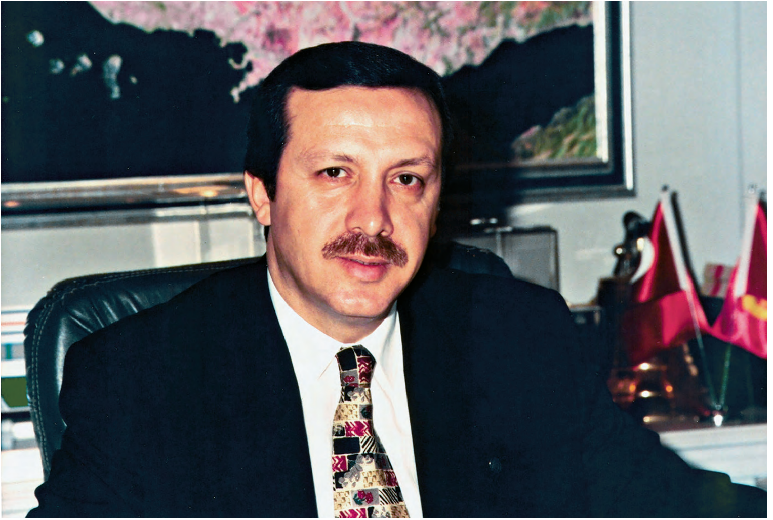
14- Recep Tayyip Erdoğan (27.03.1994-06.11.1998)

1994 İstanbul seçimlerinde tüm partilerin üzerinde durduğu konulara bakıldığında; su, trafik, çevre ve hava kirliliği, çöplerin toplanamaması gibi sorunlar başı çekmekteydi. Bu bağlamda, 1994 SHP İstanbul adayı olan Zülfü Livaneli'nin dikkat çeken en önemli projelerinden biri trafik sorununun çözülmesine yönelik olan "su altı köprüsü"ydü. SHP'nin bu projesinin özelliği, bu dönemde tartışılan üçüncü köprü ve su altı tüp geçit projelerine bir alternatif olarak planlanmıştı. Su altı köprüsünün "su altı tüp geçidi"ne göre tercih edilmesinin sebebi, maliyetinin daha ucuz olarak yapılabilecek olmasıydı. Su sorunu için suni yöntemlerle yapay yağışlar oluşturmak, ulaşımda raylı sistem ve alt ve üst geçitlere ağırlık vermek, üçüncü köprü'nün bir an önce devreye girmesi için çalışmalar başlatmak, çöplerin hijyenik olarak taşınması ve gömme yöntemi ile bertaraf edilmesi için yeni sistemler kurmak, hava kirliliğinde ise, filtreleme sistemi ile çözüm geliştirmek Livaneli'nin diğer projeleriydi. Livaneli, gazetelere verdiği ilanlarda kendisinden "bir sanat büyükelçisi" olarak bahsediyor ve dünya mediasında ve Türkiye'de kendisi hakkında yazılanlardan kolajlarla