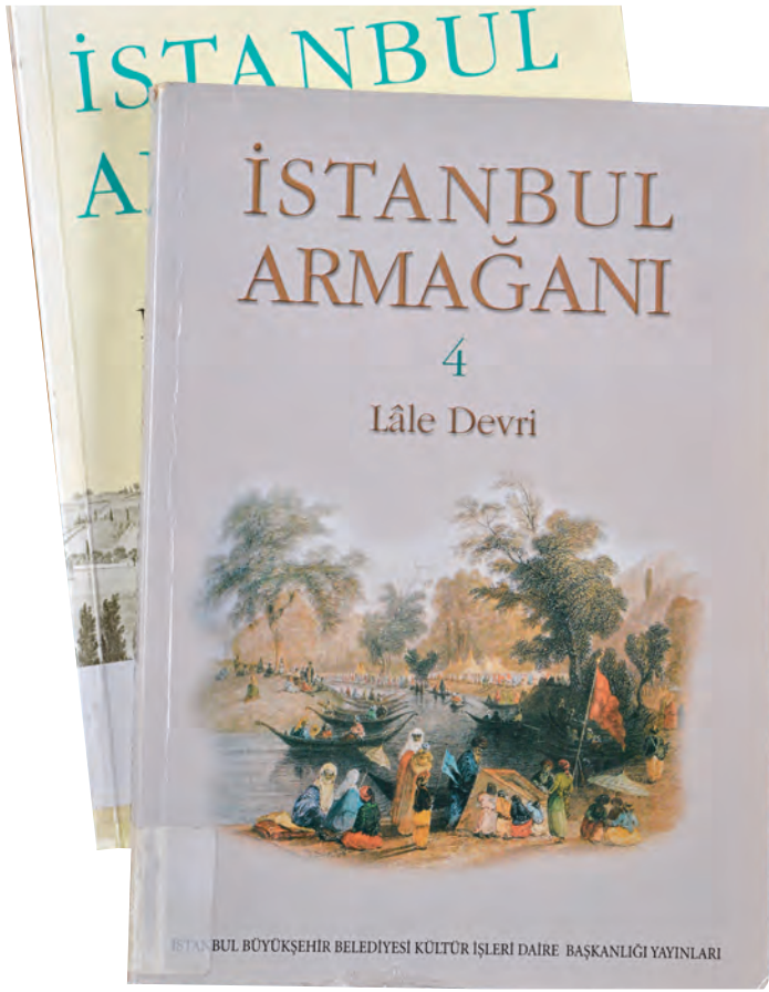
6- İstanbul Armağanı

Renkleri”, 4. cildi de “Lale Devri” ile ilgili olarak kaleme alınmış makalelerden oluşmaktadır.