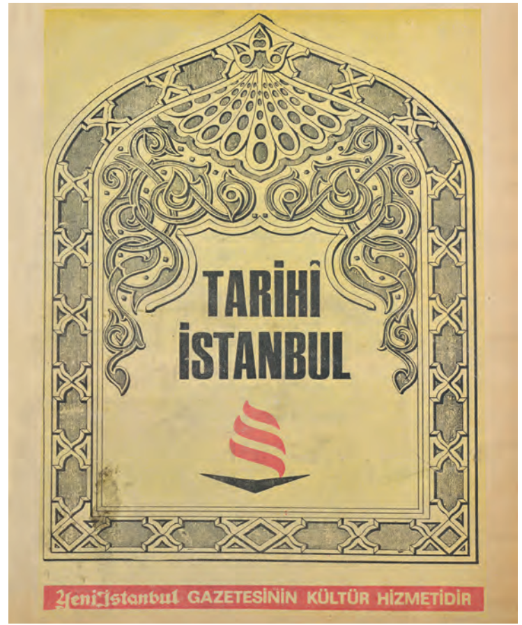
4- Tarihî İstanbul

Yeni İstanbul gazetesinin ilavesi olarak fasiküller hâlinde yayımlanmış, esas itibarıyla İstanbul'da bulunun