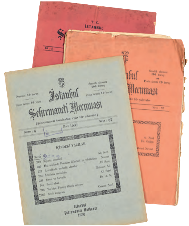
1b- İstanbul Şehremaneti Mecmuası

Derginin tatile girmeden önceki son sayılarında Sermet Muhtar Alus ve Rıza Çavdarlı ile Reşat Ekrem Koçu'nun İstanbul'un mesire yerleri ve Boğaziçi ile ilgili