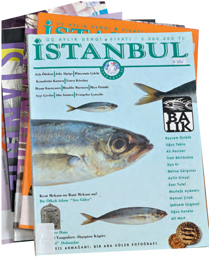
5- İstanbul dergisi

hazırlanmakta olup yazılarda ele alınan konularla ilgili eski-yeni çeşitli fotoğraf, resim, gravür, karikatür ve kartpostallarla da zenginleştirilmiştir. Bu tür dergilerin çoğunda olduğu gibi şehrin geçmişine ait inceleme ve araştırmalar burada da yoğun olmakla beraber, derginin “Gündem” başlıklı bölümlerinde ise daha çok İstanbul’un güncel problemleri ele alınmış ve bu çerçevede gerçekleştirilen mini oturumlarla söz konusu problemler tartışılmış ve bazı çözüm yolları teklif edilmiştir. Çeşitli sayılarda ayrıca İstanbul’la ilgili yeni yayımlanan kitaplar tanıtılmış, sergi ve konser haberlerine yer verilmiş, bazı semtlerin yerli halkından tanınmış kişilerle röportajlar yapılmış, şehrin tarihî özellikteki bazı semtlerine gerçekleştirilen gezilere ait izlenimlerle şehirle özdeşleşmiş bazı yapılar da tanıtılmıştır. Daha ziyade entelektüel çevrelerde şehir ve şehirli bilincinin uyanmasında katkısı gözlenen İstanbul dergisi, öteden beri İstanbul’la ilgili olarak yayımlanan en uzun ömürlü yayın organlarından biri olma özelliğine de sahiptir.