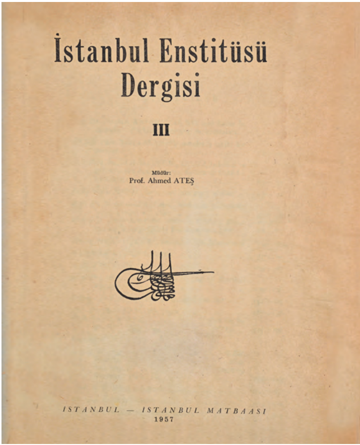
3- İstanbul Enstitüsü Dergisi