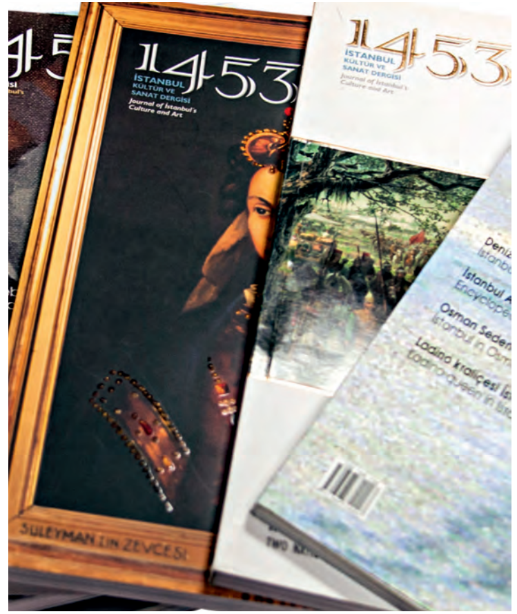
8- 1453 İstanbul Kültür ve Sanat Dergisi

İstanbul Beyoğlu Belediyesi tarafından yayımlanmakta olan Beyoğlu dergisi, başta Beyoğlu, Galata, Tophane, Cihangir, Tarlabası, Tepebaşı ve Kasımpaşa dâhil olmak üzere, bölgenin belli başlı tarihî binalarıyla, müze, kütüphane, okul, sefarethâne, lokanta, pastane ve eğlence yerleriyle otellerinin de tanıtıldığı, semtlerin yerlisi tanınmış şahsiyetleriyle, bir kısım esnafıyla röportajların da yer aldığı görsel ağırlıklı, renkli ve resimli bir yayın organı olarak yayımına devam etmektedir. Söz konusu tanıtıcı röportaj-yazılar arasında Galatasaray Lisesi, İnci Pastanesi, Çukurcuma, Hacı Abdullah Lokantası, Galata Mevlevihanesi, Balık Pazarı, Tophane Çeşmesi, Galata Kulesi, Pera Palas, Asmalımescit, Yeşilçam Sokağı, Tramvay İdaresi, Yeraltı Camii, Arap Camii, Markiz Pastanesi, Doğançay Müzesi, Saint Benoit Lisesi, Cihangir Camii, Pera Müzesi, Tophane-i Âmire,