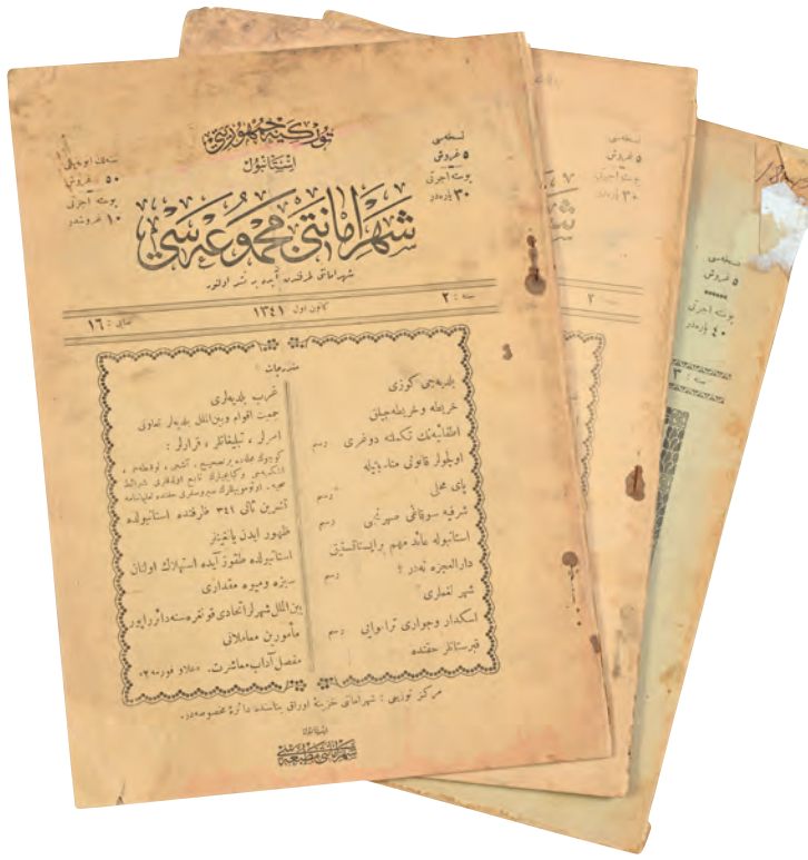
1a- İstanbul Şehremaneti Mecmuası, eski harfli