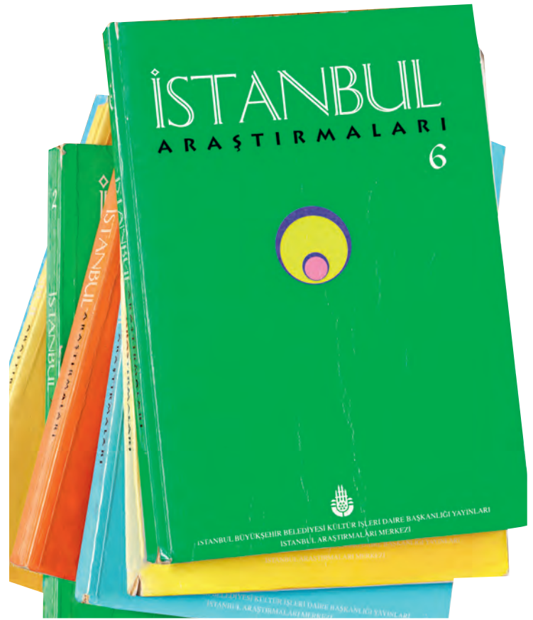
7- İstanbul Araştırmaları

İstanbul Büyük Şehir Belediyesi Kültür İşleri Daire Başkanlığı İstanbul Araştırmaları Merkezi tarafından çıkarılan dergi, doğrudan doğruya İstanbul’un tarihi, sanatı, kültürü, sosyal hayatı, mimari eserleri, edebiyatı ile ilgili araştırma, inceleme ve denemelere yer veren tamamen ilmî mahiyette bir yayın organı hüviyetindedir. Dergide yer alan yazılar “Araştırmalar-Denemeler”, “İstanbul’dan Simalar”, “Pâytaht’tan-Doğu’dan-Bati’dan”,