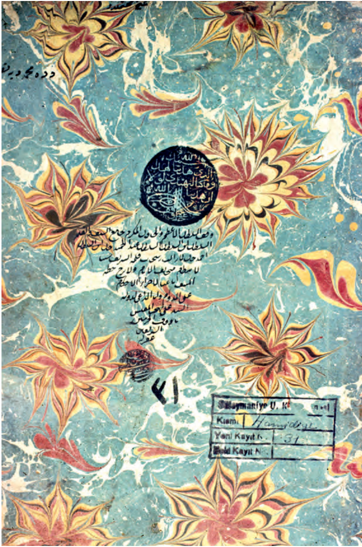
5- Hatib Mehmed Efendi'nin elinden çıkma hatib ebrusunun bir kitap kabında kullanılması

hercai menekşe, gelincik, gonca gül, kasımpatı, sümbül) yapılması başarılıymış (Resim 7); Okyay'ın öğrencisi Mustafa Düzgünman (d. 1920-ö. 1990) da bu çiçek çeşitlerine papatyayı eklemiştir. Çiçekli ebrular, sanat tarihimizde Necmeddin ebrusu adıyla tanır.