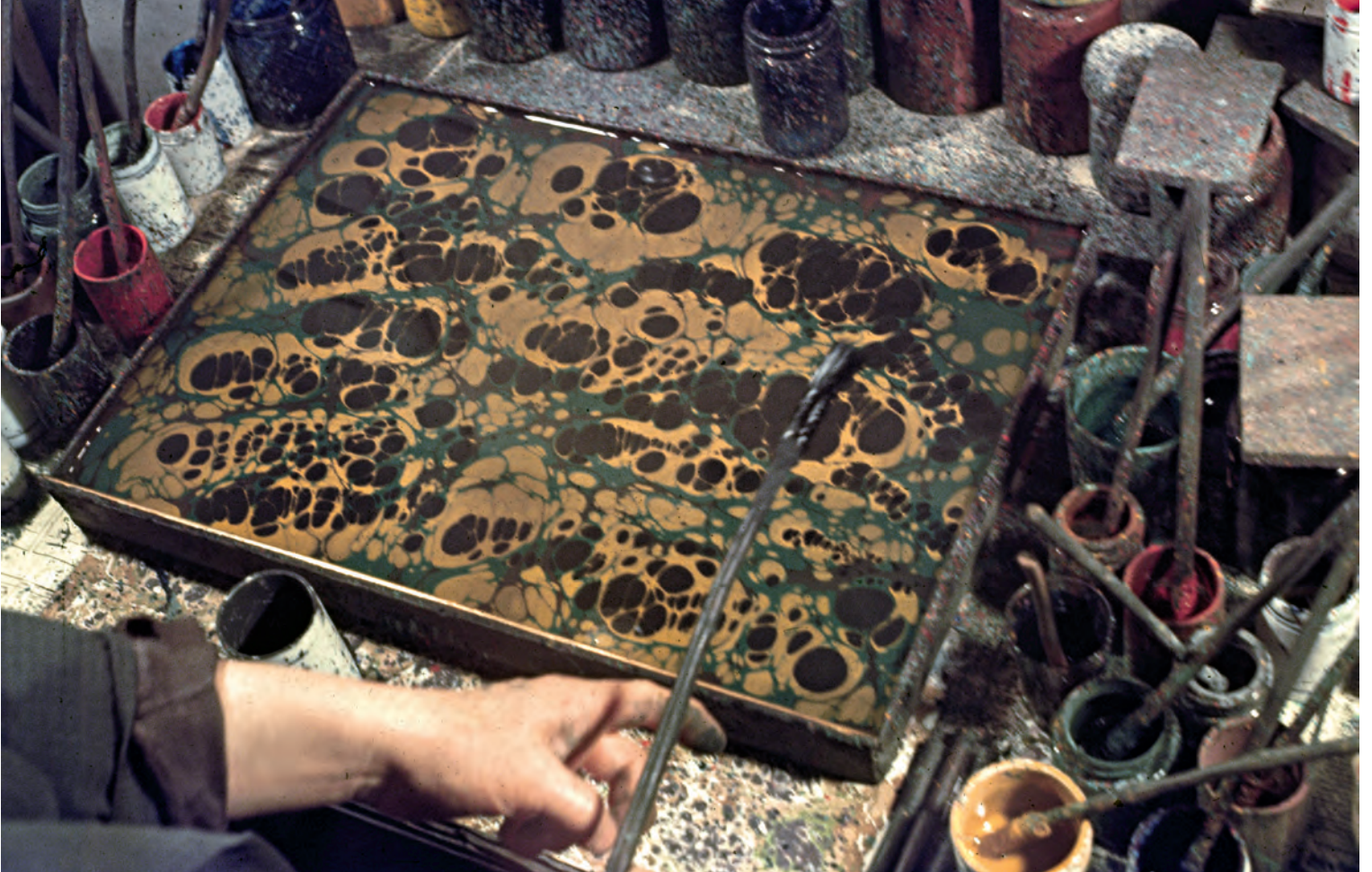
2- Mustafa Düzgünman tarafından teknede battal ebrusu hazırlanması

Tel çubuk: Serpilmiş boyalara şekil vermek için ince, boya damlatmak içinse kalınca tel çubuk kullanılır. Eskiden bu maksatla tek atkuyruğu kılından faydalanılmıştır.