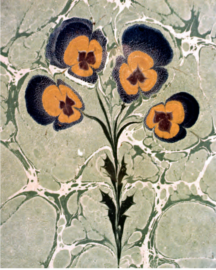
8- Mustafa Düzgünman'ın hercâi menekşe ebrusu