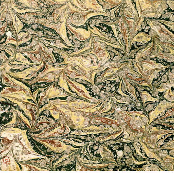
3- Hatib Mehmed Efendi'nin şal örneği ebrusu