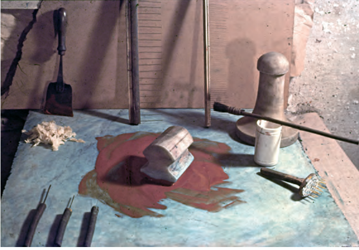
1- Ebru imalinde kullanılan alet ve malzeme (Metin içinde tanıtılmaktadır)

düzgün olmayan plakalar veya şeritler hâlidir. Suda bekletilerek miktarına göre 1/100 nispetinde ve boza koyuluğunda erimesi sağlanır ve bez bir torbadan süzülür. Bir tekne kitreli sudan yaklaşık 600 ebru kâğıdı çıkartılabilir. Kitre yerine keten tohumu , salep , ayva çekirdeği , hilbe ( boy tohumu ) gibi maddeler de Osmanlı ebruculuğunda kullanılmış, Batı dünyasında ise kitre yerine