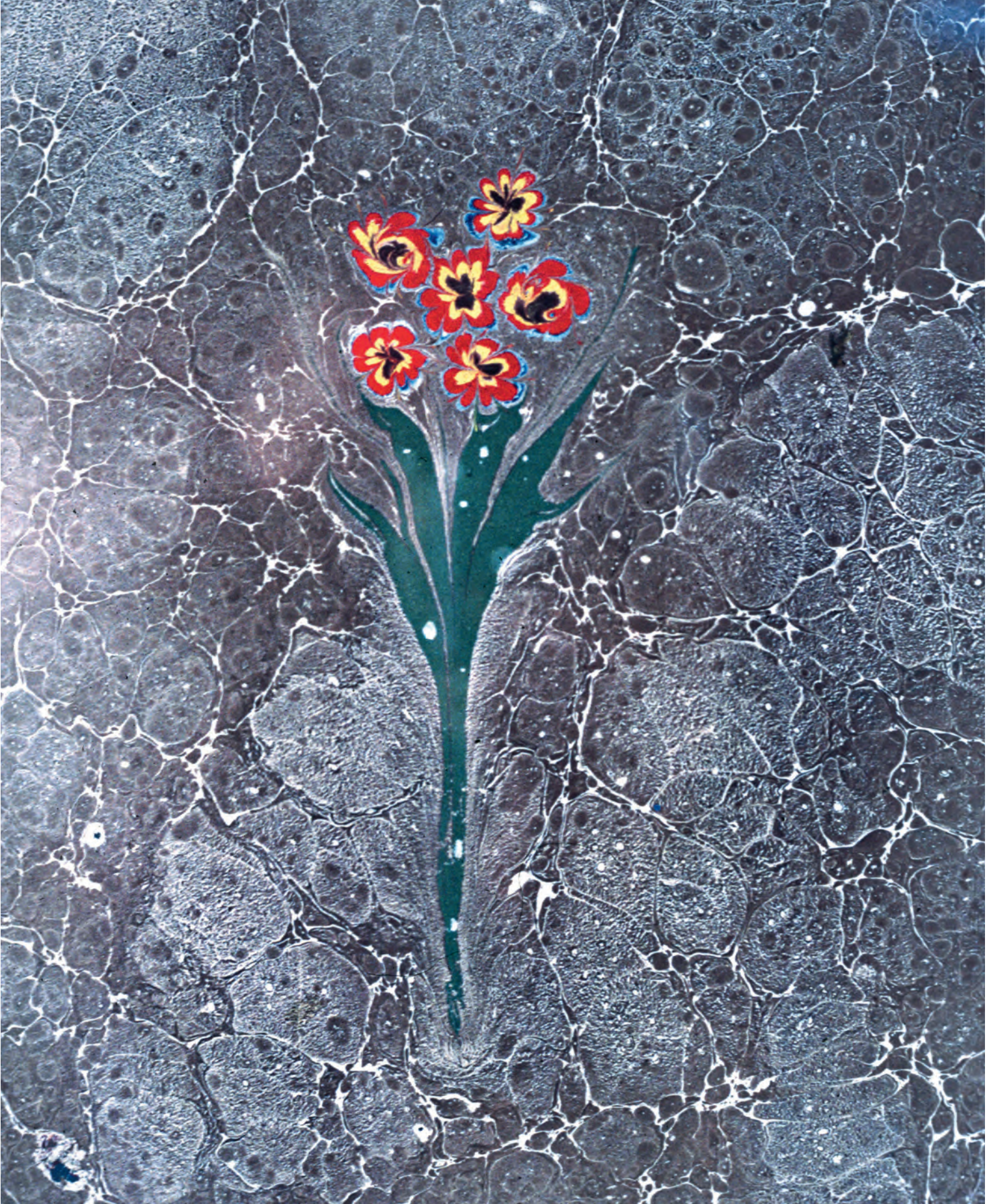
7- Necmeddin Okyay'ın çiçekli ebrusu