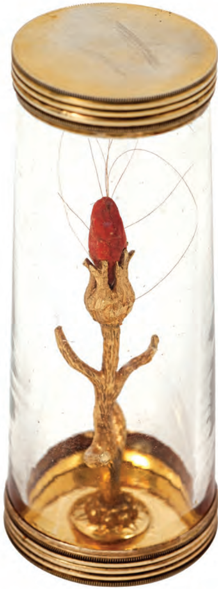
24- Sakal-ı Şerif

birinin başına bir tas su dökermiş. Hamam merasiminden sonra, öğle namazını müteakiben cemaatle dört rekât “husemâ” (Allah, Peygamber ve Ehli-beyt düşmanlarına muhalefet) namazı kılınır, Kur’an okunur, dualar edilir ve Hz. Hasan ve Hz. Hüseyin’in ruhu için şifa niyetine su dağıtılır, bu sudan alan kişiler hastalarına içirirlermiş. 55 Sünbül Efendi, Halvetî şeyhi olduğundan, tekke ve türbenin bulunduğu mekân Halvetîlerce özellikle ziyaret edilmiştir. 56