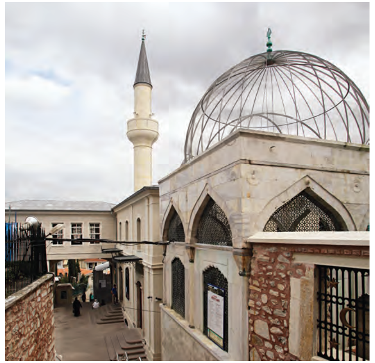
14- Aziz Mahmud Hüdayî Asitanesi

Türbe, İstanbul içinden ve Anadolu'dan gelen pek çok kişi tarafından geçmişte olduğu gibi bugün de ziyaret edilmektedir. Bireysel olarak ziyaret edildiği gibi türbe ziyaretleri çerçevesinde turlarla gelenler tarafından da gruplar hâlinde ziyaret edilmektedir. Türbeye hemen