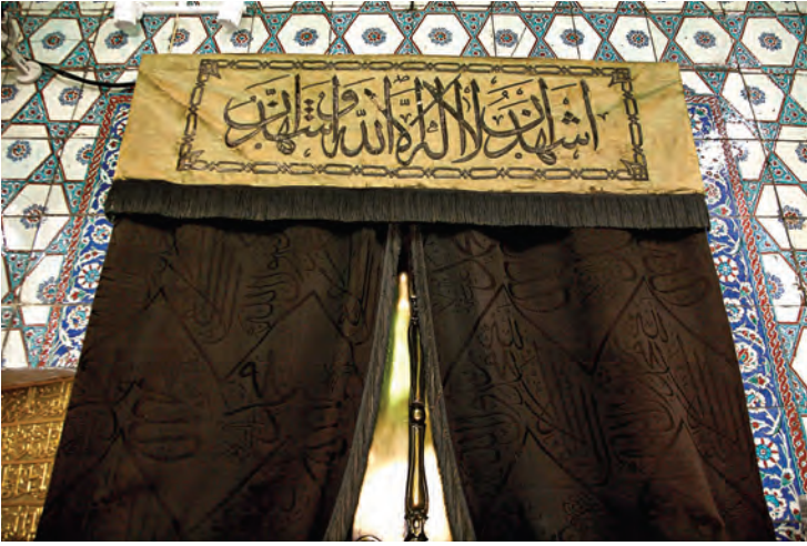
11- I. Dünya savaşı yıllarında, Surre-i hümayun ile gönderilen, ancak Mekke-i Mükerreme'ye ulaştırılmayınca Ebû Eyyüb el-Ensârî'nin Türbesi'ndeki pencerelelere asılan Kabe örtüsü

Osmanlı'dan günümüze, hacca gideceklerin Hz. Peygamber'in mihmandarı Eyüp Sultan Hazretlerinin türbesini ziyaret edip dua etmesi önemli bir gelenek olmuştur. 23 Diğer iki önemli gelenek ise sünnet çocuklarının ve gelinlerin burayı ziyaret etmesidir. Eyüp Sultan Türbesi, İstanbul'da sünnet olan çocukların ziyaret ettiği türbelerin başında gelmektedir. Aileler çocuklarını buraya getirerek onların hayırlı evlatlar olmaları, huzurlu bir geleceğe kavuşmaları için dua ederler.