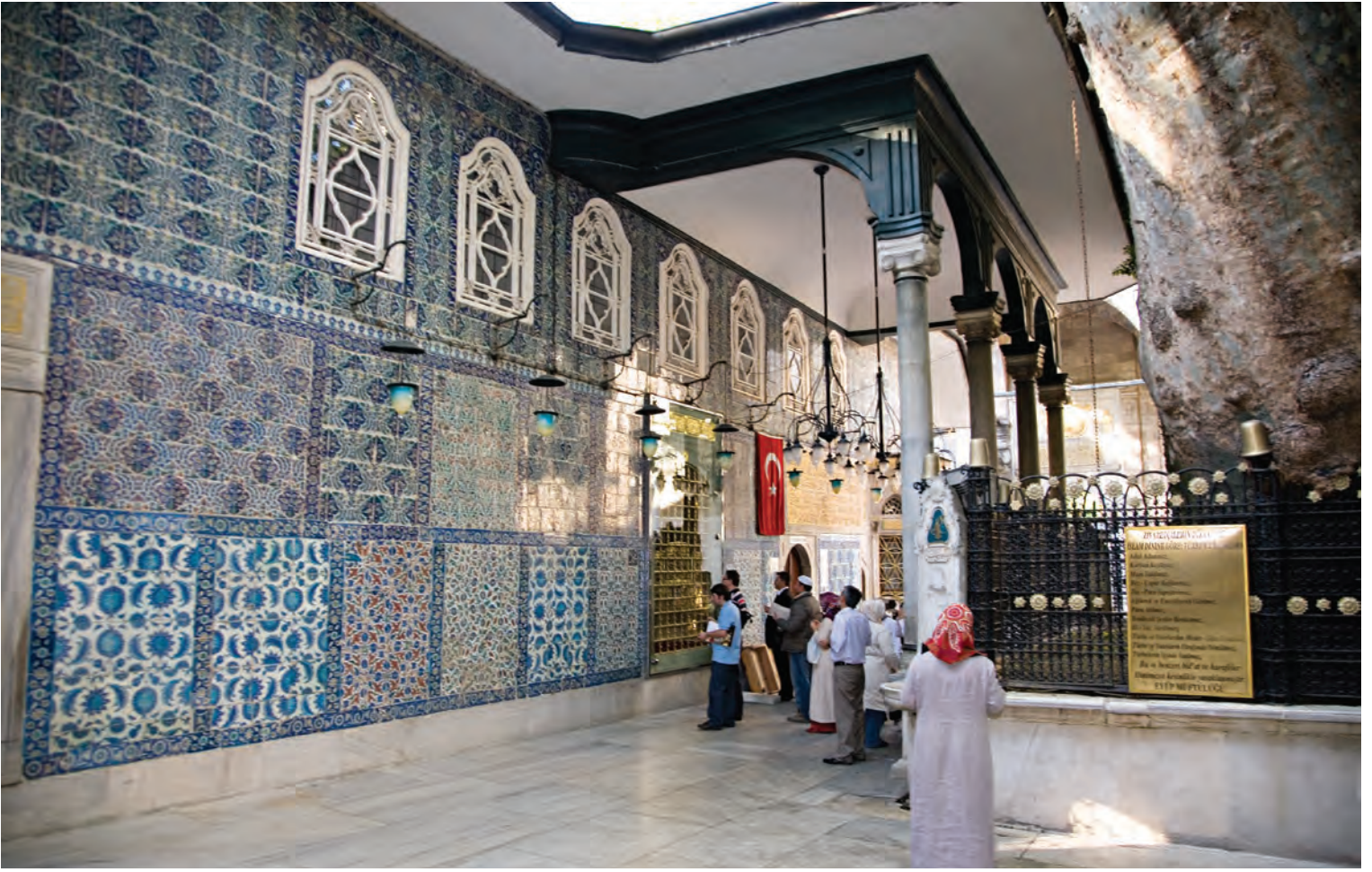
3- Eyüp Sultan Türbesi