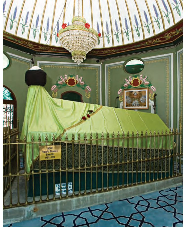
23- Sümbül Efendi'nin sandukası

hâlde yürüyemeyen çocuklar ya da nazardan korumak için bebekler anne veya babalarının kucağında dualarla türbenin etrafında gezdirilmektedir. Sanatçılar, futbolcular ve milletvekilleri de dâhil olmak üzere toplumun her kesiminden insanlar burayı ziyaret etmektedir. Üniversite ve liseye giriş sınavlarının olduğu zamanlarda özellikle öğrenciler bu türbeyi ziyaret etmektedir. 52