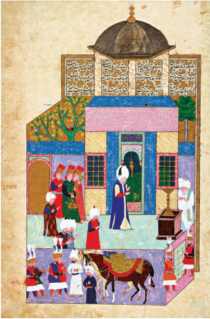
2- Kanunî Sultan Süleyman'ın Eyüp Sultan Türbesi'ni ziyareti

nispesinde yeniden şekillendirilmiştir. 10 İstanbul'da sayısı tam olarak bilinmemekle birlikte, yaklaşık 500 türbe bulunmaktadır. 11 Araştırmalar, Türk halkının yaklaşık yarısının türbeleri ziyaret ettiğini göstermektedir. Mesela 2000 yılında Toprak ve Çarkoğlu, 12 halkın %52'sinin türbe ziyaretinde bulunduğunu; Çarkoğlu ve Kalaycıoğlu 13 ise halkın %41'inin yılda en az bir kere türbeye gittiğini ortaya çıkarmıştır. Öyle anlaşılıyor ki gerek İstanbul'da gerek Türkiye'de türbe ziyaretleri halkın dinî yaşantısının ayrılmaz bir parçasıdır. Pek çok kişi dinî sebeplerle bu mekânları ziyaret etmekte, yine pek çok kişi için ziyaretler, hayatı dinin istediği şekilde devam ettirmede motive