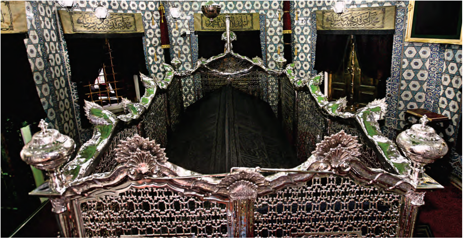
7- Ebü Eyyüb el-Ensari'nin sandukası ve III. Selim'in yaptırdığı som gümüş şebekesi