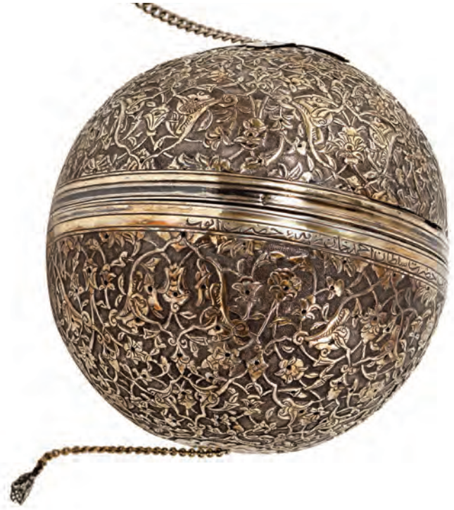
12- Sultan I. Ahmed tarafından Eyüp Sultan Türbesi'ne vakfedilen buhurdan (İstanbul Türbeler ve Müzeler Müdürlüğü)

Yaşadığı dönemde sekiz farklı Osmanlı padişahının hükümdarlığına tanık olmuştur. Devrinde hem halkın hem de sultanların sevgisini kazanan Hüdayî, "sahib-i zaman", "padişahlar şeyhi" gibi unvanlarla anılmıştır. Yaşadığı dönemin padişahlarından III. Murad, I. Ahmed ve II. Osman'a mektuplar yazarak onlara öğütler vermiştir. I. Ahmed devrinde Sultanahmet Camii'nin temel atma töreninde duayı Hüdayî Hazretleri yapmıştır. IV. Murad tahta çıkacağında Eyüp Sultan'da padişahlık kılıcını devrin en saygın şeyhi olarak Aziz Mahmud Hüdayî kuşatmıştır. Hüdayî, 1628'de vefat etmiş, bugün türbesinin bulunduğu yere defnedilmiştir. Ölümünden sonra da dergâhı ve türbesi hem saray ahali hem de halk tarafından ziyaret edilmiştir. 26