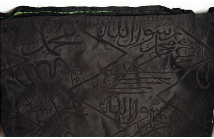
17- Kabe örtüsü

hapishaneden kurtar. Bazı hastalıkların çaresi bendedir.” diye seslenir. Merkez Efendi, namazdan hemen sonra talebelerine, “Burayı kazınız, burada sıtmalılara şifa olacak bir su var.” der. Talebeler burayı kazınca yerden kırmızı renkte bir su fışkırır. Daha sonra buraya bir kuyu yaparlar. Halk tarafından buraya “Niyet Kuyusu” adı verilir, bu kuyudan su içen sıtma hastalarının iyileşeceğine inanılır. 36 Merkez Efendi’nin halk tarafından hekim veli olarak bilinmesi, hastaları ziyaret ederek onlara dua etmesi ve türbesinin yakınında şifalı olduğuna inanılan bir kuyu olması sebebiyle hastalıklarına şifalar arayan kimseler tarafından asırlardır ziyaret edilmektedir.