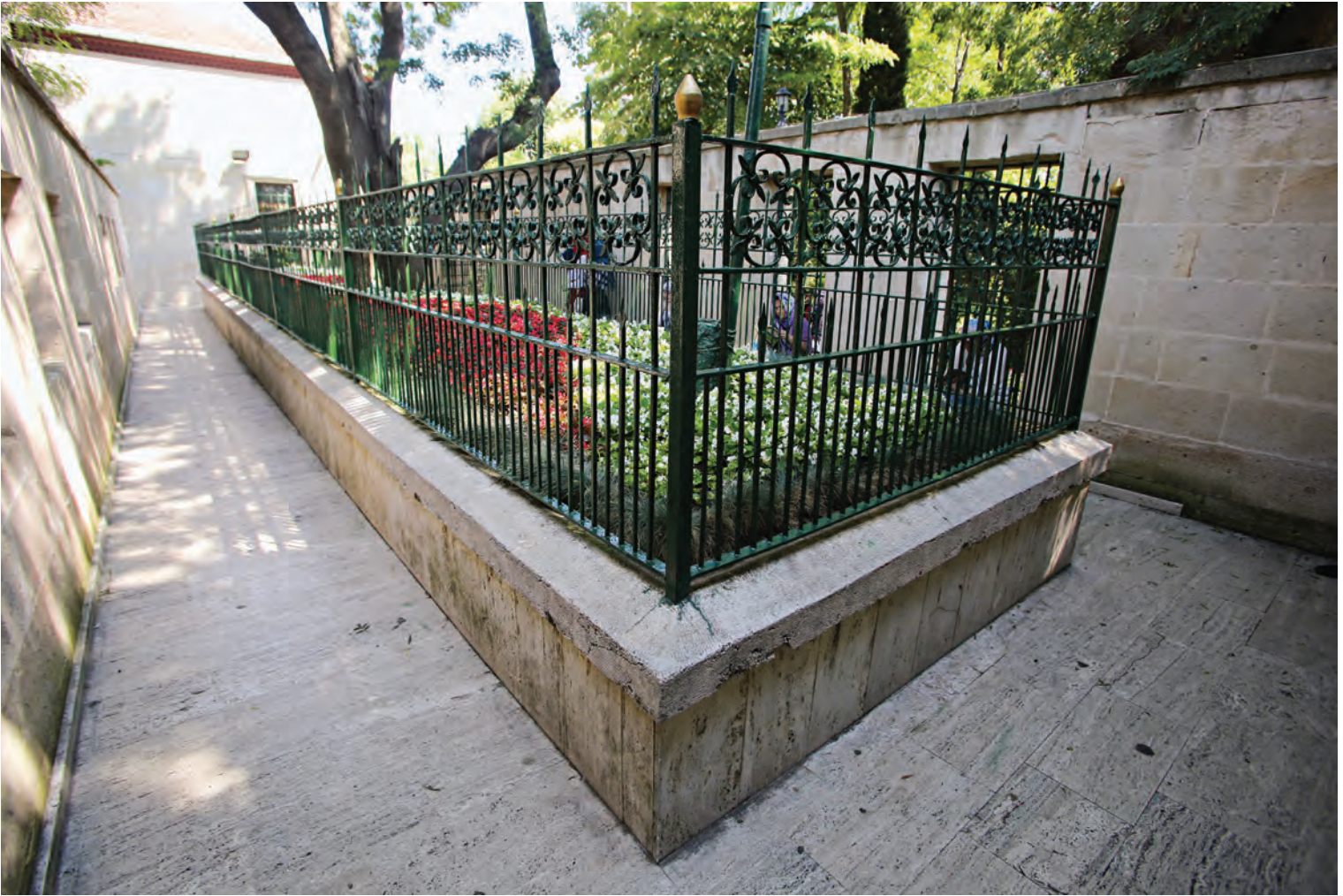
21- Hz. Yûşâ'nın mezarı

dinî inançlara sahip uygarlıklar tarafından bu tepeye tapınaklar inşa edilmiştir. Hz. Yûşâ'nın kabrinin Beşiktaşlı Yahya Efendi tarafından ilahi keşif yoluyla belirlenmesinden sonra burası İstanbul'daki Müslüman halkın da başlıca ziyaret yerlerinden biri olmuştur. Osmanlı döneminde halk, hem bireysel olarak hem de toplu hâlde türbenin bulunduğu Yûşâ Tepesi'ni düzenli olarak ziyaret etmiştir. Topluca yapılan büyük ziyaretler, genellikle temmuz ve ağustos aylarında cuma günleri yapılmış, ziyaretler bir hafta önceden civar köylere duyurulmuş, böylece ziyaretçi sayısı artmıştır. 48 Asırlardır Yûşâ Hazretlerine halkın büyük bir sevgi ve saygısı olmuştur. Özellikle Beykozlular Hz. Yûşâ'yı, Beykoz'un manevi koruyucusu olarak görmüşlerdir. 49 Zaten Hz. Yûşâ, İstanbul Boğazı'nı koruyan dört manevi bekçiden birisi kabul edilir. 50