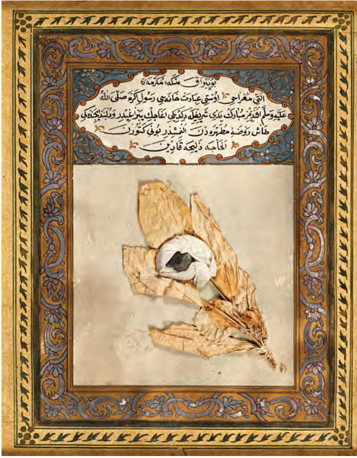
22- İstanbul türbelerinde muhafaza edilen, Hz. Peygamber'in Medine'de diktiği hurma ağacının yaprağı ve Ravza-ı mutahhara'dan (türbesi) bir taş parçası (İstanbul Türbeler ve Müzeler Müdürlüğü)