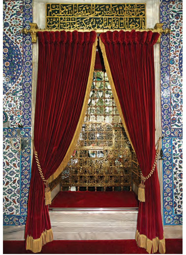
10- Ziyaretçilerin Eyyüb el-Ensari'nin sandukasını görerek dua edecekleri şekilde planlanan Niyaz penceresinin türbenin içinden görünümü

Eyüpsultan Türbesi, yüz yıllardır hem İstanbul'dan hem de İstanbul dışından gelen pek çok Müslüman tarafından büyük sahabenin manevi varlığına hürmeten, vefa duygusuyla ziyaret edilmektedir. Hatta türbenin kapalı olduğu 1923-1950 yılları arasında bile, halk burayı ziyaret etmeye ve hacet kapısında durarak dua etmeye devam etmiştir. Osmanlılar döneminde gündüz ziyareti yetmeyince türbenin pazartesi ve Kadir geceleri de ziyarete açıldığı dönemler olmuştur. 22 Günümüzde sadece gündüzleri ziyaret yapılmaktadır. Türbe, hemen hemen her gün ziyaret edilse de ziyaretler daha çok cuma, kandil-arife günleri ve ramazan ayında yoğunlaşır. Türbe, İstanbul dışından, turlarla gelen grupların da başlıca uğrak yerlerindedir. Ramazan ayında ailece türbeyi ziyarete gelip iftarı burada yapan insanların sayısı oldukça fazladır. Sabah namazlarını Eyüpsultan Camii'nde kılmak ve o vakitte kapalı olduğundan türbe dışından dua etmek bir gelenektir.