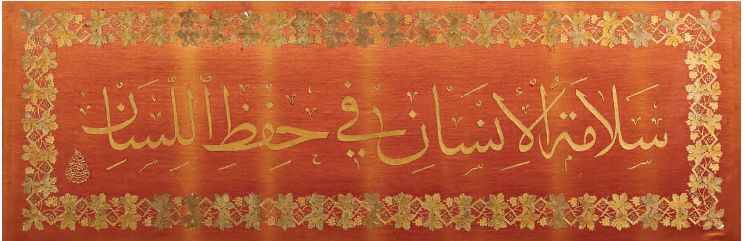
6- Sultan Abdülaziz'in Eyüp Sultan Türbesi'ndeki hattı (İstanbul Türbeler ve Müzeler Müdürlüğü)