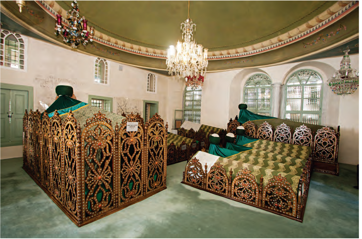
19- Yahya Efendi Türbesi

kesimlerden halk ve özellikle de denizciler ziyaret edip hediyeler getirerek dua talep ederlermiş. Bilhassa sefere çıkan ve seferden dönen gerek Müslüman gerekse Hristiyan gemiciler Yahya Efendi'ye uğrayıp hayır duasını alırlarmış. 41