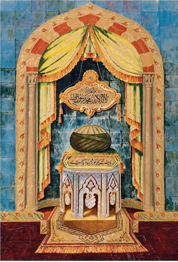
13- "Yâ Hazret-i Aziz Mahmud Hüdayî" yazılı levha (İstanbul Türbeler ve Müzeler Müdürlüğü)

rastlar. Hemen atından inip Hüdayî'nin elini öper ve atına binmesini rica eder. Bir müddet Hüdayî at sırtında, padişah da yaya olarak yürür. Kısa bir süre sonra Hüdayî bu duruma razı olmaz, "Sultanım! Sırf hocam Muhammed Üftâde'nin 'Padişahlar atının yanında yürüsün.' duası ve emri yerine gelsin diye ata bindim." diyerek attan iner ve sultanın atına binmesini ister. Üsküdarlı kayıkçılar, fırtınalı havalarda Üsküdar-Beşiktaş arasında vapurlar işlemezken, Üsküdar'dan Sirkeci tarafına rahatlıkla gidilebildiğine ve bu yolun "Hüdayî Yolu" olduğuna inanır ve bunu Hüdayî Hazretlerinin bir kerameti olarak yorarlar. 28