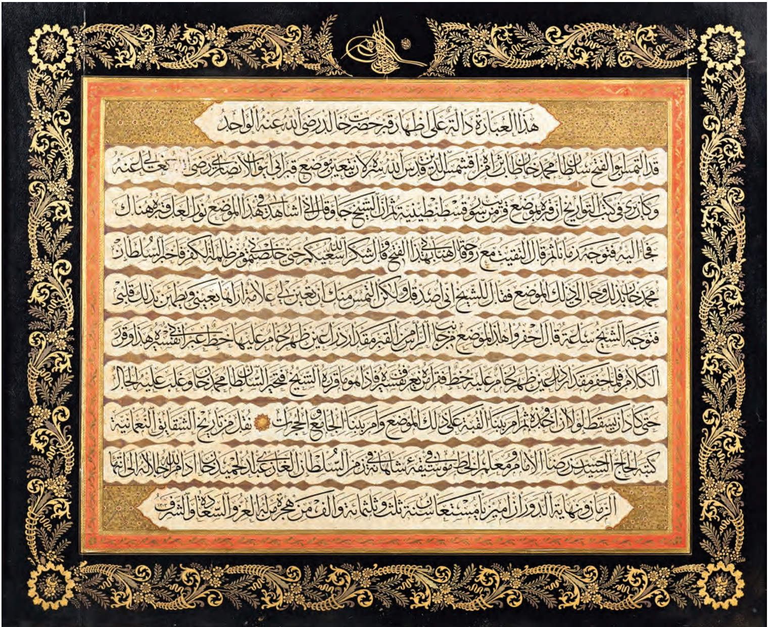
8- Sultan II. Abdülhamid döneminde hazırlanan Hz. Eyyüb el-Ensari'yle ilgili levha (hat: Seyyid Hasan Rıza) (İstanbul Türbeler ve Müzeler Müdürlüğü)

gösterilmiştir. Osmanlı padişahları, tahta çıkacakları zaman Hz. Muhammed'e olan saygılarının bir gereği olarak padişahlık kılıcını genellikle Eyüp Sultan Türbesi'nde, Hz. Peygamber'in mihmandarının manevi varlığı huzurunda kuşanmışlar, bunun için kutsal emanetler içerisinde yer alan kılıçlardan birini kullanmışlardır. Kılıç kuşanma (taklîd-i seyf), halkın da katıldığı, duaların edildiği, kurbanların kesildiği "Kılıç Alayı" denilen bir törenle yapılmış ve padişahlara kılıcı devrin şeyhülislamı veya en saygın din âlimi ya da mutasavvıfı kuşatmıştır. Böylece padişahlar hem bu büyük sahabenin manevi varlığı huzurunda Hz. Peygamber'e söz vermiş hem de idari güçlerini ve toplum üzerindeki saygınlıklarını