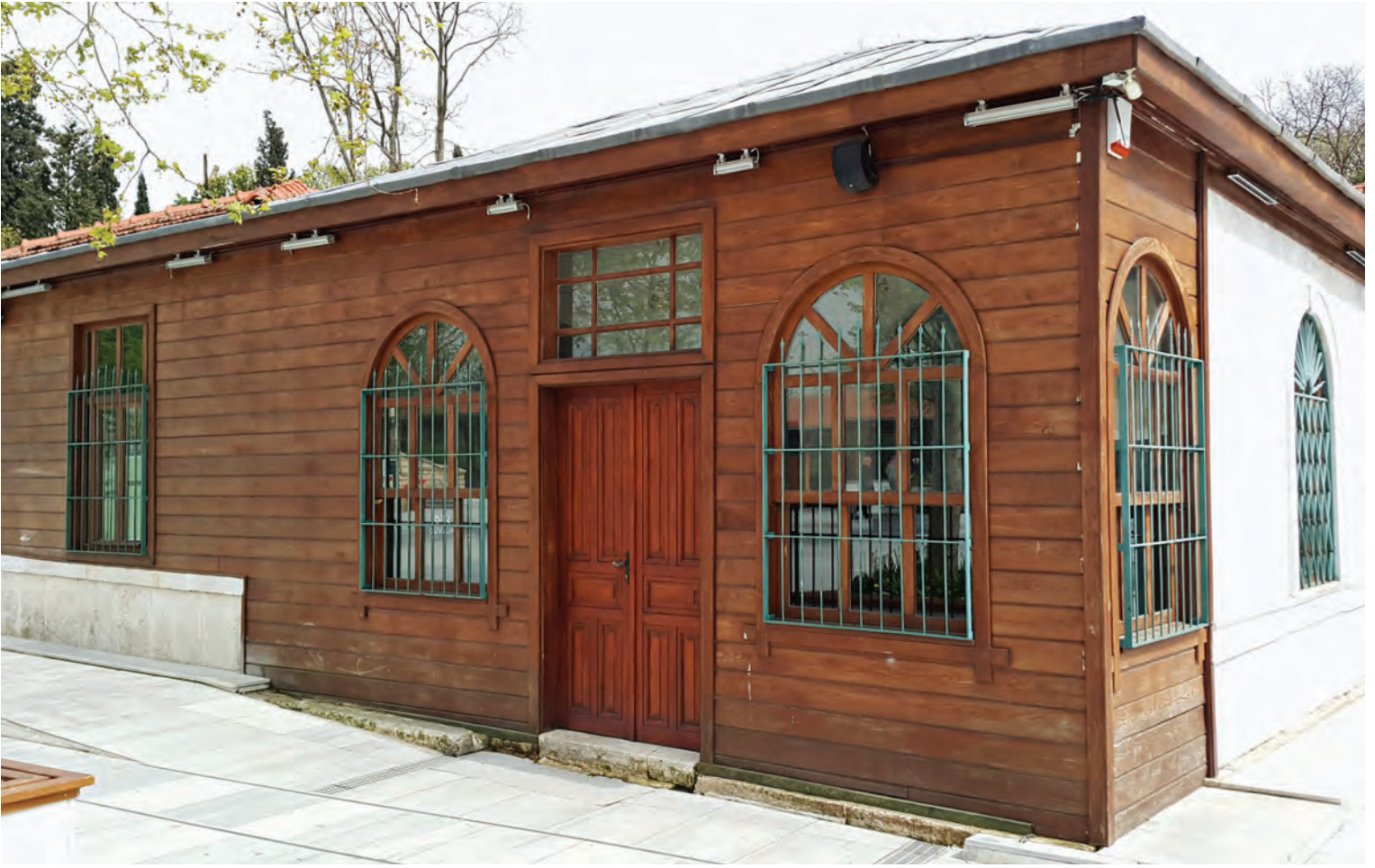
16- Merkez Efendi Türbesi

“Merkez Efendi” ismiyle tanınan mübarek zatın mezarı bulunmaktadır. Merkez Efendi, XV. yüzyıl Osmanlı âlim-evliyalarındandır. 1463 yılında Denizli’de doğmuştur. Denizli, Bursa ve İstanbul’da öğrenim gördükten sonra Amasya’ya giderek Halvetiye usulü tasavvuf eğitimi almıştır. Daha sonra İstanbul Kocamustafapaşa’da bulunan Şeyh Sümbül Efendi’ye bağlanmıştır. Farklı zaviyelerde Sümbül Efendi’nin halifesi olarak görev yaptıktan sonra, Sümbül Efendi’nin vefatı üzerine onun yerine şeyh olmuştur. Ayasofya ve Fatih camilerinde halka vaaz veren Merkez Efendi, hastaları ziyaret edip onlara dua etmesiyle meşhur olmuştur. Onun dua ettiği hastaların şifa bulduğuna inanılmıştır. 1522’de vefat eden Merkez Efendi, bugün türbesinin bulunduğu yere defnedilmiştir. Türbe, aynı adı taşıyan külliyein içerisinde yer almaktadır. Külliye, cami, türbe, çilehane, kuyu, şadırvan, mutfak, derviş hücreleri, selamlık, hünkâr köşkü ve hamamdan oluşmaktadır. 33