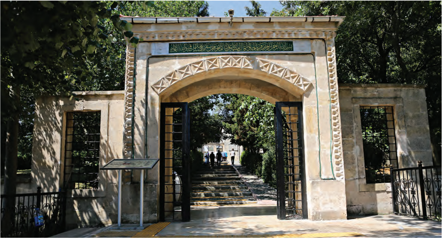
20- Hz. Yûşâ Türbesi'nin girişi

Kur'an okumakta ve dua etmektedir. Pek çok kişi burada edilen duaların kabul edildiğini, bu kutsal mekânda bulunmanın kendilerini rahatlattığını, manevi olarak kendilerini olgunlaştırdığını düşünmektedir. Bazı ziyaretçiler ise derterinin ve sıkıntılarının giderilmesi için burada dua ettiğini ve bu dualarının kabulü üzerine "vefa ziyareti" yaptığını belirtmektedir. Nadir de olsa bazı ziyaretçiler zaman zaman mezarın kenarında bulunan tespihleri alıp "lafzatullah" çekerek daha sonra tespihi bereket ve huzur vermesi için evine götürmekte ve bir müddet sonra getirip yerine koymaktadır. 43