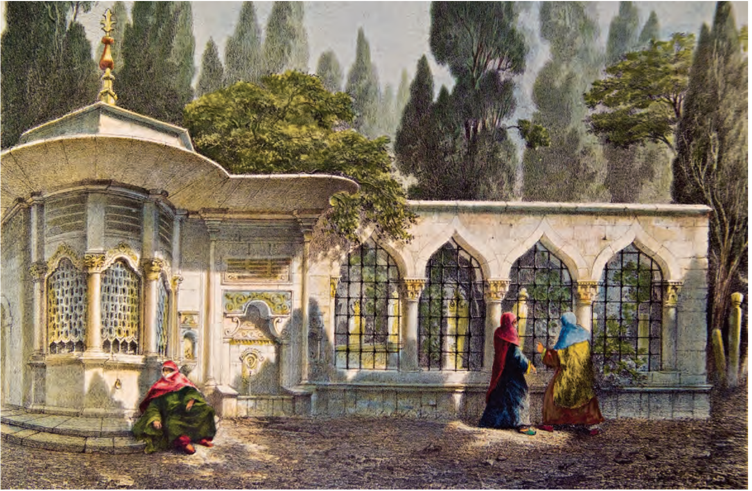
1- Üsküdar'da kadınların kabir ziyareti (Flandin)

Hız. Peygamber'in mezarı bir anlamda model olmuştur. Şöyle ki, Hız. Peygamber'in mezarı evine yapılmış ve daha sonraki süreçte de ilavelerle Mescid-i Nebevî kabri bütünüyle kuşatmıştır. Bu yönden Hız. Muhammed'in kabri ve Mescid-i Nebevî pek çok veli türbesine örneklik etmiştir. 8 Bu bağlamda ülkemizde özellikle İstanbul'da pek çok sahabe, fetih şehidi, padişah ve veli kabrine bazen devlet adamları ve resmî kurumlar bazen de hayır kurumları tarafından türbeler inşa edilmiştir. Bu türbeler, yüzyıllardır başta mekânın İslamlaşması olmak üzere pek çok fonksiyon icra etmişlerdir. Türbelerin yapımı ve idamesi, türbe ziyaretleri ve türbe bünyesinde gerçekleştirilen merasimler, Müslüman halk tarafından geçmişten günümüze her daim teveccüh bulmuş, dinî gayelerle ve dinî kurallar çerçevesinde bu ziyaretler asırlardır gerçekleştirilmiştir. Diğer taraftan bazı türbelerin İstanbul'un en güzel mekânlarında yer alması tarih içerisinde dinî gayelerle değil hafta