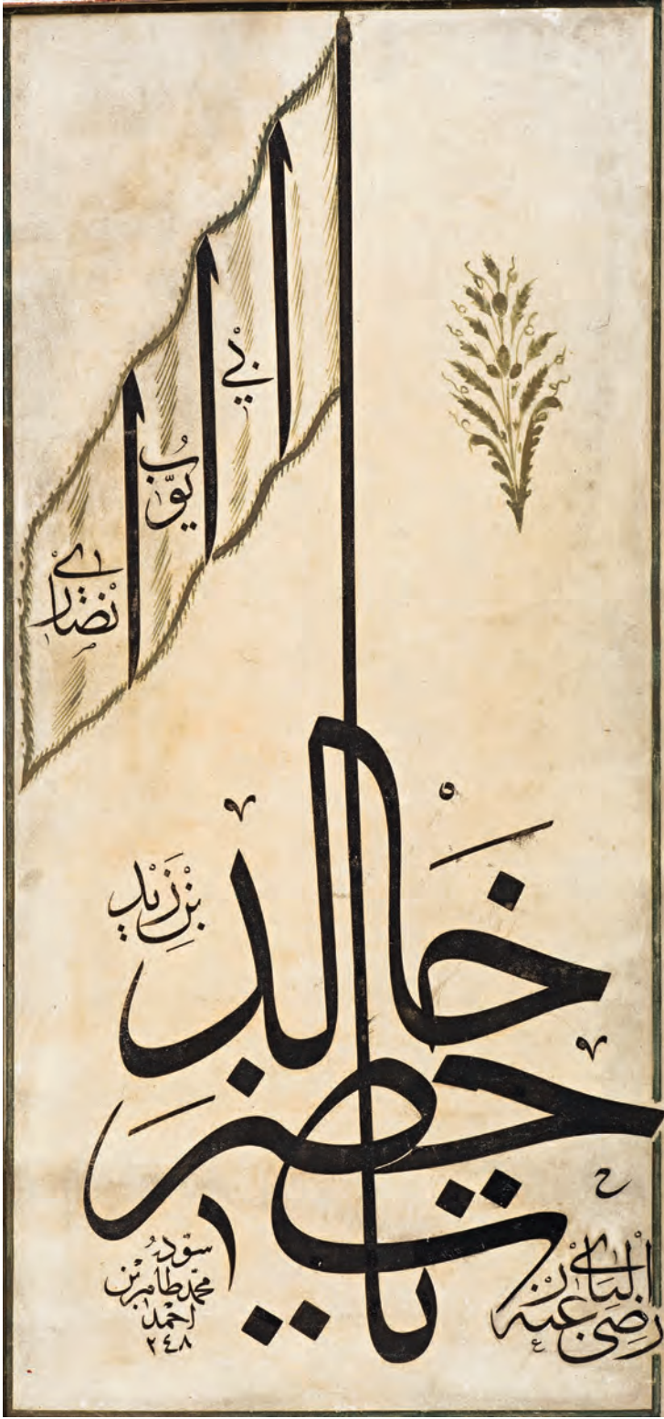
9- Eyüp Sultan'ın ismine hazırlanan ve türbeye vakfedilen 1248/1832-1833 tarihli hat levhası: Ya Hazreti Halid Bin Zeyd Radyallahu anh (İstanbul Türbeler ve Müzeler Müdürlüğü)

ve pek çok türbenin içerisinde bulunduğu ölümle hayatın birlikteliğini sembolize eden bir mekân görüntüsü vermektedir. 21