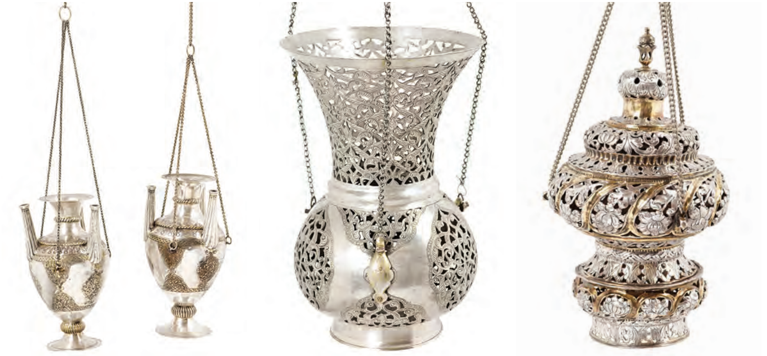
18- Türbelere vakfedilen kandiller

Ayrıca türbeye gelenlerin çoğu, türbe yakınındaki camide iki rekât namaz da kılarlar. Ancak bazı ziyaretçilerin türbede şeker ve lokum dağıttığına, türbeyi tavaf ettiğine, hasta olan yakınlarını türbeye getirdiğine nadiren de olsa rastlanmaktadır.