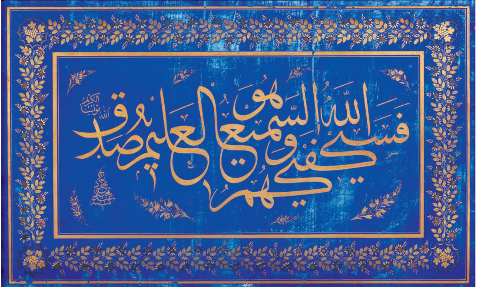
5- Sultan Abdülmecid'in Eyüp Sultan Türbesi'ndeki hattı (İstanbul Türbeler ve Müzeler Müdürlüğü)