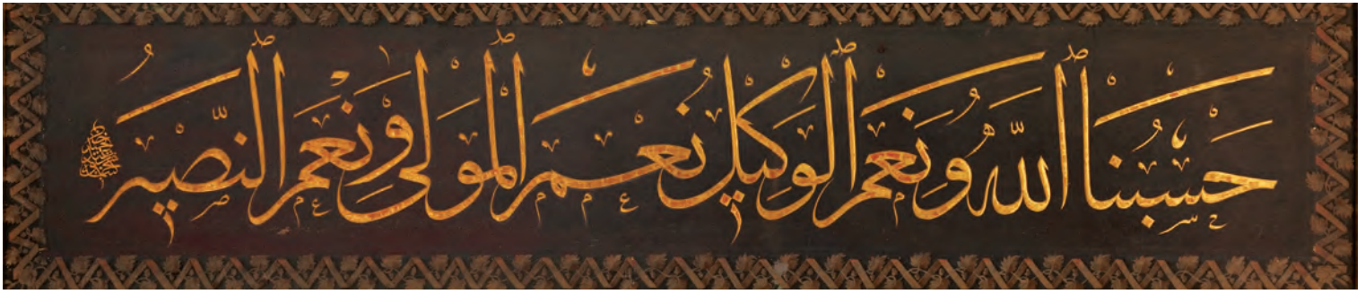
4- Sultan II. Mahmud'un Eyüp Sultan Türbesi'ndeki hattı (İstanbul Türbeler ve Müzeler Müdürlüğü)