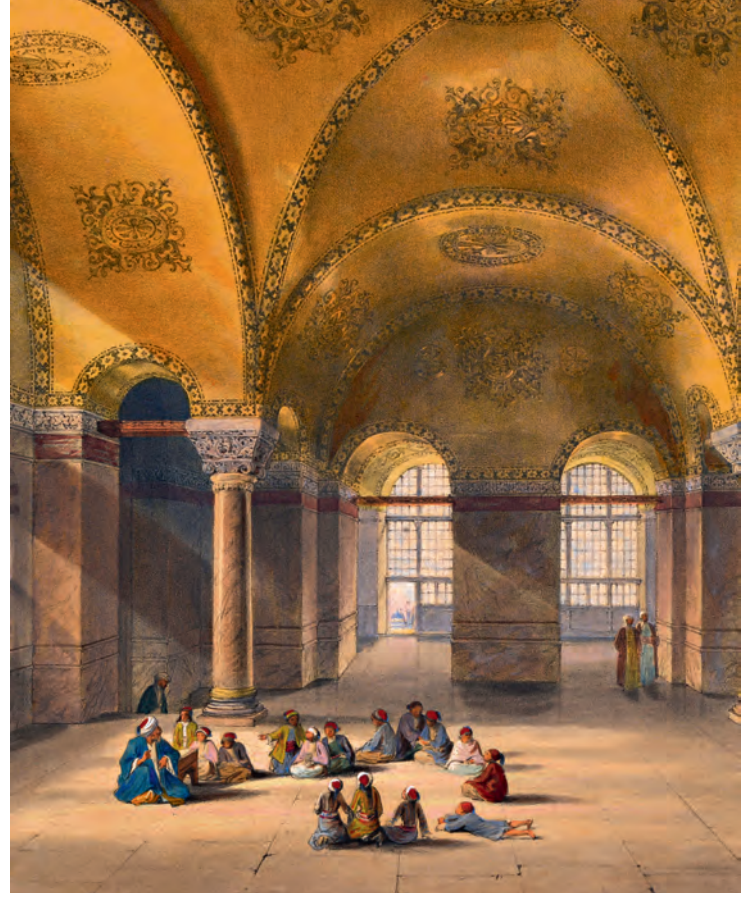
5- Ayasofya Camii'nde çocukların ders halkası (Fossati)

Gülbank metinleri mahallî bazı farklılıklar göstermesinin yanında yer yer değişikliklere de sahip olarak irticalen bir nevi beste ile okunmaktaysa da bu okuyuş vaktiyle tespit edilemediğinden, uygulama ortadan kalktıktan sonra unutulmuş ve günümüze de notası ulaşmamıştır. Gülbankler genellikle törenlerin büyük bir katılımı okulda gerçekleştirilen kısmında okunursa da, öğrencinin bir tekke mensubunun çocuğu olması gibi özel