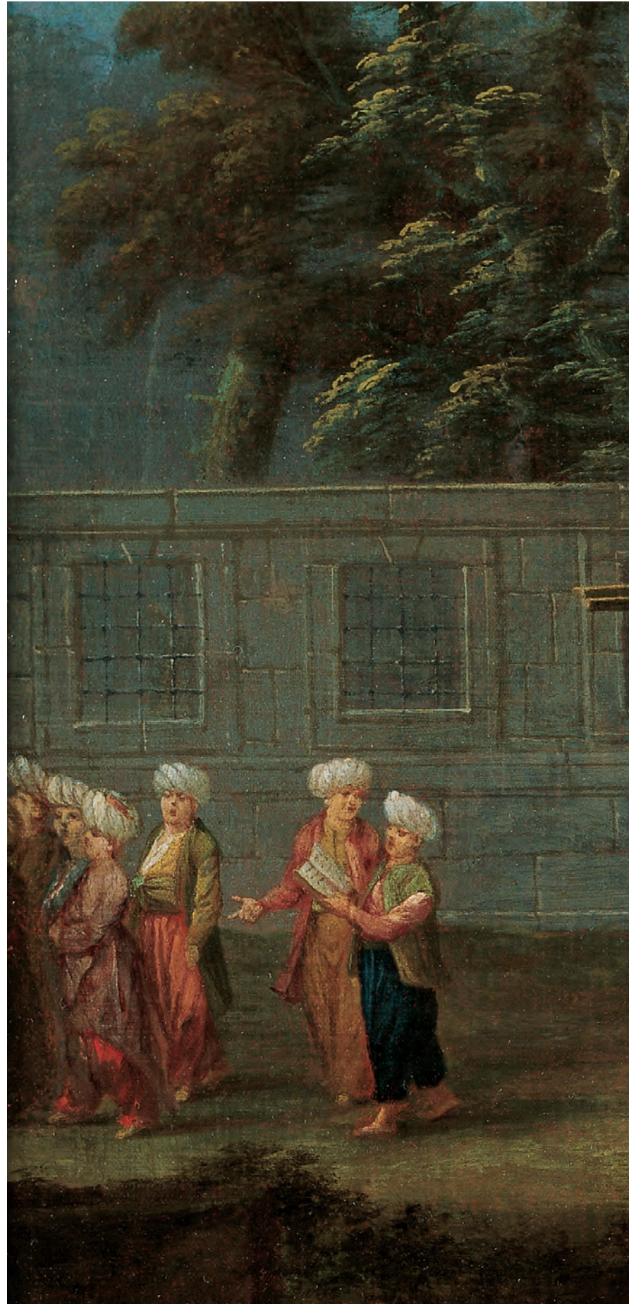
2- Âmin alayı (Vanmour, Amsterdam, Rijks Müzesi)

Eşraftan, hâli vakti yerinde ve varlıklı aileler bazen bu merasimde ilahi okumaları için başka