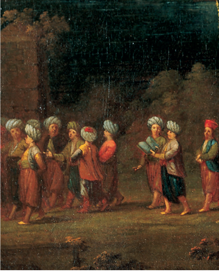
4- Mektepli çocuklar (Vanmour, Amsterdam, Rijks Müzesi)

Evveli Kur'ân, âhiri Kur'ân. Tebâreke'llezî nezzele'l-furkân. Eli kân, kılıcı kân, sinesi üryân, ciğeri püryân. Din-i mübîn uğruna şehit olan gâziler aşkına diyelim aşk ile bir Allâh!