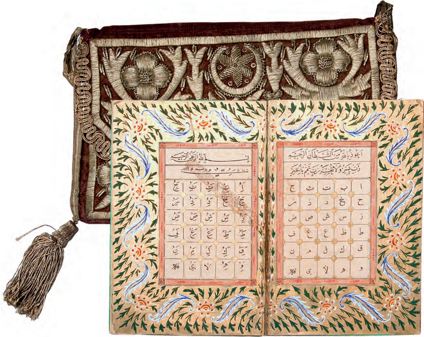
1- Elif cüzü ve kesesi