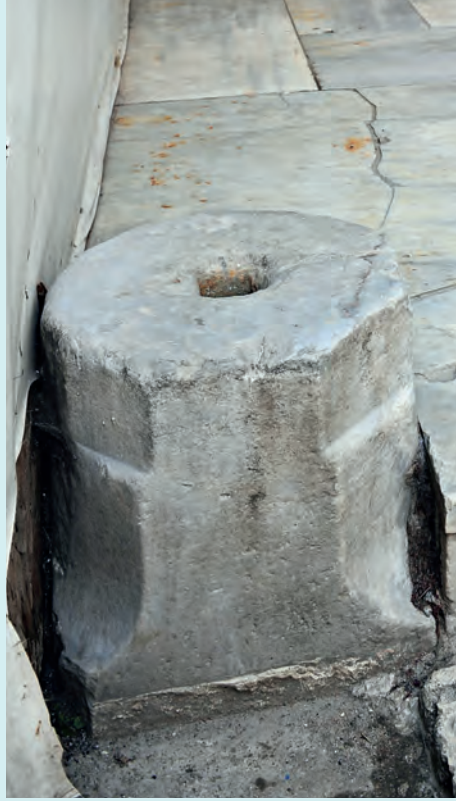
3- Edirnekapı Mihrimah Sultan Camii'nin doğu girişindeki sadaka taşı

Sadaka taşları değişik boyut, biçim ve türde olmakla birlikte, tek parça granit veya mermerden yapılmış, çoklukla silindirik kısa sütunlardan oluşur. İşlevlerine uygun olarak genellikle sade, yalın ve gösterişsizdirler. Yerden yükseklikleri, zaman içinde buldukları zeminin doldurulması veya hafredilmesi nedeniyle çok değişkendir. Özgün boylarının, küçük çocukların ulaşamayacağı yükseklikte, 0,80-1,40 m kadar olduğu kanısındayız. Daha yüksek taşların yanına, tepesine kolayca ulaşabilmek için birkaç basamak konulmuş olduğu düşünülebilir. Günümüze ulaşabilenlerin pek çoğu özgün hâllerinden daha kısa görünmektedir. Pek çoğu antik sütunlardan devşirme olduğu için gövde çapları da değişiktir. Ulaşabildiğimiz örneklerde gövde çapları 26,5 ile 60 cm arasında değişmektedir. Üst yüzeylerinde tam ortada çoklukla 4-9 cm çapında ve genellikle bu ya da buna yakın derinlikte çanağa benzer bir çukur yer alır. Bu küçük haznede madenî paralar toplanır. Bilindiği gibi eskilerde yalnızca madenî para vardır. Osmanlı'da yüzyıllar boyunca (1329'dan 1834'e değin) halkın en önemli satın alma aracı gümüş "akçe"lerdir (İlk Osmanlı kâğıt parası "kaime" Sultan Abdülmecid zamanında 1840'ta çıkarılmıştır). Ancak kimilerinde hazne bulunmaz. Günümüze ulaşabilmiş kimi örneklerde de bu çukurun harçla doldurulmuş olduğu görülür. Kare, dikdörtgen ve altıgen kesitli sadaka taşlarına da rastlanmaktadır. Taşların üzerinde tarih olmaması, malzeme olarak kullanılan antik sütunların