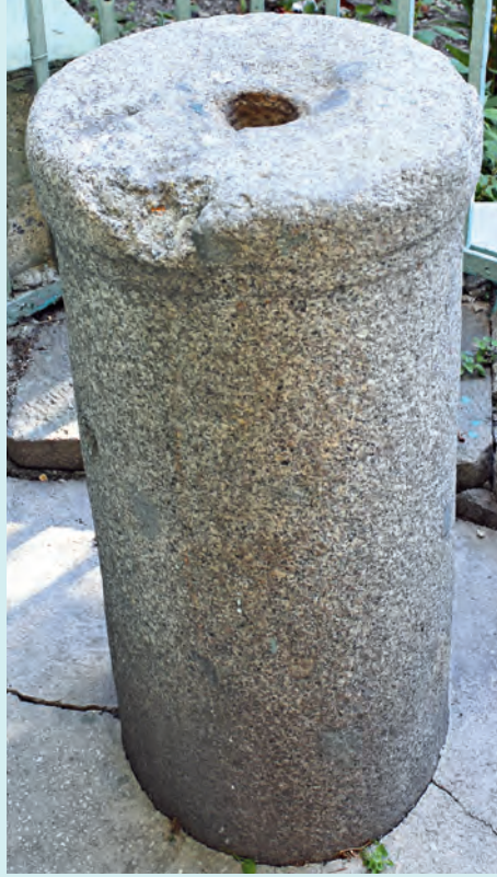
1- Sur içinde Yedikule ile Silivrikapı arasında bulunan Feyziye (Küçük Efendi) Camii’nin giriş kapısının sağ tarafındaki sadaka taşı

infak ve tasadduk edilmesine (nafaka ve sadaka olarak verilmesine) özel bir önem verilmektedir.