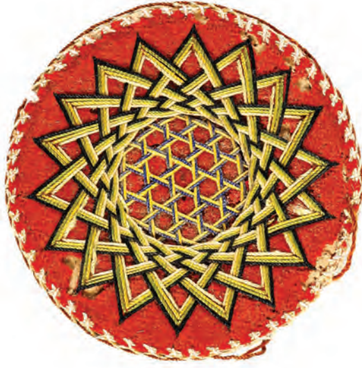
19- Tarikat-ı Aliyye-i Kadiriyye Gülü (18 köşeli)