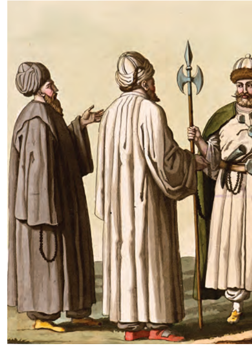
2- Tarikatlara mensup şeyh ve derviş kıyafetleri (d'Ohsson)

ve estetik açıdan hepsi birbirinden değerli, değişik tevhit açma usulleri vardır. Uşşak, sabâ, rast, suzinak, hüzzam gibi farklı makamlardaki bu usullere; şeyh tarafından topluca kelime-i tevhit okunmasıyla başlanır. “Lâ ilahe” derken başlar sağa, “illallah” derken sola, kalbe doğru çevrilir. Ayrıca feth-i esma denen ve darbeleri seslerle uygulanan usul de vardır. Bu usulde ser-zakir zakirbaşının yönetiminde zakirler, tevhidin gidişine uygun ilahiler okurlar. İçinde bulunulan kamerî aylara göre ilahi güftesi seçmek önemlidir (zilhiccede kurban ve hac, ramazanda oruç, cemaziyelevvelde tövbe, rebiülevvelde Hz. Peygamber’in doğumu, muharremde Kerbela olayı gibi). Ayrıca tekkeye misafir gelen şeyh veya dervişlerin tarikatına ait güfte de seçilebilir. Tarikat nezaketine mahsus bu âdet; tekkenin zakirbaşlarının çok geniş repertuvara sahip olmalarını gerektirir. Makamlı tevhit eşliğinde okunan ilahiler bittiğinde, tevhit makamsız, düz sesle devam ettirilir.