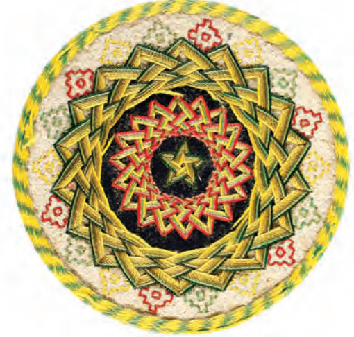
24- Dört terkli Nakşibendiyye, Kadiri, Zenburiyye, Sadıkiyye Gülü