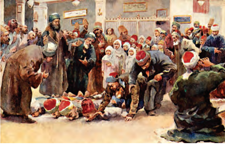
7- Devsiye Âyini

Sa'dî dervişleri, tarikatın merkezi olan Şam'da, Emeviye Camii'nde Cuma namazından sonra ayin yaparlardı. İstanbul'da Ayasofya Camii'nde ise özellikle Kadir geceleri Sa'dî ayini yapılırdı. Ayasofya Camii'ndeki büyük levhalardan Hz. Ali'nin adının yazılı olduğu levhanın altındaki yer Sa'dî tekkesi mensuplarına aitti.