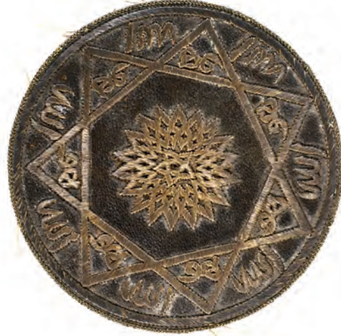
26- Tarikat-ı Aliyye-i Bedeviyye Gülü (İstanbuli)