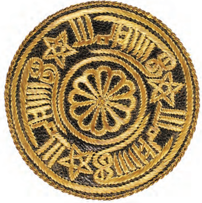
29- Tarikat-ı Aliyye Sa'diyye Gülü (7 köşeli)

hareketsiz kalınır ve semah durur. Buna, “paymaçan” veya “darda durmak” denir. O mısra bitince semah devam eder. Semah ayini yine mürşidin işaretleriyle biter, ikramdan sonra meclis dağılır.