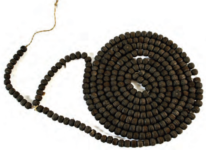
1- Zikir tespihleri (İstanbul Türebeler ve Müzeler Müdürlüğü - İBB, Şehir Müzesi)

tarikatinde şeyhler beyazımtırak posta otururlar. Bazı Bektaşî şeyhlerinin postu siyahtır. Derviş postları bütün tarikatlarda beyazdır. Tarikat erkânında postun ayakları tasavvuf remizlerinden hizmeti , boynu teslimiyeti , tüyleri bereketi , sırtı metaneti , kuyruğu himmeti simgeler. Zikir halkasındaki dergâh zabitanı denen ser-tarik , ser-tebbah , pîş-kadem , zâkirbaşı , imam , meydancı , saki , türbedar , çerağcı , pazarıcı , asadar , ferraş , kapıcı , nakip gibi tekke görevlileri; halifeler ve dervişler manevi kıdemlerine göre otururlar. Tekkeye misafir gelen şeyh varsa tekke şeyhininkinin yanına serilen posta oturtulur. İç içe halkalar önünde şeyh postunun görünüşü ay-yıldız gibidir.