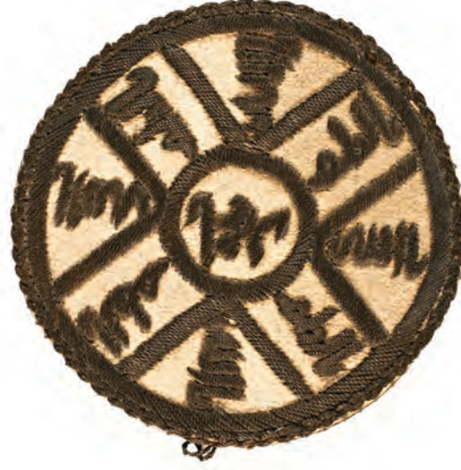
20- Tarikat-ı Aliyye-i Kadiriyye Gülü (18 köşeli)