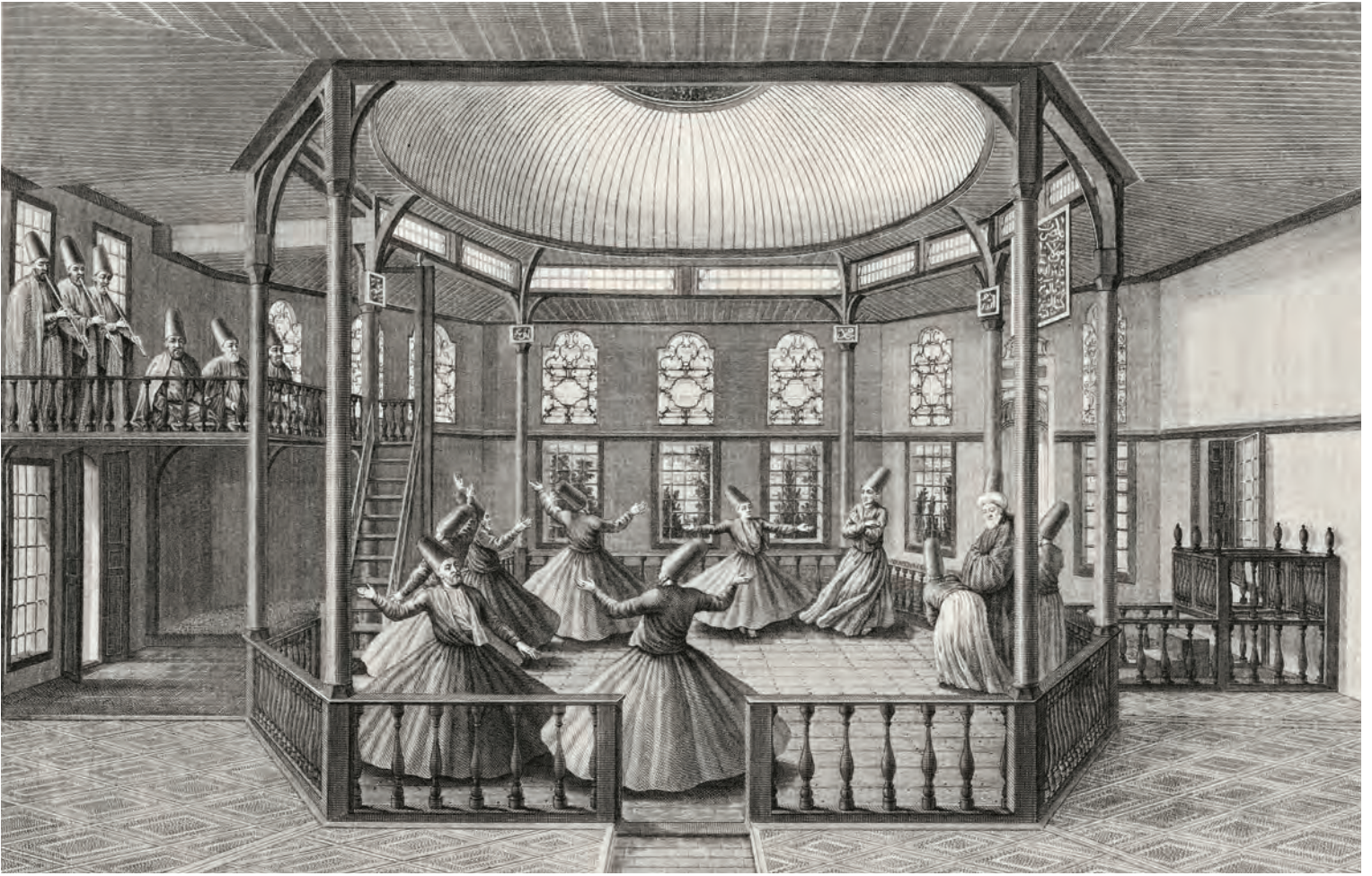
15- Galata Mevlevihanesi (d'Ohsson)

Bektaşîliğin esas töreni olan ayin-i cem ve tarikatın yeni müntesiplerinin eskilerle tanışması için yapılan ikrar ayini çok özel törenler olup teferruatını ehli bilir. Bir Bektaşî ayini ana hatlarıyla şöyledir: Babanın Fatıha vermesiyle başlayan ayine geçmeden bütün erkekler pîr huzurunda iki rekât tarikat namazını kılar. Sonra Kur'an-ı Kerim tilaveti, bazı özel dua ve evrat eşliğinde yapılan kısa zikir Hz. Peygamber'e ve ehl-i beyte dair salavat-ı şerifler ve gülbank okunmasıyla sona erer. Akabinde "çerâğ uyandırma tercümanı" denen özel besteli eser okunurken semahhanedeki büyük mumlar yakılır ve edeple meydan odasına geçilir. Burada müzik eşliğinde semah denen bir nevi dinî raks yapılır. Ayrıca baş okutma, dolu içme, mücerretlik Ali Sofrası, kurban tıglama, lokma etme, Koyun Baba denen ayinler de semah eşliğinde icra edilir. Bazı ayinlerde semah yapılmaz ve sazsız gülbank ve tercüman okunur. Ali mevlîdi de sazsız okunur. Muharrem ayında da semah yapılmaz ve şüheda-i Kербela için mersiyeler okunur. Semah ritmik kol ve ayak hareketleri ile kadın erkek karışık icra edilen dinî bir rakstır. "Ağırlama" ile başlar, "yürütme" ve "yeldirme" denen hızlı bölümlerle devam eder. Zakirlerin saz eşliğinde okuduğu