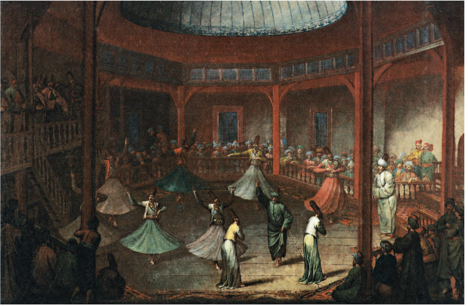
13- Mevlevî sema (Amsterdam, Rijks Müzesi)

onbeş eseri, çok yüksek seviyedeki sanat gücünün göstergesidir. Yine Sertarikzade Tekkesi'nin ve Nureddin Âsitanesi'nin Zakirbaşısı Eğrikapılı Şeyh Mehmed Efendi (ö. 1916) büyük bir musikişinastır.