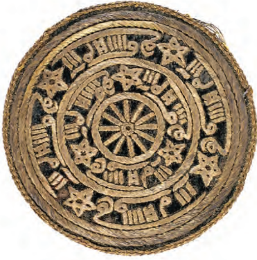
16- Tarikat-ı Aliyye-i Kadiriyye Gülü (18 köşeli)