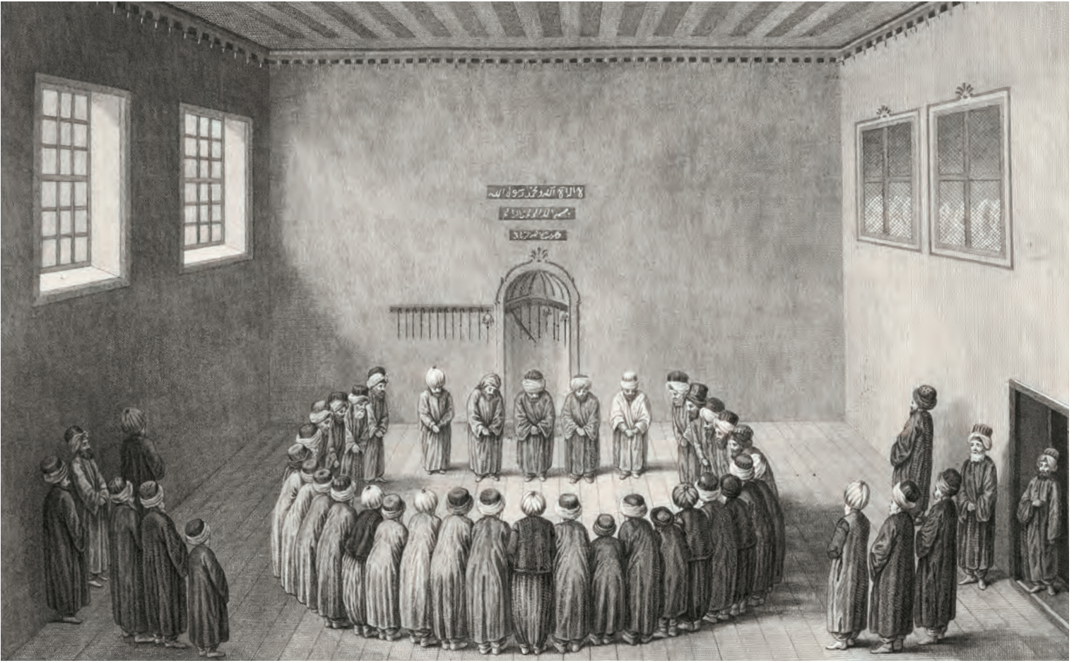
6- Rifaî dervişlerinin Kıyamî Âyini (d'Ohsson)

serilen postlarda dururlar, bazen otururlar. Zakirler meydana herkesin katılımıyla cumhur ilahi okurken dervişler ilahinin temposuna göre servi salınımıyla iki tarafa hafifçe sallanırlar. Cumhur ilahi okunurken zikir yapılmaz. Bu yüzden cumhur ilahilere yanlışlıkla cumhur durak da denmiştir. Zikir esnasında okunan ilahilere zikir ilahisi veya usul ilahisi denir. Cumhur ilahi okunduktan sonra, şeyh zikredilecek esmayı belirtir ve meydana ayrılır ( esma atmak ). Bundan sonraki ayinin yönetimi zikir reisine, müzik yönetimi ise zakirbaşına aittir.