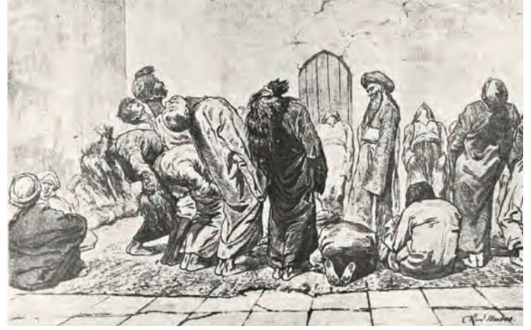
8- Şazeli'nin Kıyamî Âyini

Ali Hicazî-i Beyyumî'nin (ö. 1769) pîri olduğu Mısır kökenli Beyyumî tarikatının bilinen kıyam zikri dışında uyguladığı bir ayindir. İstanbul'da Kocamustafapaşa Ağaçkakan Tekkesi ve Eyüp'teki İslam Bey Bedevî Tekkesi'nde bu ayin şöyle yapılırmış: Kıyam hâlinde saf olan dervişler, zakirbaşının başlattığı "Allah" zikrini çekerken meydana giren şeyh, "Hû" diye seslenince kıyam safları hilal hâline girer. Zikir "Ya Allah" diye devam ederken "Ya Allah Ya Dâim" esmalarıyla tempo hızlanır. Genel kıyam ayinlerindeki gibi ayaklar sabit değildir. Parmaklar