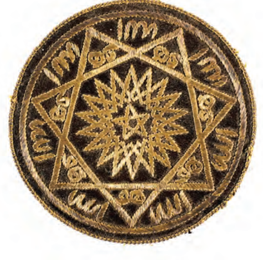
21- Bedevi Gülü (Atasoy 218)