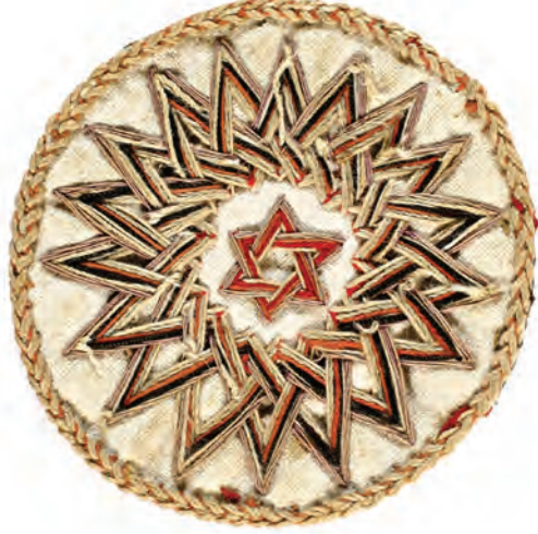
25- Tarikat-ı Aliyye-i Kadiriyye Gülü (18 köşeli)