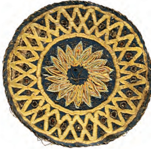
23- Tarikat-ı Aliyye Sa'diyye Gülü (7 köşeli)