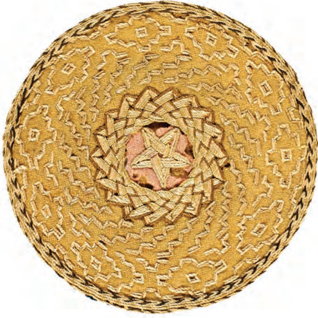
28- Çarhlı Kadiri Gülü