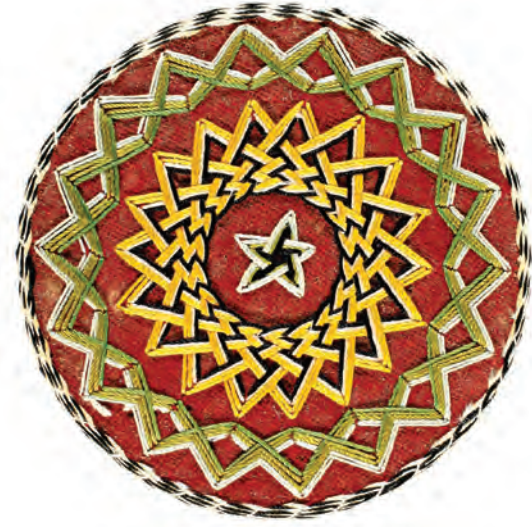
18- Havuzlu Nakşibendi Gülü (18 köşeli)