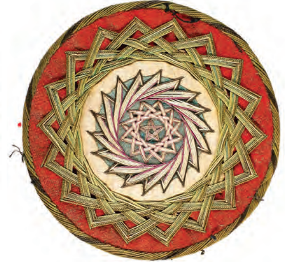
27- Tarikat-ı Aliyye-i Kadiriyye Gülü (18 köşeli)

müziğinde rastlanan kanon tekniğiyle tekrarlanır. Ayrıca, kalabalık semahlarda bulunanlardan bazıları “Ya Allah”, “Ya Şâh”, “Hû” gibi sözleri, icra olunan nefesin karar perdesinden tekrar ederler. Buna “dem tutmak” denir. Öteki tarikat ayinleri gibi, Bektaşî ayininde de perde kaldırılır ve semah havası hızlandırılır. Bestesiz okunan şiirlere nutuk adı verilir. Nefesler, naat-ı Ali, Düvazde (On iki) İmam, mersiye, miraciye, nevrüziye gibi türlere ayrılır. Bu türlere, ağır usulle bestelenmişse “oturak”, yürük usulle bestelenmişse “şahlama” denir. Şahlamalar, semaha uygun melodik yapıdadır. “Turnalar semahı” gibi özel semah havaları da vardır.