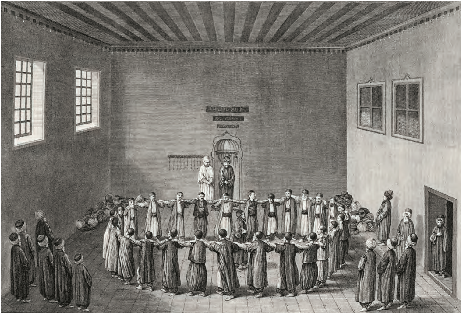
11- Rifâî dervişlerinin Halvetî Devrânî Âyini (d'Ohsson)

Hay” sesli, “Allah” lafzı kalbî olarak okunur. Devranda büyük çoğunlukla “Hû” ve “Hay” esmâ-i şerifleri okunur. Fakat çok değişik okuma tarzları vardır. Devranî ilahisi olarak bilinen özel besteli ilahi “A sultanım sen var iken” okunduğunda terennüm bölümünde “Ya Hay” diye ayak vurularak, öteki bölümlerde “Ya” demeden “Hay” ismine devam edilerek devran sürdürülür. Devran, bazen Bedevî topuyla bitirilir, bazen de şeyhin “İllallah” demesiyle sona erer.