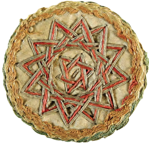
22- Tarikat-ı Aliyye-i Kadiriyye Gülü (18 köşeli)