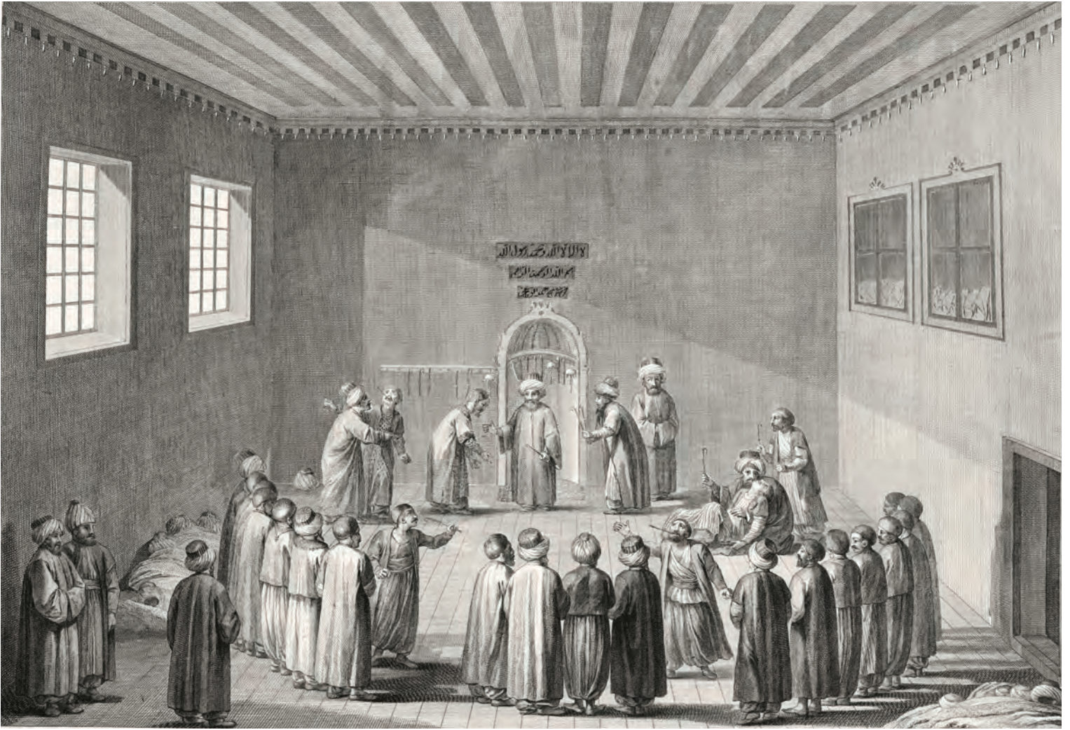
12- Rifâî dervişlerinin tığ, zincir, cenbiye vb. ile gerçekleştirdikleri âyinler (d'Ohsson)