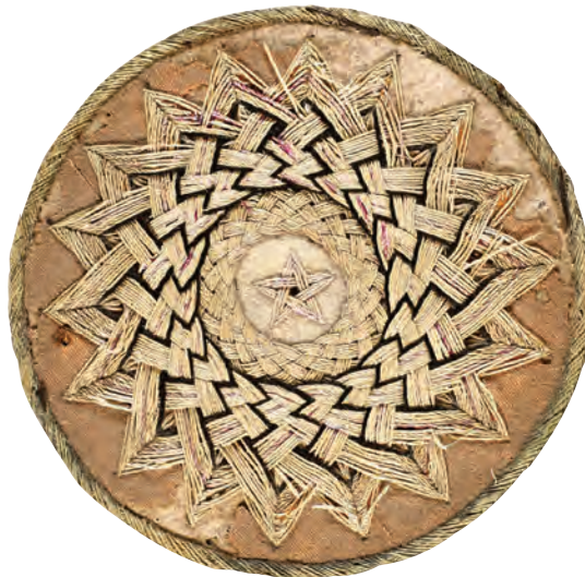
17- Tarikat-ı Aliyye-i Kadiriyye Gülü (18 köşeli)