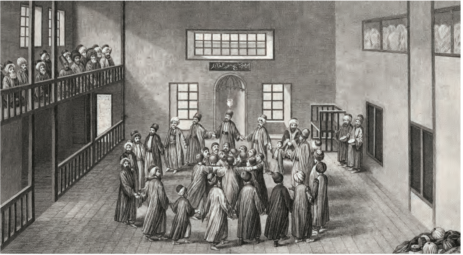
9- Rifaî Burhan Âyini (d'Ohsson)