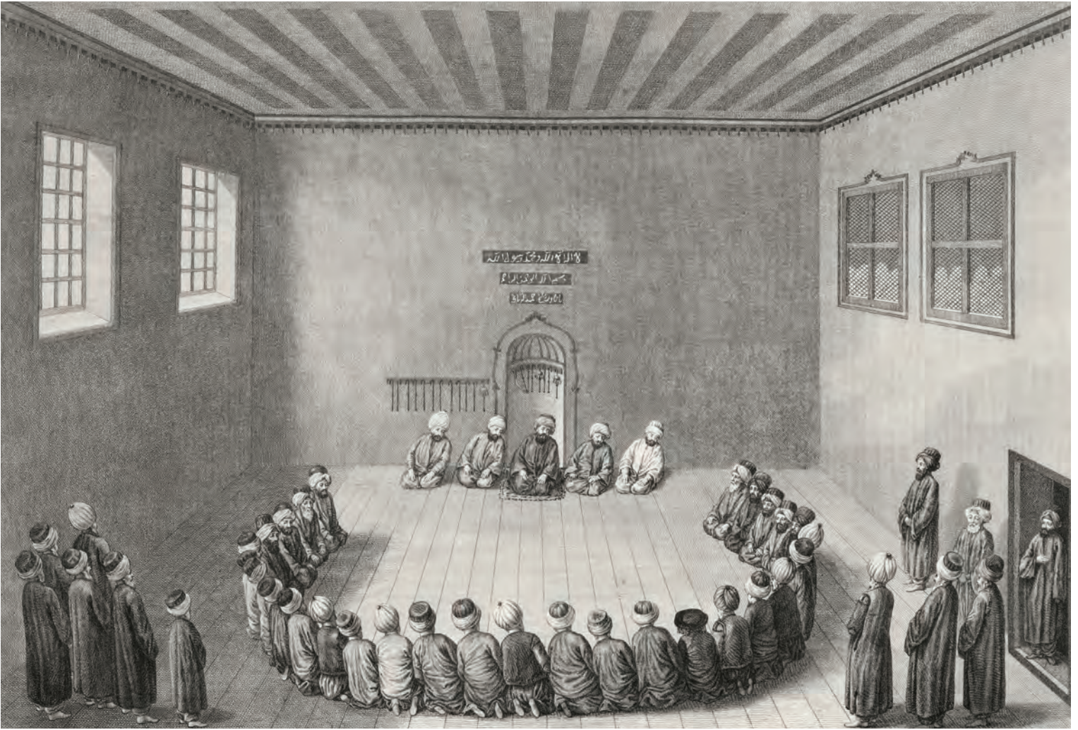
5- Kuûdî Âyini (d'Ohsson)

eliyle dervişlere tutturur. Şeyh çok ağır tempoda “euzü besmele” çeker ve üç defa kelime-i tevhit ve “Allah” zikri okunur. Zikir devam ederken perde perde yükselen “Allah” lafzıyla tempo hızlanır. Başlarını aşağı yukarı hareket ettirip elif harfi çizer gibi zikreden dervişlerin görünüşü çok estetikdir. Şeyhin “Allahu ekber kebirâ” deyip okuduğu dua ve gülbanktan sonra zikrullah biter. Meydancı imamesini öpüp topladığı tespihle şeyhi bekler. Şeyh meydandan ayrılırken meydancı ve dervişler özel bir tarzda başlarını eğip (baş kesip) şeyhin selamını alırlar.