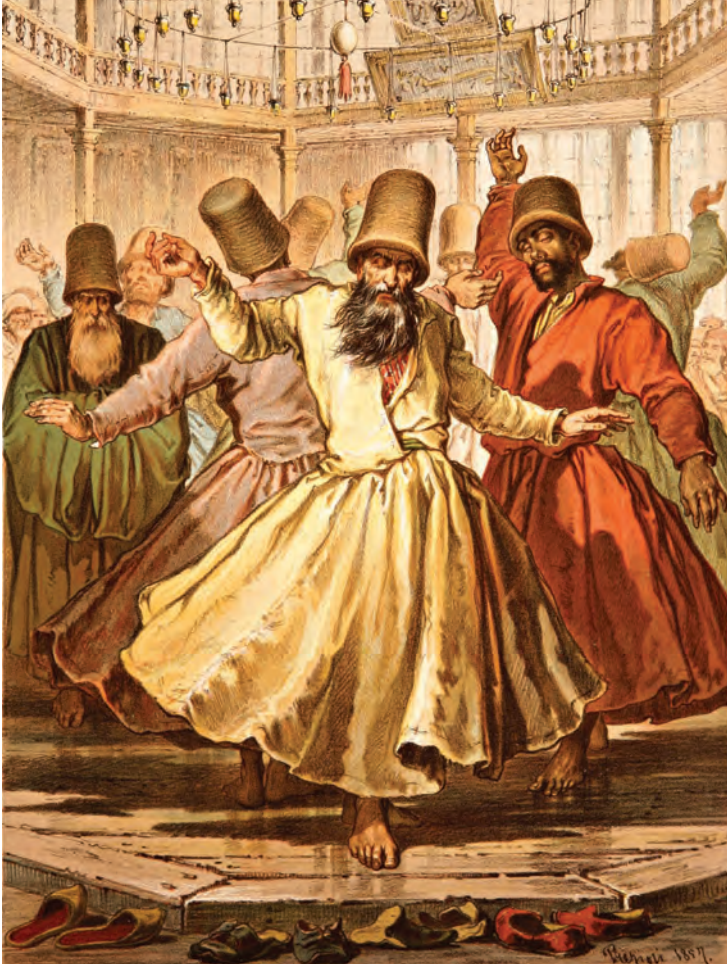
14- Mevlevî sema

bir kısmı unutulmuş hüseyinî-âşîran ve yarım kalan nikrîz; Hafız Zekâî Dede'nin (ö. 1897) mâye, ısfahan, sûzinâk, sabâ-zemzeme, sûzidil; Kudümzenbaşı Ahmed Hüsameddin Dede'nin (ö. 1900) rahatül'ervah; Şeyh Ahmed Celaleddin Dede'nin (ö. 1907) düğah; Bolâhenk Nuri Bey'in (ö. 1910) karcıgar bûselik; Şeyh Hüseyin Fahreddin Dede'nin (ö. 1911) acemaşîran; Yahya Efendi Zakirbaşısı diye tanınan Şeyh Mehmed Şevki Efendi'nin (ö. 1914) kaybolan ısfahan; Musullu Hafız Osman Dede'nin (ö. 1918) bir selamlık hüseyinî; Abdülkerim Dede'nin (ö. 1920) kaybolan yegah; Rauf Yektâ Bey'in (ö. 1935) yegah; Ahmed Avni Konuk'un (ö. 1938) buselik-âşîran, dilkeşide ve rûy-i irak; Muallim Kâzım Uz'un (ö. 1938) sultanîyegah; Zekâî Dedezade Hafız Ahmed Irsoy'un (ö. 1943) beyâtî-bûselik ve müstear; Râkım Elkutlu'nun (ö. 1948) karcıgar; Hafız Kemal Batanay'ın (ö. 1982) nikrîz; Sadettin Heper'in (ö. 1980) hisarbûselik ayinleri vardır. Hüseyin Sadettin Arel (ö. 1955) çeşitli makamlardan 51 ayin bestelemiştir. Son devirlerde Cinuçen Tanrıkorur'un beyâtî-arabân ve eycârâ; Zeki Atkoşar'ın muhayyer, sazkar, mahur; Necdet Tanlak'ın neveser ve tahir; Fatih Salgar'ın uşşak; Doğan Ergin'in ferahnâkaşîran; Cüneyd Kosal'ın nişabur; Kemal Tezergil'in nihavent; Hasan