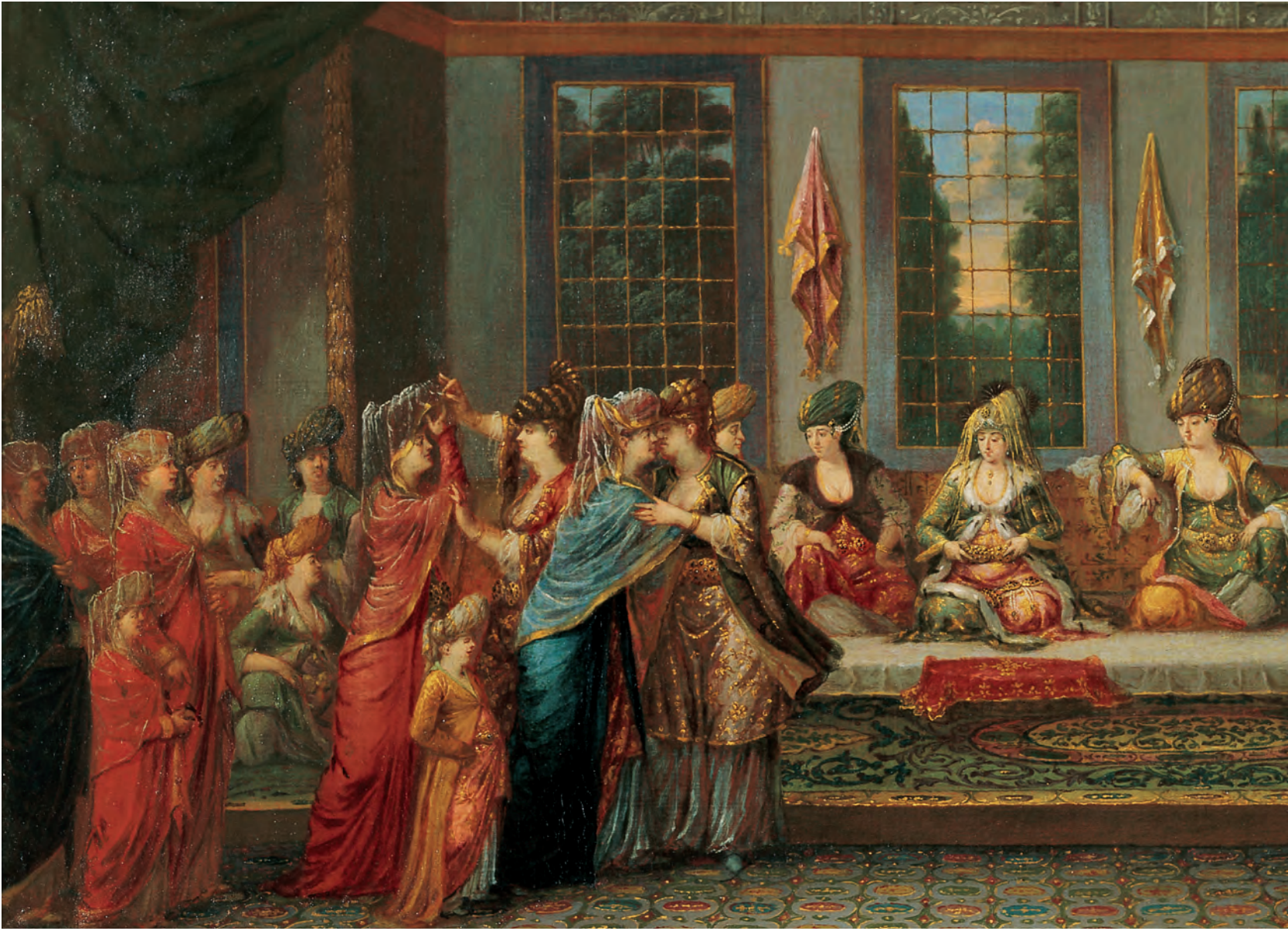
5- Bir İstanbul konağında düğün (Vanmour, Amsterdam, Rijks Müzesi)

çeşidinin fazlalığı, ikincisi ise etin bolluğuydu. Etin yağlı kısmı makbuldü. Pilav sofrada mutlaka bulunurdu.