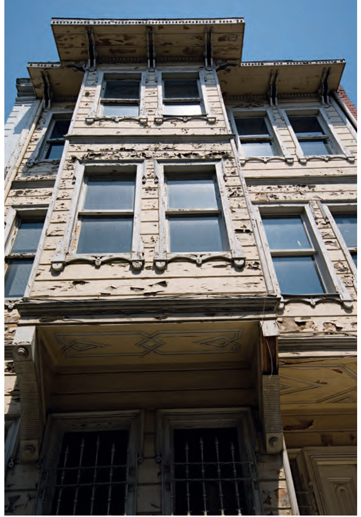
8- Kayserili Ahmet Paşa Konağı

Bahçeler için gereken su , kuyulardan karşılanırdı. Konağın atlarının arasından güzel olmayanlar ayrılır, kuyudan suyu çıkarmak için dolap beygiri olarak kullanılırdı. Kuyu aynı zamanda buzdolabı işlevini de görürdü. Fileler yapılarak yazın karpuzlar kuyuya salınır, bu şekilde soğumaları sağlanırdı. Konağın içme suyu ihtiyacı ise sakalar tarafından karşılanırdı. Taşdelen, Karakulak gibi sular, sakalar sayesinde getirilerek konağın dış kapısında bulunan borular vasıtasıyla depolara akıtılırdı. Bu şekilde saka suyunu boşaltır, ne kadar su getirdiyse kapı yanındaki tahtaya işaret koyardı.