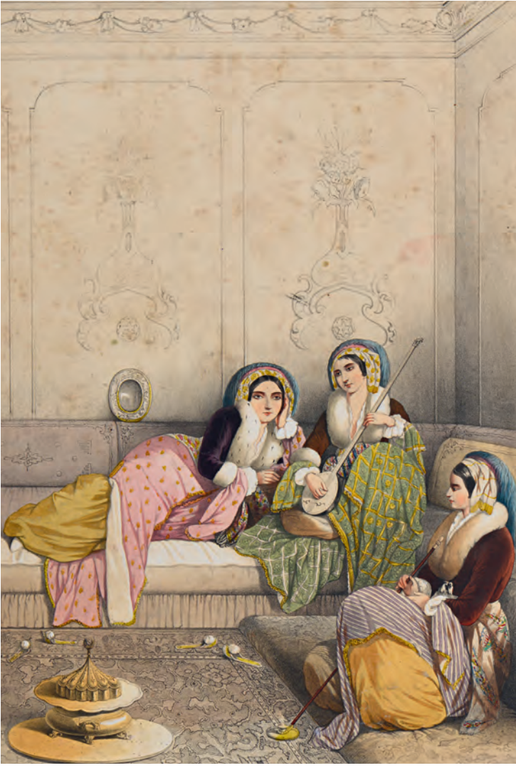
2- Türk evinde kış ısınması ve eğlenmesi (M. Fuad)

hitap ederdi. Konakta yetiştirdiği çocuk büyüyüp, dadı da onun yetişkinliğini görürse konağın delikanlısı ona anne gözüyle bakar ve ona büyük hürmet gösterirdi. Yine konağın kendine ait imam ve müezzini bulunurdu. Bazı konaklarda imam sayısı ikiye çıkardı. Konak ahalsinin çokluğu cemaatin oluşmasında önemliydi. Bütün bu görevliler konağın “kapı halkı”nı oluştururdu.