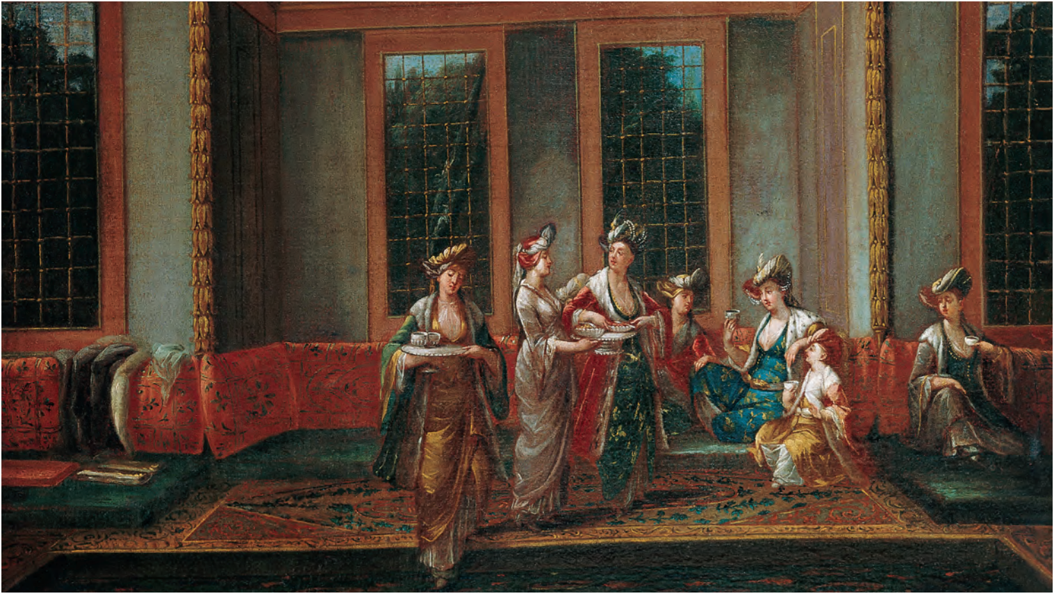
1- Bir İstanbul konağında harem bölümü

Sultanahmet'te Talat Paşa Konağı, Fatih'te Suphi Paşa Konağı, Cağaloğlu'nda Bülbül Tevfik Paşa Konağı (Cağaloğlu Akşam Kız Sanat Enstitüsü), Rauf Paşa Konağı (İl Milli Eğitim Müdürlüğü), Moda'da Mahmut Muhtar Paşa Konağı, Çamlıca'da Ahmet Ratıp Paşa'nın Konağı (Kız Lisesi), Divanyolu'nda Hacı Salih Efendi Konağı (İl Sağlık Müzesi) örnek olarak gösterilebilir. Ayrıca Süleymaniye Kayserili Ahmet Paşa Konağı, Sultanahmet Recep Peker Konağı, Necmettin Molla Konağı ve Reji Nazırı Konağı (Yeşil Ev) da ahşap konakların güzel örneklerindedir.