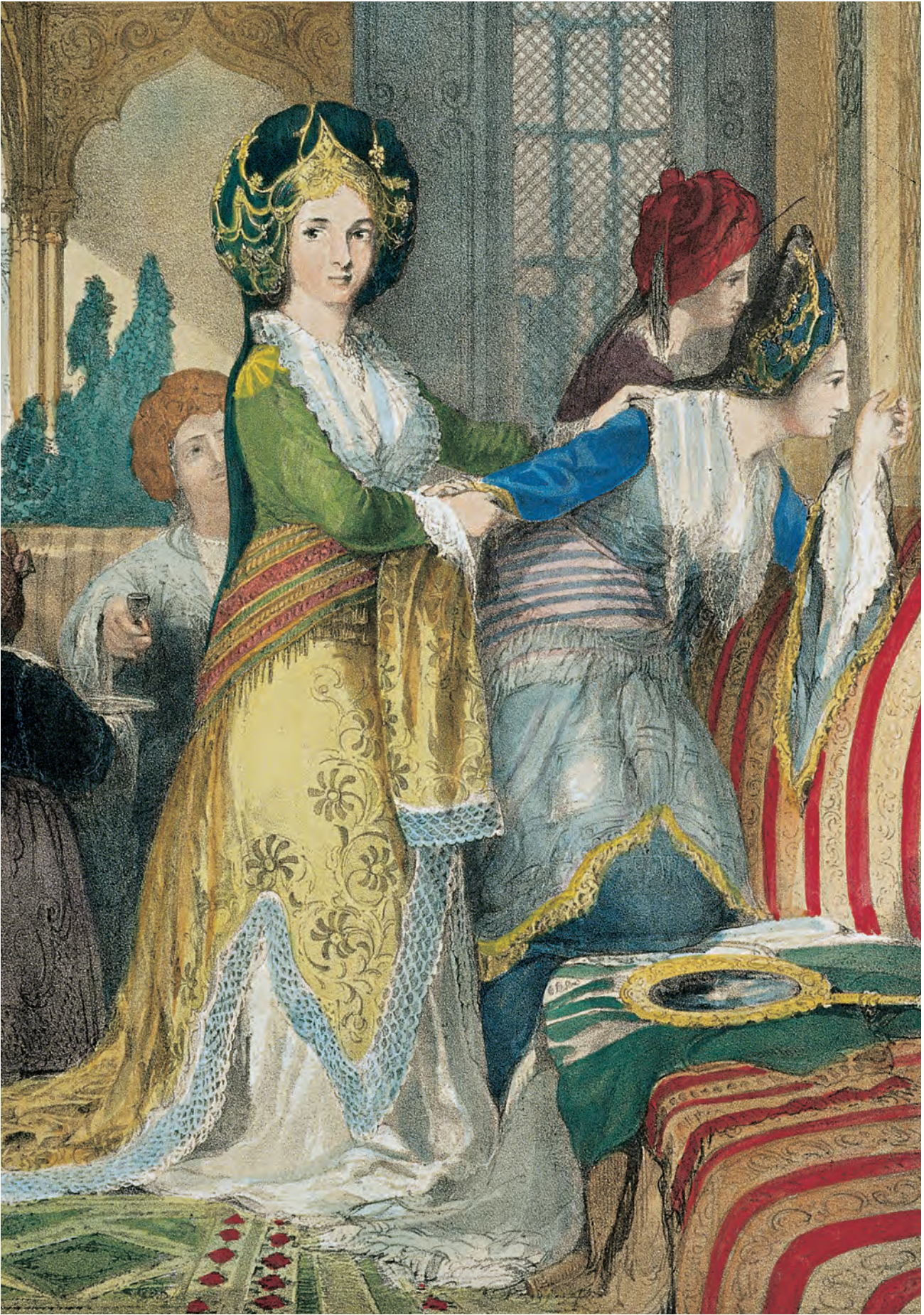
4- İstanbul'da bir konağın haremi (TSMK, nr. 29/9)