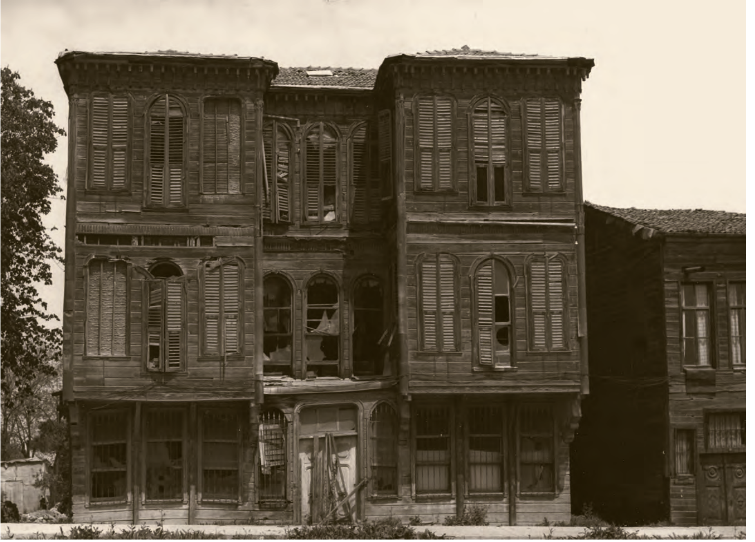
9- Artık terk edilmiş olan bir İstanbul konağı

Kayık sahibi olabilenler Göksu'daki kısa mesafeli gezintiler dışında Boğaziçi'nde bilhassa mehtap seyrine bayılırlardı.