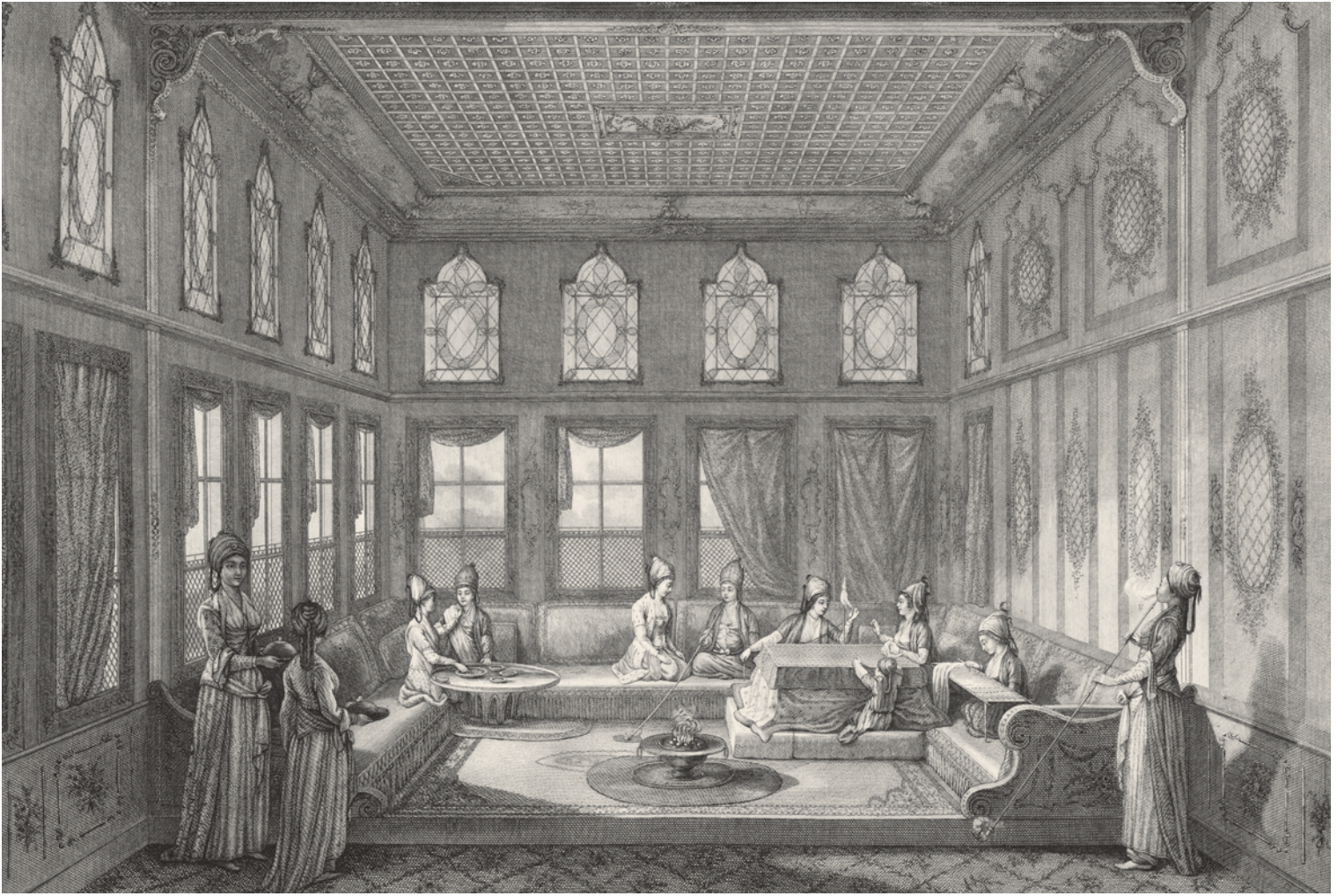
11- Bir konağın harem dairesi (d'Ohsson)

diye başkasına duyuran İstanbullu; maddi imkânsızlıkları dolayısıyla çok şık giyinemese bile temiz, pak ve düzenli olan, giyim kuşamındaki renk uyumuna dikkat eden, bakımsız ve özensiz gezmeyen bir kişidir.