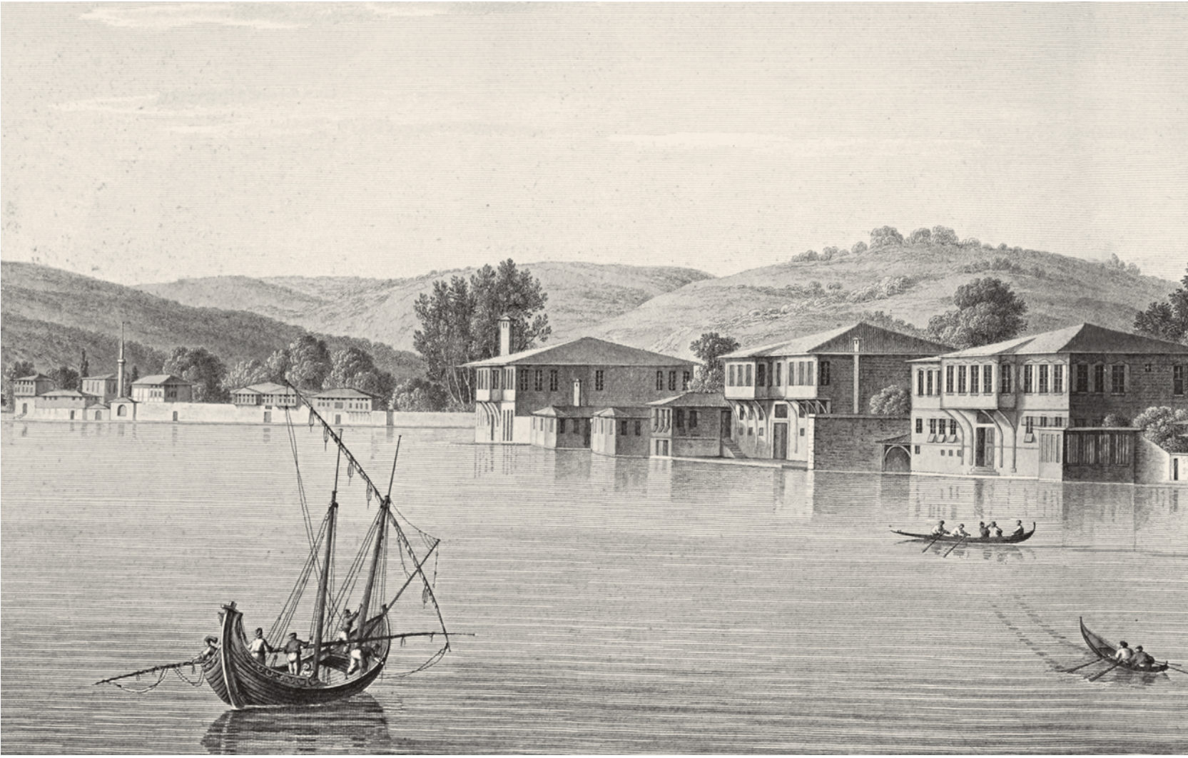
10- Büyükdere'de yalılar (Melling)

ve tambur sesine keman ve piyano da karışmıştır. Aynı şekilde Teşvikiye'de, Nişantaşı'nda, Yıldız Sarayı'nın yakın çevresinden başlamak üzere bir yüksek sosyete oluşmuştur. Topkapı Sarayı geçerli iken Sultanahmet-Fatih ne ise; Dolmabahçe'nin, Çırağan'ın, Yıldız'ın Nişantaşı'sı, Teşvikiye'si de odur.