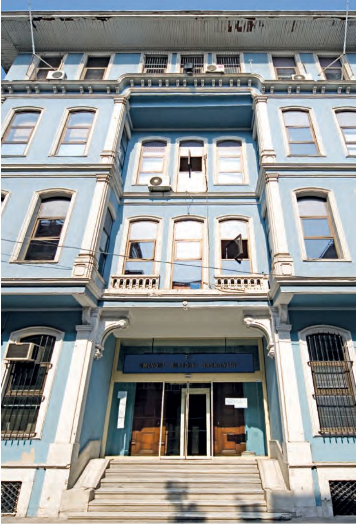
7- Arif Paşa Konağı (Fatih)

olmazsa olmazlardan birisi limonluk tur. Limon İstanbul'da zor yetiştiği için oldukça kıymetli idi. Bahçenin görünmeyen kısmında ise küçük ve büyük bostanlar oluşturulurdu. Küçük bostanda maydanoz, tere, nane, soğan gibi sebzeler yetiştirilirdi. Bostandan sonra bağlar önemli idi. Bağlarda özellikle çavuş üzümü yetiştirilirdi.