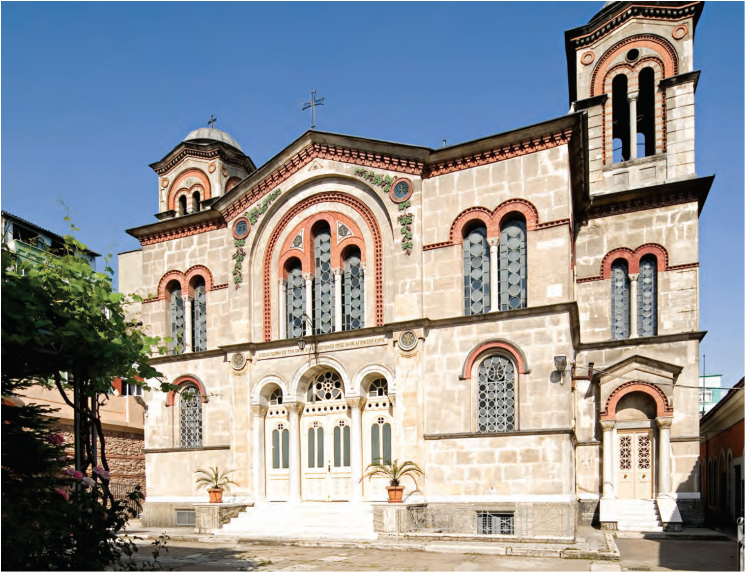
19- Aya Kiriaki Kilisesi

geceleyn sessiz yürüyüşleri dinî bir tören alayına benzese de, yaşlılar mum ışığında yürüyen bu kortejin, azizin anısıyla ilişkilendirilen ilkbaharı karşılama sevincinden kaynaklandığını iddia ederler. Ortodoks nesillerin onlarca dinî geleneklerine kattıkları bu geçiş törenini titizlikle uygulamışlardır.