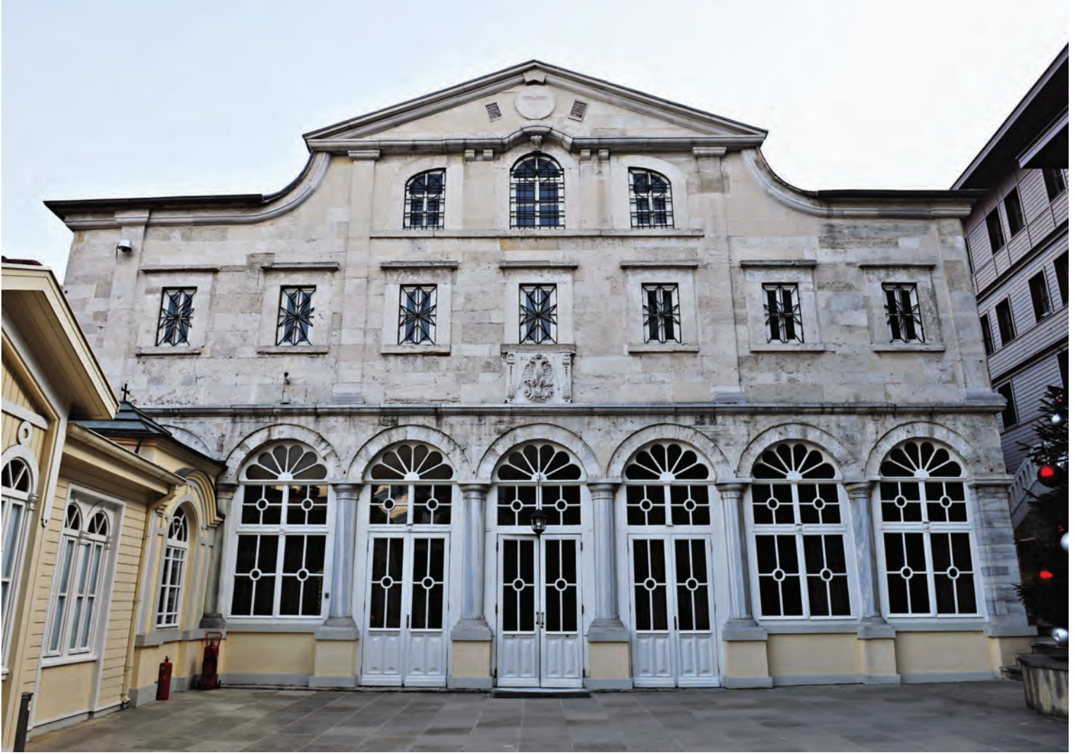
9- Fener Rum Patrikhanesi

iyi yaşam koşulları aramaktaydılar. XX. yüzyılın başında, 1906/1907 Osmanlı nüfus sayımına göre, İstanbul çevresine dağılmış 160.000 Osmanlı vatandaşı Rum Ortodoks yaşamaktaydı. 1923 yılında sadece 100.000 kadar kalmışlardı.