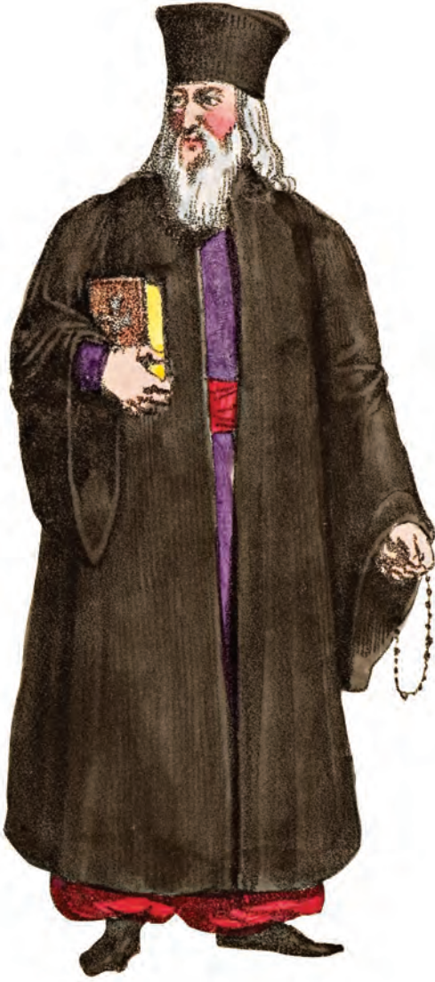
2- Rum Ortodoks papazı (Costumes l'Empire Turc, 1821)

Adlarını 1601'den itibaren patrikliğin merkezi Fener Mahallesi'ne yerleşmelerinden alan ada tüccarlarının torunları olan Fener sakinleri, XVII. yüzyılın ortası ile XIX. yüzyılın başı arasında imparatorluğun siyasi hayatında aşağı yukarı önemli mevkilerde bulunmuş, elli civarında Ortodoks ailenin üyeleridir. Bunların en göze çarpıcı mevkide bulunanları önde gelen mütercimler, Tunalı prensler, Bâbîâlî'nin yüksek düzey yöneticileri ve bakanlarıdır. Kilise kurumuna çok yakın kalarak, bu farklı unvanlarıyla onlar patriklikle Osmanlı yönetimi arasında aracı bir rol oynadılar. Bu durum 1821 baharına kadar devam etti. Yunanlıların Mora'da ayaklanması, bu bağımsızlık hareketini çok açıkça destekleyen Fenerlilerin sonunu getirmiştir. Bazıları idam edilmiş, diğerleri de kaçmayı başarabilmiştir.