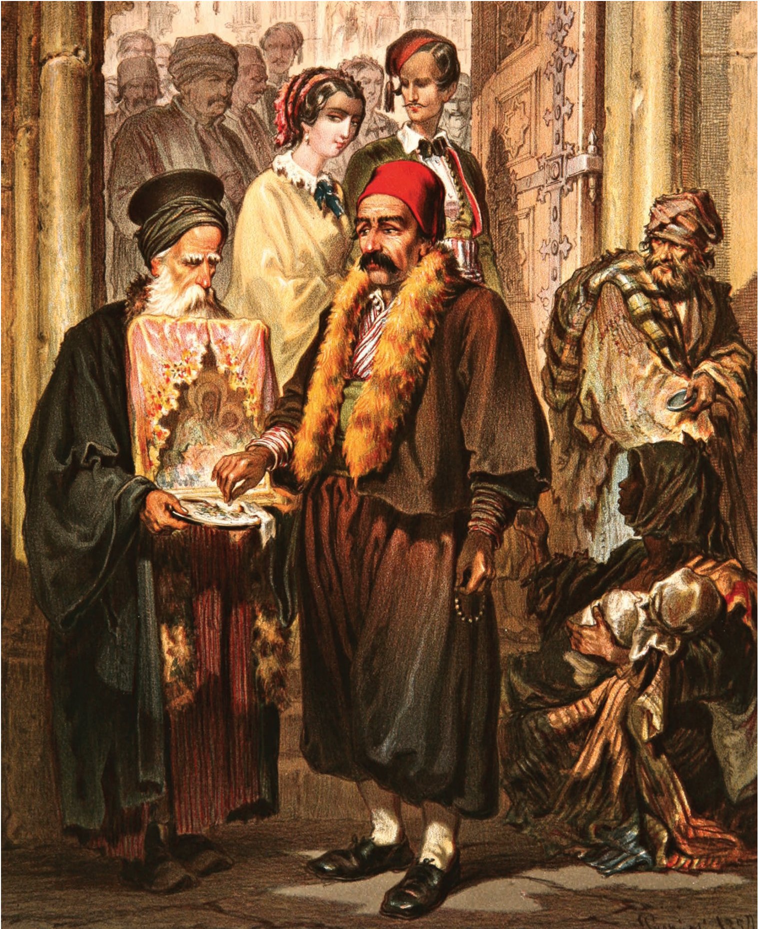
7- İstanbullu Rumlar (Preziosi)