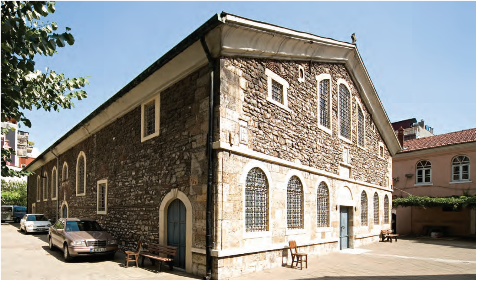
17- Yenikapı Ayios Theodoros Kilisesi

akşamı ayininde papazlar, diyakozlar ve ayin eşyaları taşıyıcıları, kilise bağlıları epitafios eşliğinde tören alayı için kiliseden çıkarlar. Bir buçuk asır önce, Fener ve Balat mahallelerinde pencereye dayanmış kadınlar, gül suyu dökmek için epitafios, patrik ve diğerlerinin çıkışını beklerlerdi.