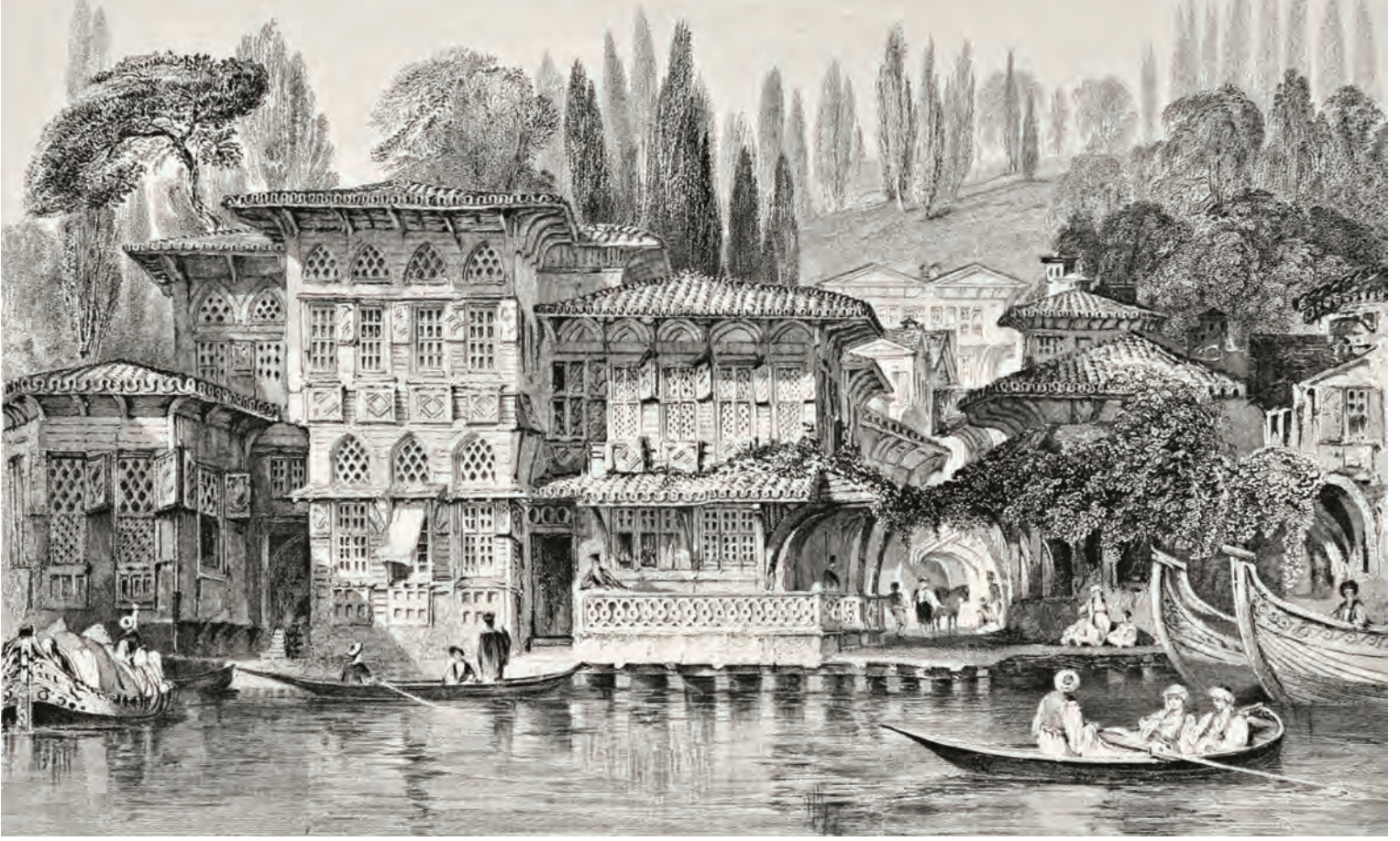
6- Yeniköy yakınlarında bir Rum din adamının yalısı (Allom)

ortak projelere katılamıyorlardı. Daha da çarpıcı olanı, genel olarak -özellikle XIX. asrın ikinci yarısında çok canlı olan- eğitimle ilgili tartışmalara katılamıyorlardı.