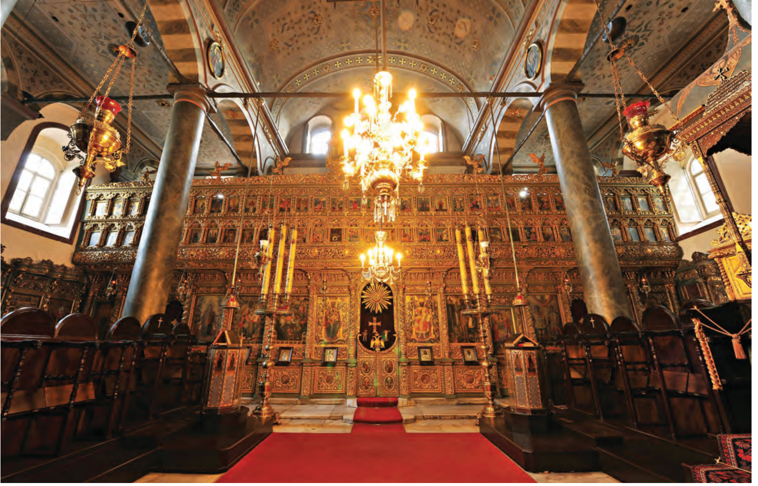
15- Orta bölümden ikonostas'ın görünümü. (İkonostas kilisenin 3. ve sadece din adamlarının girebildiği bölüm ile orta bölümü ayırır. İkonostas üzeri ikonlarla bezenir) (Yorgo Benlisoy)

bakıldığında, zamanın durmasına yol açan bayram, insanların büyük çoğunluğu için daha katlanılabilir bir günlük yaşam sağlar. Son olarak bayram, kilise üyeleri arasında sosyal bağları koruyarak, güçlü bir sosyalleşmeye yol açar.