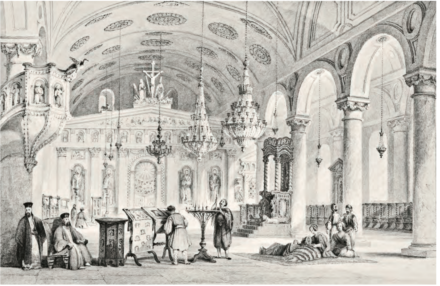
8 Balıklı Rum Kilisesi (Allom)

Zaten, bütün XIX. yüzyıl boyunca, çok sayıda Karamanlı, çoğunlukla İstanbul'a göç etmiştir. Kolektif kimliklerin güçlenmesinden ve 1890'lı yıllardan itibaren artmaya başlayan milliyetçiliğin şiddetlenmesinden önce Karamanlıların göç nedenleri ağırlıklı olarak ekonomikti. Kapadokya yavaş yavaş Hristiyan nüfusundan boşalmıştır. Aynı dönemde, başkente veya köye yerleşen bu Hristiyan nüfus, Rum milletinin merkezî eğitim kurumları tarafından yoğun bir şekilde Helenleştirmeye konu olmuştur. Özellikle İstanbul Grek Edebiyat Cemiyeti ( Syllogue littéraire grec de Constantinople ), XIX. yüzyılın sonlarına doğru Kayseri bölgesinde birçok okul kurdu. Bu ilim cemiyetinin temel hedefi; kırsal bölgelerde yaşayanların okuma-yazma problemini çözmektir. Bunu yaparak, herhangi bir sınıfa konulamayan (Karamanlılar gibi) toplulukları Yunanistan Krallığı'nın kurulmasıyla yeni bir şekil alan Greklilik kalıbına sokmayı hedeflenmekteydi.