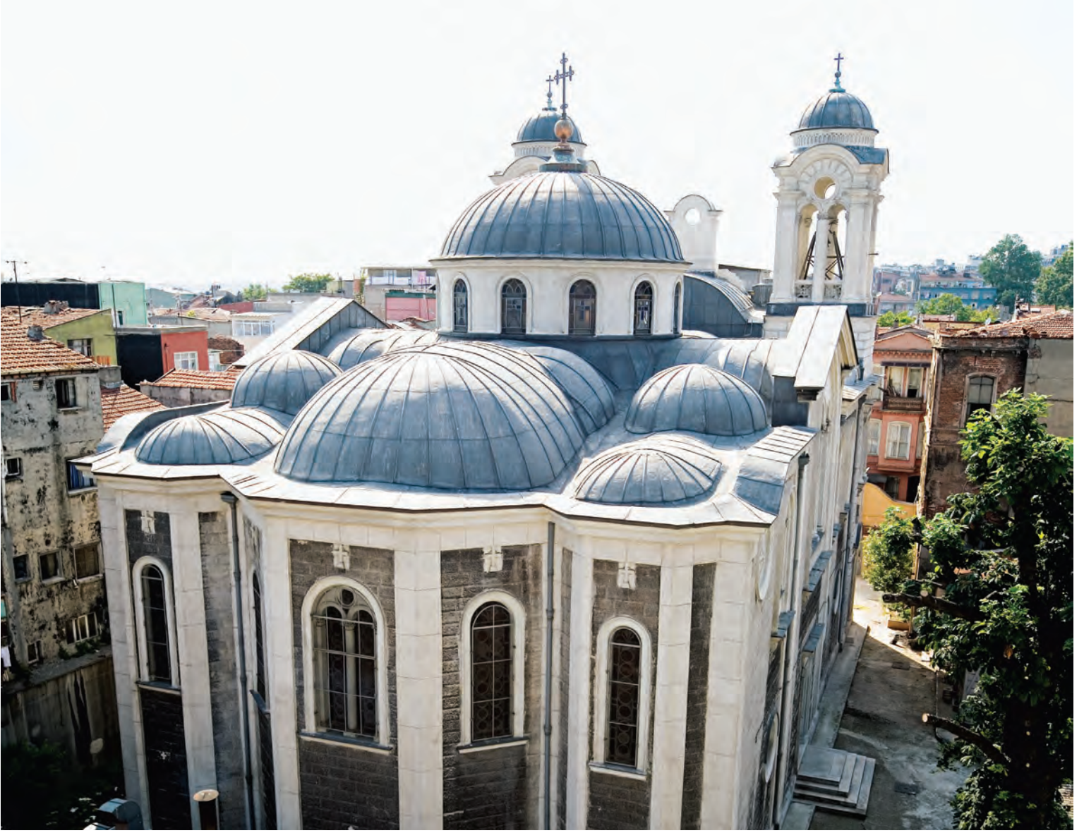
18- Kumkapı Panayia Elpida Kilisesi

geçmeden önce dumanla giriş kapısının üstüne haç işareti yaparlar. Bu ritüel her yıl tekrar edilir -bugün bile hâlâ devam eder- ve bir mahalle içerisinde Rum evlerini ayırt etmeye yeter. Yunanistan'da da bugün hâlâ yaygındır.