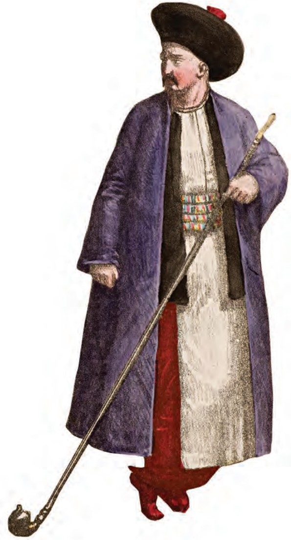
3- Rum soylu (Costumes l'Empire Turc, 1821)

Diğer bir deyişle, yalnız kilise yönetiminin başındaki kişi Osmanlı Devleti'ne karşı sorumludur. Gerçekte, her yeni patriğin göreve başlaması vazifeyi alacak kişinin gücünün sınırlarını belirleyen bir berat (imtiyazlar içeren imparatorluk mektubu) eşliğinde gerçekleşmektedir. 1860'lı yıllardan itibaren sultan, aynı metni değiştirmeden