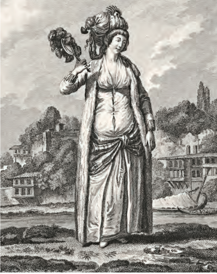
4- Bir Rum kadın (Gouffier)