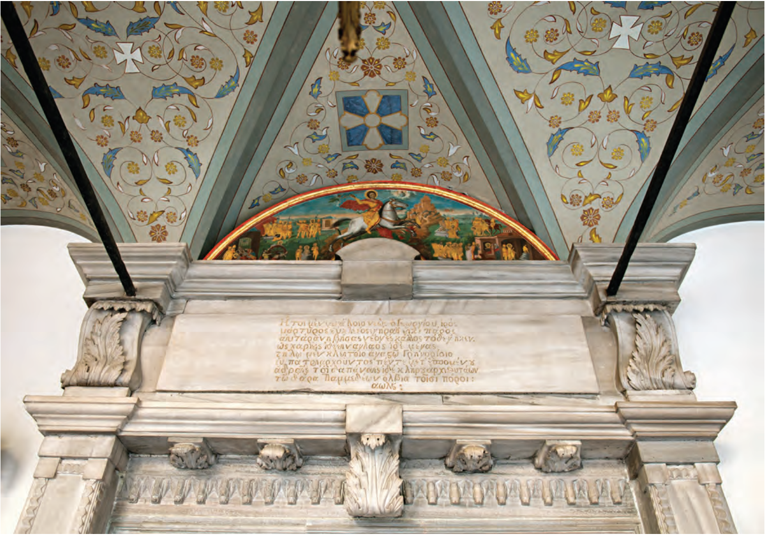
14- Ortodoks kiliseleri mimari olarak 3 bölümden oluşur. Giriş (narteks), orta (soleas) ve din adamlarının girebildiği bölüm olan ieron. Aya Yorgi (Ayios Yeorgios) Patriklik Kilisesi'nin narteks (giriş) bölümünden cemaatin durduğu orta bölüme (soleas) geçişi sağlayan merkez kapısı üstündeki 1835 tarihli restorasyon kitabesi (Yorgo Benlisoy)

Ortodoks kiliseleri içerisinde koltukların dağıtım uygulamasının önemini ve kapsadığı zaman diliminin uzunluğunu belgelemektedir.