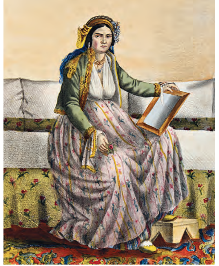
5- Ev kıyafetleriyle bir Rum kadın

Cemaat (Yunanca ενορία: enoria) bir kilise etrafında organize olmuş belirli bir alanda yaşayan din bağlarının hepsini ifade eder. Alan faktörü, cemaat ve üyelerini tanımlamak için önemlidir. Bu bağlamda, Müslüman toplum içerisinde buna en yakın yapı (tabii ki şeklen değil), muhtemelen mahalle yapısıdır. Fakat mahalle yapısı nadiren ibadethaneyle ilişkilidir. Elimizde bulunan bilgi ve belgeler 1860'lara kadar İstanbul'un Ortodoks cemaatlerinin tarih boyunca yerleşmiş aşağı yukarı aynı prensipler etrafında işlev gördüğünü göstermektedir. Somut olarak cemaatler, kilisenin bakımıyla ve muhtemelen mali imkânlar izin verdikçe bölgenin Ortodoks çocuklarına eğitim vermekle ilgilenirdi. Zaman içerisinde oluşan gelenekle yerleşen modele tamamen uygun olarak, cemaatler özel bir otonomiye sahiptiler ve hatta bazen kendi başlarına karar alma yetkileri bile vardı. 1862'nin genel yönetmelikleri ve merkezileştirme endişesiyle yapılan idari yapılanma eski alışkanlıkları iptal etmemiştir. Söz konusu yönetmelikler; kurumsal bir çerçeve sağlamış ve böylece biçim birliği şeffaflığın teminatı olmuştur.