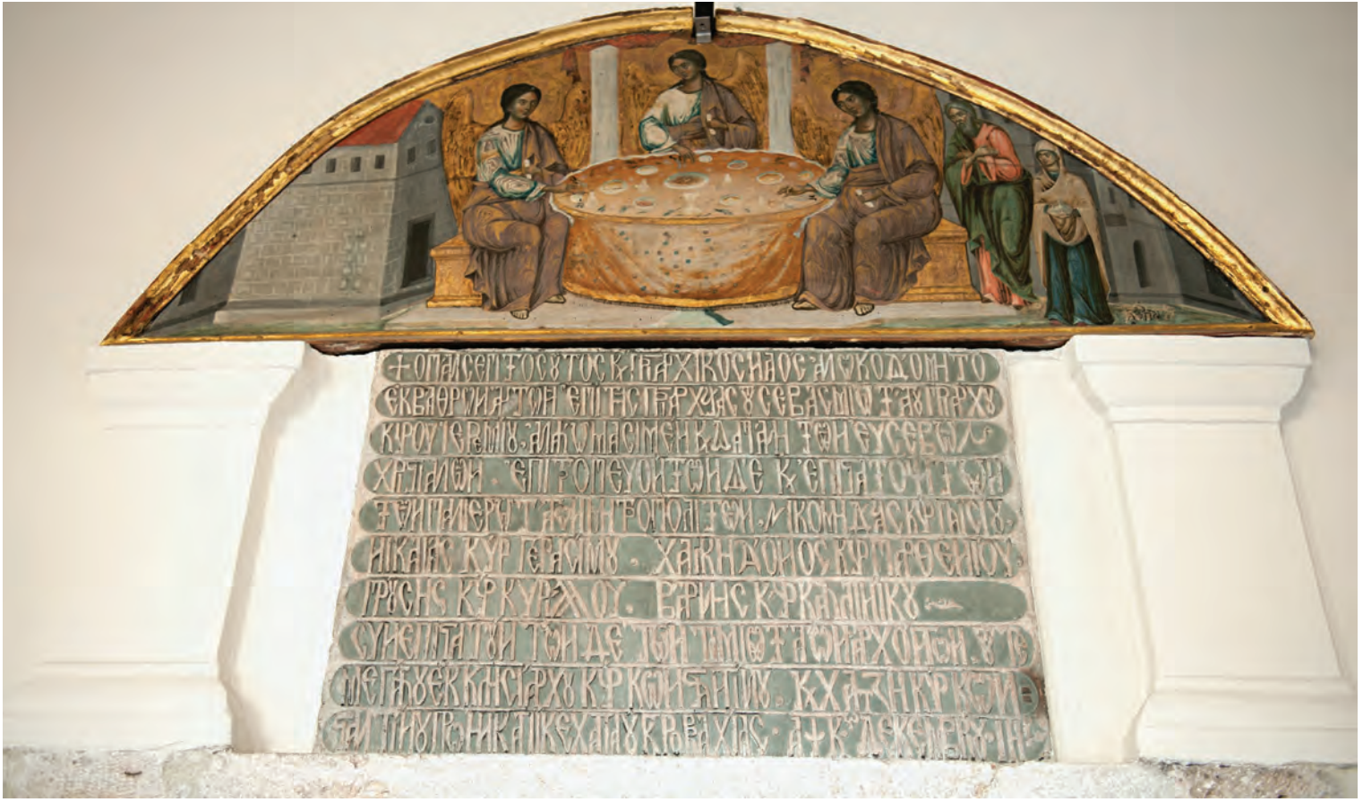
16- Narteks (giriş) bölümünden orta bölüme sağ giriş kapısı üzerinde bulunmakta. Eski Ahit'te anlatılan Hz. İbrahim'in üç melek tarafından ziyaret edilşinin tasviri. Masada oturanlar melekler, sağda durup meleklerle ikramda bulunanlar ise Hz. İbrahim ile karısı Sara

gücünün farkında olan ve şartlar nedeniyle farklı bir yorum yapılması endişesi taşıyan Ekümenik Patrik Meletios, 1923 yılında bu uygulamayı istisnai olarak askıya almıştır. 4