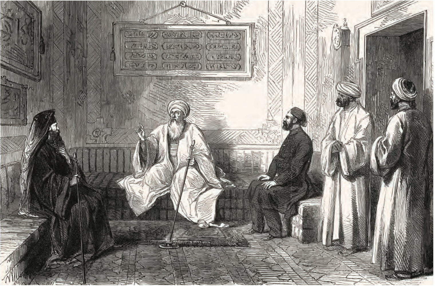
11- Patriğin şeyhülislami ziyareti

Dimitrios'un sekreteri ve sağ kolu olan I. Bartholomeos, Yalta'da belirlenen dünyanın artık bulunmadığı bir zaman diliminde patriklik tahtına oturdu. Soğuk Savaş'ın sonu, SSCB'nin dağılması, Berlin Duvarı'nın yıkılması ve demir perdenin açılması... Birçok yönden bu yeni (ve genç! 1991'de 51 yaşında) patrik, İstanbul Kilisesi'nin prestijini yeniden geriye almak için istediği gibi davranma gücüne sahip olmuştu. Onun atılımıyla Fener, bugünün dünyasına göre yapılanma çabasında, modern bir kurum olma görünümü almıştır.