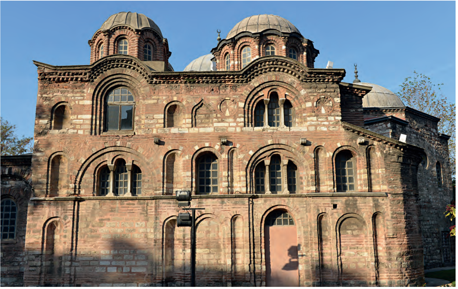
30- Pamphkaristos Manastırı (Fethiye Camii)

söylenmektedir. Ancak şehirde Evergetis adlı iki manastır bulunmaktaydı. Bunlardan Meryem'e ithaf edilmiş olan Theotokos Evergetis Manastırı genellikle surdışında olduğu düşünülen bir yapı iken, İsa'ya ithaf edilmiş olan Hristos Evergetis Manastırı şehirde Haliç'te bulunmaktaydı. Azize Theodosia Kilisesi'nden ise ilk kez XVI. yüzyılın ilk yarısında İstanbul'da bulunmuş, yapıyı görmüş ve bundan "Ayakapısı ile Cibalikapısı yakınındaki Theodosia Kilisesi" diye söz eden bir Fransız tarafından bahsedilmiştir. Yine aynı yüzyılda şehri gezen bir Alman seyyah da İstanbul'un sur kapılarından bahsederken 12 numaralı Ayakapının adını Aya Theodosia'dan aldığını yazmıştır. Öte yandan Azize Theodosia Kilisesi'nin Yeni Ayakapı yakınındaki Sinan Paşa Mescidi olduğu da iddia edilmiştir. Buna sebep olarak da Rus hacılardan Zosimos'un, Evergetis Manastırı'nda gördüğünü söylediği Theodosia'ya ait röliklerin aslında Aya Theodosia Kilisesi'nde bulunduğunu ve bunun da şehri iyi bilmeyen bir yabancıнын birbirine yakın olan iki yapıyı karıştırması nedeni ile olduğu yazılmıştır.