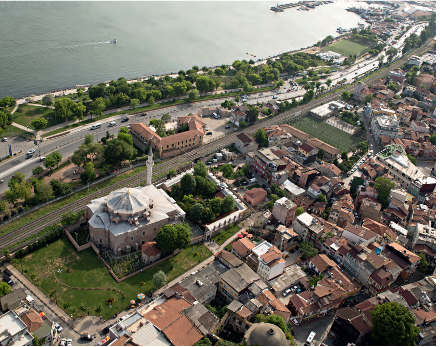
16- Sergios ve Bakkhos Kilisesi (Küçük Ayasofya Camii)

adının geçtiği bir yazıtta dair harf kalıntıları vardır. Asıl itibarıyla olasılıkla tunçtan olan harflerin yeri bugün boştur. İki Nike'nin tuttuğu yuvarlak kalkanın içinde İsa Peygamberin isminin ilk iki harfi olan x ve p içiçe geçmiş biçimde tasvir edilmiştir. Bu uygulama, sıklıkla zaferin sadece bu dünyada değil ama ölümün üzerinde de İsa Peygamber yardımıyla gelebileceğini hatırlatmak adına anıtlarda olduğu kadar lahitlerde de yapılmaktaydı.