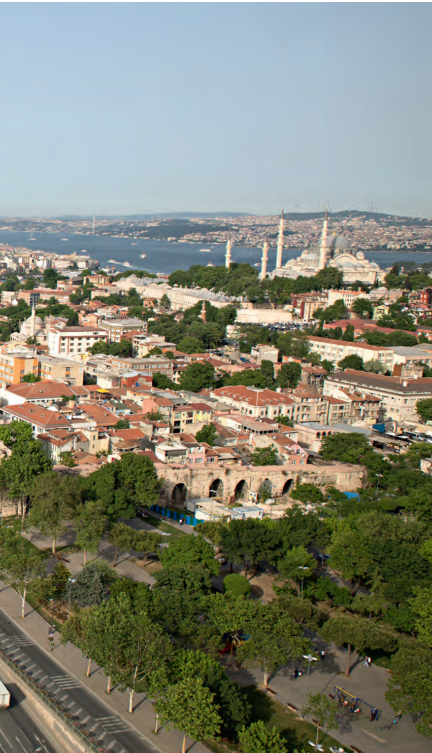
(da), Süleymaniye Külliyesi (sağ tarafta) ve şehrin yükselen kuleleri

çıkan veba salgını halk arasında bu taramaya bağlanmış ve uğursuzluk olarak addedilmiştir. X. yüzyıldan itibaren limanın batısında Amalfi ve Venedikliler yerleşmeye başlamış bunları XI. yüzyılda buraya yerleşen Pisalılar takip etmiş ve bunu son olarak da XII. yüzyılın ortalarından itibaren de limanın güney ve doğusuna yerleşen Cenovalılar izlemiştir. Onlarla beraber bölgeye