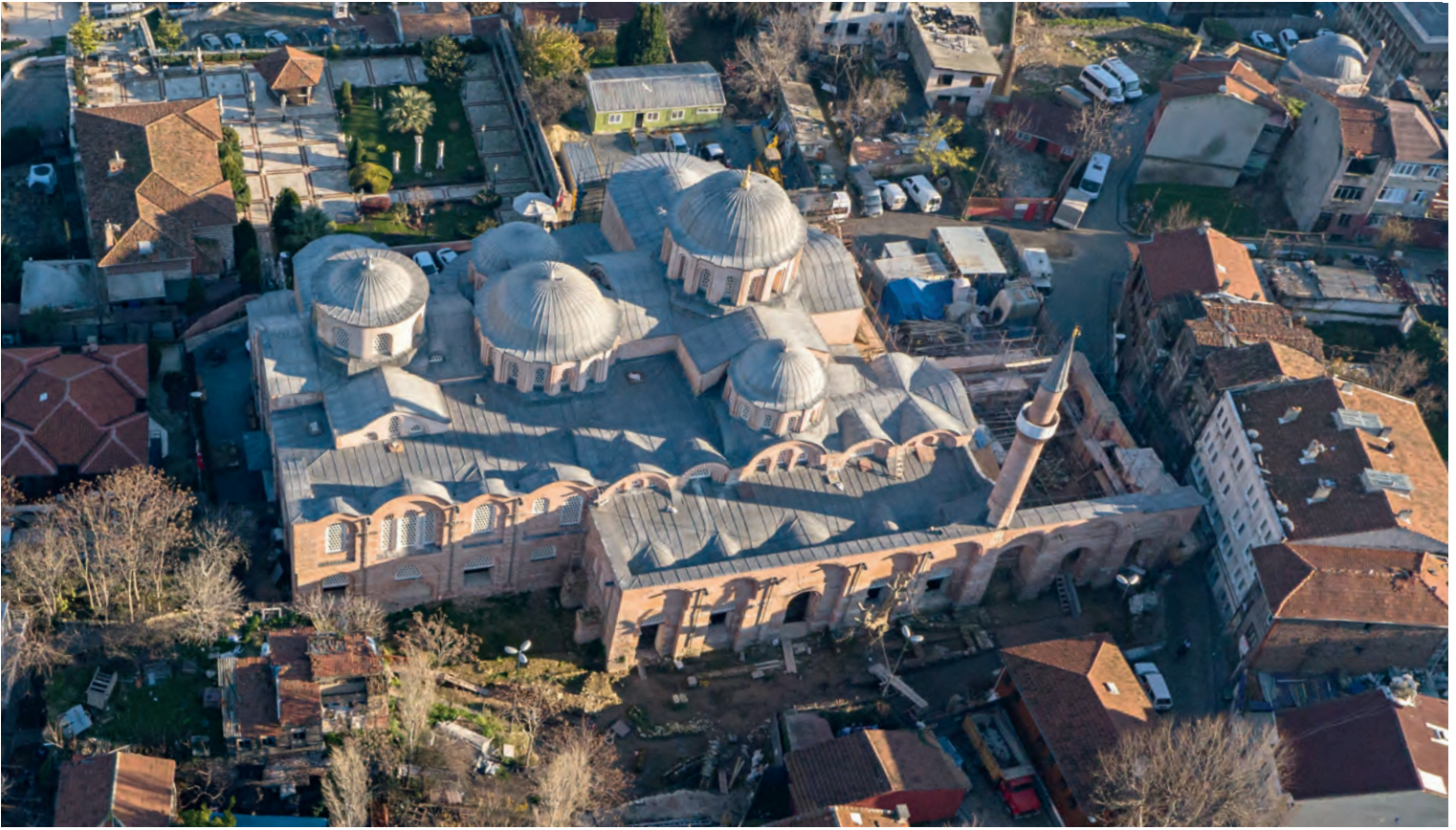
21- Pantokrator Manastırı (Zeyrek Camii)

tipikon sebebiyle manastır topluluğunun bu tarihten önce bitirilmiş olduğu genel olarak kabul edilen bir görüştür. Öte yandan 1134 yılında ölen İmparatoriçe Irene'nin buraya gömülmesi sebebiyle de burada en azından manastırın bazı bölümlerinin bitirilmiş olduğu gerçeği göz ardı edilmemelidir. Bu tür manastırlar genellikle yaşlılıkta ya da herhangi bir siyasi olay neticesinde olumsuz yönde gidebilecek olaylara karşı bir sığınma yeri olarak düşünülmüştür. İmparatorluk ailelerinin geleneksel mezarı olan Havariyun/12 Havari Kilisesi yanındaki yuvarlak binada 1028 yılından sonra yer kalmadığından, manastır, kurucusunun aile üyelerinin gömülmesi amacına da hizmet edecek şekilde planlanmıştır. Bu manastır kiliselerinde ilk gömülen 1134 tarihinde ölen İmparatoriçe Irene olmuş, onun ardından kocası II. Ioannes Komnenos'da (1118-1143) 1143 tarihinde öldüğünde yine buraya gömülmüştür.