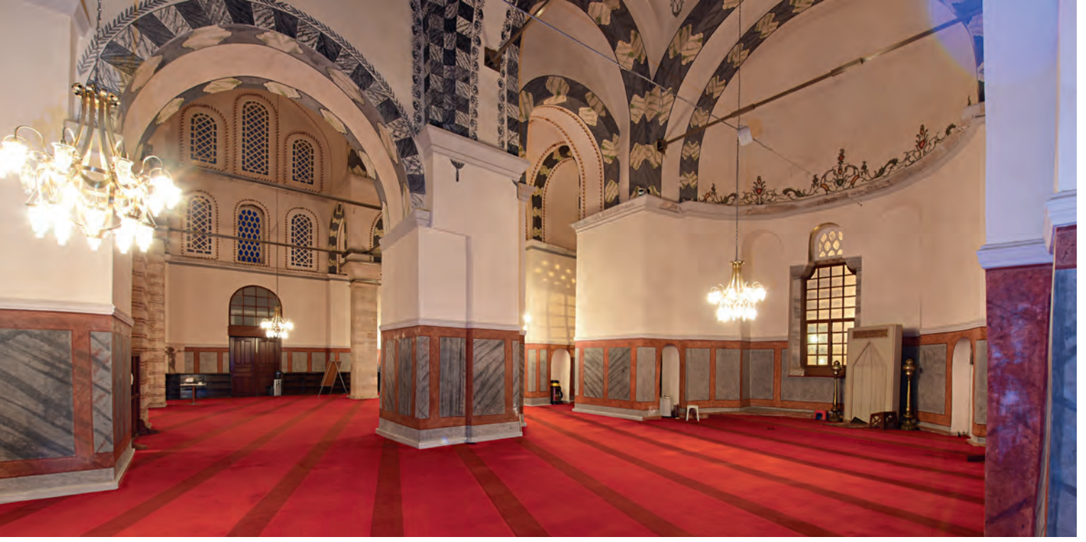
22- Pantokrator Manastırı (Zeyrek Camii)

İçinde bulunduğu mali sorunlar nedeniyle yeni kurulan Haçlı Krallığı'nın son kralı olan II. Baldwin tamirine para ayıramadığı Bizans sarayları yerine, hükümdarlığının son günlerinde manastırı saray olarak kullanmış, hatta buradaki ikameti sırasında çatılardaki kurşun kaplamaları da satmıştır. Manastır ayrıca daha önce Venediklilerce hazine, yönetim binası ve mahkeme olarak da kullanılmıştır.