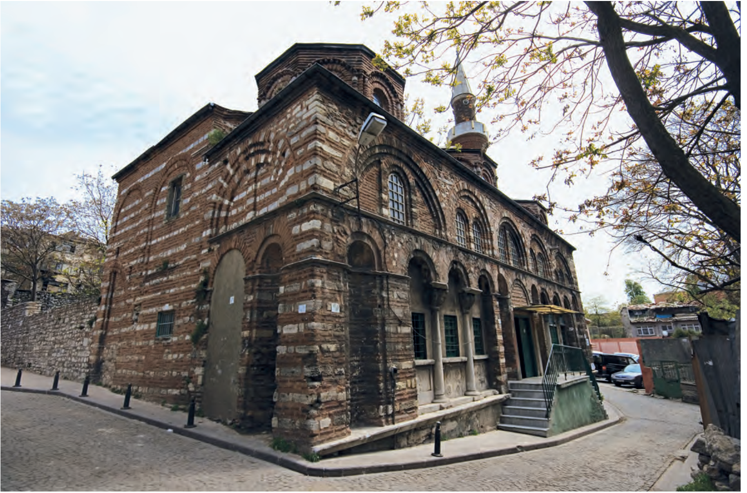
26- Vefa Kilise Camii /Molla Güranî Camii