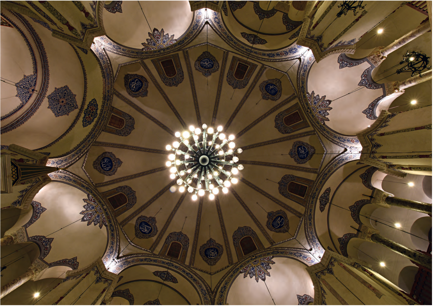
17- Sergios ve Bakkhos Kilisesi (Küçük Ayasofya Camii)

renkli taşların açılan küçük kanallara gömülmesiyle yapılan opus sectile döşeme mozaikleri vardır. Binanın doğu kısmında apsis bölümünün hemen önünde bir krypta vardır. Kilise binasının kuzey cephesinde ve çevre duvarı üzerinde tuğla ile haç tasvirleri yapılmıştır. Mescide çevrildikten sonra kible yönünde bir mihrap oluşturmak için bir duvar çekilmiştir. Bina içindeki tek arkeolojik kazı XX. yüzyıl başları itibarıyla Rus Arkeoloji Enstitüsü tarafından yapılmıştır.