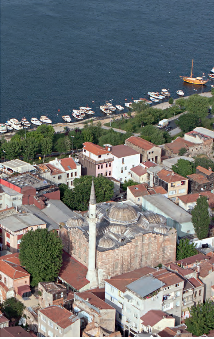
31- Atik Mustafa Paşa/Şeyh Cabir Camii

kadınlar manastırı kilisesi olarak Eufemia Kilisesi'nden bahsetmiştir. Bu yapıya ilişkin bir bilgi de Alman seyyah Reinhold Lubenau'dan alınmaktadır. Lubenau'nun seyahatnamesini yayınlamış olan Sahn'dan öğrenildiğine göre; 1589 ya da bu tarihten kısa bir süre önce İstanbul'da bulunmuş olan Lubenau, patrikhanenin yer aldığı Pammakaristos Kilisesi'ni ziyaret ettikten sonra içinde çok güzel bir suyun bulunduğu (bu yapı olasılıkla bugün ayazması hâlâ faal durumda olan Blakhernai) bir kilise ve bunun yanında içinde Azize Eufemia'nın vücudu bulunan bir başka kiliseyi gördüğünü söylemektedir. Lubenau ilginç bir şekilde, bu kiliseyi gezerken yapı içerisinde renk renk mozaikler bulunduğunu ve kendisinin de bu mozaiklerden arkadaşı Hans Fugen'e vermek üzere bir kese topladığını yazmaktadır. 1980'li yıllarda yapı içerisinde yapılan tamirat çalışmaları sırasında orada bulunan bazı araştırmacılar temizlik çalışmaları sırasında zeminden çıkan kavanozlar