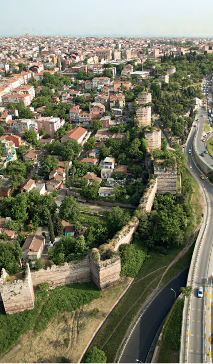
5- İstanbul surları (Edirnekapı'dan Ayvansaray'a)

yaptırıldığı iddia edilmişse de bu surların inşaatının 439'da olduğu genel kabul edilen görüştür. Surlar inşa edilmelerinden kısa bir süre sonra 447 yılındaki depremde hasar görmüş ve onarılmıştır. Bu onarıma ait tamir kitabesi XIX. yüzyılın ortalarında Yenikapı civarında görülebilirken daha sonra kaybolmuştur. 763 yılının kışı kutup soğuklarını getirmiş, Karadeniz kıyısında metrelerce genişlikte bir alan donmuş, ayrıca kopup gelen buz kütleleri surlara hasar vermişlerdir.