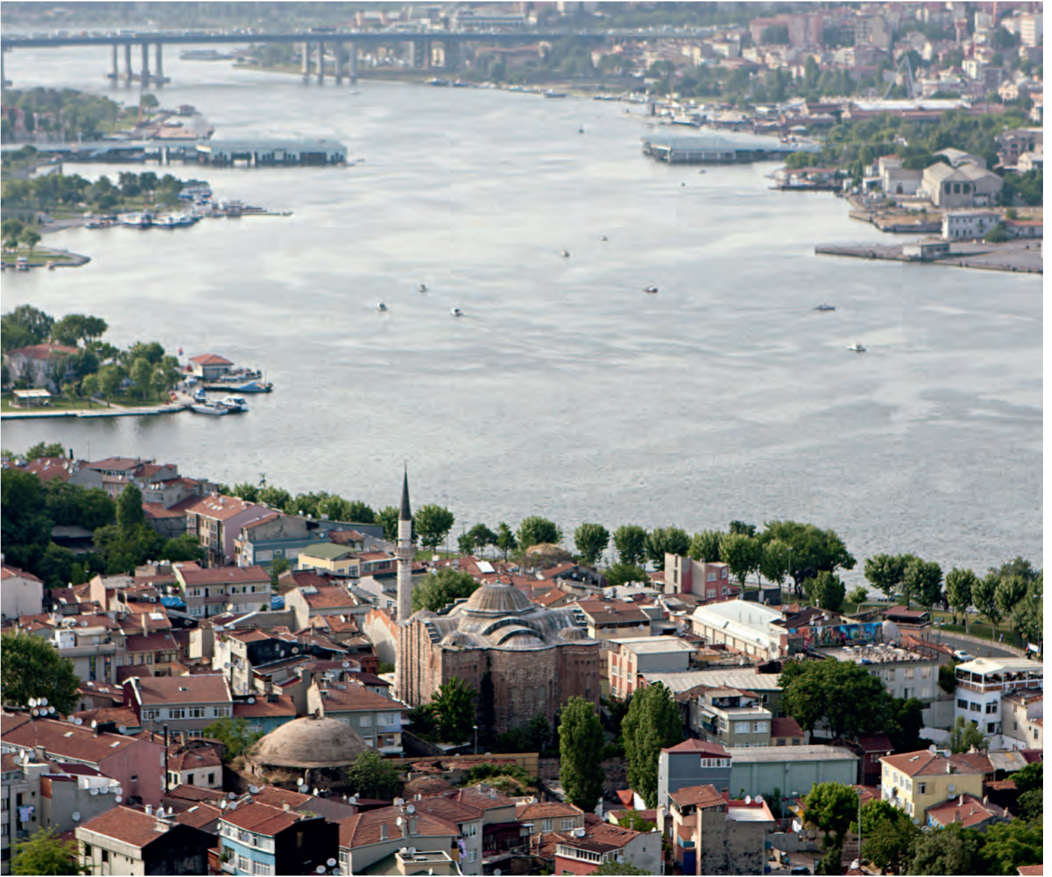
29- Hristos Evergetis Manastırı Kilisesi (Gül Camii)

gelen bu alt yapı içerisinde yapılan çalışmalar sonucunda, bunun yakınında yine manastıra ait başka mimari bölümler daha ortaya çıkarılmış ancak kesin işlevleri belirlenememiştir.