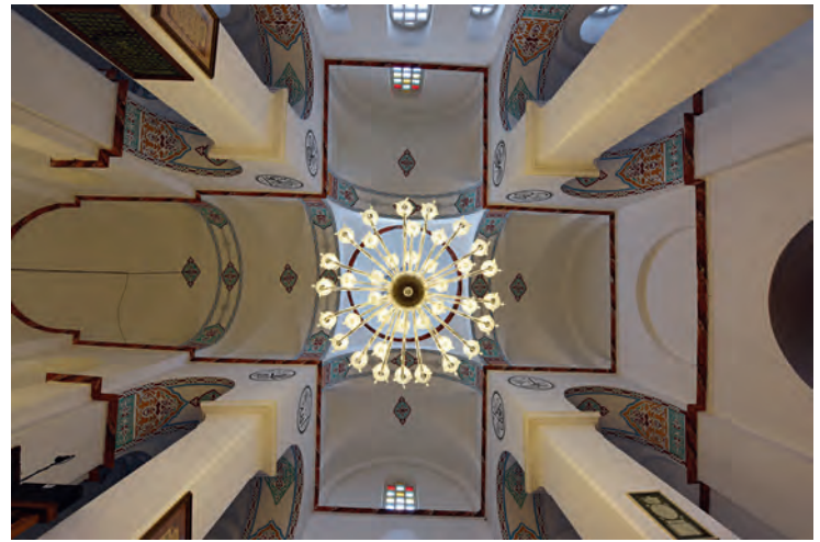
19- Mirelaion Manastırı Kilisesi (Bodrum/Mesih Paşa Camii)

Iustinianos Mozolesi adıyla anılan ve serbest kollu haç planlı ikinci mezar binasında I. Iustinianos'la başlayıp İmparator Theofilos'un kızı Maria'yla sonlanan yirmi üç imparatorluk ailesi üyesi gömülmüştür.