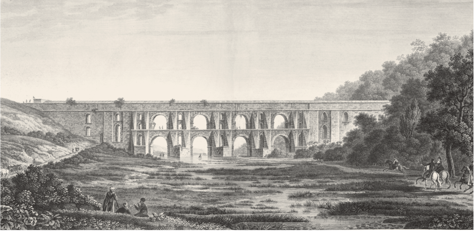
9- Justinyen Kemer (Melling)