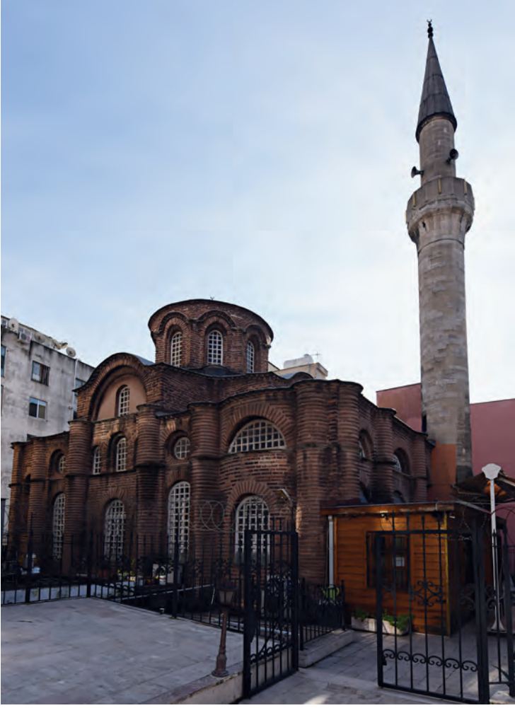
20- Mirelaion Manastırı Kilisesi (Bodrum/Mesih Paşa Camii)

binasına dönüştürülmüştür. Bunun en bariz göstergesi kuzey duvarı üzerinde yer alan Hz. Meryem ve yanında kadın bir banıyı gösteren freskodur. Kilisenin alt yapısı içinde güneydoğu duvarında bir kadın ve Hodegetria Meryem'i (Yol Gösteren) tasvirli bir fresko bulunmuştur. Bundan da yapının Palaiologoslar döneminde geçirdiği tamirin ardından alt yapının ilk defa bir gömü yeri olarak kullanılmaya başladığı anlaşılmıştır. Kilisenin bağlı bulunduğu kadınlar manastırı X ve XI. yüzyıllarda imparatorluk ailesinden asil kadınların kaldığı bir yer iken, Palaiologoslar devrinde 1315 yılı civarında bir erkekler manastırına dönüştürülmüştür. Alt yapı, devşirme başlıkları olan dört sütun yardımıyla üstünde bulunan kilise yapısını desteklemektedir.