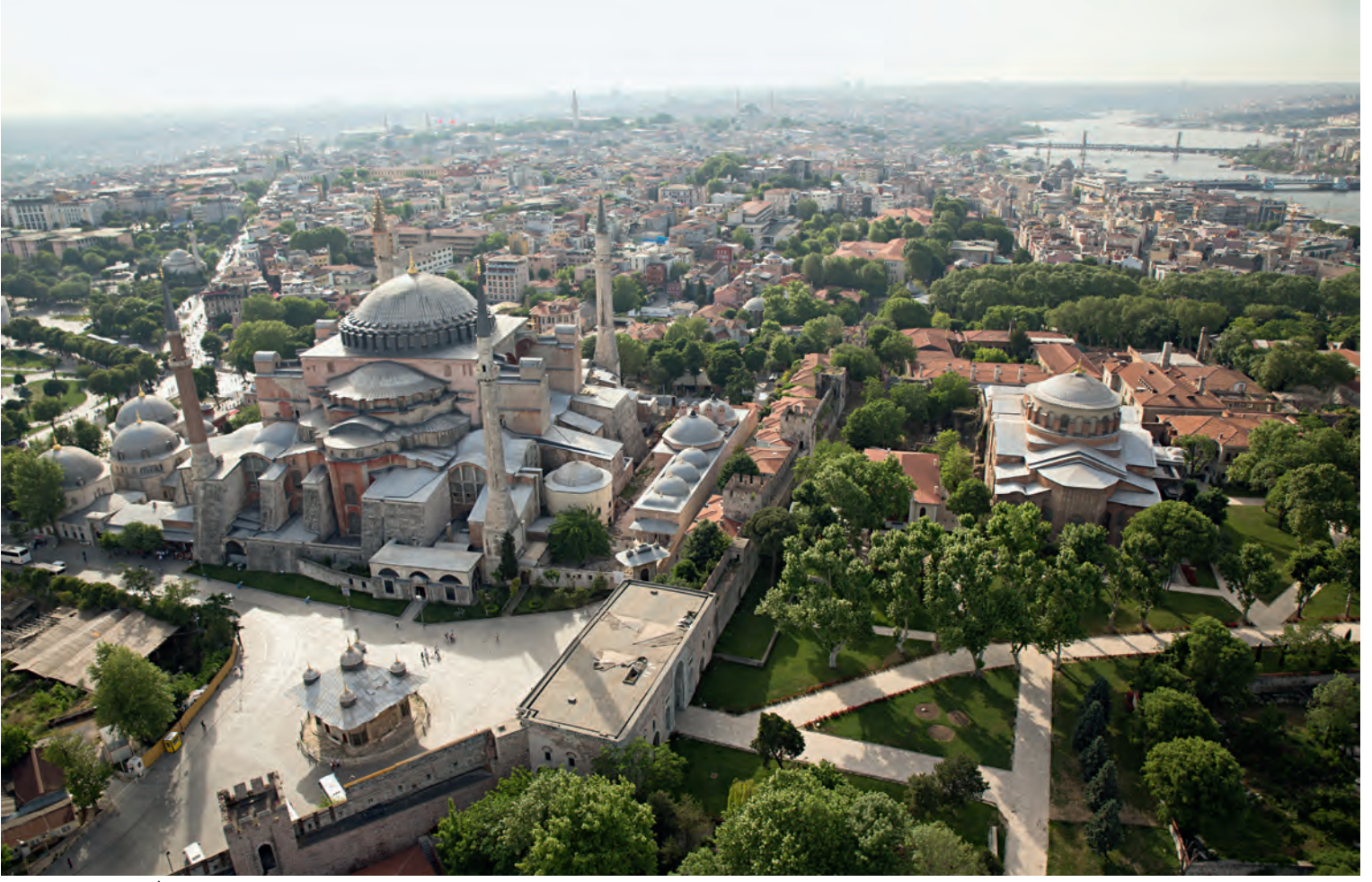
1- Ayasofya ve Aya İrini

Bryas Sarayı'nı inşa eden Patrikes ve Pantokrator Manastırını (Zeyrek Camii) inşa eden Nikeforos'tur.