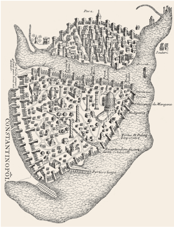
8- İstanbul'un surları, abideleri ve limanları (Coignard)

Limanların tek başına bir mimari yapı olarak değil de bununla ilintili yapılarla birlikte değerlendirilmesi gerekmektedir. Buna göre, yakınlarında olması gereken ambarların da bu çerçevede yer alması lazımdır. Varlıkları kaynaklardan bilinen ve tahıl, yağ gibi maddelerin muhafaza edildikleri horreumların limanlardan uzaklarda olmaması gerekmektedir. Ancak bugüne kadar kent içinde horreum olarak belirlenebilmiş bir yapı bulunamamıştır.