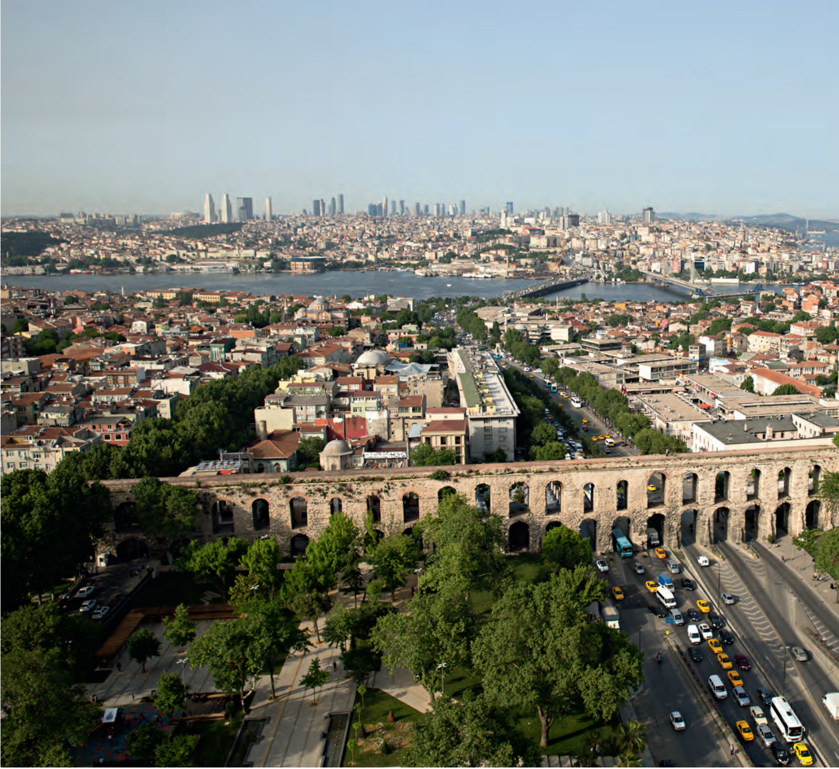
10- Şehrin üç dönemi (Bizans, Osmanlı, Cumhuriyet) ve bu döneme ait mimari eserler bir arada Valens (Bozdoğan) Su Kemerı (ön tarafta), İMÇ ve SSK binaları (yolun sağında ve solunda)

1957'de inşaatı başlanan sahil yolu ile Boukoleon Limanı'na ilişkin önemli bilgiler yok olmuştur.