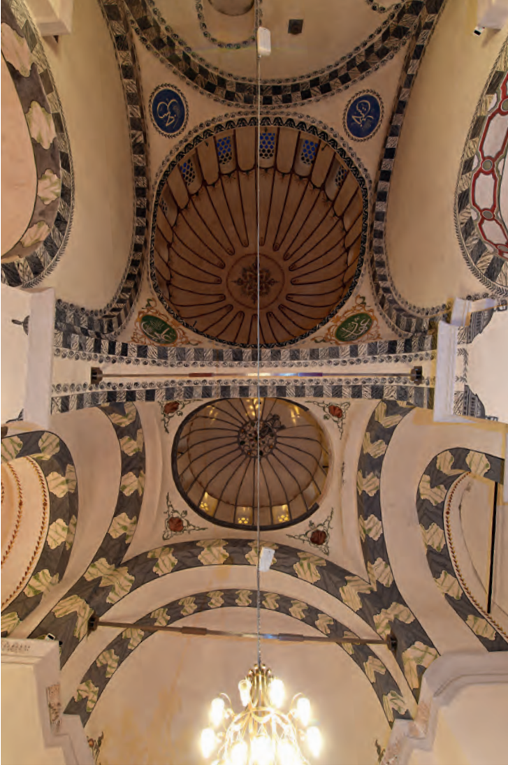
23- Pantokrator Manastırı (Zeyrek Camii)

Meryem Ana'ya ithaf edilmiş olan kuzey kilisesi kubbenin sütunlarla desteklediği tipte kapalı Yunan haçı planlı bir yapıdır. Bizans döneminde kubbeyi destekleyen dört sütun, Osmanlı döneminde yerlerine konan payelerle değiştirilmiştir. Bunlardan doğu yönünde bulunan ikisi dörtgen ve kesme taştan, batı yönündeki diğer ikisi ise altıgen ve taş tuğla almaşık biçimde örülmüşlerdir.