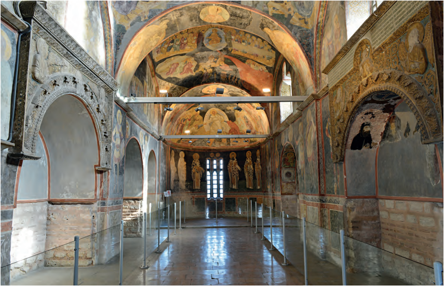
32- Hora Manastırı Kilisesi (Kariye Camii)

Komnenos'un kayınvalidesi Maria Dukaena tarafından olasılıkla 1077-1081 yılları arasında yeni bir kilise inşa ettirilmiştir.