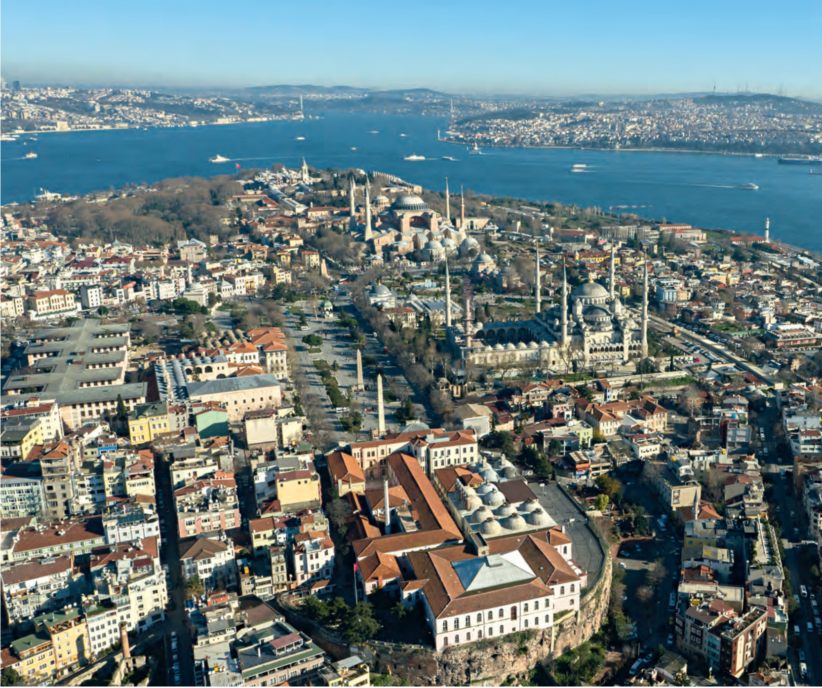
6- Hipodrom ve Büyük Saray'ın duvarları (Ön tarafta)

Kent içinde bulunan imparatorluk sarayları içinde en eskisi Büyük Saray adıyla anılan yapıdır ve yapı, IV-XI. yüzyıllar arasında kullanımda kalmış, bu tarihten sonra sürekli onarım gerektirmesi üzerine özel törenler dışında kısmen kullanılmak haricinde terk edilmiştir. Bu tarihten sonra bugünkü Ayvansaray semtinde bulunan Blakhernai Sarayı kullanılmıştır. Büyük Saray'a ait Iustinianos Evi ya da Bukeleon Sarayı adıyla bilinen bir kısmı bugün hâlâ Ahırkapı civarında ayakta durmaktadır. 1990'larda Topkapı Sarayı'nın girişi karşısında ve Four Seasons Oteli