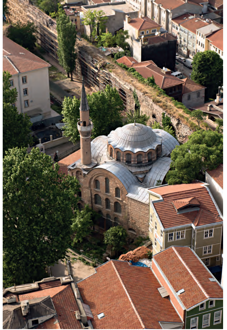
24- Meryem Ana Kiriottissa Manastırı Kilisesi (Kalenderhane Camii)

Bu bölümdeki kubbe, binanın boyutlarıyla kıyaslanınca küçük kalmaktadır. Diğer bölümlerin aksine buradaki kubbe üzerinde kaburgalar görülmemekte ve kubbe üzerinde sekiz adet pencere bulunmaktadır. Orta yapıda örnekleri görüldüğü gibi bu kubbenin tam ortasında da son onarımlar sırasında yapılmış bitki süslemesi vardır. Kapalı kollu haç planlı yapıda, haçın güney kolunu oluşturan ve orta yapıya geçişte bulunan tonozun doğu ve batı yönündeki tuhaf görünümlü derin pencereler, kubbenin ağırlığının olasılıkla bu yöne kaymasına sebep olmaktadır. 1997 yılında başlayan çalışma ile