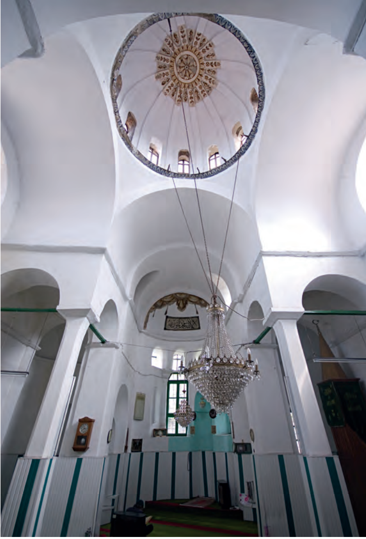
27- Vefa Kilise Camii / Molla Güranî Camii