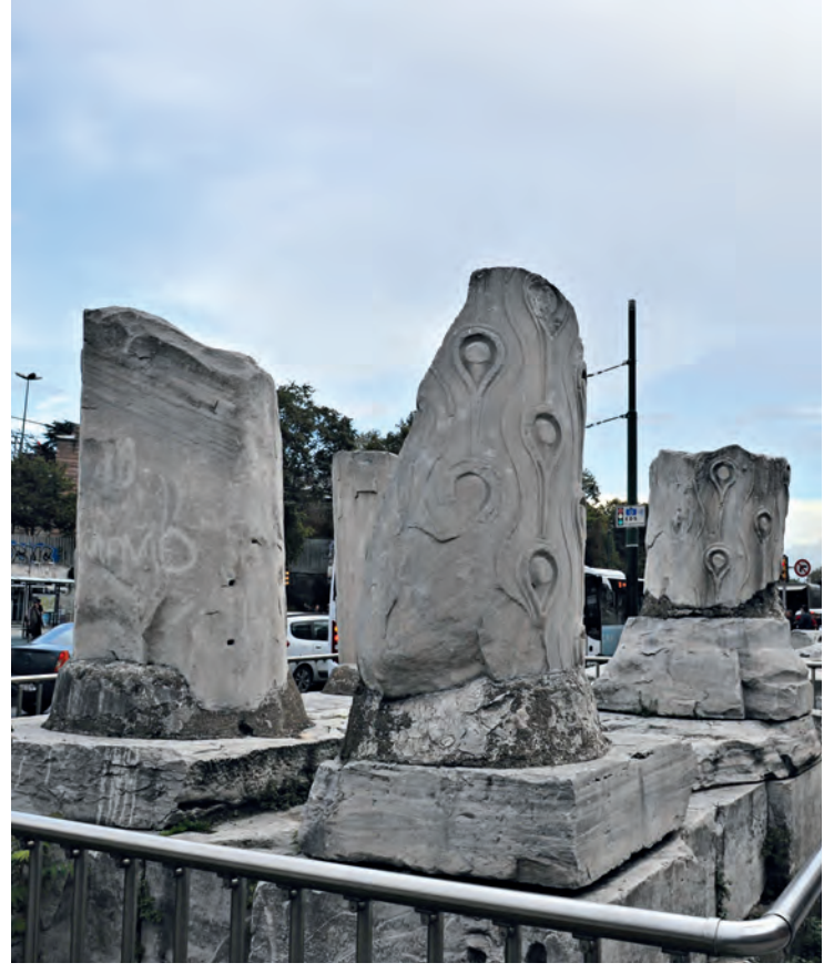
14- Forum Tauri-Forum Theodosios'un kalıntıları

Hipodrom'un orta bölümünde yer alan tek parça pembe granit Mısır Dikilitaşı MÖ XV. yüzyılda Firavun III. Thutmosis döneminde dikilmiş, İstanbul'a olasılıkla İmparator Iulianus Apostata (361-363) döneminde getirilmiş, ancak I. Theodosios (379-395) döneminde