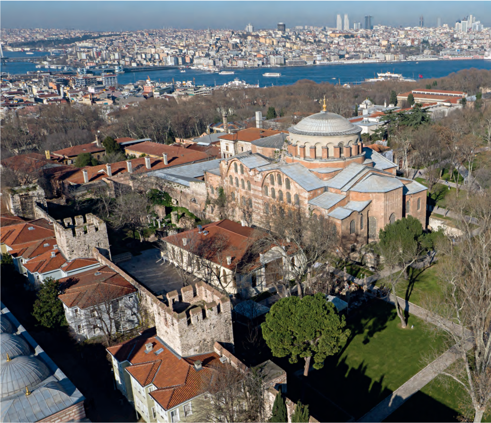
18- Aya İrini

boyutlu haç, ikonklazma dönemi sanatının en önemli temsilcilerinden kabul edilmektedir.