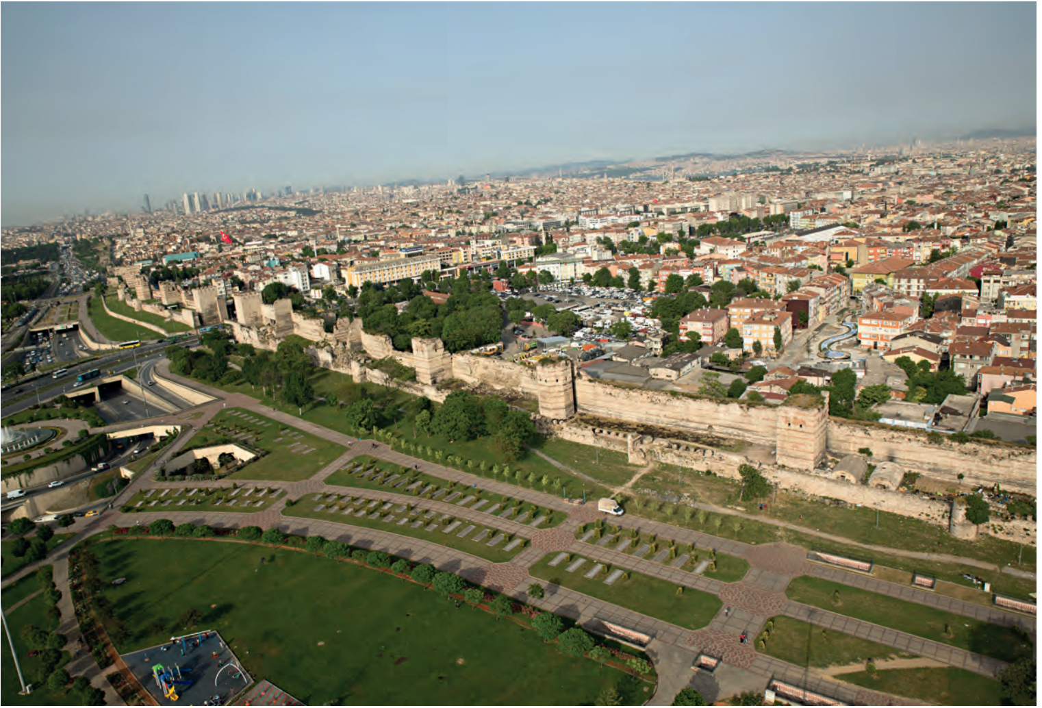
4- İstanbul surları (Vatan Caddesi'nden Topkapı'ya)

bulunmuş bir yazıtta surun iki ayda yapıldığı belirtilse de, bu boyutta bir yapının inşaatı için bu sürenin mümkün olamayacağından, olasılıkla bu bir tamir kitabesidir.