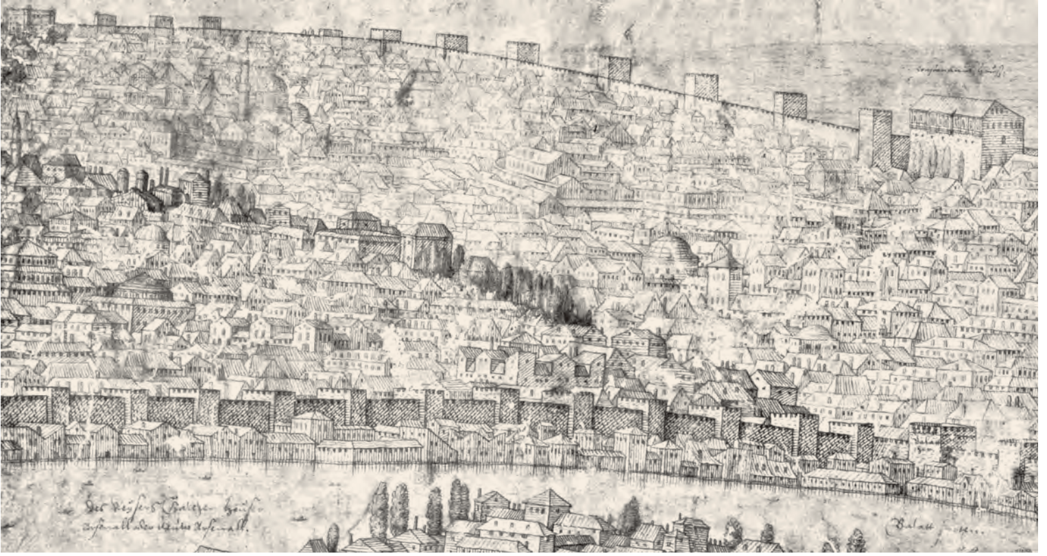
2- Kara ve deniz surları (Edirnekapi ve Ayvansaray çevresi), XVI. yy. (Lorichs'den detay)