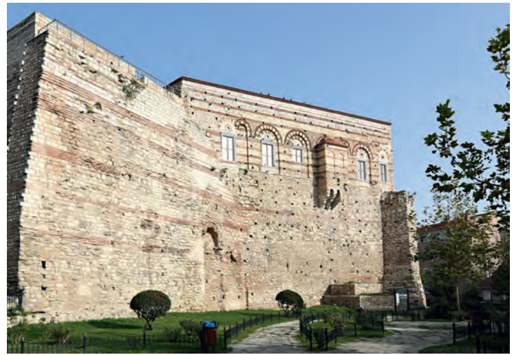
7- Tekfur Sarayı

XI. yüzyıl sonlarından itibaren oturulmaya başlanan Blakhernai Sarayı 'na ait bazı bölümler bugün dahi kullanılabilir derecede iyi durumdadır. Bunlar içinde en bilineni Tekfur Sarayı adıyla anılan kısımdır. Batı cephesinde Bizans'ın özellikle son döneminde (1261-1453) çokça görülen renkli tuğla ve taşlarla yapılan