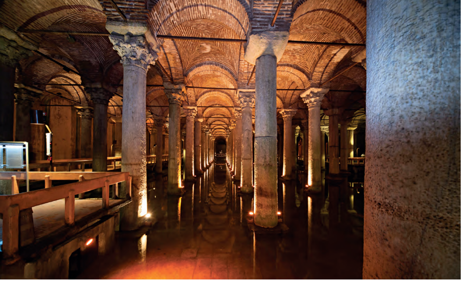
11- Binbirdirek Sarnıcı