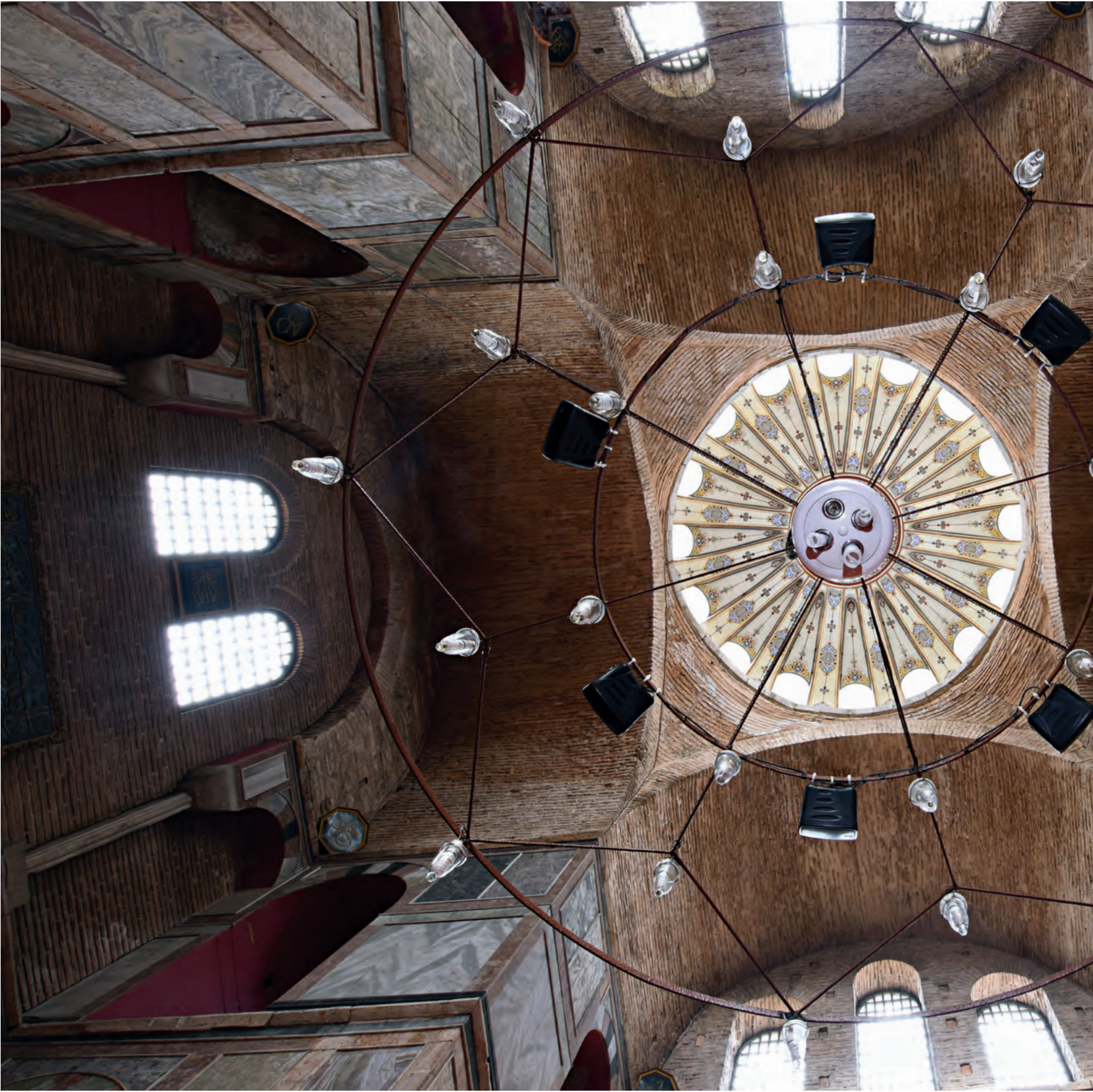
25- Meryem Ana Kiriottissa Manastırı Kilisesi (Kalenderhane Camii)

yüzyıla kadar kullanılmış olan bir Roma hamamıdır. Bugünkü yapının olduğu yerde inşa edilen ilk kilise ise VI. yüzyılın son çeyreğine tarihlenen ve Kuzey Kilisesi adıyla anılan yapıdır. Bunun hemen ardından Bema Kilisesi