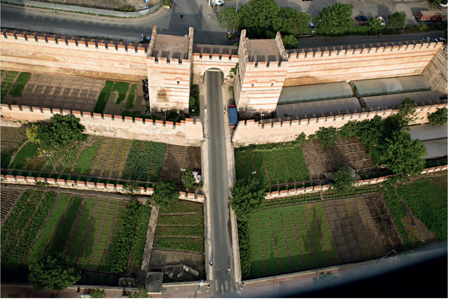
3- İstanbul surlarının üç aşaması (Belgrat Kapısı çevresi)

ortalama yükseklikleri 11 m ve çokgen olanların ortalama iç çapları da 5 m kadardır.