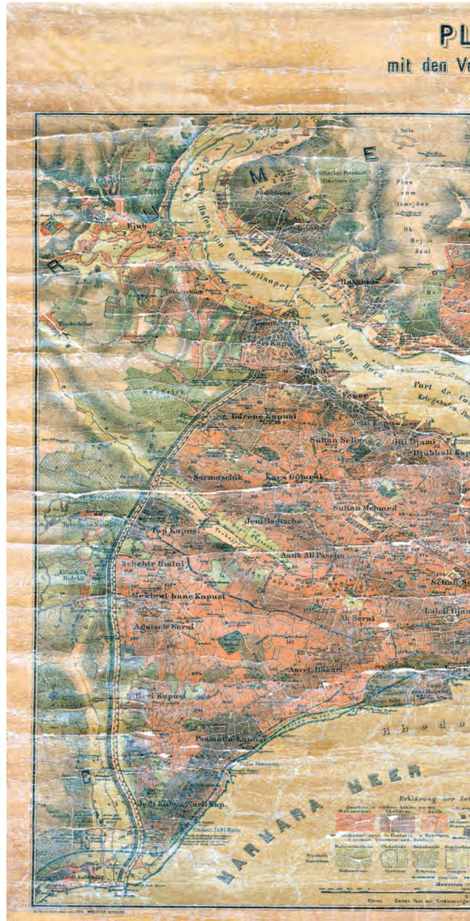
12- İstanbul'un yerleşim alanlarını gösteren 1880 tarihli plan (C. Stolpe, İÜ., Nadir Eserler Ktp., Haritalar Bölümü)

* Bu liste aynı tarihli İstanbul Vakıfları Tahrir Defterî 'nden oluşturulmuştur.