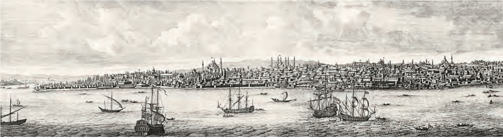
2- İstanbul panoraması (Bruyn)