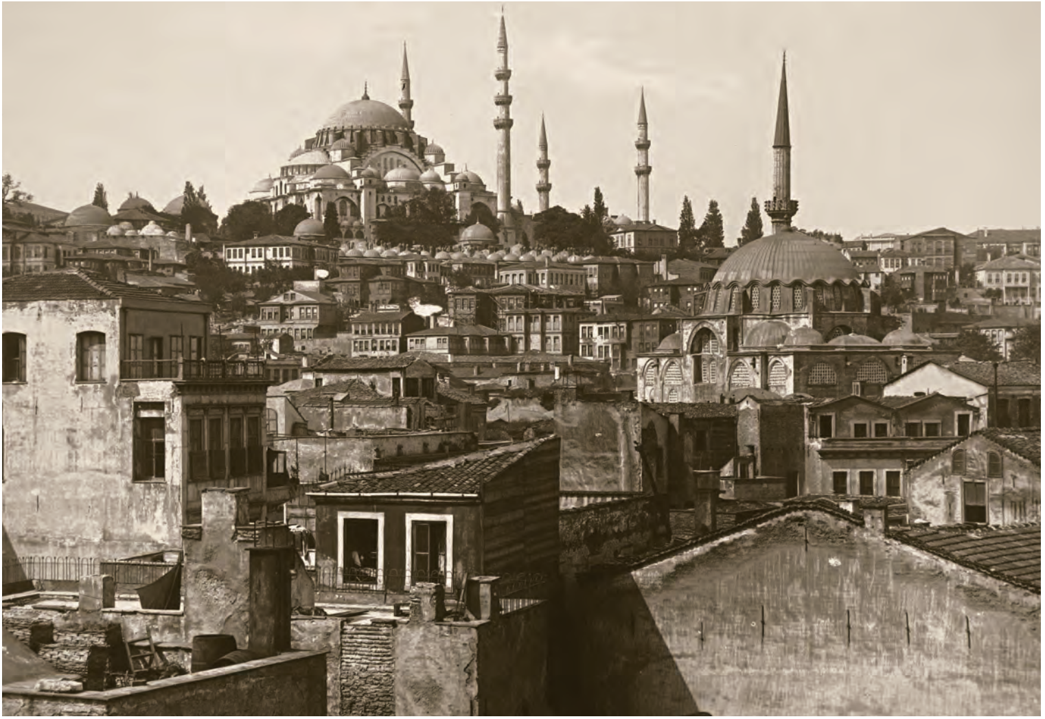
17- Süleymaniye Mahallesi