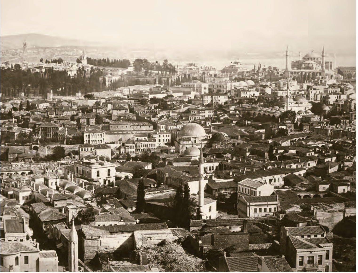
13- Ayasofya ve çevresi

1. belediyede 76, 2. belediyede 40, 3. belediyede 46, 4. belediyede 29, 5. belediyede 40, 6. belediyede 24, 7. belediyede 43, 8. belediyede 41, 9. belediyede 33, 10. belediyede 10, 11. belediyede 30, 12. belediyede 10, 13. belediyede 14, 14. belediyede 26, 15. belediyede 17, 16. belediyede 11, 17. belediyede 30, 18. belediyede 4 mahalle bulunuyordu. Son iki belediyeden biri Erbaa kazası, diğeri İzmit sancağıydı. Buna göre suriçi İstanbul'da 298, bütün İstanbul'da ise 524 mahalle mevcuttu.