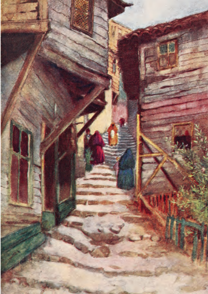
14-15-16- Üsküdar sokaklarında gündelik hayat (Milligen)

Hacı Hüseyin Ağa Hacı Kadın Hacı Timur Hubyar Kasap İlyas Kâtip Muslihittin- Altımermer Kıçı Hatun Kocamustafapaşa Kürkçübaşı Ahmet Şemsettin Nevbahar Sancaktar Hayrettin Seyid Halife Seyid Ömer Veled-i Karabaş