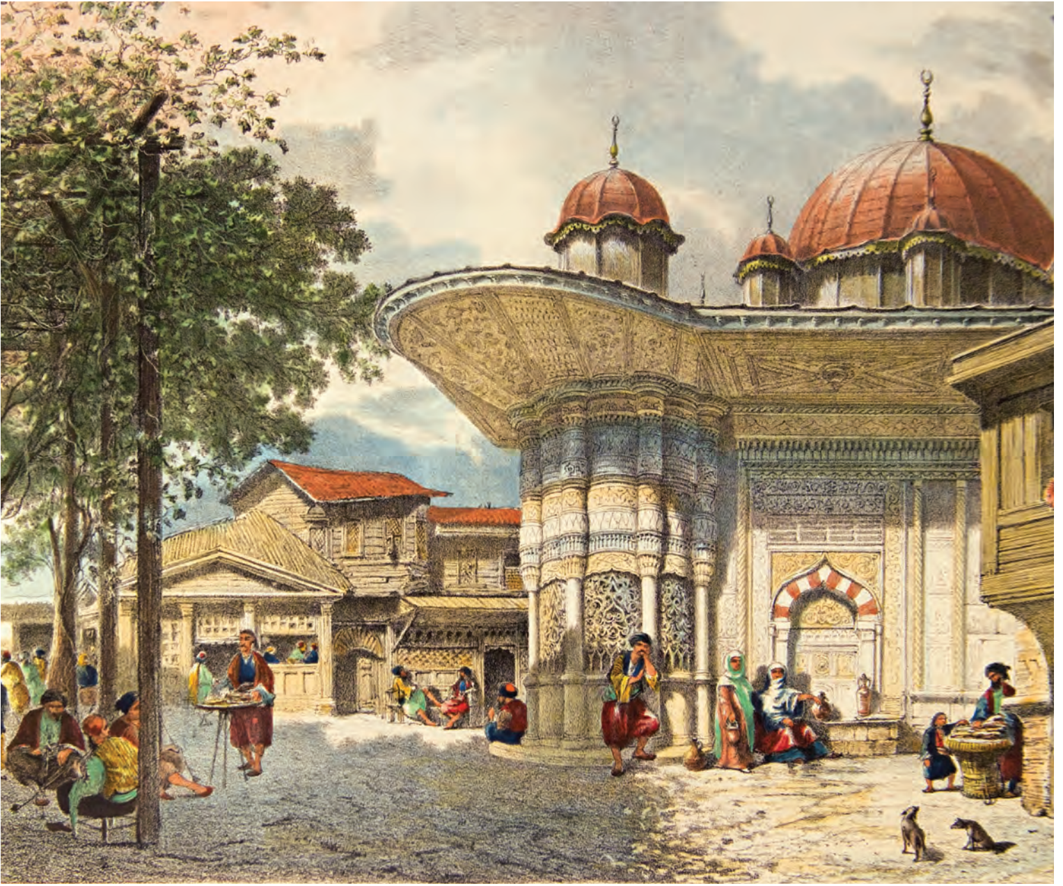
10- Galata çeşmesi, çevresindeki yerleşim alanı ve semt sakinleri (Flandin)

olayın aydınlığa kavuşturulmasında ve doğan bir zararın karşılanmasında da müştereken sorumluydu. Mahallelerde çıkan yangının söndürülmesi bile ilgili mahallenin doğrudan sorumluluğu altındaydı. Mahalle, üyelerinin ortak bir mabette ibadet ettiği ve nüfusu yaklaşık 1.000 kişiden oluşan yerleşim birimi olarak belirtilir. 1864 Vilayet Nizamnamesi 'nde mahalle, ev sayısı dikkate alınarak "en az elli haneden oluşan bir yerleşim birimi" şeklinde tarif edilmiştir. Mahallelerde vergi yükümlüsü reaya kayıtlara, buldukları mahallelere göre ismen yazılmış, oturdukları binaların hangi mahalle sınırları içinde bulunduğu belirlenmiştir. Bu durum mahalle yönetiminin merkezî yönetimin denetimi altında olduğunun da göstergesidir.