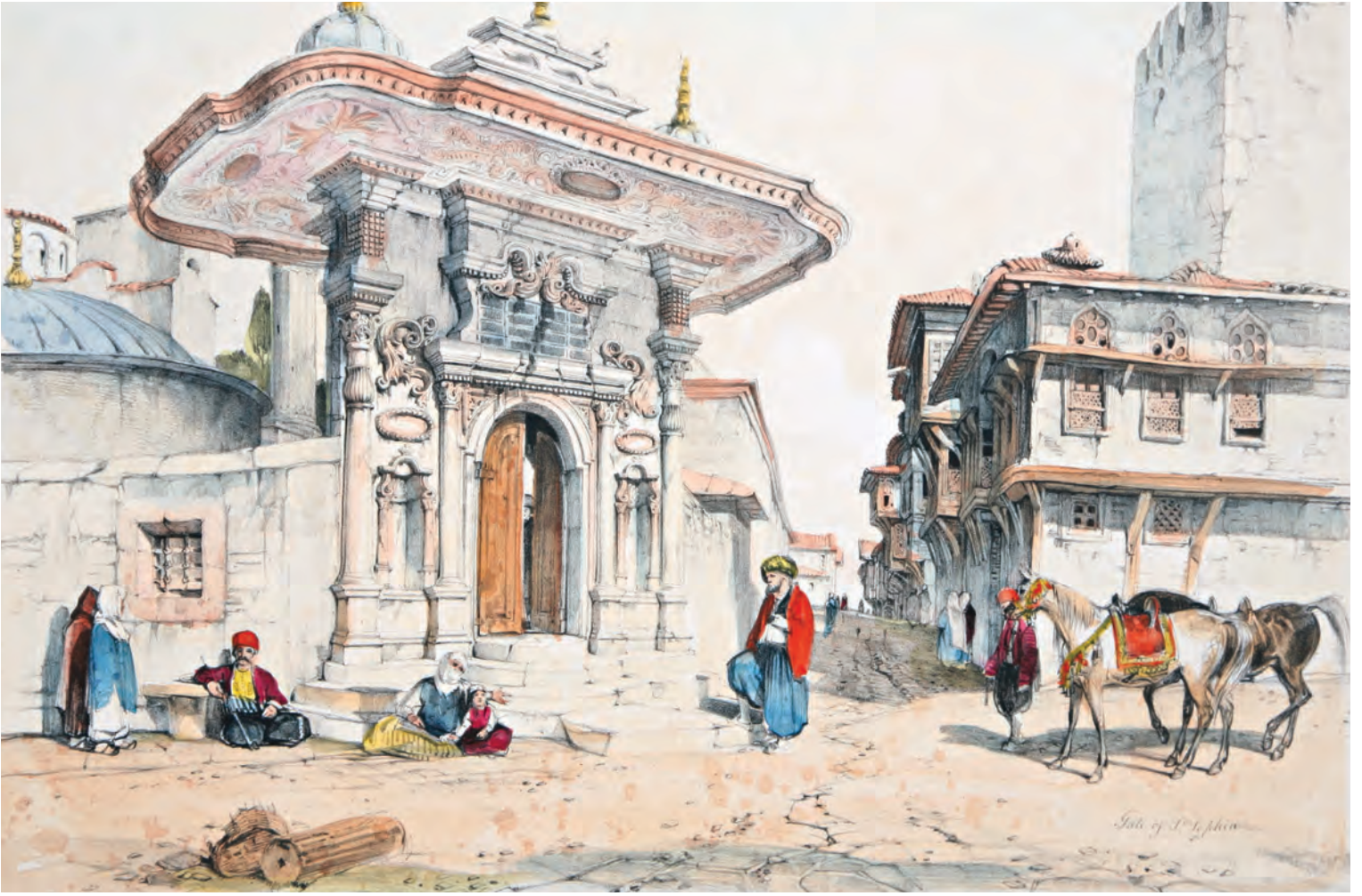
9- Soğukçeşme Sokağı, sokak sakinleri ve Ayasofya imareti (Lewis)

ev verilmek ve vergi muafiyeti getirilmek suretiyle Hasköy'e taşınmasıyla boşalan muhitin, bir Müslüman mahallesine dönüştüğü anlaşılmaktadır. 1727'de ise, Balıkpazarıkapısı dışında yaşayan Yahudilere, mülklerini Müslümanlara satarak diğer Yahudi mahallelerine taşınmaları bildirilmişti. Bunun aksi de vaki idi: 1636'da Langa'da Kâtip Kasım Mahallesi'nde Müslüman evlerinin sayısının, gayrimüslimler tarafından satın alınmak suretiyle 300'den 33'e indiği görülmekteydi. Bu ve benzeri durumlarda çıkarılan fermanlarda, Müslüman evlerinin Hristiyanlara satılmasının yasak olduğu ve Hristiyanların surdışında ev yapmaları belirtilmekteydi. Mahallelerin kimlik değiştirmesi, aynı dinden olup farklı yapılanmalar hâlindeki kimliklerin bir araya gelmesine de neden olabiliyordu. Mesela 1633 ve 1660 yangılarından kaynaklanan iskân yeri değişikliği ihtiyacı nedeniyle, yüz küsur yıldır ayrı yaşayan Romaniot, Sefarad ve Karaî Yahudi cemaatleri tek cemaat hâline dönüşmüştü.