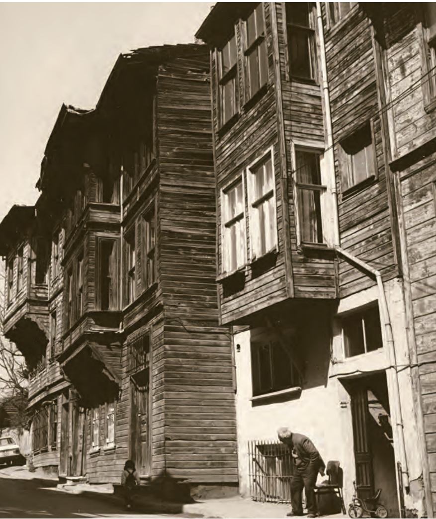
18- Eski bir İstanbul sokağı