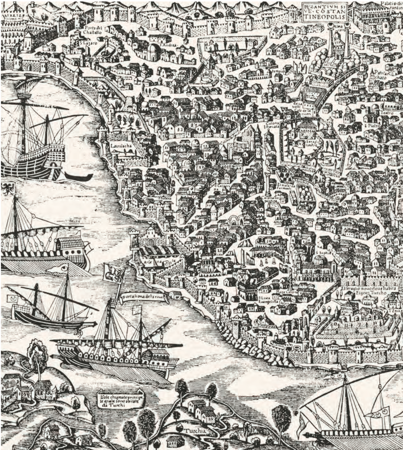
1- İstanbul: Suriçi, Galata ve şehri kuşatan surlar (Vavassore), XVI. yüzyıl