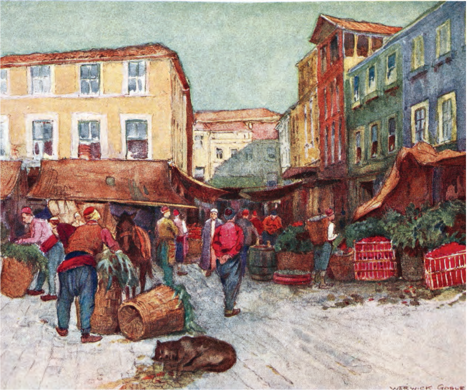
11- İstanbul'da bir mahalle pazarı (Millingen)

sayılmakta, görevi boyunca raiyyet ve avarız vergilerinden, 1826'ya kadar da askerlik hizmetinden muaf tutulmaktaydı. İmamın mevkidaşı olan kocabaşılardan da vergiden muaf olduğunu biliyoruz. Padişahın emirleri kadı tarafından imamlara aktarılır veya münadilerce pazar yerleri ve caddelerde ilan edilirdi. İmam; cemaatine yönelik dinî ibadet ve eğitim hizmetleri yanında, mahalledeki sosyal düzenin, fahişe kadınlar ile bunlarla nikâhlananların mahalleden ve İstanbul'dan çıkartılması dâhil ahlaki asayişin sağlanmasından ve mahallenin idareye olan yükümlülüklerini yerine getirmesinden de sorumlu idi. İmam, üzerine düşen ödevleri yapmayan fertleri resmî makamlara, özellikle kadıya bildirmek mecburiyetindeydi.