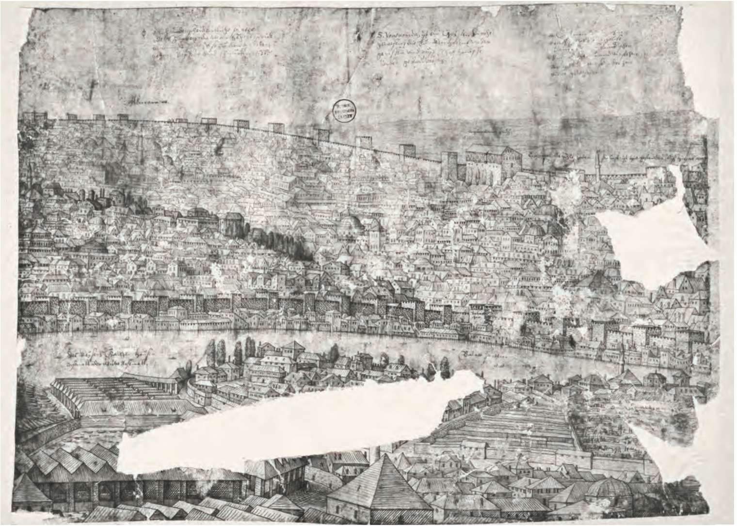
5- Surlar ve Suriçi İstanbul'undan bir kesit (Lorichs)

şehir kesimi” şeklinde tanımlanır. Bu açıdan mahalle şehirleşmenin bir önceki evresi olan “dar mekânlı” bir cemaat hayatıdır. Halkın çeşitli kimliklere göre bölge ve mahallelere ayrılması, İslam şehrinin en önemli özelliği olarak vurgulanır. “Müslüman mahallesinde salyangoz satılmaz.” sözü ile suriçi İstanbul’un “müminler şehri” 3 olarak nitelendirilmesi de, dinin mahalledeki yansıması olarak görülmelidir.