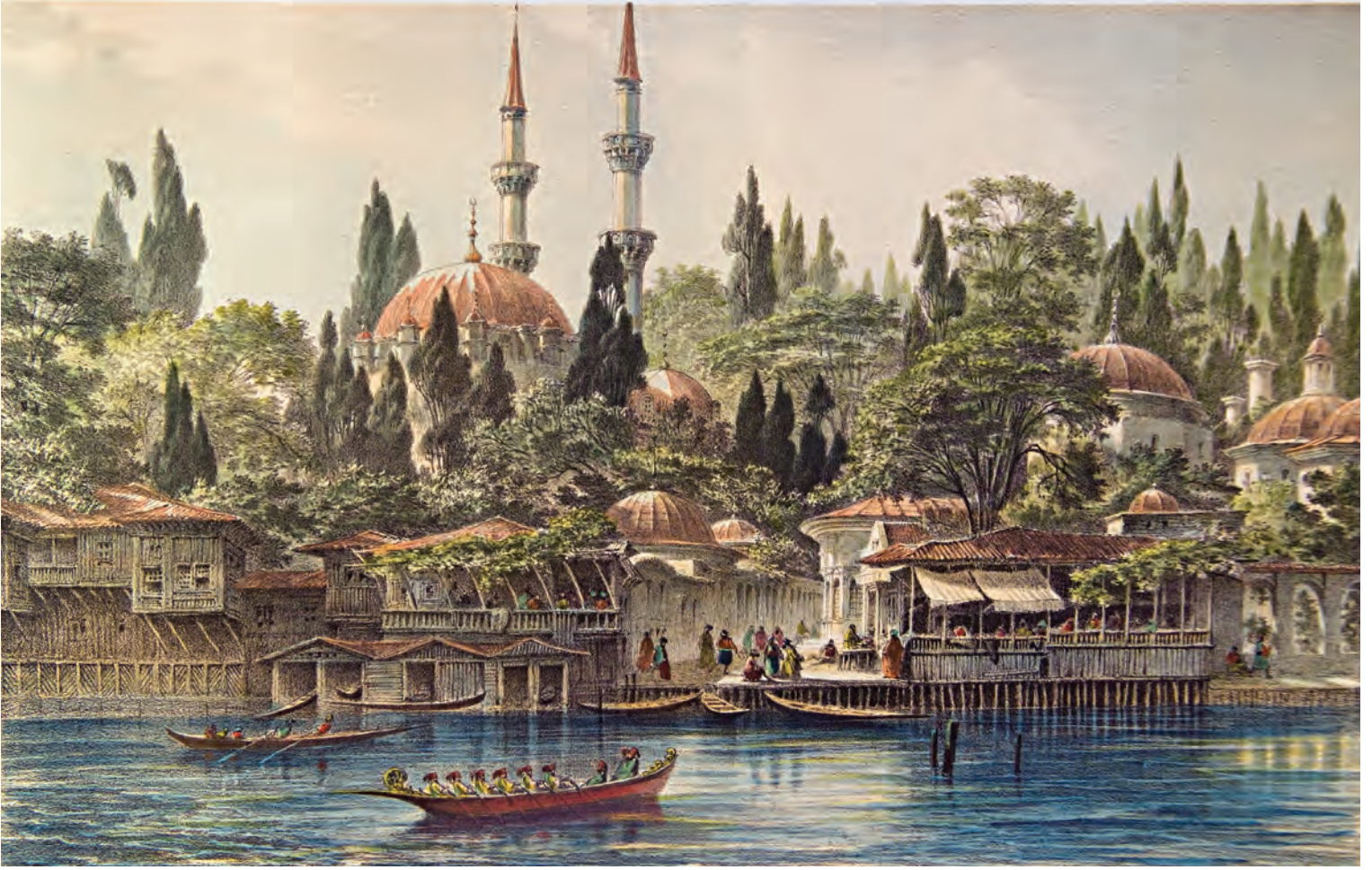
7- Eyüpsultan Camii, iskelesi ve çevresi (Flandin)

oluşumuna adımdı. Mektep ve çeşmelerin de yerleşimi teşvik ederek mahalle oluşumunda önem taşıyan bir unsur olduğunu belirtmeliyiz. İstanbul'da yer alan her bir bina ve hizmet türü şehir yerleşimine ve çevresinde mahalle oluşumuna doğrudan veya dolaylı tesir eden yapılar olarak görülebilir. Yine İstanbul'a sürgün yöntemiyle yapılan yerleştirmeler, Müslim ve gayrimüslim mahallelerinin inşası ve oluşmasında büyük rol oynamıştır. Üsküplü, Tahtakale, Balat, Eyüpsultan, Kazancı gibi mahalleler bu yöntemle oluşmuştu. Bir mahalleden sayılabilmek için orada kesintisiz beş sene ikamet etmiş olmak gerektiğinden Müslim veya gayrimüslim sürgünler, ya dindaşlarının mahalleleri içinde bütünleşir veya zamanla yeni bir mahalle oluştururlardı.