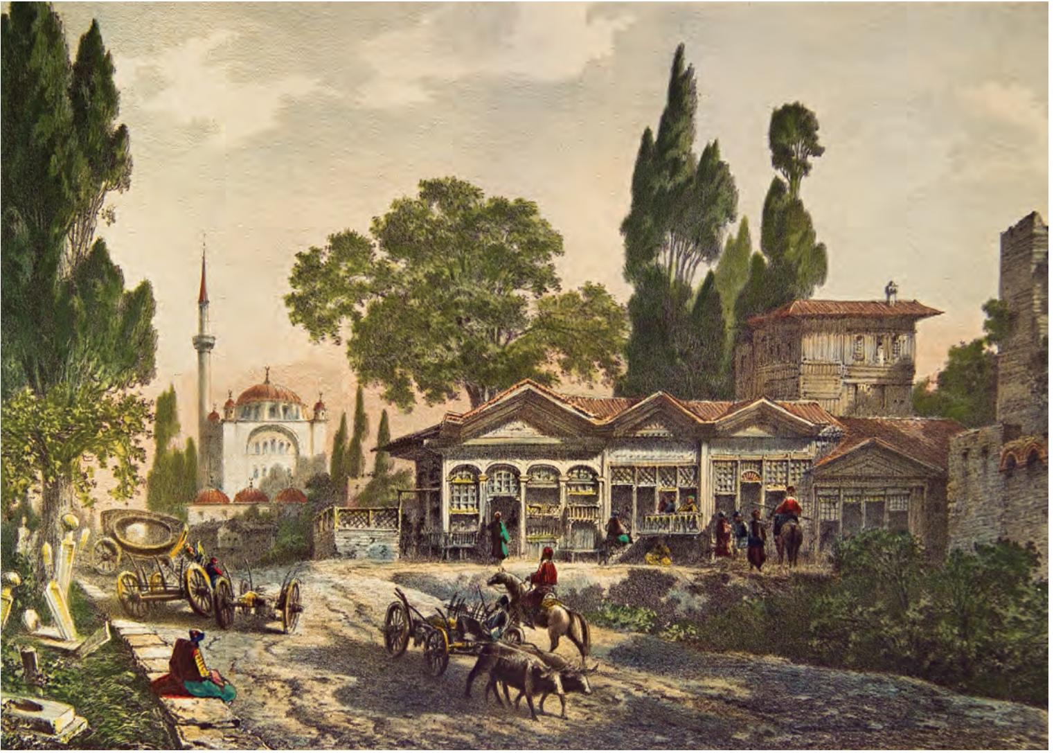
6- İstanbul'un ilk nahiyelerinden Topkapı (Flandin)

Mahalle mescitleri genellikle, ileri gelen bir mahalle sakini tarafından yaptırılmış, zamanla bazıları camiye de dönüştürülmüştür. Mahalleye ismini vermiş olan şahsiyetlerin dinî kimliği ve tasavvufî yönü de mahallenin gelişmesinde oldukça etkiliydi. Mesela, Seyyid Emir Ahmet Buharî (ö. 922/1516) Mahallesi'nde, onun adına "mürit ve muhibleri" tarafından onlarca vakıf kurulmuştu.