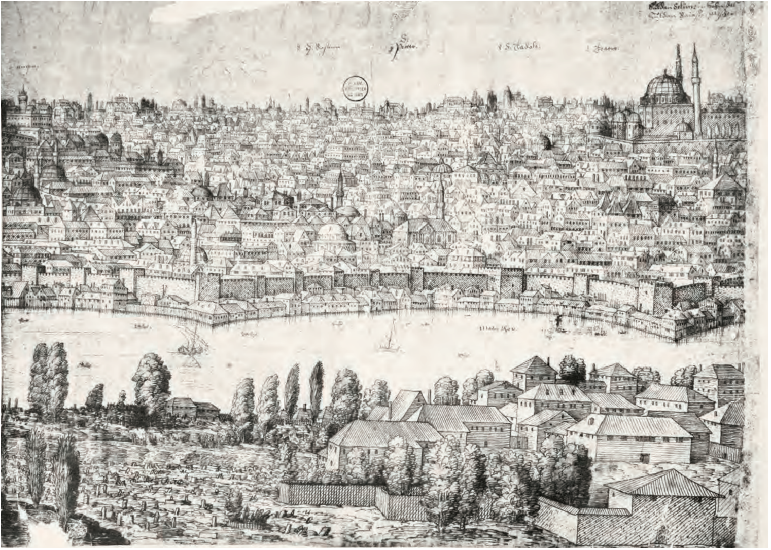
8- Haliç'in iki yakası: Yavuz Sultan Selim, çevresi ve karşı (Lorichs)

Bu çerçevede, evler iki kattan yüksek olmayacak, sokağa doğru saçak ve çıkıntı yapılmayacaktı. Ucuz maliyeti dolayısıyla mahallelerdeki evlerin çoğu ahşaptı. XVI. yüzyılda görüldüğü üzere ev ihtiyacı yüzünden, ikamet alanlarındaki büyük bahçeli saraylar yıkılıp yerlerine bitişik ahşap evler yapılmıştı. Mahallelerde 1725 yılında Müslümanlar için 12, zimmî ve Yahudiler için 9 zirâ olan evlerin yükseklik ölçüsü, 1817 tarihli bir talimatla 14 ve 12 zirâ çıkarılmış, Tanzimat'tan sonra tamamen kaldırılmıştı. Gayrimüslimler Müslüman mabedi yakınında ev inşa edemez, buradaki bir evde oturamazlardı.