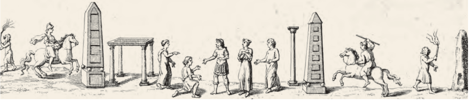
11- Hipodrom'daki yarış ve eğlenceler

Bu sabit pazar yerlerinin dışında bir de kentin dışında kurulan pazarlar vardı. Bunlar haftanın belli günlerinde merkezde ve farklı semtlerde faaliyet gösterirlerdi. Üreticiler ve lonca mensupları en iyi fiyata mallarını bu pazarlarda satardı. Bu pazarlar, halkın sadece alışveriş yaptığı değil, aynı zamanda hoşça vakit geçirdiği mekânlardı. Çünkü kentten kente ülkeyi dolaşan gezgin eğlendiriciler sık sık bu pazarlara gelirdi.