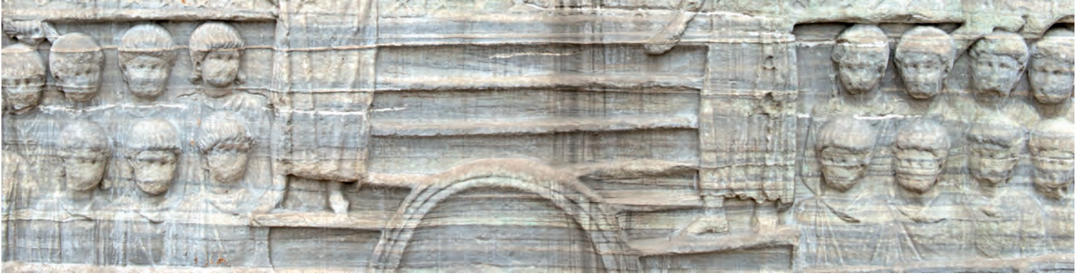
6- Hipodrom'da yarış izleyenler (Dikilitaş, Sultanahmet)

üzerine yerleştirilmiş heykeller yarışçıların tamamladığı turları göstermek üzere yan yatırılırdı. Aynı anda 10'dan fazla arabanın yarışabildiği yapı 120 m genişliğinde ve 480 m uzunluğundaydı. Kırkar basamaklık tribünler 100.000 kişilik bir kapasiteye sahipti. Yarışlar esnasında spinanın etrafında yedi turun tamamlanması kuraldı. Yapı, çok sıcak havalarda tribünlerin üzerinde yüzlerce makaranın aracılığıyla velum denilen tentelerle örtülürdü. Tribünlerin altında at ahırları, yarışçı ve diğer göstericilerin soyunma odaları bulunurdu.