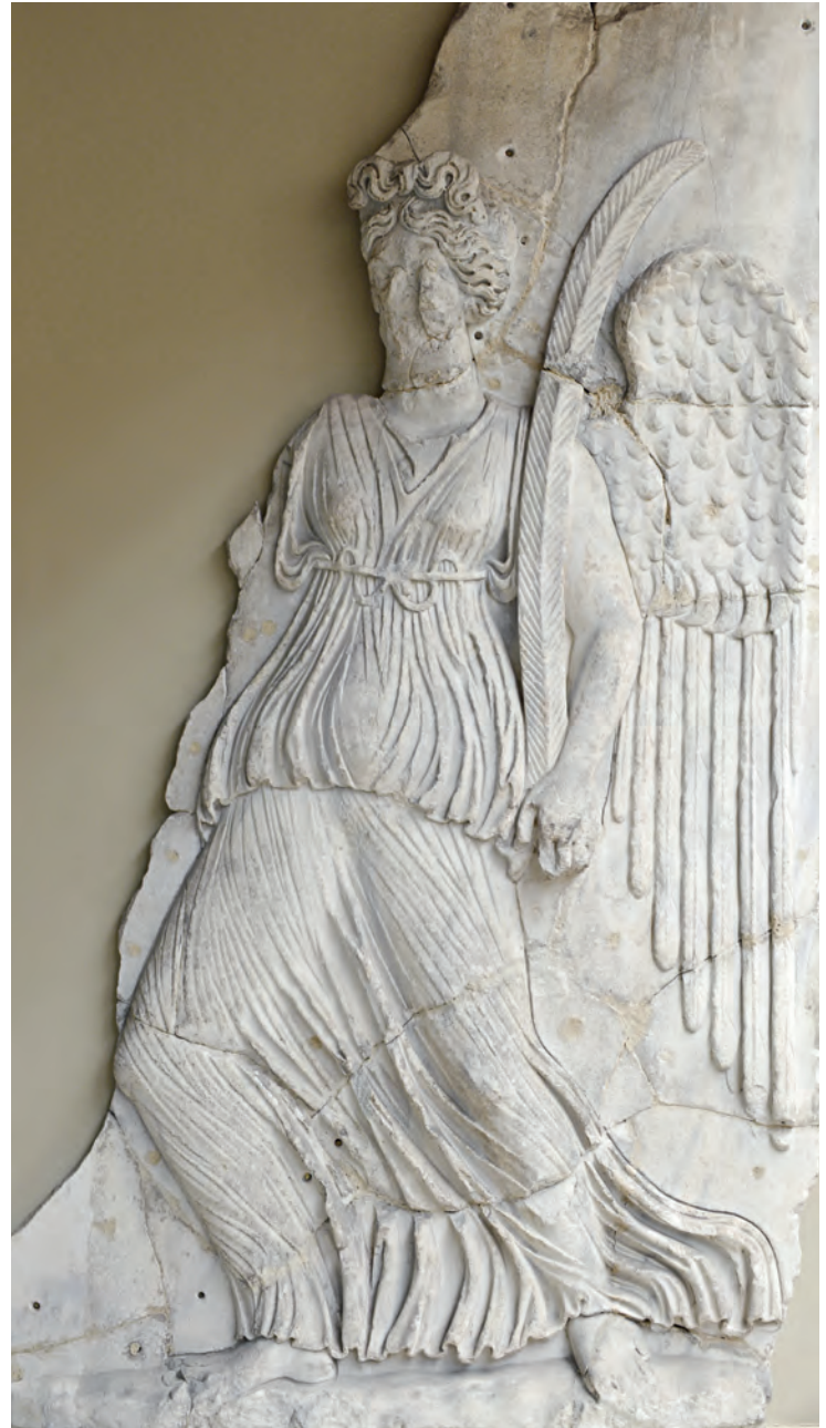
9- Balat Kapısı'nın girişini süsleyen Nike Heykeli (İstanbul Arkeoloji Müzesi)

Egzotik ülkelerden getirtilen vahşi hayvanların avlanması üzerine kurulu program da büyük ilgi çekiyordu. İmparator I. Iustinianos, Hipodrom'daki gösteriler için yirmi aslan, otuz panter ve daha başka vahşi hayvanlar getirtmişti. Programa egzotik kuşlarla uzak ülkelerden getirilip geleneksel kıyafetleri içinde arz-ı endam ettirilen insanlar da dâhil edilebiliyordu. Bir diğer gösteri türü ise savaş oyunlarıydı. Nitekim asker kökenli imparatorlardan Nikeforos Fokas'ın emriyle Hipodrom'da böyle bir savaş oyunu gösterisi düzenlenmişti. Ancak gösteriler o denli gerçekçi sahnelenmişti ki seyreden halk korkarak kaçışmıştı. Hipodrom'da cereyan eden bir diğer garip olay da bir Türkün dikilitaşın tepesine çıkıp buradan uçma denemesinde bulunmasıydı. İmparator, Konya'dan Bizans başkentini