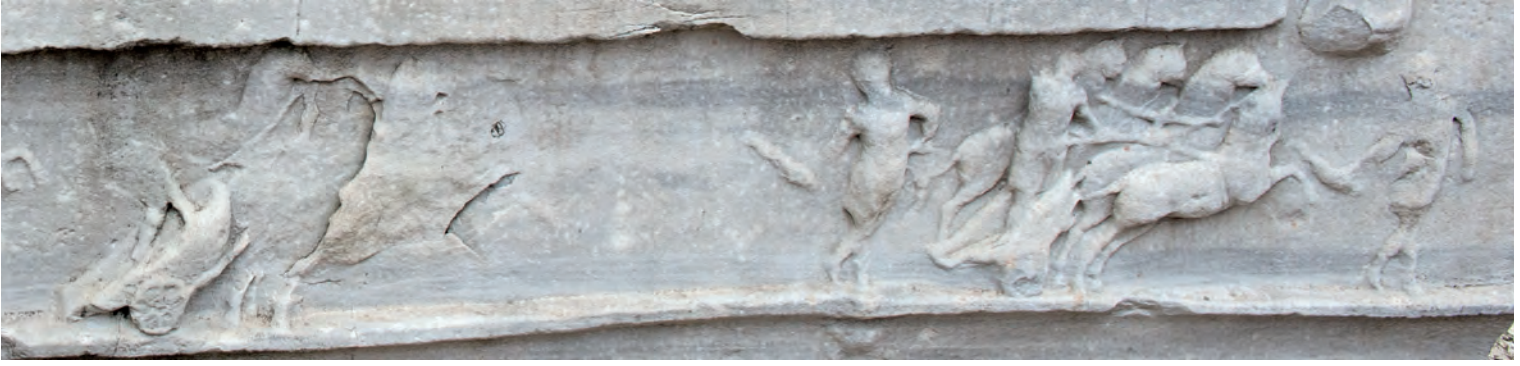
5- Hipodrom'da at yarışları (Dikilitaş, Sultanahmet)

Bizans'ta kilisenin verdiği bu evlilik tarifine uygun olarak düzenlenen ağırbaşlı törenler de yok değildi. Theofilaktos Simokattes, İmparator Maurikios'un VI. yüzyılın sonunda yapılan düğün törenini şu sözlerle tarif ediyor: "İmparator ile imparatoriçenin başına çelenkleri koydu ve onlar da bu en kutsal ve gerçek inancı takip eden herkes gibi İsa'nın hem tanrısal ve hem de insani yönüyle ilgili gizeme dâhil oldular." 16