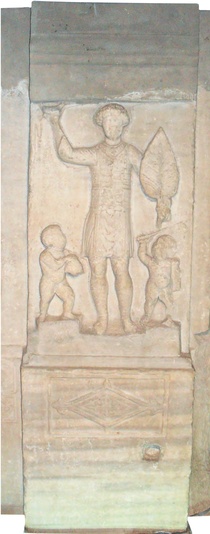
4- Meşhur bir yarışçı elinde palmye dalı tutarken (İstanbul Arkeoloji Müzesi)

vermek zorundaydı. 9 Ayrıca böyle zamanlarda tutukluları serbest bırakır 10 ve terfi bekleyenleri de ödüllendirirdi. 11