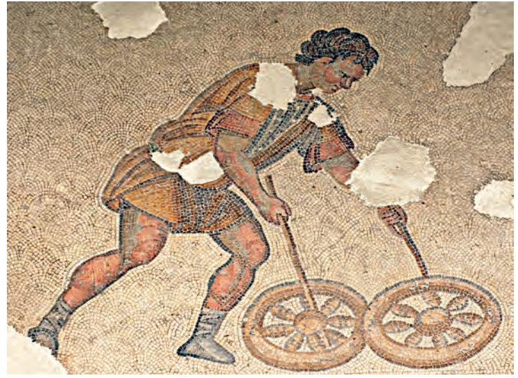
7- Sirkus oyunu (Mozaik Müzesi)

Bugünkü futbol yıldızlarının Bizanslı muadilleri olarak nitelendirebileceğimiz araba yarışçıları büyük bir hayran kitlesine sahiplerdi. Bu fanatik taraftarlar, yıldızlar hakkında her gelişmeyi takip eder ve bilirlerdi. Hipodrom sadece başkente özgü bir mekân değildi. Büyük Bizans kentlerinde de Hipodrom vardı. Bizans'ın en ünlü kilise babalarından Ioannes Hrisostomos (d.