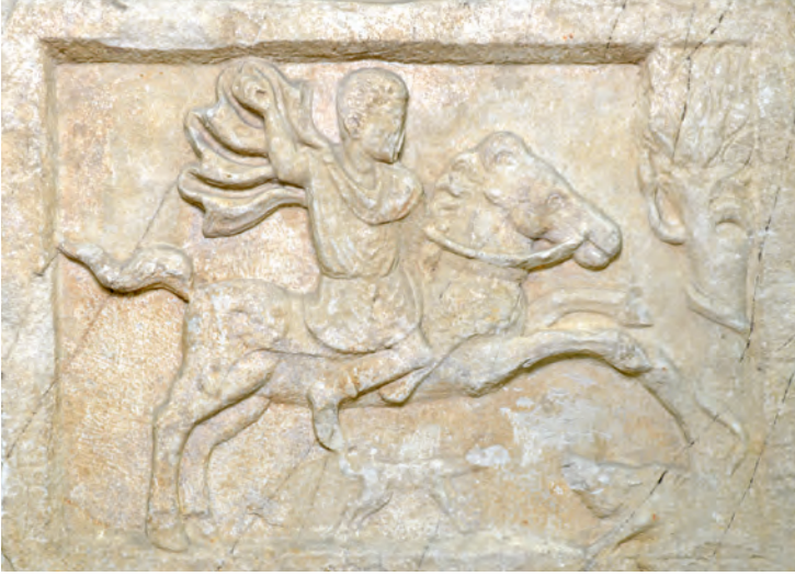
8- Bir süvariye ait mezar taşı (İstanbul Arkeoloji Müzesi)

yaprağı verilirdi. Hipodrom'da yapılan yedi turluk araba yarışı da adını buradan aldı. Galibe ayrıca elbiseler ve paranın yanında gümüş bir taç da verilirdi. İmparatorluk ekonomisinin zora girdiği dönemlerde bu taç bir sonraki dönemki galibe sunulmak üzere geri verilirdi. Tacın şampiyona sunulması imparatorun aktouarios (ἀκτουάριος) adlı bir temsilcisi aracılığıyla olurdu. İmparatorların yarışların galiplerine taç sunması nadir görülen büyük bir onurdu.