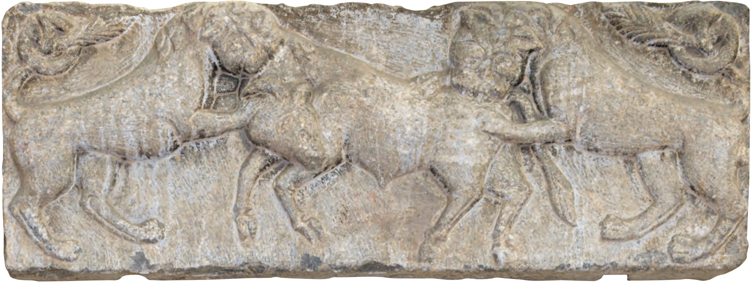
10- Forum Tauri'deki bir binayı süslediği tahmin edilen, boğaya saldıran aslanlar betimli VIII-IX. yüzyıllara ait kabartma (İstanbul Arkeoloji Müzesi)

asillerin Hipodrom'da turnuvalar düzenlediklerini yazıyor. Tarihçi, coustria ya da ternementa olarak tanımladığı bu eğlence türünü Bizanslıların Fransız, Alman ve Burgundiyalılarından bu vesileyle öğrendiklerini kaydediyor. 24