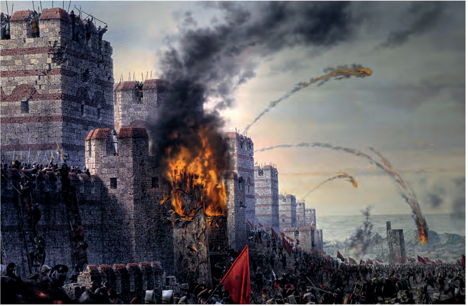
23- Osmanlı birliklerinin surlara genel hücumu (Panorama 1453 Tarih Müzesi)

taşla doldurulmuştu. Dış taraftan ise balçıkla sıvanmış hâldeydi. Bu korunaklı hâle getirilen seyyar kule, Ksilokerkos yani bugünkü Belgratkapı önündeydi. Surlara on adım mesafeye kadar çekilmişti. Bu kuleye üstü örtülü bir yoldan rahatlıkla giriliyordu. Kulenin içindekiler, dışarıdan herhangi bir tehlikeye maruz kalmaksızın sürekli toprak yığarak hendekleri dolduruyor ve bunları neredeyse ikinci surun yüksekliğine kadar getiriyordu. 108