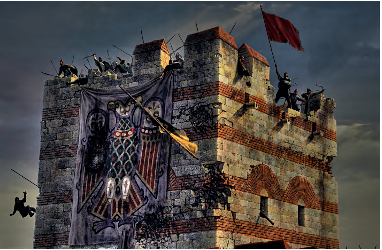
28- Osmanlı askerlerinin surlara hâkim olması (Panorama 1453 Tarih Müzesi)

Şehre ilk olarak nereden girildiği ve surlara ilk çıkanların kimler olduğu konusu da bugün pek çok tartışmayı beraberinde getirmiştir. Kaynakların incelenmesi sonucu bir yerden değil, değişik kesimlerden surların aşıldığı anlaşılır. Fakat yoğun girişin Topkapı gediğinden olduğu katidir. Osmanlı tarihçilerinden Tacizade, Edirnekapı'ya doğru olan gedikte gazilerin galip olup içlerinden 5-10'unun duvar üzerine çıkarak sancak diktiğinden ve onları gören herkesin bir anda içeri girdiğinden açık şekilde söz eder. 124 Bazı yazarlar deniz tarafındaki daha zayıf surlardan yani Haliç kesiminden girildiğini iddia ederler. Ancak bu doğru değildir. Aslında Topkapı tarafından şehre girilince müdafiler surlardan çekilmişler, diğer taraftakiler de surların üzerinde mukavemet görmeyince rahatça duvarları aşmışlardır. Yani ana giriş Topkapı'dır ve burada müdafaada bulunan Giustiniani'nin yaralanıp müdafa hattından çekilmesi direnişi zayıflatmıştır. Ayrıca Bizans tarihçisi