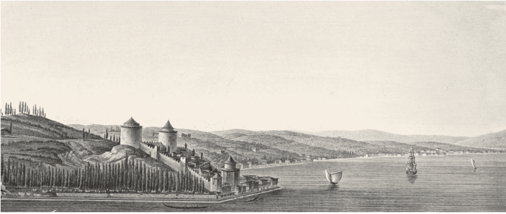
3- Rumeli ve Anadoluhisarı (Melling)

öfkelenerek Türkleri engellemek için surdışına çıktıkları, ama hepsinin yakalanıp öldürüldüğüne dair bilgiler mevcuttur. 7 Hisarın yapım şekli ise daha çok denizden geçecek gemileri engellemeye yönelik bir şekil arz etmektedir. Üstelik burçların konumu, kara tarafına da tam anlamıyla hâkim olmak düşüncesinin bir ürünüydü. İlk büyük burçları mayıs ayına doğru bitirilen hisarın inşaatı, ağustos ayında tamamlanmıştı. 8 Yapımı yaklaşık dört ay süren hisarın içine gerekli bütün teçizat ve silahlar konuldu. Özellikle ateşli silahlar öyle yerleştirilmişti ki, hisarın önünden geçen bir küçük kayık bile bunların ateşinden kurtulamazdı. Dönemin tarihçilerinden biri, büyük toprakların surun altına, deniz kenarına yerleştirildiğini, çapraz atış sistemi içinde sağ ve sola yönlendirildiğini, daha yukarıya yerleştirilenlerin güllerinin denizin ortasına yettiğini; eğer sektirme sistemiyle ateşlenirlerse, karşı kıyıya kadar rahatlıkla erişebildiklerini anlatır. 9 Fethi şahit olan tarihçi Tursun Bey ise deniz tarafındaki surlara yirmi top yuvası