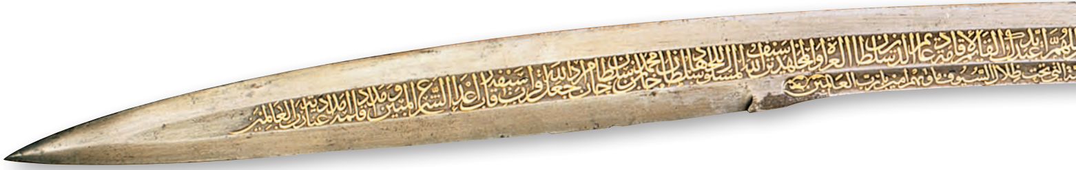
7- Fatih'in kılıcı (TSM)

bakımından da önemlidir. Dukas'ın anlattıkları bir ölçüde hem Türk hem de Bizans tarafında Halil Paşa'ya karşı oluşan intibahın geç dönemdeki bir yansıması olarak mütalaa edilebilir. Halil Paşa'nın Bizans'tan sürekli rüşvet alarak onları daima kolladığı fikri, Türk kaynaklarında da Dukas'ın belirttiği tarzda onun "gâvur ortağı" şeklinde nitelendirilmesine yol açmıştı. Fethiye taraftar grupları olan siyasi çekişme mantığı içinde Halil Paşa için yapılan bu yakıştırmalar, belirli bir yere oturtulabilir. Ama gerçekte durumun böyle olduğunu göstermez. Halil Paşa'nın Bizans tarafından genellikle eski sultanın barışçı siyasetini devam ettirmek isteyen tecrübeli bir vezir olarak görüldüğü, onun bu tutumunu sürdürmesi için kendisine türlü hediyeler yollanmış olabileceği akla yatkın gelebilir. Tarihî gelenekte hediye getirme ve alma pek çok devlette de görüldüğü gibi, rutin bir işittir. Bunun rüşvet olarak nitelendirilmesi ise tamamen dönemin şartlarının getirdiği siyasi çekişmelerle bağlantılı bir mahiyet arz eder. Osmanlı Devleti'nin ikinci adamı pozisyonundaki Halil Paşa'nın güç ve kudretinin, Bizans altınlarına ihtiyaç duymayacak ölçüde büyük olduğu açıktır. Onun böyle bir harekete karşı çıkmasının altında yatan temel sebepler, daha çok dışarıdan gelebilecek tehditlerin devleti yıkımın eşiğine götürebileceği endişesidir.