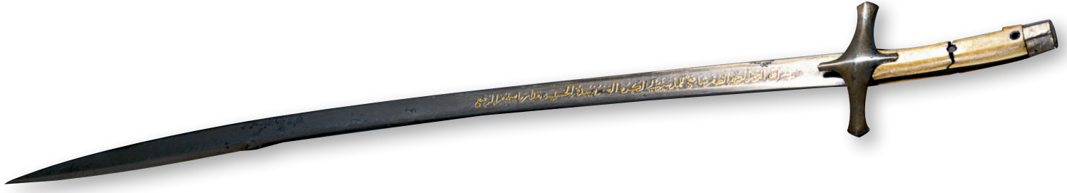
8- Fatih'in kılıcı (TSM)

kulelerin planları ve malzemeleri hazırlanmış, sayısız tipte ipten veya ağaçtan yapılmış tırmanma aletleri, merdivenler imal edilmişti. II. Mehmed muhtemelen çağına göre çok güçlü olan surları yıkacak veya tahribata uğratabilecek döneminde bilinen bütün araç-gereçlerini hazır hâle getirmişti. Çoğunun malzemesi sonradan sur önlerinde birleştirilmek için parçalar hâlinde hazırlanmıştı. Taşıma işi için de sayısız deve katarlarının, diğer yük hayvanlarının tedarikine çalışıldı. Malzeme ve topları nakletmek üzere arabalar hazırlandı, bunları çekecek öküzlerin teminine çalışıldı. Uzun sürecek bir kuşatma ve askerî hareket için askerî yiyecek ve içeceği de önemliydi, bu bakımdan daha Edirne'deyken yeterli yiyecek stoklarının yapılması istenmişti, bunlar ordunun hareketi sırasında sur önlerine yığılacaktı. Bütün bu alışılmış işler yerine getirilirken II. Mehmed'in güvendiği en yeni ve büyük silahı, döktürdüğü devasa toptu.