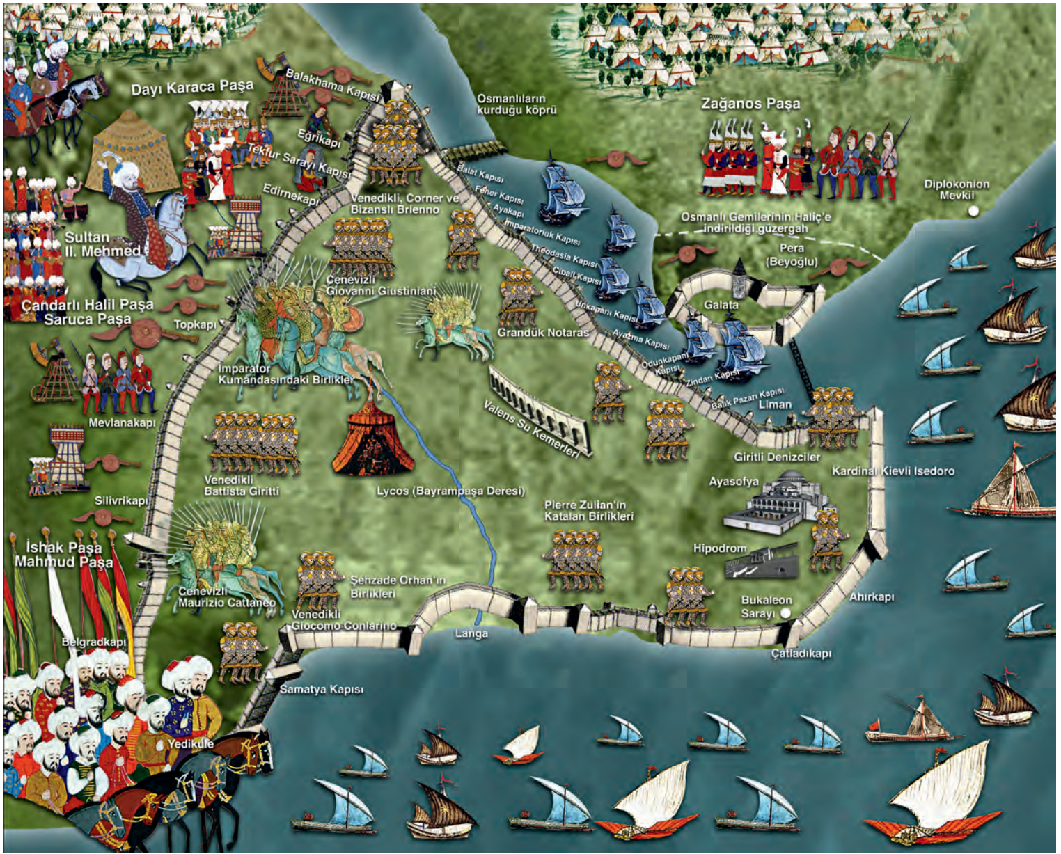
15- İstanbul kuşatması planı

Yanında birçok Venedikli tüccar ve asilzade bulunuyordu. Yine savaşa katılmak için imparatorun emriyle üç Tuna kadirgasıyla iki küçük kadirga limandan hareketle Ayvansaray taraflarında Chinigio/Kynegion (Avcıkapısı) denilen yerde karaya yanaştı. İçinde tamamıyla silahlı 1.000 mürettebat bulunuyordu. Bunlar hep birlikte saraya giderek imparatorun huzuruna çıkıp durumu görüştiler. Nasıl bir görev alacaklarını konuştular. İmparator onları kara tarafındaki surlara sevk etti. Amacı bu intizamlı ve silahlı birliğin surlarda görülmesinin, II. Mehmed üzerinde olumsuz bir etki yapmasıydı. Bunlar kara surlarında dolaşıp gövde gösterisinde bulunduktan sonra tekrar limana döndüler. Aslında bu gösteriş harekâtı Türklerden ziyade mahsur durumdaki şehir ahali için bir moral ve teselli vesilesi olmuşa benzemektedir. Fakat