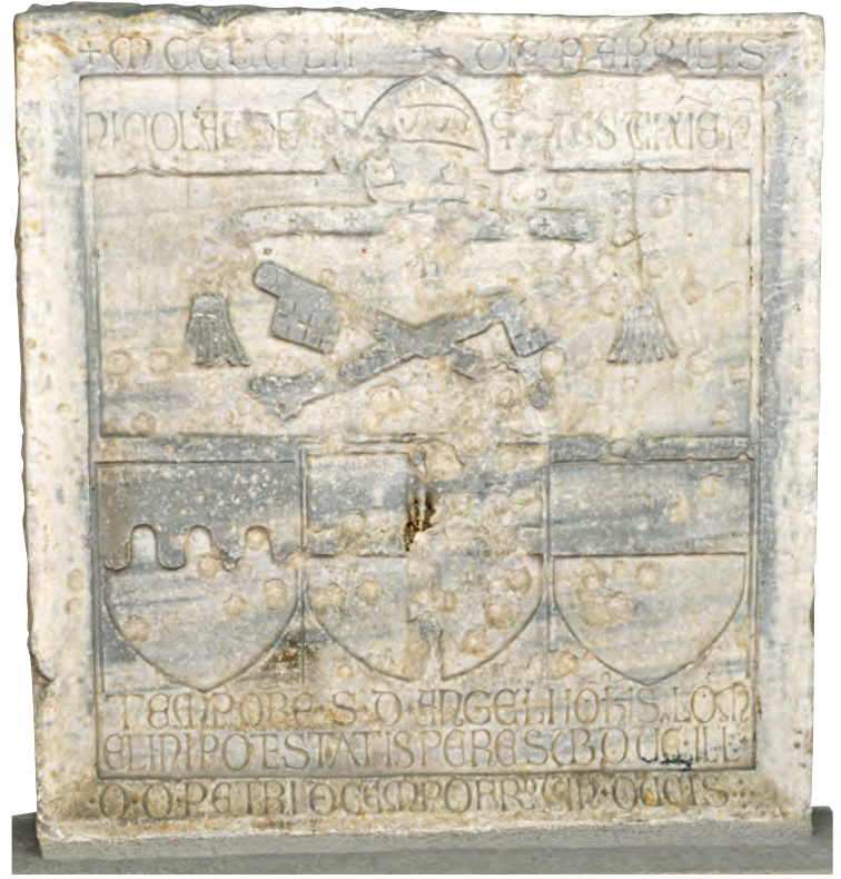
12- Galata surlarının tamiri için hazırlanan 1 Nisan 1452 tarihli kitabe (İstanbul Arkeoloji Müzesi)

İmparator ve kurmayları, ilk Türk saldırısı karşısında surlarda müdafa hatlarını şöyle oluşturmuştu: Marmara'dan itibaren Porta Aurea (Altınkapı) Andronikos Kantakuzenos'a; Yedikule, Venedikli Catarino Contarini'ye; Porta Aurea'dan Pegae Kapısı'na kadar Cenovalı Maurizio Cattaneo'ya; Pegae Kapısı (Silivrikapı) Nikolo Goudeles ve Battista Gritti veya Nicolo Mocenigo'ya; Polyandrio (Myriandrio/Mevlevîhane/Mevlanakapı) kesimi Cenovalı Paolo, Triolo ve Antonio Bocchiardi kardeşlere; Aziz Romanus (Topkapı) ise Giovanni Kantakuzenos'a tevdi edilmişti. En önemli bölge olarak görülen Topkapı/Hücumkapısı ile Kharisios (Edirnekapı) arası bizzat imperatora bırakılmıştı; sonra bu kesimin sağ yanında Giustiniani ve 700 adamı konuşlanmıştı. Edirnekapı'da Bizanslı Leontaris Briennio ve Venedikli Fabrizo Corner bulunuyordu. İmparatorluk sarayı kapısı önce Dolfin Dolfin, sonra da Giovanni Loredan adlı Venediklilere bırakılmıştı. İmparator sarayının müdafaası ise önce bizzat XI. Konstantinos, sonra Venedik balyosu Girolamo Minotto ile Giovanni Giorgi'deydi. Kaligaria (Eğrikapı) kesimi, Bizanslı Theodoro Caristeno ile Emanuele