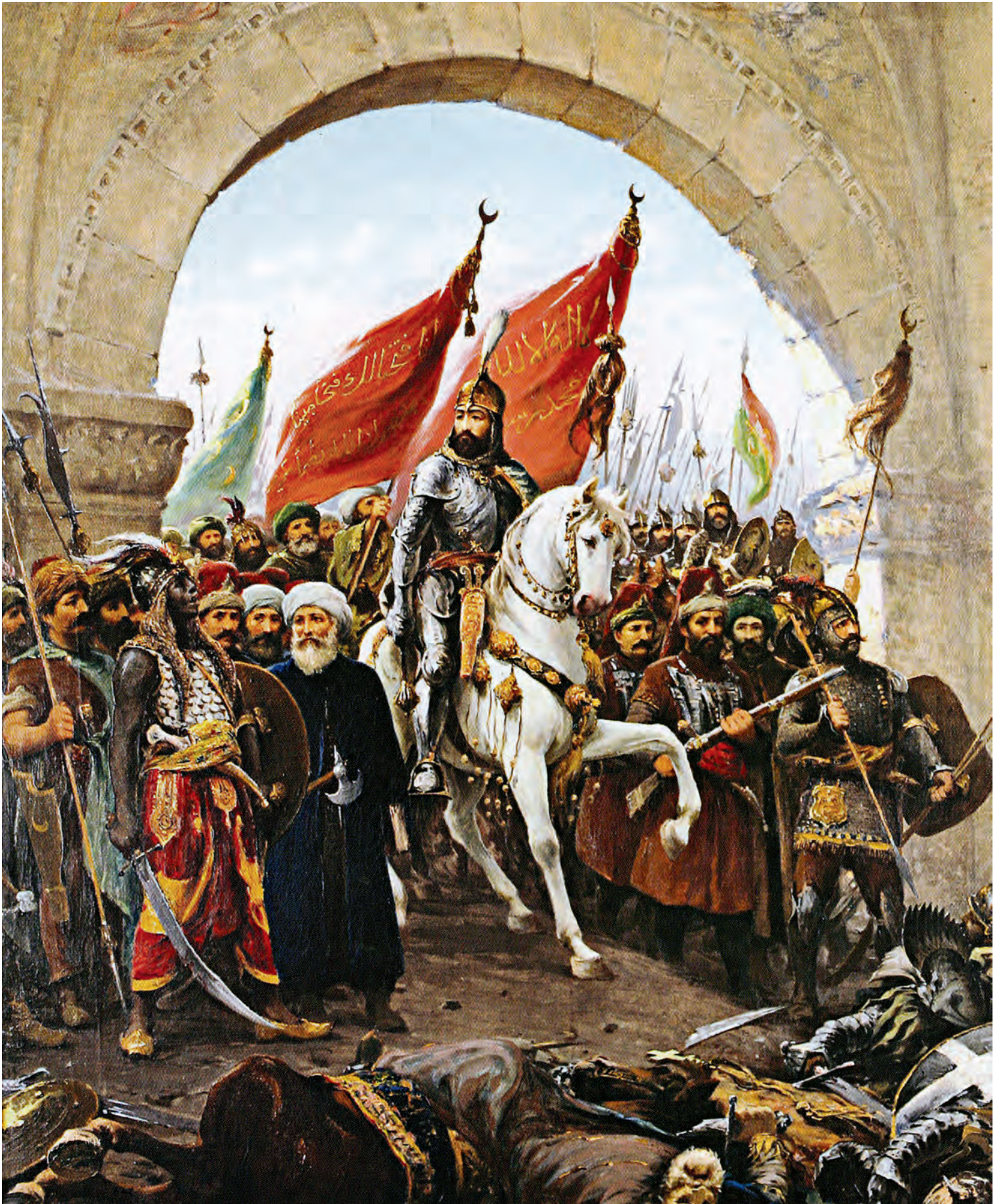
29- Fatih'in şehre girişı (Zonaro)