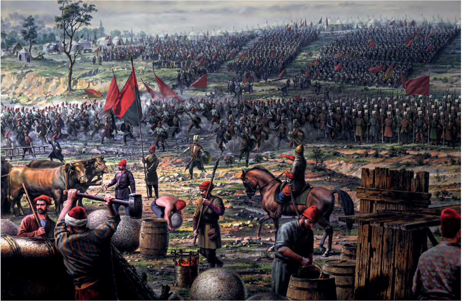
14- İstanbul muhasarasında Osmanlı kuvvetleri (Panorama 1453 Tarih Müzesi)

arkebüzler yerleştirildiğini bildirir. 65 Tarihçi Dukas daha açık şekilde müdafilerin ellerinde bulunan tüfek benzeri bir hafif ateşli silahtan fırlatılan ceviz büyüklüğündeki güllelerin saldıranlara büyük zayıat verdiğini belirtir. 66