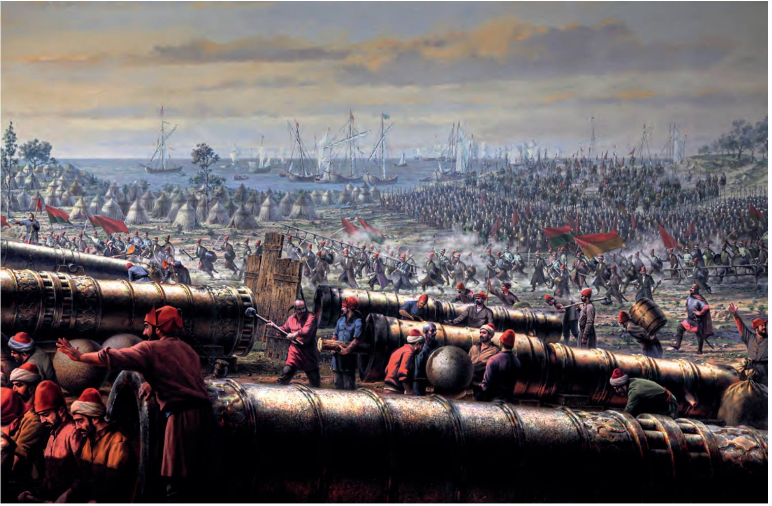
24- Osmanlı donanması ve toplar (Panorama 1453 Tarih Müzesi)

ordugâhında tıpkı 20 Nisan'daki deniz savaşı dolayısıyla olduğu gibi yeni ve ikinci büyük krizin yaşanmasına yol açmıştı.