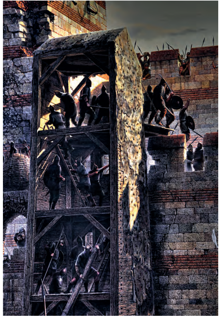
22- Osmanlı ordusunun yürür kule ile surlara hücumu (Panorama 1453 Tarih Müzesi)

şehrin içine asker sokmak maksadı yanında surların altına getirilip toprak kısmı boşaltılmak veya ateş yakılarak patlayıcı maddelerle infilak ettirilmek suretiyle sur veya burçların çökertilmesi amacıyla da kazıldığı söylenebilir.