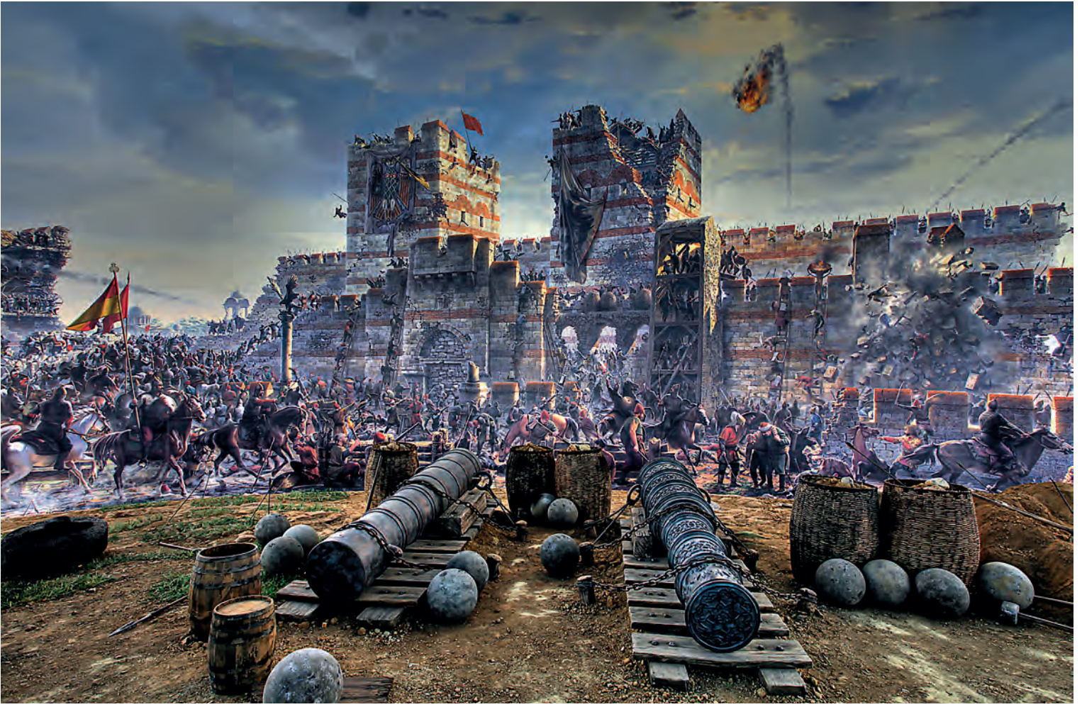
18- Surlar önündeki mücadele (Panorama 1453 Tarih Müzesi)

ile taciz edilirken, bir kısmı yine büyük kalkanlarla kendilerini koruyarak merdivenler dayayıp surların boş bulunan kesimine çıkma gayreti gösterdi. 87