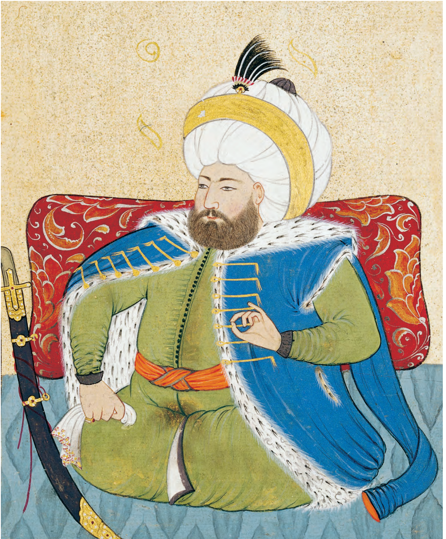
5- Levnî tarafından hazırlanan Fatih portresi (TSM, nr. A. 3109)