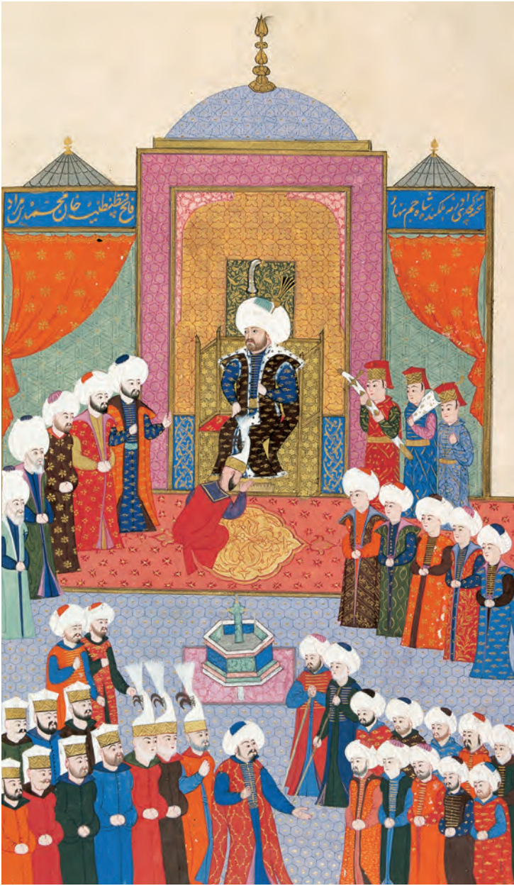
1- Fatih'in cülusu (Hünernâme)

onun önemli bir stratejist olduğunun ilk ciddi belirtisiydi. Rumelihisarı'nın inşası, II. Mehmed'in Konstantiniye'yi tehdit altında tutacağı'nın nişanesi olmuştu. II. Mehmed inşaatı başlatmak ve nezaret etmek için 26 Mart 1452'de hisarın yapılacağı yere geldi. 4 Bizanslılar onun Edirne'den yola çıktığını dahi haber almışlar, bu vesileyle de yolların Osmanlılarca kesildiğini öğrenmişlerdi. Gerçekten de II. Mehmed bir taraftan Gelibolu'daki deniz üssünde bulunan 30 kadirga ve irili ufaklı yük gemilerini Boğaz'a yönlendirdiği gibi kendisi de yanında vezirleri ve askerleri olduğu hâlde inşaat alanına ulaşmıştı. İnşaatın yapılacağı sahayı bizzat kendisi seçmiş, Boğaz'ın