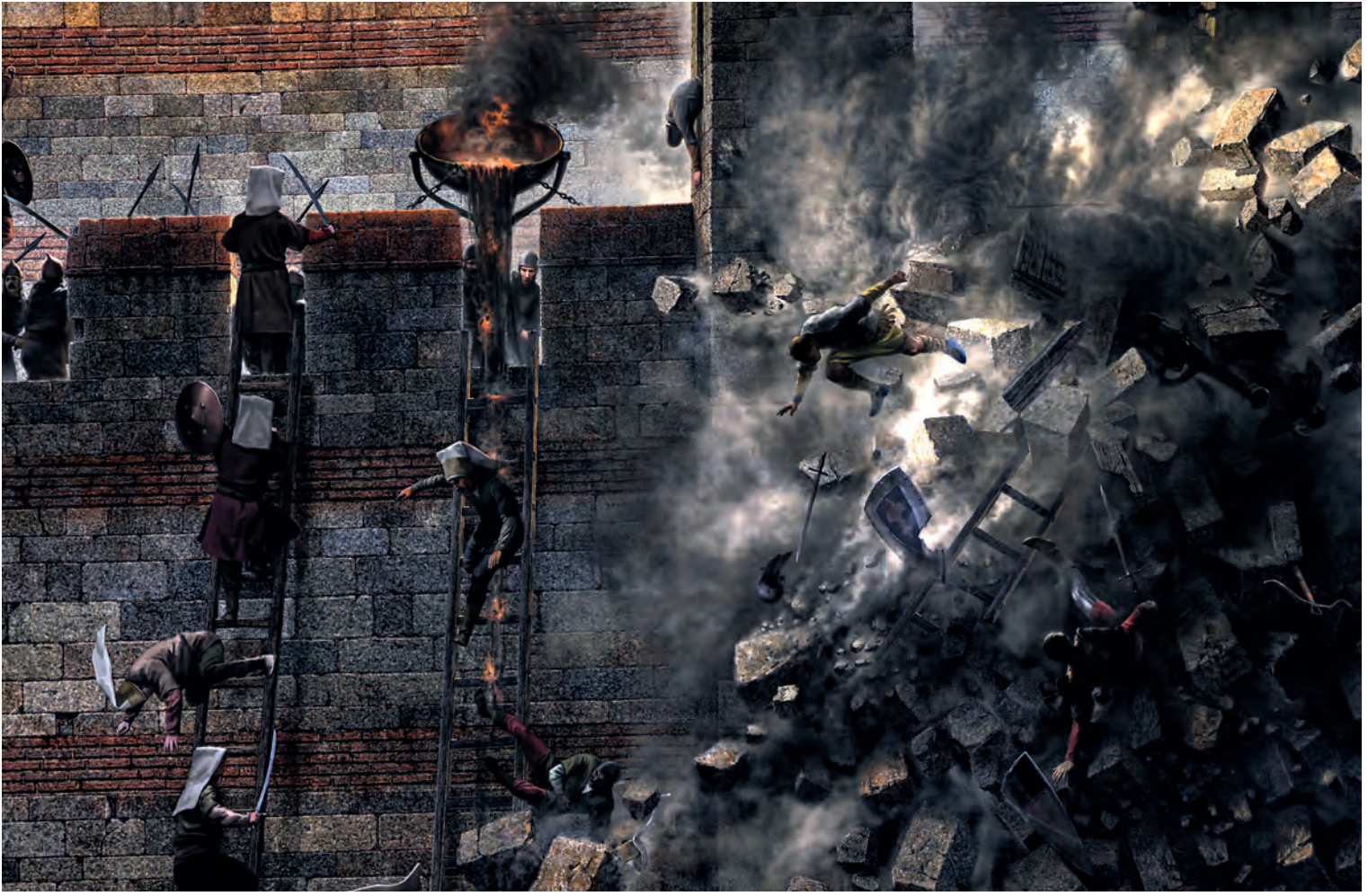
25- Osmanlı askerinin surlara tırmanışı (Panorama 1453 Tarih Müzesi)

tartışmalar son hücum için yapılacak büyük hazırlıklar dolayısıyla herkesin kendi görev yerlerinde hummalı bir faaliyete girişmesi sonucu bitmiş gözüküyordu. Artık nihai bir genel saldırıyı tam olarak planlama vakti gelmişti. Öncelikle kumanda heyetiyle bu saldırıyı görüştü, kumandanlarını da toplayarak onlara durumu anlattı.