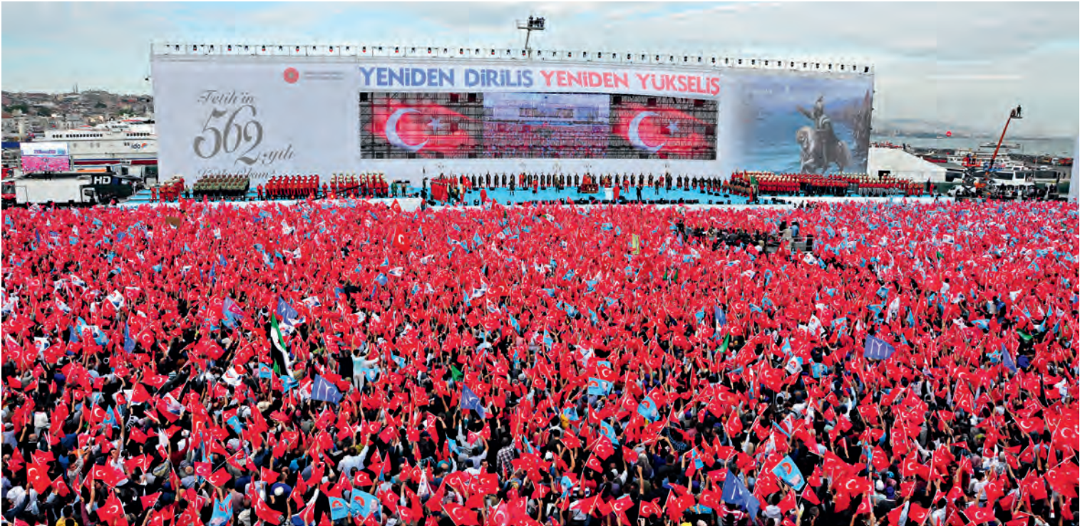
30, 31, 32, 33- Fetih kutlamaları tarihinde bir ilk: İstanbul'un fethinin 562. yıldönümü en üst düzey resmi katılımıyla kutlandı. İstanbul Büyükşehir Belediyesi, İstanbul Valiliğine ve TC. Cumhurbaşkanlığı tarafından 30 Mayıs 2015'de İstanbul Yenikapı Meydanı'nda düzenlenen, Başbakan, Meclis Başkanı ve Cumhurbaşkanı'nın katılımıyla gerçekleştirilen kutlamalardan kesitler (İBB)

sürdüremeleri de dikkat çekicidir. 149 Bu konu daha sonra Osmanlı uleması arasında derin tartışmalara sebep olmuştur.