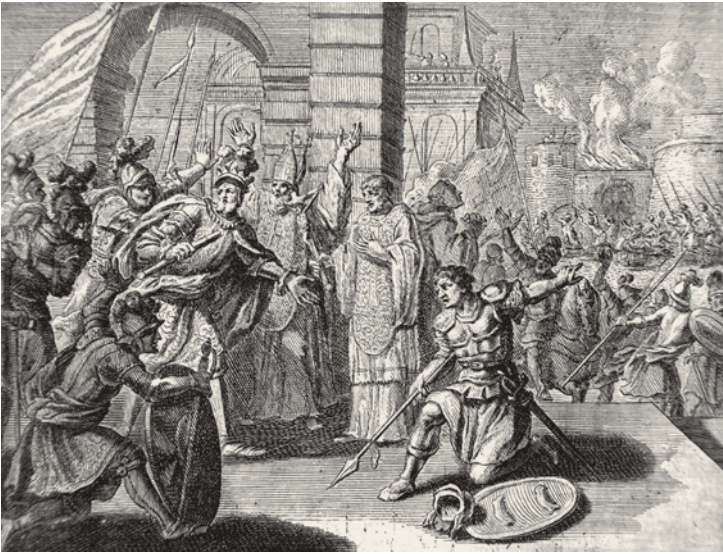
27- İstanbul'un düşüşü (Rycaut)