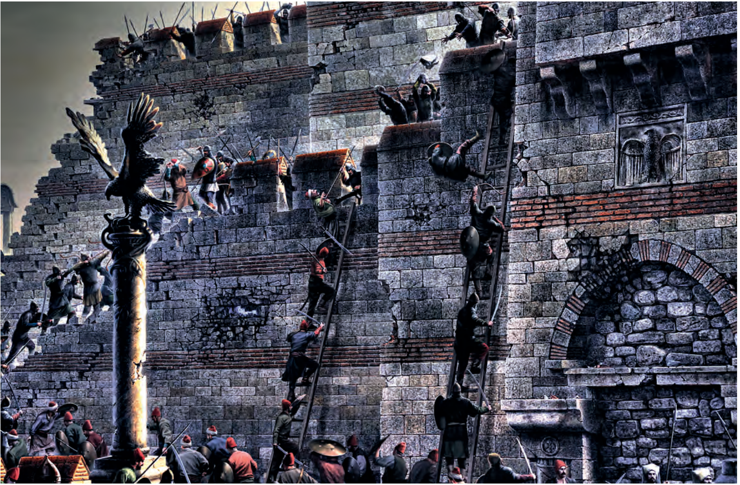
20- Surlardaki mücadele (Panorama 1453 Tarih Müzesi)

indirilmesi gibi düşünilemeyecek bir durumu da ortaya koyar. Bundan dolayı güzergâhı söz konusu hazırlıkların daha rahat yapılabileceği arka plandaki bir mevkiye çekmek gerekir. Burası ise Osmanlı donanmasının üslenmiş olduğu yer, yani Beşiktaş koyu ve Dolmabahçe/Kabataş'a kadar uzanan kesim olabilir. Dolmabahçe'nin bu dönemde içeri doğru derin bir koy hâlinde olduğu bilinmektedir.