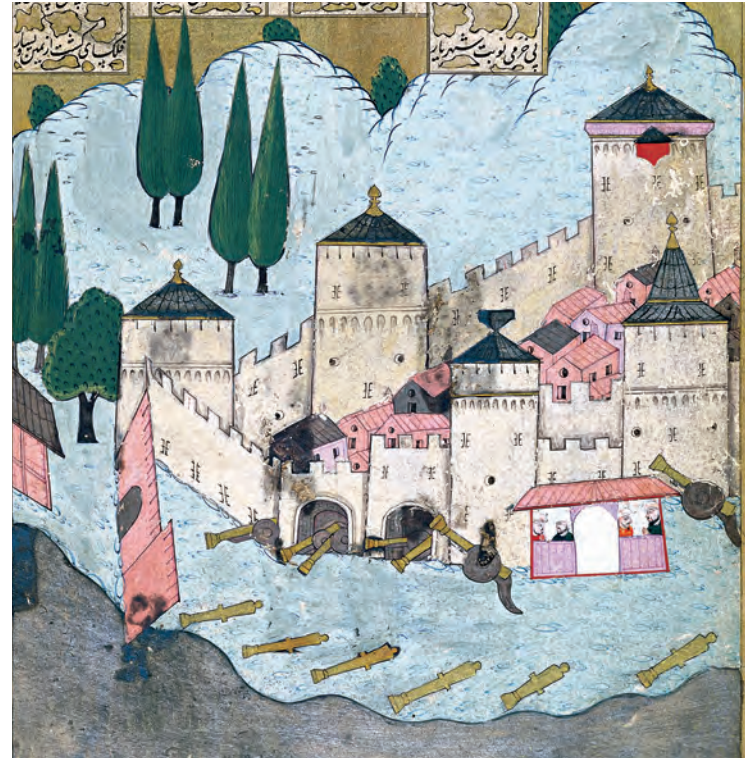
2- Hisarbecesi, boğazdan geçen gemileri durdurmakla görevli topları ve içindeki yerleşim birimleriyle Rumelihisarı (Hünernâme)

onun önemli bir stratejist olduğunun ilk ciddi belirtisiydi. Rumelihisarı'nın inşası, II. Mehmed'in Konstantiniye'yi tehdit altında tutacağı'nın nişanesi olmuştu. II. Mehmed inşaatı başlatmak ve nezaret etmek için 26 Mart 1452'de hisarın yapılacağı yere geldi. 4 Bizanslılar onun Edirne'den yola çıktığını dahi haber almışlar, bu vesileyle de yolların Osmanlılarca kesildiğini öğrenmişlerdi. Gerçekten de II. Mehmed bir taraftan Gelibolu'daki deniz üssünde bulunan 30 kadirga ve irili ufaklı yük gemilerini Boğaz'a yönlendirdiği gibi kendisi de yanında vezirleri ve askerleri olduğu hâlde inşaat alanına ulaşmıştı. İnşaatın yapılacağı sahayı bizzat kendisi seçmiş, Boğaz'ın