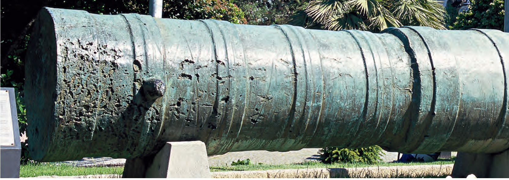
6- İstanbul'un kuşatmasında kullanılan toplardan birisi ve taş güller (Askeri Müze)

bir hâlde olduğunu, Bizanslıların sürekli olarak pusuya yatıp kendilerini zora düşürmek için uğraştıklarını ve fırsat kolladıklarını, babası zamanındaki savaşlarda Haçlı birliklerini nasıl üzerlerine sevk ettiklerine hepsinin şahit olduklarını etkili sözlerle anlatmıştı. Şehri almanın öneminden bahsetmiş, buranın açık ve gizli şekilde her kötü işe kalkıştığını, artık durumun dayanılmaz hâl geldiğini, olup biteni anlatmak için bu toplantıyı düzenlediğini, kendi fikrinin ne yapıp edip büyük bir şevkle savaşa hazırlanmak olduğunu belirterek, bu şehri devletine katmak istediğini, bunu başaramazsa, bu yolda devleti bile kaybetmeyi göze aldığını beyan etmişti.