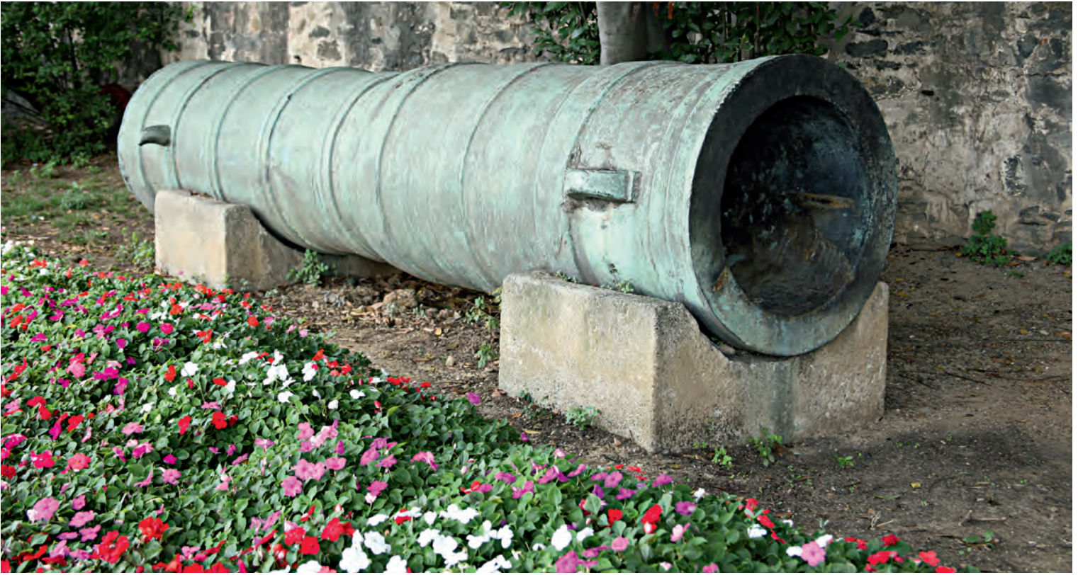
4- İstanbul kuşatmasında kullanılan toplardan biri (Rumelihisarı)

kaynaklarında hemen hiç ayrıntı yoktur. Yalnız tarihini sonradan II. Mehmed adına kaleme alan Kritobulos, bu dönemi nispeten mufassal olarak nakleder, II. Mehmed'in karşı karşıya kaldığı meseleler hakkında da ipucu verir.