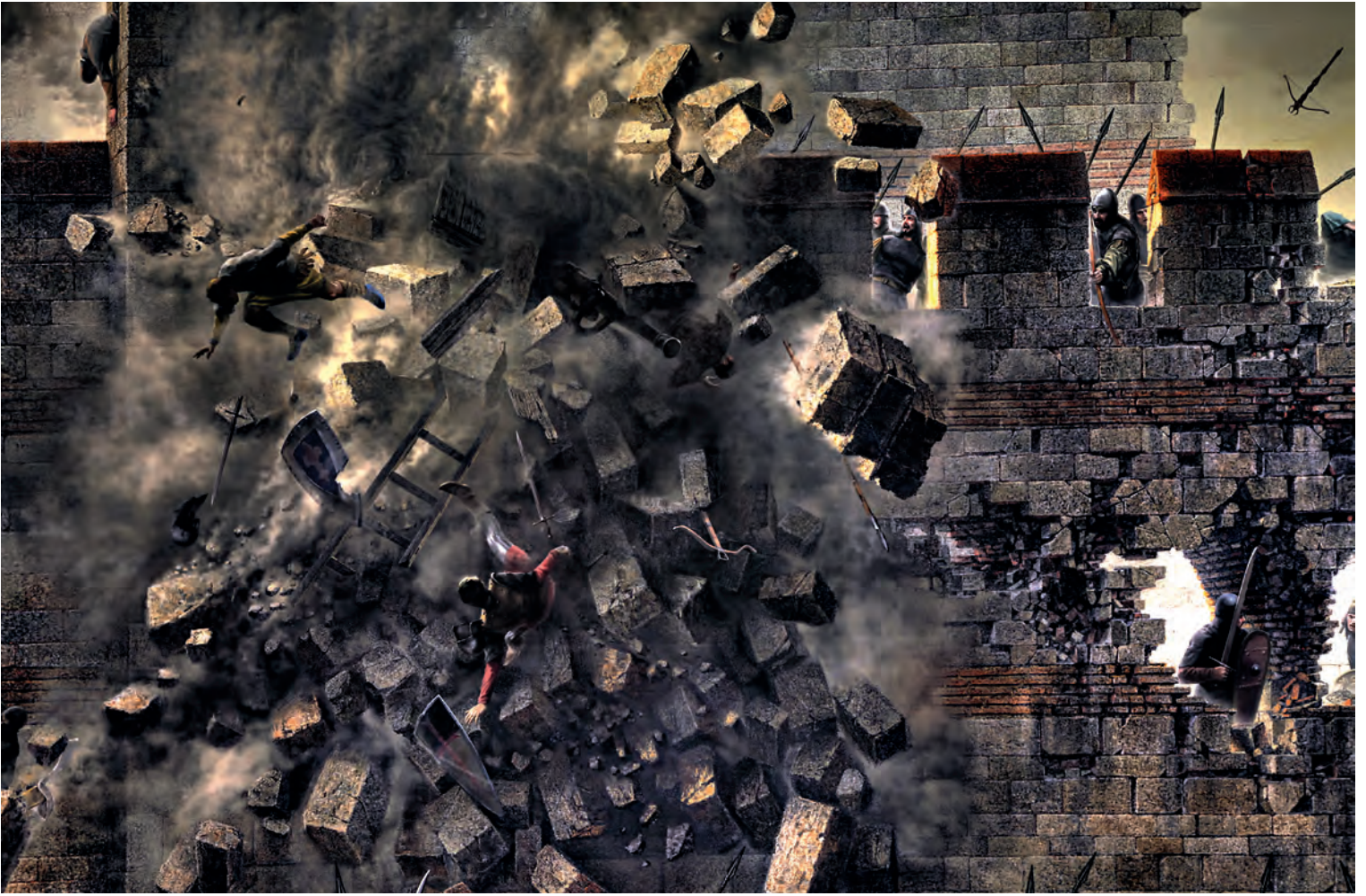
21- Aşılamaz denilen surların yıkılması (Panorama 1453 Tarih Müzesi)

Ancak bu bilgiler sonradan kulaktan kulağa aktarılan rivayetlerle karışmış bir özellik arz eder. Haliç'e indirilen bu gemiler parlak bir düşüncenin ürünü olmakla birlikte kuşatmanın seyrinde belirleyici bir rol oynamadılar. Yalnız bir kısım müdafileri, deniz bölgesindeki surlara çekip diğer tarafta kara surlarındaki müdafaayı biraz zayıflattılar. Aslında bu gemiler muharip bir sığfata sahip olmayıp daha ziyade seyyar bir iskele ve kuşatma aracı gibi vazife gördüler. Nitekim bunların birbirine bağlanarak köprü gibi kullanıldığı, hatta üzerine toplar ve askerler konulup surların önüne kadar uzatılan ve geri çekilen seyyar bir tabya hâline getirildiği, bazılarının pruvalarına sur boyuna kadar uzanan tahta kuleler yapılarak buradan ok ve kurşun atıldığı yine kaynaklardan anlaşılmaktadır. 101 Ancak şurası muhakkaktır ki donanmanın Haliç'te görülüşü, Bizans'ta büyük bir maneviyat bozukluğuna yolaçmış ve Osmanlı tarafında ise deniz yenilgisinin acısını unutturmuş, yeni bir şevk ve heyecan getirmiştir.