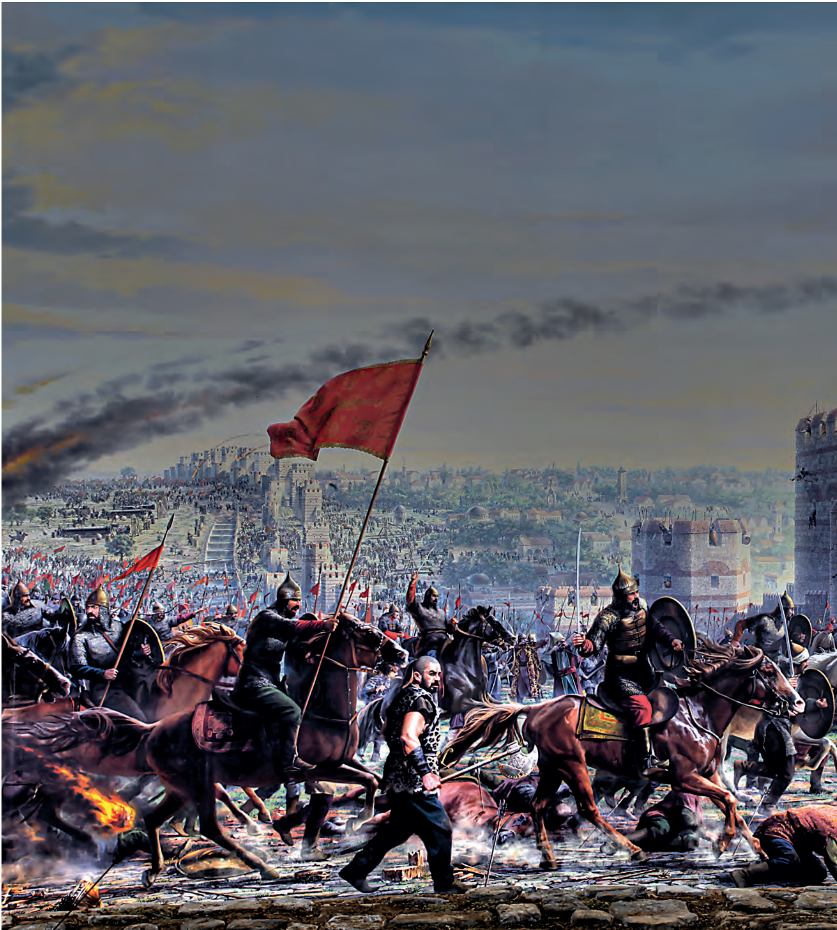
26- Surlardaki mücadele (Panorama 1453 Tarih Müzesi)