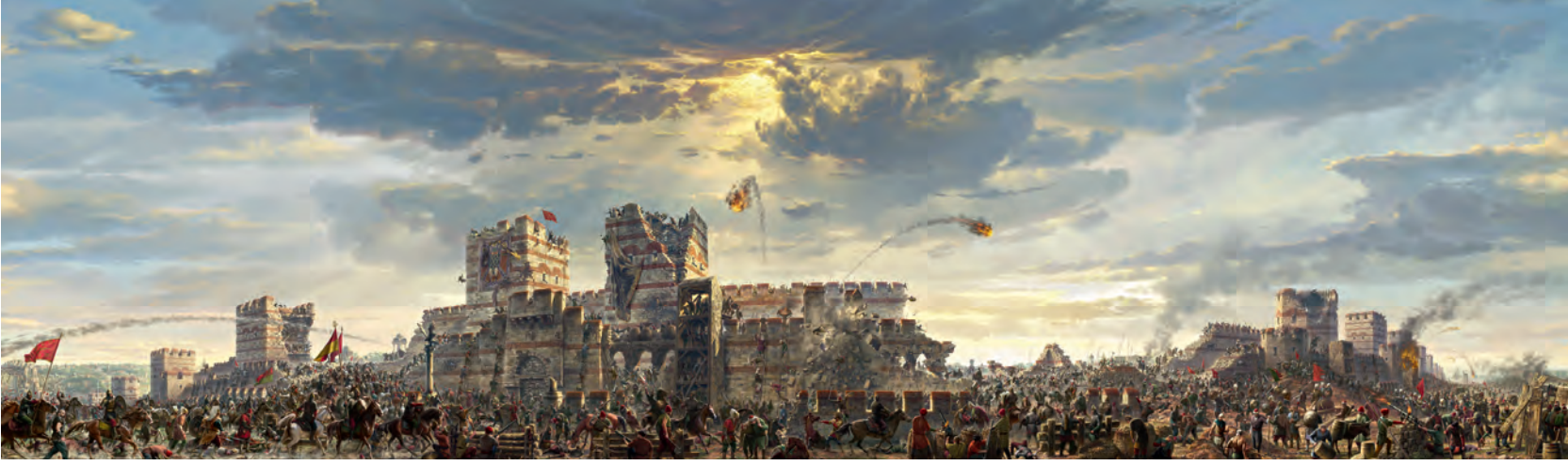
17- Tarih danışmanlığını Feridun M. Emecen'in yaptığı, tarihî bilgiler ışığında İstanbul kuşatmasını konu alan Panorama 1453 (Panorama 1453 Tarih Müzesi)

donanma, Haliç Limanı'na doğru bir manevra yaptı. Bu durum limandaki gemilerde telaşa yol açıtıysa da Osmanlı gemileri daha sonra geri çekildi. Söz konusu manevranın bir bakıma limandaki gemilerin durumunu anlamaya yönelik bir taktik olduğu kolayca anlaşılır. Nitekim aynı gün bataryalardan da toplar ateşlendi, surlar yoğun bir şekilde taş güllerinin hedefi oldu. Barbaro, 18 Nisan'a kadar büyük bir askerî hareketlilik olmadığını, yalnızca sürekli şekilde topların ateşlendiğini belirtir. Öyle anlaşılıyor ki, II. Mehmed öncelikle top ateşiyle surları yumuşatıp tahrip etmeyi ve dolayısıyla da müdafiler üzerinde büyük bir moral çöküntüsüne yol açmayı hedeflemiş bulunuyordu. Bu süre zarfında tek tük küçük grupların surlara yönelik harekâtı görülüyor değildi. Özellikle ön surlarda bulunan Bizanslı müdafilere yönelik bu tip saldırılar, karşı tarafın gücünü ölçmeye yarayan denemelerden ibaretti. Surların önüne kadar yaklaşan Osmanlı yayaları üzerine tüfek ve ok atışı yapılıyor, yaralanan veya ölen Türkleri, arkadan gelen arkadaşı hiçbir korkuya kapılmaksızın sırtlayıp geri götürüyordu. Ölülerini düşmana bırakmamak için içlerinden on kişiyi feda edebiliyorlardı. 78