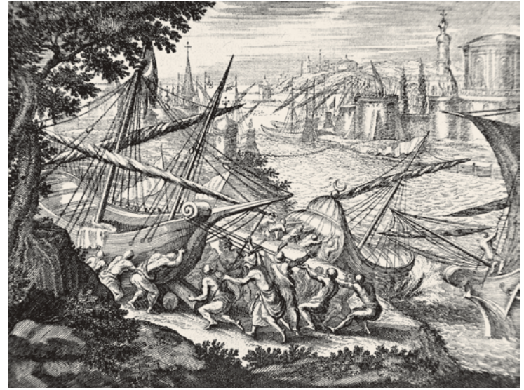
19- Gemilerin karadan yürütülmesi (Rycaut)

Limandaki gemilerin top ateşine tutulduğu 21 Nisan'da, özellikle Aziz Romanus kesiminde gün boyu süren yoğun bir top ateşi de başlatılmıştı. Bu bombardıman o kadar yoğun olmuştu ki, kimse başını surdan kaldıramıyordu, duvarlar parçalanıyor, dumandan göz gözü görmüyordu. Bu kesimdeki büyük bir kulenin de top atışları sonunda tahribata uğraması korkuyla karşılanmıştı. Bizanslılar artık bunu büyük bir hücumun takip edeceği kanaatindeydiler. Gemilerin limana girmesiyle oluşan iyimser hava, büyük kutlama ve sevinç, yerini yine derin bir ümitsizliğe bırakmıştı. Yıkılmaz gibi görülen surların parçalanması şehrin düşüşüyle ilgili kehanetleri yeniden halkın arasında yaygın hâle getirmişti. Fakat beklentilerin aksine, yoğun top ateşini genel bir saldırı takip etmedi. Bu da Bizanslılara yıkılan