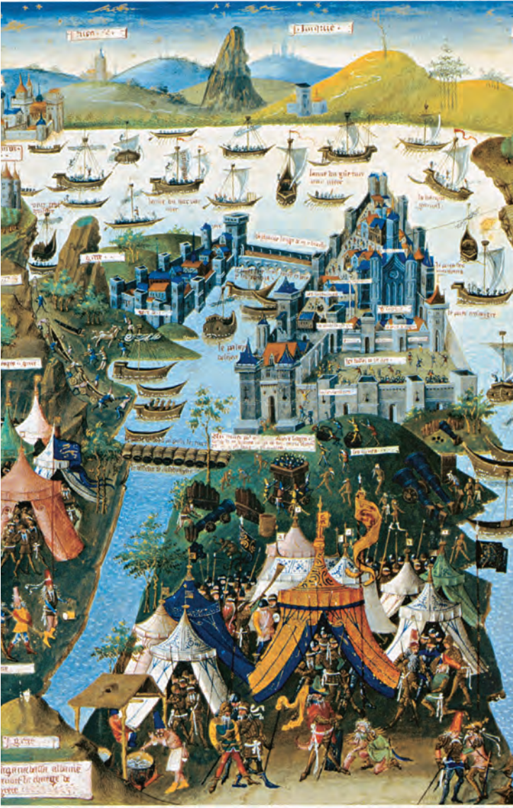
16- İstanbul kuşatmasını ve gemilerin karadan yürütülmesini resmeden bir çizim (Broquiere)

hareket emri vermişti. Bunu haber alan Bizanslılar ve Venedikliler; Cenova, Venedik, Ancona ve Girit gemilerinden oluşan 9-10 gemiyi zincire paralel olarak dizdiler. Türk donanmasının faaliyetini Galata Kulesi'yle şehir tarafındaki kuleden rahatlıkla izleyebiliyorlar, buna göre hareket ediyorlardı. 70