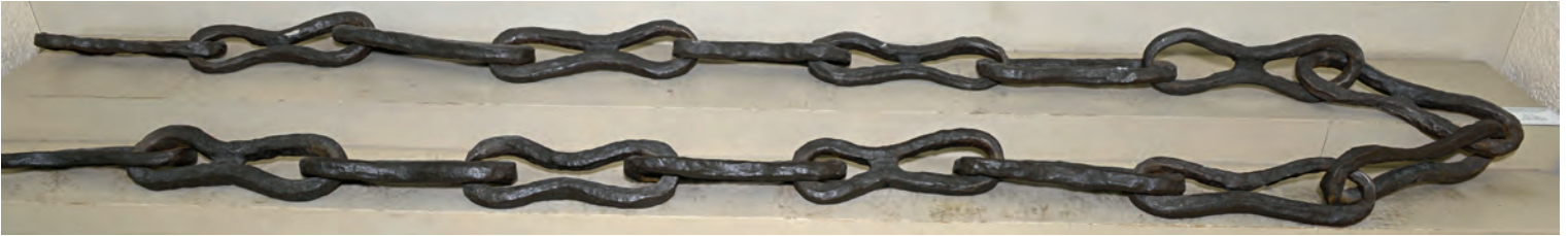
10- İstanbul'un fethini engellemek için Bizanslılar tarafından Haliç'in girişine çekilen zincirin bir kısmı (İstanbul Arkeoloji Müzesi)

planlamıştı. Burayı yıprattıktan sonra ağırlığı Topkapı ile Edirnekapı arasında ortadan bir de derenin (Bayrampaşa/ Likos Deresi) geçtiği kesime verecekti. Haliç'e Marmara tarafından girilen kesimde kalın bir zincir çekildiğini biliyordu. Bu bakımdan içerideki limanda bulunan Bizans ve Latin gemilerinin daha da hareketsiz kalmalarını temin etmeye çalışacaktı. Marmara denizine bakan surlar boyu ise donanmaya bırakılacaktı. Beşiktaş'ta Çifte Sütunlar mevkiinde üslenmiş olan donanmanın asıl görevi, denizden gelebilecek yardımları önlemektir. II. Mehmed ayrıca, Haliç'e girebilmek için çılgın sayılabilecek bir planın hazırlıklarını çok önceden yapmıştı. Bazı gemileri Beşiktaş veya Dolmabahçe koyundan dereyi izleyerek 38 Haliç'e indirme niyetindeydi ve bunun için kuşatma sırasında her şey çok önceden hazırlanmış