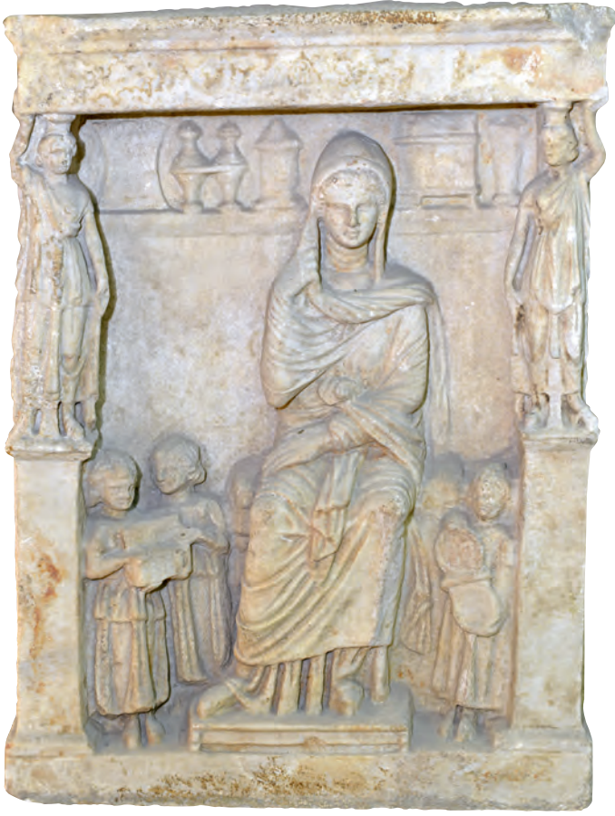
3- Lollia Salvia'nın mezar taşı. Kabartmadaki betimlemeler ölen kadının varlığını gösterir (Hellenistik Dönem, MÖ. II. yüzyıl) (İstanbul Arkeoloji Müzesi)

sakin körfezi ile mükemmel bir yer olduğunu anlarlar. Bunu görmeyip Kadıköy bölgesine yerleşen Khalkedonluların da kör olduklarını düşünürler. 2