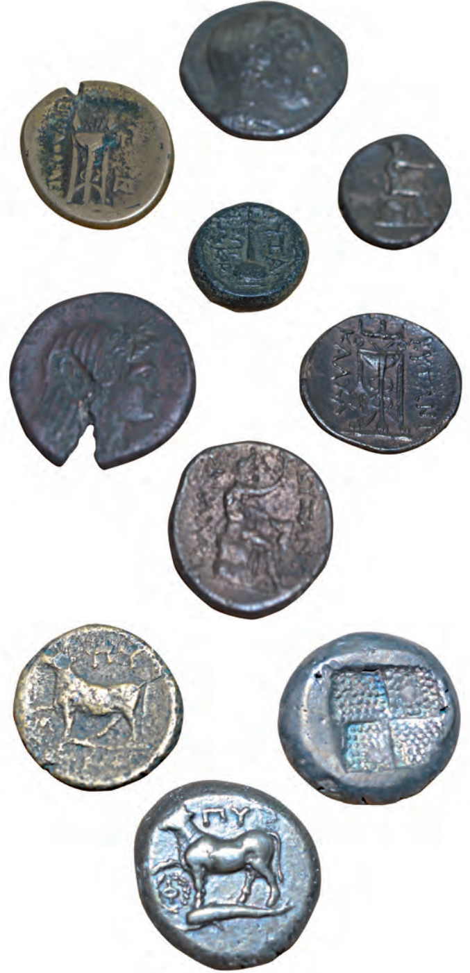
2- MÖ III-II. yüzyıllara ait Byzantion kenti sikkeleri (İstanbul Arkeoloji Müzesi, Sikkeler Bölümü)

hâline gelmiş olmalıdır. Zaten ilerleyen yüzyıllarda Byzantion, Kadıköy'ün de önüne geçer ve büyük olasılıkla şu efsanenin doğmasına neden olur: Byzas liderliğindeki Megaralı kolonizatörler yeni kentlerini nereye kuracaklarına dair bir ipucu almak için Yunanistan'ın Delfi kentindeki kâhinliğe danışırlar. Kâhin, "Kenti Körler Ülkesi'nin karşısına kurun." der. Kafaları karışık bir şekilde yola çıkan kolonizatörler Sarayburnu civarına geldiklerinde, bu alanın Boğaz'ı kontrole uygun konumu ve Haliç dediğimiz