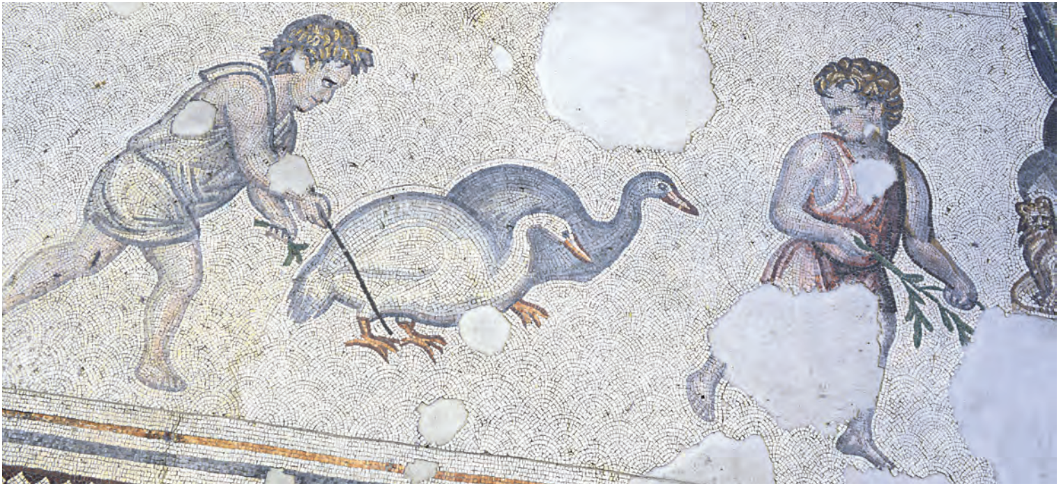
9- Konstantinopolis çiftçisi (Büyük Saray) (Mozaik Müzesi)

kalkışmaktan kendilerini alamamışlardı. 80 Bu yüzyıllarda kentin ticari merkezi Marmara Denizi kıyılarından iyice kuzeye kaymıştır. Bu değişimde, sayıları her geçen gün artan İtalyan tacirlerin duvarlarla çevrilmiş mahallelerini Haliç kıyısındaki bölgeye kurmalarının da etkisi vardır. Sirkeci'den Unkapanı'na uzanan bir sahil hattında sırasıyla Ceneviz, Piza, Amalfi ve Venedik mahalleleri kendilerine ait iskeleleri ile Haliç'i dev bir uluslararası limana çevirmişlerdir. 81 Konstantinopolis'in karşı yakasındaki Galata ise XI. yüzyıla gelindiğinde, 2.500'e ulaşan nüfusu ile önemli bir Yahudi mahallesi hâline dönüşmüştü ve bu Yahudilerin önemli bir kısmı ipek ticaretinden zengin olmuştu. 82 XII. yüzyılın ortalarında İspanya'dan kutsal topraklara doğru hac için yolculuk eden Yahudi tacir Tudelalı Bünyamin'in yazdığına göre, "[Yahudilerin] durumları çok kötüdür ve onlara karşı çok nefret vardır ve bu nefretin artmasında kirli sularını evlerinin önüne boşaltıp Yahudi mahallesini kirleten Yahudi debbağların [deri tabaklayanlar] payı vardır." 83 Karaköy'ün adının Karaim ya da Karayit adlı ve Konstantinopolis'te