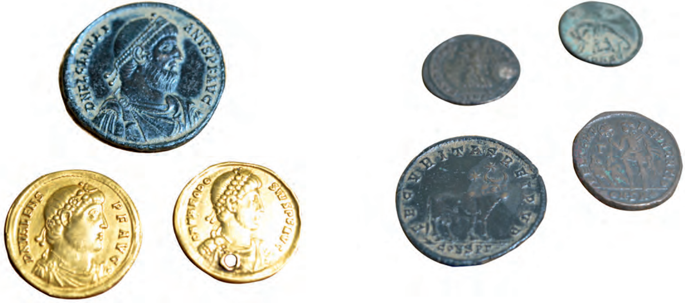
8- IV-V. yüzyıllara ait Konstantinopolis'te basılan sikkeler (İstanbul Arkeoloji Müzesi, Sikkeler Bölümü)

verirlerse karşılığını ödemekle yükümlüydü ama tacirler de bir gemiye mal yüklemeyen önce o geminin sağlam ve yeni olduğunu kontrol etmekle yükümlüydüler; zira yaşlı bir gemide batan mal için kimse sorumlu değildi. 35