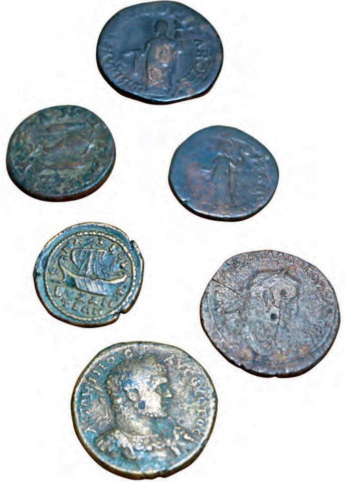
6- Erken dönemde Konstantinopolis'te basılan sikkeler (İstanbul Arkeoloji Müzesi, Sikkeler Bölümü)

alışverişi kolaylaştırıyordu. Daha büyük yükler için tunç kantarlar ve kantara çengelle asılan yükü dengelemek için imparatoriçe ya da Athenaios-Minerva figürlü kantar topu kullanılırken, ince tartım gerektiren ürünler için tunç teraziler ve kefeleri dengelemek için de kare ya da yuvarlak tescilli tunç ağırlıklar kullanılırdı. 20