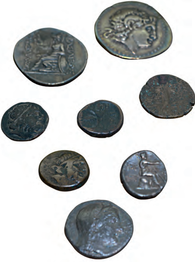
1- MÖ III-II. yüzyıllara ait Byzantion kenti sikkeleri (İstanbul Arkeoloji Müzesi, Sikkeler Bölümü)

Yunanlı Herodotos ve Polybios, Romalı yazar Plinius ve Geç Antik Çağ'dan Eusebios gibi yazarların anlattıklarına göre, Byzantion Kadıköy'ün kuruluşundan birkaç on yıl sonra, MÖ 660 yılında Megaralı lider Byzas tarafından kurulmuştur. Dolayısıyla kentin ismi de Byzas'ın yeri anlamına gelen Byzantion olur. 1