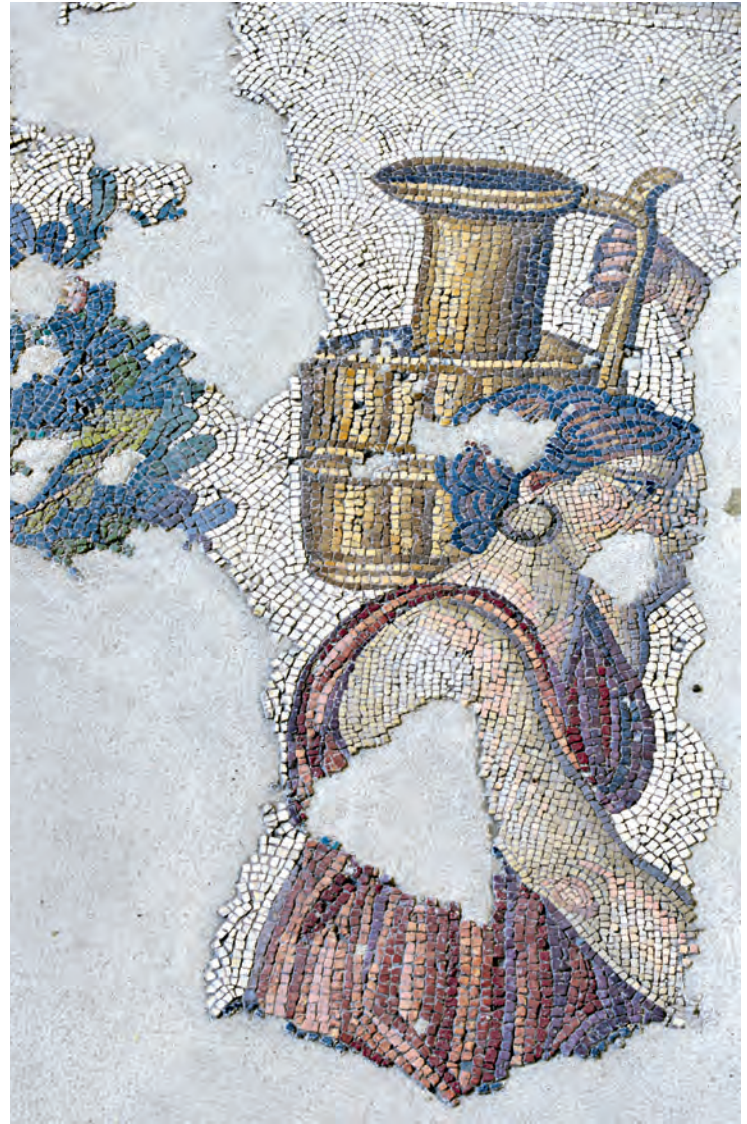
4- Büyük Saray'da Konstantinopolis gündelik hayatını tasvir eden bir mozaik (Mozaik Müzesi)

verilen üstü kapalı sütunlu galerilerden müteşekkil sokaklarda yer alan dükkânların ( ergasterion ) rolü büyüktür. Strategion'u bir kenara bırakırsak, Bizans İstanbul'unun büyük meydanları yarımada'nın batısını doğusuna bağlayan ana cadde üzerinde bulunur. Bizans döneminde Mese olarak bilinen ve Ayasofya'dan başlayıp Aksaray'a doğru uzanan ana cadde (Divanyolu Caddesi) üzerinde bulunan Konstantinos Forumu (Çemberlitaş), Theodosios Forumu (Beyazıt Meydanı) ve Forum Bovis (Aksaray) hem ticari hem de törensel işlevlere sahiptiler. Forumlardan daha küçük macellum lar antik dönemlerde çevresi dükkânlarla kapalı alanlardı ve temel olarak et ve balık pazarı işlevi görüyorlardı. Notitia 'ya göre, Konstantinopolis'te dört macellum vardı. Bunlardan ikisi Sirkeci-Eminönü bölgesinde, diğer ikisi de Çemberlitaş ile Laleli arasında bugünkü Mesihpaşa ile Mimar Kemalettin mahallelerine karşılık gelen bölgedeydiler