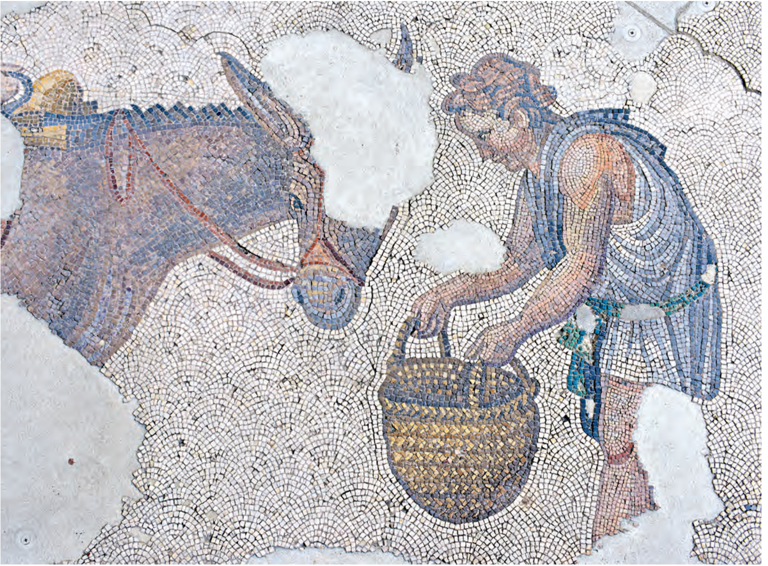
5- Konstantinopolisli bir çiftçi (Büyük Saray) (Mozaik Müzesi)

( Notitia 'ya göre VIII. bölgede). 13 Yan yana dizilmiş çeşitli büyüklüklerdeki dükkânların olduğu stoalar ise kentin farklı caddelerine dizilmişlerdi. Örneğin, 50'si sağda 50'si solda 100 dükkân, Mese'nin Çemberlitaş ile Sultanahmet arasındaki en değerli kısmındaki stoaya kurulmuştu. Mese'nin Aksaray'a kadar olan kısmını da alırsak, ana cadde üstünde toplam beş yüz kadar dükkânın olduğunu görürüz. Genellikle hem sınaî üretimin yapıldığı hem de satışının gerçekleştiği dükkânların toplam sayısını bulmak tabii ki imkânsızdır; ancak sadece Ayasofya Kilisesi'ne ait 1.100 dükkânın olduğu göz önünde bulundurulduğunda, büyük sayıların söz konusu olduğu aşîkârdır. 14