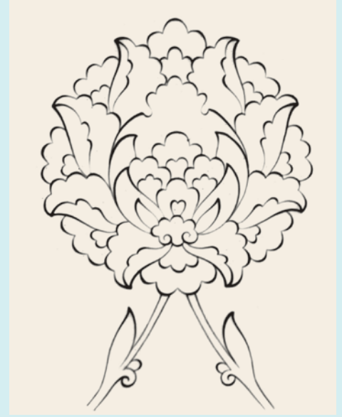
1- Hatâyî motifi

Hayvan motifleriyse, hayal mahsulü efsanevi hayvan motifleri (ejder, simurg, ki'lin) ve tabiat kaynaklı, üsluplaştırılmış hayvan motifleri (aslan, pars, tavşan, geyik ve