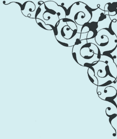
3- Rûmî motifleriyle hazırlanmış bir küşe deseni

Her devirde önemli bir motif olarak kullanılan ve pek çok çeşidi bulunan rûmî motifi, aslı itibarıyla hayvan kaynaklı olup, ismi "Anadolu'ya ait" demektir. Vaktiyle Roma İmparatorluğu'nun hüküm sürdüğü, İran yaylalarına kadar uzanan Anadolu yarımadasına "Diyâr-ı Rûm" denilmesinden dolayı motife bu ad verilmiştir. Rûmî kelimesinin yanlış düşüncelere sebep olduğunu gören bazı sanat adamlarımız bu motife, Türkî veya Selçûkî ismini koymayı teklif etmişlerse de bu teklif kabul görmemiştir. İşlemeli , sencîde , sarıлма , dendanlı gibi rûmî çeşitleri vardır. Rûmî ve münhani motiflerinin en belirgin çizim özelliği, nüans verilmeksizin hazırlanmasıdır.