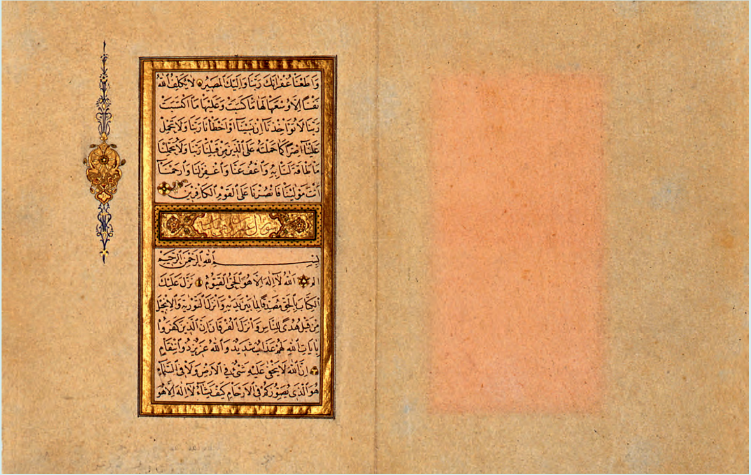
2- Akkâseli muhrec sayfa örneği

tamamladığı bir eseri göstererek: “Hoca, bunda bir mecdiyelik (=eski yirmi kuruş) iş var mı?” demiş. Necmeddin Efendi de alıcı gözle bakıp: “Evet, var.” cevabını verince Bahaddin Efendi “Öyleyse, sandık otur!” cümlesini kullanmış. Necmeddin Efendi hayretle: “Aman Hocam, o ne demektir?” diye sorunca şu cevabı almış: