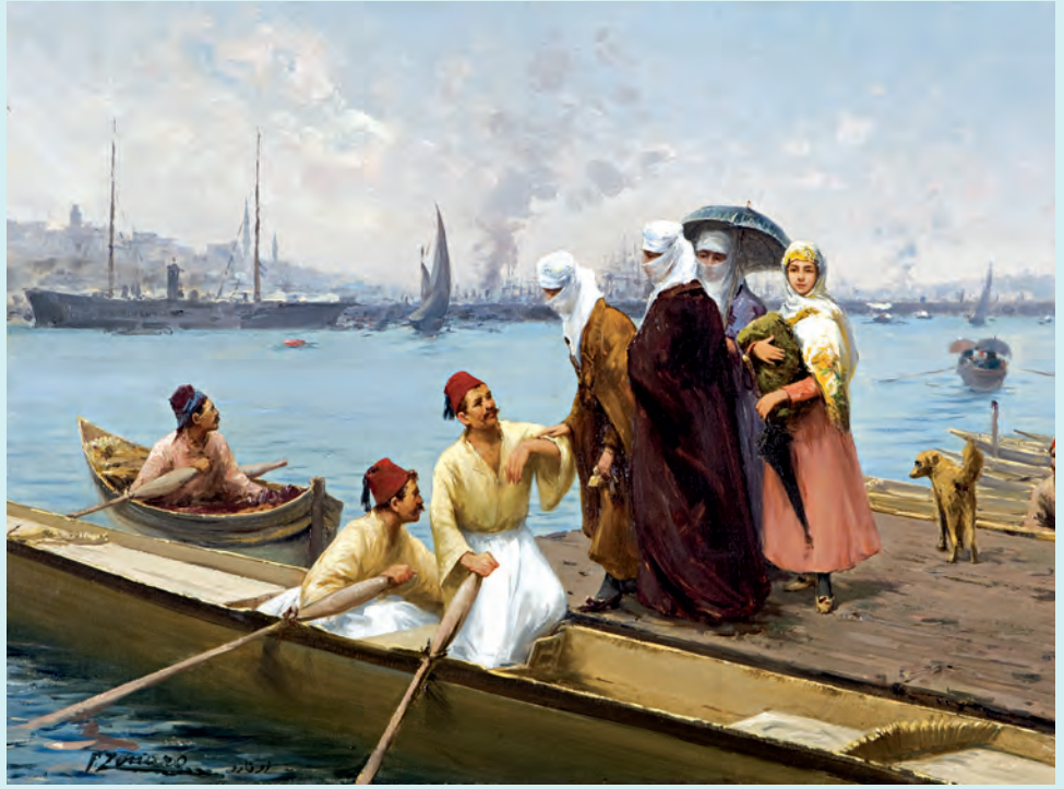
2- Müslüman hanımların iskeleden kayıklara binmesi (TSM)

Ma'ruz-ı çâker-i keminelidir ki, Mâlûm-i âli-i sadaret-penâhileri buyurulduğu üzere Tersane-i Âmire tarafından Boğaziçi'ne işlettilmekte olan vapur-i hümayuna şimdiye kadar İslâm hatunları irkâb olduğu yoğise de Rusya bandırasıyla mahall-i mezkûre işlemekte olan vapurda geçen gün beş on kadar ehl-i İslâm hatunu olup Boğaziçi'ne gitmekte olduğu müşahede olunmuş ve giderek daha ziyadeleşeceği derkâr bulunmuş olup sâye-i hü mâ-pâye-i hazret-i şâhânedede Tersane-i Âmire tarafından mahall-i mezkûre mahsus vapur işlemekte olduğu hâlde böyle ecnebi vapurlarıyla İslâm hatunlarının gidip gelmesi yakışksız görünüp eğerçe bu âna kadar Boğaziçi vapuruna hatun konulduğu yoğise de beyana hâcet olmadığı üzere taşra iskelelere gitmekte olan vapur-i hümayunlara hatun yolcusu konulmakta idüğinden bunun dahi onlara kıyas olunarak hatun irkâb olunmasında bir gûna mahzur görünmeyip şu kadar ki, pazar kayıklarında olduğu gibi rical ile nisvân bir yerde bulunmamak ve usul-i tesettür ve ihticâba riayet