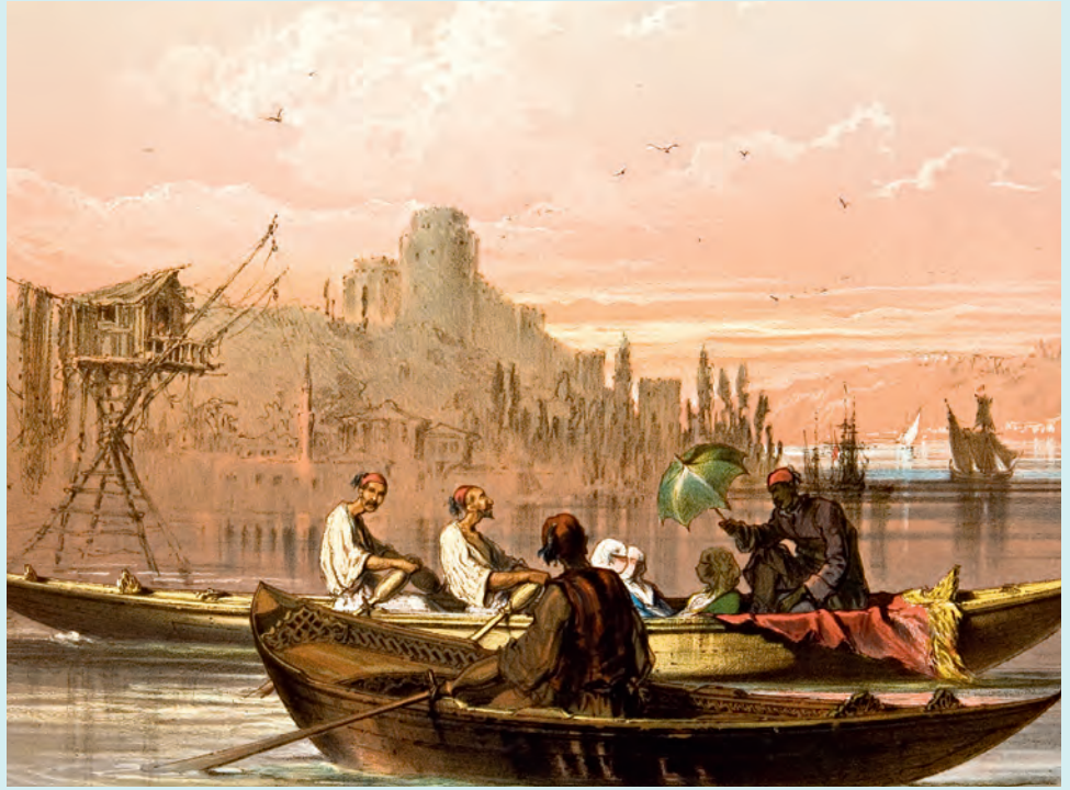
3- Müslüman hanımların İstanbul Boğazi'ndeki kayık yolculuğu (Preziosi)

Atufetlü efendim hazretleri, Boğaziçi'ne işlemekte olan Rusya vapuruna geçenlerde beş on kadar ehl-i İslâm hatun binmiş ve bu keyfiyet çirkince görünmüş olduğundan Tersane-i Âmire'den Boğaziçi'ne işlemekte olan vapurun bir tarafına nisâ için kafes vaz'ı ve mahal tahsisiyle rükûblerine ruhsat verilmesi ve bu suret münasip olmadığı hâlde ecnebi vapuruna ehl-i İslâm hatunlarının rükûbleri men' kılınması ifadesine dair devletlü kapudan paşa hazretlerinin tezkiresi üzerine Meclis-i Vâlâ'dan kaleme alınan bir kıta mazbata mezkûr tezkire ile beraber manzur-i âli buyurulmak için takdim kılındı. Her ne kadar vapurda nisâyâ mahal tahsisiyle usul-i tesettür ve ihticâbiyyeye riayet olunsa bile yakışık almayacağına