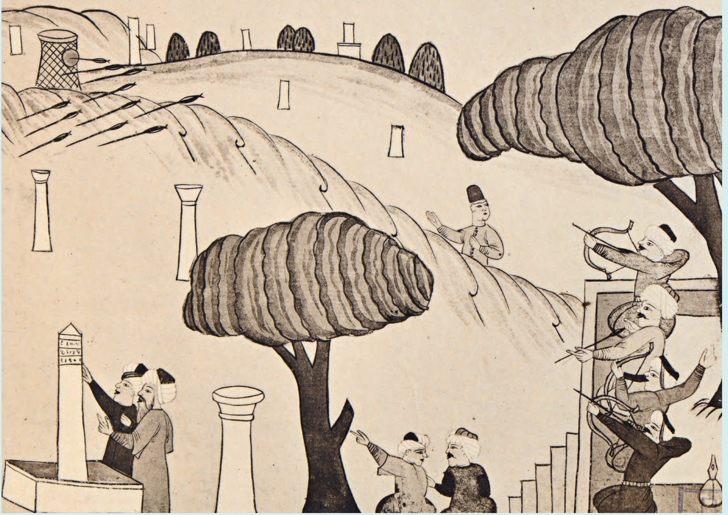
2- Okmeydanı (Taeschner)

sırasından sofrada oturuş düzenine kadar her türlü etkinlik çeşitli kurallar dairesinde yerine getirildiği için bir okçuluk geleneği ve âdâbı oluşmuştu. Müsabakalarda ok yere düştüğünde genellikle “Yâ Hak” denirdi. Okçular kullandıkları eşyalara hürmet ederler, abdestsiz ok atmazlar, pirlarını yâd etmedikçe vazifelerini bitirmiş sayılmazlar, kendilerinden önce gelen şanlı adamlara ve umumiyetle ihtiyarlara saygı gösterirler, sokakta yürürken önüne geçmez, bunların ailelerini her türlü saldırıya karşı korumayı mertlik sayarlardı.