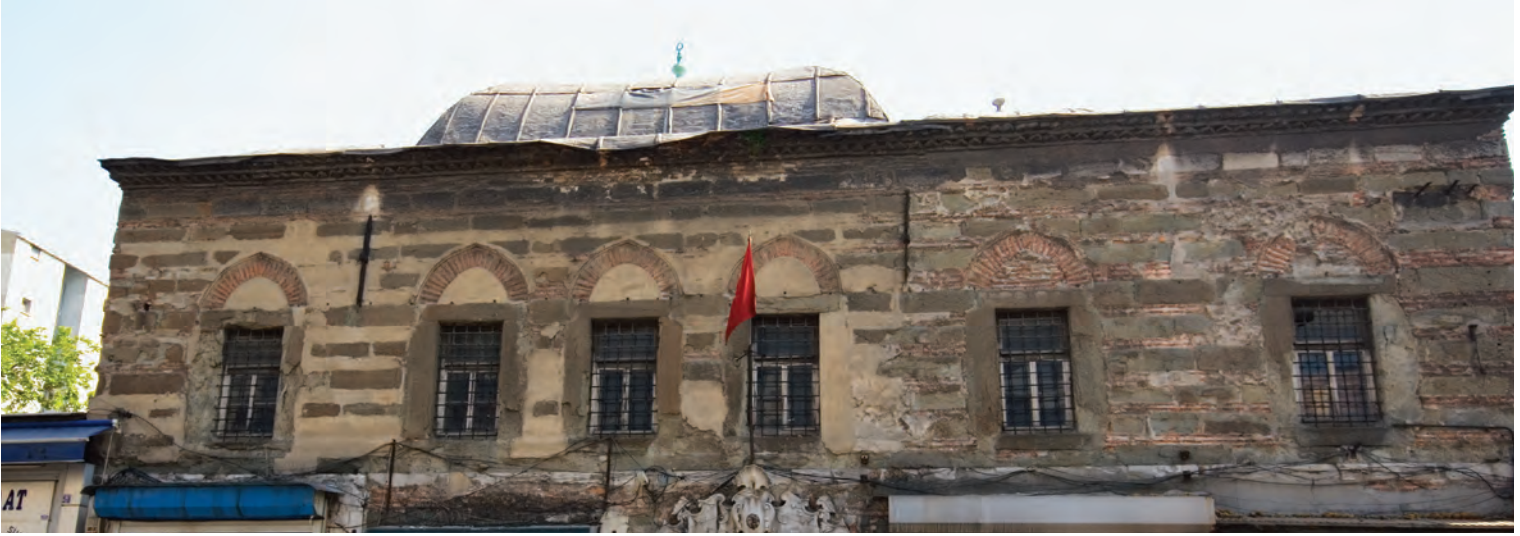
15- Ragıp Paşa Kütüphanesi

Cevdet Paşa'nın naklettiğine göre I. Abdülhamid, tahta çıktıktan birkaç yıl sonra ecdadının izinden giderek adını yaşatacak bir cami ve imaret yaptırmak istemiş, fakat bu iş için seçilen yerlerde çok sayıda ibadethane bulunduğu için içinde cami bulunmayan bir külliye inşasına karar vermiştir. Bahçekapı'daki külliye'nin temeli sadrazam ve şeyhülislamın da hazır bulunduğu bir merasimle Şaban 1191 (Eylül 1777) tarihinde atılmış 93 , aynı yılın Zilkade (Aralık) ayında bazı bölümleri tamamlanmıştır. Medrese ve kütüphanenin inşası ise ancak 1194'te (1780) bitirilebilmiştir.