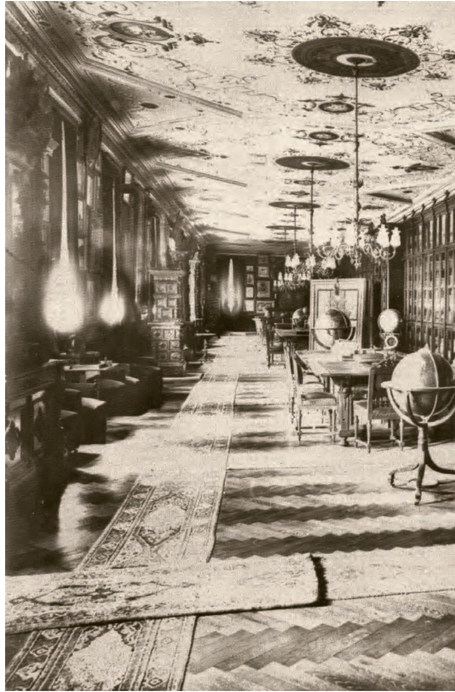
16- II. Abdülhamid'in kurduğu Yıldız Kütüphanesi (Yıldız Albümleri)

Daha önce kurulan bu kütüphanelere yapılan ek vakıflar yanında, III. Selim devrinde İstanbul'da yeni kütüphaneler kurma yönünde bazı çalışmalar yapılmıştır. Mesela ulemadan Debbağzade İbrahim Efendi, 1801 yılında Kılıç Ali Paşa Medresesi'nde bir kütüphane kurmuştur. Şeyh Mustafa Hulusî Efendi, Balat'ta yaptırdığı cami, mektep ve kütüphanenin 15 Şaban 1212 (2 Şubat 1798) tarihli vakfiyesinde kütüphaneye koyduğu 250 cilt kitabın adlarını vermekte ve ihdas ettiği üç hafız-ı kütüblüğe de oğlunu, damadını ve torununu tayin etmektedir. 102 Celvetiyye meşayihinden Mehmed Hasib Efendi'nin 1208'de (1793-1794) Üsküdar'da yaptırdığı