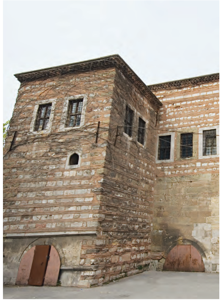
8- Şehit Ali Paşa Kütüphanesi

İstanbul Vefa'da, III. Ahmed dönemi sadrazamlarından Şehid Ali Paşa'nın yaptırdığı müstakil binada kurmuş olduğu kütüphane zengin koleksiyonuyla dikkat çekmektedir. Bu kütüphaneye Ali Paşa, çeşitli ilim dallarına ait bazı kitaplar koymuş ve bunların bir de kataloğunu hazırlattır: Aslında Şehid Ali Paşa, Safer 1127 (Şubat 1715) tarihli vakfiyesinden anlaşıldığına göre ilk kütüphanesini İstanbul'da Üskübî Mahallesi'ndeki