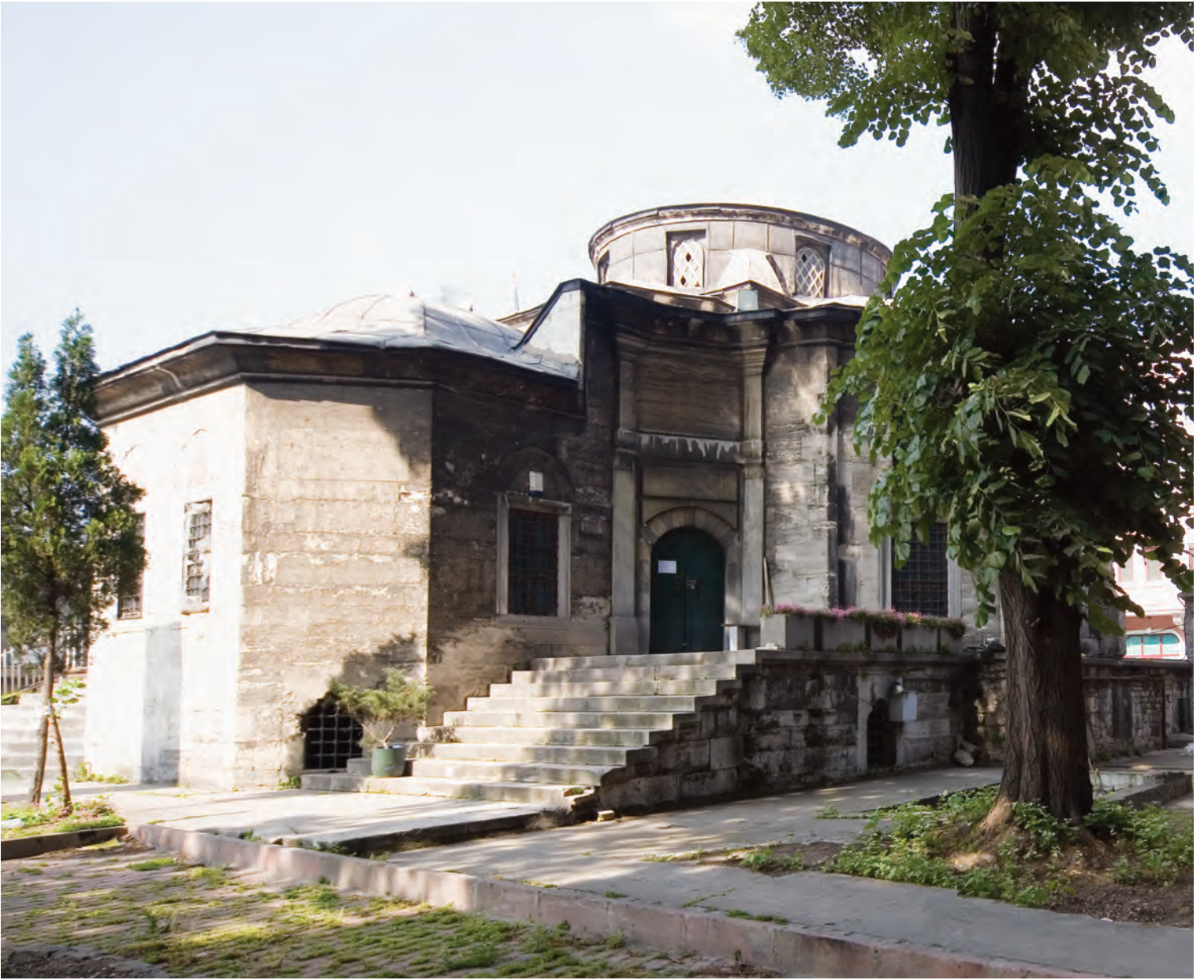
11- Nuruosmaniye Kütüphanesi

Rıza Efendi'nin Eylül 1740 tarihinde oldukça zengin bir koleksiyonu bu kütüphaneye bağışladığı ve kitaplarının bakımı için ek personel tayin ettiği görülmektedir. 67