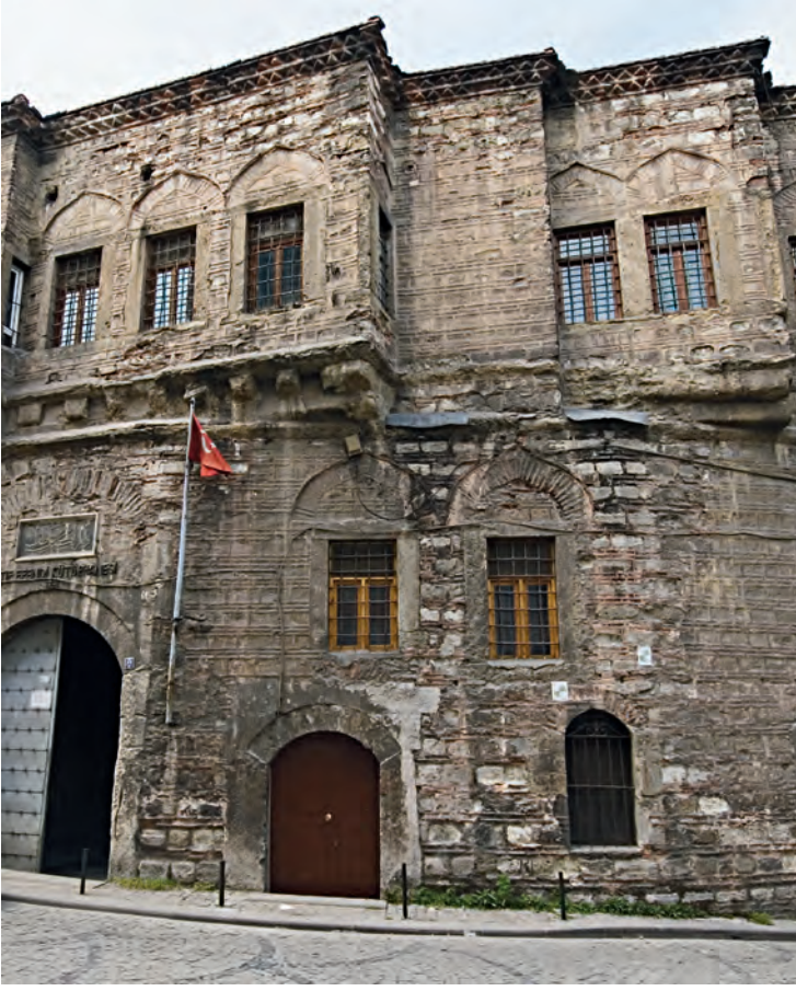
10- Atif Efendi Kütüphanesi

kütüphaneleri 61 yanında devletin en uzak bölgelerindeki kalelerde bile kütüphane kurma teşebbüsüne girişen I. Mahmud'un saltanatı süresince, İstanbul'da ve diğer şehirlerde devlet adamları, âlimler ve başka sınıflardan kimseler tarafından çok sayıda kütüphane kuruldu. I. Mahmud'un İstanbul'da yaptırdığı kütüphaneler arasında Ayasofya Kütüphanesi, gerek mimarisi gerekse de zengin koleksiyonu ve geniş kadrosuyla dikkati çekmektedir. Kütüphanenin vakfiyesi 1152 Şevvalinde (Ocak 1740) hazırlanmış 62 ve kitapların bir kısmı aynı yılın Kasım'ında temin edilmişse de açılış merasimi ancak 21 Nisan 1740 tarihinde yapılabilmektedir. İstanbul'da aynı yıl içinde Âşir Efendi Kütüphanesi'nin koleksiyonunun oluşturulduğu ve Defterdar Atif Efendi tarafından yaptırılan bir binada nadir eserlerden oluşan zengin bir koleksiyona sahip önemli bir kütüphanenin kurulduğu görülmektedir. İdareci sınıftan kimseler tarafından tesis edilip ulema sınıfına mensup çocukları tarafından geliştirilen bu iki