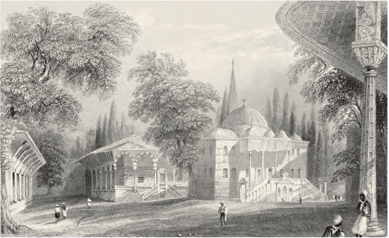
4- Topkapı Sarayı'nın üçüncü avlusunda yer alan III. Ahmed Kütüphanesi (Pardoe)

Sadrazam Sokullu Mehmed Paşa'nın (ö. 1579), İstanbul'daki medrese ve hankahı ile Bergos'taki medresesinde birer kütüphane kurduğu 981-982 (1574-1575) yıllarında düzenlediği iki vakfiyesinden öğrenilmektedir. 32 Hanımı İsmihan Sultan'ın vakfiyesinde olduğu gibi Sokullu'nun vakfiyesinde de her üç müesseseye vakfedilen kitapların büyük bir itina ile hazırlanmış kataloğu mevcuttur. 33 Sokullu, vakfiyesinde özellikle kitapların değiştirilmesinin önüne geçilebilmesi için alınacak tedbirler üzerinde durmuş ve eskiyen ya da kaybolan kitapların yerine aynı eserin bir başka nüshasının satın alınıp vakfedilmesini şart koşmuştur.