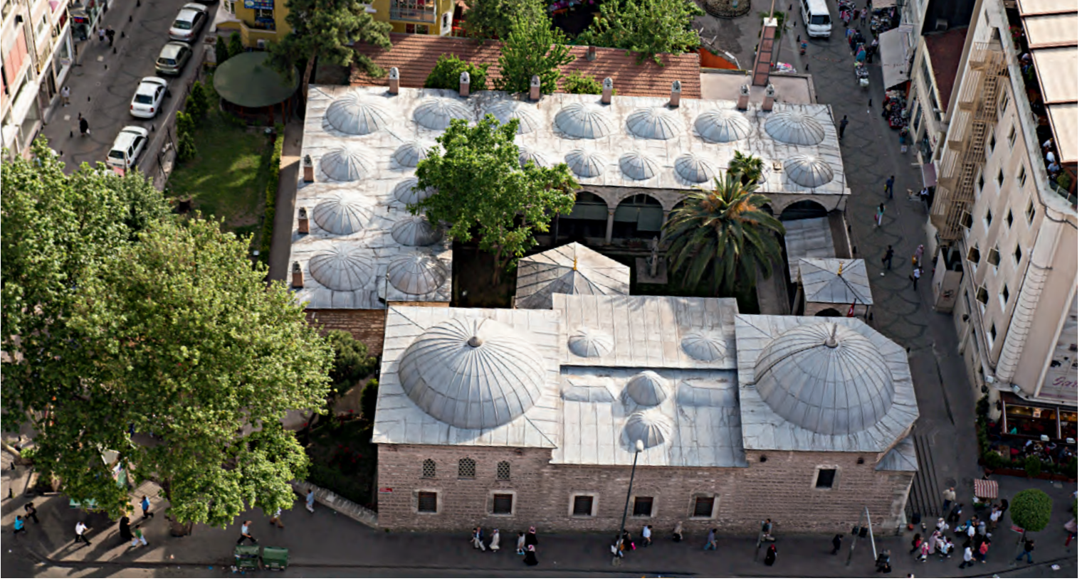
2- Millet Kütüphanesi

eserin üzerindeki Muhammed b. Ali Fenarî'ye ait sayım kayıtlarından öğrenilmektedir. Bu kütüphaneye ait Kanunî Sultan Süleyman devrinde Hacı Hasanzade tarafından hazırlanmış bir kataloğun önsözünde belirtildiğine göre, Muhammed b. Ali Fenarî tarafından külliye de bulunan kitapların bir de kataloğu yapılmıştır. 16