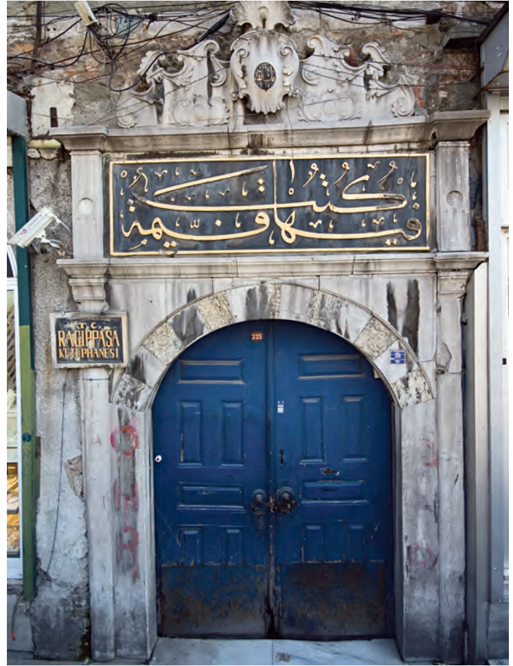
14- Ragıp Paşa Kütüphanesi'nin kapısının üzerindeki kitabe

III. Mustafa döneminde iki defa şeyhülislam olan Veliyyüddin Efendi, 3 Rebiülevvel 1175'te (2 Ekim 1761) şeyhülislamlıktan ilk azlinde düzenlediği bir vakfiye ile 150 kitabını Atıf Efendi Kütüphanesi'ne vakfetmiş 87 ve