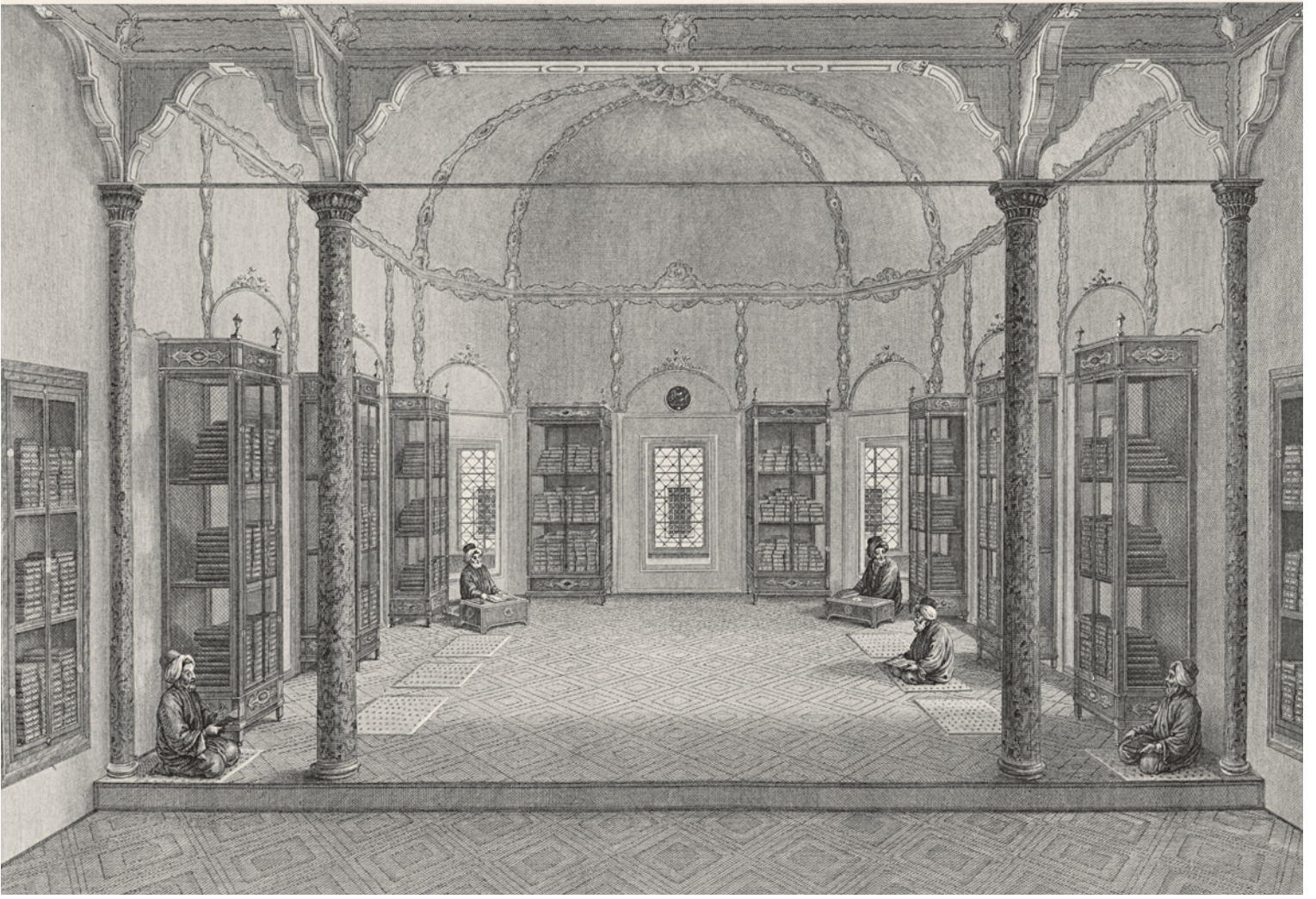
12- I. Abdülhamit Kütüphanesi (d'Ohsson)

Hacı Beşir Ağa'nın kurduğu vakıf kütüphanelerinden başka, zengin bir özel kütüphanesi bulunduğu da anlaşılmaktadır. Öldüğünde sadece Karaağaç'taki hazine odalarında, arasında Kâtib Çelebi'nin el yazısıyla Cihannümâ adlı eserinin de bulunduğu 150 kadar değerli kitap çıkmıştır. 70