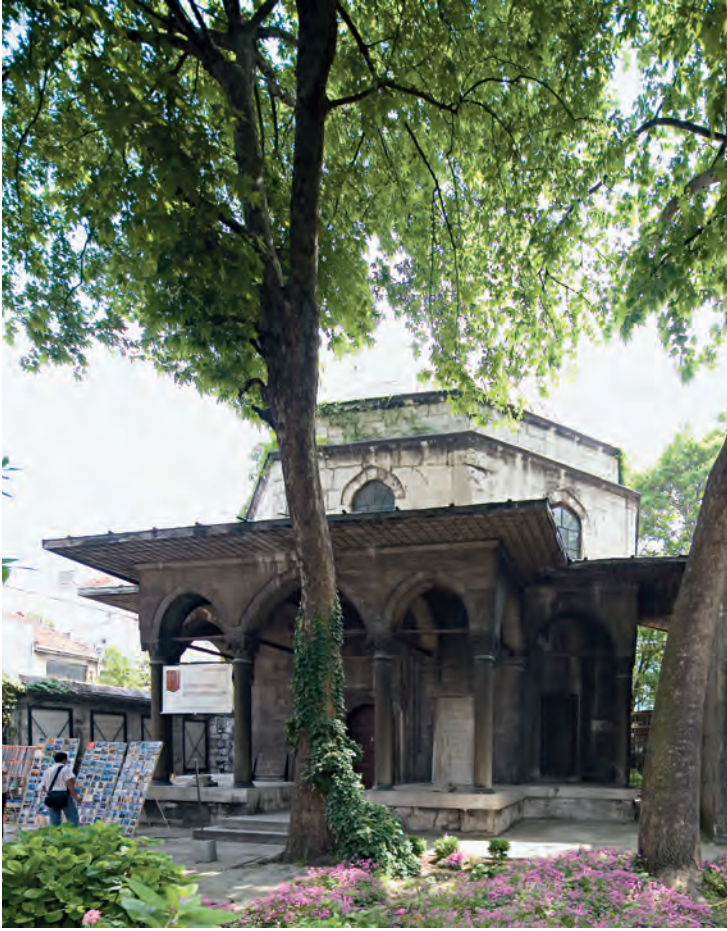
3- Merzifonlu Kara Mustafa Paşa Kütüphanesi