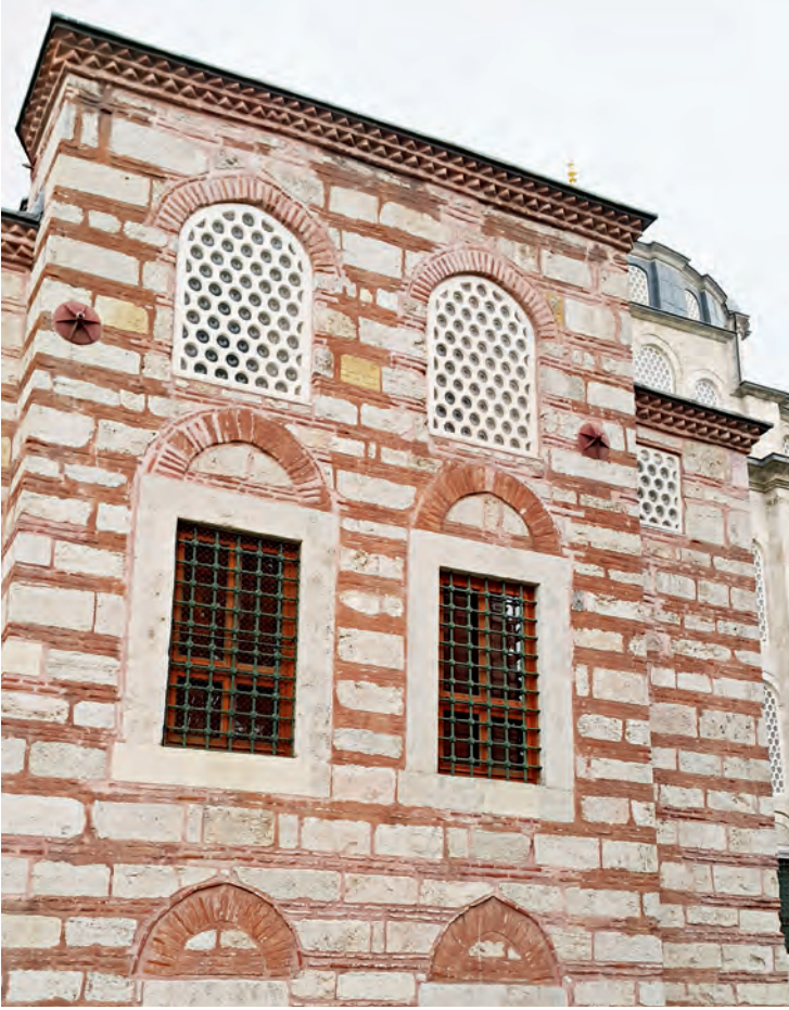
1a-b- Fatih Kütüphanesi girişi ve hazire tarafından görünüşü