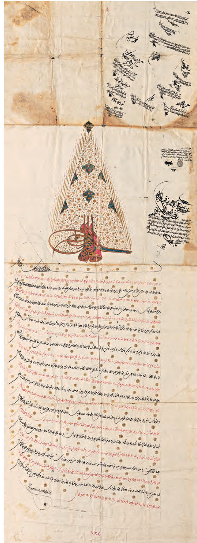
6- I. Mahmud'un İstanbul'daki Kütüphaneleri Vakfı Mukataası'ndan olan Belgrad'daki Sayd-ı Mahi ve Geçidha Mukataasının malikane olarak verilmesiyle ilgili 29 Temmuz 1773 tarihli berat (BOA, MF, nr. 124)