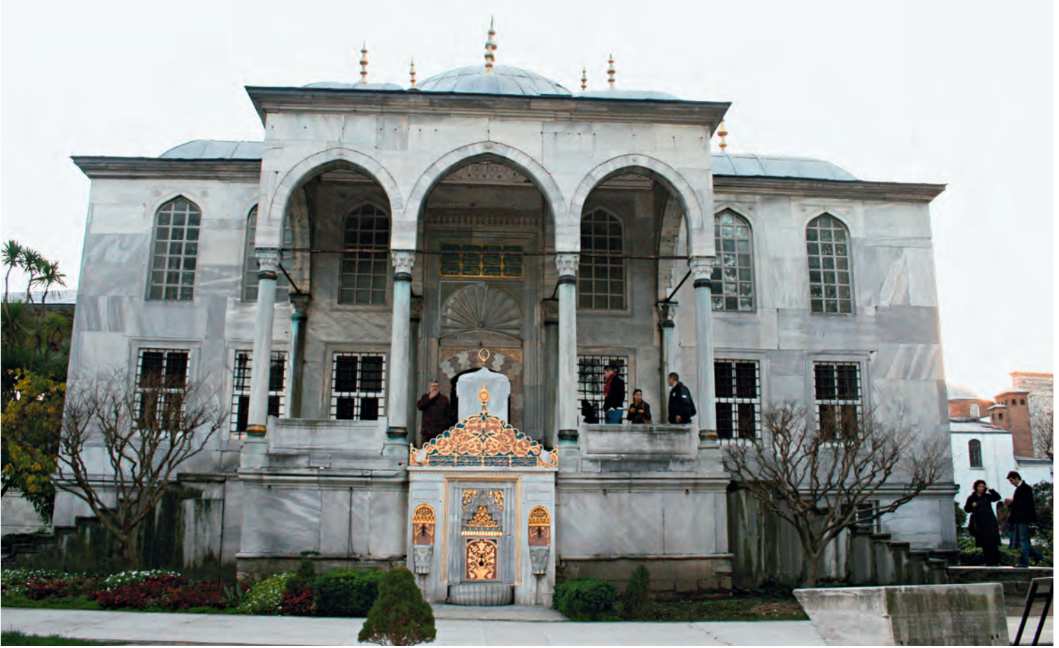
5- III. Ahmed Kütüphanesi

bu kütüphanenin hafız-ı kütübüne günlük 3 akçe ilave ücret tayin ettiği 1047 (1637-1638) tarihli vakfiyesinden anlaşılmaktadır. 36 Anadolu Kazaskeri Mehmed Efendi b. Abdullah Molla Çelebi'nin Fındıklı'daki camisinin içinde kurduğu kütüphane, vakıf sahibinin 992'de (1584) düzenlenmiş vakfiyesinden anlaşıldığına göre caminin yakınında yaptırmayı düşündüğü darülhadis hoca ve talebelerine hizmet verecekti. 37 Mehmed Ağa'nın İstanbul Çarşamba'daki camisinde tesis ettiği kütüphane ise sadece medrese ve darülhadisinin müderrislerine açıldı. 38