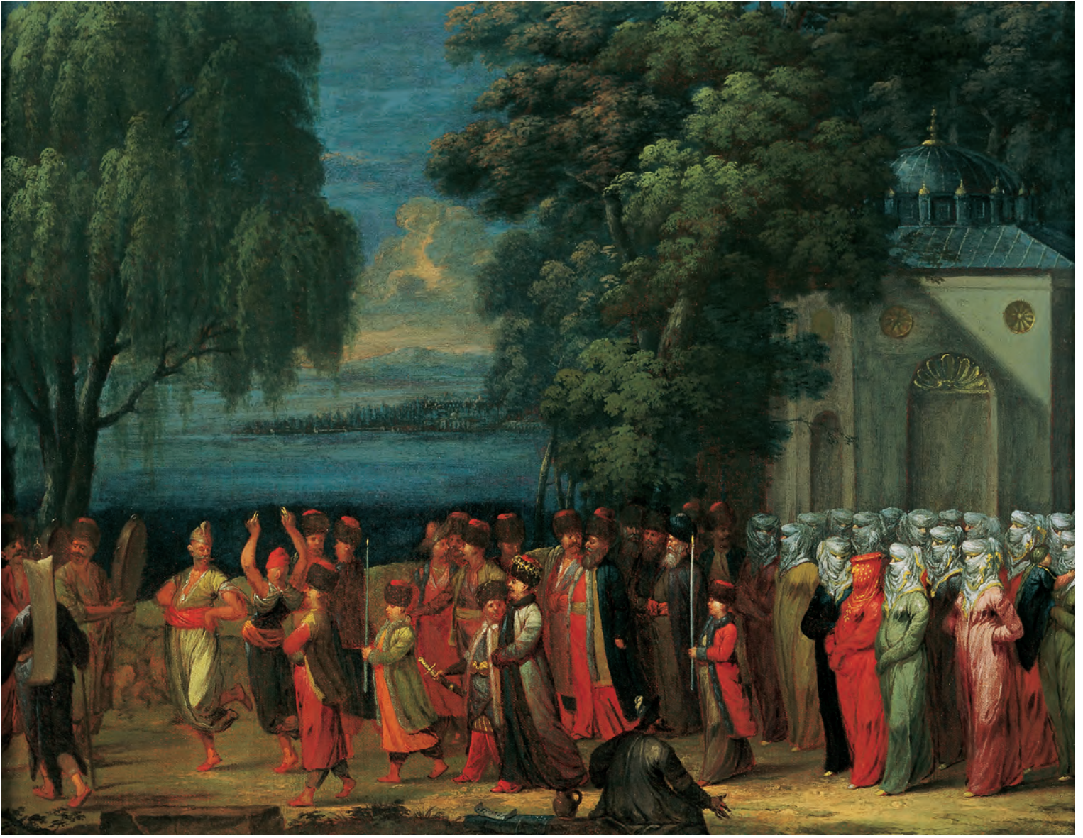
19- XVIII. yüzyılda İstanbul'da bir düğün alayı (Vanmour, Amsterdam, Rijks Müzesi)

Ne güzel came imiş sevb-i edeb” ifadelerini kullanarak, kadınların kadim üzere ve edebe uygun giyinmeleri gerektiğine vurgu yapar. 62