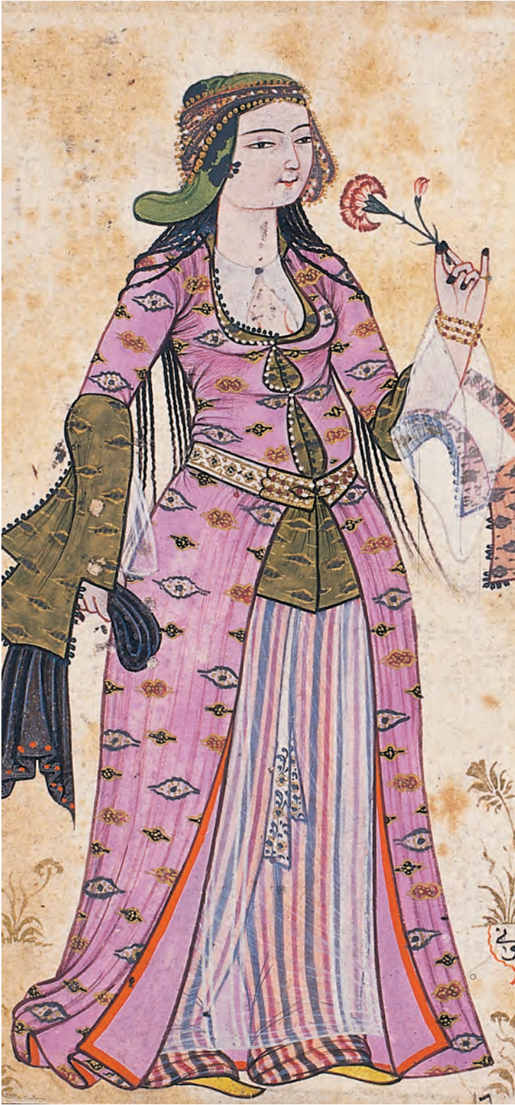
12- XVIII. yüzyılda kadın ve erkek tiplmesi (Levnî, Albüm)

gayrimüslim grubun farklı renkte kıyafet ve özel başlık giymesi talep edilmiştir.