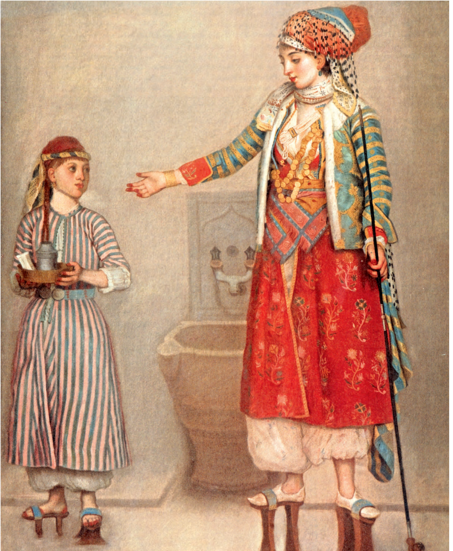
20- XVIII. yüzyılda hamamda bir Türk kadını ve hizmetçisi (Doha, Orientalist Müzesi)