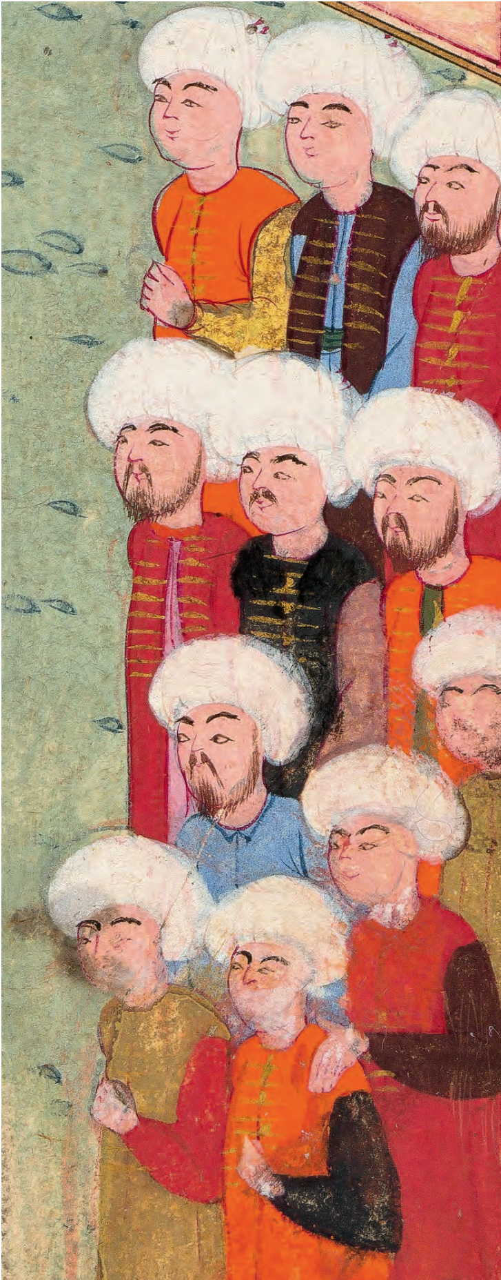
6- İstanbul'da erkek kıyafetleri (İntizâmî)

etmiştir. Dönemin sadrazamı, gayrimüslim temsilcilerin görünüşe çok ehemmiyet verdiğini belirtmesine rağmen, Yavuz sade giyimini değiştirmemiştir. İpek ve sırma kıyafetler giyen oğlu Süleyman'ı tasvip etmeyen Yavuz'un, "Bre çakşırılı sen böyle giyersen ya anan neylesin? Ona giyecek nesne komamışsın." diyerek oğlunu azarladığı rivayetinin doğruluğu şüpheli de olsa, bu anlamda hayli yaygınlaşmıştır. 25