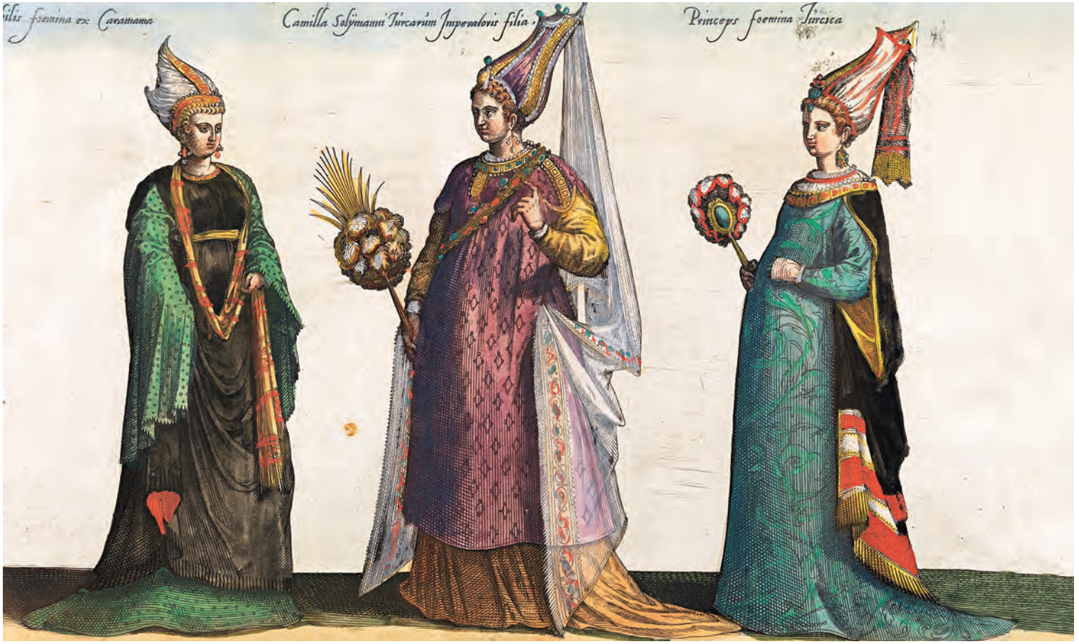
8- Karamanlı Hanım, Kanunî Sultan Süleyman'ın kızı (Mihrimah Sultan) ve Hanım Sultan'ın kıyafetleri (TSM, nr. 17 /1024)

II. Mahmud devri örneklemesi olarak Hızır İlyas, Letâif-i Enderun isimli eserinde bu konuda teferruatlı bilgi verir. Enderun'da dört kez mevsim giysisi değişmesinin âdet olduğunu, uygun giysinin bir tür ibadet olduğunu belirtir. Yazın sıcak havalarda giyilen beyaz kaftan, eylül ayı girince değiştirilirdi. Enderun-ı Hümayun'da kışın koyu renkler giyilir, hava ısınınca kışlık kıyafet olan çukaya kaplı samur kürk değiştirilerek sof kaplı samur kürk giyilirdi. Saray tarafından ilan edilen, mevsime dayalı kıyafet değişimi umumiyetle cuma günleri yapılırdı. 30