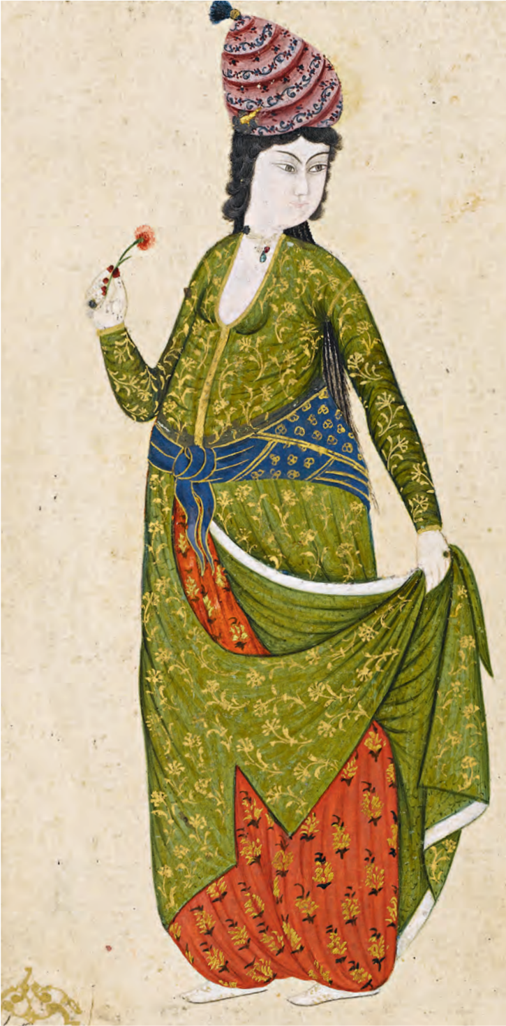
17- XVIII. yüzyılda karanfilli bir kadın (Abdullah Buharî, TSM, nr. YY.1042)

Ayrıca yüzyılın ikinci yarısında ilk dönemde bulunan beledi , çuka , sandal , hataî , boğası , edirneşahî , germsud , mağrib şalî , zencirbaş , şalî , sof , kadife , kutnudan yapılmış kıyafetlere ilaveten, acemkârî , altınoluk , Ankara şalîsi , telkârî , çitari , hindî , damgahane , frenk , entari , gezi , İstanbul şalîsi , mahmudiye , bağdadkârî , sakızkârî , sevayi , suzenikârî , çeşm-i bülbül ve selimiye kumaşları kullanılır.