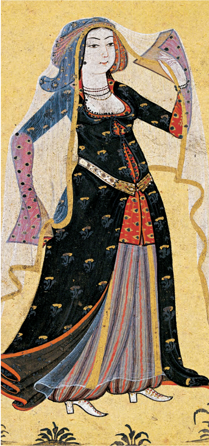
13- XVIII. yüzyılda bir kadın tiplemesi (Levni, Albüm)

İstanbul'da yaşayan gayrimüslim kıyafetleri konusunda düzenlemeler II. Mehmed ile başlamıştır. Fermanlardan takip edilebildiği üzere, XVI. yüzyılda gayrimüslim halkın giysilerinin biçim, kumaş cinsi ve renkleri üzerinde önemle durulmuştur. Örneğin 1580 tarihli bir fermana göre, II. Mehmed döneminde Yahudilerin kırmızı şapka ve siyah ayakkabı,