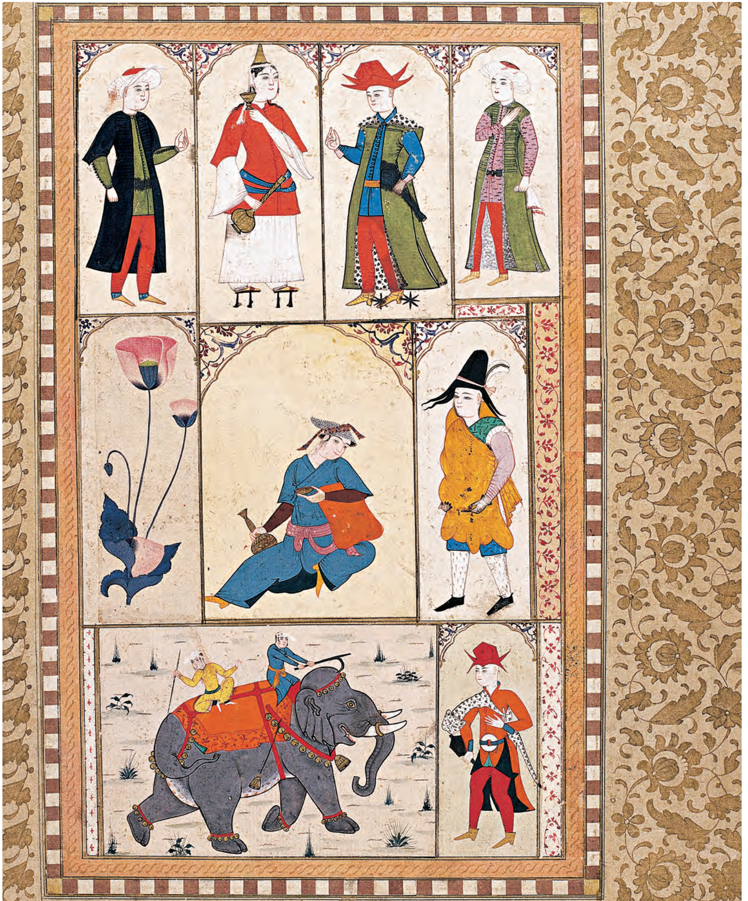
9- I. Ahmed Albümü'nde yer alan kıyafetlerden bazıları (TSMK, nr. B 408)