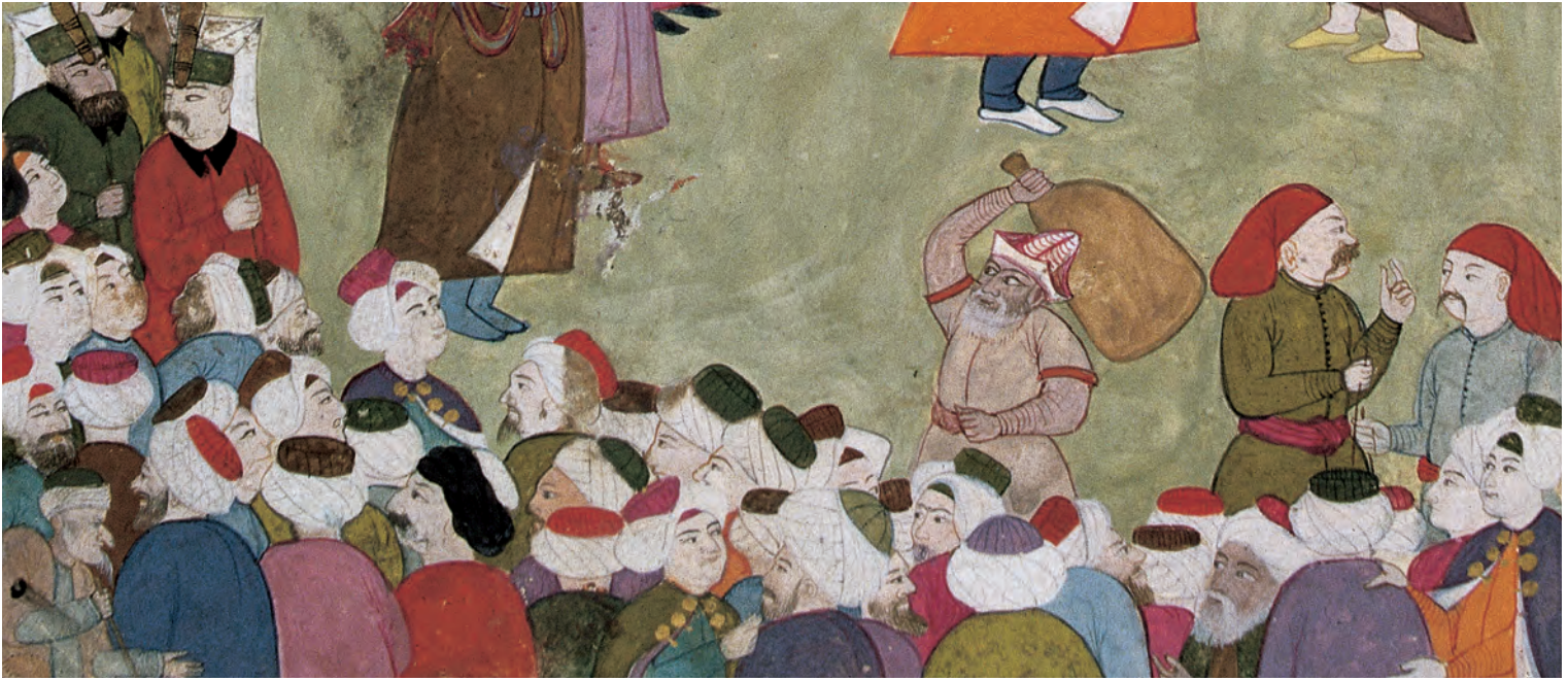
16- 1720 şenliğinde İstanbul ahali (Surnâme, nr. 3594)

Yetkililer Hz. Muhammed'in "Kim bir topluluğa benzerse o gruptan olur ( men teşebbehe kavmen fehüve minhüm ).” hadisine atıfta bulunarak hem başlığı diken esnafı hem de giyen Müslümanları ikaz eder ve esnafın eskiden verilen ölçü üzere dikmesini ister. Ancak bazı ihlallere rağmen, bir grubun diğer bir grup gibi giyinmemesi konusunda hassasiyet devam eder. Bu dönemde d’Ohsson, Osmanlı toplumunda her Türkün (yani Müslümanın) kendine tahsis edilen kıyafeti giydiğini, farklı bir grubun elbiselerini giymenin ve özellikle başlığını kullanmanın bir utanç sebebi olduğunu ve bu durumun dinden dönme ve sadakatsizlik olarak değerlendirildiğini belirtir. 54