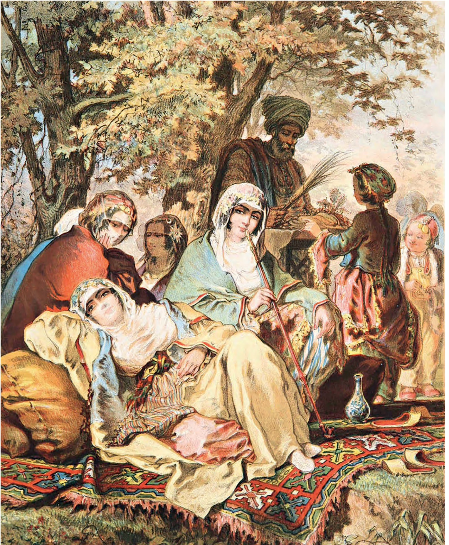
22- XIX. yüzyılda İstanbul kadınları Küçüksu'da eğlenirken (Preziosi)