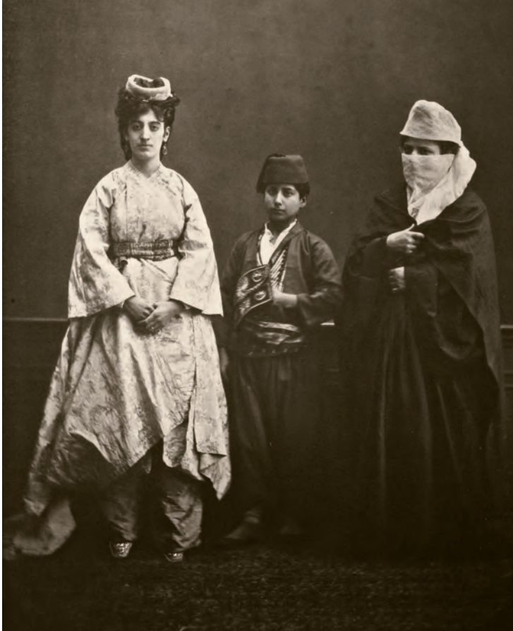
31- Sokak kıyafetleriyle (sağda) ve ev kıyafetleri içinde (solda) İstanbul hanımları

netice itibarıyla üst sınıf arasında çarşaf terk edilirken, Batı modası iyice kendisini hissettirmiştir.