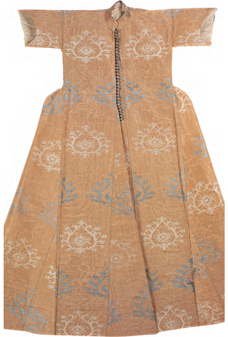
25- II. Mahmud'un kıyafet reformundan önceki kaftanı (TSM, nr. 13/644)