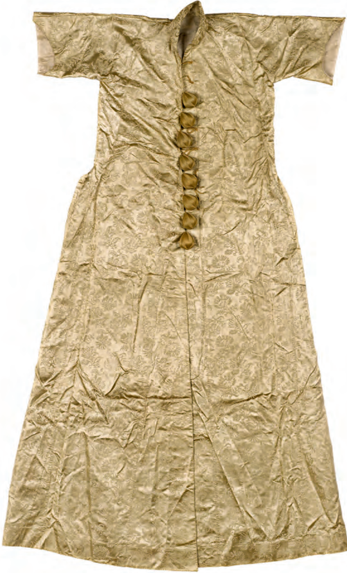
24- Entari (TSM, nr. 13/751)