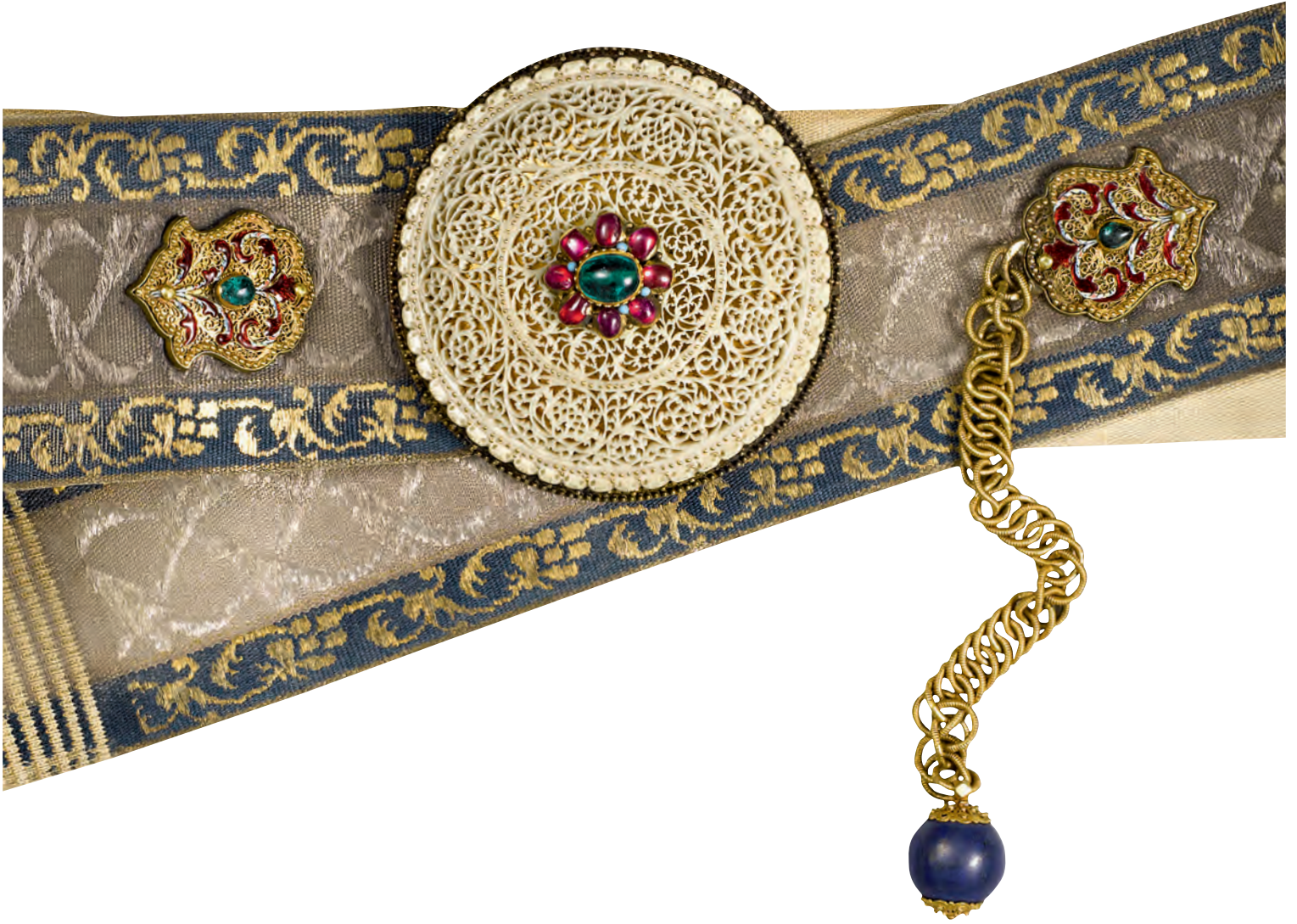
18- XVIII. yüzyıla tarihlenen murassa kemer (TSM, nr. 2/538)

Pardoe, Kurban Bayramı günü, Sultanahmet Camii'nde padişahın da katılımıyla yapılan bayramlaşma töreni esnasında gördüğü Türk kadınlarının yaşmaklarını ayrıntısıyla anlatır. Kadınların yüzlerini örttükleri bembeyaz ve çok ince tülbent yaşmaklarının altından yalnız yanları işlemeli hotozlarının üstündeki göz kamaştırıcı pırlantaları görmeye dudaklarının rengini bile seçtiğini belirtir. Ayrıca bu dönemde Müslüman kadınların ince ve açık yaşmağa ilave olarak gayrimüslimler gibi ince pamuk çorap ile gezildiği belirtilir. Diğer taraftan 1850 sonrası feracelerde parlak leylaki, pembe, siyah, açık mavi gibi rengârenk şalaki adlı yeni cins kumaştan dikilmiş feraceler görülür.