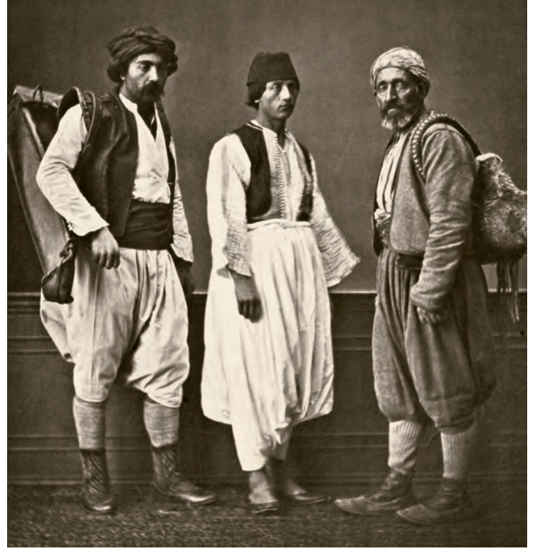
29- İstanbullu hamal (sağda), kayıkçı (ortada) ve saka (solda)

öncesi kadınların sahip oldukları gücün sınırlarına ışık tutan bir alan olarak görülmüştür.