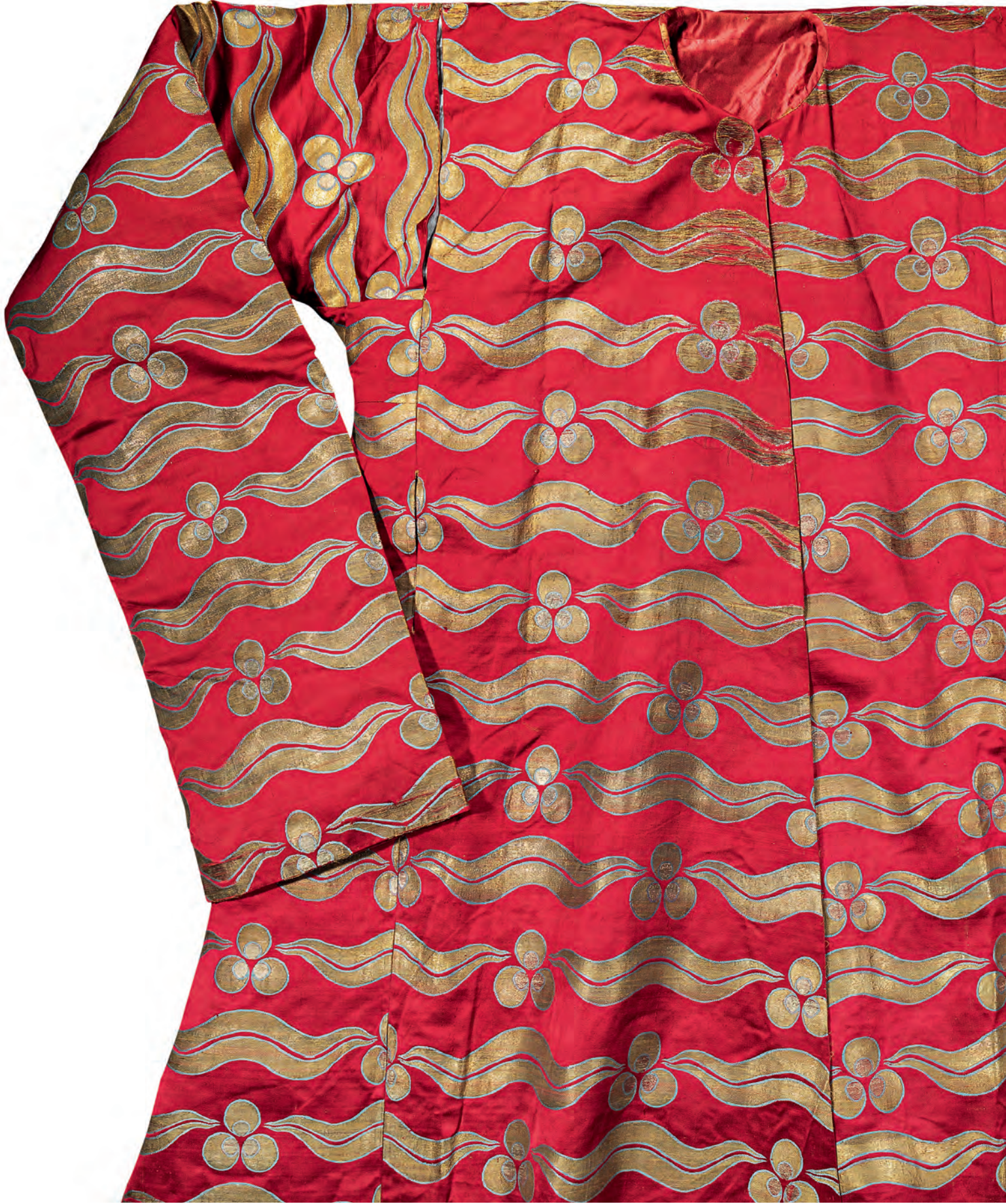
14- XVII. yüzyılda tören kaftanı (TSM, nr. 13/408)