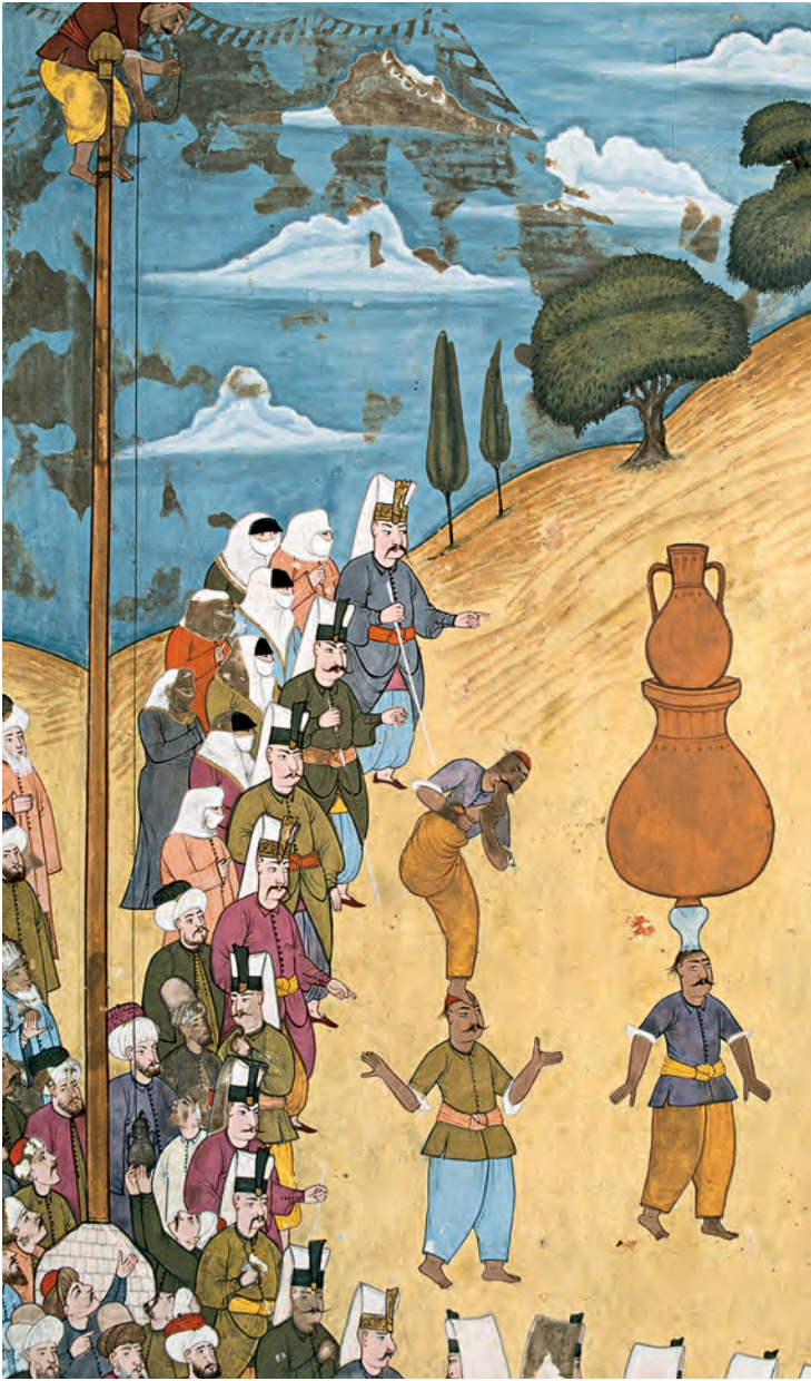
15- 1720 şenliğinde İstanbullu erkek ve kadınlar gösterileri izlerken (Vehbî)

giymeyerek üstleri gibi giyinmeye başladılar. Esnaf, hizmetçi, sanatkâr ve hekimlerin bazıları kadim olan kıyafetlerini bozarak devlet ricaline mahsus kıyafetleri giyerler. Örneğin kakum ve vaşak kürk vezirler, ulema ve devlet ricaline mahsus olup halka yasak olmasına rağmen, esnaf ve halkın gücü olsun olmasın değerli kürkleri giyerek devlet adamlarını taklit ettikleri belirtilir. 51 Başlıklarında kanuna aykırı olarak birtakım