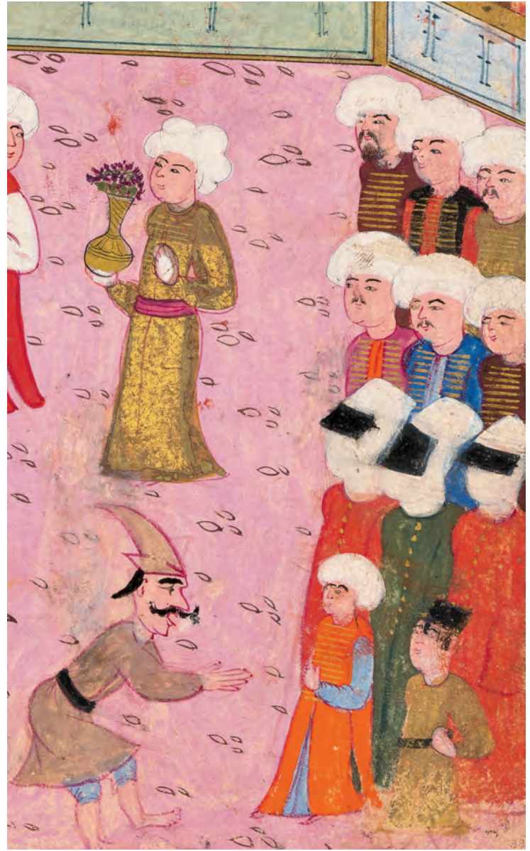
4- Kadın kıyafeti (İntizâmî)

benzemekle birlikte, her bir padişah kavuğun şeklinde değişiklik yapmıştır. XVIII. yüzyıl sonlarında İstanbul'da yaşayan d'Ohsson, başlıklar hakkında detaylı bilgi verir. II. Mehmed'in ulemaya mahsus örfi kavuk giydiğini yazarken, mücevveyi ilk giyenin II. Bayezid olduğunu belirtir. I. Selim, selimî denen başlık şeklini getirmişken, I. Süleyman muhtelif başlık şekilleri icat etmesine rağmen mücevveze kullanmıştır. Kendinden sonra gelenler ise I. Mahmud dönemine kadar bu başlığı kullanacaklardır. 14