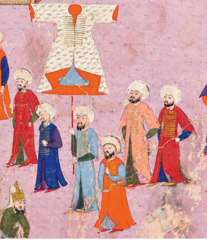
2- Kaftan tarzileri (Intizâmî)

yabancı yazarları da İstanbul halkının giyim kuşamı konusunda yerli kaynakları destekler mahiyettedir. 10