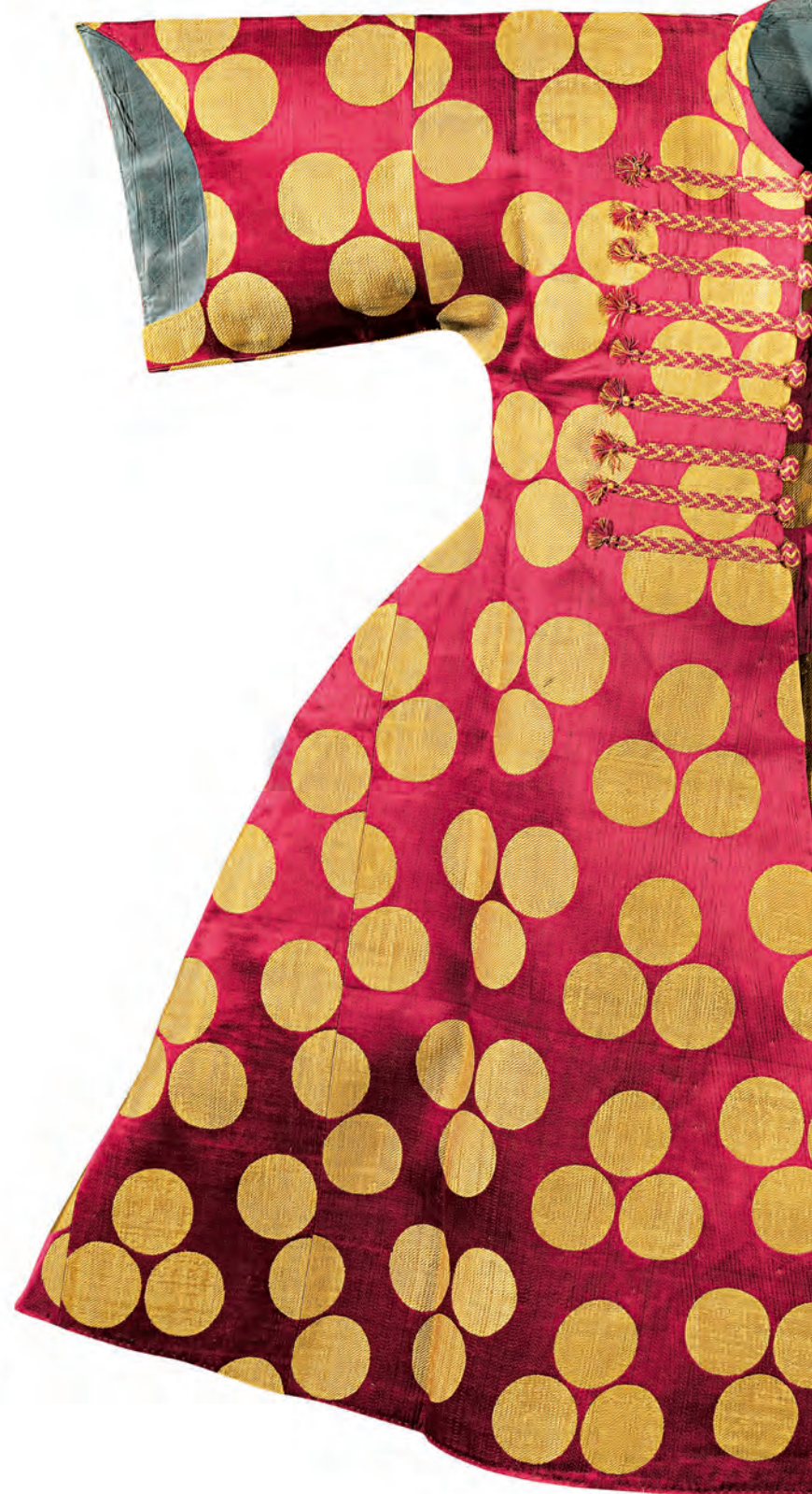
3- Tören kaftanı (TSM, nr. 13/739)