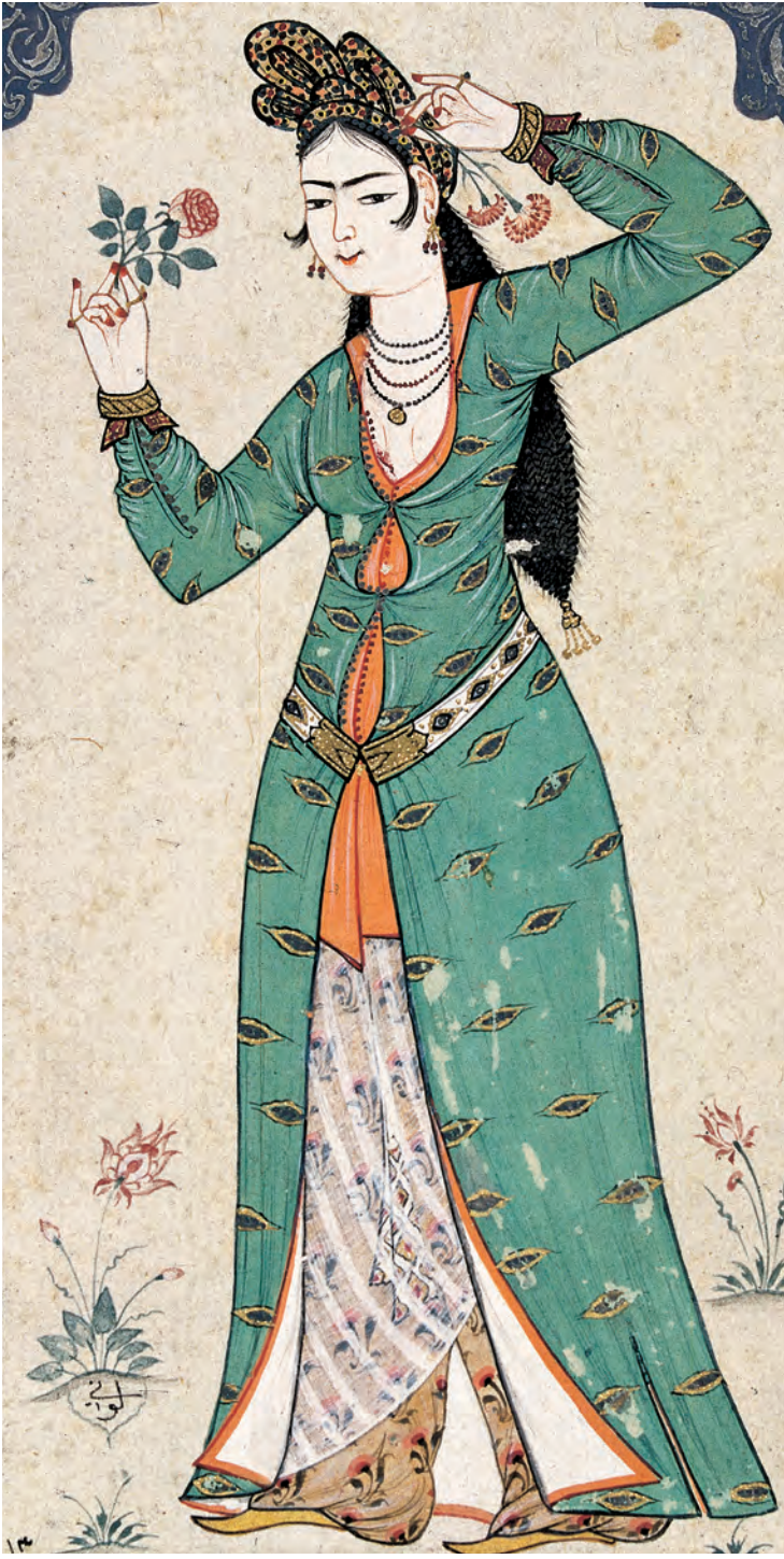
10- Kadın kıyafeti (Levnî, Albüm)

Geleneksel kıyafet tarzının bir uzantısı olarak, İstanbul'da kadın erkek kıyafeti genelde ana hatlarıyla aynı olup fark kullanılan aksesuar, kesim şekli ve başlıktadır. İstanbul'da yaşayan kadınların yüzyıllar boyunca küçük değişikliklerle devam edegelen giyim kuşamının en önemli öğeleri şalvar , çakşır , bürüncük gömlek , entari/dolama , hırka , kaftan ve gömlek , kaftan , kürk , dışarıda ferace ve yaşmak tır.