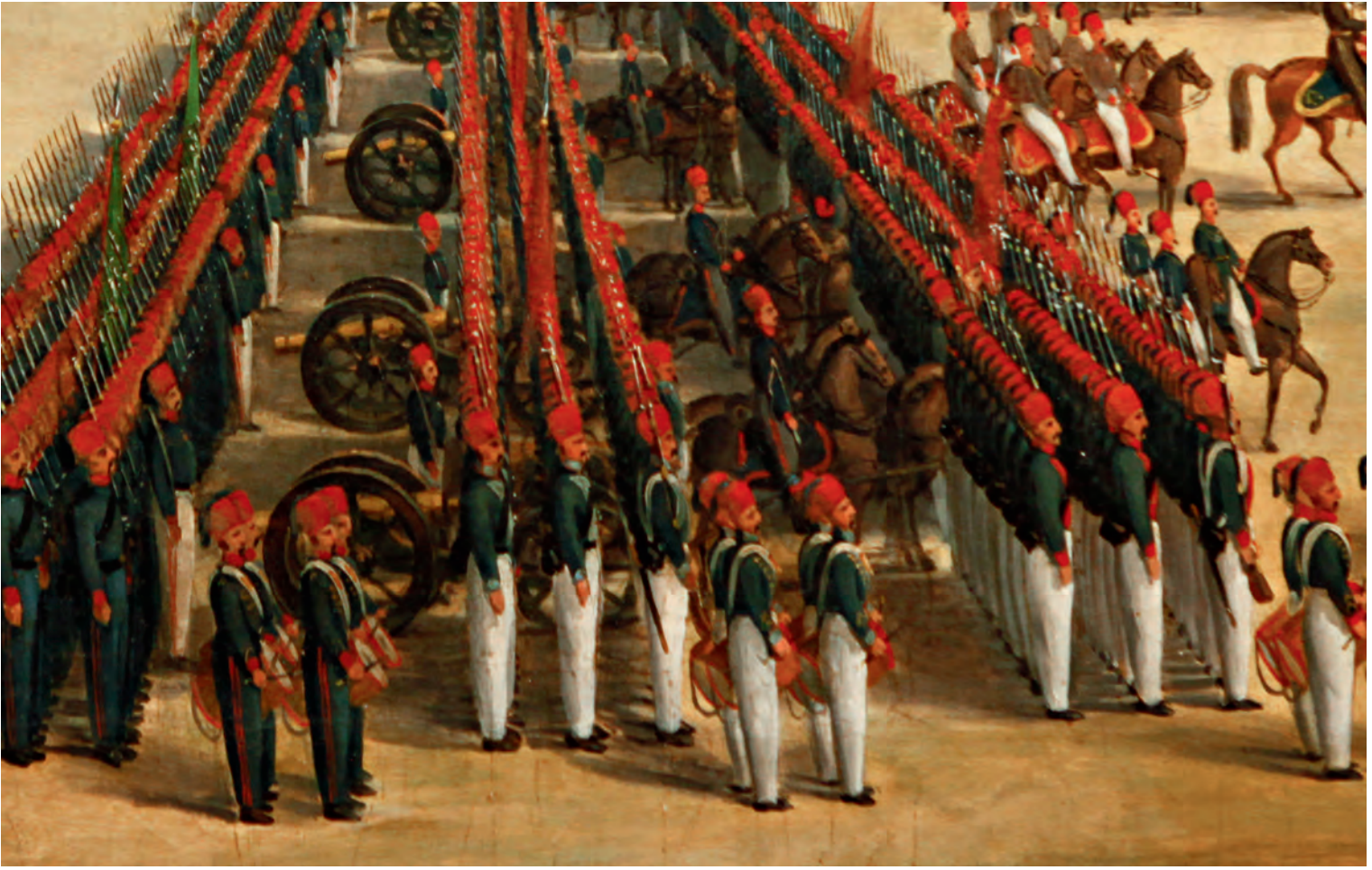
27- Yeni kıyafetleri içinde Asakir-i Mansure askerleri (MSA, nr. 11/1482)

İmparatorluk başkentinde değişim, diğer yerlere kıyasla daha erken gerçekleşir. Gelenekselden Avrupai tarzda kıyafete geçiş, XIX. yüzyılın son çeyreğine doğru hızlanır. 1875 sonrası ise tamamen Batılı karakter kazanarak geleneksel çizgiden kopuş gerçekleşir. Edmondo de Amicis 1870 tarihinde İstanbul'a geldiğinde feracenin genelde Paris modasına göre dikilmiş elbise üzerine giyildiğini yazar. 84