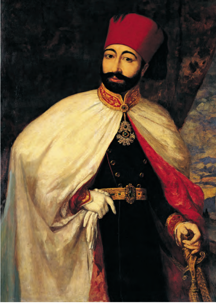
26- Batılı kıyafetleri içinde II. Mahmud (TSM, nr. 17/36)

Nizam sonrası Sultan Abdülmecid döneminde ihtarlar farklı şekillerde devam eder. Memur ve hademenin memuriyetine ve gördükleri işe göre giyinmesine ve askeriyeye benzememelerine vurgu yapılır. 77 1861 senesinde Beyoğlu ve Galata'da İslam milletine yakışmayacak kılık ve kıyafette dolaşanların men edilmesi talep edilmiştir. 78