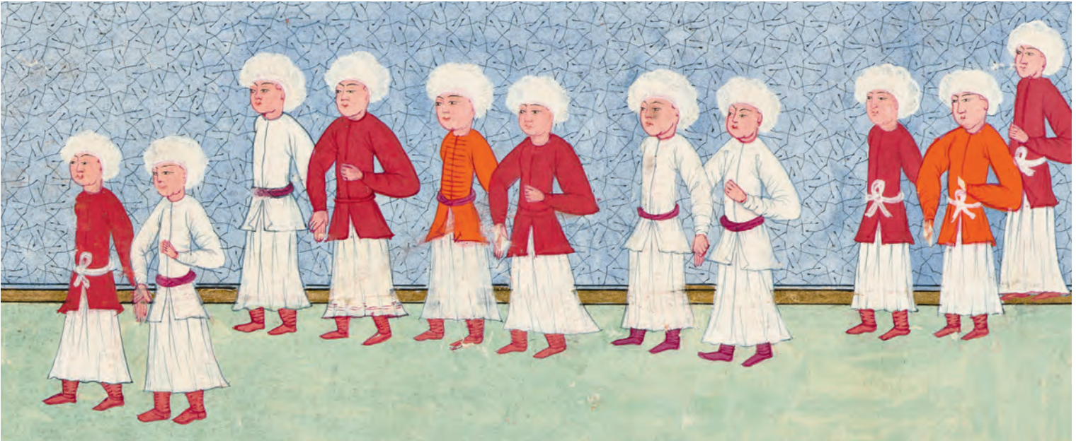
1- Sarıkcı esnafı (İntizâmî)

İmparatorlukta her alanda olduğu gibi, giyim kuşam alanında da XVI. yüzyılda en yüksek düzeyine ulaşılmış, Sultan Süleyman zamanında, Kanun-ı Teşrifât geliştirilmiştir. 5 Devletin gelişip zenginleşmesiyle kılık kıyafet, devletin himayesinde yaşayan her bir unsuru diğerlerinden ayıracak derecede çeşitlilik göstermiştir. 6 Padişaktan hademeye dek asker, sivil, ilmiye ve her sınıftan görevlilerin Divan-ı hümayun toplantıları, sefer, mevlit, bayram, diğer merasimler ve muhtelif vesilelerle rütbe ve mesleklerine göre giymesi gereken kıyafet ve başlıklar bellidir. 7