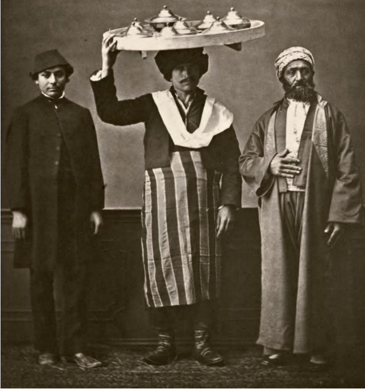
28- Eski kıyafetleri içinde bir İstanbullu (sağda), ayvaz (ortada) ve yeni kıyafetlerle bir genç (solda)

yerel dinamikler ile yabancı öğelerin birleşiminin örneğidir.