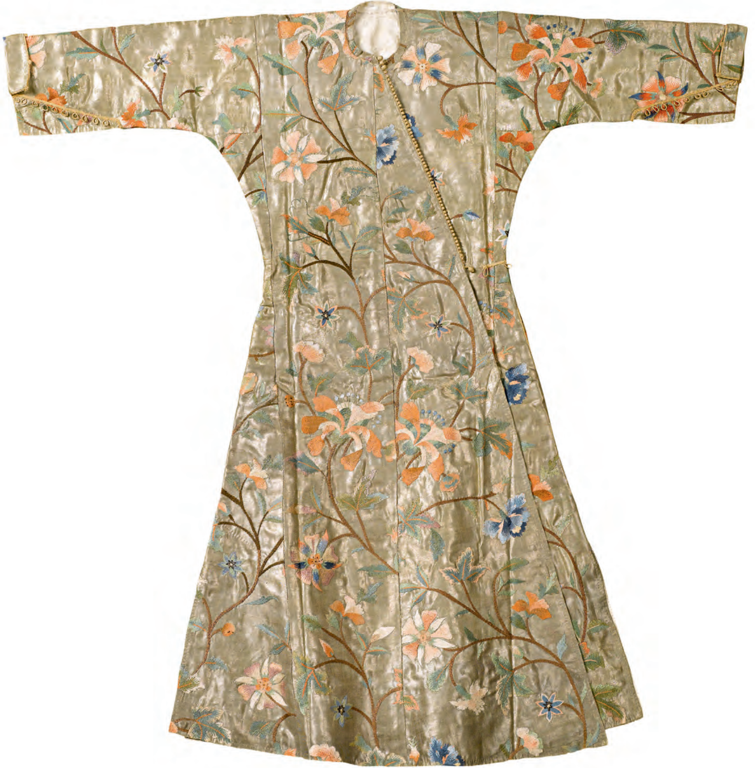
5- Osmanlı entarisi (TSM, nr. 13/804)