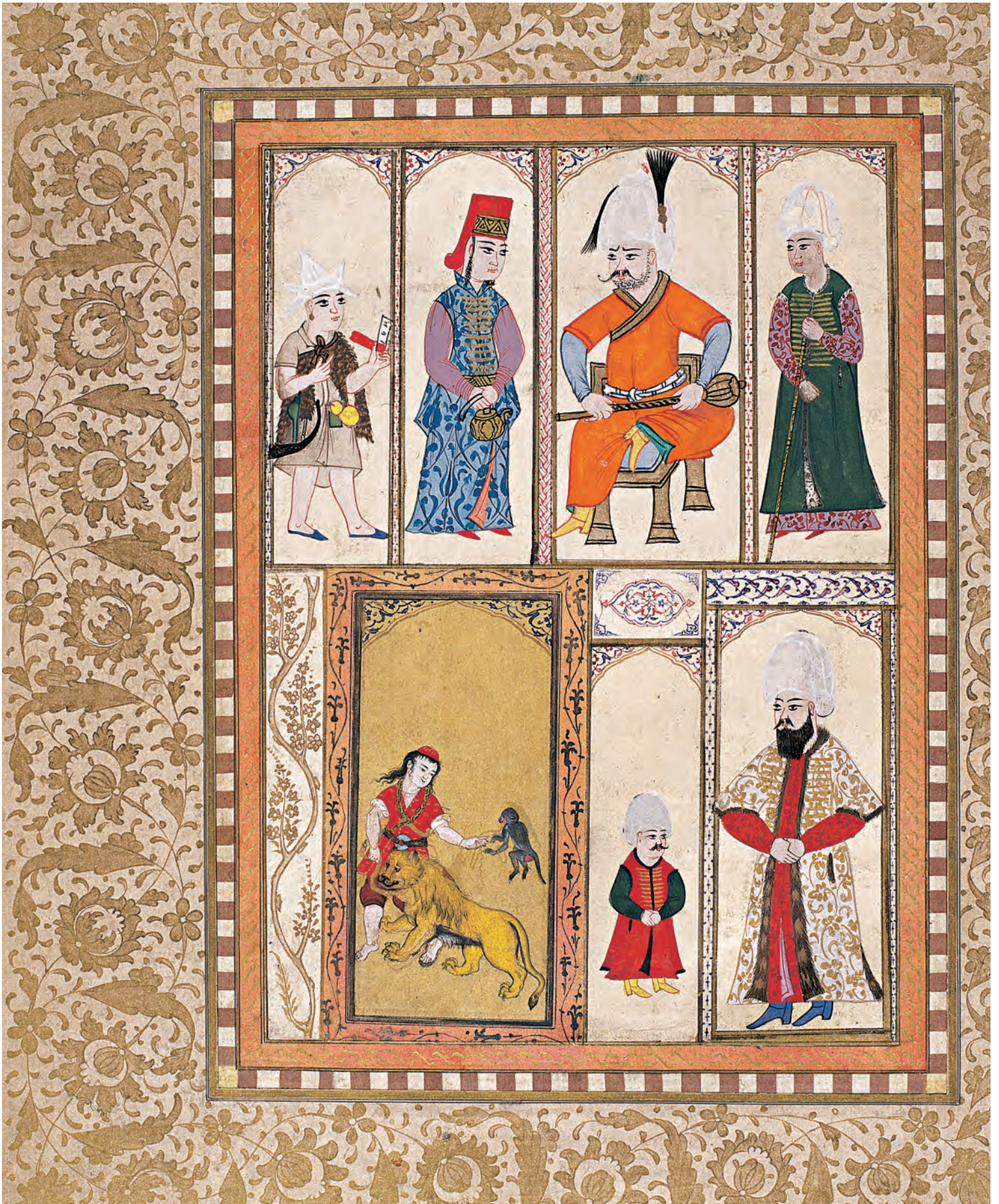
7- İstanbul'da farklı toplumsal kesimlerin kıyafetleri (TSMK, nr. B.408)