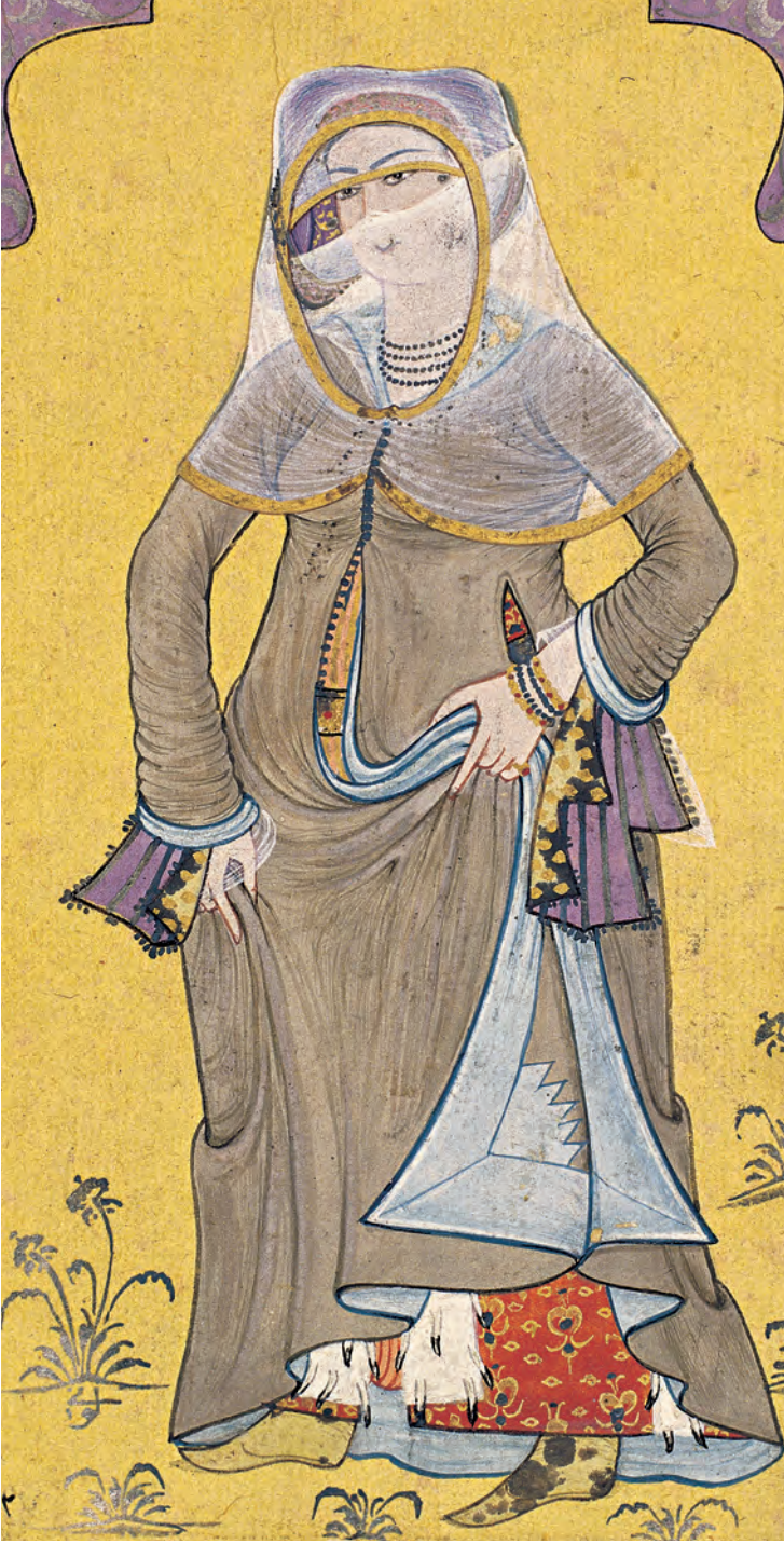
11- Günlük kıyafetleri içinde bir kadın (Levnî, Albüm)

Sokak giysisi olarak ise ferace , yaşmak ve peçe kullanılırdı. Yaşmağın bir bölümü gözler dışında yüzü kapatırken, diğer kısmı başı örterdi. Yabancı görsel kaynaklarda görülen feraceli, yaşmaklı ve kimisi peçeli kadınlar ile Şehnâme-i Selim , Surnâme-i Hümayun ve Hünernâme 'de görülenler birbirine benzemektedir.