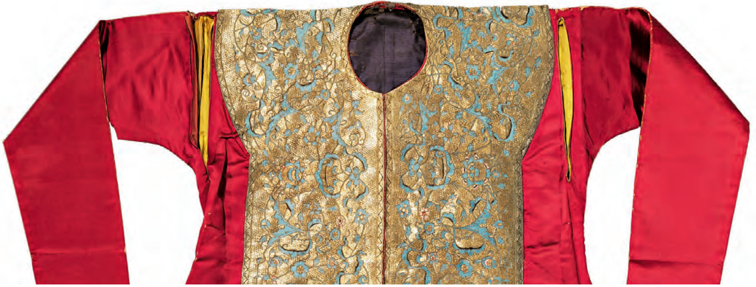
23- Şehzade kaftanı, (TSM, nr. 13/1015)