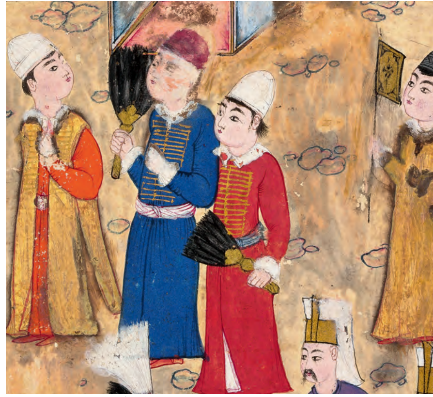
4- Kadın-erkek Hristiyanlar (İntizâmî)

bir varıllık/yoksulluk algısı getiriyordu. Amaçlanan Osmanlı tebaasına bol miktarda malı, özellikle temel gereksinimleri satın alınabilir fiyatlarla sunmaktı. Ayrıca Osmanlı uygulamaları üzerinde görünürde hâlâ etkisi olan iki gelenek, yani fütüvvet (zanaatkârlara itidali öğreten literatür) ve ihtisap (çarşı-pazar zabıtası muhtesibin yetki