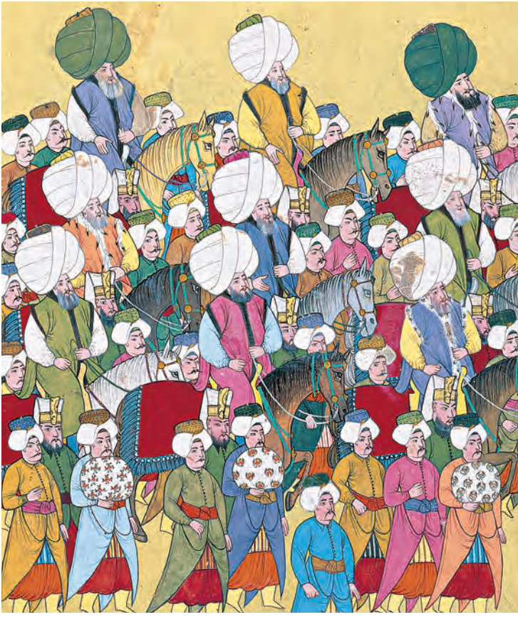
7- Osmanlı ilmiye sınıfı (Vehbî)

esnekliğine doğru gidiş, Kâğıthane'deki Sadabad Kasrı, Haliç boyuna köşklerin inşa edilmesi, bütün bunlar tüketimdeki gözle görülür değişikliğe işaret eder. Deniz kıyılarına inşa edilen köşklerin ( sahilsarayı/sultanefendi sarayları ) yaygınlaşması kadın sultanların siyasi gücündeki artışa delalet eder, zira evlerinin idaresini kocalarından ziyade kadınlar ellerinde tutuyorlardı. 21