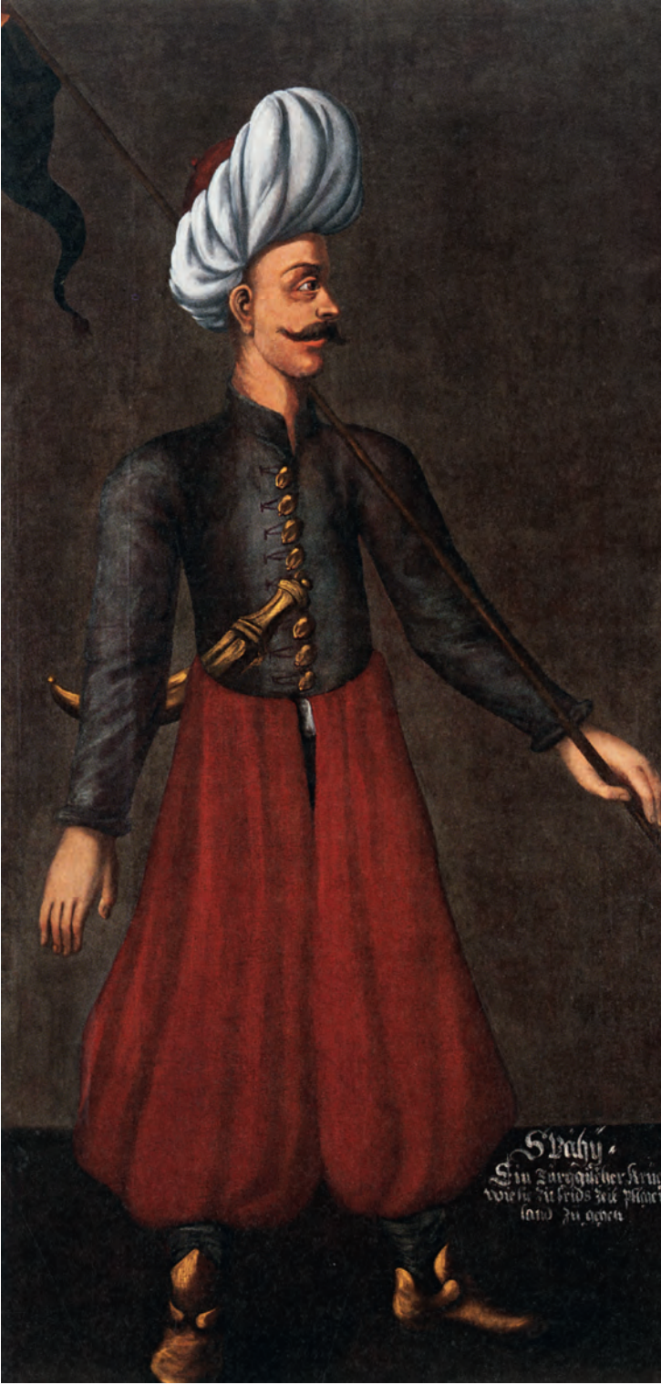
10- Sipahi (Hörmann-Gemminge, Doha, Orientalist Müzesi)

ancak daha geniş bir resmin parçası olarak görülebilir. Bu tablo askerleri, devlet şenlik ve ziyafetlerine gıda maddeleri teminini ve İstanbul'un iâşesi için gıda fiyatlarının denetlenmesini de içine alır. 51