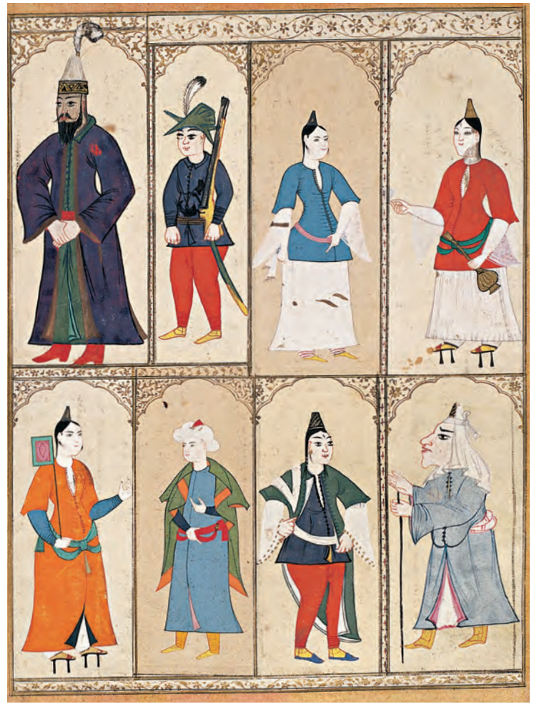
5- İstanbullu erkekler ve kadınlar (I. Ahmed Albümü, TSMK, nr. B. 408)

verir. Evliya, dilencileri de unutmuyarak, çeşitli meslek, mansıp, soy sop, din ve mezhepten kimselerin (iddiasına göre sadece kendilerine hizmet eden) hamamlara sıklıkla gittiklerini anlatır. ( Araplara Tahte'l-kal'a Hamamı; müftilere Müfti Hamamı; taşçılara Silivrikapısı Hamamı; Yahudilere Çifdıkapısı Hammamı; dilencilere İstinye Hamamı... ). 15