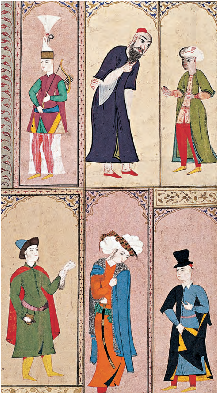
11- İstanbullu müslim ve gayri müslimler (I. Ahmed Albümü, TSMK, nr. B. 408)

bu okulu kurdu. Darüşşafaka kız ve erkek Müslüman çocuklara eğitim veriyordu. 37