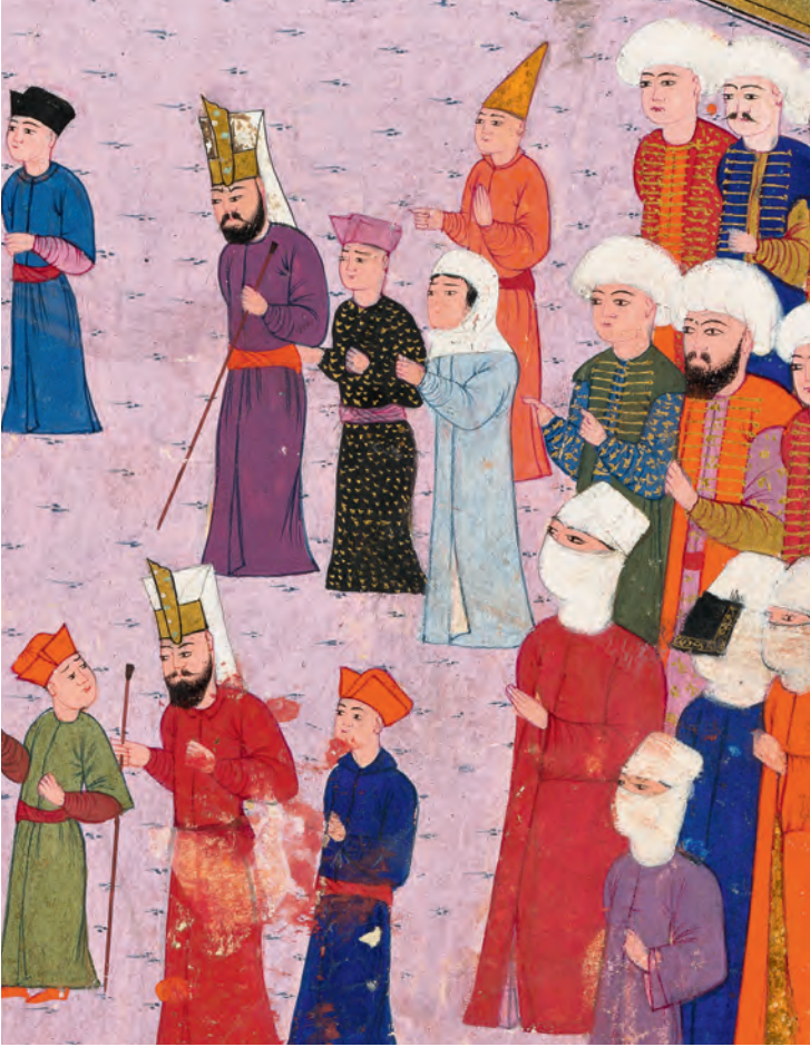
3- İstanbul kadınları (İntizâmî)

bir varıllık/yoksulluk algısı getiriyordu. Amaçlanan Osmanlı tebaasına bol miktarda malı, özellikle temel gereksinimleri satın alınabilir fiyatlarla sunmaktı. Ayrıca Osmanlı uygulamaları üzerinde görünürde hâlâ etkisi olan iki gelenek, yani fütüvvet (zanaatkârlara itidali öğreten literatür) ve ihtisap (çarşı-pazar zabıtası muhtesibin yetki