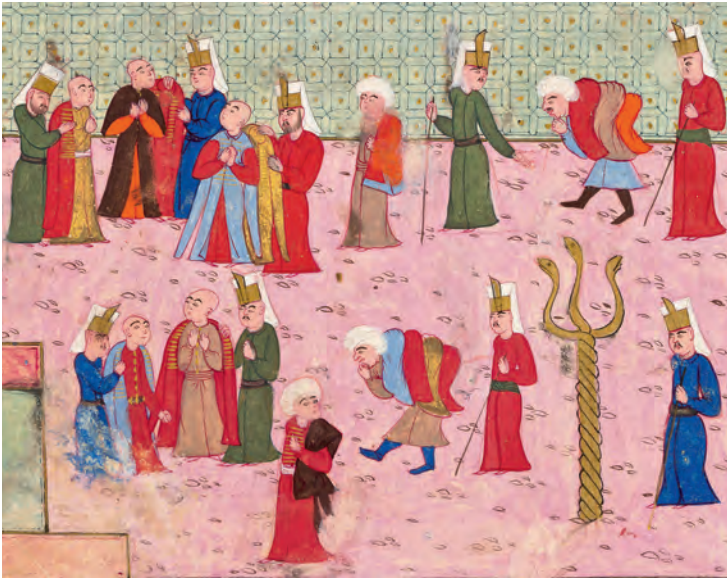
2- Halka kıyafet ihsanı (İntizâmî)