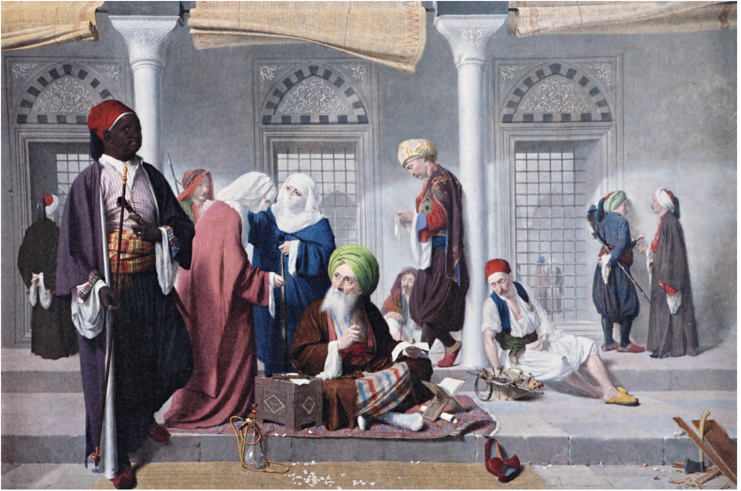
6- Cami avlusunda arzuhalci ve İstanbul sakinleri (Walter Gold, Doha, Orientalist Müzesi)

kalıplarının ne zaman değiştiği konusunda bir mutabakat olmamakla beraber, ilk kapsamlı değişimin XVII. yüzyılda kahve ve tütün tüketimiyle başladığı; XVIII. yüzyılda ithal Hint dokumaları ve artan yerli imalatla genişlemenin sürdüğü ve nihayet XIX. yüzyılda Avrupa kaynaklı ithal mallarındaki muazzam artış ve yerli sanayi üretiminin sürmesiyle daha da geliştiği belirtilir. 17