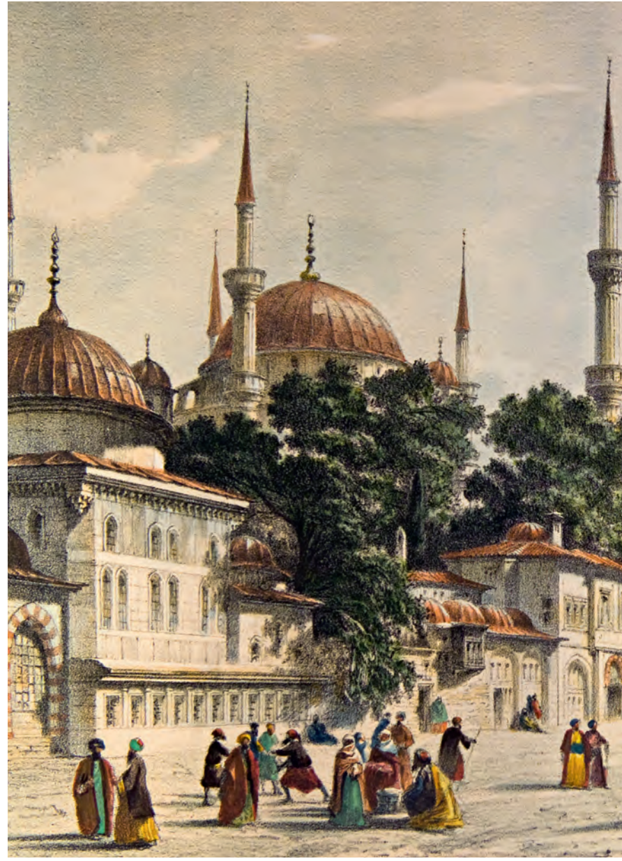
12- İstanbulluların en önemli buluşma mekânı: Sultanahmet Meydanı (Flandin)

barınak ve sağlık hizmetleri sağlama amacıyla, dilencilik yasağını (1896) takiben kuruldu. Kurumun yardımları etnik ve dinî ayrım gözetmeksizin erkek, kadın ve çocukları kapsıyordu. 39