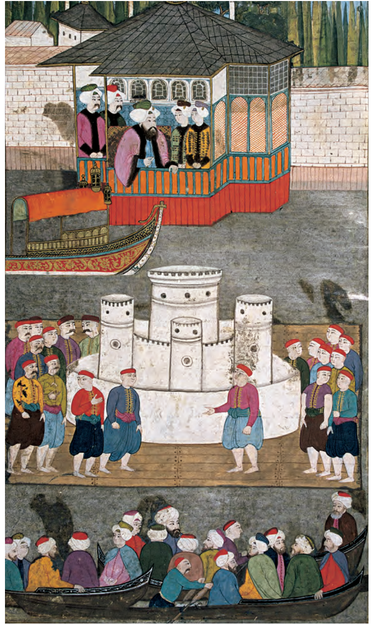
8- 1720 şenliğinde III. Ahmed, devlet ricali ve halk gösterileri izliyor ( Sûrnâme-i Vehbî , TSM, nr. 3594).

Bu dönemde mütevazı kesimlerin tüketim kalıpları Eyüp semtinin mahkeme kayıtlarına dayalı olarak tetkik edilmiştir. Mahkeme kayıtlarına göre, köylerdeki en varlıklı kesim, ticaretin çeşitli alanlarıyla uğraşan ve vergi muafiyetinden faydalanan yeniçerilerdi. 24 Eyüp'ün mütevazı köylüleri öldüklerinde geride bıraktıkları inekler, öküzler, atlar, arı kovanları, tavuk kümesleri ve topraktı.