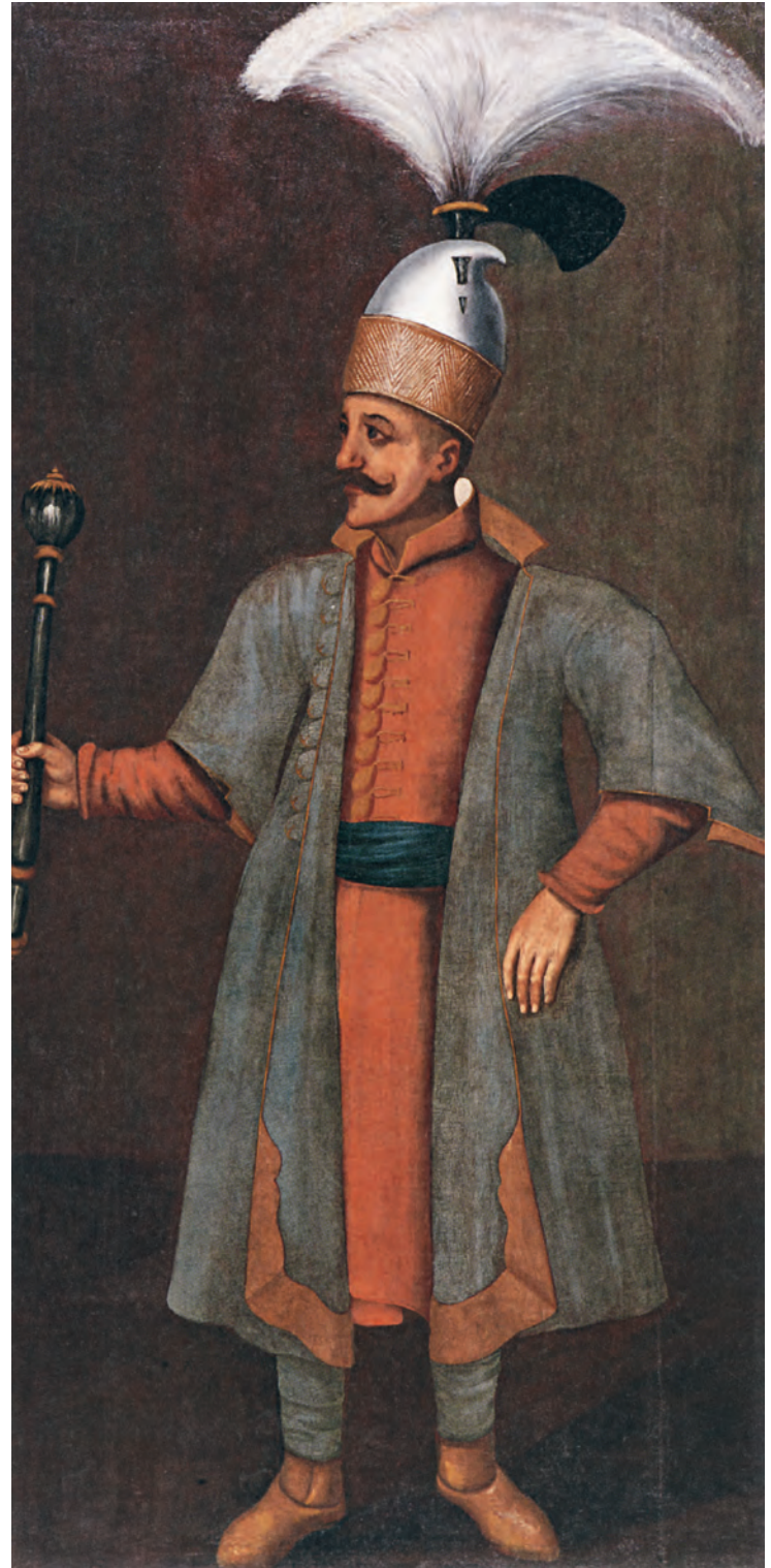
9- Yeniçeri zabıtlarından süpürge sorguçlu çorbacı (Hörmann-Gemminge, Doha, Orientalist Müzesi)

Yakın zamanlarda yapılan araştırmalar Osmanlı coğrafyasında yemek dağıtımının şartlarını ve anlamını açıklığa kavuşturdu. Bu çerçevede, insanlar sadece sosyoekonomik durumları nedeniyle değil, aynı zamanda kurumsal bağlantıları (dinî okullarda öğrenci olmaları veya yardım kuruluşlarında çalışmaları) sayesinde ya da gelip geçen yolcular olarak imaretlerde yemek yeme hakkına sahip oluyorlardı. Yardım, "hayırsever ile yardımdan faydalanan kimse arasındaki hamî-korunan ilişkisi"nde olduğu gibi, hatta bu sonuncusu yoksul veya muhtaç olmasa bile, modern ödenti anlayışı çerçevesi içinde veriliyordu. 29 Aynı zamanda aşevlerinin "muâşeret