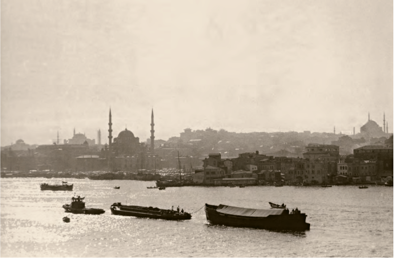
2- Haliç'ten Suriçi İstanbulu'nun bir kısmının görünümü

1961 senesinin 21 Kasım'ında orada vefat etti, gasledildi, oradan Edirnekapı'ya uğurladık. O zaman on dokuz yaşındaydım. Bu çizgi içerisinde ilk hatırladığım Beyazıt ile ilgili havuz ve güvercinler. Yokuştan yukarı çıkardık. O zaman tabii daha Menderes'in eli İstanbul'a değmemiştii. Yokuşun, yani Mithatpaşa Caddesi'nin veya sokağının üzerinde, yokuşun başında bir bahçe vardı. Orada yol biraz daralırdı ve köşede beyaz kıyafetli bir koz helvacısı dururdu. Annem pek almazdı, "Pistir onlar kirlidir, yenmez." derdi. Ama teyzem fark ettirmeden alırdı. Ben bakardım kim alacak bana koz helva diye. Beyazıt Meydanı'na çıkardık. O zaman o meydanda fotoğrafçılar var şipşak. Hâlâ öyle resimlerimiz var. Kısa pantolonlu, biraz tombulca bir ev çocuğu, sokağa çıkmasına izin verilmeyen... Beş-altı yaşlarındayım, daha mektebe gitmiyorum. Güvercinlere yem atardık. Tabii camiyi hatırlıyorum, üniversitenin büyük kapısını hatırlıyorum. Beyazıt havuzunu çok iyi hatırlıyorum. İki tane gezmemiz vardı. İkisi de tramvayla Beyazıt Meydanı'ndan başlardı. Birincisi Atikalî'ye anneanneme giderdik. Babam sabahları öğretmenlik yaptığı Vefa Lisesi'ne giderdi.