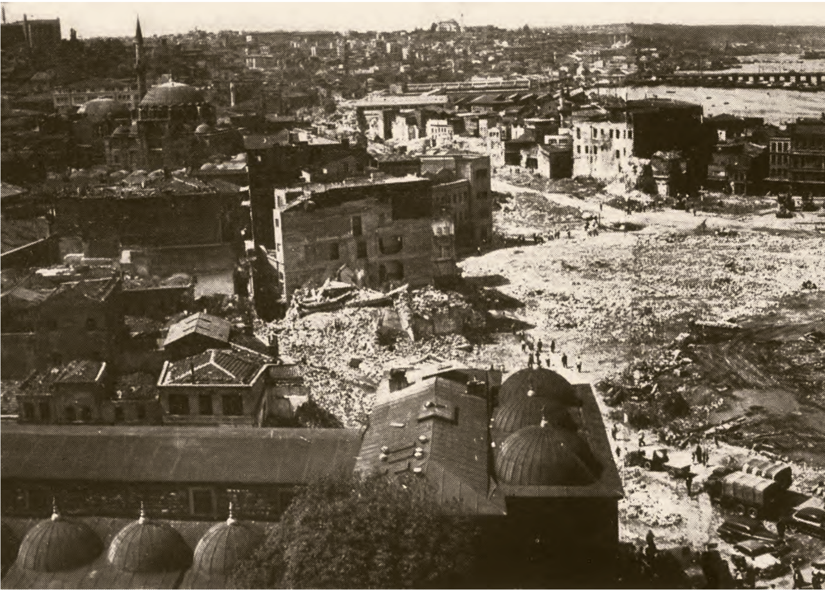
4- Demokrat Parti döneminde Eminönü Meydanı'na da el atılmıştı. Fotoğraf Haliç kıyısındaki Balık Pazarı ortadan kaldırıldıktan hemen sonra çekilmiştir. Bir süre sonra Eminönü ile Unkapanı arasındaki caddenin inşasına başlanacaktır ( İstanbul'un Kitabı )

anlaşıyor. Fakat anladığım kadarıyla Atikali'de tipik Osmanlı peyzajı devam ediyor. Biraz tarif ettiniz. Biraz daha ayrıntı verebilir misiniz Atikali ve çevresini?