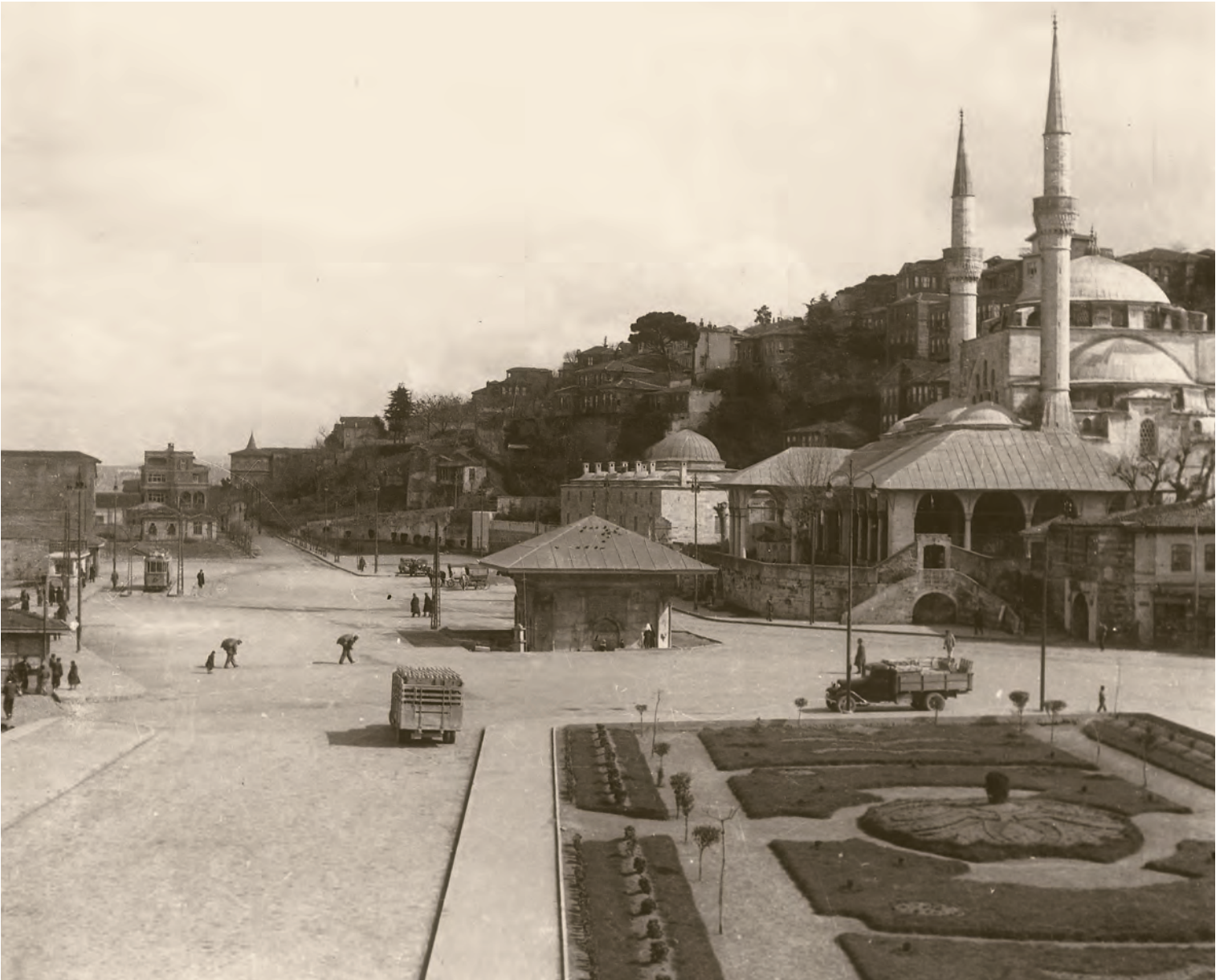
15- Üsküdar Meydanı, Mihrimah Sultan Külliyesi ve III. Ahmet Çeşmesi