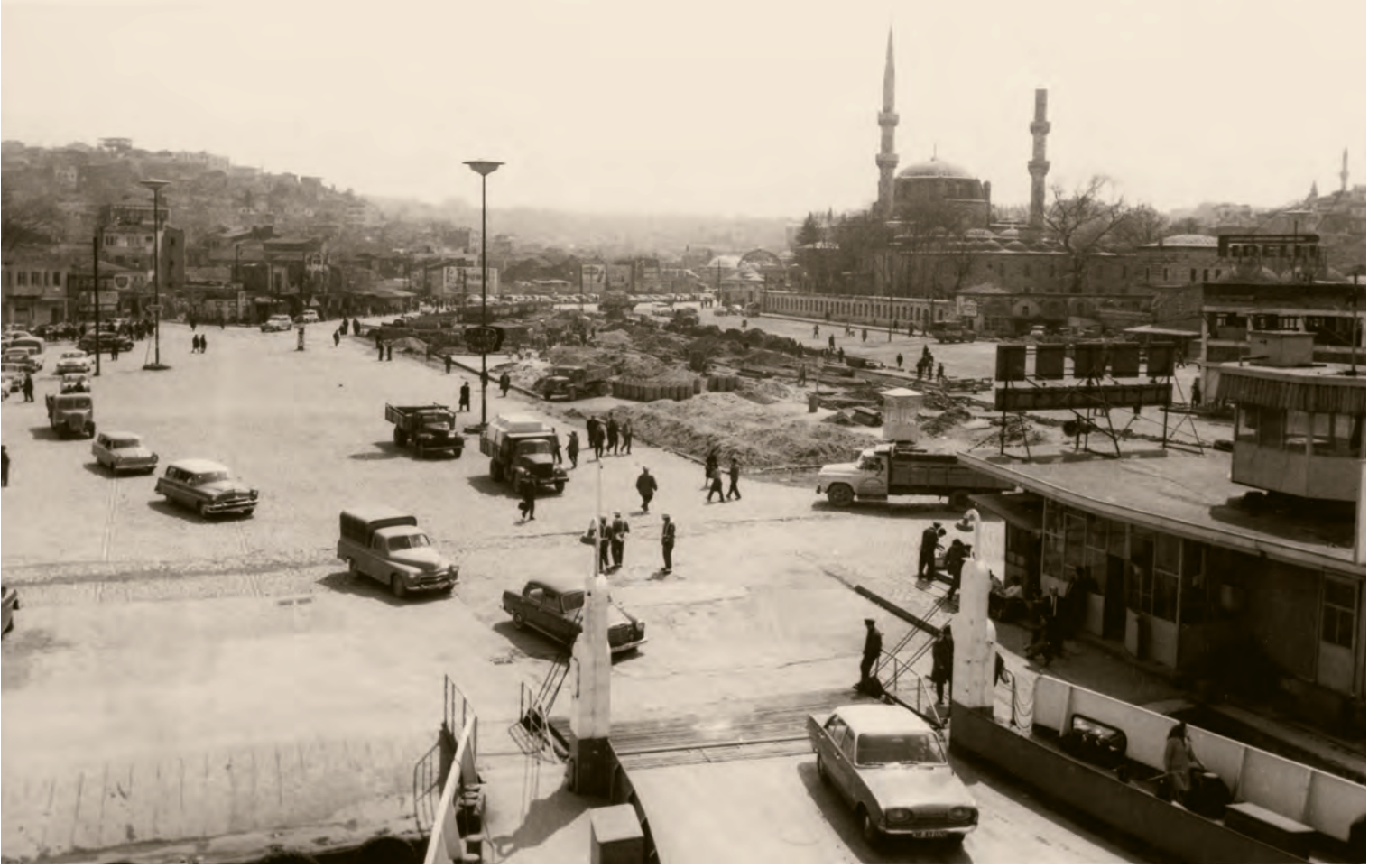
16- 1950'lerde Üsküdar İskelesi ve Meydanı. Sağ tarafta Gülnuş Emetullah Sultan Camii, sağ minaresinin külahı kırılmış. Bitişğinde Gülnuş Emetullah Sultan'ın üstü açık, yağmur suyu alan türbesi