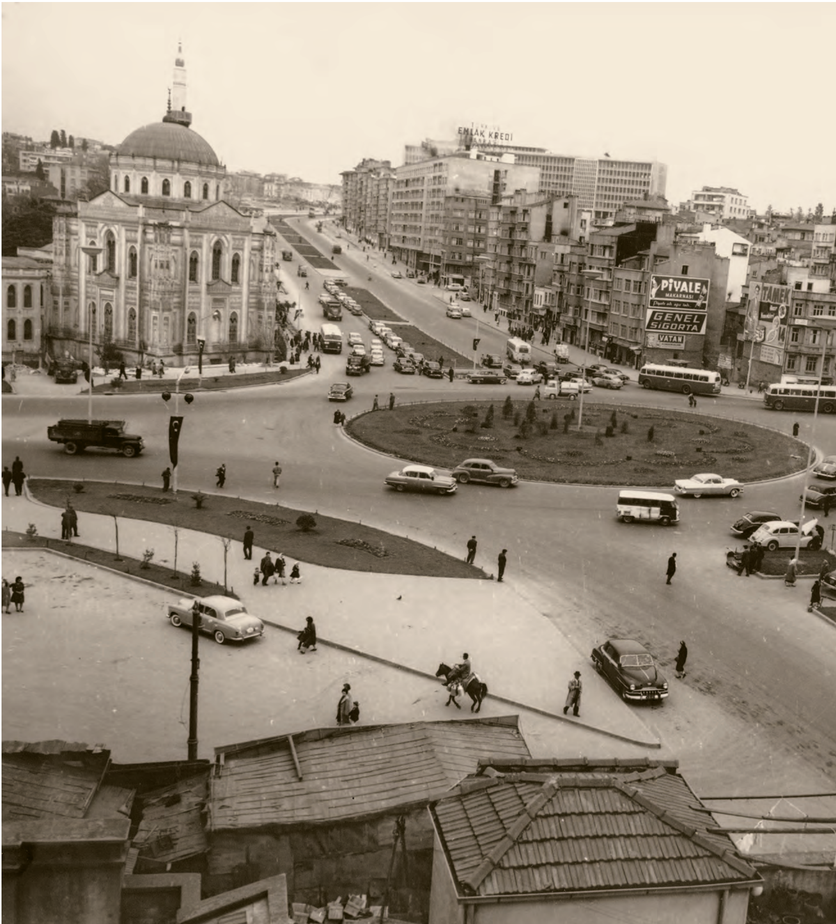
11- Aksaray'dan Saraçhane'ye... Aksaray Meydanı bir üst geçitle henüz işlevsiz hâle getirilmemiş