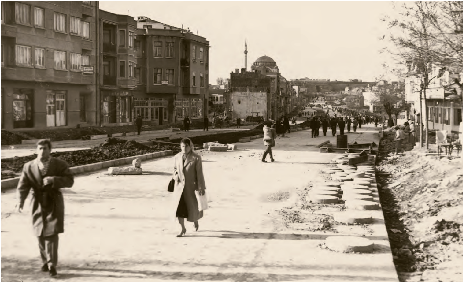
12- Fatih-Edirnekapi Bulvarı'nda 1950'lerde imar faaliyetleri