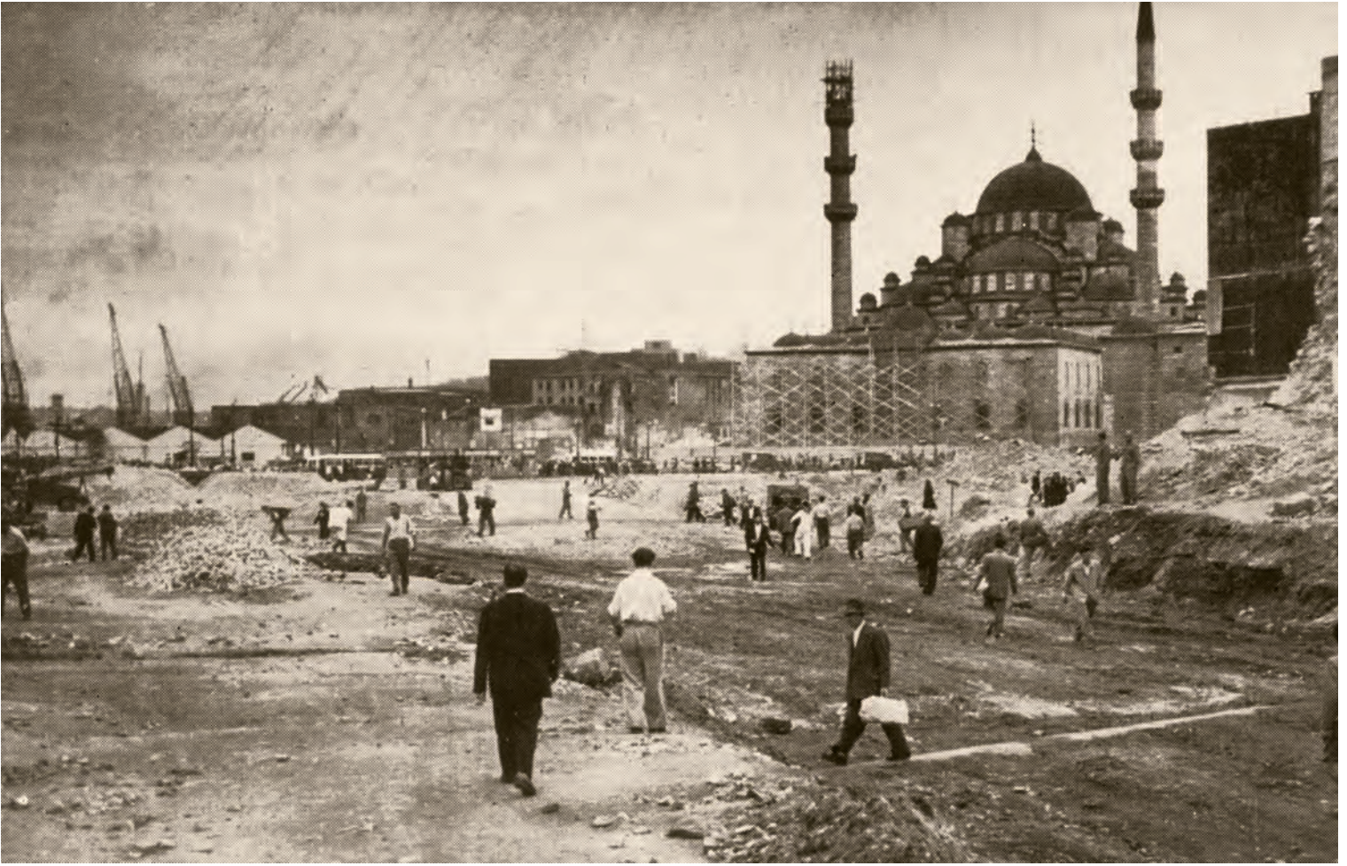
8- Eminönü-Unkapanı yolunun Balık Pazarı ortadan kaldırıldıktan sonraki görünüşü. Öndeki boş alanı, eski İstanbul'un renkli köşelerinden biri olan Balık Pazarı işgal ediyordu ( İstanbul'un Kitabı )