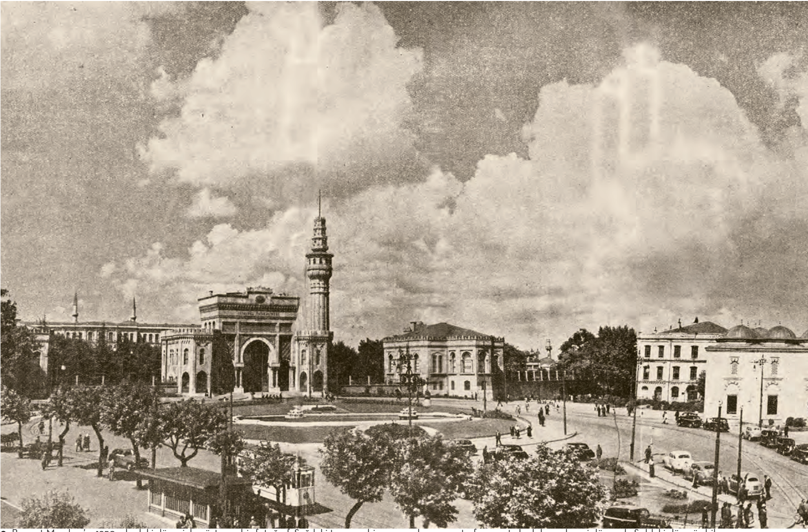
9- Beyazıt Meydanı'nı 1950 yılındaki düzeniyle gösteren bir fotoğraf. Sağdaki tramvay biraz sonra havuzun etrafını gıcırtyla dolaşarak geri dönecek. Soldaki dönmüş bile. Sağdaki ağaçlıklı bölgeye giren yola saparsanız Küllük Kahvesi'ne ve Emin Efendi Lokantası'na ulaşacaksınız ( Turistik İstanbul Rehberi , İstanbul 1950)

yapıyoruz? Beyazıt Meydanı'nda daha sonra da devam etti bu hareketler. Bir akşam evde oturuyoruz mayısın ortaları, aşağıda, mahallede olağanüstü bir gürültü. Babam dedi ki lambaları söndürün, açın pencereden bakın. Bizim evden dört yol ağzı gözükiyordu. Baktık tanklar inmiş bizim mahalleye. “Baba,” dedim, “tanklar inmiş!” Babam, “Bunlar kışladan çıkmışlarsa netice almadan girmezler!” dedi. 31 Mart'ı, Mahmud Şevket Paşa hadisesini yaşamış. Anlatıyor tabii bunları, ben parça parça birleştiriyorum. Boğazlıyan Kaymakamı Kemal Bey'in Beyazıt'ta asılışını görmüş.