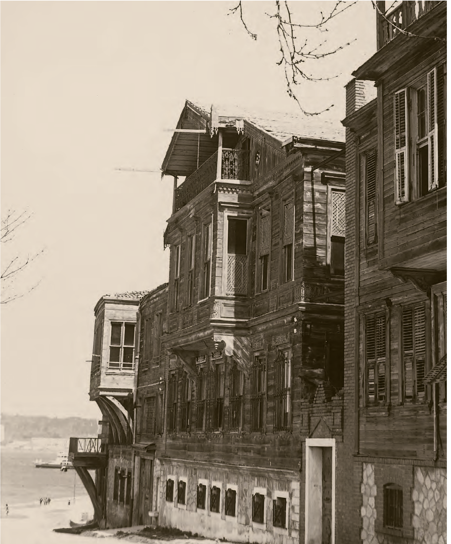
6- 1950'lerin İstanbul'unda ahşap konaklar