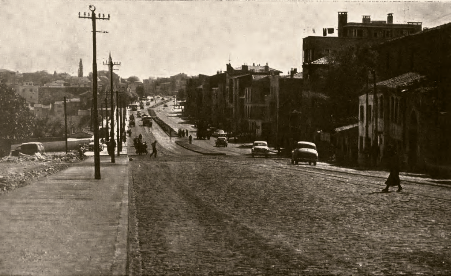
13- Edirnekapı-Beyazıt yolu, Edirnekapı'dan başlayıp otuz metre genişlikte, ortası refüjlü bir cadde hâlinde, Fatih Külliyesi'ne, oradan devam ederek Saraçhane ve Şehzadebaşı'ndan Beyazıt'a ulaşıyordu ( İstanbul'un Kitabı )

büyük lüfer çıkmaya başlar. Tekneniz varsa yemli lüfer yaparsınız. Ben -o zaman tekne yoktu- sahilden istavrit, izmarit avlardım. İsterdik ki mektepler açılmasın da biraz daha kalalım. Sonra tekkeye intisap edince Safer Efendi hepsini yasakladı.