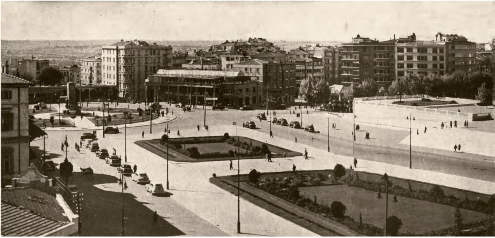
10- Topçu Kışlası yıkılıp yerine İnönü Gezisi yapıldıktan sonra Taksim Meydanı (Cumhuriyet Devrinde İstanbul)