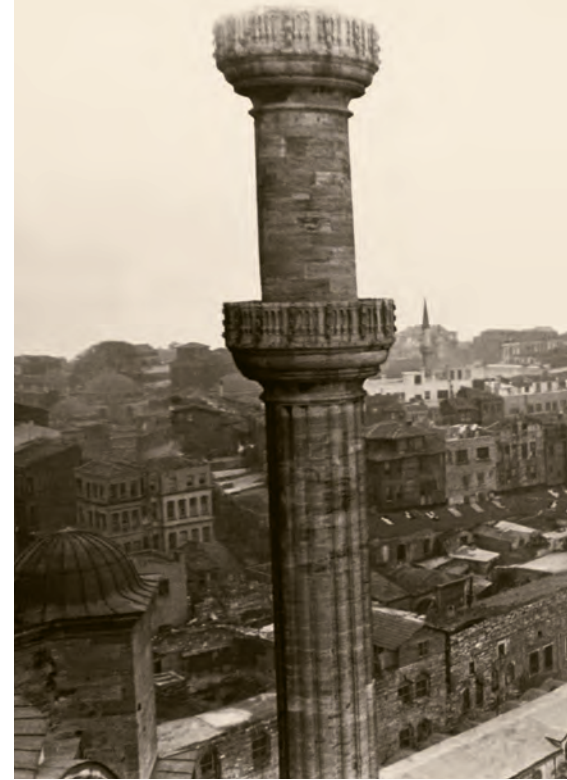
3- Nuruosmaniye'den İstanbul'un panoramik görünümü