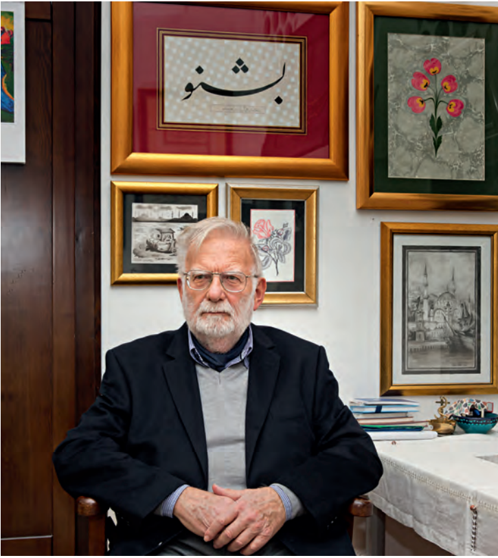
7- Saadettin Ökten