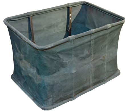
9- 1826-1874 dönemine ait bez sarıncık (İBB İtfaiye Müzesi)