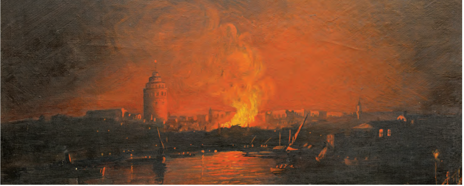
1- 1935'teki Galata yangınına tasvir eden resim (İBB İtfaiye Müzesi)

Osmanlı İstanbul'unda hemen her yüzyılda onlarca yangın meydana geldiği gibi, bunlardan birkaçı şehri baştan başa harabeye çeviren ve ihrâk-ı azîm , harîk-i kebîr , harîk-i ekber şeklinde adlandırılan büyük yangınlardır. Nitekim tüm kapı eşiklerinin altınla dolmasını engelleyen unsurun yangınlar olduğunu ifade eden deyim, İstanbul'un yangınla imtihanını özetler mahiyettedir. Selânikî'nin 1563-1600 yılları arasındaki otuz yedi yıllık bir süre içerisinde kaydetmiş olduğu yangın sayısının on yedi olması ise, yukarıdaki veciz ifadeyi örneklemektedir. 5