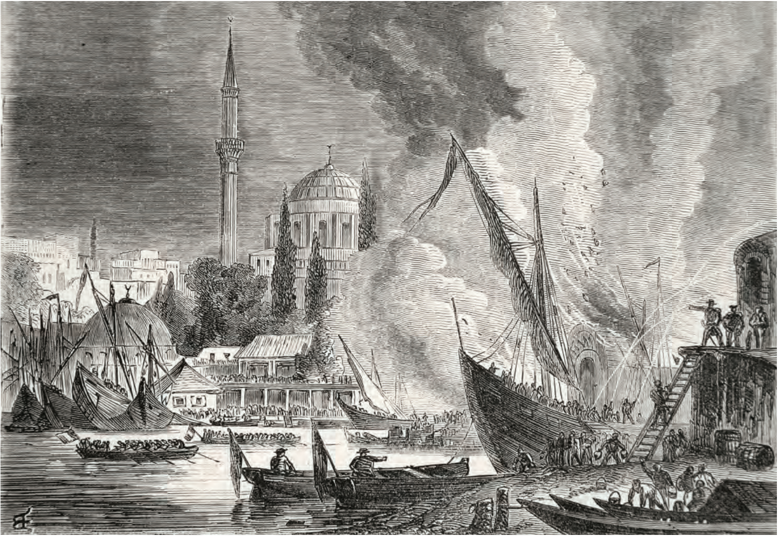
6- 1858'deki İstanbul yangını ve söndürme çalışmaları (Illustration)

evlere ulaşmış, şiddetli rüzgâr sebebiyle suriçine sirayet etmiş ve buradaki bazı evler yanmıştır. Çarşamba'da bulunan Fethiye Camii'ni de küle çeviren bu yangın Fenerkapı, Yavuz Selim, Çukurbostan ve Fatih'e kadar uzandıktan sonra öğle vaktinde sönmüştür. 43 Aynı tarihte Galata İskelesi'nden başlayan yangından etkilenen bir geminin barutuna ateş değmesiyle meydana gelen patlama neticesinde Sadrazam Kemankeş Kara Mustafa Paşa'nın yüzü yanmış ve bu durum paşanın devlet işlerinden üç ay boyunca uzak kalmasına sebebiyet vermiştir. 44