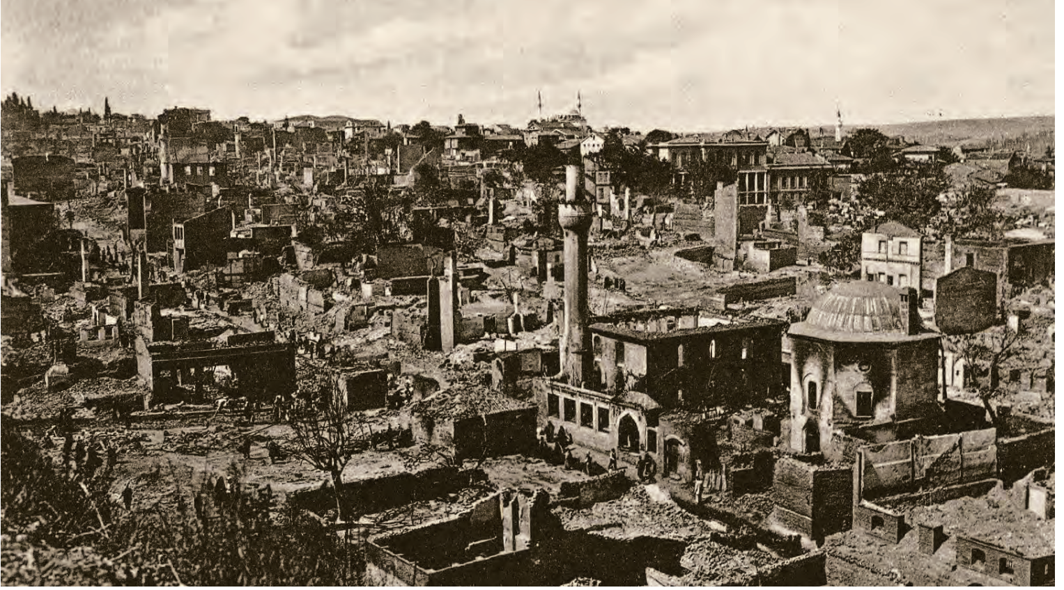
11- 1908 yangını sonrası şehrin görünümü

7 Mayıs 1696'da Galata'da çıkan bir yangında St. Benoit Kilisesi yanmıştır. 74 Ayrıca, bu yangında Fransızlara ait Capuchin ve Cizvit kiliseleri zarar görmüş ve Fransız elçisinin padişaha sunduğu bir arz üzerine söz konusu kiliseler için tamir izni verilmiştir. 75 Kemankeş Kara Mustafa Paşa Camii de bu yangında kül olan diğer yerler arasındadır. 76