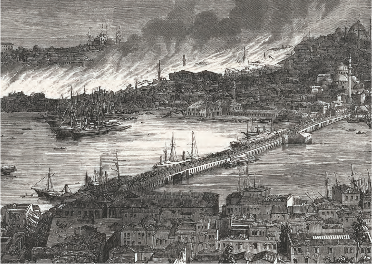
7- 1865 Hoca paşa yangını ve yayılma alanı (l'illustration)

Sultan yaşadığı korkudan dolayı ertesi gün vefat etmiştir. 63