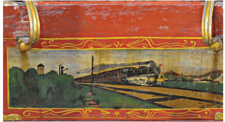
8a-b-c-d-e 1826-1874 dönemine ait yangın söndürmede kullanılan mahalle tulumbaları (İBB İtfaiye Müzesi)