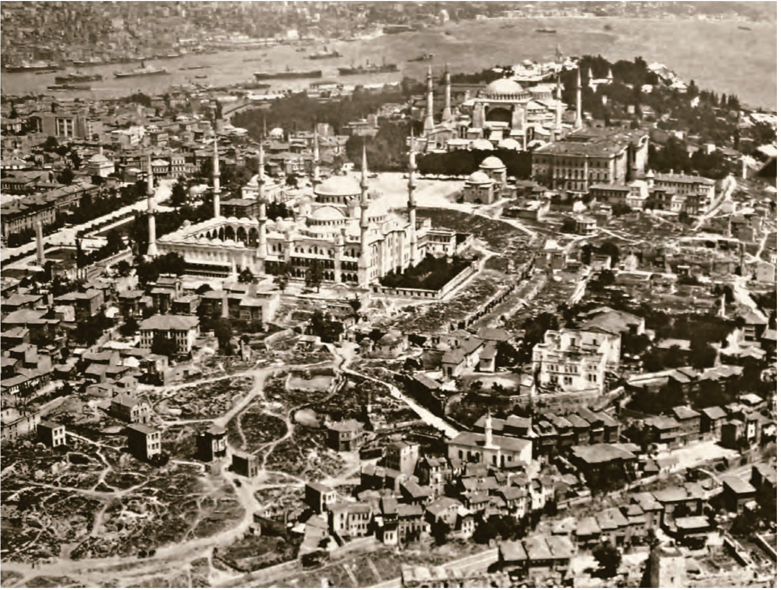
12- Sultanahmet ve çevresinin XX. yüzyıl başlarında bir yangın sonrası görünümü

Nitekim tulumba sonrası dönemde İstanbul'un muhtelif bölgelerinde çıkan yangınlar şehre büyük zararlar vermeye devam etmiştir. 101 Örneğin, 27 Temmuz 1729'da Balat'ta çıkan yangın şehrin sekizde birini yok etmiştir. 102 1730'da Fındıklı ve Şengül Hamamı civarında, 103 1731'de Galata'da çıkan yangınlar büyük zararlara yol açmıştır. 104 1732 Nisan'ında iki gün arayla Koska ve Molla Gürani'de çıkan yangınlar yine birçok binayı harabeye çevirmiştir. 105