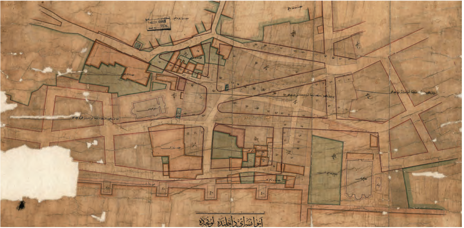
2- Ayvansaray'da 1880'da meydana gelen yangının nereleri etkilediğini gösteren bir harita

Kanunî'nin Edirne'de bulunduğu 5 Şubat 1540'ta gece vakti çıkan yangında Eski Saray tamamen yanmıştır. 12 Bu zamana kadar her kimin evi ya da dükkânında yangın çıkmışsa, dikkatsizliğinin cezası olarak idamı gerekmektedir, sarayın sakini olan padişah için böylesi bir durum söz konusu edilemeyeceğinden bu gelenek son bulmuştur. 13