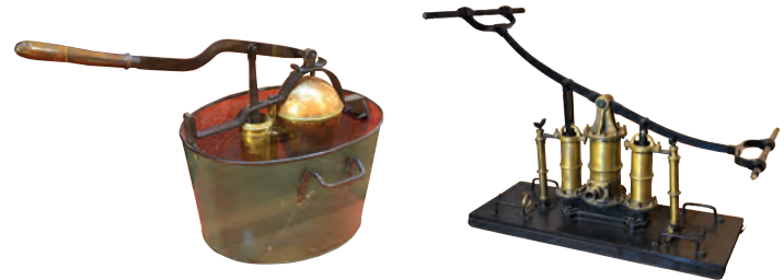
10a-b XIX. yüzyıla ait çardaklı tulumbalar (İBB İtfaiye Müzesi)