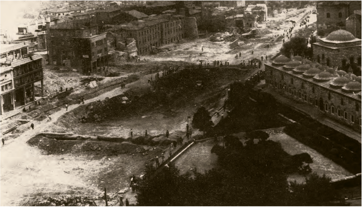
13- Ordu Caddesi, gerekli görülen yıkımlar yapılarak genişletilmiş, tesviyesi ve blokajı tamamlanmış. Kısa bir süre sonra 25 cm. kalınlığında beton zemin dökülecek ve asfaltlanacak ( Istanbul'un Kitabı )

yani 1830'larda. Mareşal Moltke'nin 1830'larda yaptığı haritası, bu aksın açılması birbirini tamamlayan şeyler olduğuna göre bu haritayı ilk imar planı olarak kabul etmek mümkün. İttihatçılar tarafından başlatılan birbirinden kopuk mühendislik projelerinin her biri doğrusu ayrı bir iptidailik ve felakettir. Cumhuriyet'in ilanından sonra önemli bir isim, bir Alman mimarı, Helgöztz... Bir mühendis... Almanya'da o tarihlerde mühendisler ve mimarlar birbirinden ayrı değil. Onun çizdiği bir plan, yine dar alanları ihtiva ediyor. Yer yer yol açma tekliflerini ihtiva ediyor. Liman için bazı düşünceleri var yazılarında. Velhasıl Helgöztz'den sonra, 1930'larda İstanbul'a iki insan davet ediliyor. Prof. H. Prost ve Martin Wagner. Bu iki mimar 1937 senesinde belediyede iki ayrı odada oturuyorlar, bir bakıma yarış içerisindedir. Wagner'in İstanbul'la ve şehir meseleleriyle ilgili çok önemli on-on beş yazısı var. Wagner, o bir sene sonunda İstanbul'da bir şey yapamayacağı kanaatine varıp ayrılıyor, Harvard'a gidiyor, orada bütün XX. asrı etkileyen bir şehir şeması çiziyor. Wagner'in raporları son derece açıklayıcıdır, fakat bizde okuyan çok az oldu. Bu raporlar, Batı Avrupa şehir hukukunda yeni fikirlerin nasıl geliştiğini, İstanbul'un bu bakımdan hangi