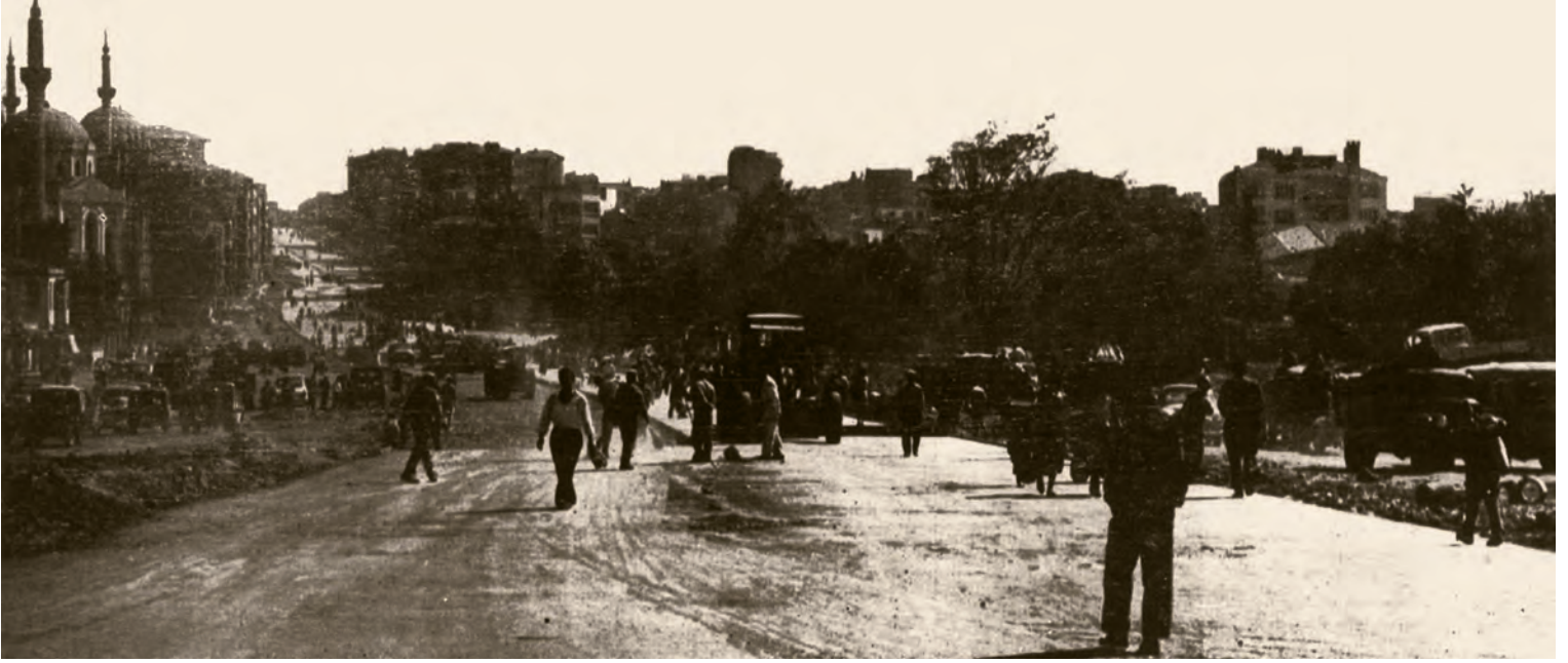
9- Demokrat Parti döneminde açılan Millet Caddesi, Topkapı'dan girdikten sonra Şehremini, Çapa ve Taşkasap'tan geçerek Aksaray Meydanı'na ulaşıyor, oradan Ordu Caddesi'ne bağlanıyordu. Bu caddenin açılışı sırasında çok önemli tarihî eserlerin yanı sıra, semtler ve mahalleler yok olmuştu ( İstanbul'un Kitabı )

bunun beraberinde de kaçınılmaz bir şekilde vakar ifadesi bu yapıların asli psşik özelliklerini, biçim ifadelerini teşkil ediyordu. Sinan ile kalfası Mehmed Ağa arasındaki görüş farklarını biliyoruz. Sultanahmet Camii'nde, bu büyük vakar ve bu büyük huşu hissi yerine bir letafet duygusunun öne çıktığı görülür. Bu bir bakıma cihat misyonunu ön planda tutan bir nesil yerine, zarafetin ve dünyevi bir güzellik yaklaşımının öne geçtiğini gösteriyor. Bir asır kadar sonra, bir taraftan Sinan'ın muakkipleri Yeni Cami'de, Sinan mektebinin ürünlerini gündeme getirmeye çalışmışlardı. Yeni Cami'in inşasından hemen sonra Sultanahmet Çeşmesi'nin inşa edilmesi üzerine, İstanbul mimarları ve yapı esnafı iki üç gün saray etrafında nümayiş yaptılar. Hünkârın bu zevksizliği İstanbul halkına reva görmeye hakkı yoktur diyorlardı. Takriben, altmış sene sonra, III. Selim, Kanunî'nin Sinan'a inşa ettirdiği Üsküdar (Kavak) Sarayı'nı yıktırıp yerine Selimiye Kışlası'nı inşa ettirmeye karar verdiği zaman İstanbul halkı yine ayaklanmıştı.