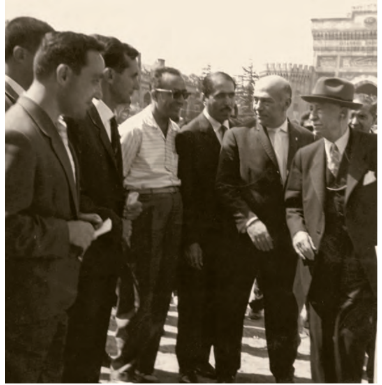
2- Beyazıt Meydanı Yayaştırma Projesi'nin uygulama çalışmasının yapıldığı günlerde, İstanbul'u ziyaret eden Başbakan İsmet İnönü'ye yetkililer tarafından Beyazıt Meydanı'nda bilgi verilirken. Soldan beşinci şahıs, projenin mimarı Turgut Cansever'dir

► Galatasaray'da tarih hocam Cavit Baysun'du, tarih zevkimi geliştiren insan. Çok değerli Fransız hocalarımız vardı. Fransız edebiyatını, edebiyat tarihini Fransız hocalardan dinlemek o ayrı bir şans ve zevk... Baro başkanlığı da yapan Muvaffak Benderli'den divan edebiyatı zevki aldım. Benderli bu edebiyatın güzelliğini öğretti bize. 1935'te Sami Boyar'dan resim dersleri almaya başladım. Sami Boyar'ın karısı, Halide Edip'in teyzesinin kızıydı. Böylece postempresyonist resimler yapmaya başladım. Hatta Eminönü Halkevi'nde on altı ve on yedi yaşlarımda iki de sergi açtım. Orta üçüncü sınıftayken Galatasaray Lisesi'ne bir resim hocası geldi, Ali Karsan. Resim kabiliyeti olanlar için bir atölye açılmıştı okulda. Buraya devam etmeye başladım. Cihat Burak ve Avni Arbaş o günlerden arkadaşlarımdır. Sonra bir başka resim