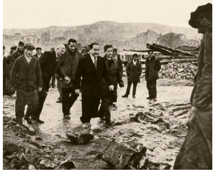
7- Başbakan Adnan Menderes'in elbette İstanbul'un tarihi kimliğini yok etmek gibi bir amacı yoktu. Tam aksine, Tek Parti devrinde kasıtlı olarak ihmal edildiğini düşündüğü bu muhteşem şehri imar ederek ayağa kaldırmak istiyordu. Yapılan, aslında Tek Parti devrinde kabul edilen H. Prost planlarını uygulamaktan ibaretti ve İstanbul'un eski vali ve belediye başkanı Lütfi Kırdar'ın başlattığı iş tamamlanmıştı. Menderes'in gözü karalığının sebeplerinden biri de, devrin şehirci ve mimarları tarafından "Başvekilim, imarcılıkta bizi geçtiniz!" diye pohpohlanmasıydı. Başbakan Adnan Menderes ve Cumhurbaşkanı Celal Bayar İstanbul'un imarıyla ilgili bir planı incelerken (üstte). Başbakan Menderes imar çalışmalarını yerinde denetlerken (altta) ( İstanbul'un Kitabı )

tektonik, kendi başlarına birer varlık idiler. Bu yapı, Bursa ve İstanbul evlerinde XV. asırdan sonra ev mimarisinde çatının biçimini ve ifadesini belirliyordu. Şehre tepeden baktığımız zaman evlerin ve camilerin yapılarının nasıl olduğunu anlamak mümkün. Aynı şekilde bu, evlerin kaç odadan müteşekkil olduğunu okuma fırsatı veriyordu. Bu, mimariyi yukarıdan aşağıya bir topolojik yaklaşımla çözümlenme metodolojisinin bir neticesidir. Kubbeli bir caminin, kubbeyi taşıyan parçalar, oradan daha aşağıdaki