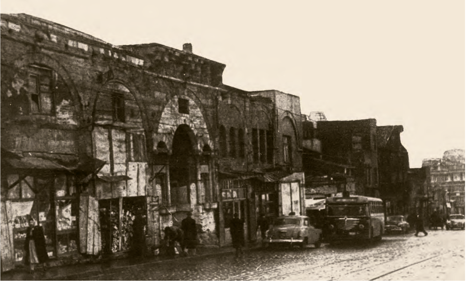
10a- Beyazıt'ı Aksaray'a baęlayan Ordu Caddesi'ni geniřletmek amacıyla yapılan alıřmalar sırasında ekilmiř bir fotoęraf. Caddeyi geniřletebilmek iin muhteřem bir yapı olan Simkeřhane'nin ve Sleyman Pařa Hanı'nın n kısımları kesilmiř ve kazılar yapılarak Roma devrinden kalma bir zafer takının kalıntıları ortaya ıkarılmıřtı ( İstanbul'un Kitabı )