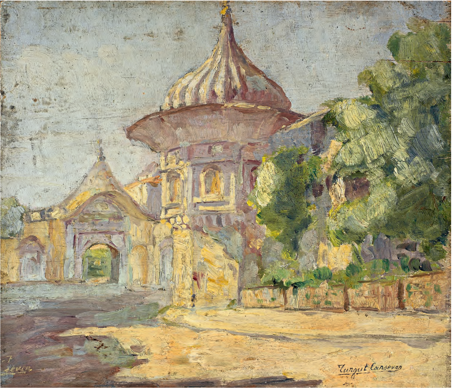
6- Bâbiâli ve Alay Köşkü. Turgut Cansever'in yağlıboya tablosu

İkinci defa Beylerbeyi'nde 25-30 kişilik bir gruba konuşurken gördüm. Şair olarak en parlak yıllarıydı, He'yi yayımlamıştı.