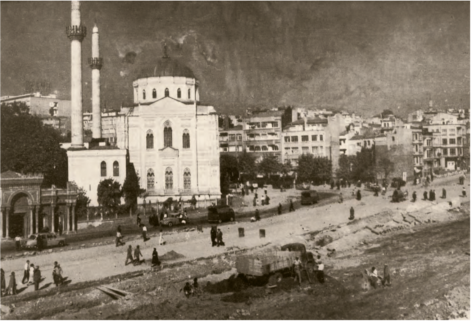
8- Demokrat Parti dönemi imar faaliyetleri sırasında Aksaray Meydanı ( İstanbul'un Kitabı )

taşıyıcı sistemler ve zemindeki duvarlara kadar, yukarıdan aşağıya düşünme sistematığı ile vücuda getirildiğini biliyoruz.