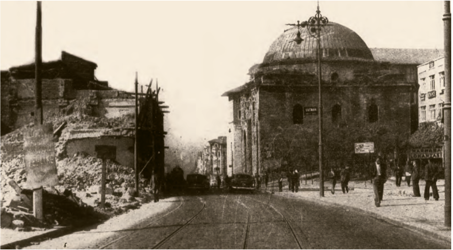
12- Ön cephesi yıkılan tarihî Simkeşhane binası ve karşısında, biraz ileride II. Beyazıt Külliyesi'nin hamamı. Halk arasında "Patrona Halil Hamamı" diye bilinen bu hamam, bazı aydınların ısrarlı taleplerine rağmen kör kazmadan kurtulmayı başarmıştır ( İstanbul'un Kitabı )

bir perspektif içerisinde, su sathı üzerinde hareket eden insanların gördüğü şehir imajı birinci öncelik iken, Kemaleddin Bey, inşa ettiği bu binanın, şehrin bu alanlarından görünüşü içerisinde nasıl bir olumsuzluk yaratacağını hiç hesaba katmamıştır. Bugün bile, etrafında kat kat barbarlıklar yapıldıktan sonra, Dördüncü Vakıf Hanı'nın denize bakan cephesinin çirkinliği hâlâ açık. Burada İslamî hüviyet taşıyan Türk-Osmanlı varlık telakkisinin epistemolojik kaynağının yok oluşundan söz edilebilir. Yani bilginin ancak bilginin konusu olan nesne yahut hadise etrafında dolaşarak, onu her yönüyle görerek, inceleyerek teşekkül edebileceği hususundaki temel inanç ve felsefi kanaat, akide yok olmuş bulunuyor. Kemaleddin Bey'in böyle bir şeyden muhtemelen haberi bile yok.