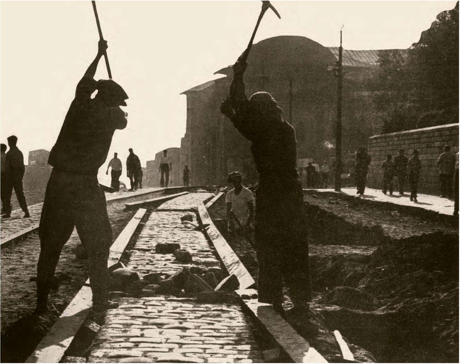
11- Beyazıt Meydanı'ndaki imar çalışmalarında kazmalar faaliyette... Ordu Caddesi, tramvay rayları sökülerek asfaltlanmaya hazır hâle getiriliyor ( İstanbul'un Kitabı )

Nezareti aksını devam ettirip ta sahile kadar inmeyi öngörüyor. Abdülhamid'in yaptırdığı, Sarayburnu'nu karşı tarafa bağlayan köprü projesi var. Önemli bir şehrsel hizmet projesi Şirket-i Hayriye şehrin birçok noktalarını birbirine bağlamayı öngörüyor. Bu bağlantının merkezî noktası olarak da Sirkeci düşünülüyor. Demiryolunun geldiği yer olduğu için... Bir bakıma yalnızca, yüksek sanat eserlerinin üretildiği bir kültür şehri olan İstanbul bir anda bir dış ticaret merkezi hâline geliyor. Düşünün bir kere, İstanbul, matbaanın gündeme geldiği günlerde, büyük Avrupa şehirlerinde yazılan kitapların toplamından fazla kitap yazılan bir şehir, yani dünyanın en fazla kitap üreten şehri... Kâtipler, tezhipçiler, dilciler... Ayrıca minecilik, gümüşçülük, sedef kakmacılığı gibi diğer artizan işlerin en yüksek seviyede yapıldığı şehir olarak İstanbul, birden