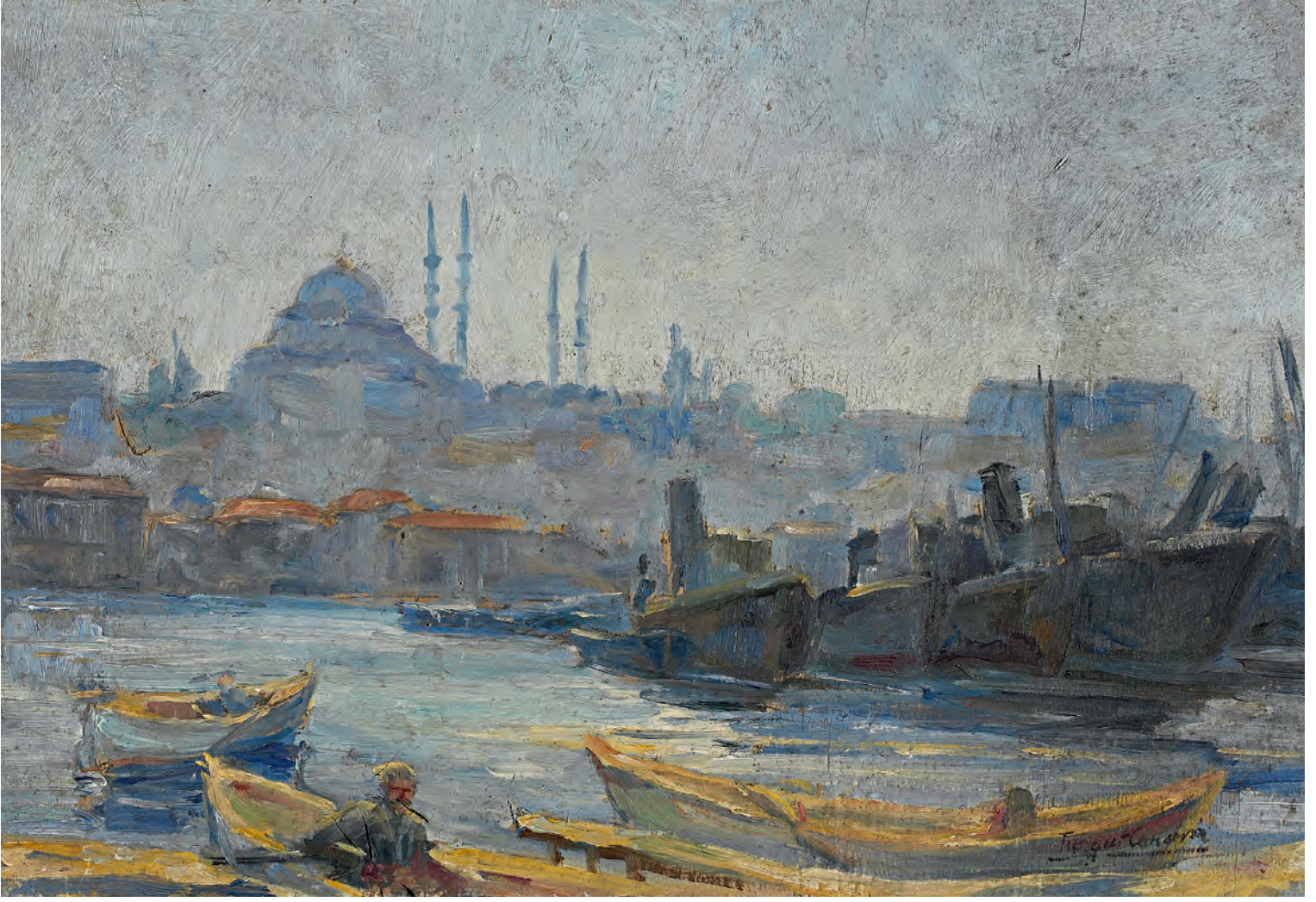
5- İstanbul. Turgut Cansever'in yağlıboya tablosu