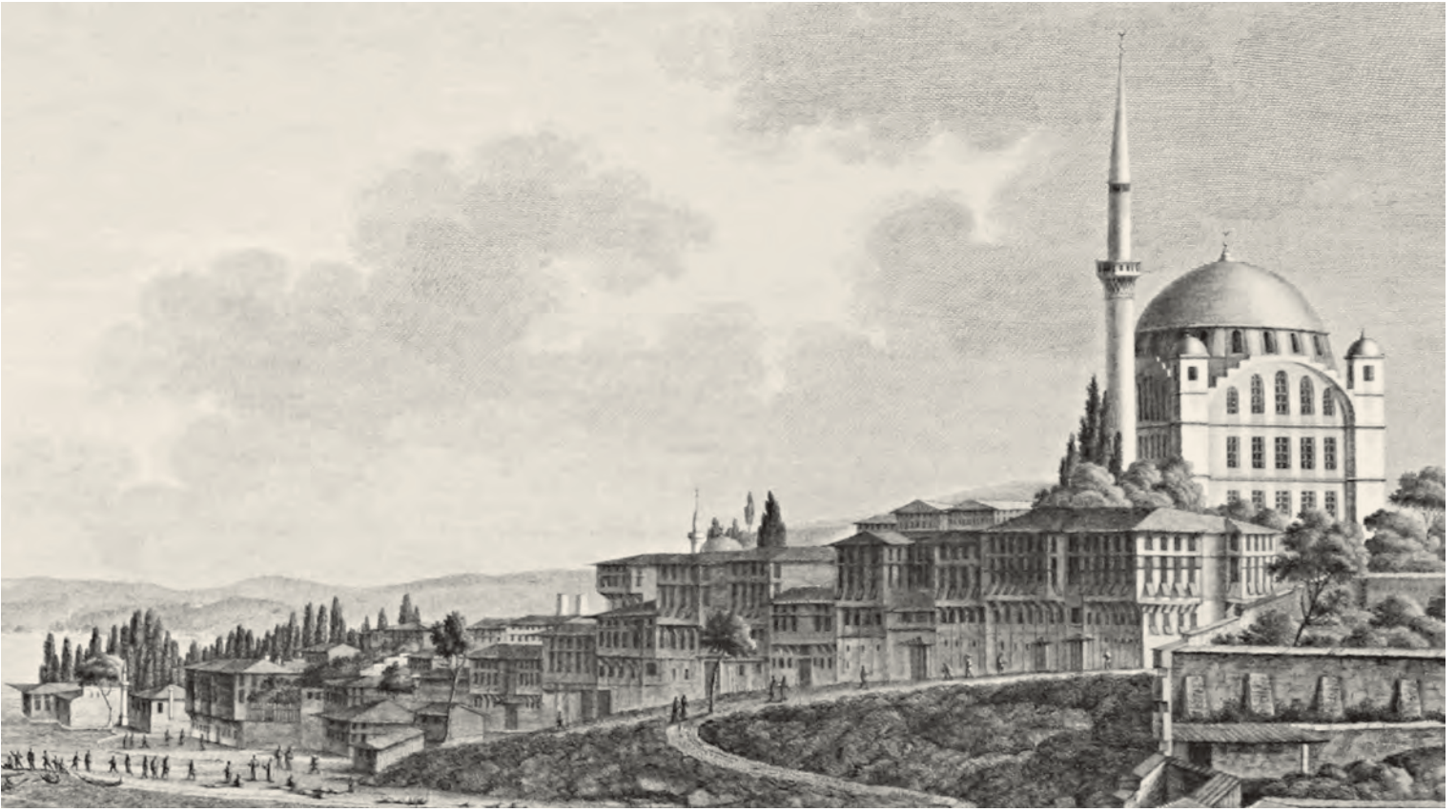
5- Ayazma Camii (Üsküdar) çevresindeki evler (Melling)

akla getirmektedir. 69 Dolayısıyla dam bu örnekte avludan ne ayrı bir birimdir ne de tam anlamıyla ona bağlı bir birim. Belki burası aynı zamanda ahırdan çıkan gübrenin kurutulduğu bir mekân olma özelliği de taşımaktadır. Zira birçok evin ahır olduğu görülmektedir. Örneğin Sultan Mahallesi'nde olan bir menzil, "içinde dört ocaklı fevkani ve tahtani evleriyle ve çatmasıyla ve bir fevkani altı ahırlı odasıyla 70 ve kuyusu ve fırınıyla ve bir miktar bahçesiyle" 71 oldukça iyi bir örneklik teşkil etmektedir. Bazı ahırların ise müstakil birer birim gibi oldukları anlaşılmaktadır, öyle ki kendilerine ait avluları dahi bulunmaktadır. Gümüş Hatun bt. Abdullah, nefsi Üsküdar'da Geredelü Mahallesi'nde olan "bir mülk ahır"ı 72 "iki odasıyla ki