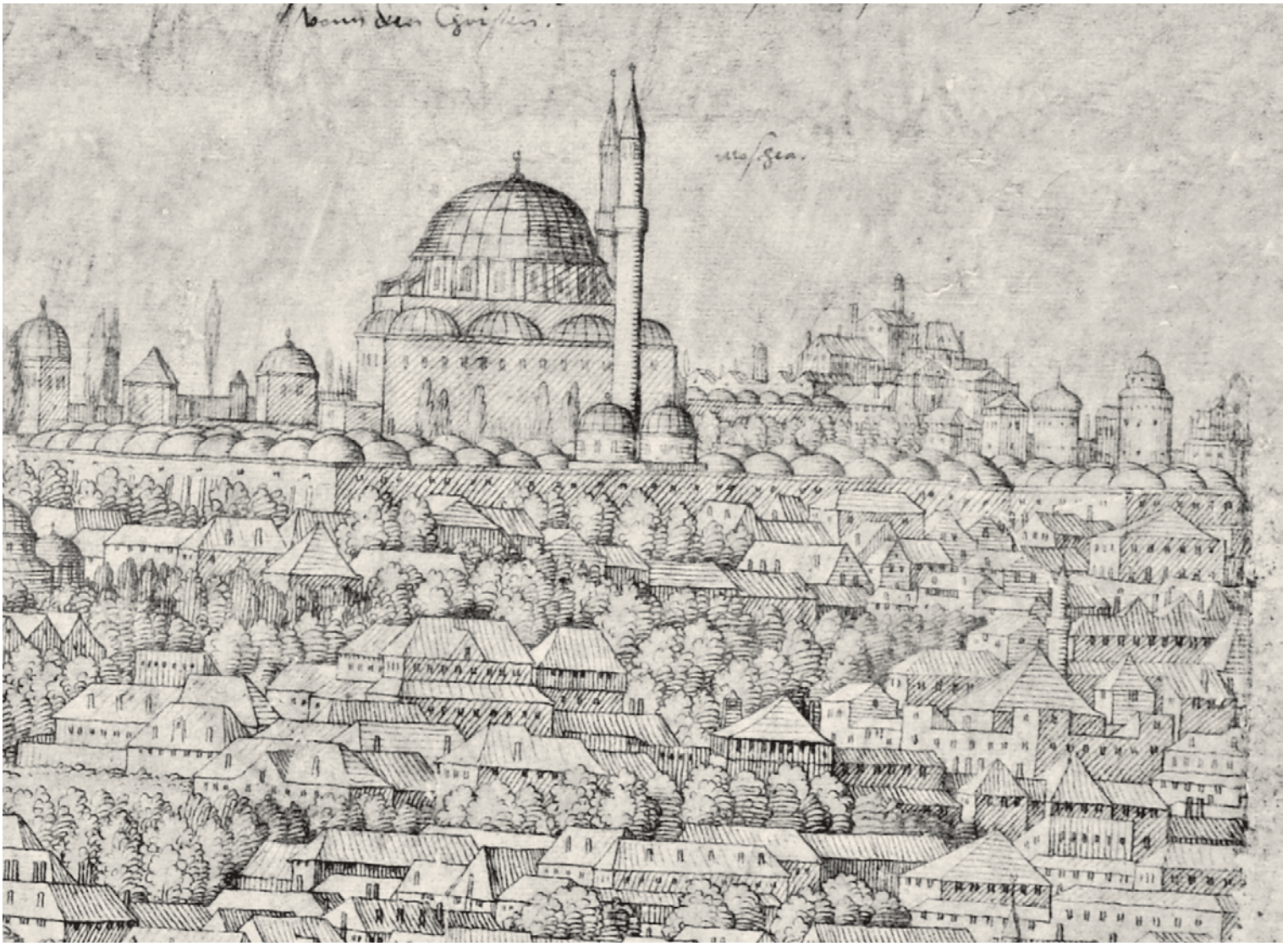
2- Süleymaniye Camii civarındaki evler (Lorichs)

birbirine göre konumlanışı açısından muttasıl ve mahdut olma durumu ile yollara göre tanımlanması belgelerin yaygın tanımlama güzergâhlarıdır.