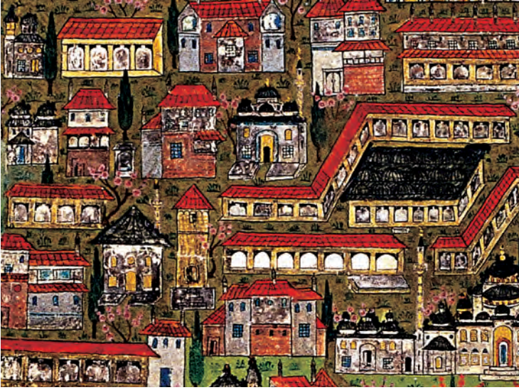
4- İstanbul'un evleri (Matrakçı'dan ayrıntı)

rastladığımız ev tipi ise taş evdir ve hududuyla birlikte 300 akçedir. 37 Acaba 250 akçelik bir çakıl ev ile 300 akçelik bir taş ev arasında ne gibi bir fark vardır? Bu iki kayıta yer alan çakıl ile taş malzemenin nitelik farkı nedir? Büyük bir çakıl ev ile küçük bir taş evin maliyeti birbirine yakın olabilmekte midir? gibi sorulara cevapları sicillerden kolaylıkla çıkarabilmek pek mümkün gözükmemektedir.