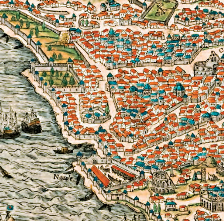
3- Yedikule ve çevresi (Giovanni Andreas di Vavassore, Byzantium sive Constantineopolis , detay)

Çünkü narh defterlerinden anlaşıldığına göre hızar tahtası son derece pahalı ve az bulunan bir malzemedir. Terekede yer alan bir ev de yine ağaçtan yapıldığı anlaşılan köhne haşeb evdir . Onunla birlikte bir “hayat”, “daire” ve “köhne haşeb dam” bulunmaktadır. 29 Bu tanımla harap olmuş bir ahşap evden bahsedilmektedir.