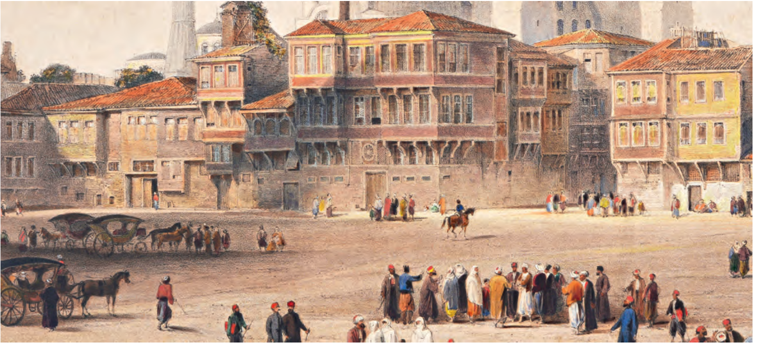
7- Ayasofya Camii yanındaki konaklar (Fossati)

kullanılabileceğine hükmedilebilir. Böyle değil de oturmak için kiralandı ise bir çeşit küçük han görünümdeki bu yapının, hanlar ve görece büyük evler arasında da pek bir farkının olmadığına dair yorumlarda bulunulabilir.