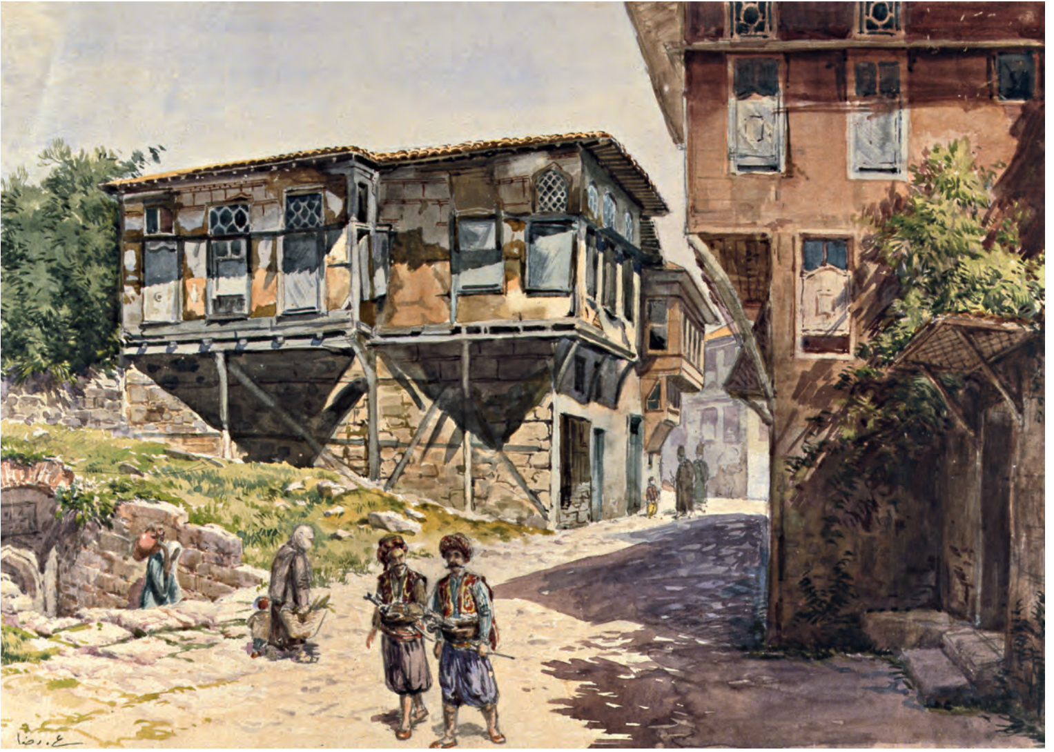
8- Bir İstanbul sokağı ve evleri (İRHM)

en önemli işlevi, ev ahalisinden başka kişilerin de belli zamanlarda evin düzenine hâlel getirmeden eve dâhil olmasını temin etmesidir. Her evde hatta çoğunluk olarak rastlanılmayan selamlığın bu işlevini selamlık olmayan evlerde sağlayan birimlerin olup olmadığı ya da bu durumun her evde sağlanması gereken bir durum olup olmadığı tartışmalıdır. Selamlığın konumlanmış biçimi “haremlik”ten uzakta olması ile karakterize edilebilir. Bugünkü anlamda bütüncül bir yapısının olmadığını ifade ettiğimiz Osmanlı evindeki, haremlik mesabesinde bir odadan uzaktaki bir diğer odanın da bu işlevi görebilmesi mümkündür. Zira söz konusu haremlik-selamlık ayrımının salt zengin ya da daha doğru bir ifade ile toplumun üst tabakasındaki insanlara has olduğu yönündeki görüş tartışmaya açıktır. Bu tip bir ayrımın toplumun üst tabakasından mülhem bir algıyla sadece büyük evlerde olabileceği savı tartışmalıdır. Zira Hüseyin b. Hızır’ın Balat yakınlarındaki el-Hâc Muhyittin Mahallesi’nde bulunan “tahtani iki beyti,