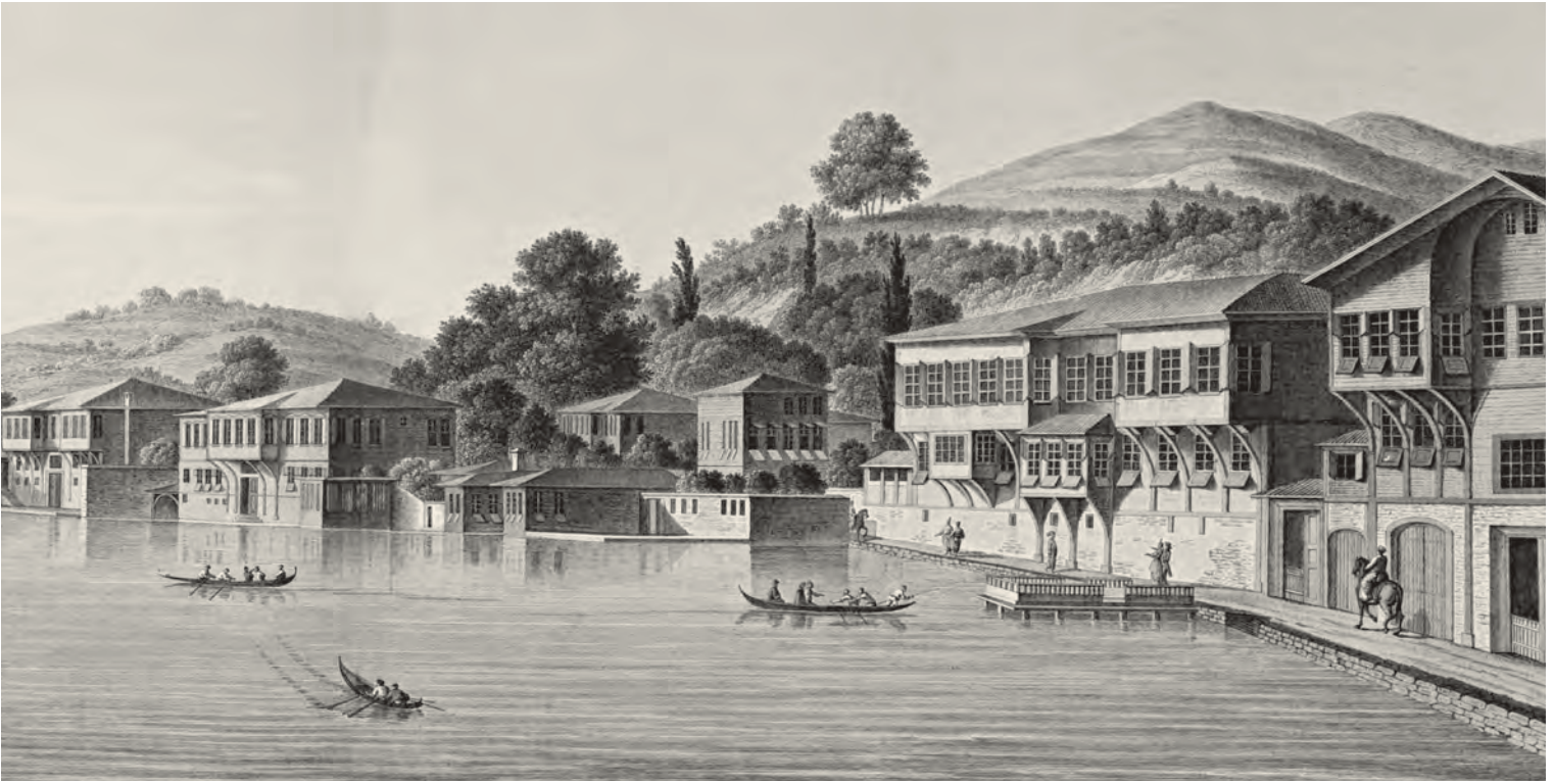
9- Büyükdere'deki yalılar (Melling)

Bir ön değerlendirme ya da kısa bir sonuç olarak geleneksel İstanbul evinin modern zamanlarda “özel alan” olarak “tasarlanmış” evlerden farklı bir duruma işaret ettiği söylenebilir. Bugün içerisinde yaşadığımız evlerle “ev” olması hususiyetinde birtakım benzerlikler taşısa da XVI. yüzyıl İstanbul evleri şehirden ya da “kamusal alan”dan yalıtılmış olmanın yerine şehrin bir prototipi mahiyetindedirler. Bir tür küçüklü büyüklü külliye şeklindeki bu evler, zirai yapı ile iç içe geçmiş ve nispeten kendi kendine yeterli olan ailenin, bugün çoğu kamusal üretimden geçen ihtiyaçları ev bütünü içinde karşılanmıştır. İhtiyaçlar ekseninde evlerin esneyebilme hususiyetleri ise eve bir dinamizm kazandırmış ve kalıplaşmış/statik bir yapılaşmanın aksine, her evin kendi “bireysel”liğini sürdürmesine yol açmıştır denebilir. “Kamusal” olana doğru hiyerarşik bir kurulumla genişleyen evler, bu “bireysel”liğin uzantısı şeklinde kontrollü olarak mahremiyetin kademelenmesine ve muhafazasına da olanak vermiştir. Elbette bu “bireysel”lik evin diğer mimari formlara karşı konumlandığı bir “bireysel”lik, yani onlardan farklılık üzerine kurulu bir mimari form olmaktan öte her ailenin ihtiyaçlarına dayalı farklılıklardan ibaret bir “bireysel”liktir. Burada belirleyici olan yapıdan ziyade aile/insandır. Ev insana göre biçim almakta ve bu biçim hiçbir zaman statikleşmemektedir. XVII. yüzyıl İstanbul evlerinin de bu anlayışı muhafaza ettiği görülmektedir.