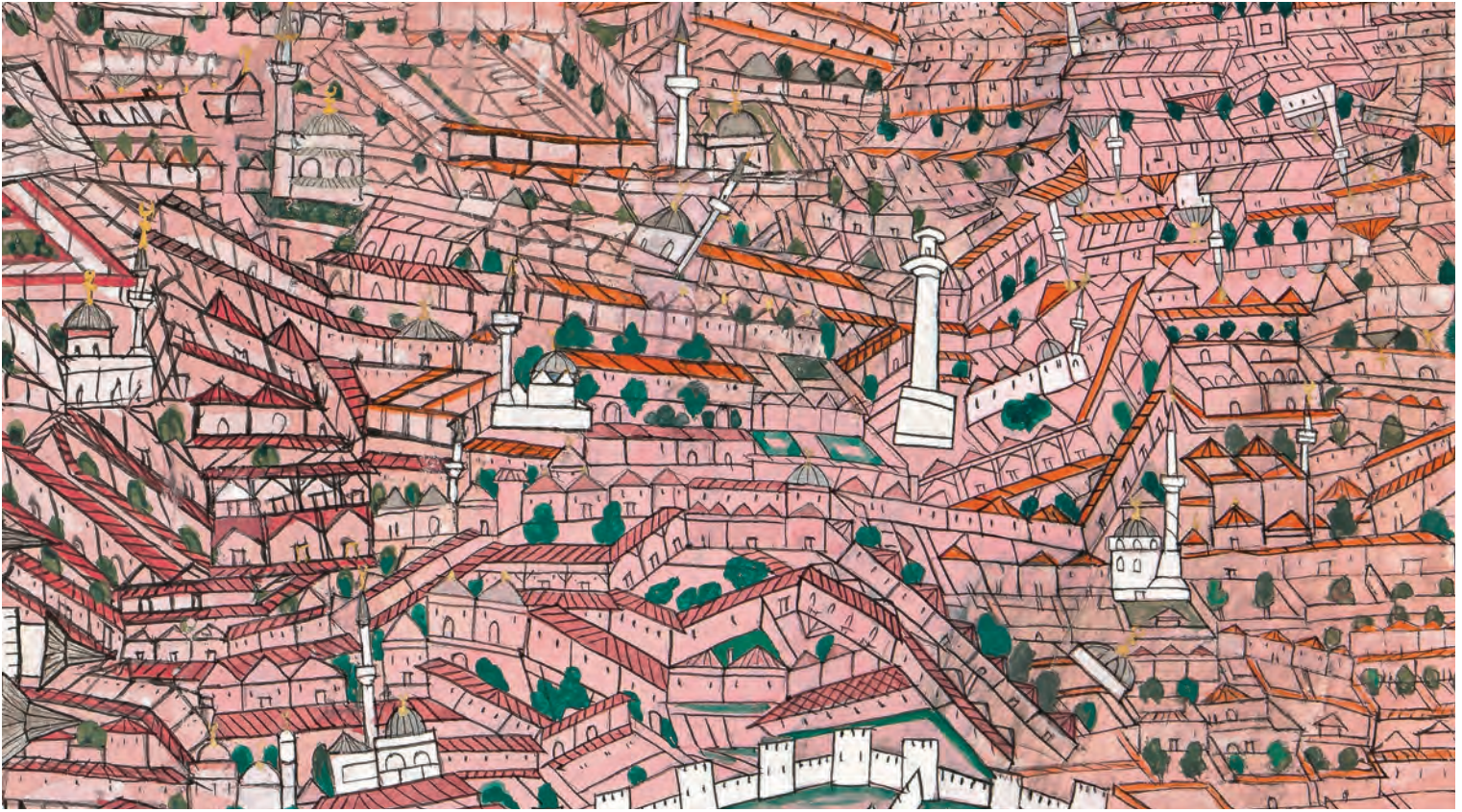
1- Osmanlı İstanbul'unda ev mimarisi ve mahalle yapısı ( Hünernâme )