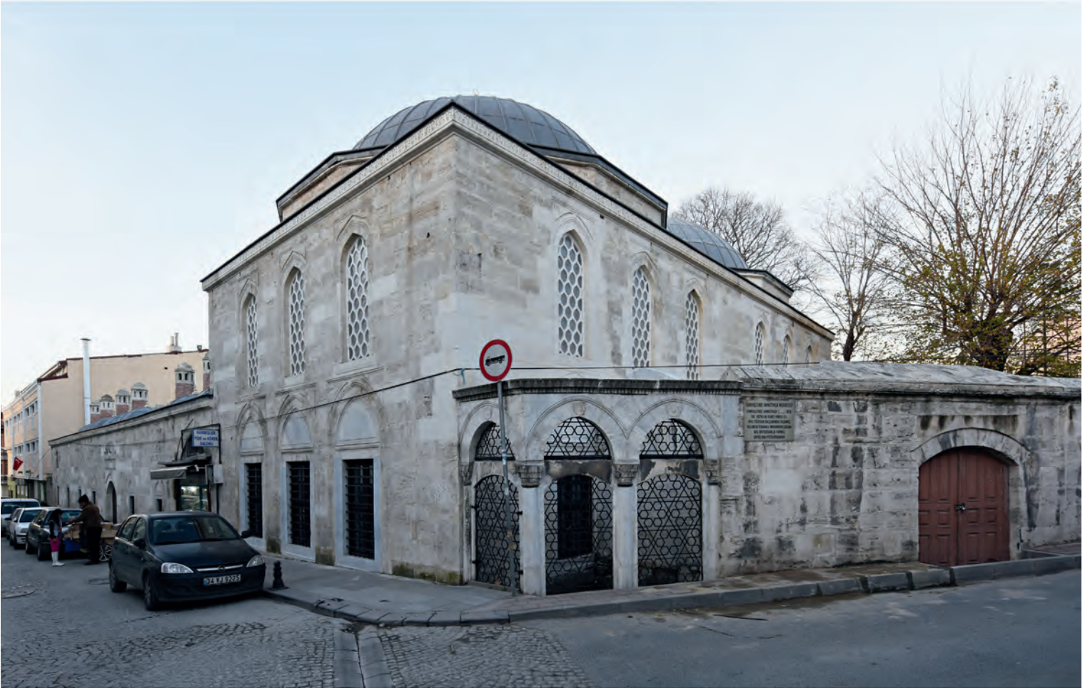
42- Ekmekçizade Ahmet Paşa Külliyesi

arasında zikredilebilir. Dönemin küçük mescitleri ise şunlardır: Vefa Mescidi, Kürt Çelebi Camii (1611), Kadıköy Osman Ağa Mescidi (1612), İstavroz Mescidi/Camii (1613), Kürkçübaşı Mescidi (1613), Arabacılar Mescidi (1614), Kara İmam Mescidi (1615), Halil Paşa Camii (1617), Gedik Abdi Mescidi (1621), Gülşenî Tekkesi Mescidi (1622), Sormagır Odaları Mescidi (1622), Üsküdar Kavak Sarayı Mescidi. 100