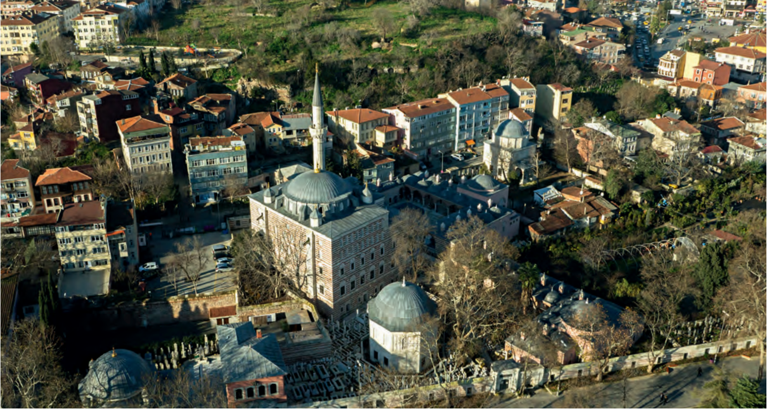
24- Zal Mahmut Paşa Külliyesi

Külliye'nin inşasına, vasiyetlerine binaen çiftin ölümlerinden sonra başlanmıştır. Külliye; türbe, aynı tarihlerde (1578-1579) yapımlarına başlanan ve 1590'da tüm unsurlarıyla tamamlanmış olan cami ve çifte medrese (Şah Sultan Medresesi ve Zal Mahmut Paşa Medresesi) ve sokak çeşmesinden (998 [1589-1590]) oluşur. Külliye'nin inşasına Mimar Sinan'ın başmimarlık döneminde başlanmış, Sinan'ın 1588'deki vefatından sonra, halefi Davud Ağa'nın mimarbaşılığı döneminde tamamlanmıştır.