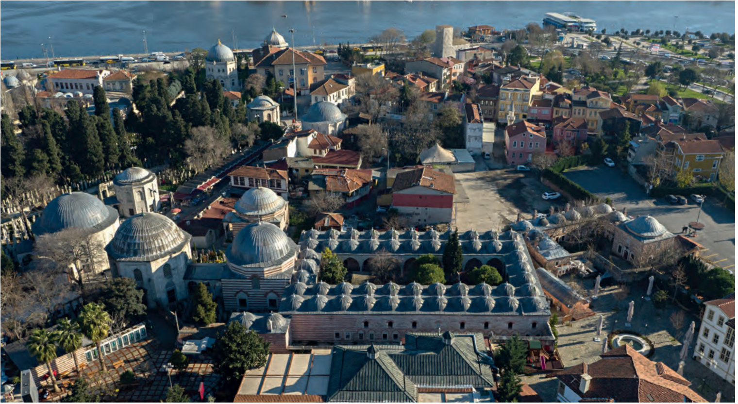
21- Eyüp İsmihan Sultan-Sokullu Mehmet Paşa Külliyesi

Sultan'ın bütün unsurlarının orijinal hâllerine bugüne ulaşamadığı üç külliyesi (Davutpaşa, Eyüp ve Yenikapı dışında) bağlılık, hayır ve iskânın mütevazı örnekleri arasındadır. İlk külliye, kocasıyla yaşadığı sarayının yanında, Davutpaşa'da kurulmuş, mescit (1528) ve zaviyeden (1534-1535) oluşmuştur. Eyüp'te bahçe sarayında inşa ettirdiği (1537), daha sonra camiye çevrilen (bşl. 1555 - btş. 1556) mescit ve zaviye külliyesi ile Yenikapı dışında inşa olunan Merkez Efendi'nin yaptırdığı mescidin tadilatı gibi düşünülebilecek mescit ve zaviyeden (1552) oluşan diğer iki külliyesidir. 46