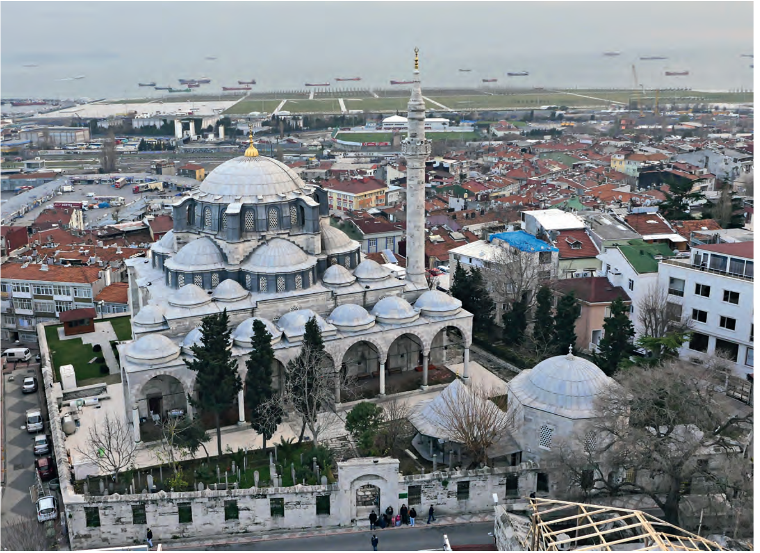
38- Cerrah Mehmet Paşa Külliyesi

olduğu akılda tutulmalıdır. Şu kesindir ki iktidar ilişkileri, mimar seçimi, yapının inşa edildiği yer (gayrimüslim mahallesi ya da komşusu), bir ağanın yaptırdığı bu evsafa bir cami olması ve malzeme tercihleri hasebiyle külliye dikkate değerdir. Mehmed Ağa, Divanyolu'nda, Kızlarağası Medresesi olarak bilinen Mehmet Ağa Medresesi'ni (1579-1582) de yaptırmıştır.