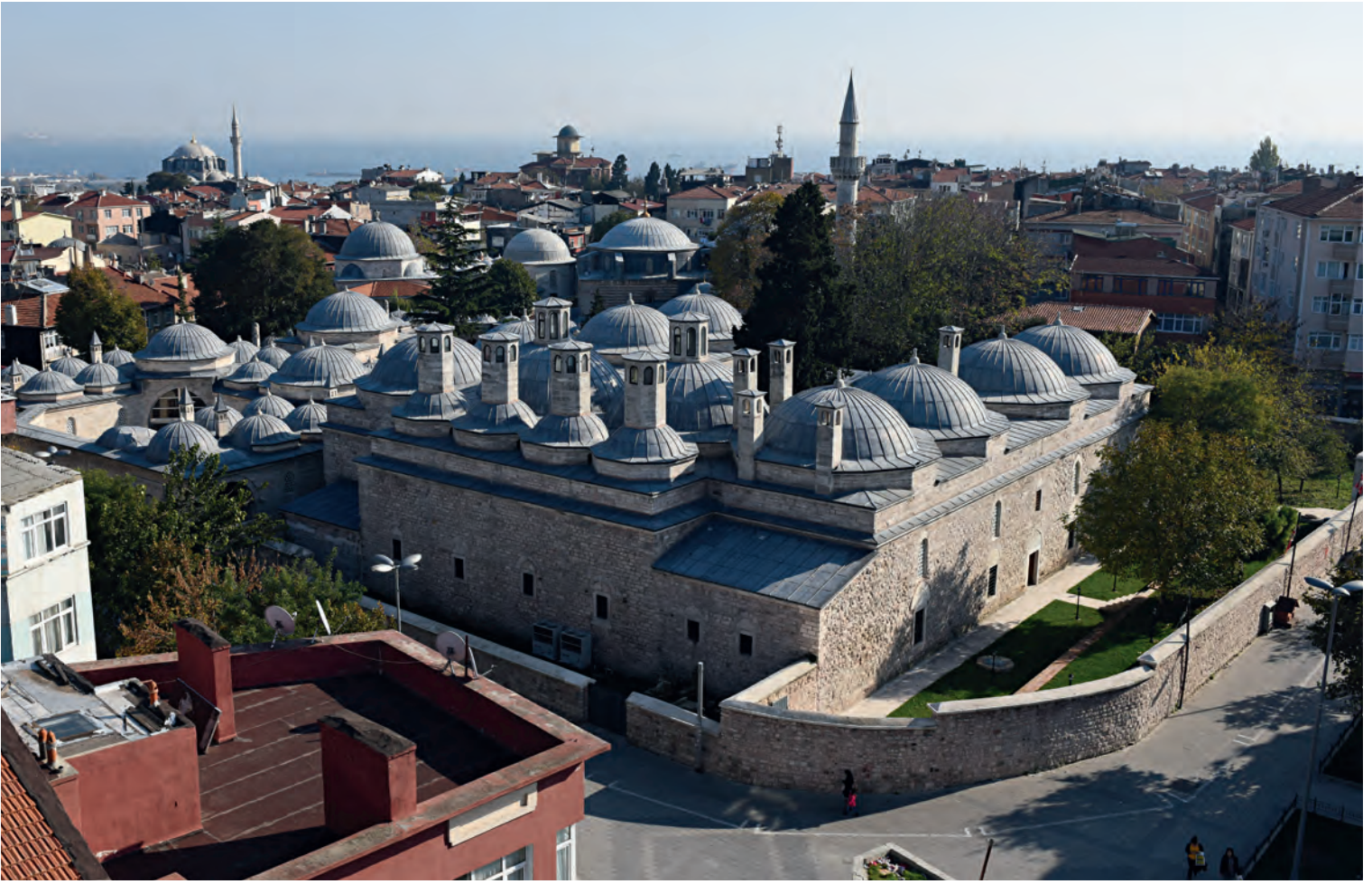
8- Haseki Hürrem Sultan Külliyesi

Ayrıca imparatorluğa başka bir yerden gelmesi ve bir nevi köle cariye olmasının, Hürrem Sultan'ın Avratpazarı'nda inşa ettirdiği yapı topluluğunun yer ve işlev tercihiyle alakalı olup olmadığı sorusu, üzerinde düşünülme hakkı etmektedir.