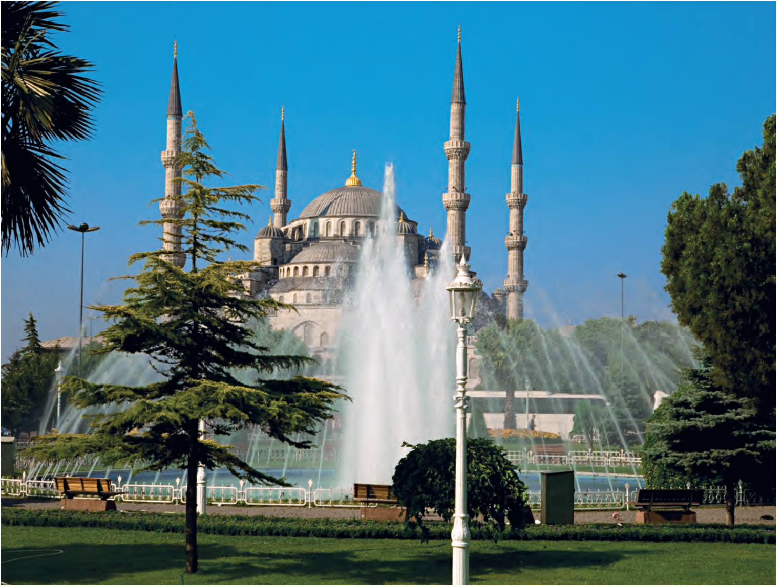
46- Sultanahmet Camii