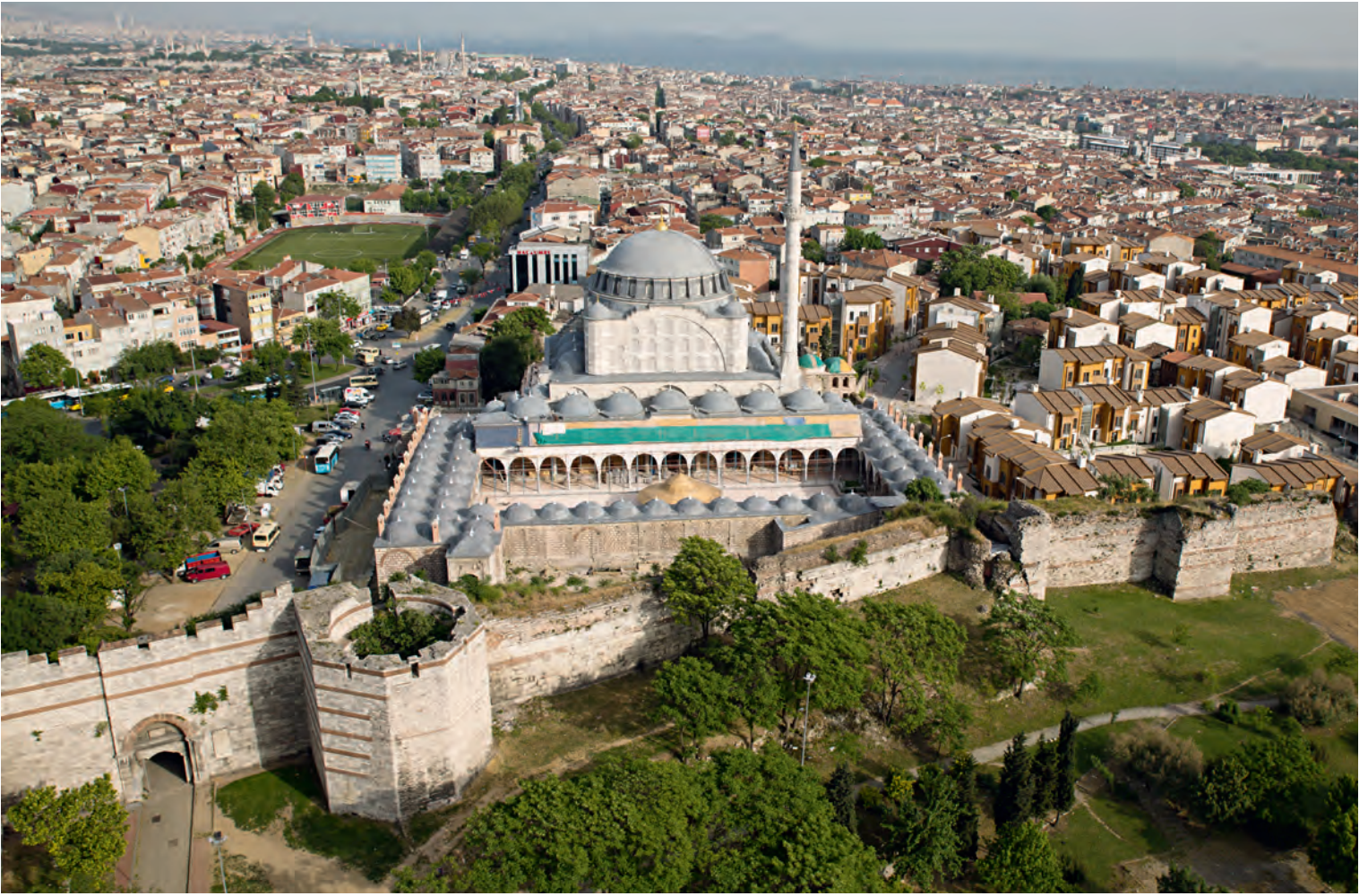
12- Edirnekapı Mihrimah Sultan Külliyesi