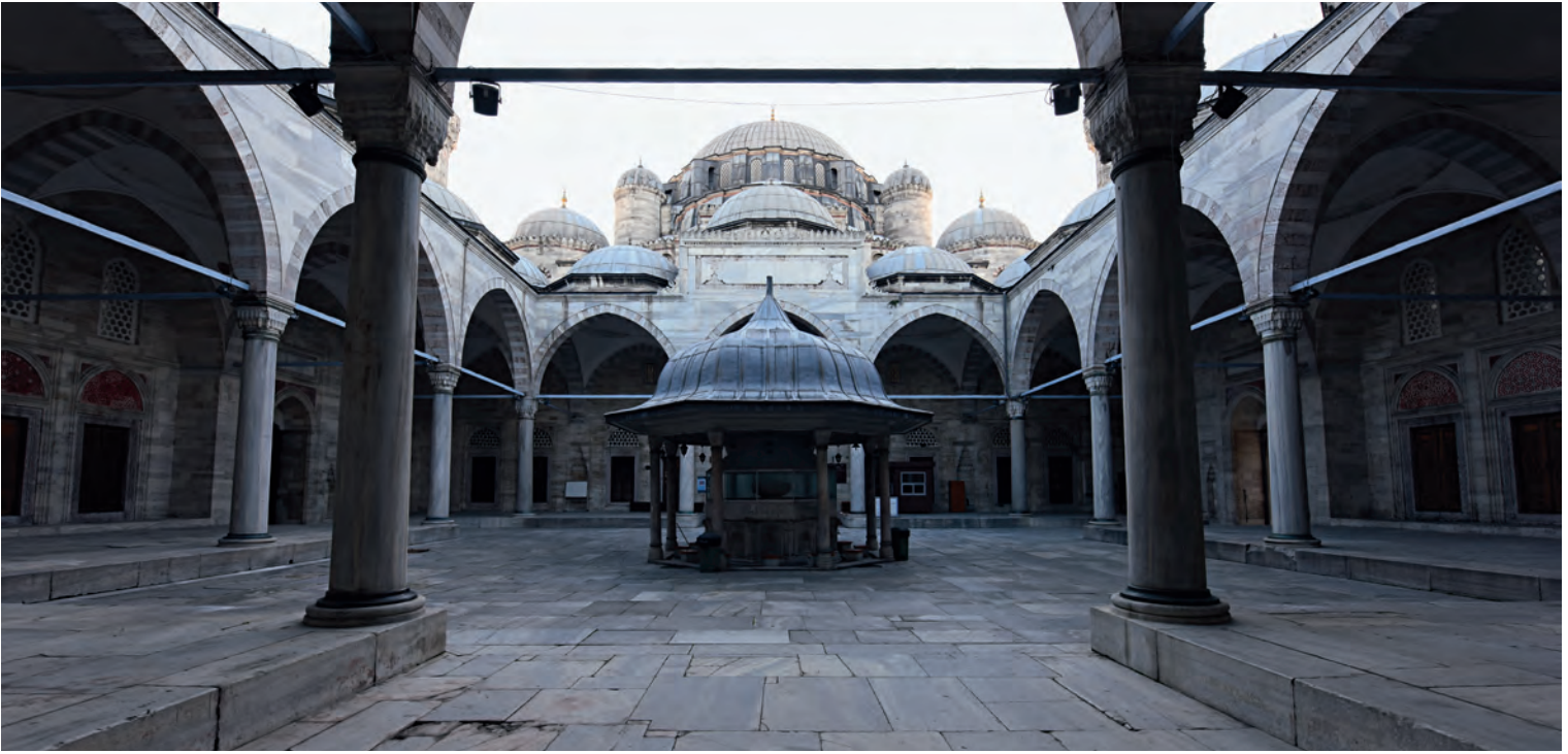
18- Şehzade Camii

Külliyesi işlev programında yer alan ama bugüne ulaşmayan tabhane, imaret ve hanıyla birlikte, Haseki ve Atik Valide ile benzer bir temayül gösterse de, onlarla benzer bir rolü paylaşmaz gibidir. Çünkü Üsküdar sahili Avratpazarı ve Üsküdar sırtlarına nazaran, en azından ticari aktivite olarak daha mamur ve işlek bir yerdir. Mihrimah Sultan Külliyesi'nin hâlihazırda ticari işleviyle var olan bu yerde yapılmış olması, tıpkı Edirnekapı'daki gibi o yeri toparlama ve yeniden tanımlama rolü ile açıklanabilir. Özetle, kadın bânilerin yaptırdığı bu dört külliye İstanbul'un kentsel gelişimindeki kurma, toparlama ve yeniden tanımlama görevlerine memur idiler.