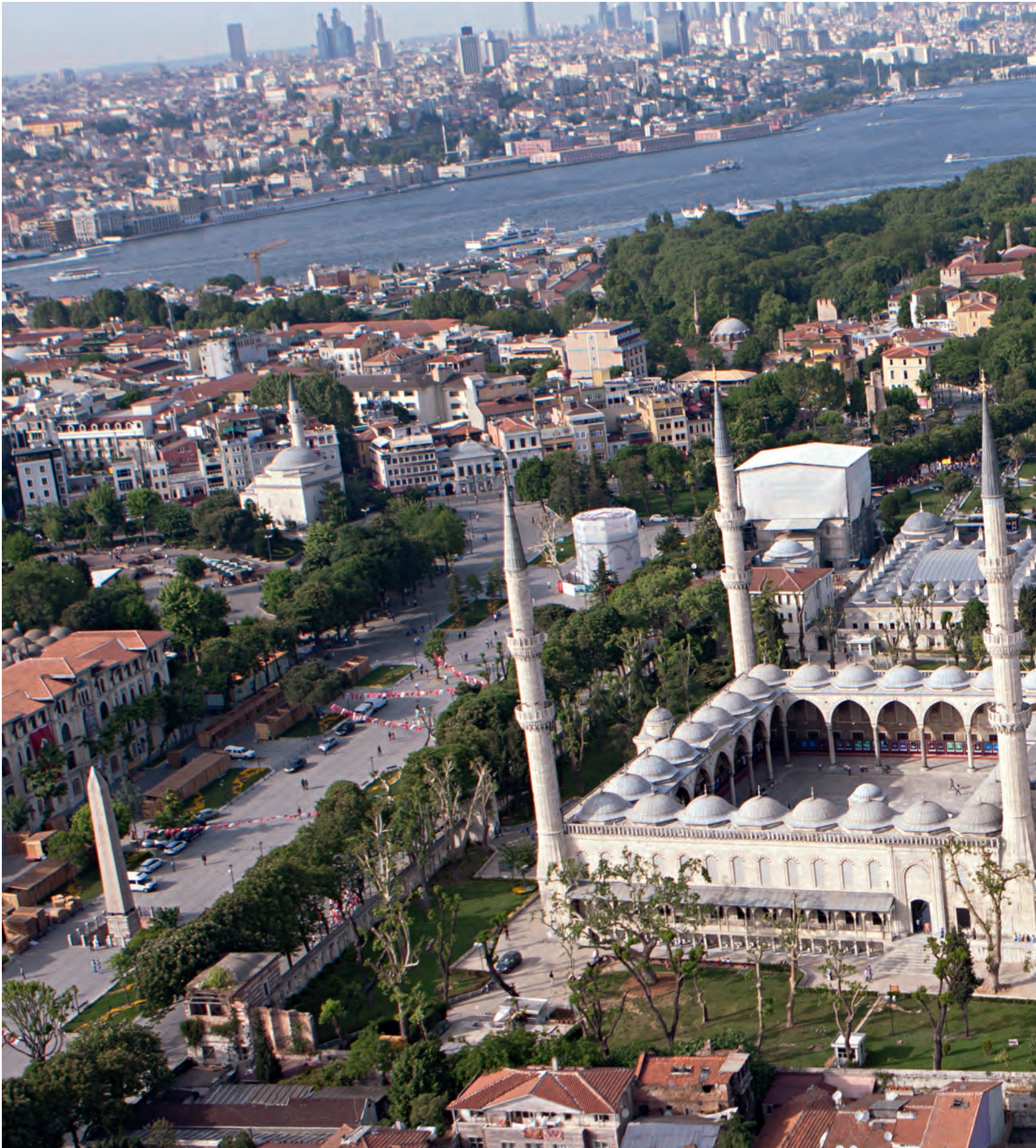
44- Sultanahmet Külliyesi