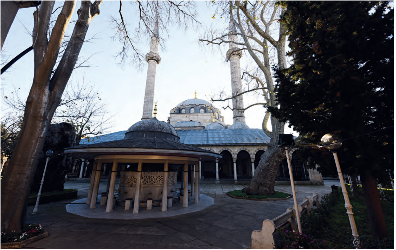
14- Atik Valide Sultan Camii

Kuzeyde ise külliye'nin dış sınırlarına asimetrik bir şekilde yerleştirilmiş ana/avlü girişi yapılmıştır. İçten dışa doğru bir sıra revak ve dükkânlar dizilmiştir. Avlunun batı kenarı revaklar ve medrese hücrelerinden oluşmaktadır. Güneyde medrese revaklarından daha yüksek caminin son cemaat revakları bulunmaktadır. Özellikle kuzey ve doğu kanadı biçimlenme ve içeriğinin külliye'nin konumuyla doğrudan ilişkili olduğu söylenebilir. Külliye, bir sur kapısının hemen yanındadır ve dükkânların şehre giren yoğun ticari varlığın ilk karşılama noktalarından birinde oluşu; çok sayıda dükkâna yer verilmesi (vakfiyesine göre altmış iki dükkân, karşıdaki evin altında üç dükkân ve bir bakkal dükkânı) ve külliye'nin Edirnekapı'ya bakan iki kenarında dizilişi manidardır. Diğer taraftan ticaretin dışa bakan yüzü ile medrese ilminin içe bakan yüzü arasında bir tezat vardır ve her ikisi de hayatın gerçeğidir. Medrese ve dükkânların sırt sırta verdirilmesi ve bünyelerinden kaynaklı tabii yönler (iç ve dış) yönlendirilmesi olağan ama bir o kadar da çarpıcı bir çözümdür.