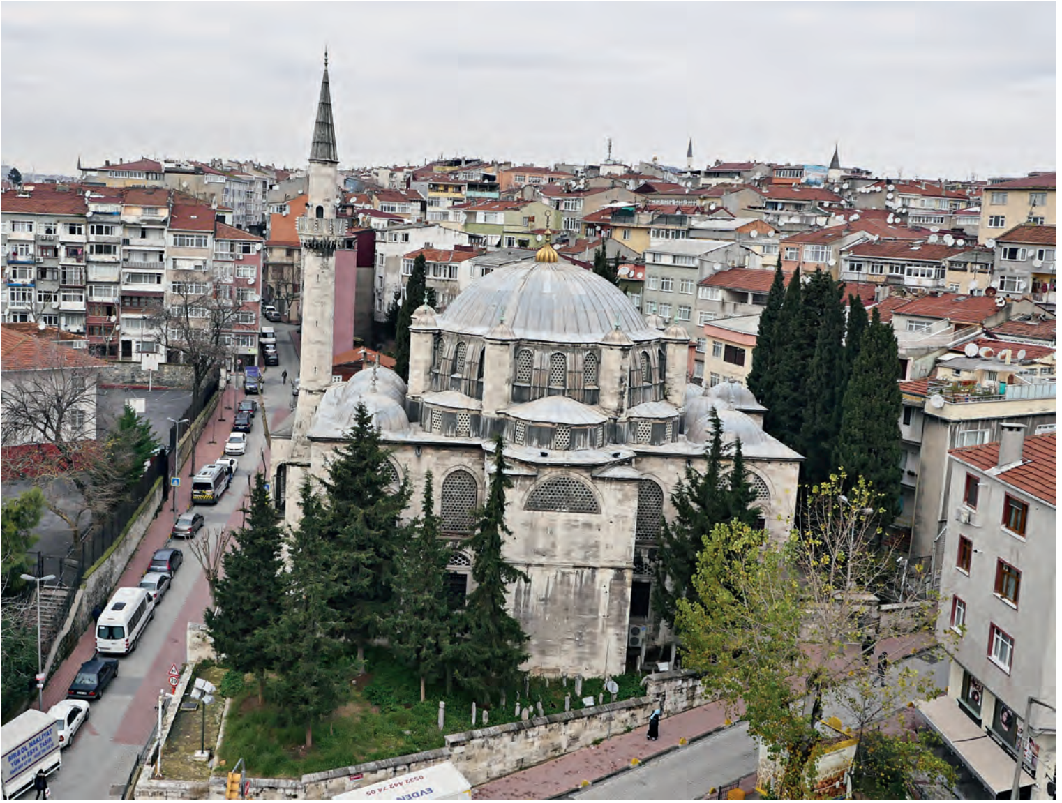
33- Mesih Mehmet Paşa Camii