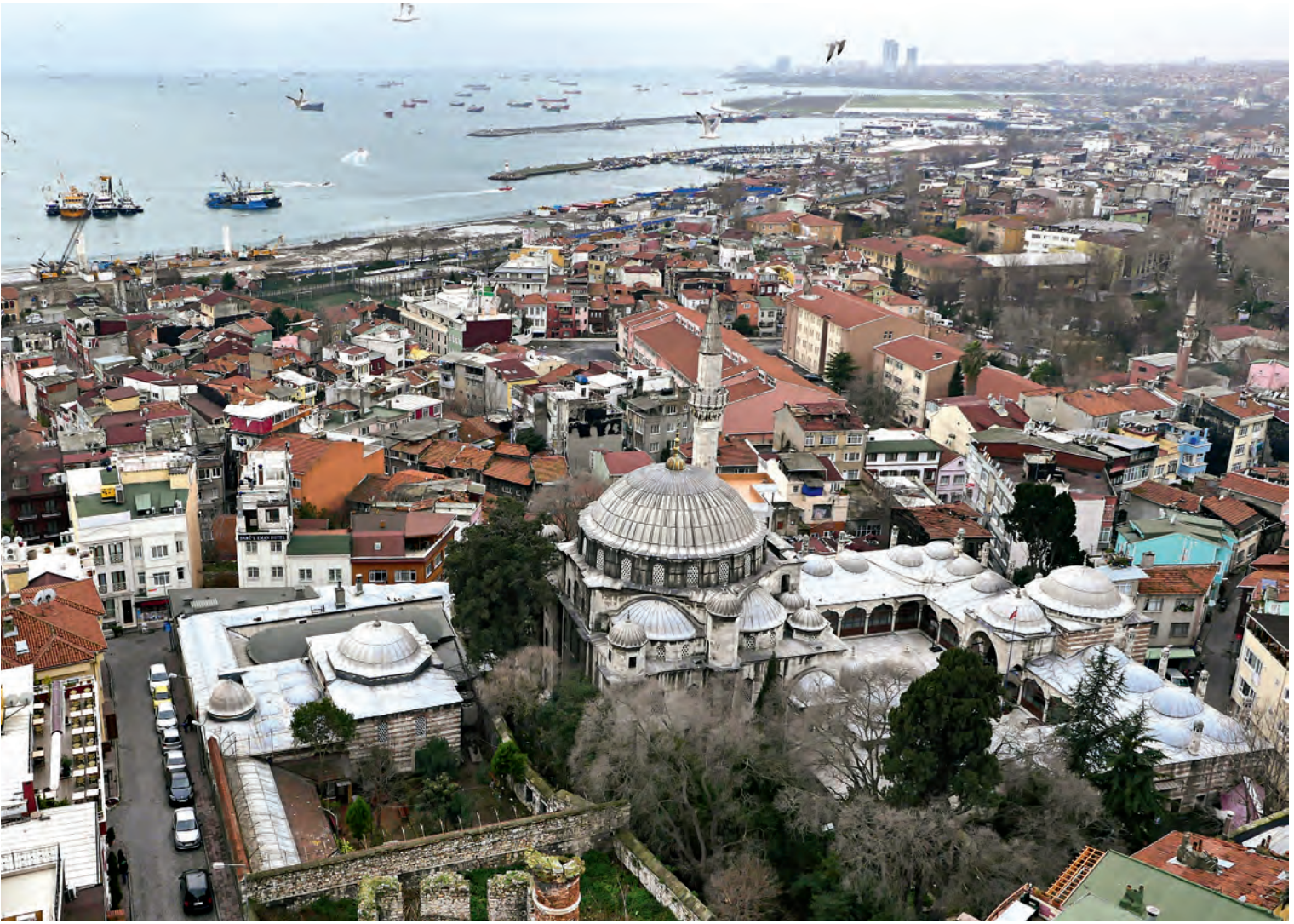
23• Kadırga Sokullu Mehmet Paşa Külliyesi

oturtulmuştur. Medresenin revak kubbelerinin aksine, cami revak kubbelerinin müstakil kaideler üzerine ve orta giriş aksı kubbesinin ise daha yüksek bir seviyeye yerleştirilmiş olması, camiyi oluşturan mimari biçimlerin tek tek belirginleşmiş bireyler haline getirilmesi yönünde bir iradenin tezahürüdür. 50