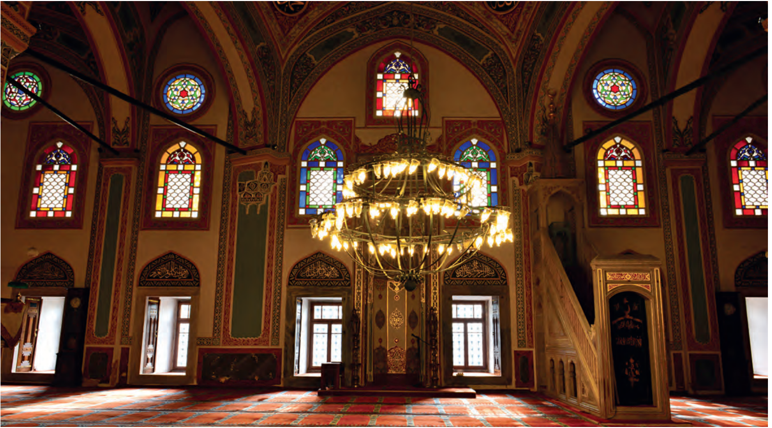
28- Beşiktaş Sinan Paşa Camii

Ayrıca her üç caminin geniş dış avluları vardır. Kasımpaşa ve Tophane camileri yan galerilere de sahiptir. Sinan'ın üç camideki farklı biçim ve strüktür tercihleri hem kendi arayışları hem de yukarıdaki sebeplerden dolayı önemli gözükmektedir.