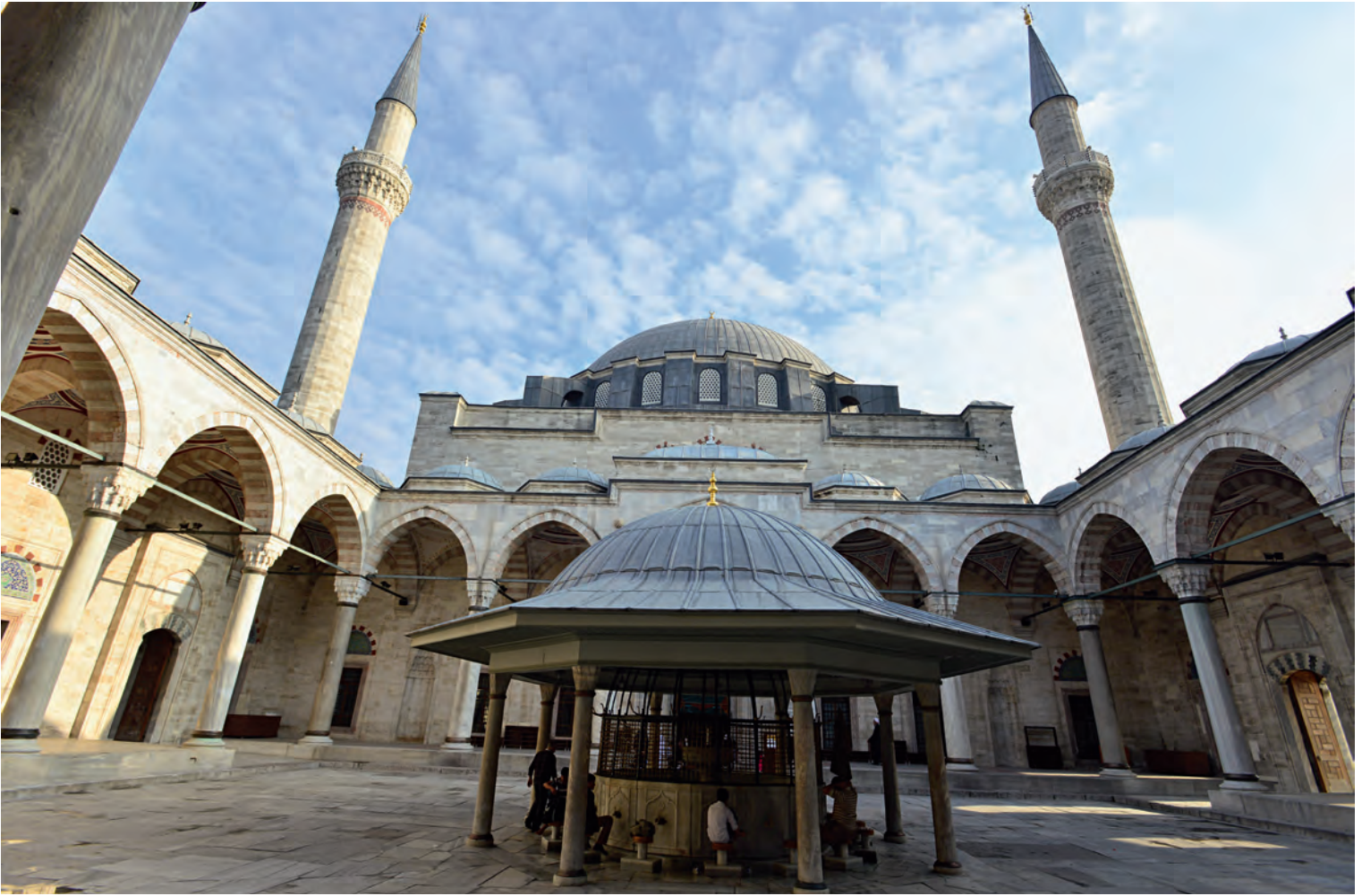
2- Yavuz Sultan Selim Camii

“zaviyeli”, “tabhaneli” gibi adlandırmaları olan bu yaklaşım, İstanbul Beyazıt Camii’nden sonra Yavuz Sultan Selim Camii aracılığıyla da İstanbul’a girmeye devam eder. İstanbul, Edirne ve Bursa’yı bünyesine katmayı sürdürmektedir. XVI. yüzyılın ilerleyen zamanlarında Edirne, Bursa’nın yanı sıra başka coğrafyalar ve Ayasofya gibi İstanbul’un kadim anıtları da içselleştirilecek ve yeni terkiplerin temel dinamikleri olacaklardır. Yavuz Sultan Selim Camii bu yoldaki önemli duraklardan biridir. “Mısır fatihi Yavuz, Sultan Selim Camii’ni (1522), Bursa üslubu ile Edirne Beyazıt Külliyesi’nin mimarisini birleştiren ve yüceleştiren bir şekilde Haliç’e hâkim bir noktada, Çukurbostan adıyla anılan Bizans sarnıcının yanında Mimarbaşı Acem Ali’ye inşa ettirmiştir.” 2 Mimar Acem Ali tarafından yapıldığı öne sürülse de, bu savın bir kanıtı yoktur. Diğer taraftan, o devirde imparatorluğun mimarlık faaliyetinin içinde olan Acem Ali’nin, Sultan Selim Külliyesi inşasında bulunduğu kuvvetle muhtemeldir.