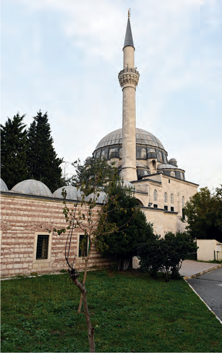
34- Nişancı Mehmet Paşa Camii (Karagümrük)

ve imar-iskân modelleriyle sınırlı değildir. Sinan'dan sonra İstanbul'a mimarbaşı olarak eserler sunacak olan üç ismin dönemi başlamaktadır: Davud Ağa, Dalgıç Ahmed Ağa, Sedefkâr Mehmed Ağa.