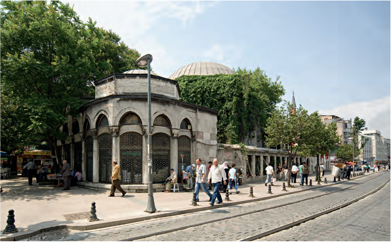
53- Merzifonlu Kara Mustafa Paşa Külliyesi

yarısında konumu ve fiziki varlıklarıyla şehrin en görünür olan önemli merkezleri, XVII. yüzyılın sonunda artık yeni görünümlere sahiptirler. Süleymaniye Külliyesi ile Eski Saray ve çevresinin, Sultanahmet Camii ile Atmeydanı'nın ve Valide Camii (Yeni Cami) ile bugün, Eminönü Meydanı olarak bilinen Gümrük Kapanı'nın merkezî konumları güçlenmiştir. Bu üç abidevi yapı, imparatorluk İstanbul'unun, payitahtın yeni fiziksel çevre terkinde işaret taşları olmuştur. Mimar Sinan, Süleymaniye inşaatı için Eski Saray'ı "tarh" eylemiştir. Sedefkâr Mehmed Ağa ise Sultanahmet Camii'ni "Atmeydanı demekle maruf mesirede" yer alan bir "arsa-i a'lâ"da inşa etmiştir. Divanyolu ise küçük rical külliyesi ile baştan sona tezyin edilmiştir.