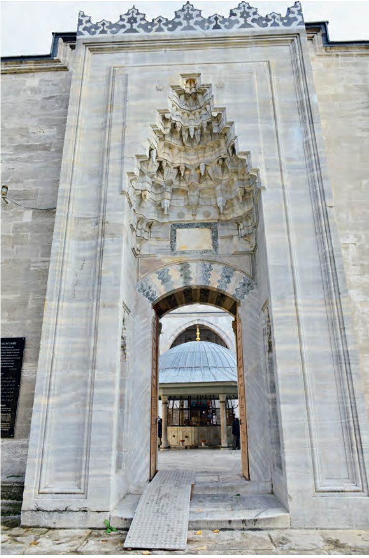
4- Yavuz Sultan Selim Camii avlu giriş kapısı

geçirmiş, XIX. yüzyıldan bu yana ise iki yangın sonucunda ortadan kalkmış, yeniden inşa edilmiş ve orijinal hâliyle bugüne gelememiştir. 6