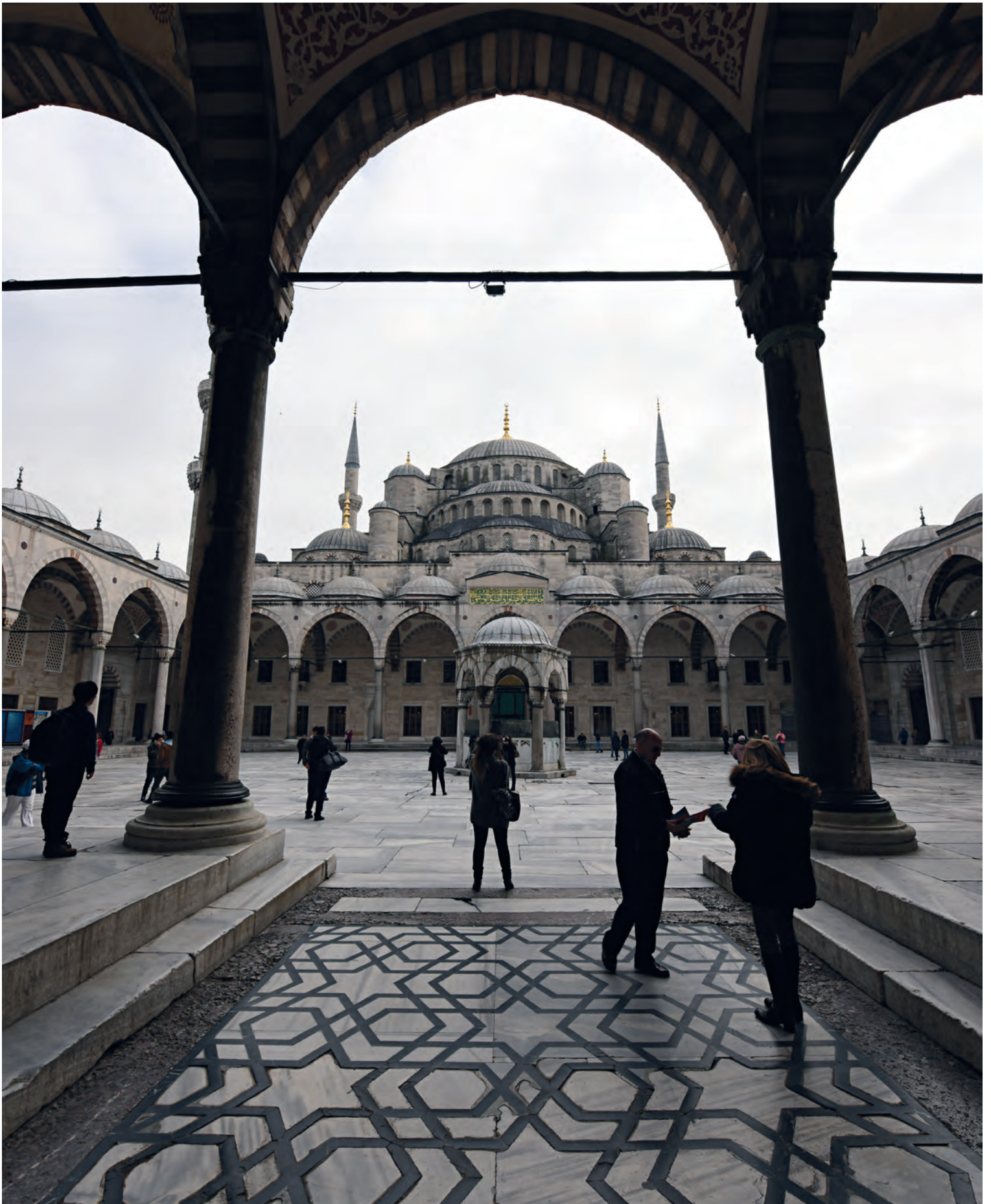
43- Sultanahmet Camii