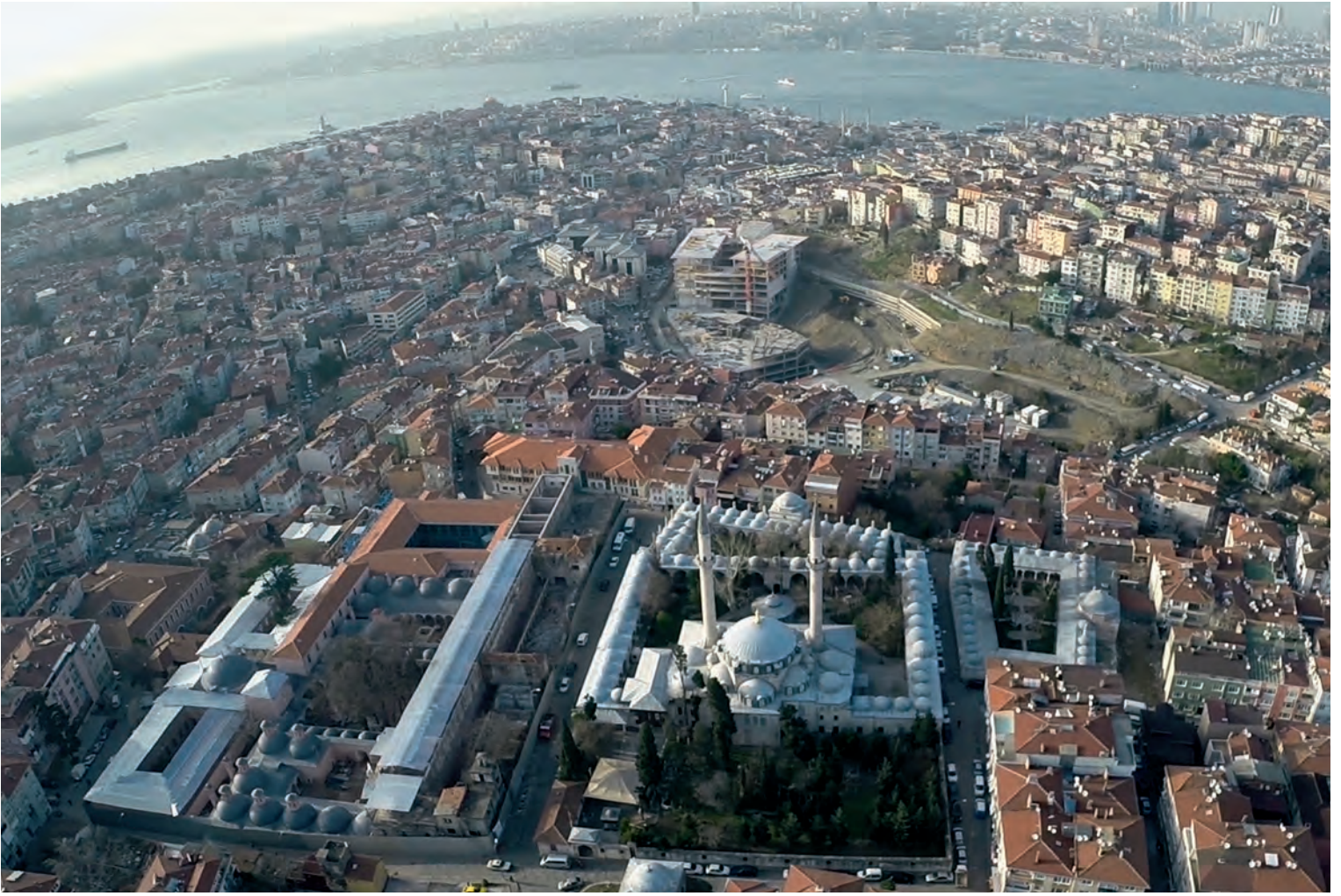
15- Atik Valide Külliyesi

immateriel hale getirilmiş sütun başlıklarının taşıdığı narin ve şişkin yüksek kemerler üzerinde, neredeyse varlıkları belirsiz sekiz köşeli kasnaklara oturan kubbelerden oluşmaktadır. 31