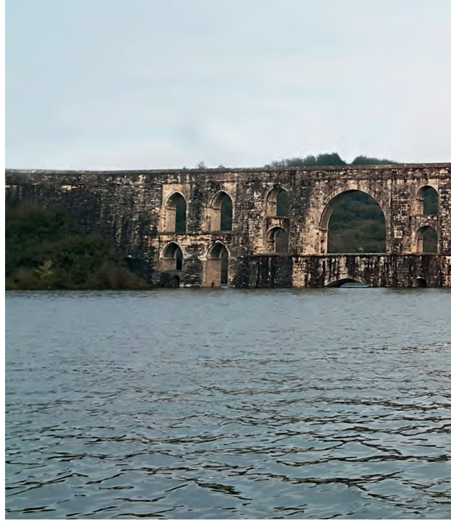
35- Moğlova Su Kemeri

Mimarlık mesleğini, imparatorluğun en varlıklı ve münbit zamanlarında Mimar Sinan'ın yanında çalışarak öğrenmiş iki mimar, Davud Ağa ve Dalgıç Ahmed Ağa sırasıyla mimarbaşı olmuşlardır. Mimarbaşılıktan önceki görevleri ise suyolu nazırlığıdır. Onlardan sonra gelen Mehmed Ağa'nın da mimarbaşı olmadan önceki görevinin suyolu nazırı olduğu düşünülürse, bu makam Sinan devrinden başlayarak mimarbaşı olmanın ön şartı gibidir.