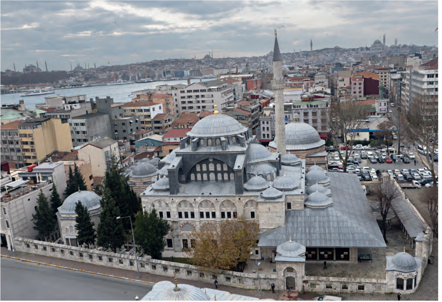
29- Kılıç Ali Paşa Külliyesi

sıbyan mektebi, hamam ve çarşıdan oluşuyordu. 65 Cami altı eşit kubbeli bir “ulu cami” modelidir. Biçimsel özellikleri itibarıyla Sinan’a ait olup olmadığı en çok tartışılan camidir. Turgut Cansever, Edirne Selimiye Camii’nin bitirilişine yakın tarihte inşa edilen caminin asli özelliklerinin Sinan tarafından belirlendiğine kuşku duymaz. 66 Ona göre; “Sinan, Piyale Paşa Camii’nde ananevî payeli ve eşit ölçüde kubbelerle örtülü enlemesine genişleyen cami mekânını yeni bir ruh ve üslupla tekrar gündeme getirmiştir. Altı kubbenin yalnızca cami mekânının orta yerindeki iki yuvarlak sütunla taşınarak namaz sırasında imamı görmeyi zorlaştıran iri payelerin yarattığı mahzurun aşılması da, Sinan’ın payeli camiler geleneğine yeni bir katkısıdır.” 67