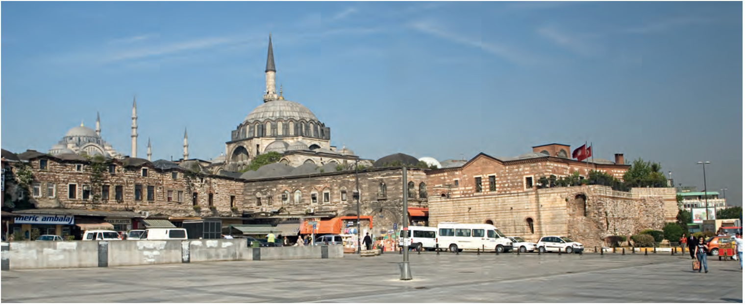
26- Rüstem Paşa Külliyesi

durumu da karşılamış gibidir. Hem kalabalık içinde bir ferahlık sağlanmış hem de Süleymaniye'ye saygıyla kendi varlığını hissettirebilmiştir.