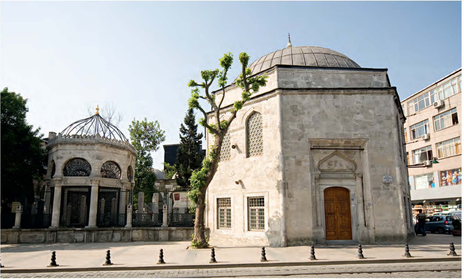
52- Köprülü Külliyesi

IV. Mehmed (1648-1687) Edirne’de oturduğu için belki de imar faaliyetlerinin ve Divanyolu’nun biçimlenmesinin tek yetkilisi Köprülülerdi.