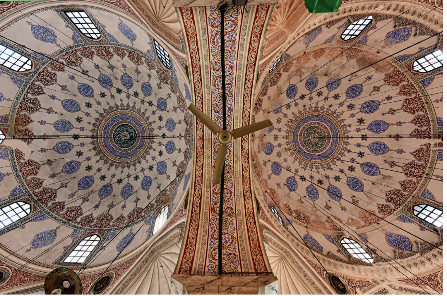
6- Haseki Hürrem Sultan Camii

Turgut Cansever'in aşağıdaki yorumu, Mimar Sinan'ın, yukarıda bir kısmı zikredilen bânilerin himayesinde yaptığı işlerde İstanbul'dan ne aldığı ve bunları İstanbul'a nasıl yansıttığının bir başka ifadesidir: