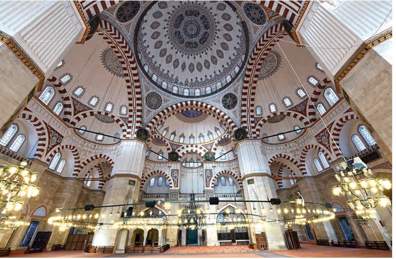
19- Şehzade Camii

beş türbe daha vardır. Bunlar: Rüstem Paşa Türbesi (969 [1561-1562]), Şehzade Mahmut (ö. 1603) Türbesi, Şeyhülislam Bostanzade Mehmet (ö. 1598) Türbesi, İbrahim Paşa Türbesi (1603), Fatma Sultan Türbesi (997 [1588-1589]).