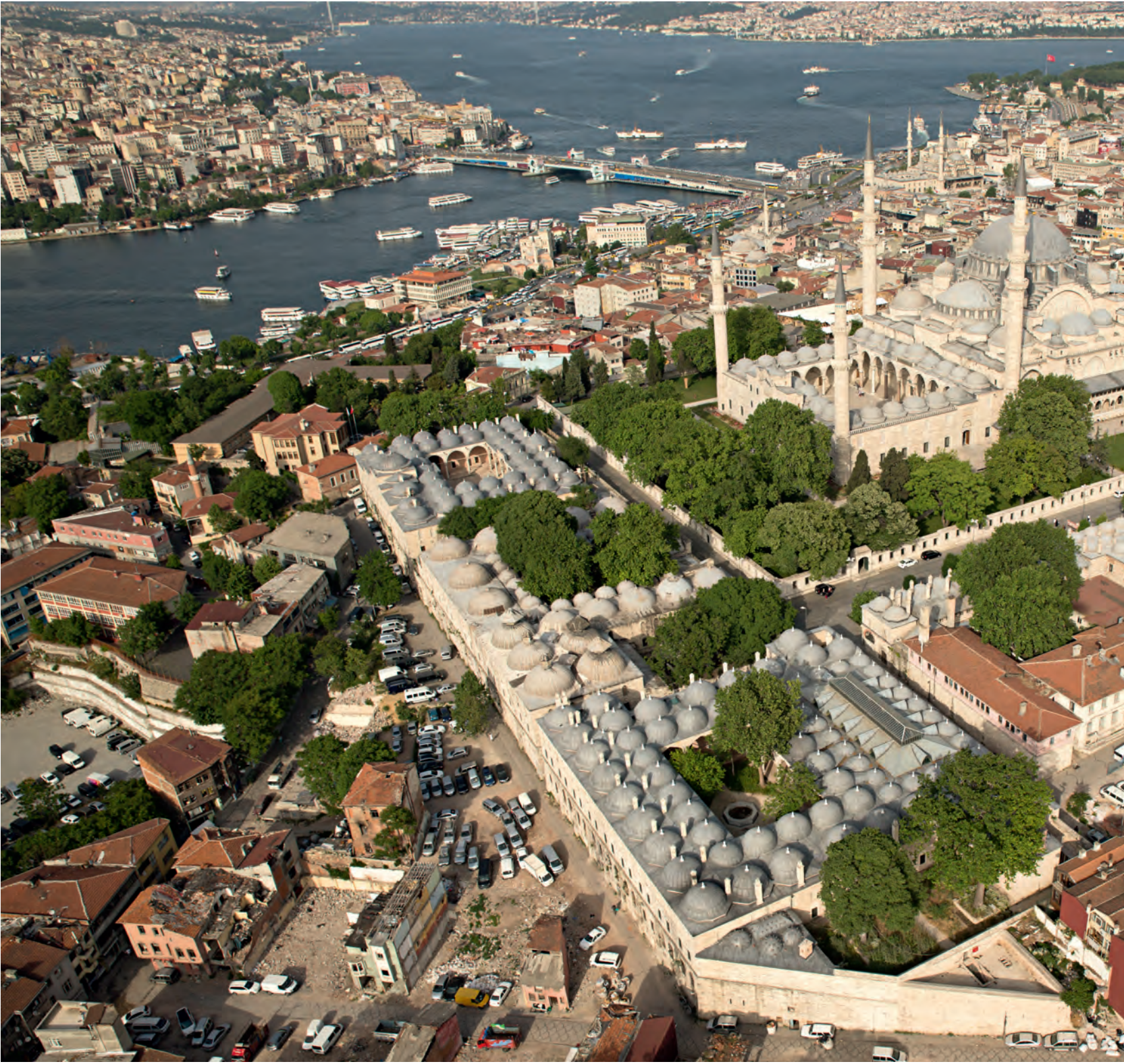
20- Süleymaniye Külliyesi