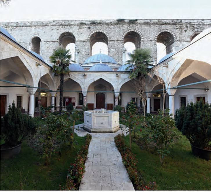
39- Gazanferâğa Medresesi

ihtiyaç olmaması ile doğrudan ilişkili olduğunu söylemek yanlış olmaz. Bu külliye'den sonra artık, nüfus ve yerleşim olarak kalabalık semtlerinde küçük külliye'ler yapılacaktır.