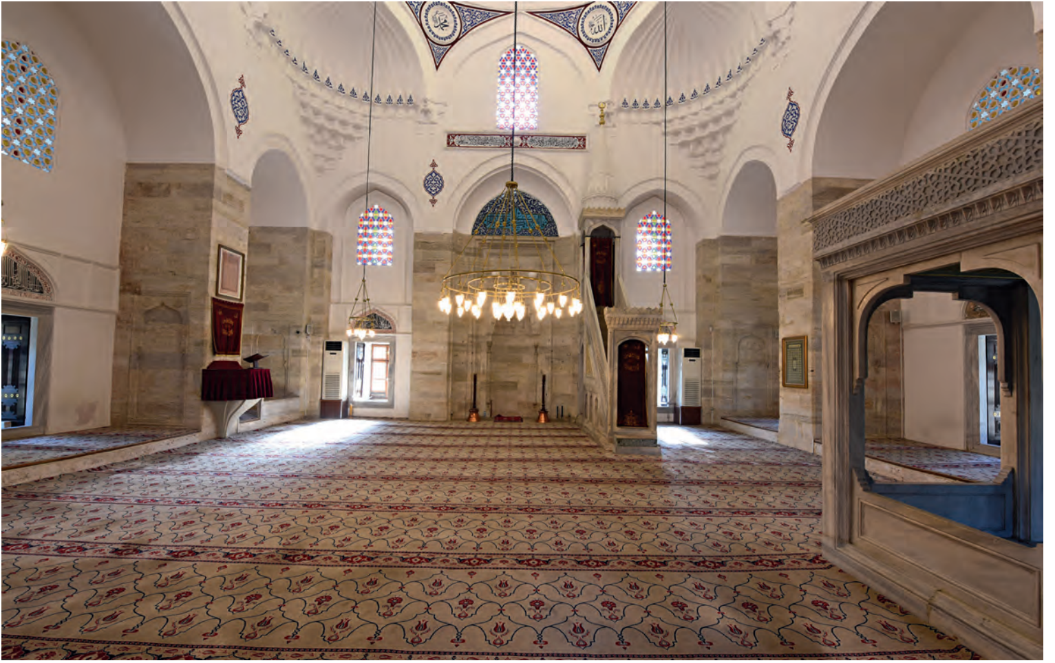
31- Silivrikapı Hadım İbrahim Paşa Camii

Edirne Beyazıt, Sultan Selim (İstanbul) ve Firuz Ağa (İstanbul) gibi XV. asrın ikinci yarısına ve XVI. asır başlarına ait camilerin sade mimarisini devam ettirir. İbrahim Paşa Camii, bu yapılardan yeni ölçüleri, daha yüksek bir kaide üzerine oturan kubbesi, taş-tuğla duvar yapısı, duvarlar üzerinde yer alan yüksek, iri pencerelerin sivri armudî pencere boşlukları ve son cemaat yerindeki armudî kemerlerin yükselen boşluklarıyla oluşan şakulî, canlı, hareketli ifadeyle ayrılır. Bu yapıdaki tek kubbe tercihi ile Selimiye arasındaki ifade yakınlığı, Sinan'ın sanat iradesinin bütünlüğüne işarettir. 71