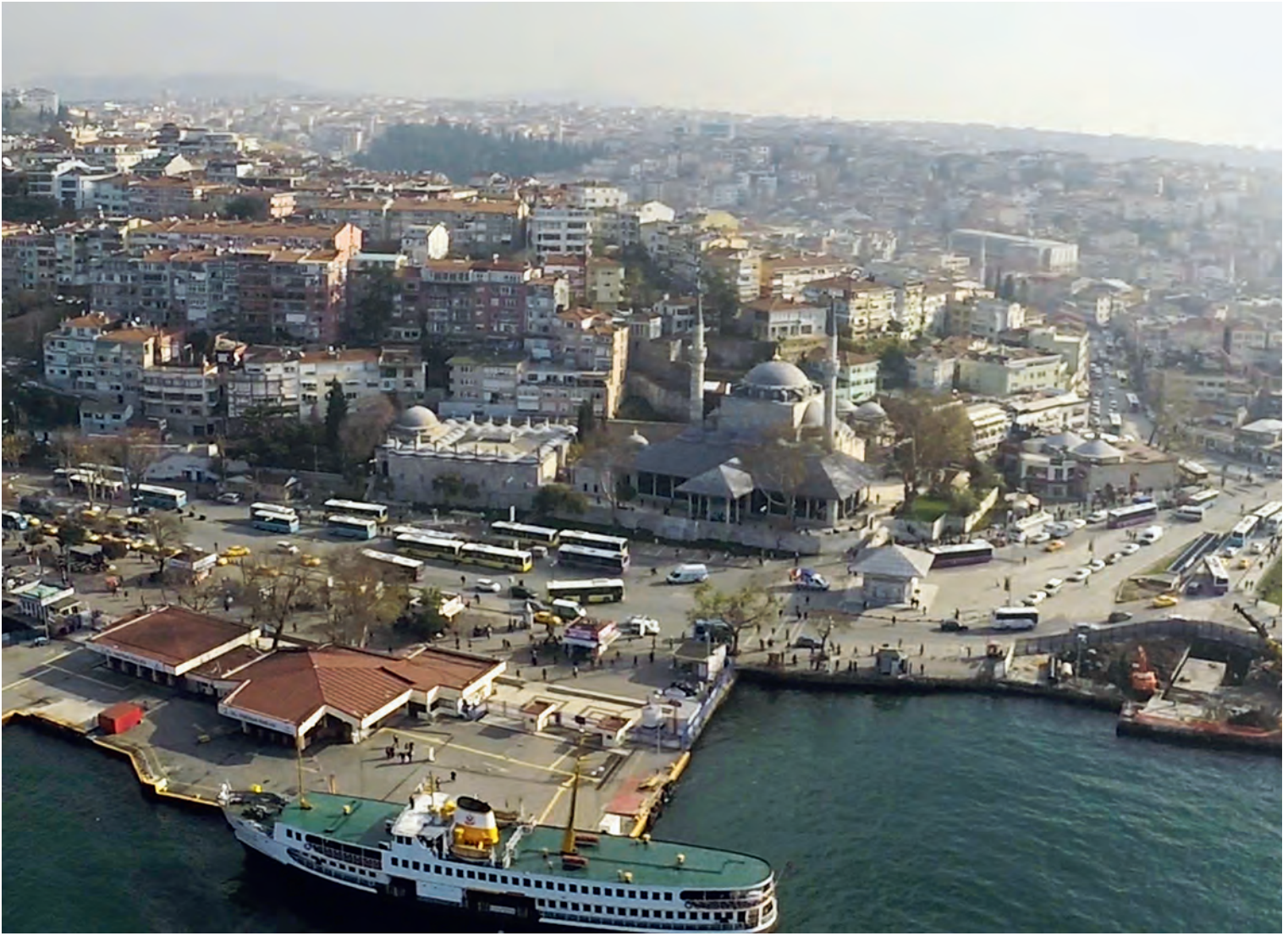
9- Üsküdar Mihrimah Sultan Külliyesi

kubbelerin kürevî formları, kubbe kaplama katlarının hamama ışık sağlayan fenerlerin kaidelerinde biten ince çizgilerle oluşmuş gri renkli zarif kurşun kaplama dokusu, Osmanlı zühd (azla yetinme) tavrının yüce güzelliğini vücuda getirir. Sinan'ın bu eseri, yerden yükselen düz duvarların üzerindeki sekizgen kasnaklara basan kubbelerin kurşun örtülerinin geçmiş yapılarına göre daha etkili bir ölçüde mimariyi belirlediği örneklerden biridir. Bu saf biçimler ve sıva-duvar-maden ilişkisinin çarpıcı mimarisi, Sinan'ın mimarisinin gelişiminde önemli bir adımdır. 20