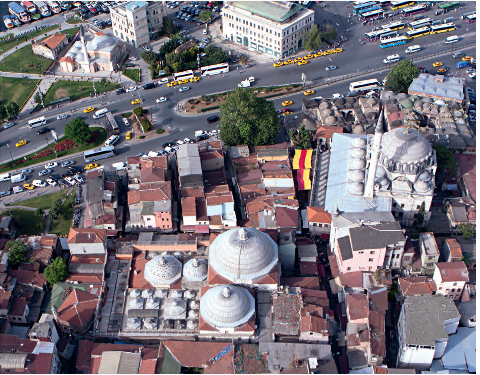
25- Rüstem Paşa Külliyesi

caminin büyük orta mekânını örten kubbeden, büyük kemerler, pandantifler ve fil ayakları da üç cephede birbirinden ayrılmış, böylece her birine ayrı bir önem ve şahsiyet kazandırılmıştır.” 55