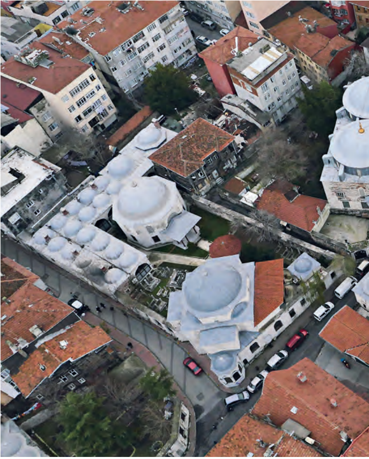
49- Haseki Bayrampaşa Külliyesi

Külliyesi ve XVII. yüzyılın ikinci yarısında Köprülülerin yaptırdığı camisiz küçük külliyelerle (Köprülü Mehmet Paşa Külliyesi, Kara Mustafa Paşa Külliyesi, Amcazade Hüseyin Paşa Külliyesi) diğer küçük eserler (Fazıl Ahmet Paşa Kütüphanesi vd.), bunlar arasındadır. 1635'te inşa edilen Bayram Paşa Külliyesi ise bir anlamda Köprülülerin öncüsü olarak gösterilebilir.