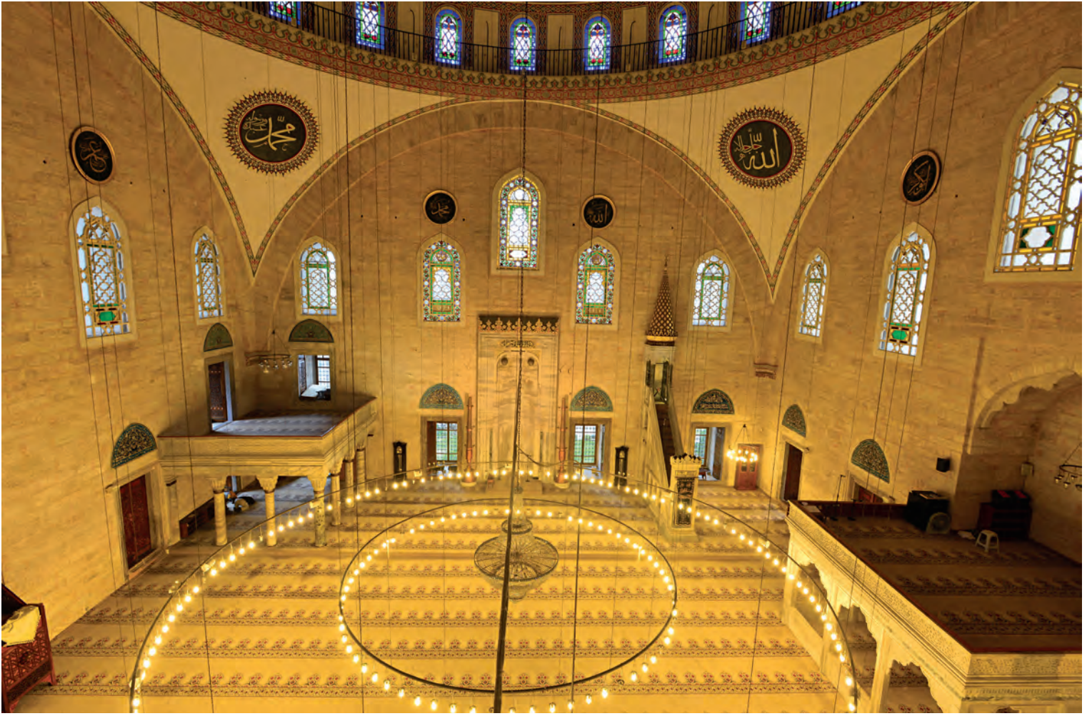
3- Yavuz Sultan Selim Camii

1525 yılındaki vakfiyesinde “re’isü’l-mi’mârînü’l-emîrîn” ve 1525-1526 tarihli cemaat-ı mimarân listesinde ise “Alâ’ü’d-dîn ser-mi’mârân” olarak geçer ve ölümüne kadar listelerde mimarbaşı olarak bulunur. 1539 yılında ölmüş olabileceği düşünülen, Acem Ali’nin selevi, başmimar olduğu kabul edilebilecek “üstad Yakub Şah el-mi’mâr el-mühtedî”den sonra kelime olarak başmimar sıfatını alan ilk kişinin Acem Ali olduğu bilinir. Bu itibarla başmimar unvanının mimarlık mesleğinin ayırt edici bir vasfı olarak, Kanunî dönemiyle kullanılmaya başlandığı söylenebilir. 4 Şüphesiz daha önceden de başmimar anlamına gelebilecek kıdemli ve yetenekli mimarlar ya da birinci mimarlar söz konusudur.