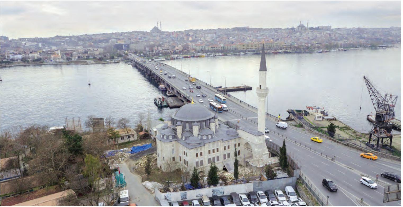
27- Azapkapı Sokullu Mehmet Paşa Camii

camii (bşl. 1573 - btş. 1577-1578), eski kaptanıderya yeni veziriazam tarafından Kasımpaşa'daki mirî tersanenin yanında inşa ettirilmiştir. "Haliç'in güney kıyısını tezyin eden abideler dizisine karşı kıyından küçük de olsa bir odak noktasıyla cevap vererek dengeyi sağlamak amacıyla seçilmiştir. Bu tercih, Fatih döneminde Murat Paşa, Davut Paşa, Koca Mustafa Paşa camileri gibi eserlerle yarımada yapılmış mimari katkının devamı olarak Sokullu Mehmet Paşa Camii'nin güneyde Marmara kıyısında, Kadırga Limanı civarındaki yamaçlara inşa edilmesiyle benzerlik taşır." 60