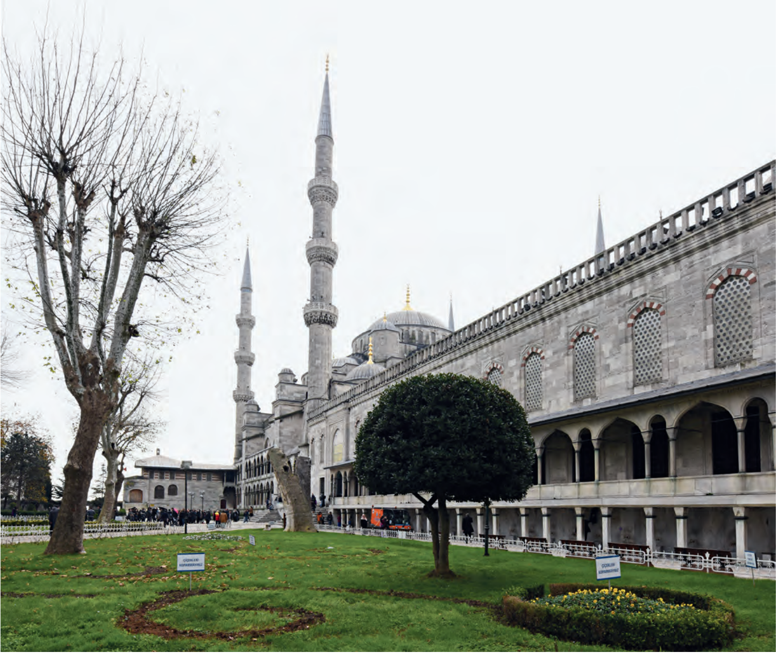
48- Sultanahmet Camii

karamsarlık, bütün bunlarla bağlantılı bir biçimde alevlenen saray ve yönetici entrikaları, padişahın özellikle XVII. yüzyılın ikinci yarısında toplumsal bir figüre dönüşmesi ve XVI. yüzyıla kıyasla geri plana çekilmesi. 112