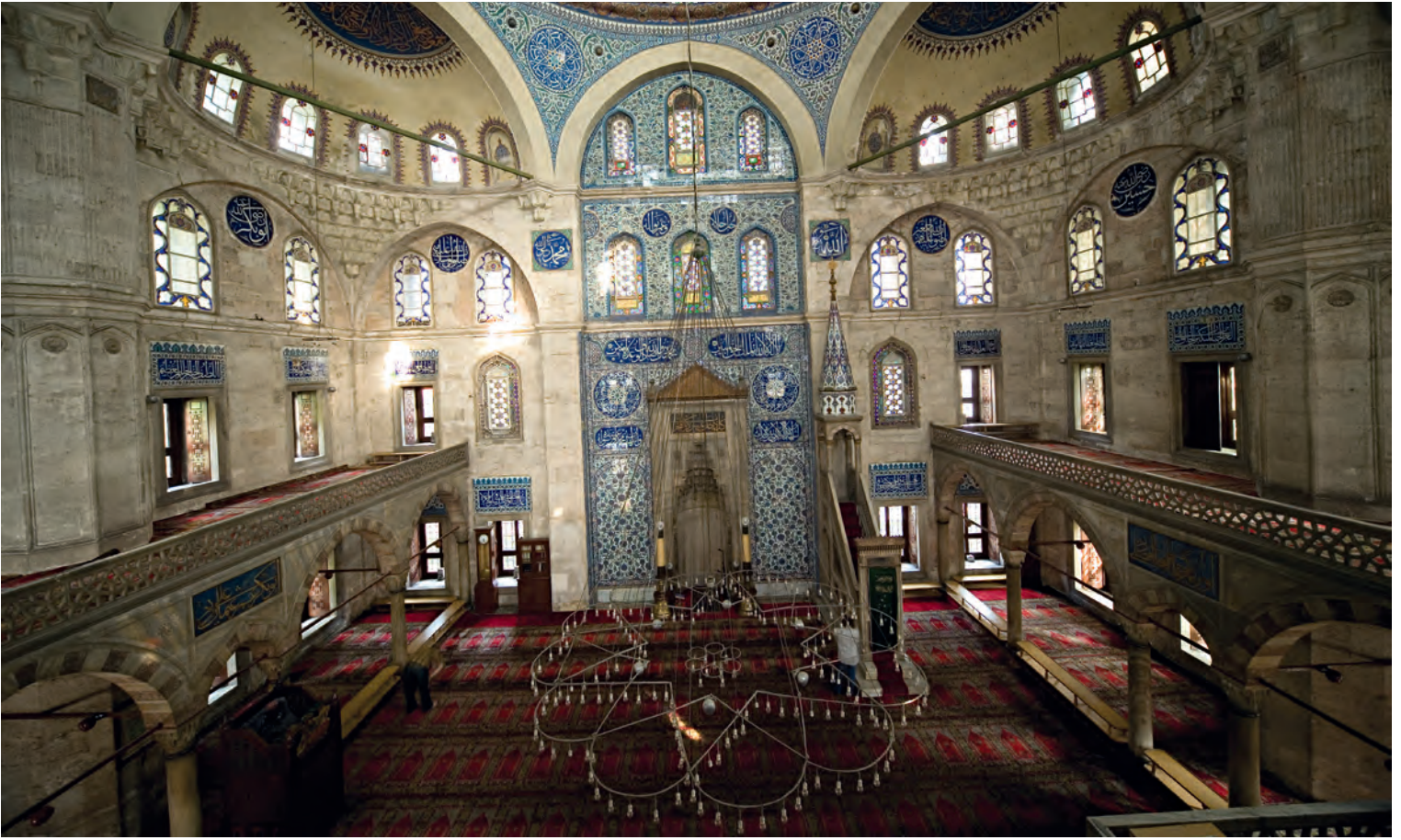
22- Kadırga Sokullu Mehmet Paşa Camii