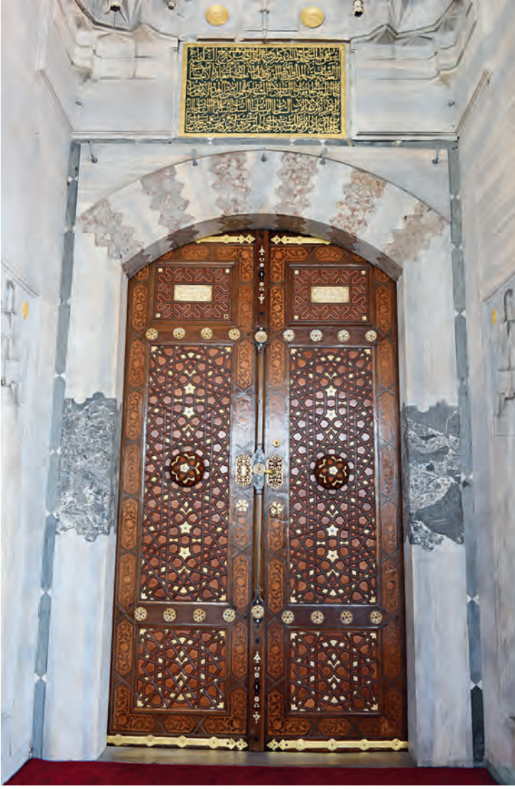
11- Üsküdar Mihrimah Sultan Camii'nin iç giriş kapısı ve kitabesi

Saray muhitleri yeni görünümleriyle sahnededir artık.