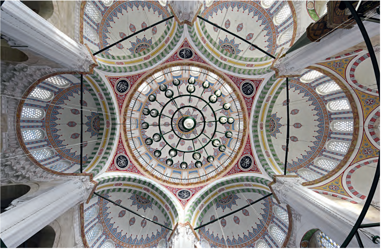
37- Cerrah Mehmet Paşa Camii

de yoğun olarak yaşadığı Çarşamba semtinde 1585 yılında tamamlanan camisi ile birlikte bir külliye yaptırır.