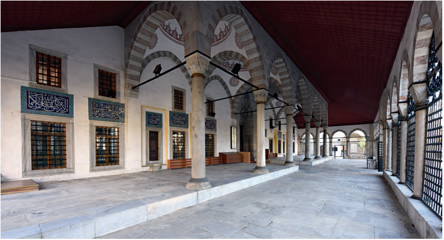
16- Atik Valide Sultan Camii

bina ettirmiştir. Onun bu hayır yapıları bina edilmeden evvel, yerleri ve yerlerinin çevresi boş arsalardı. Bu hayır yapılarının etrafına çektiği kalabalık halkın evler ve menzillerde yerleşmesiyle, Üsküdar'ın meskûn bölgesi en az üçte bir oranında genişlemiştir.)