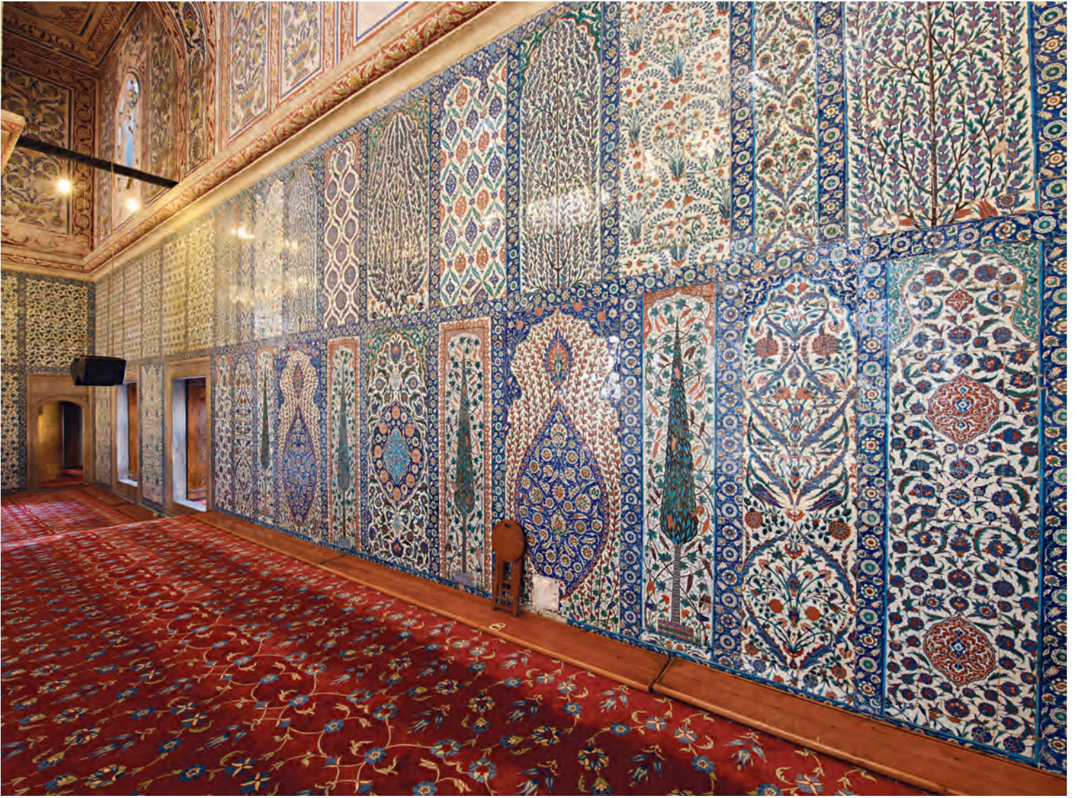
47- Sultanahmet Camii duvar çinileri

mimarisinde ise bu satırlar mukarnaslarla örtülüdür. Bu yaklaşım kubbenin altındaki alanın bir geometrik düzen ve onun uzantıları ile oluşmasını ve kubbenin tam yuvarlak halinin aşağılara sarkmadan yukarıda kendi başına, bağımsız şahsiyetini koruyarak yer almasını sağlar. 110