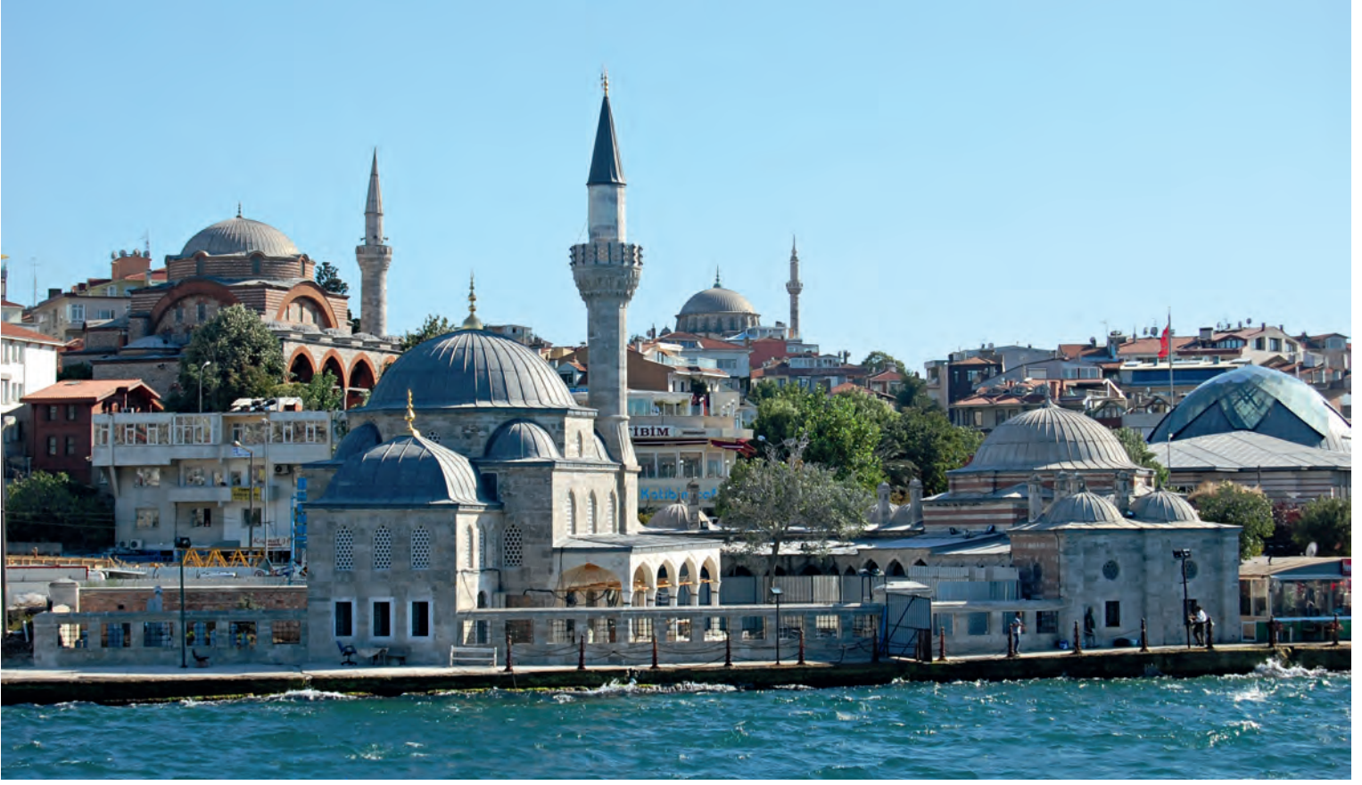
32- Üsküdar Şemsipaşa Külliyesi

gibidir. III. Murad'ın musahibi Şemsi Ahmed Paşa (ö. 1580) tarafından denize sıfır noktasında ve neredeyse sıfır kotunda inşa ettirilmişti. Bu külliye yaklaşık otuz beş sene önce yine Sinan tarafından Şemsi Paşa Külliyesi'nin çok yakınında inşa edilen Mihrimah Sultan Camii'yle karşılaştırılabilir. Tek kubbeli küçük bir camiden, L tipinde bir medreseden ve caminin doğu duvarına bitişik, denize doğru çıkma yapan bir türbeden oluşur. "Mihrimah Sultan Camii, mihrap duvarı ve üç yarım kubbenin örttüğü mekân, manevi dünyanın sınırını oluştururken, uzayan denizin karşı kıyısında maddi dünyaya ait sınır fark edilir. Şemsi Paşa Camii ise hemen yanı başındaki Boğaziçi'ni bütün derinliği ile kucaklayan, onunla bütünleşen bir çözümdür." 73