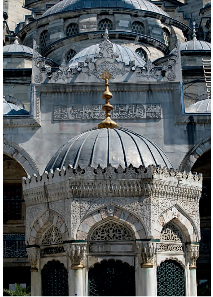
50- Yeni Valide Camii ve şadırvanı (Eminönü)

Şunu her daim akılda tutmak gerekir ki her yeni külliye (hatta her yeni yapı) şehir mekânını dönüştürmekte, mekânı yeniden tanımlamakta ve iskânın belirleyicisi olmaktadır. Yeni Cami de böyledir. Fakat onun daha farklı ve karmaşık bir öyküsü vardır. İnşaat çalışmalarına (istimlakler vs.) ilk başladığı zamanlarda