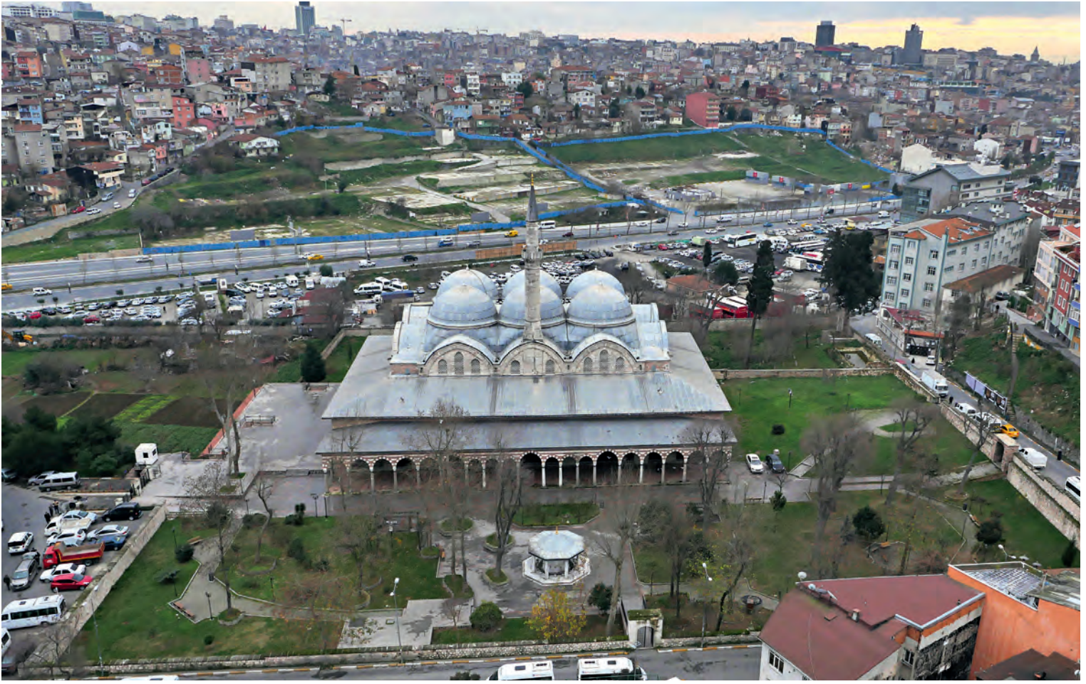
30- Piyale Paşa Külliyesi

kalfalarından birisinin yaptığını bile öne sürerler. 69 Turgut Cansever, Ayasofya ile benzerlik kuranlarla aynı görüşte değildir: