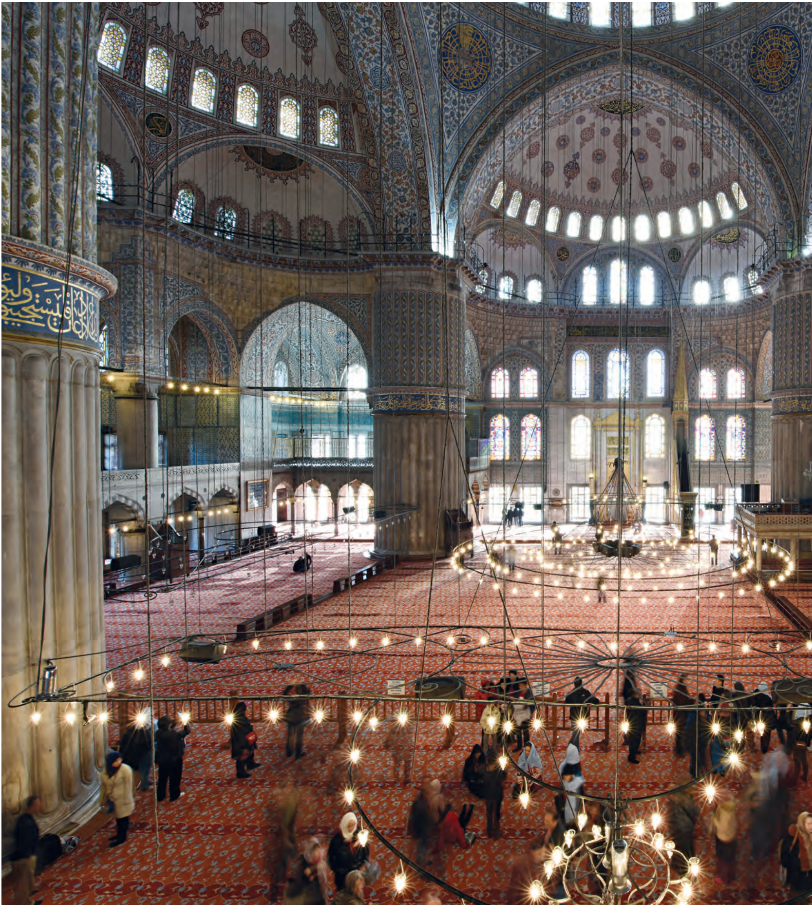
45- Sultanahmet Camii