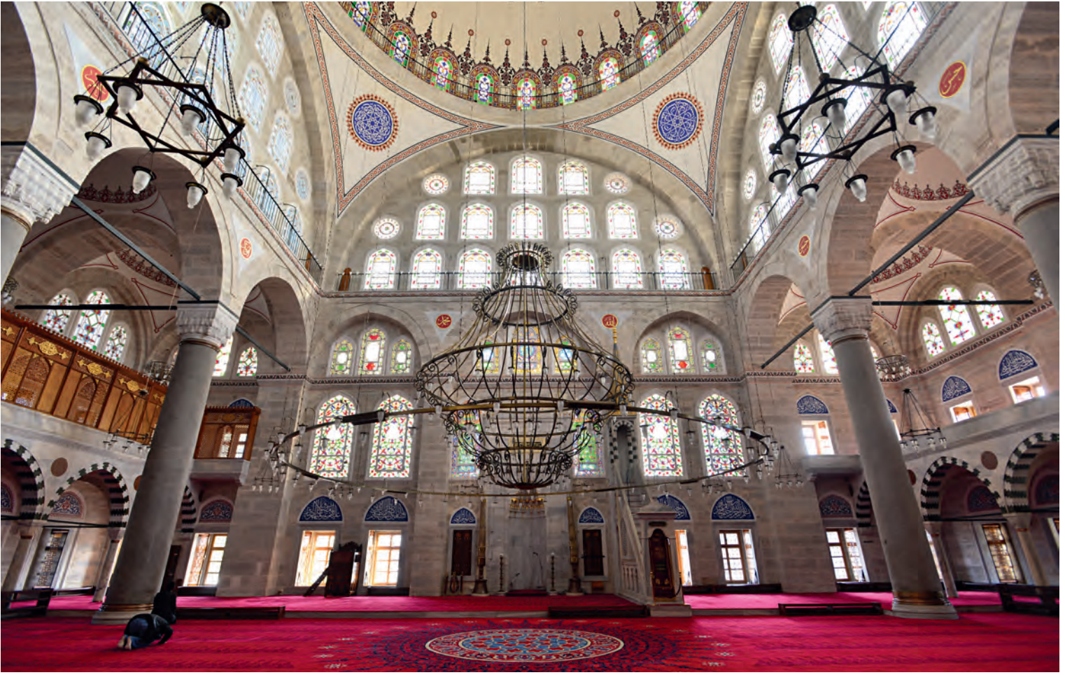
13- Edirnekapı Mihrimah Sultan Camii

hamam ve türbeden oluşmaktadır. Türbede Mihrimah Sultan'ın damadı Güzelce Ahmed Paşa, kızı Ayşe Sultan ve diğer çocukları metfundur. Türbe, Mihrimah Sultan Külliyesi içerisinde ama Ayşe Sultan'a ait bir vakıfla irtibatlıdır. 28 Cami ve medrese 976 (1568-1569) tarihlerinde tamamlanmıştır. Külliye'nin vakfiyesi 1570 tarihli'dir. Külliye'nin diğer birimi olan çifte hamamın izin belgesinin tarihi 1565'tir.