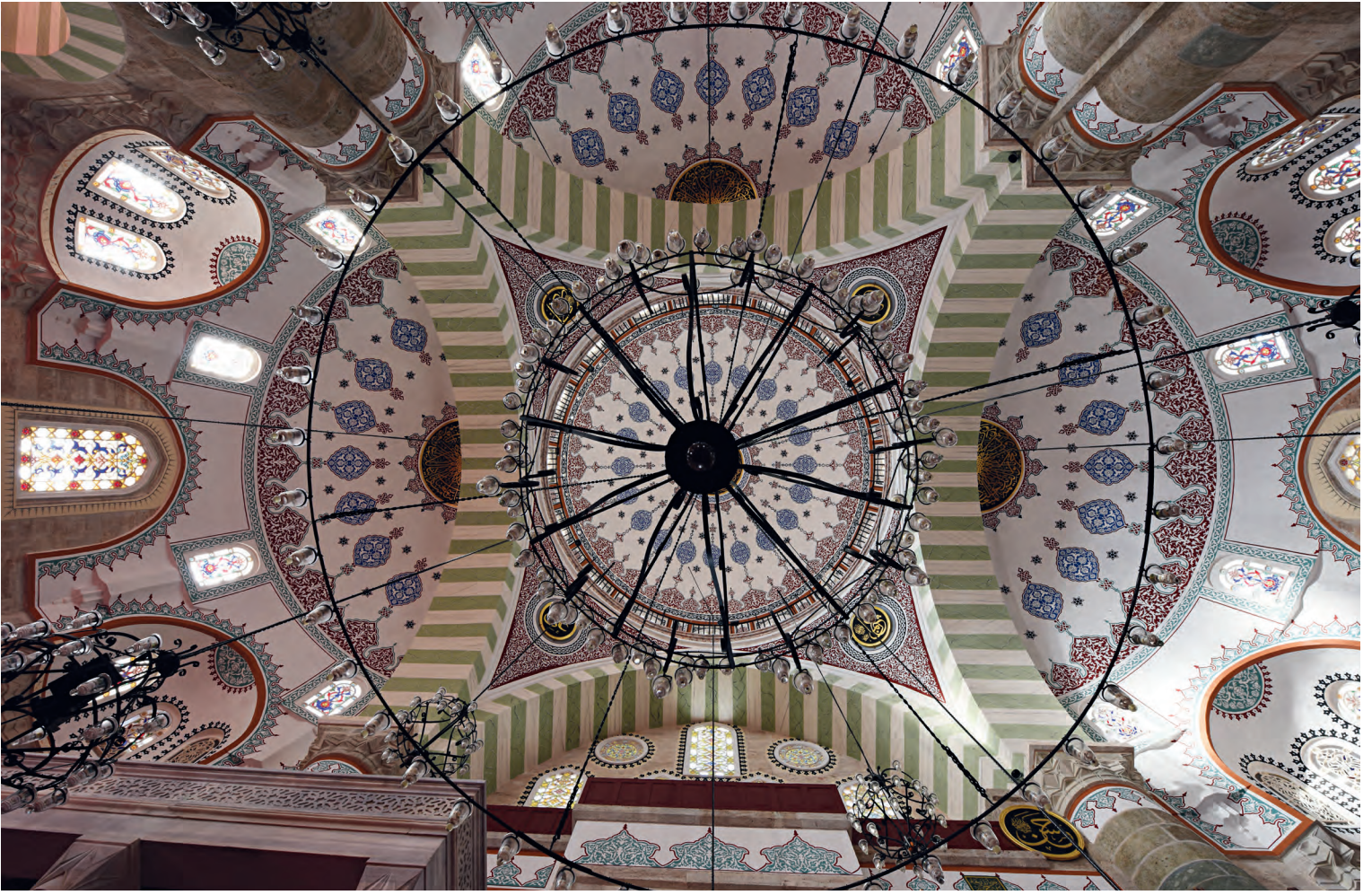
10- Üsküdar Mihrimah Sultan Camii

şimâlîsinde ebnâ-i sebîl için iki ribât-ı ‘âlî binâ itmişdir. (Âşık Mehmed, Menâzirü'l-avâlim 22 ).