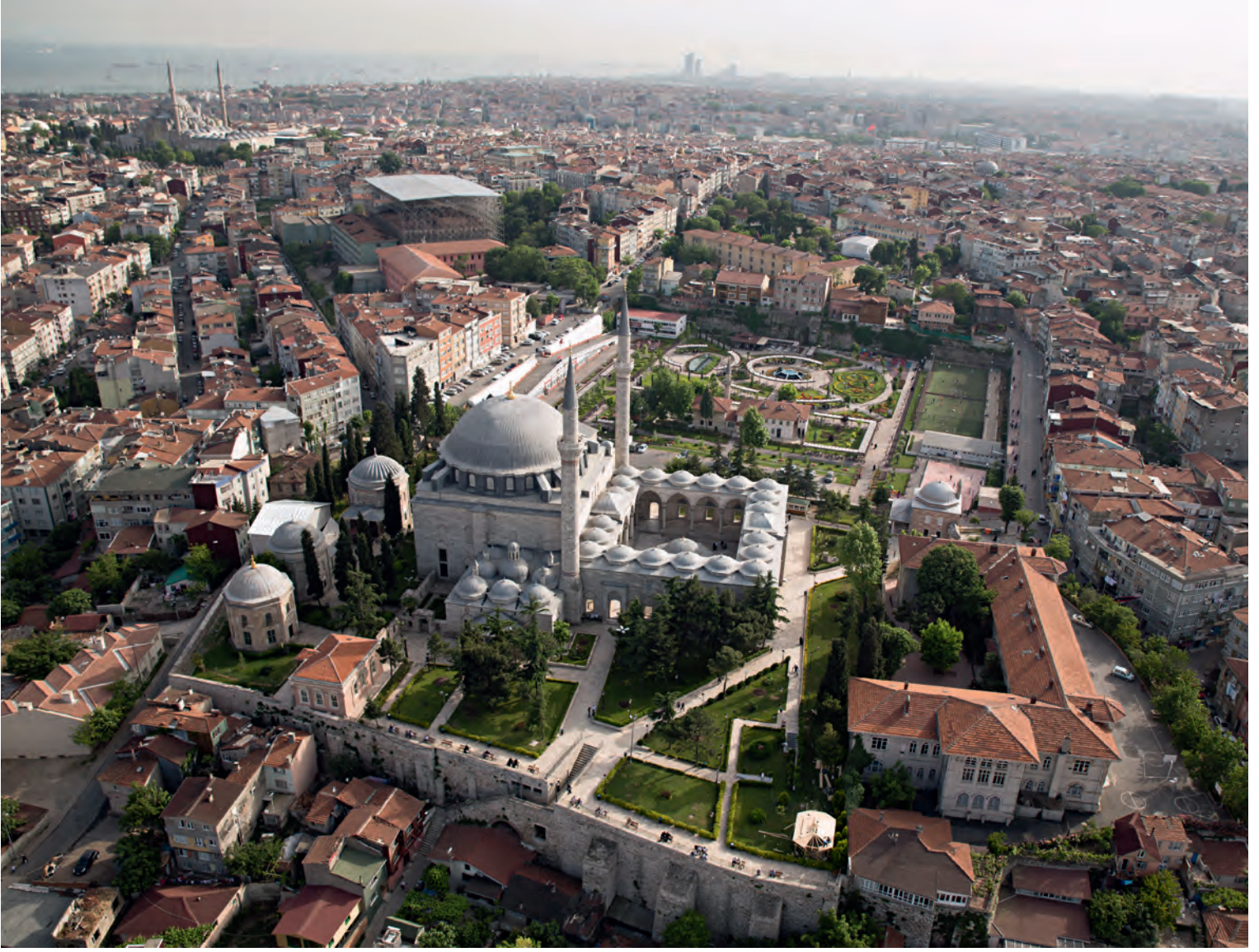
1- Yavuz Sultan Selim Külliyesi