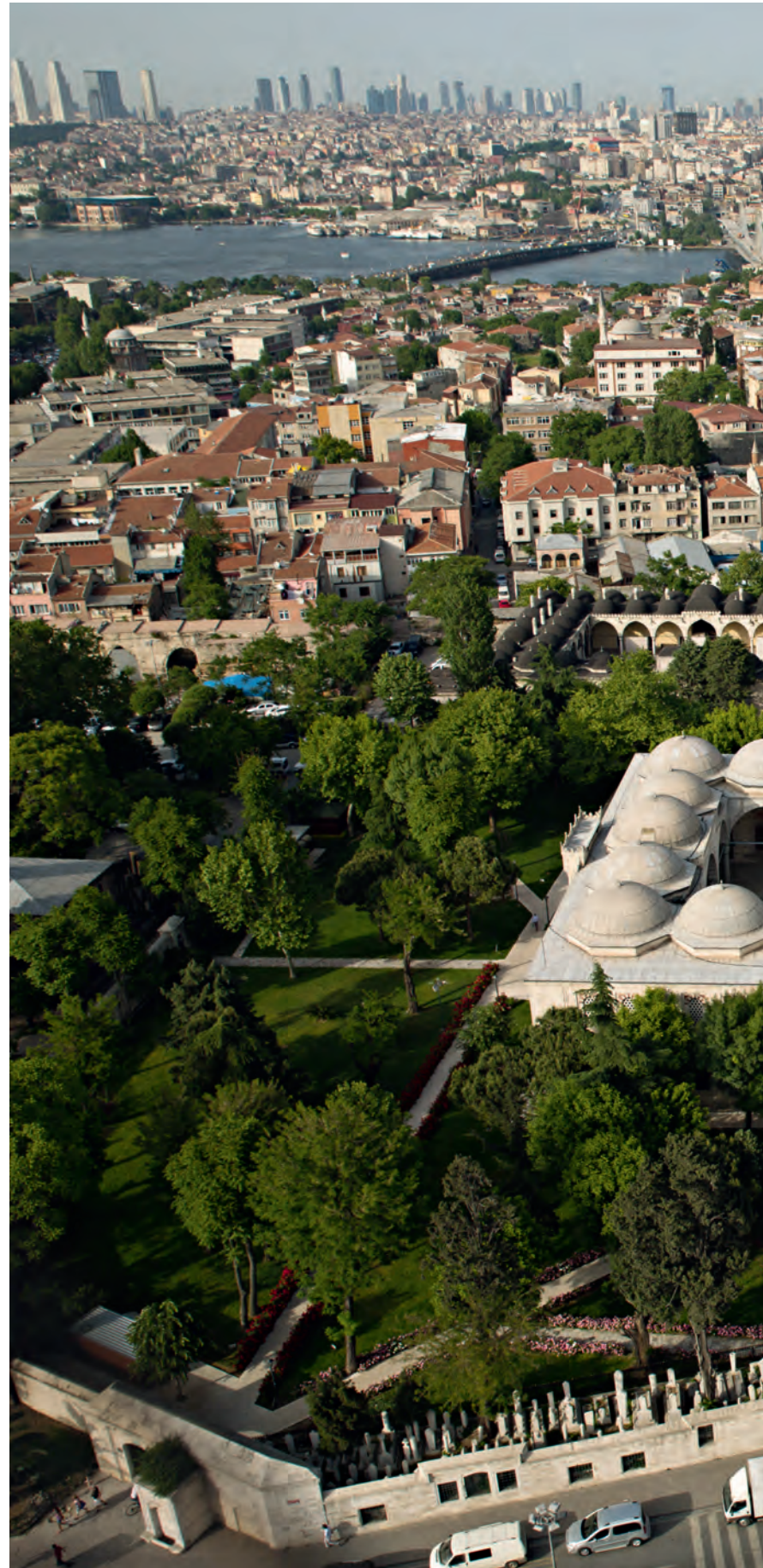
17- Şehzade Külliyesi

Üsküdar (bşl. 1543-1544 - btş. 1548) ve Edirnekapı (ikinci inşaat izni 1563 - vakfiye 1570) Mihrimah Sultan külliyesi için ise yukarıdaki iki külliye'ye nazaran daha kalabalık yerler seçilmişti. Edirnekapı Mihrimah Sultan Külliyesi 66 dükkânla birlikte yapıldığına göre o devirde oldukça kalabalık bir semtte ve İstanbul surlarının giriş kapısında yer alıyordu. Üsküdar Mihrimah Sultan