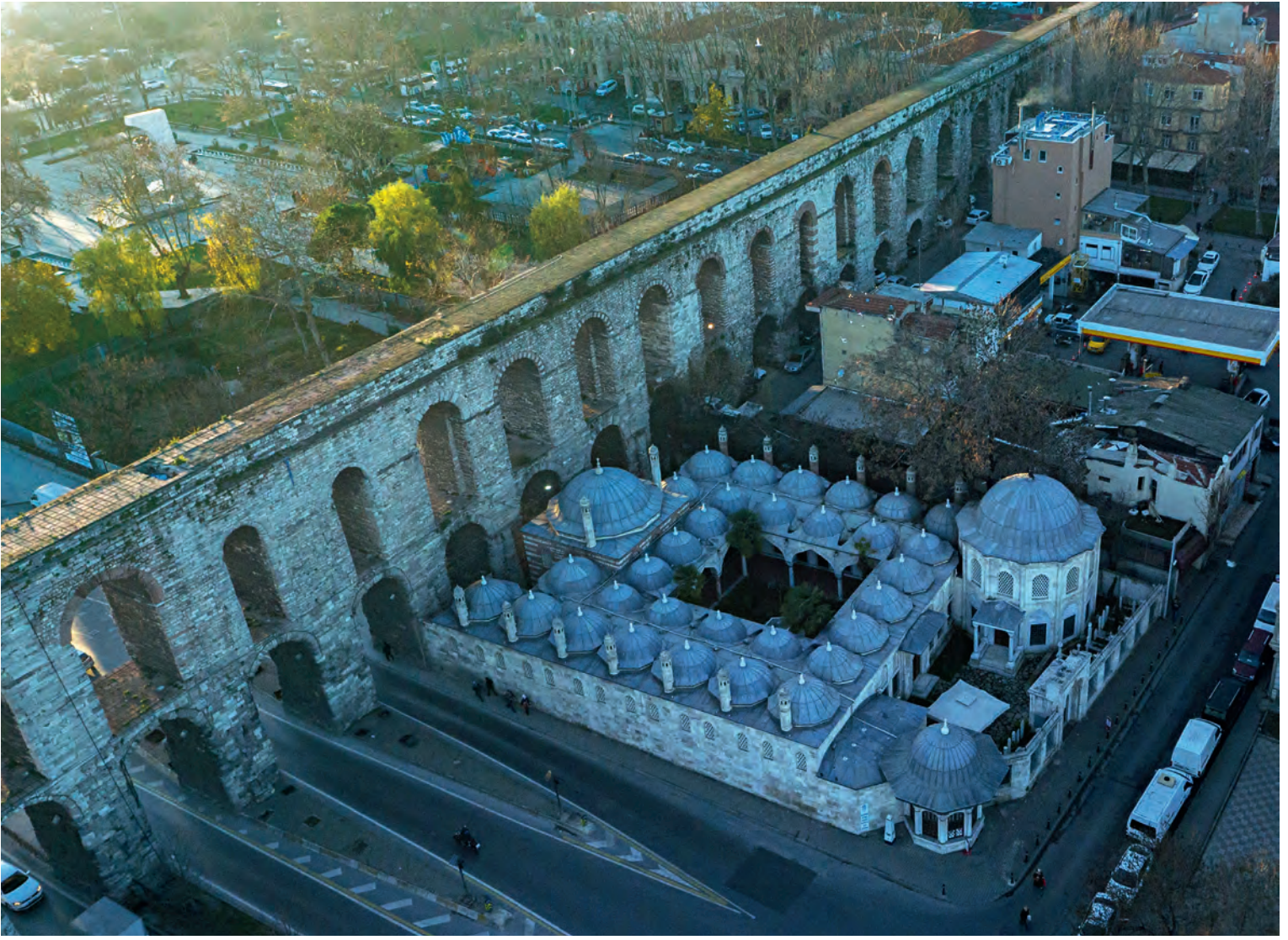
40- Gazanferâğa Külliyesi

etmekte fakat artık içerisinde cami olan külliye inş edilmemektedir. XVII. yüzyıl boyunca devam edecek olan bu uygulamanın XVI. yüzyılın sonlarındaki ilk örnekleri Gazanfer Ağa ve Koca Sinan Paşa külliyeleridir. Başka bir ifadeyle yapı isimleri şöyle verilebilir: Gazanfer Ağa Türbeli Medresesi ve Sinan Paşa Türbeli Medresesi.