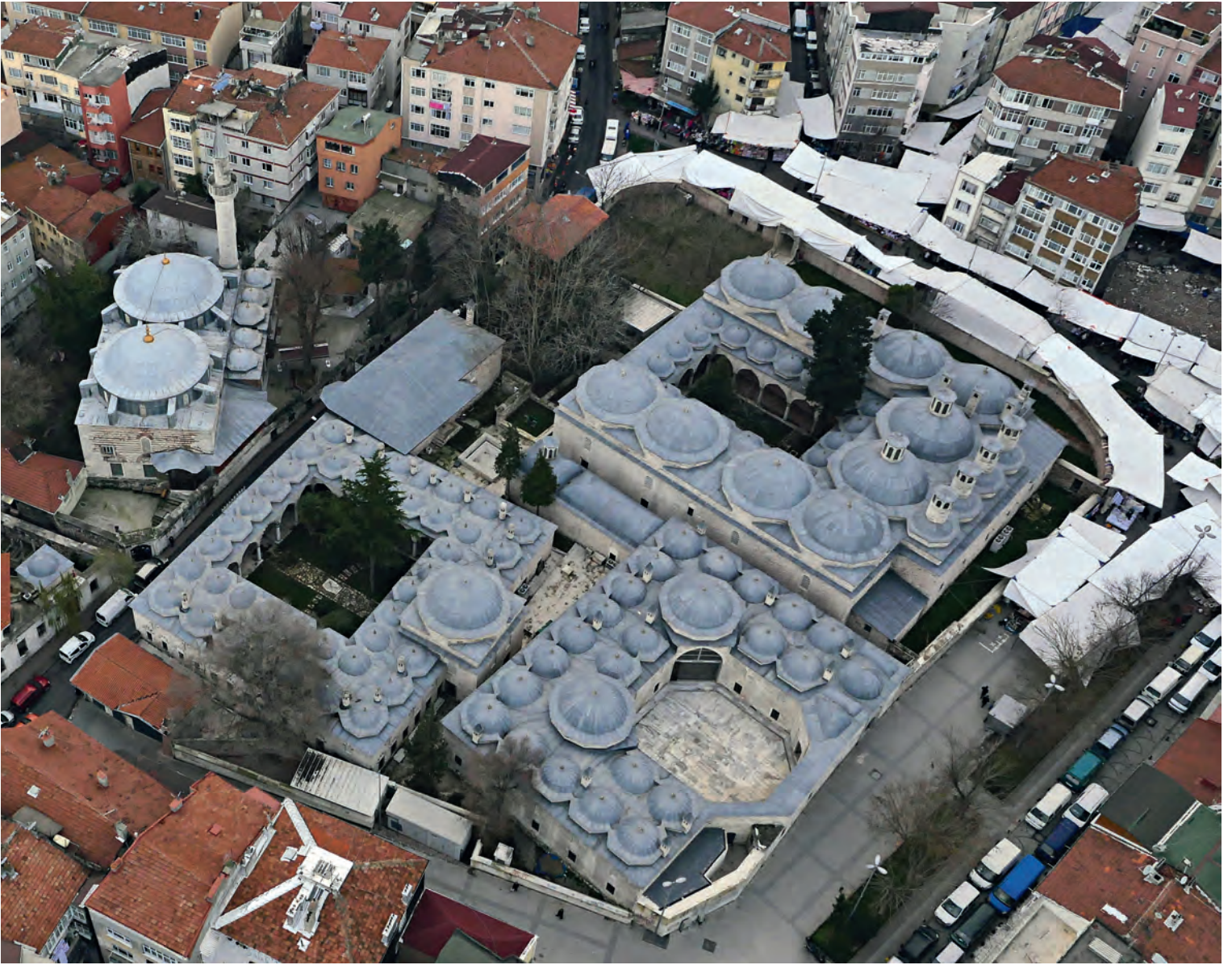
5- Haseki Hürrem Sultan Külliyesi

isimler ise Yakup Ağa, Cafer Ağa, Sekbanbaşı Ali Ağa, Kabasakal Sinan Ağa, Mehmed Çelebi ve Mahmud Ağa'dır.