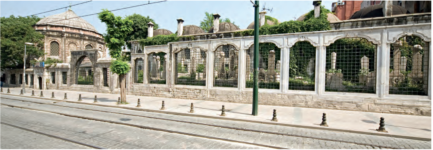
41- Koca Sinan Paşa Külliyesi