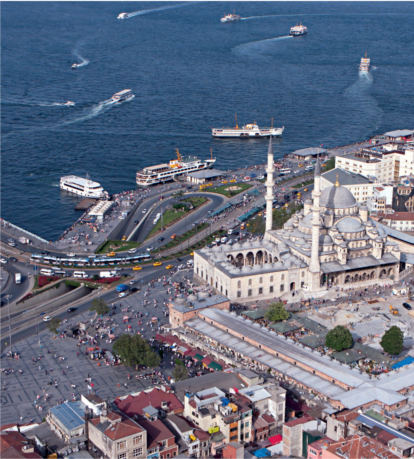
51- Yeni Valide Külliyesi (Eminönü)