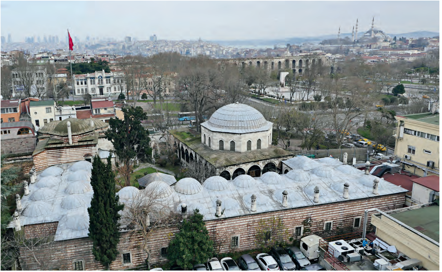
54- Amcazade Hüseyin Paşa Külliyesi

sahiptirler. Şüphe yok ki bu imar ve iskân hareketinin bazen olabildiğince görünür bazen izlerini bile sürmenin neredeyse imkânsız olduğu aktörleri mimarlar, kalfalar, ustalar ve işçilerdi. Yapıların yanı sıra biçim tercihlerinin, malzeme tedarikinin, iş gücü dolaşımının ve inşaat masraflarının ve dolayısıyla İstanbul'un inşa edicisidirler. Acem Ali, Sinan, Davud, Dalgıç Ahmed, Sedefkâr Mehmed, Kasım, Mustafa ve daha birçok mimar; bânilerin, hamilerin ve üstatların himayelerinde iş görmüşlerdir.