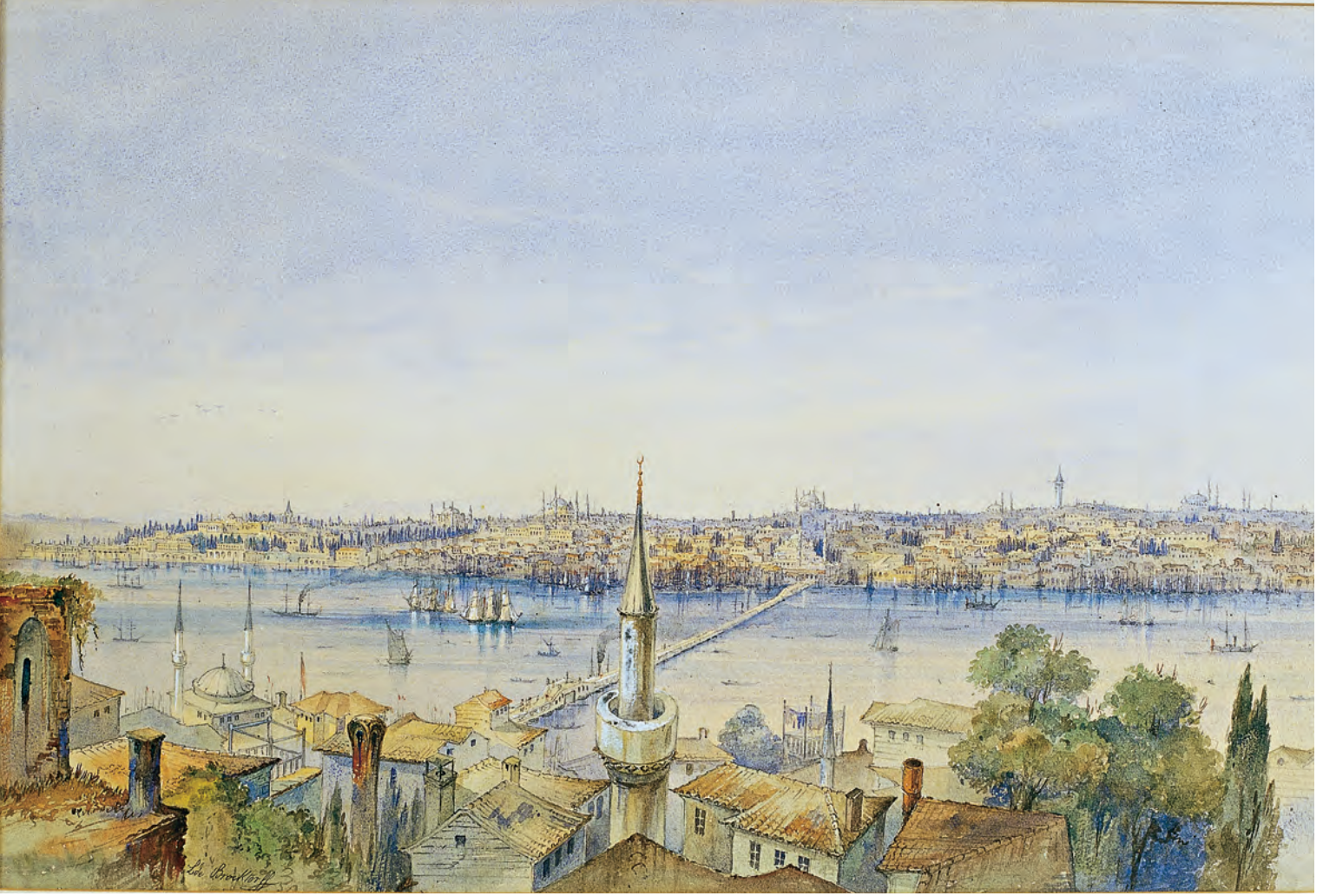
9- Topkapı Sarayı'ndan Süleymaniye'ye Haliç'in iki yakasında İstanbul evleri (Brocktorff)

Ayrıca bu iki mekân, birbirinden farklıdır. Mağsel, Müslümanların gusül alınacak yer (gusülhane) olarak tanımladıkları mekândır. Üst katlarda bulunabilmesi, buraların “yunmalık” denen dolaba benzer basit düzenekler şeklinde olabileceğini akla getirir. Bu mekânlarda çok büyük ihtimalle akar su bulunmadığından, kuyudan veya kuyu yoksa çeşmeden taşınan suyla; ibrik, tas gibi yıkanma araçları yardımıyla yıkanılır. Hamam ise, ailedeki herkesin kullanabildiği, belki bazı evlerde akar suyu olan, boyutları bakımından mağsele göre daha büyük bir mekândır ve hamama bağlı soyunma mekânı olarak kullanılan camekân odası ile birlikte inşası bakımından özel mekânlardır. Genellikle kârgir olarak inşa edilen hamamın, evin bina kıymetinden ayrı olarak kıymetlendirilme nedeni de bu özelliğinden dolayıdır. Öte yandan, hamamların çoğunda dahi akar suyun varlığından söz etmek zordur, dolayısıyla buraların halk hamamlarıyla kıyaslandığında küçük boyutlarda, yalnızca evin sakinleri tarafından kullanılabilen mekânlar olduğunu ve buralarda da taşıma su ile yıkanıldığını