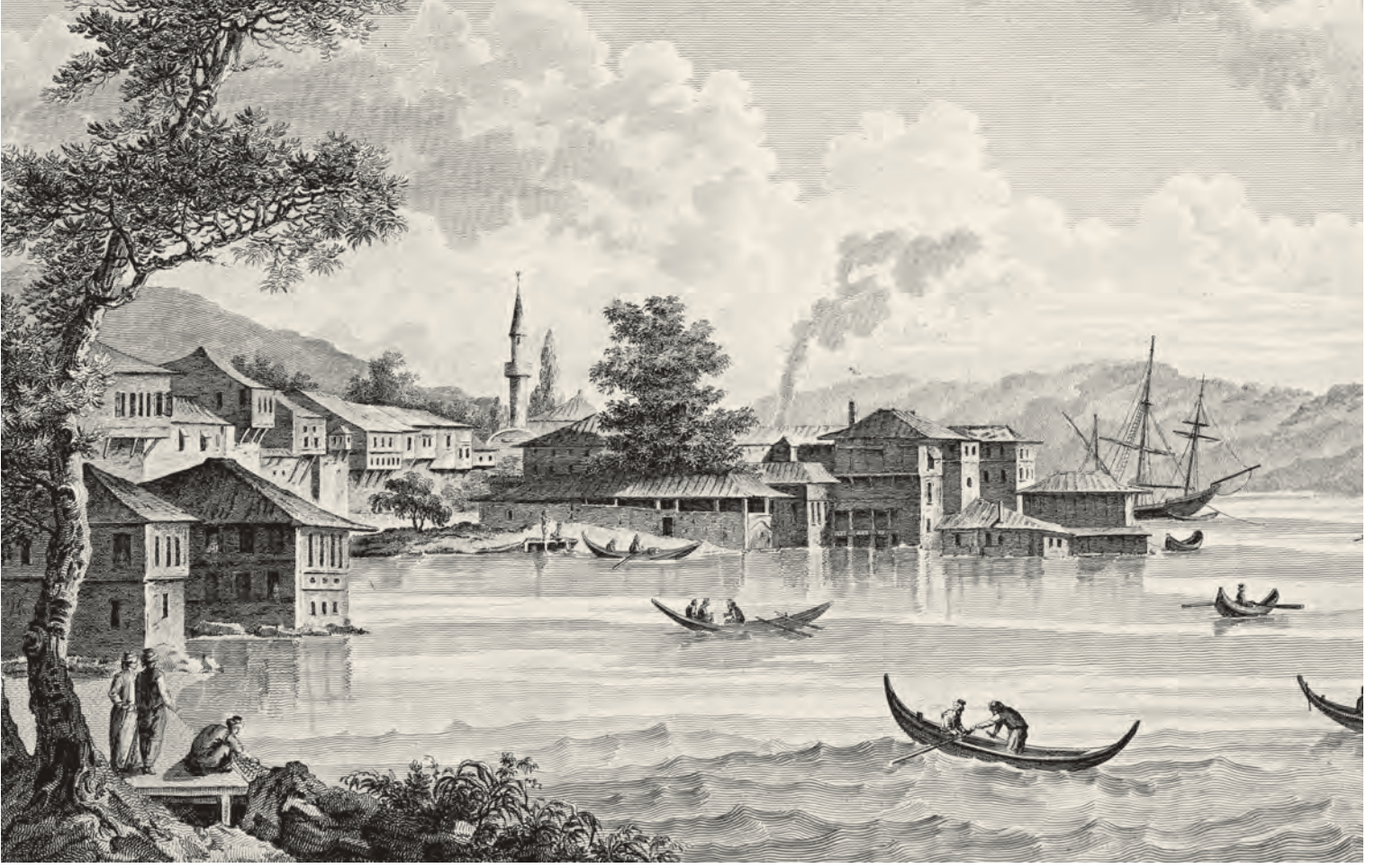
4- Büyükdere evleri (Gouffier)

dünyasında “tarik-i amm” ve “tarik-i hass” olarak nitelenen bu yolların kamusal ve özel kavramlarına göndermesi vardır. “Tarik-i amm”, umumi, genel, herkese ait bir yol demektir ve bu özelliğinden dolayı kamuya açık, dolayısıyla kamusal denilebilecek bir niteliğe sahiptir. “Tarik-i hass” ise, 11 bir veya birkaç eve açılan ve bu evler tarafından ortak kullanılan sokaklardır. Bu sokaklardaki kullanım hakkı, yalnızca bu evlerin sakinlerine aittir ve sakinlerin ortak mülkü olarak değerlendirilir. 12 Bu nedenle buralarla ilgili alınacak kararların, ancak bu sakinler tarafından verilebilmesi söz konusudur. Faroqhi, herkese açık olmayan bu yolların geçit hakkı bulunduğunu belirtir. 13 Bu