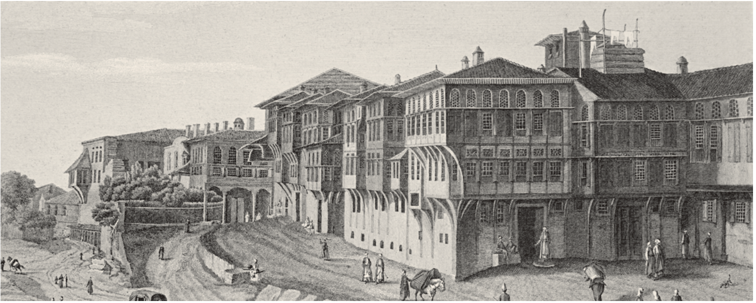
5- Sultanahmet'teki konaklar (Melling)

içeren bölüm iken; hariciye evin kamusala daha açık bölümü olup dâhiliye ile sokak arasında bir geçiş bölgesi oluşturur. 15 İncelenen evlerdeki mekân bileşenlerinin dağılımı da, bu saptamayı destekler. Sözelimi hamam, camekân odası, mağsel, cameşuyhane, matbah ve fırına -ki bunlar XVIII. yüzyıl İstanbulluları için yine de kadının ve evin özel alanını, aile yaşamını ilgilendiren yerler olarak görülebilir- yalnızca dâhiliye bölümünde, ahıra ise yalnızca hariciye bölümünde rastlanır. Bahçe, kuyu ve kiler de ağırlıklı olarak dâhiliye bölümünde yer alır. Öte yandan oda, sofa, mabeyn odası, cihannüma, köşk, tahtapuş, sofa, kenif, dehliz, abdesthane ve muhtıb gibi bileşenler ise, her iki bölümde de yer alabilen bileşenlerdir. Bu iki bölüm arasında böyle bir dağılımın olması, tarik-i hassta gördüğümüz kademeli düzenlemenin evin içinde de devam ettiğini gösterir. Evin en mahrem kısımlarıyla kamusalla ilişkilenebilecek kısımları arasında iki bölümlü evlerde hariciye, bir geçiş bölgesi olmuştur.