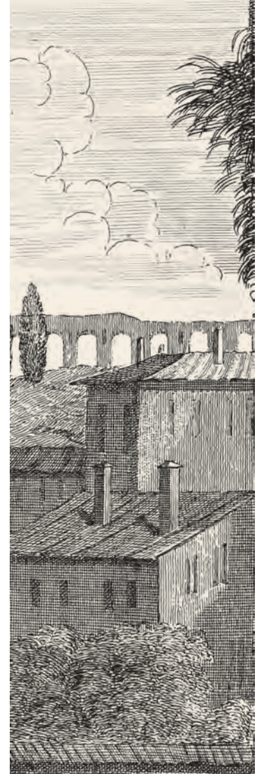
1- İstanbul evleri (Ferriol)

Öte yandan evlerin kat sayıları XVI. yüzyıl evleriyle kıyaslandığında artmıştır. 7 XVI. yüzyılda İstanbul'da tek katlı evler ağırlıklı iken, XVIII. yüzyıla gelindiğinde incelenen binalar arasında tek katlı binalar oldukça azdır, kat sayısı bakımından iki katlı olanlar büyük çoğunluğu oluştururken, üç katlı binalar da yüzdelik dilimde ikinci sırada yer alır. 8 Hatta dört katlı bir ev örneğine dahi rastlanmıştır.