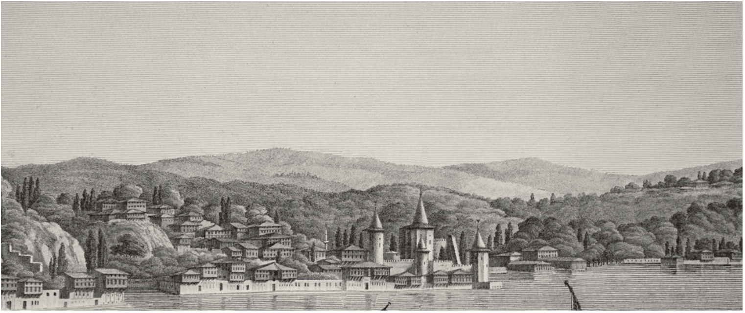
6- Anadoluhisari ve çevresindeki evler (Melling)