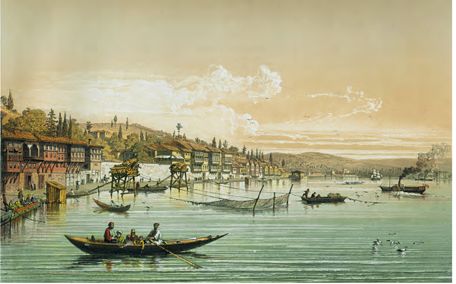
8- Boğaz'daki yalılar (karşı tarafta Anadoluhisarı) (Brindesi)

Selamlık ve kahve odası gibi özelleşmiş odaların konumları da bu anlamda çarpıcıdır. Selamlık odası, erkeklerin vakit geçirdiği ve erkek ziyaretçilerin kabul edildiği oda olarak bilinir. 18 Kahve odası da, yine işle ilgili ziyaretçilerin ağırlandığı ve kendilerine kahve ikram edilen bir kabul odası olarak tarif edilir. 19 Dolayısıyla buranın da selamlık gibi erkeklerin kullandığı ve kamusalla ilişkilenebilecek bir mekân olduğunu düşünmek gerekir.