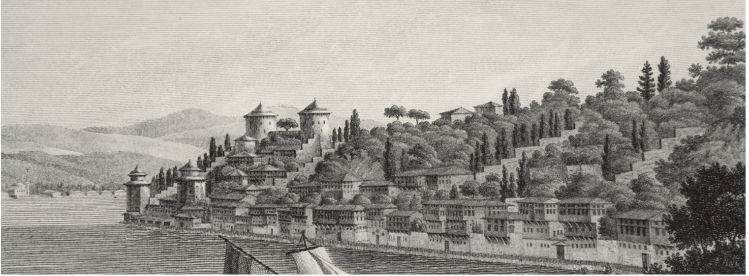
7- Rumelihisari ve çevresindeki evler (Melling)

kaç odası (kaç kapısı) olduğunu gösterir. Buradaki kapı ifadesi önemlidir, odanın her zaman bir kapısı vardır ve bu, onun en mahrem mekân olmasıyla ilişkilidir.