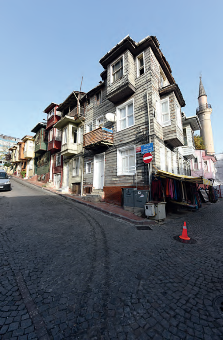
12- Kariye Bostanı Sokağı'nda (Kariye Müzesi'nin yanında) zamana direnen evler

bir düzenlemenin tartışmaya değer olduğu söylenmelidir. Mahremiyetle ilişkili mekânsal düzenlemeler, Osmanlı dünyasında kamusal ile mahrem alanın, sanıldığı gibi ikili bir kavram üzerinden okunamayacağını, birinin sınırının bitip diğerinin o noktada başlamadığını görmek açısından da önemlidir. Kamusaldan mahrem alana sayısız ara mekân üzerinden geçilerek ulaşılır. Evlerin mekânlarına dair terminoloji de bu anlamda çok çeşitlilik arz eder. Herhangi bir işlevsel farklılaşmaya işaret etmeyen, kamusal ve mahrem arasındaki farklı kademeler olarak yeniden düşünülmesi ve okunması gereken çok sayıda terim vardır: tarik-i amm, tarik-i hass, dâhiliye, hariciye, oda, sofa, dehliz, divanhane, selamlık odası, kahve odası gibi.