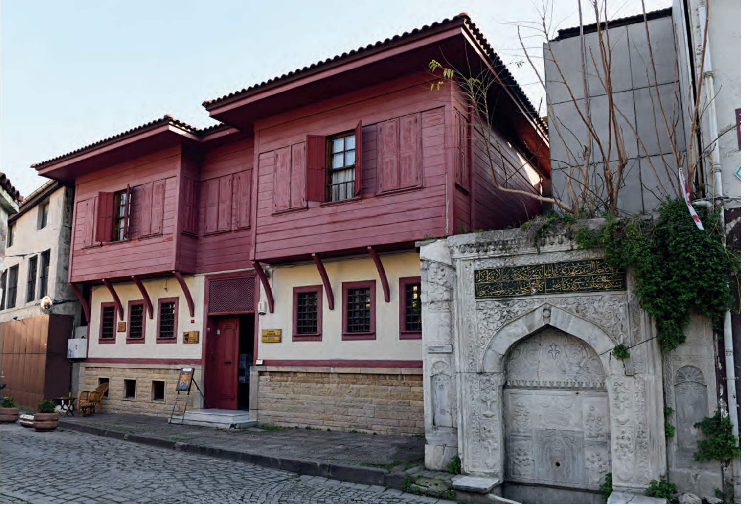
10- III. Selim devri bestekarlarından Hammamizade İsmail Dede Efendi'nin evi

açından da ne kadar kullanılabilir olduğuna şüpheyle bakmakta yarar vardır.