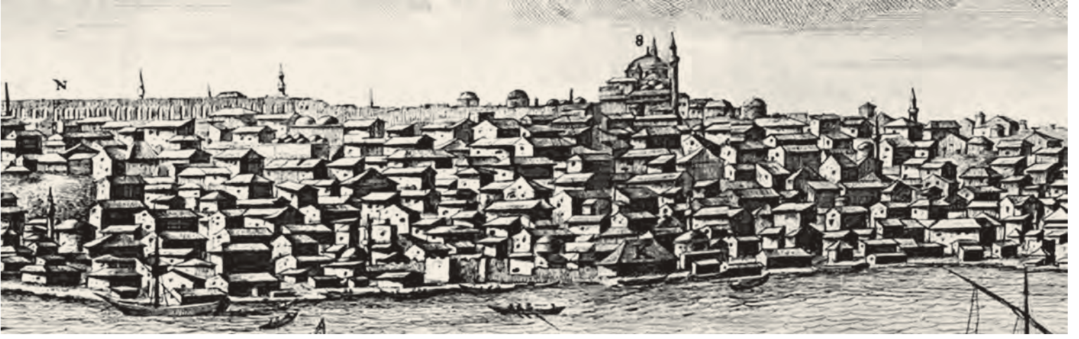
2- Unkapanı ve Fatih civarındaki evler (Bruyn)