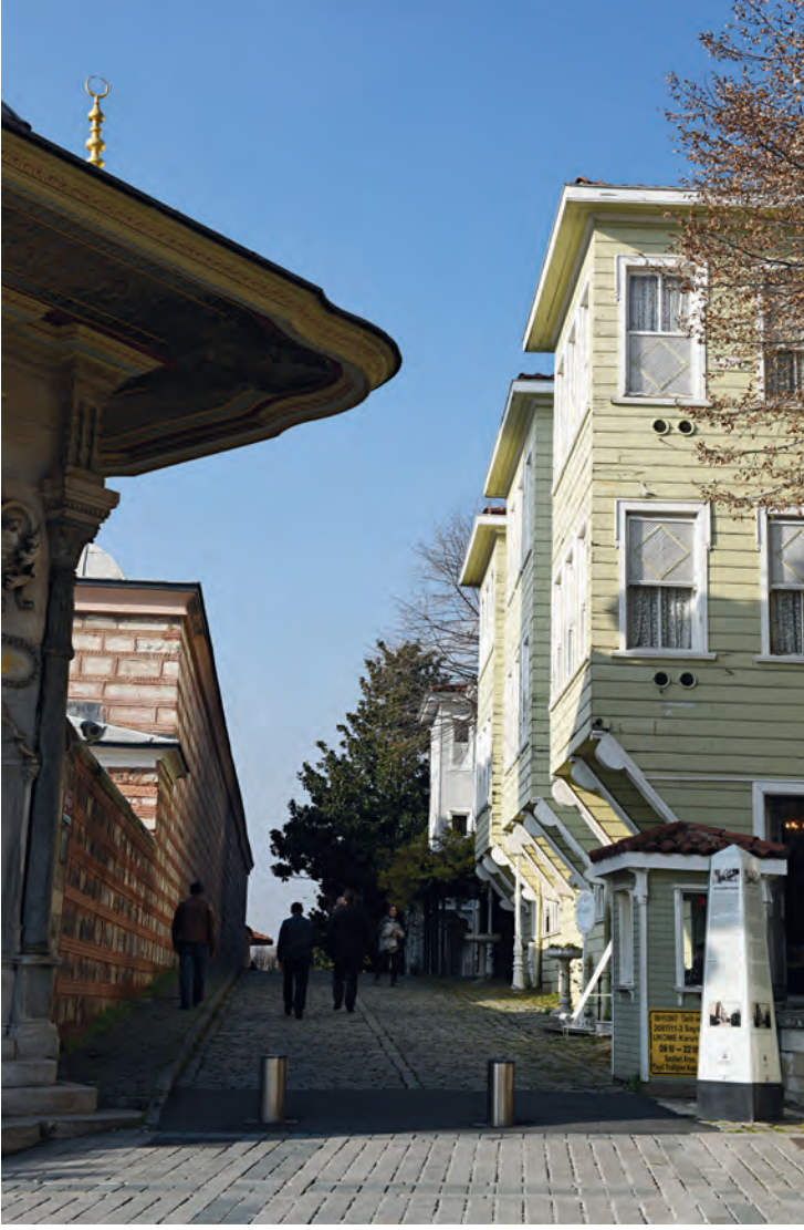
11- Soğuk Çeşme Sokağı'nda restore edilen evler (Ayasofya ile Topkapı Sarayı arasında)

Bu oran, kent içinde evlerin büyük çoğunluğunun avlu ve bahçe gibi açık mekânları olduğunu gösterir. Kentteki yoğunluğa, sıkışıklığa, kat sayılarının artışına ve arsa boyutlarının küçüklüğüne rağmen küçük de olsa, bu açık mekânların, İstanbul kent sakinlerinin evlerinde mutlaka olması gereken bileşenler olarak düşünüldüğünü gösterir.